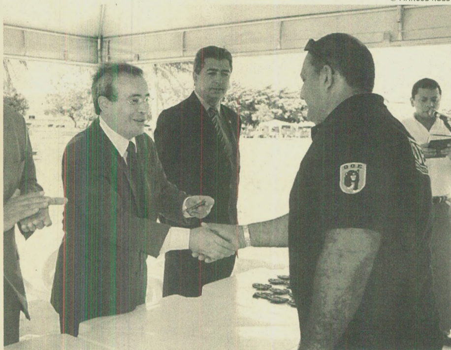
HARRISON TARGINO "No próximo mês, estaremos nomeando mais 500 policiais que serão integrados à Polícia Militar"

"No próximo mês, estaremos nomeando mais 500 policiais que serão integrados à Polícia Militar, concretizando o total de 2 mil soldados nomeados desde 2003", afirmou Harrison. Segundo ele, esse efetivo também reforçará o policiamento do interior do Estado, somando-se aos civis que já estão sendo enviados.