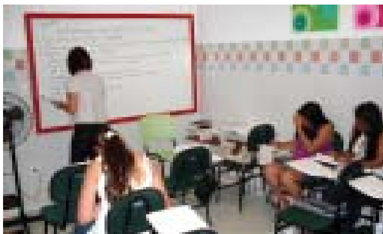
Alunos em sala de aula no curso de hotelaria oferecido pelo Cendac

Ainda conforme Bernadete, a pretensão da Ong é que já neste mês de agosto sejam abertas novas turmas, com os cursos de Arte Culinária, pintura e artesanato. A taxa de inscrição é gratuita, porém é necessário que o interessado tenha acima dos 16 anos de idade, além da apresentação dos seguintes documentos: Foto 3 x 4, xérox da Identidade e do CPF, Comprovante de Residência e de Renda.