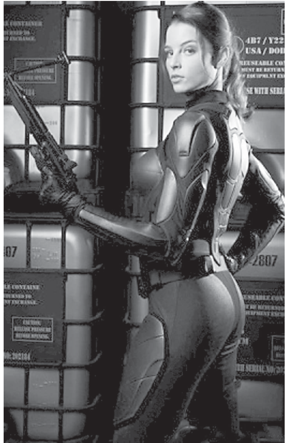
"G.I. Joe - A Origem de Cobra" é mais um blockbuster baseado no sucesso de bonecos