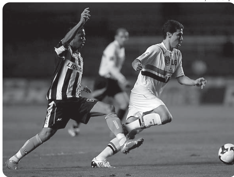
Na quarta-feira, o São Paulo venceu o Botafogo por 3 a 1 no Morumbi

"Se for ver desde o início do ano, a equipe vive o melhor momento agora. Estamos jogando de uma forma que não deixamos dúvidas, pois esta-