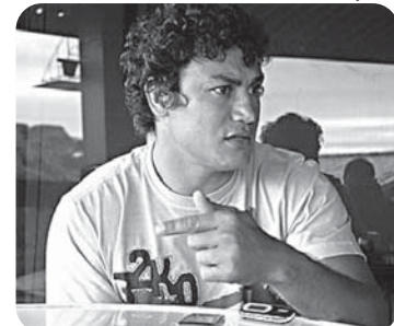
Popó confirma volta ao ringue