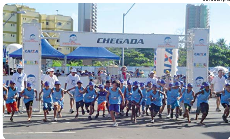
Atletas de 7 a 12 anos vão participar da maior corrida infantil do país

A Maratoninha estimula a participação de meninos e me-