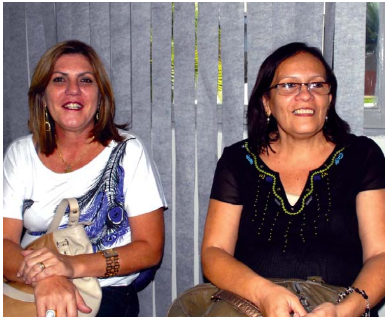
Maruska e Irani consideram evento de suma importância para o homem

A Semana Estadual da Saúde do Homem será encerrada na sexta-feira (14), com uma caminhada ecológica, às