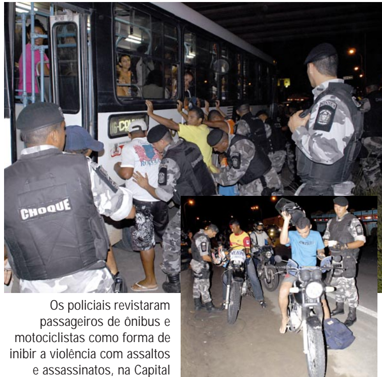
Os policiais revistaram passageiros de ônibus e motociclistas como forma de inibir a violência com assaltos e assassinatos, na Capital