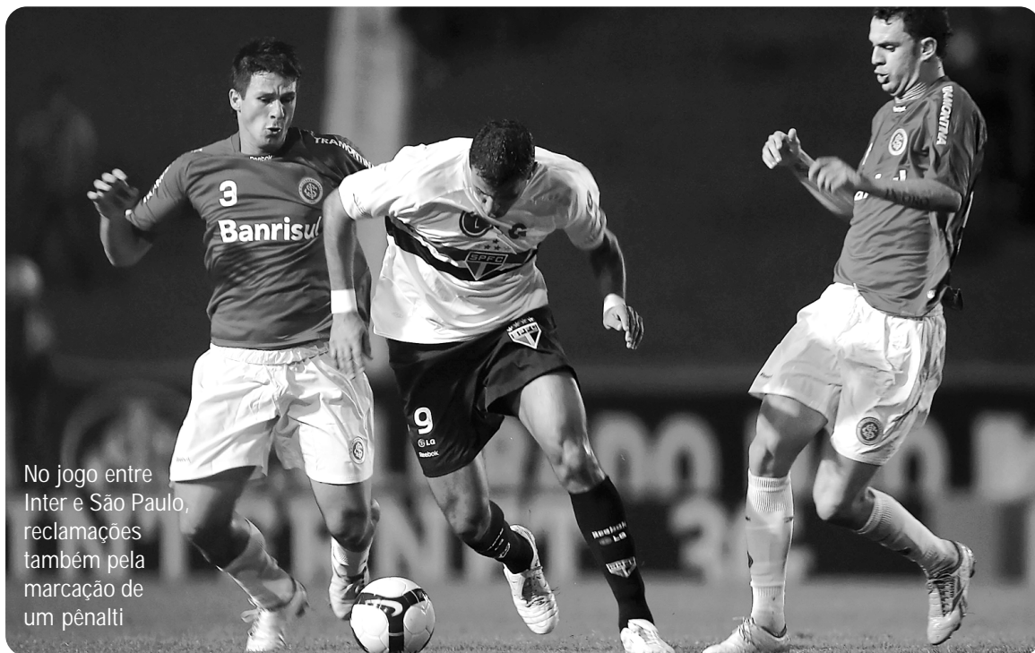
No jogo entre Inter e São Paulo, reclamações também pela marcação de um pênalti