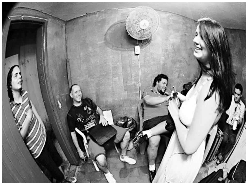
A banda paraibana Sonora Sambagroove aposta nas junções com o rock e com o reggae

Onze amigos e diversas influências musicais. Isso deu samba. O Trio Pouca Chinfra e a Cozinha chega aos seus quatro anos de vida respeitando o samba, com músicas autorais e ganhando reconhecimento nas rodas e palcos por onde passa. Com uma pegada mais forte, ca-