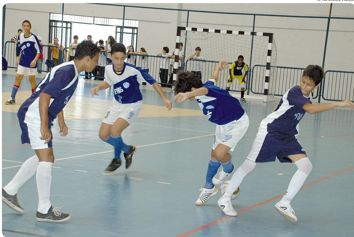
O futsal é uma das modalidades das competições que vão acontecer em Campina Grande neste fim de semana

A exemplo de outras edições já realizadas, os Jogos Escolares da Paraíba 2009 (12-14 e 15-17 anos) acontecem nas 12 Regionais. O evento é promovido pelo Governo do Estado através das Secretarias Estaduais de Juventude, Esporte, Lazer, Educação e Cultura.