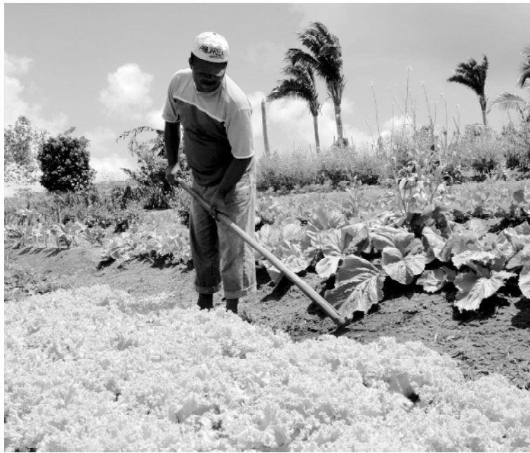
A Lei Geral da Ater vai beneficiar os agricultores familiares na Paraíba

O presidente Lula ainda defendeu a agricultura e a pecuária