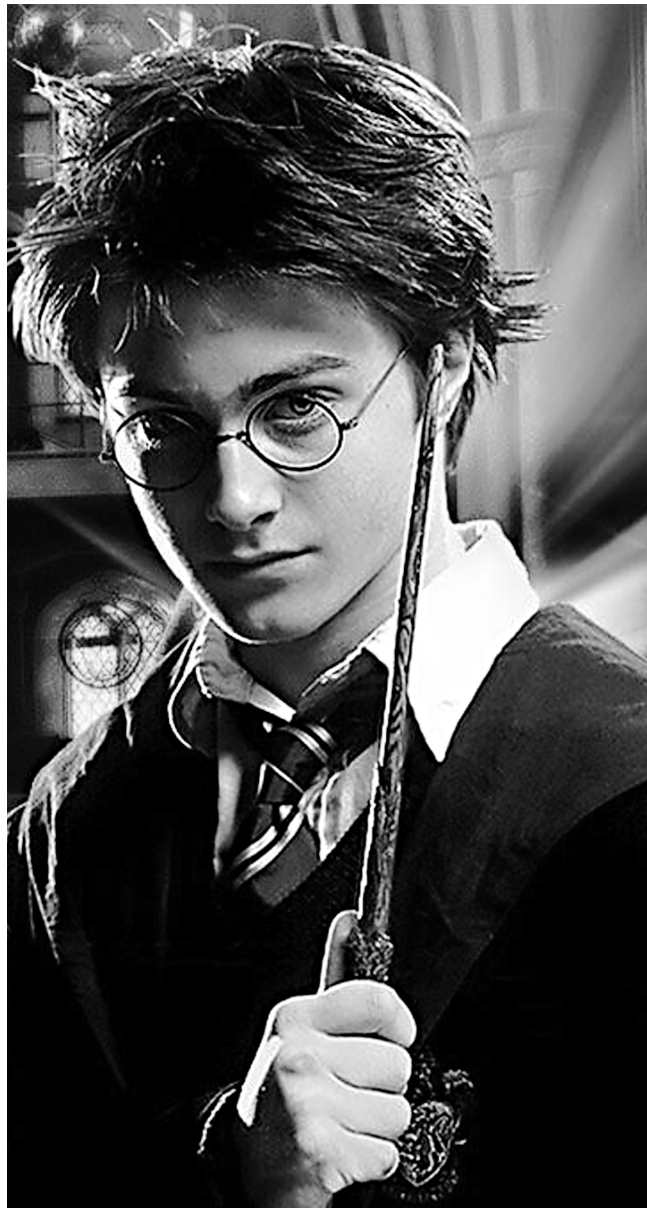
Um dos maiores blockbusters do ano, 'Harry Potter' continua lotando as salas de cinema

67 BANCO. 7/cálabar. 9/zorastro. — esa — paz. — eel — 3/ant