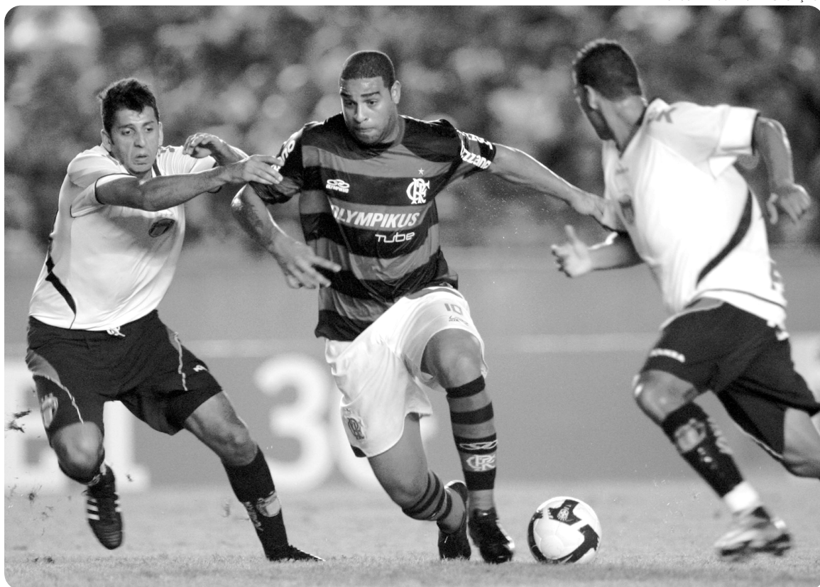
O Flamengo empatou com o Barueri e reclamou da arbitragem pela marcação de um pênalti a favor do adversário

"Estávamos no melhor momento e ele deu um pênalti que não existiu", explicou o meio-campista Cleiton Xavier. "Isso não pode acontecer", gritou Diego Souza, sem esconder a irritação. "Não foi pênalti", emendou o goleiro Marcos.