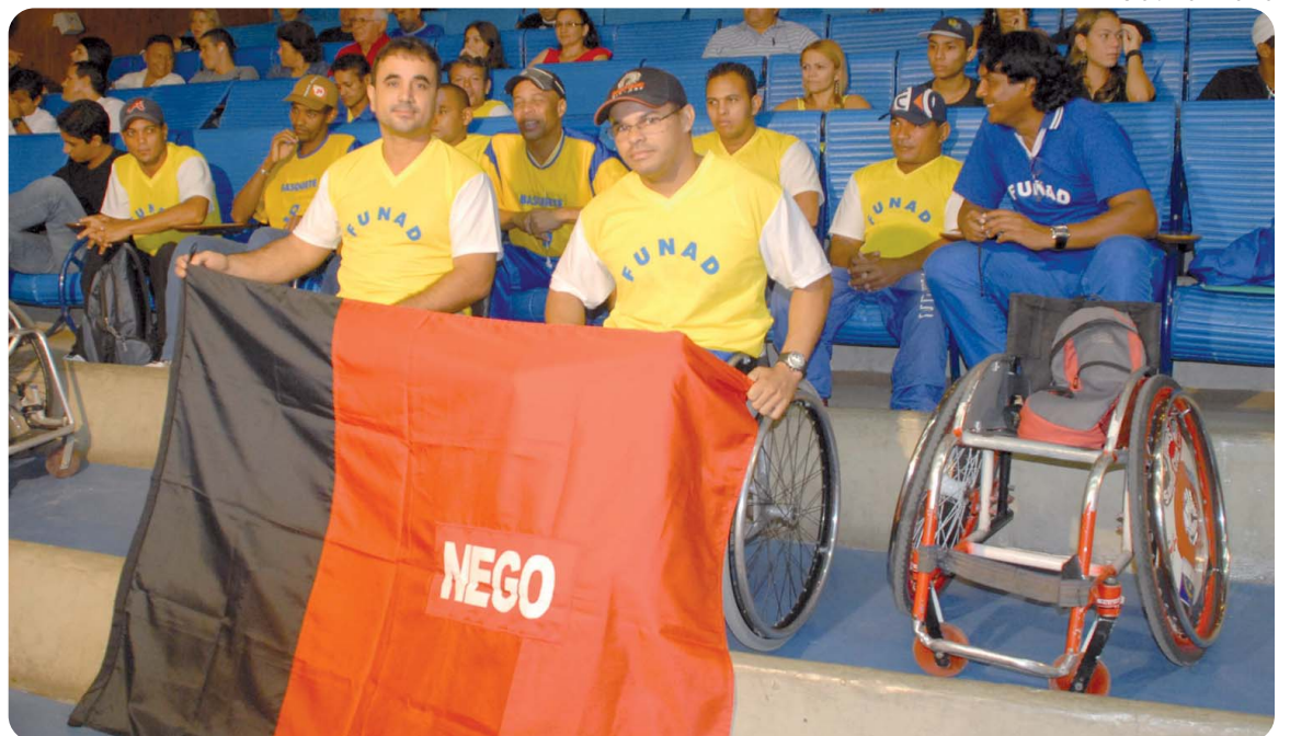
Atletas da Funad, integrantes do programa Bolsa Atleta vão participar da competição a partir do próximo dia 30

O Campeonato Regional de Basquete será realizado de 30 de maio a 04 de junho, pela Associação Atlética dos Portadores de Deficiência da Paraíba (AAPD/PB), reunindo 14 equipes e cerca de 250 atletas de todo o Nordeste em João Pessoa. O evento terá como parceiros a Fundação Centro Integrado de Apoio ao Portador de Deficiência (Funad), a Secretaria Estadual da Juventude, Esporte e Lazer (Sejel) e a Prefeitura da Capital.