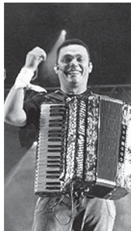
Amazan animará a festa, na Usina Cultural

O evento conta com o apoio do Governo do Estado e da Prefeitura de Campina Grande. A entrada é franca.