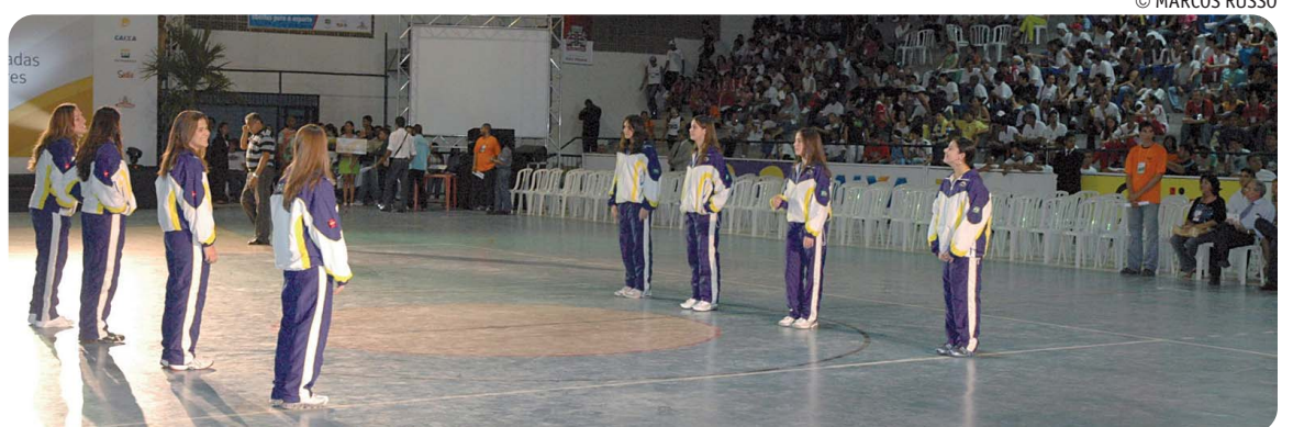
O ginásio do Colégio Pio X, no Centro da cidade, será palco, na próxima semana, de outro evento esportivo