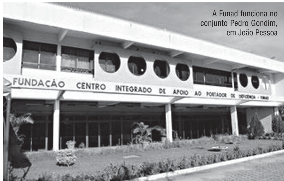
A Funad funciona no conjunto Pedro Gondim, em João Pessoa

seus usuários e funcionários, já que parte deles também possui algum tipo de deficiência, a Funad oferece ainda um serviço especializado para as pessoas com deficiência visual, através do 'Espaço de Estímulo à Leitura Braille'. São mais de 200 títulos impressos, incluindo livros da Bíblia Sagrada, que podem