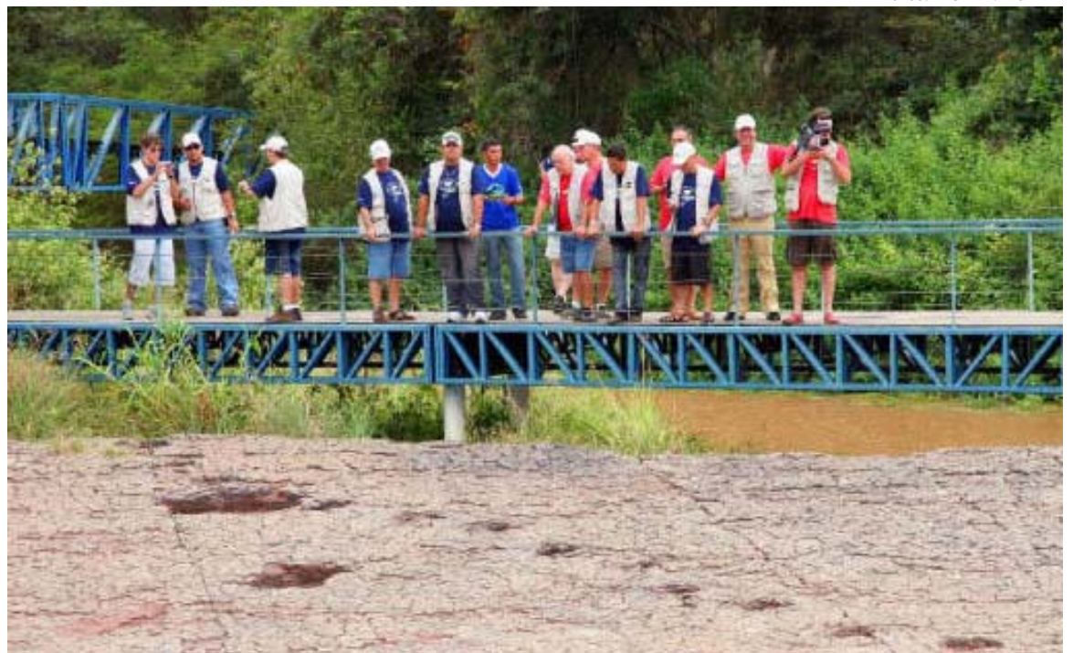
Turistas observam e tiram fotos das pegadas de dinossauros sob ponte de ferro na zona rural do município de Sousa

E com o cumprimento do TAC, a candidatura se fortalecerá e o Vale dos Dinossauros poderá fazer parte de um grupo seletivo de localidades consideradas Patrimônio da Humanidade. Atualmente pouco mais de 800 lugares no mundo possui esse reconhecimento.