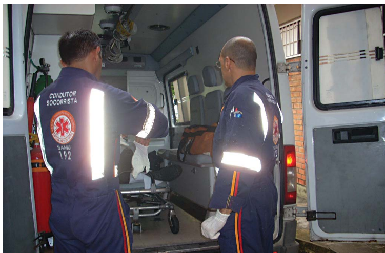
Quem chamar indevidamente o Samu corre risco de pegar seis anos de cadeia

denador do serviço para coibir essa ação e evitar possíveis transtornos ainda maiores", salientou.