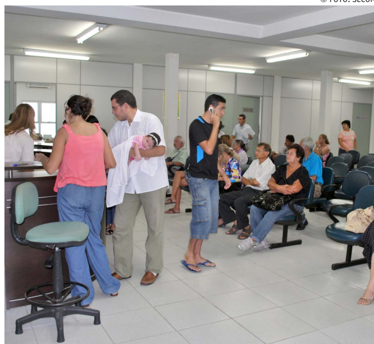
Servidores estaduais são atendidos na recepção de um dos blocos da PBPrev

Apesar destas especialidades, os médicos têm que fazer especializações em Medicina do Trabalho e Perícia Médica, que são ministrados em universidades federais, sob a orientação da Sociedade Brasileira de Perícia Médica e Medicina do Trabalho. Eles contam ainda com engenheiros do trabalho que fazem avaliação do ambiente de trabalho e dos riscos para o servidor, para casos de concessão de gratificações por periculosidade e por insalubridade.