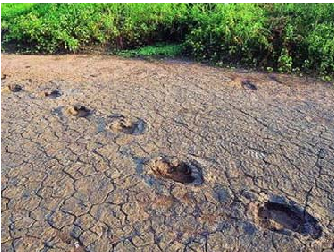
Pegadas de dinossauros integra rastros e trilhas fossilizadas de mais de 80 espécies na Bacia do Rio do Peixe