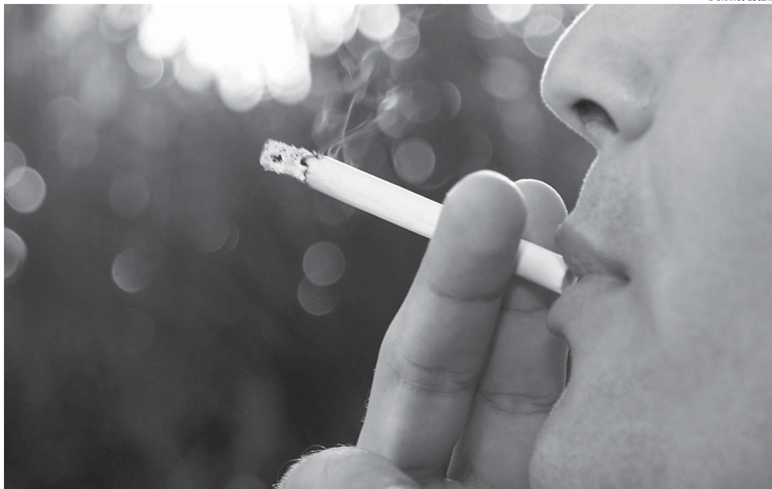
Cigarros, com alta de 18,42%, foi um dos itens que mais contribuiu para o resultado do mês de maio. Já os remédios tiveram alta de 3,21%

O IPCA é o índice oficial utilizado pelo Banco Central para cumprir o regime de metas de inflação. O centro da meta de inflação para 2009, determinado pelo Conselho Monetário Nacional (CMN), é de 4,5%, com margem de tolerância de dois pontos percentuais para cima ou para baixo.