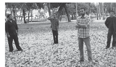
Rock jovial e divertido é feito pela RCP

Flertando com influências que trazem bandas como: Bloc Party, The Hives, The Strokes, King of Leon, Foo Fighters, Queens of Stone Age, Gram e Dalila no Caos, foi possível abraçar a psicodelia e a suavidade