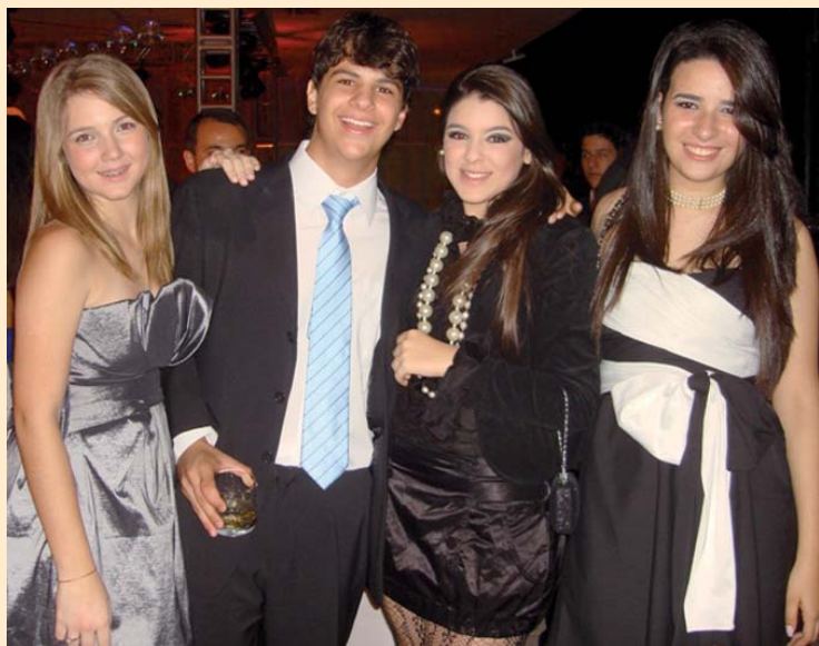
O público jovem também prestigiou a aniversariante