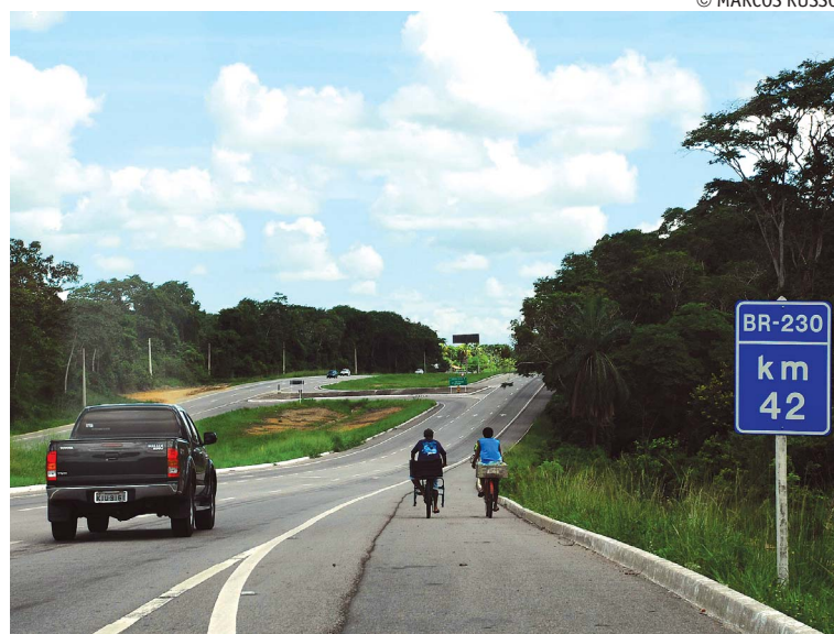
Espaço da BR-230 será ampliado e terá recursos totais de R$ 400 milhões

Conforme enfatizou, o governo federal está dando atenção especial à Paraíba, "porque o Estado vem fazendo a sua parte, com austeridade, com determinação, para enfrentar os grandes desafios. Por isso, o Estado conseguiu recuperar alguns