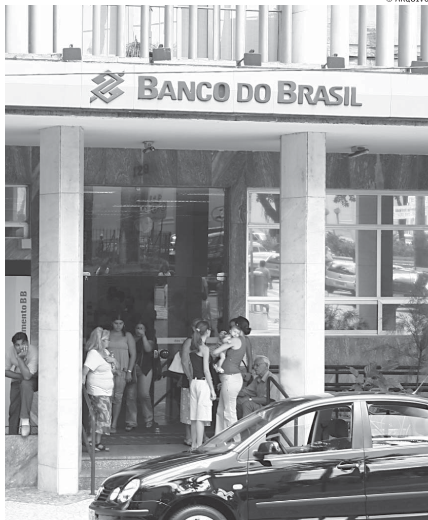
Banco reduziu as taxas de juros em nove linhas destinadas às pessoas físicas

No mês de abril, Aldemir Bendine assumiu a presidência do Banco do Brasil, substituindo Antônio de Lima Neto. A troca foi motivada por pressões - inclusive do presidente Luiz Inácio Lula da Silva - para queda dos juros, o que ainda não havia acontecido.