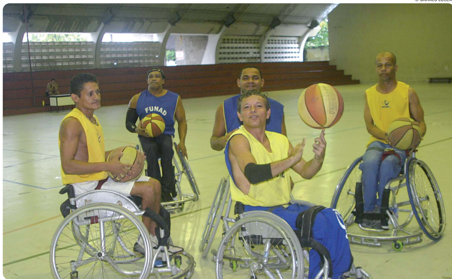
Atletas da Funad seguem treinando diariamente para competição que reunirá 18 equipes do Nordeste. A Paraíba terá duas representantes na disputa

"Podemos dizer até que estão na Paraíba os melhores atletas de basquete em cadeiras de rodas do Brasil, pois disputamos as competições com equipamentos ultrapassados, en-