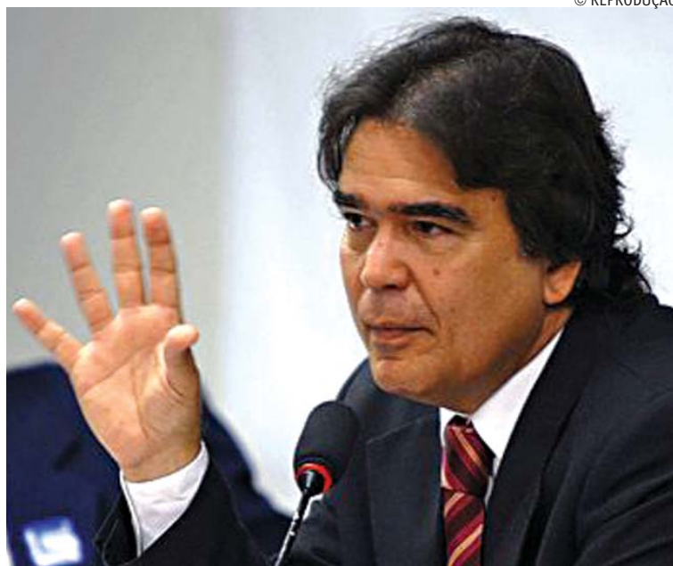
Temporão disse que meta é reduzir em 5% ao ano os índices da mortalidade

Também em função do Pacto, a Paraíba passará de 35 para 103 leitos de Unidade de Cuidados Integrados (UCI); de 558 para 610 as equipes de Saúde da Família; de 18 para 76 os Núcleos de Apoio à Saúde da Família (NASF); de 40 para 62 os leitos de UTI e instalará mais quatro bancos de leite humano. O ministro adiantou que as ações do Pacto já estão em execução. Temporão e o secretário estadual de Saúde, José Maria de França, assinaram como testemunhas do ato.