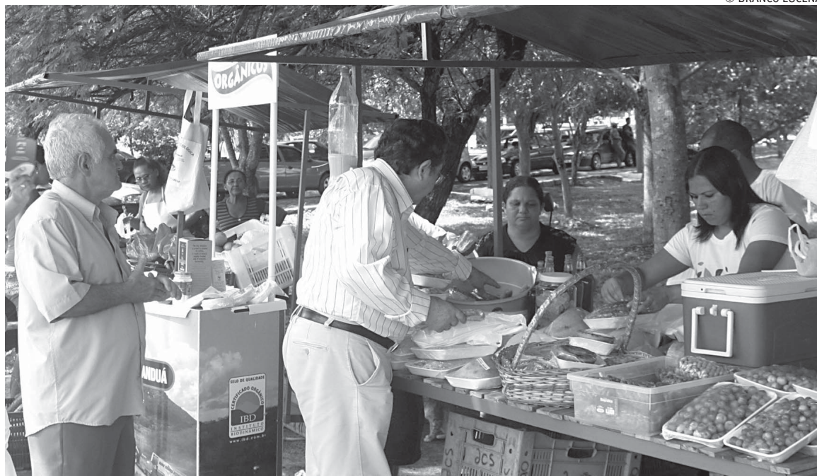
Os produtos orgânicos estão tendo uma excelente aceitação dos consumidores, porque são mais saudáveis

O evento se prolongará até o dia 30 deste mês com a realização de seminários, reuniões técnicas, dias de campo, ofici-