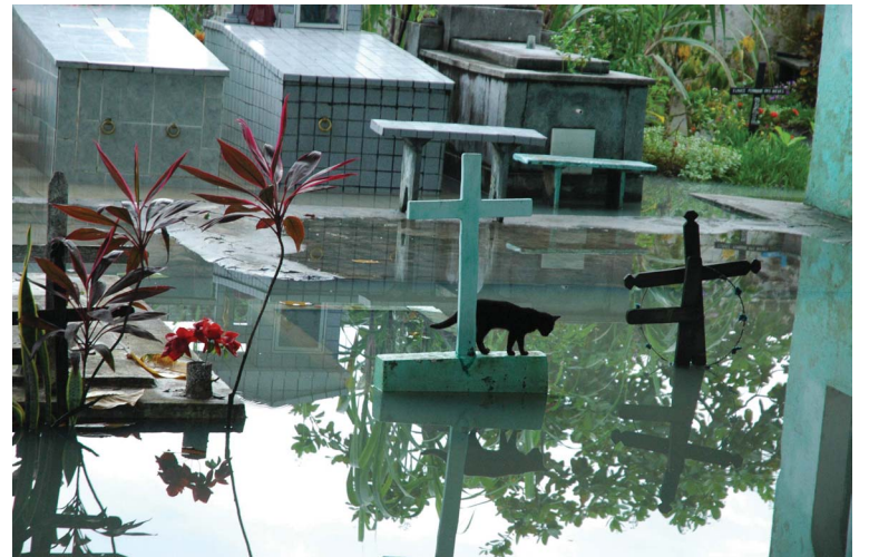
Água deixa gato ilhado em cemitério da comunidade Monsenhor Magno