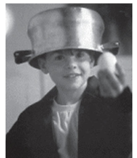
Cena de 'O menino Maluquinho'