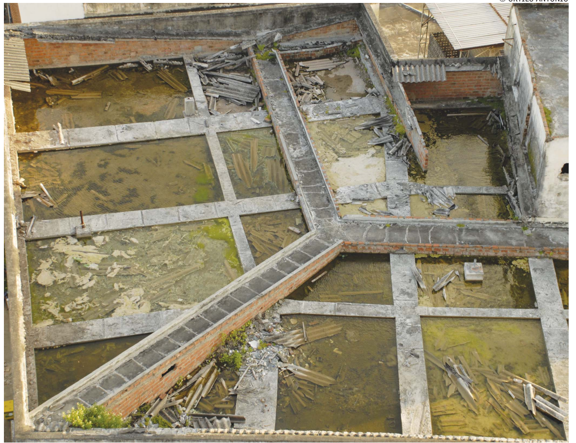
Piscinas cheias d'águas do prédio recebem a visita periódica de fiscais da vigilância da Prefeitura Municipal