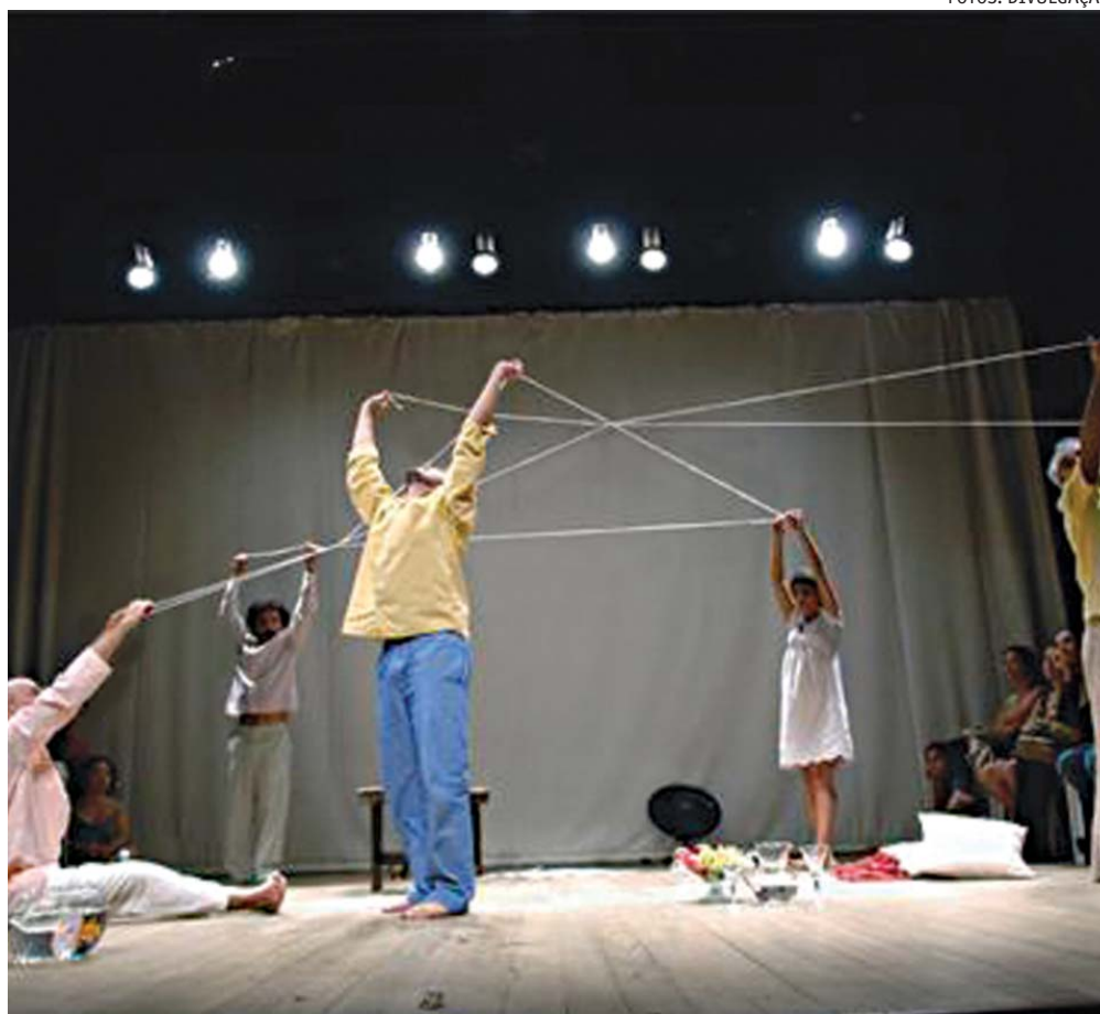
Cena do espetáculo "A Gaiivota", a mais nova encenação do gupo Piolin, que irá ao Cariri