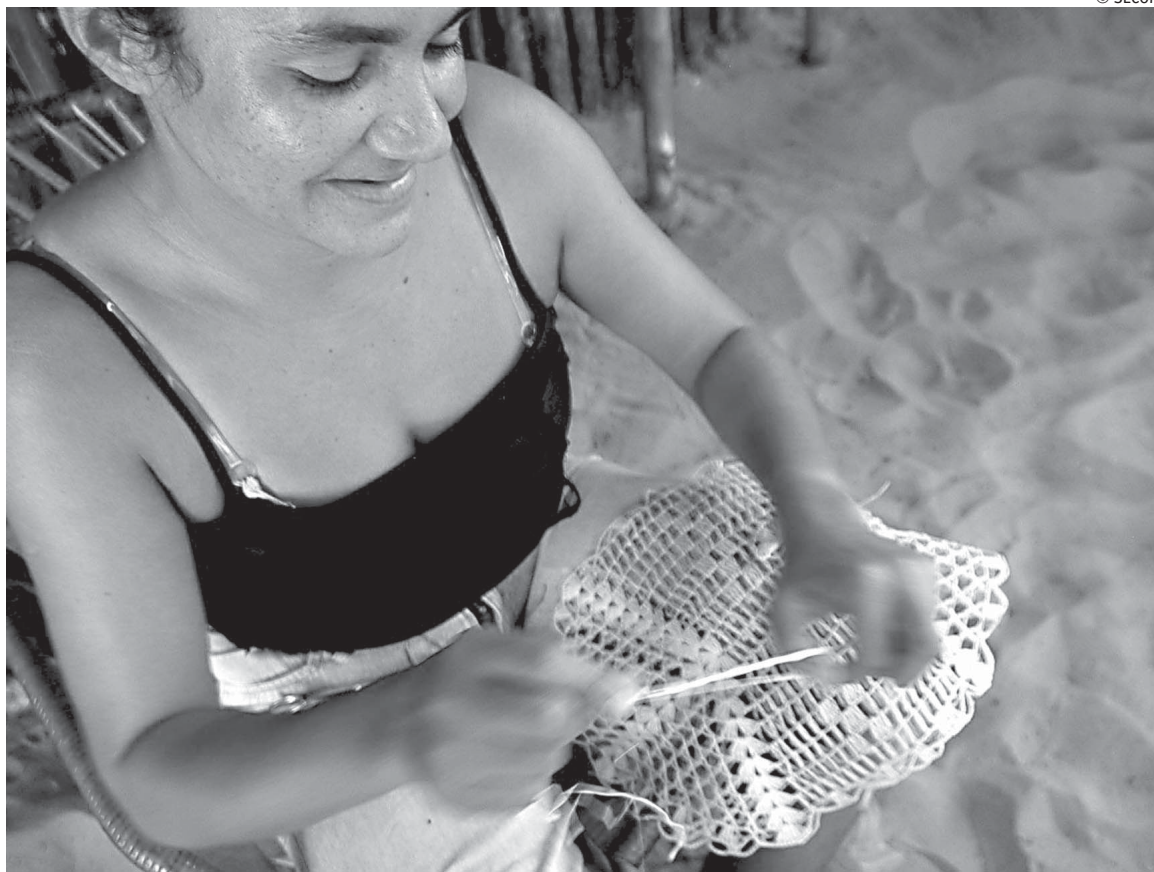
No Estado, elas vão conquistando o mercado artesanal, que é uma forte fonte de renda e garante lucro

A Cooperativa das Bordadeiras de Alagoa Nova (Cooban), uma das oito unidades produtivas da Paraíba premiada pelo Top 100 de Artesanato deste ano, emprega 35 mulheres da zona urbana e rural do