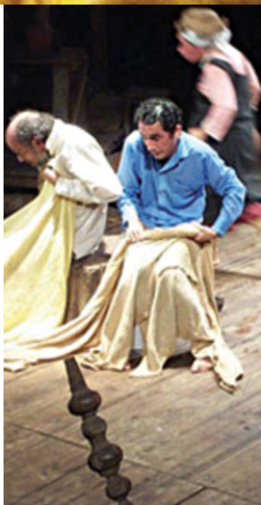
Baseado no conto de Guimarães Rosa, a peça paraibana 'Vau da Sarapalha' fez sucesso no Brasil e em diversos países