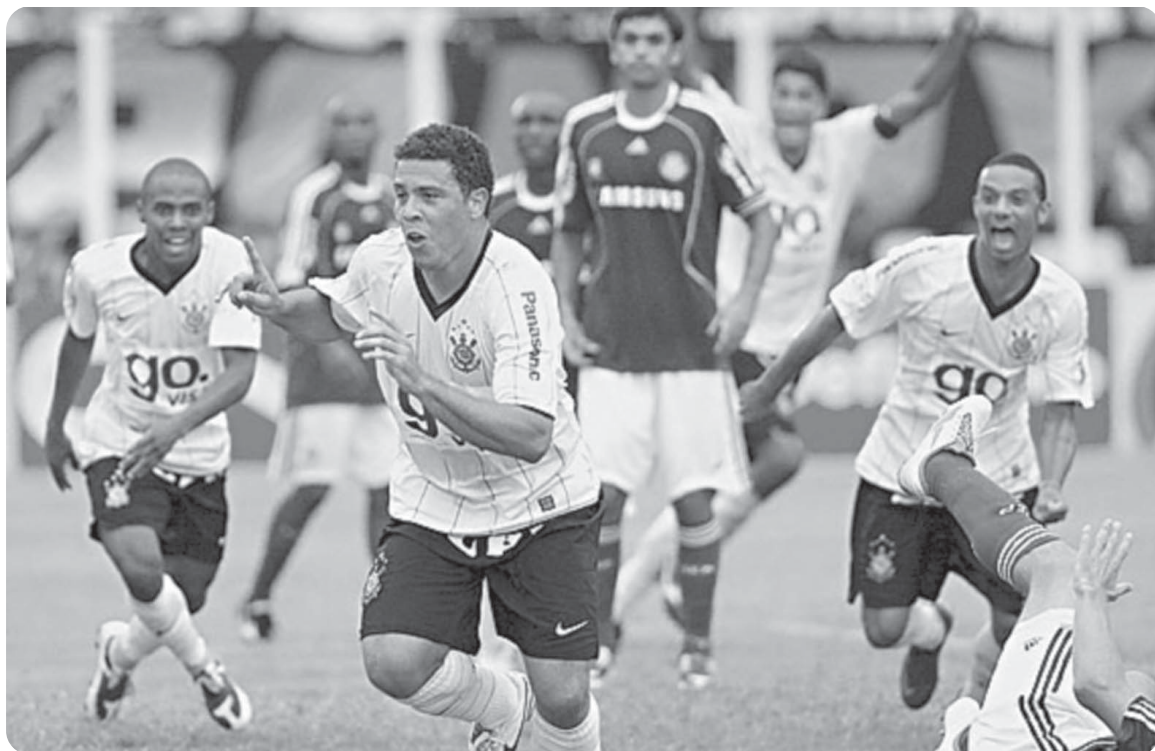
... e corre para comemorar junto com os seus companheiros no jogo que aconteceu em Presidente Prudente