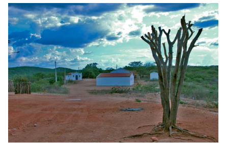
Na foto maior o chefe do clã com filhos netos e bisnetos. Acima, vista do Quilombo do Talhado em Santa Luzia