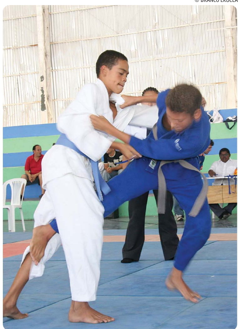
Judô paraibano tem alcançado resultados expressivos nos últimos anos

Apesar da competição estar voltada para atletas de 23 anos, a Paraíba enviará judocas entre 15 a 22 anos, ou sejam, nascidos em 1994, 1993, 1992, 1991, 1990, 1989, 1988 e 1987. Os judocas masculinos lutarão a partir da faixa roxa/2º kyu (-55kg, -60kg, -66kg, -73kg, -81kg, -90kg, -100kg e +100kg). Já o feminino, a partir de faixa laran-