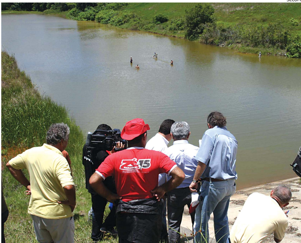
A Barragem de Gramame é responsável pelo abastecimento de parte da Grande João Pessoa