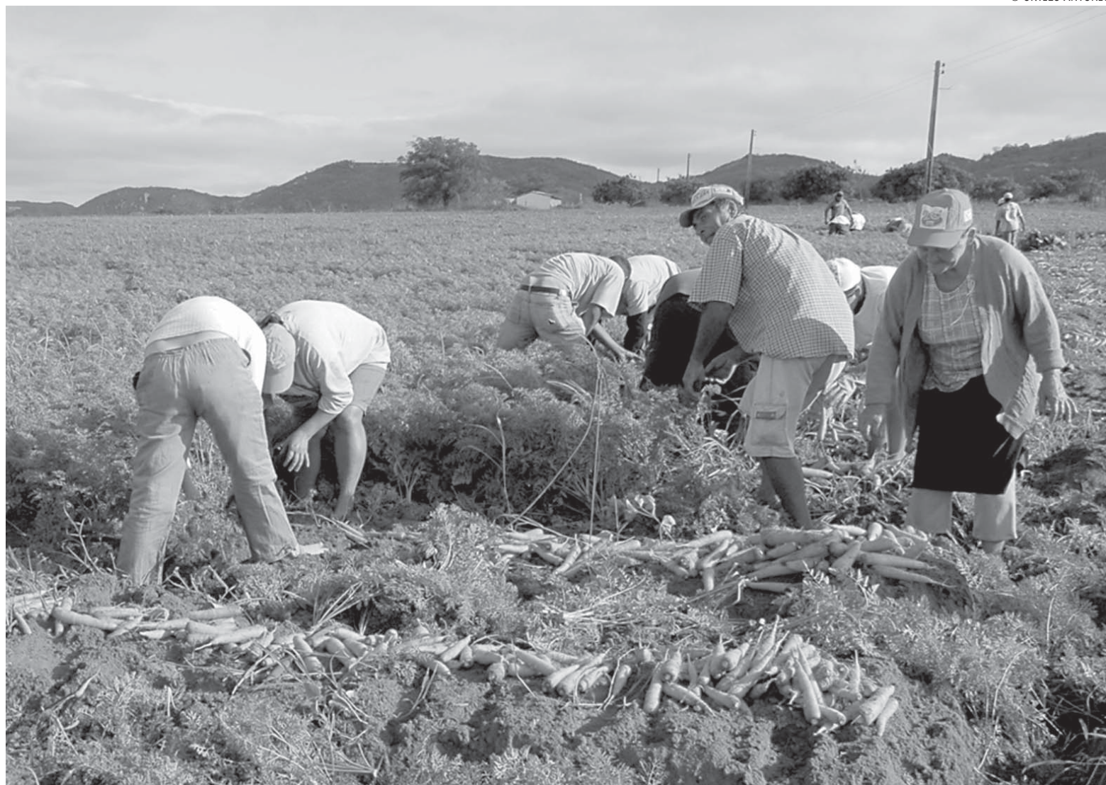
Os agricultores que regularizarem a situação poderão ter novas oportunidades de financiamentos do Pronaf, para dar continuidade ao trabalho