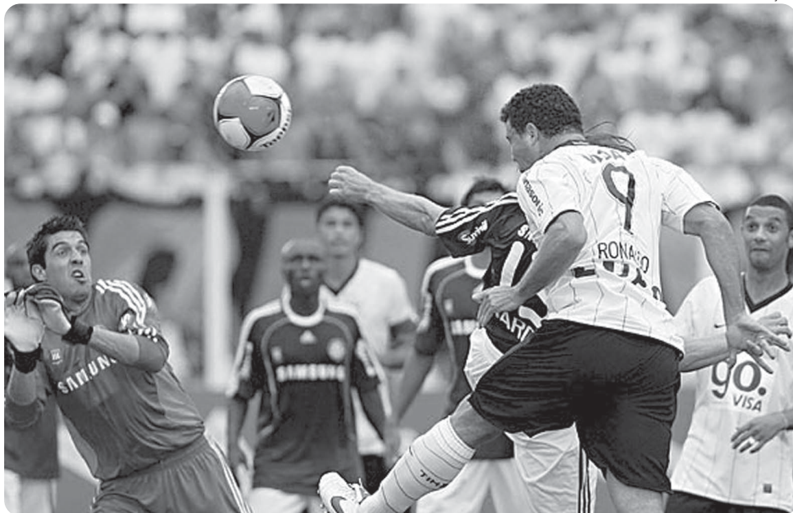
Ronaldo sobe e cabeceia firme para marcar o seu primeiro gol após um longo período de inatividade...