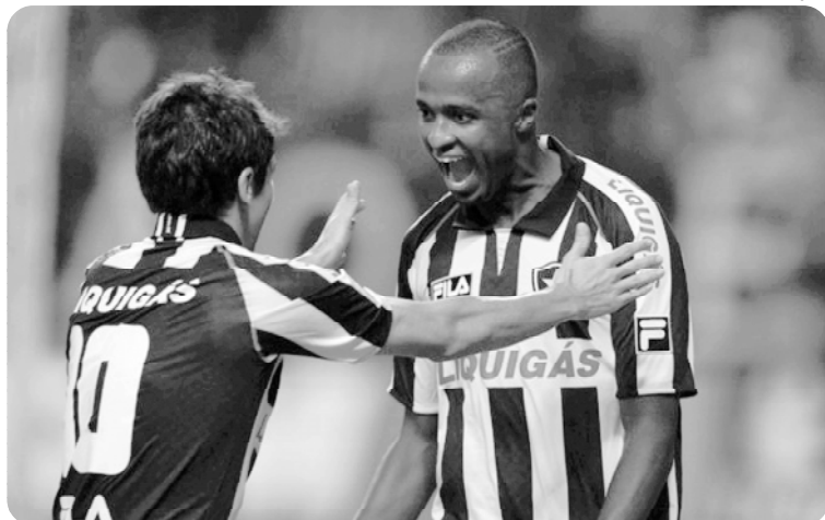
O Botafogo, de Reinaldo, joga contra o Sport, hoje, na Ilha do Retiro

n o poder  contar com tr s titulares: Maur cio Ramos e Pierre, lesionados, e Pablo Armero, servindo a sele o da Col mbia. Muricy optou pelas entradas de Marc o na lateral e do jovem Maur cio na zaga. J  no meio-campo, Edm lson e Souza atuaram lado a lado como volantes.