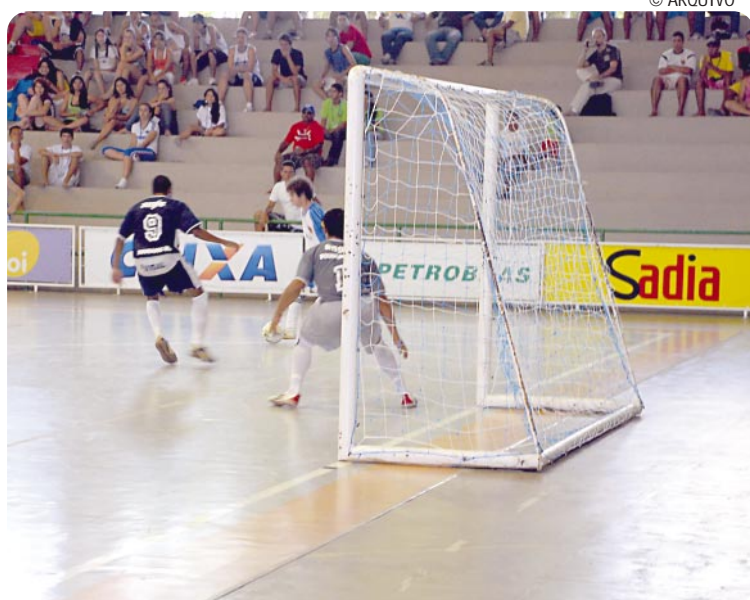
A competição de futsal reúne sete Estados brasileiros neste fim de semana