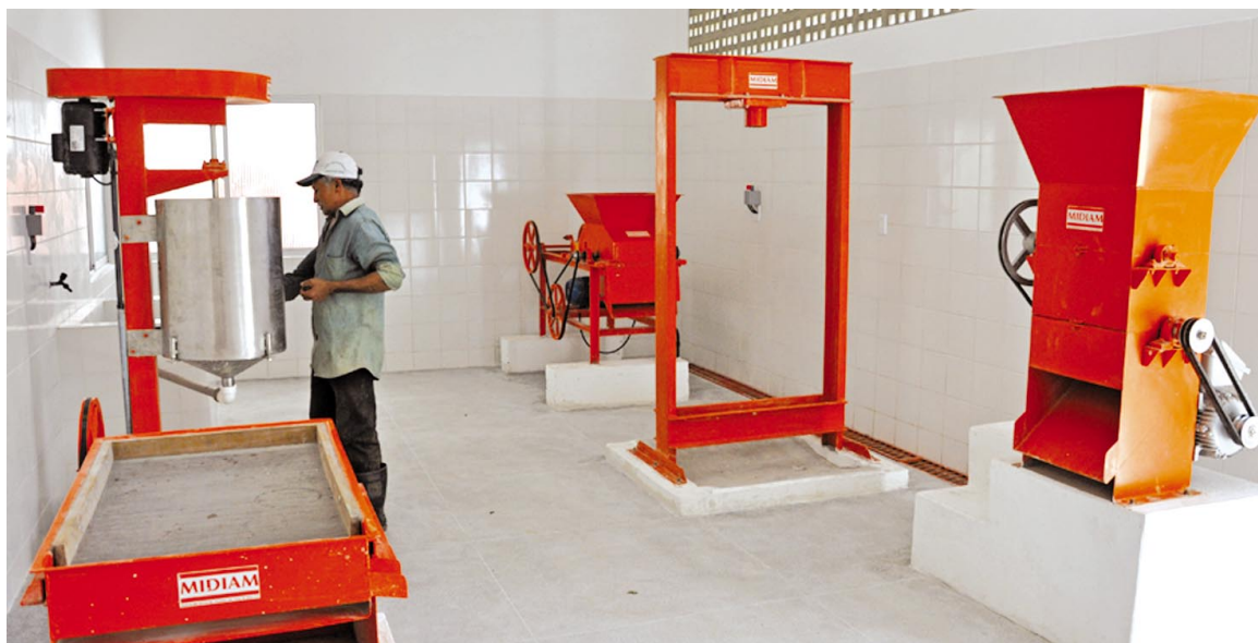
Casa de farinha é construída no Sítio Almeida, Distrito de Alvinho, em Lagoa Seca, em terreno doado pelos agricultores

No sítio é produzido de tudo um pouco, por isso atende às exigências dos consumidores. São produzidos alface, repolho, coentro, batata doce, inhame, coco, laranja de vários tipos e jerimum. Eles estão testando o cultivo de um tipo de laranja procedente da Ásia, que se destaca das demais pelo seu tamanho. "A produção da casa de farinha vai ajudar a diversificar nossa oferta de produtos e aumentar a renda de nossas famílias", comentou com entusiasmo o produtor rural.