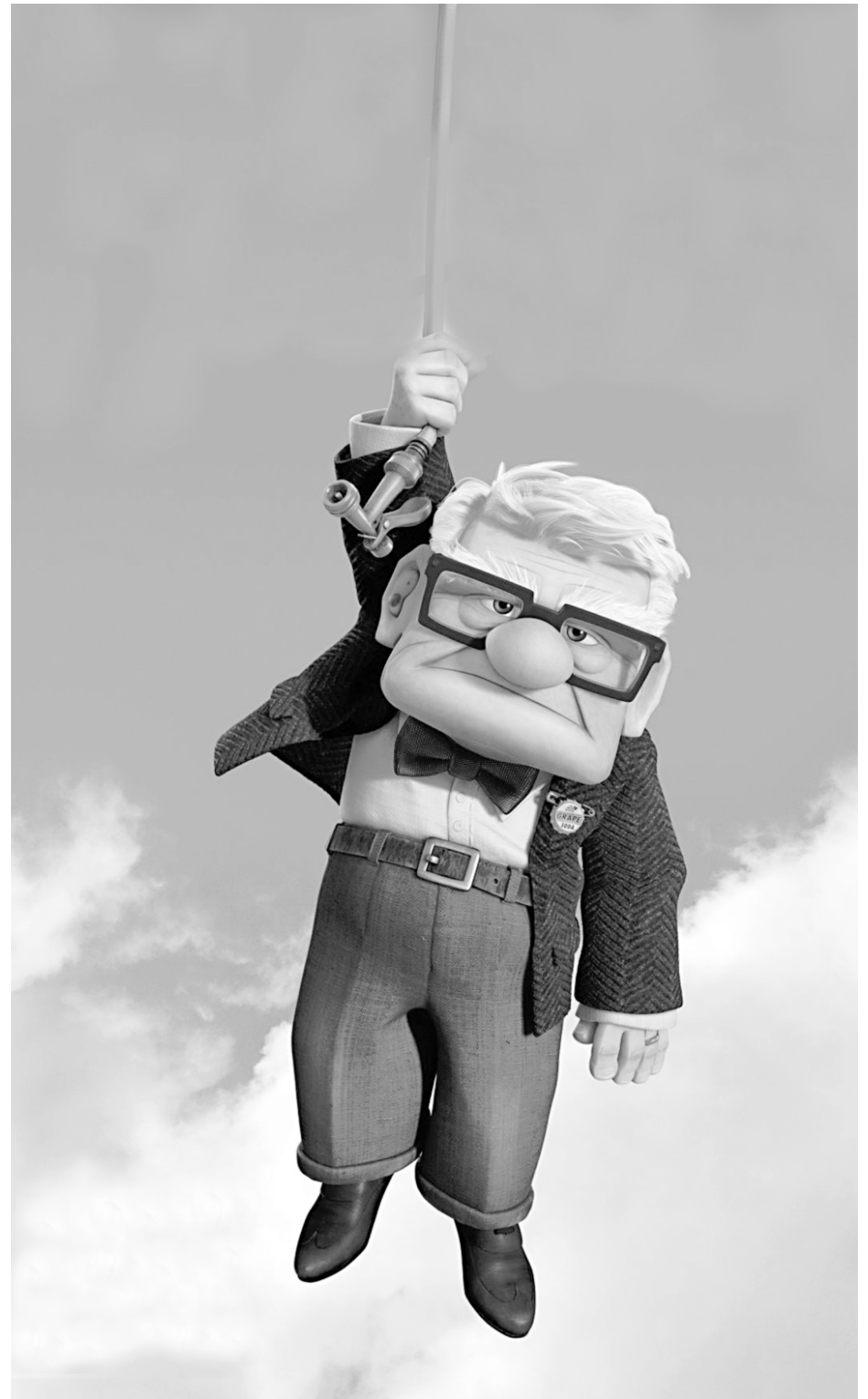
Cena de 'Up - Altas aventuras', animação que está em cartaz no Cine Box 7, em João Pessoa

Áries (21/03 a 20/04) - Parece que algumas pessoas insistem em cruzar o seu caminho e atrapalhar seus planos e projetos. Procure ter um pouco mais de paciência, pois a partir do dia 9 essa pressão diminui consideravelmente. Continue no controle de suas emoções.