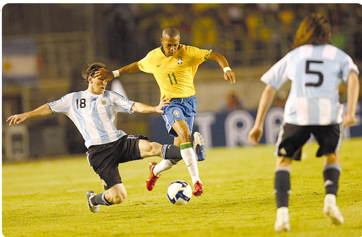
No jogo disputado ano passado pelas Eliminatórias, realizado no Brasil, não houve vencedor e sim empate de 0 a 0