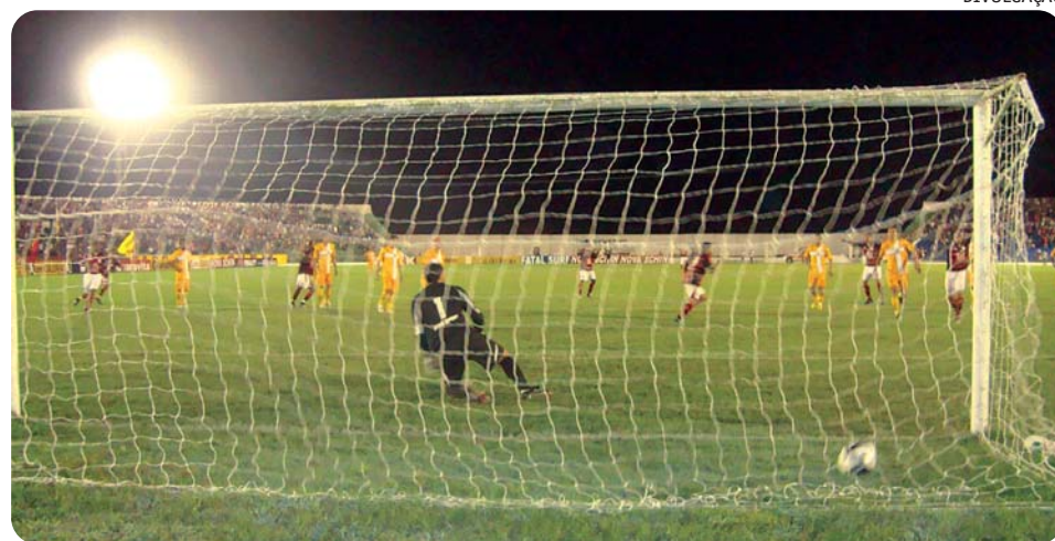
Na última partida em Campina Grande, o Campinense venceu com gol de pênalti o Brasiliense