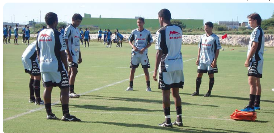
A maioria dos jogadores do Botafogo já foi regularizada junto à CBF para a Copa Paraíba