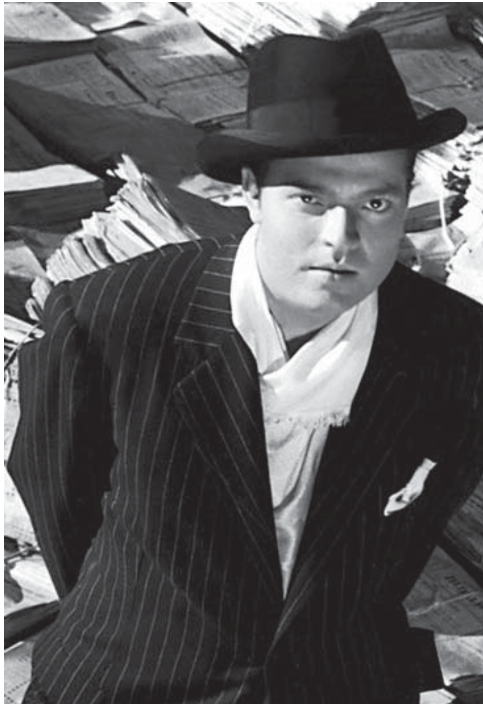
Orson Welles é o grande nome de 'Cidadão Kane', filme produzido na década de 40

O Cine Sesc funciona no miniauditório da entidade comerciária, que fica situado na Rua Desembargador Souto Maior, 281, Centro de João Pessoa, de segunda a sexta-feira. Mais informações pelo telefone (83)32083158.