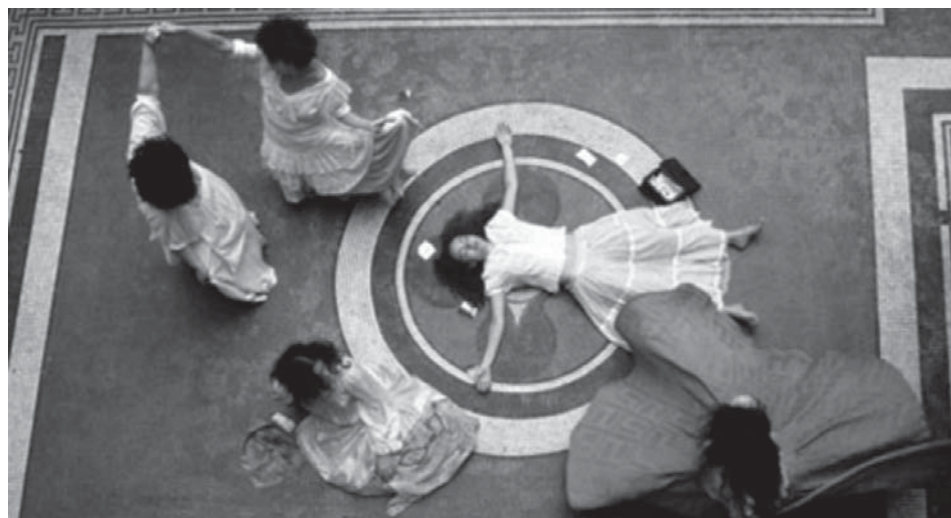
Cena de 'Hysteria', espetáculo encenado pelo Grupo XIX de teatro, de São Paulo

Contudo, a questão da histeria feminina não é específica daquela virada de século (XIX/XX) e em muitos níveis ainda encontra reflexos na nossa atualidade. Para verificar essa ressonância, é dada voz às mulheres da transição dos séculos XX/XXI, experimentando uma dramaturgia híbrida - as atrizes trazem, por meio de um texto previamente elaborado, as questões referentes ao século XIX, e as colocam em confronto com as questões das mulheres da plateia (séculos XX/XXI), fazendo da sala de