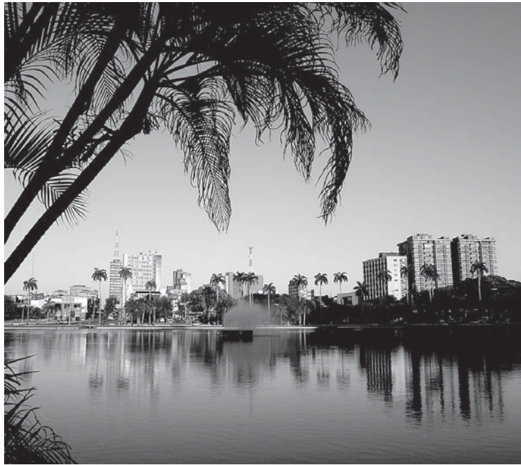
A Capital paraibana sediará, de 2 a 8 de novembro, a Semana de Cultura da Paz