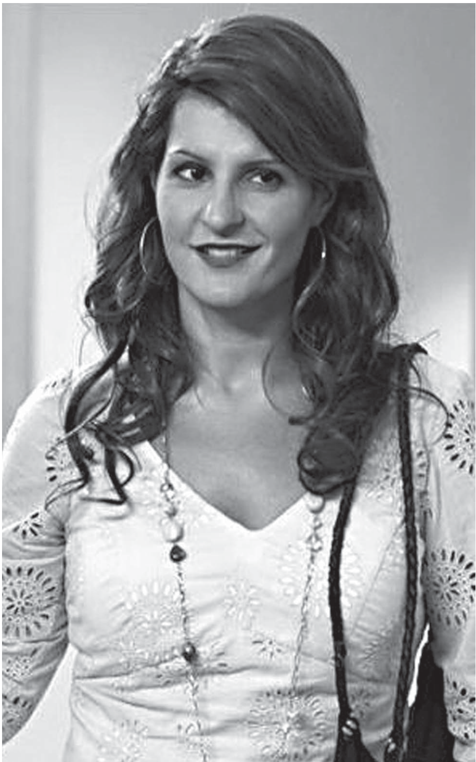
Nia Vardalos é a protagonista de 'Falando Grego', que entra em cartaz hoje na Paraíba