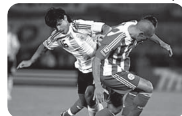
A Argentina perdeu a terceira partida consecutiva