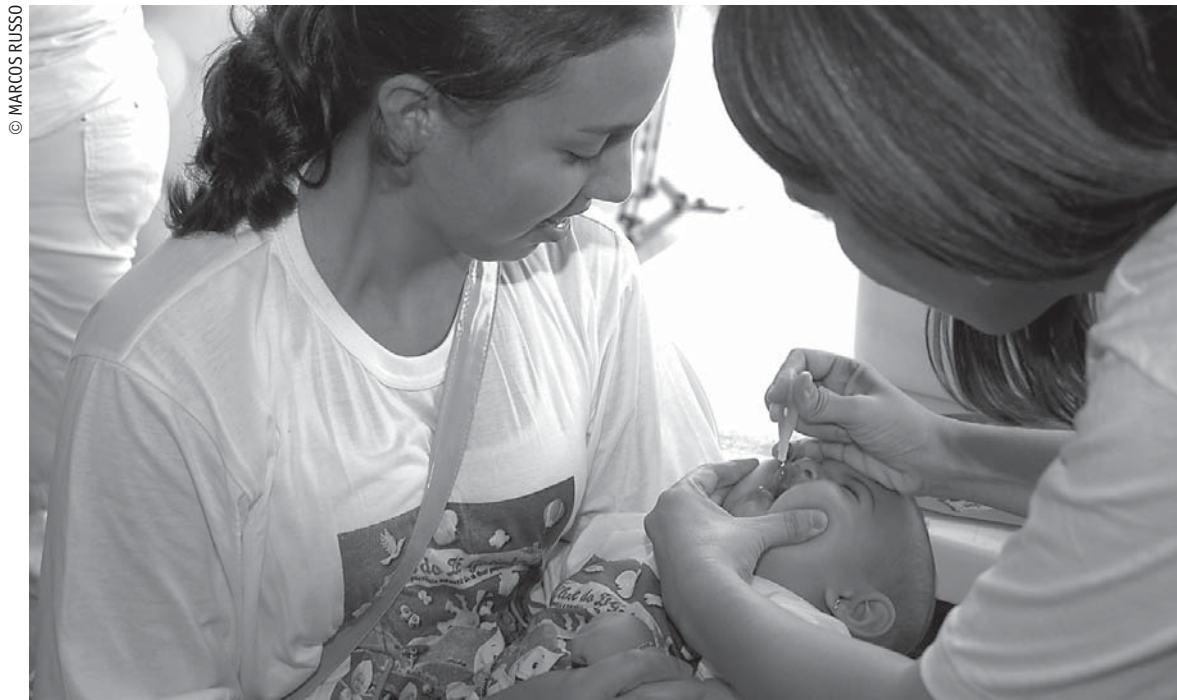
A imunização das crianças é considerada o meio mais eficaz para evitar a propagação da poliomielite na Paraíba

Este é o 29º ano da campanha nacional e o 20º sem a doença no país. Os imunizantes já foram distribuídos nas 12 Gerências Regionais de Saúde, que repassaram aos municípios, desde o mês de agosto, quando deveria ter sido realizada esta segunda etapa da vacinação. O adiamento aconteceu por causa da sobrecarga dos serviços