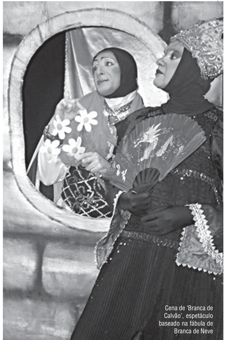
Cena de 'Branca de Calvão', espetáculo baseado na fábula de Branca de Neve