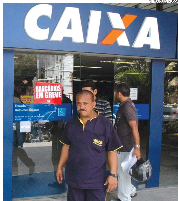
Usuário só ingressou em agência da Caixa Econômica a partir das 11 horas