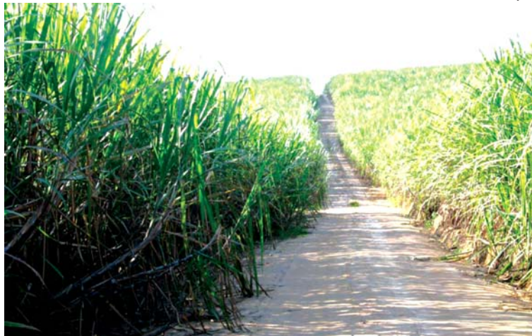
A meta do Governo é adequar a necessidade de ampliação da produção

Essas áreas, somadas àquelas onde o plantio já não é permitido, como as unidades de conservação e terras indígenas, fazem com que fique proibido o plantio da cana em 92,5% do território brasileiro. As proibições previstas pelo zoneamento estabelece que estarão aptos ao plantio da cana-de-açúcar 64 milhões de hectares. Considerando os novos critérios, a expansão da cana-de-açúcar poderá ocorrer em 7,5% do território nacional. Atualmente, o cultivo de cana ocupa uma área de 8,89 mi-