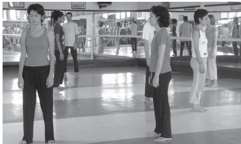
Atores e atrizes paraibanos participam de oficina com Norberto Presta, em João Pessoa

Para esta atividade, que é resultado de uma parceria com o colégio Pio X - onde o grupo Alfenim está realizando residência artística - e com a UFPB, o Coletivo paraibano contou ainda com o apoio da Estação Ciências Cultura e Arte Cabo Branco, do Sebrae PB e da Funjope.