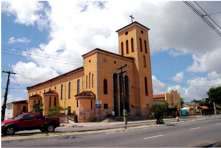
Igreja São José Operário vai receber os fiéis ao término do ato público