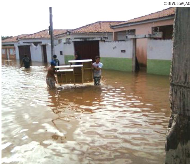
Chuvas causaram inundações em bairros de Patos em abril deste ano

Os recursos serão destinados à recuperação e reconstrução de nove açudes (Serra Negra, Maria de Fátima, Gato, Roberval Dantas, Lagoa de Favela, Trincheira, Odilona Braga, Santa Rita, Cidade); 208 quilômetros de rodovias (24 trechos de bairros e comunidades); 13 escolas, três creches, um asilo de idosos, 166 casas e 13 passagens molhadas. Todas essas áreas foram incluídas no Plano de