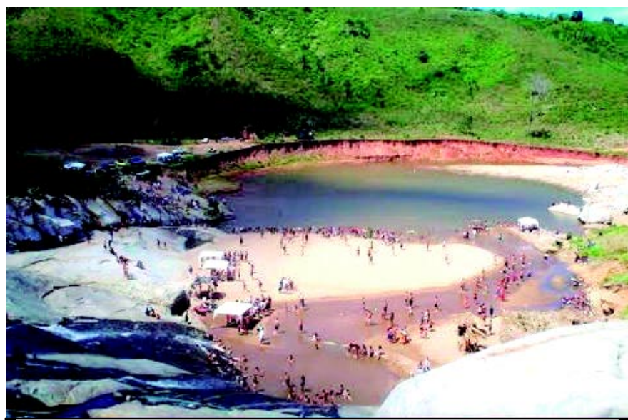
Balneário Cachoeira da Furna - um dos cartões postais da cidade de Alagoa Nova

A região era primitivamente habitada pelos índios Bultrins, da nação Cariris. Foi fundado um aldeamento a Aldeia Velha, posteriormente chamado de Bultrin. Com a promulgação do Diretório dos Índios, em 1760 as terras indígenas do aldeamento extinto foram invadidas por fazendeiros, gerando um conflito com os indígenas, que resistiram à invasão. Os índios foram vencidos. Remanescentes destes indígenas foram viver na missão do Pilar. Os portugueses estabeleceram então fazendas na região, que foram os núcleos de novos povoados.