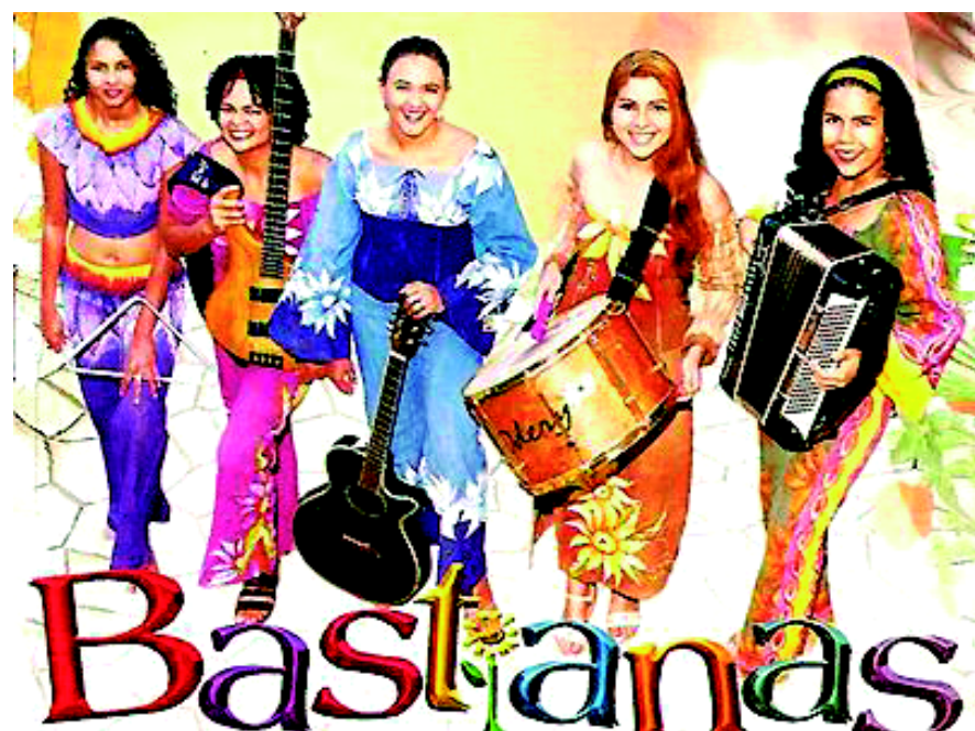
Show de As Bastianas encerra rota em Alagoa Nova com muito forró e animação

Palco da Revolta de Quebra-Quilos no século XIX, a cidade de Alagoa Nova, localizada a cerca de 90 km da Capital paraibana, recebe a 'Rota Cultural Caminhos do Frio 2011'.