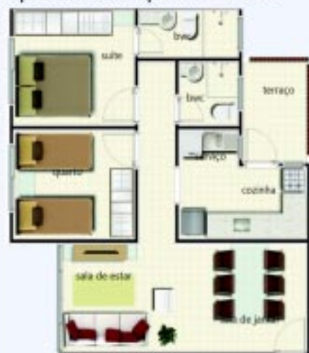
Apartamento tipo 01 - Terreo

Construções Incorporações Locações Consultoria