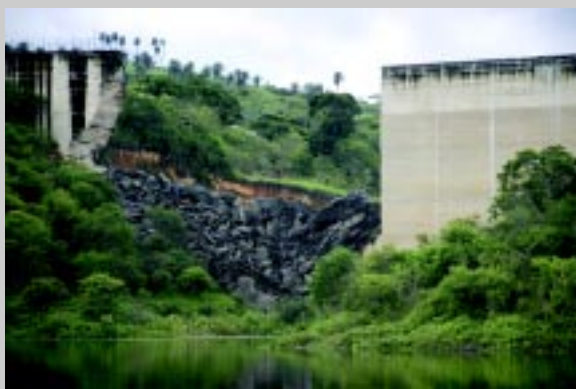
Barragem de Camará Rapel, esporte de alto nível