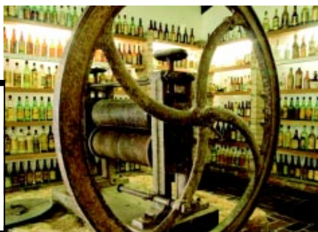
Museu da cachaça - história e desenvolvimento das usinas e produção de aguardente.

Em 5 de junho de 1900, foi extinta a vila de Alagoa Nova. Foi novamente elevado à categoria de município com a denominação de Alagoa Nova, pela lei nº 215, de 10 de novembro de 1904.