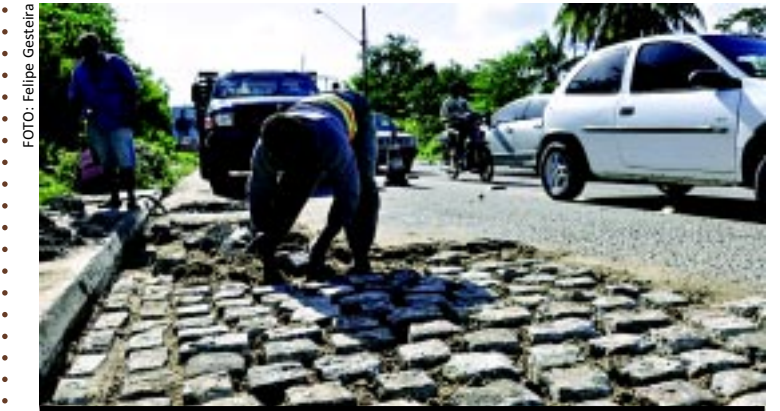
[FOTO&LEGENDA] Com dias mais ensolarados, agentes da Secretaria de Infraestrutura de João Pessoa retomaram a Operação Tapa Buraco em vários bairros da Capital. Esta semana estão sendo feitos serviços de recuperação e limpeza de galerias e recuperação de vias.