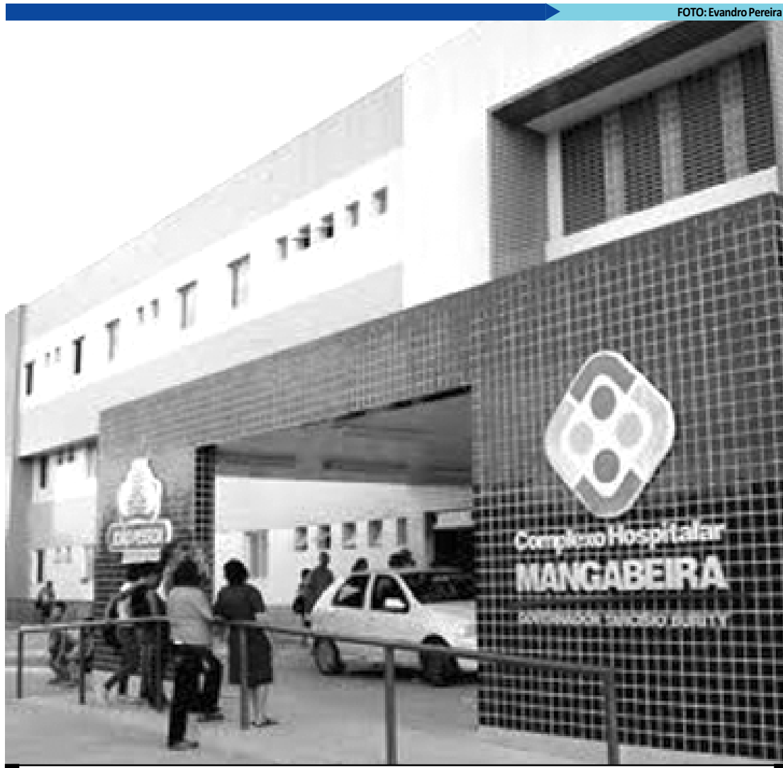
Inspeção realizada ontem no Trauminha, em Mangabeira, constatou morte de paciente com a bactéria KPC

Unidades de Saúde, revelou o promotor da Saúde de João Pessoa, João Geraldo Carneiro, na tarde de ontem. A Prefeitura Municipal de João Pessoa está investindo em obras de ampliação e melhorias do Trauminha. Hoje o hospital possui 120 leitos e estão passando