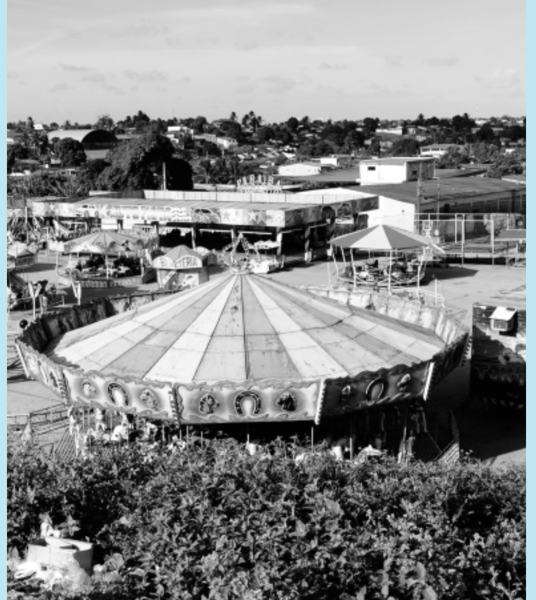
Bombeiros e CREA-PB estiveram no parque instalado às margens da avenida principal de Cruz das Armas