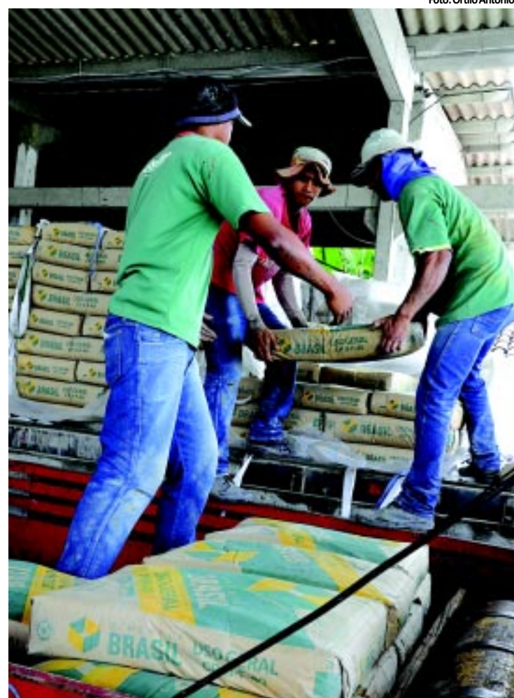
Distribuidora e fábrica têm 10 dias para explicar escassez do produto

Distribuidora de cimento Nassau para apresentarem as razões do desabastecimento do produto no mercado. PÁGINA 12