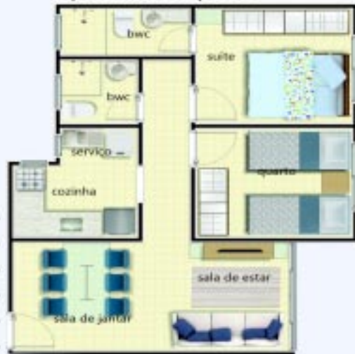
Apartamento tipo 02