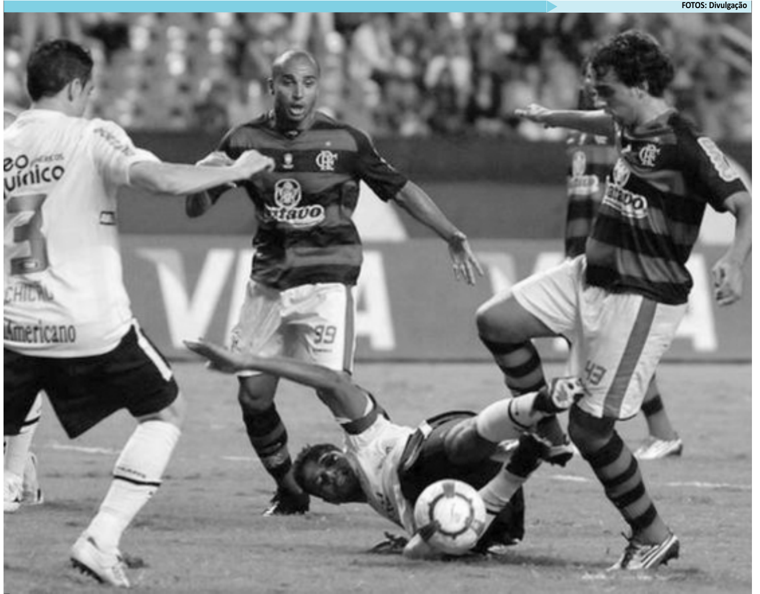
Corinthians e Flamengo continuam na liderança absoluta da televisão e seguem ganhando muito dinheiro nas transmissões ao vivo do Brasileiro

O Fluminense verá também o Flamengo mais distante. Serão R$ 43 milhões de diferença de receitas. Pelo contrato vigente, ela é de aproximadamente R$ 20 milhões.