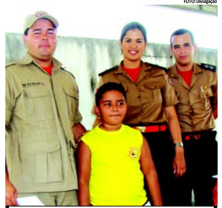
Para participar do treinamento, as crianças precisam estar na escola

Para participar do treinamento, os garotos e garotas devem estar frequentando a escola normalmente. Durante o curso, todos terão di-