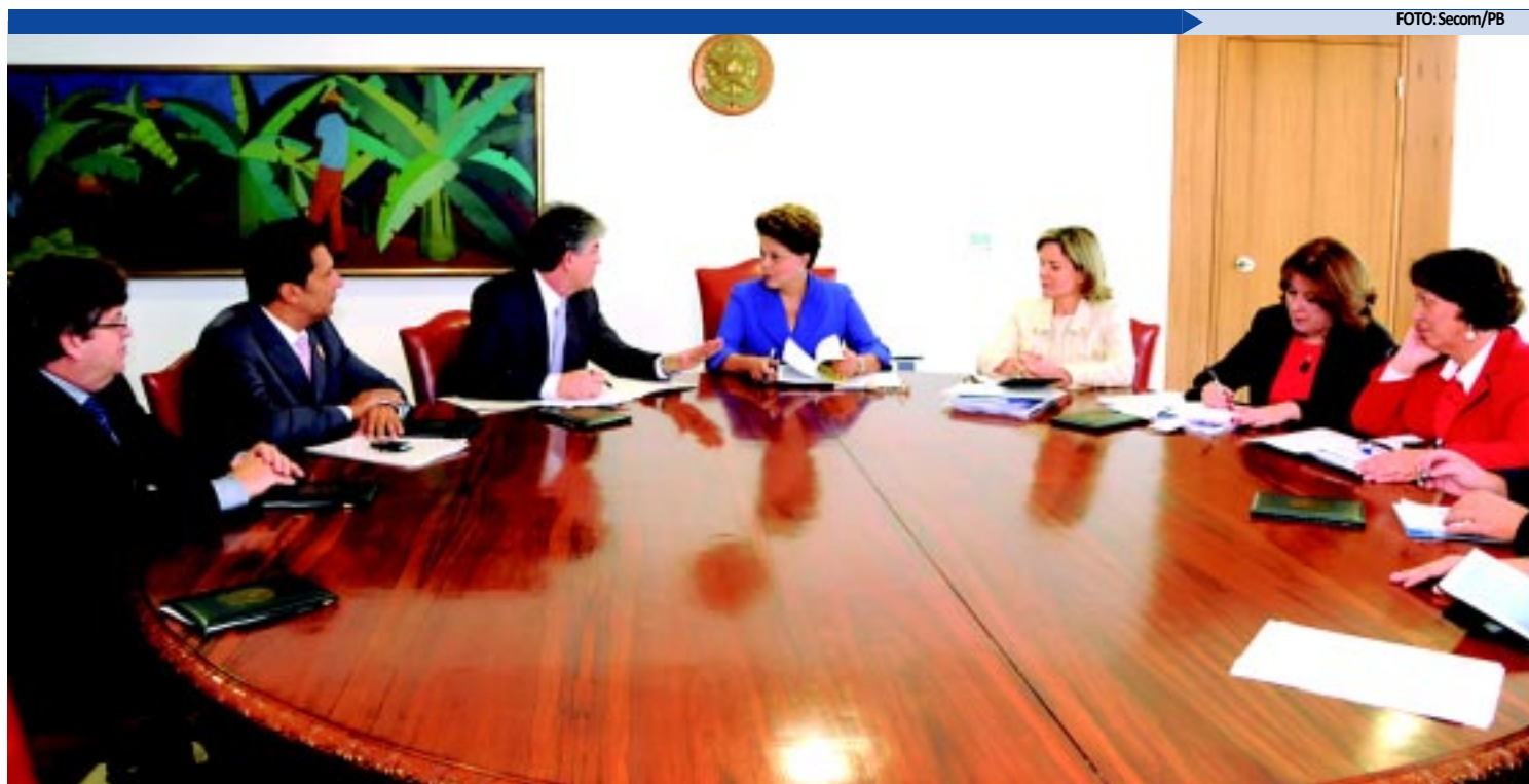
Governador Ricardo Coutinho teve audiência com a presidente Dilma Rousseff, no Palácio do Planalto, e recebeu garantia de recursos para obras conveniadas

De acordo com o governador, Suape já opera com 18% acima de sua capacidade, e a modernização do Porto de Cabedelo dialoga com o investimento da Fiat na divisa entre Pernambuco e Paraíba e com outros empreendimentos, como as quatro fábricas de cimento que serão instaladas na Paraíba – que se tornará o maior produtor de cimento do país.