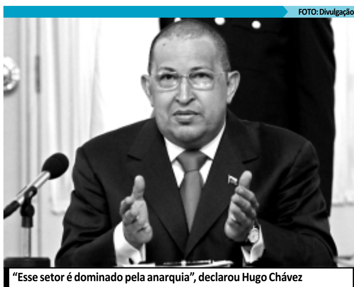
"Esse setor é dominado pela anarquia", declarou Hugo Chávez

Usando uniforme militar e sem cabelos por causa da quimioterapia, Chávez rebateu as informações de que seu estado de saúde havia piorado. "Eu estou trabalhando mais do que nunca. Mas, é claro, tudo sujeito a um regime de atividade física reduzida e um plano de recuperação", disse ele, referindo-se às recomendações médicas para este período do tratamento do câncer.