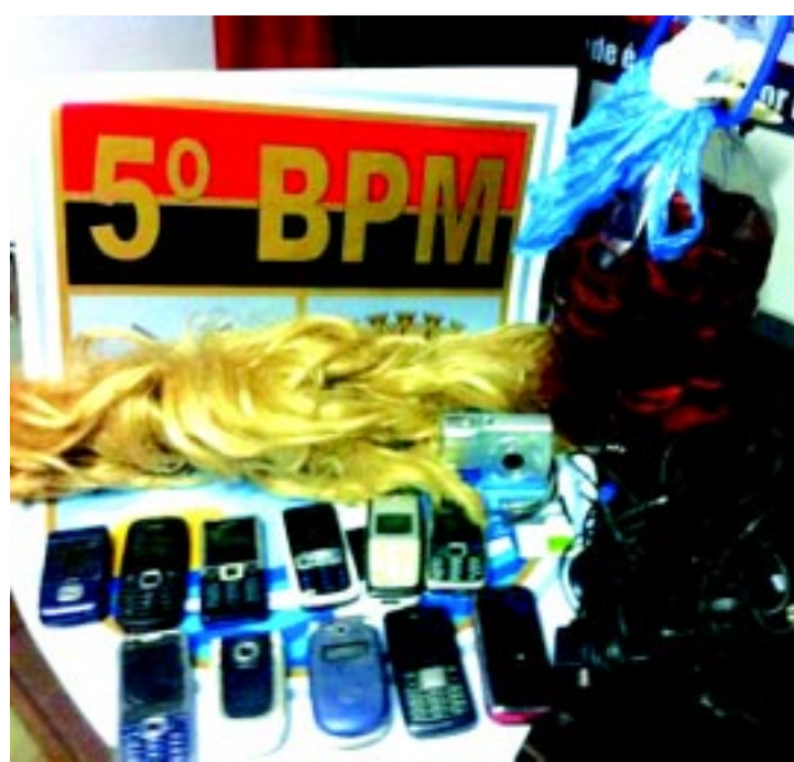
Polícia encontrou com adolescentes celulares, gasolina e uma peruca