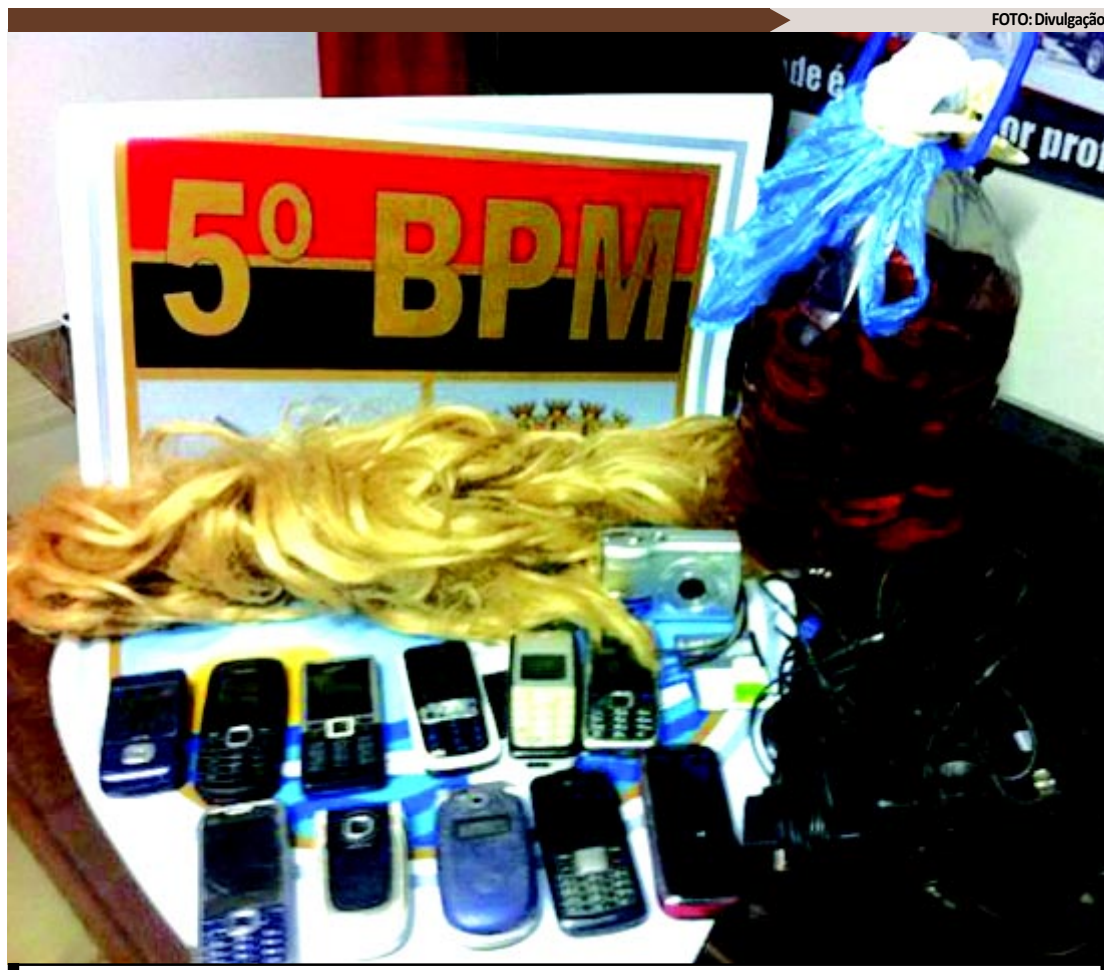
Com os adolescentes foram encontrados celulares, máquina fotográfica e um botijão com dez litros de gasolina