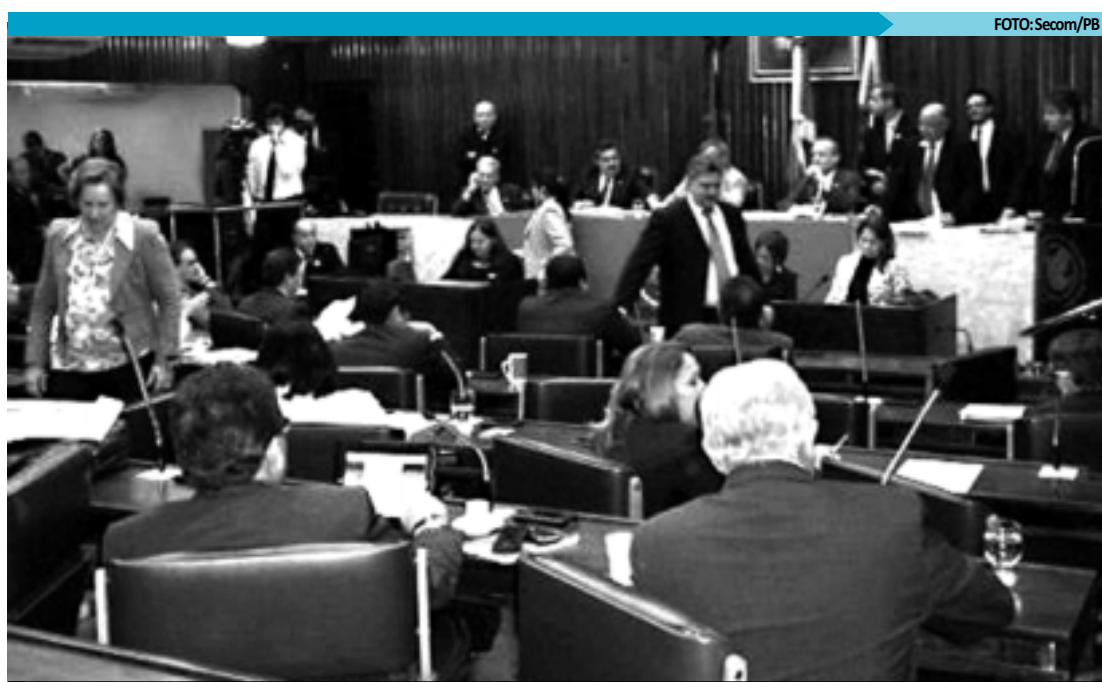
Bancada de Oposição saiu do plenário e adiou a votação de projeto da permuta de terrenos para a quarta-feira

Com relação às críticas feitas pelo deputado André Gadelha, a assessoria de imprensa da Caixa Econômica Federal disse que a orientação da instituição é não falar sobre o assunto, já que o princípio que rege a avaliação é a do sigilo bancário. A assessoria, no entanto, deixa claro que toda avaliação obedece a alguns princípios de natureza normativa, rigorosamente definidos pela empresa, e passa pela homologação da Gerência de Governo da instituição.