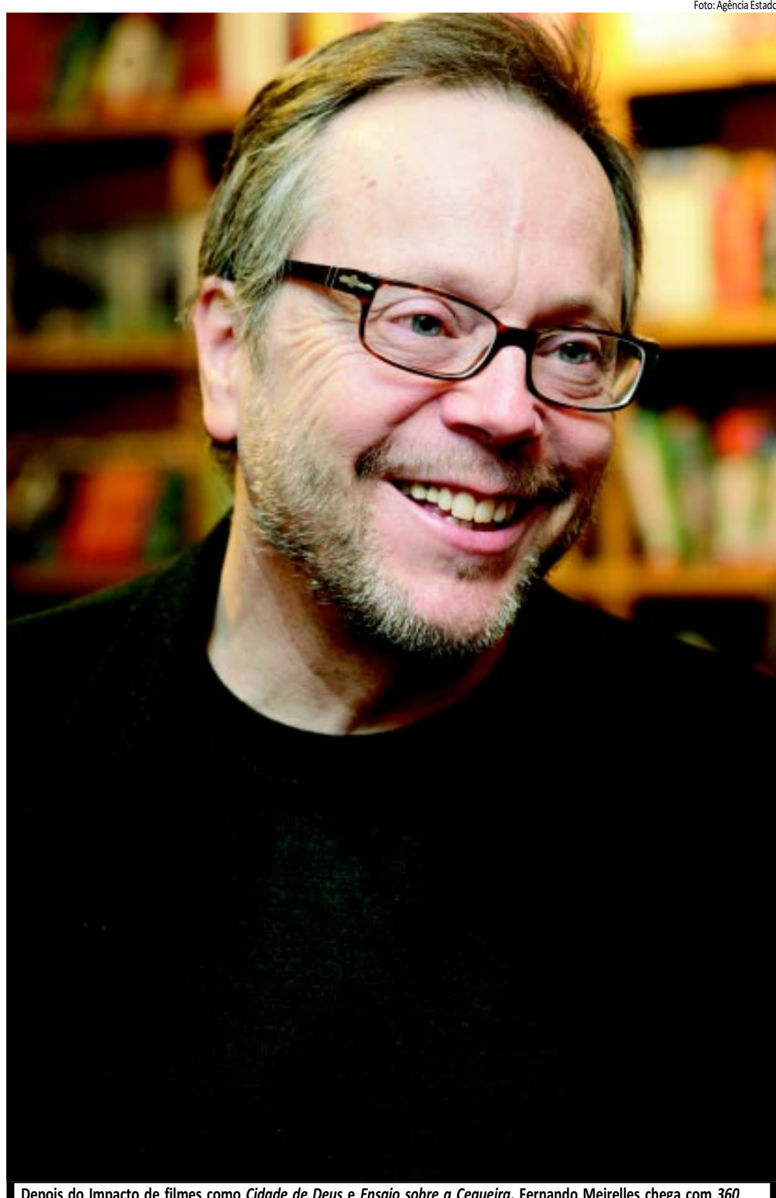
Depois do Impacto de filmes como Cidade de Deus e Ensaio sobre a Cegueira , Fernando Meirelles chega com 360

No meu caso acho que não é tanto o vício na adrenalina. Meu problema é que sofro de entusiasmo. De acordo com o dicionário, a palavra vem do grego em + theos (em Deus), ou possuído por uma força divina. Não sou religioso. Então Deus está fora da minha equação, mas percebo quando sou arrebatado por uma alegria que me dá vontade de avançar sem medir obstáculos. Quando a onda passa, já estou comprometido e aí às vezes vem o arrependimento. Mas sigo em frente. Nunca 'cheirei' na vida, mas imagino que o efeito do pó tenha alguma relação com