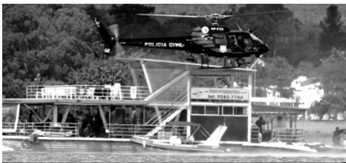
O barco Imagination naufragou no dia 22 de maio e, segundo a perícia, levou apenas três minutos para afundar

Em 2007, Cacciola teve uma prisão preventiva por denúncia de violação a um artigo da lei sobre crimes contra o sistema financeiro, que descreve como crime emitir, oferecer ou negociar títulos ou valores mobiliários sem lastro ou garantia suficientes.