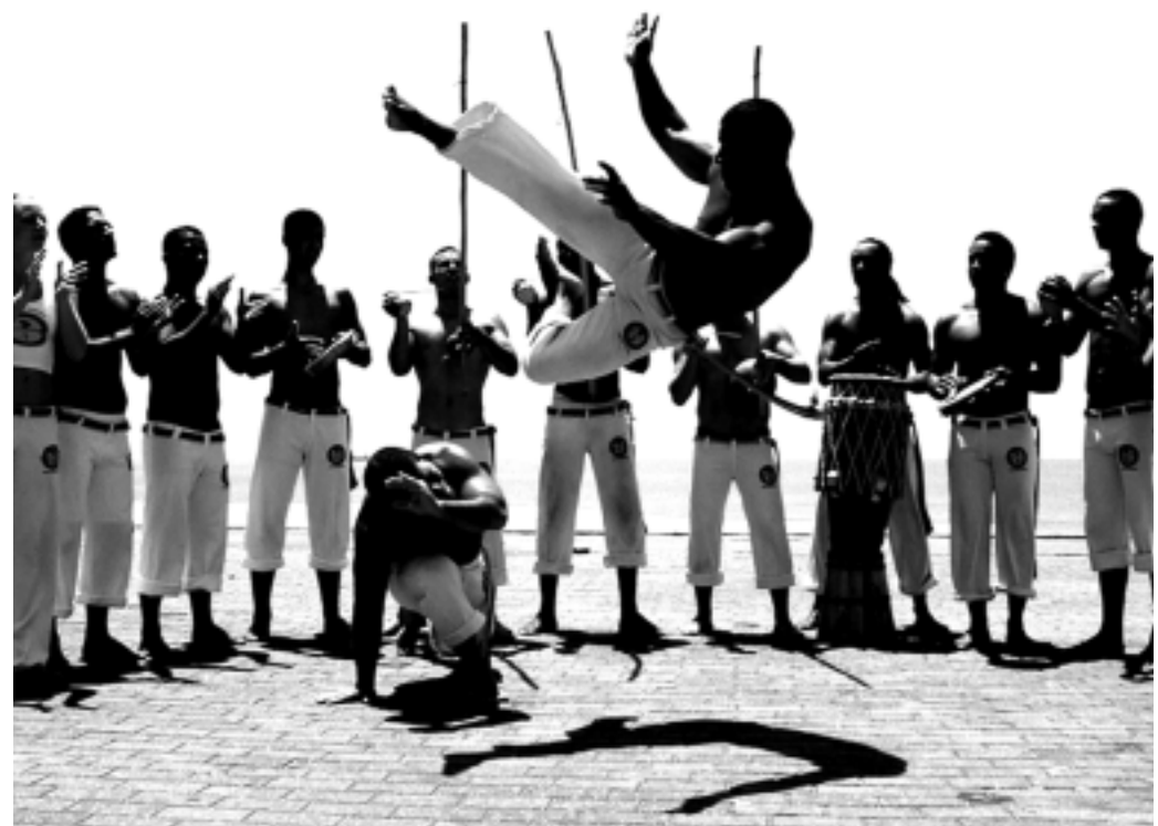
Os pessoenses terão a oportunidade de ver em ação alguns dos maiores capoeiristas do mundo

"Já é possível notar um grande crescimento em número de alunos estrangeiros e brasileiros. Esses eventos ajudam a quebrar barreiras e faz com que a gente acredite que um dia essa arte estará entre as mais praticadas e respeitadas do mundo", finalizou Barrão.