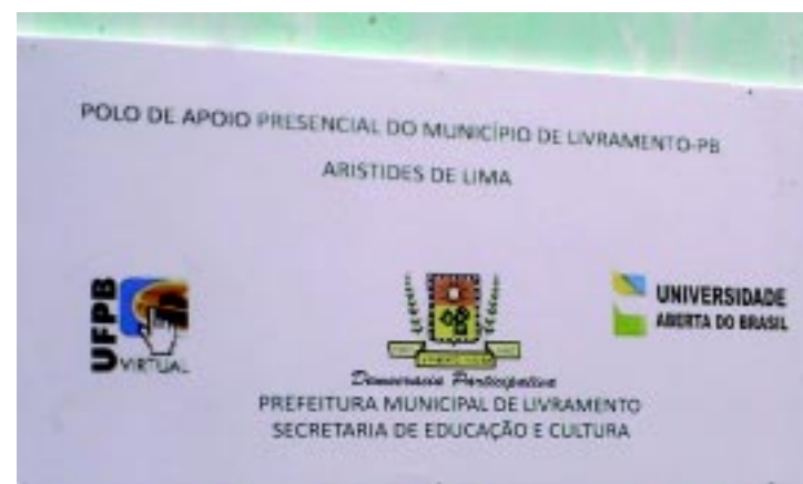
Polo da UAB Aristides de Lima

Para o público interessado em saber como funciona as atividades acesse os seguintes sites: caritertoriocultural@gmail.com ou unileigadotrabalho@gmail.com ou então através do fone 3463.2332.