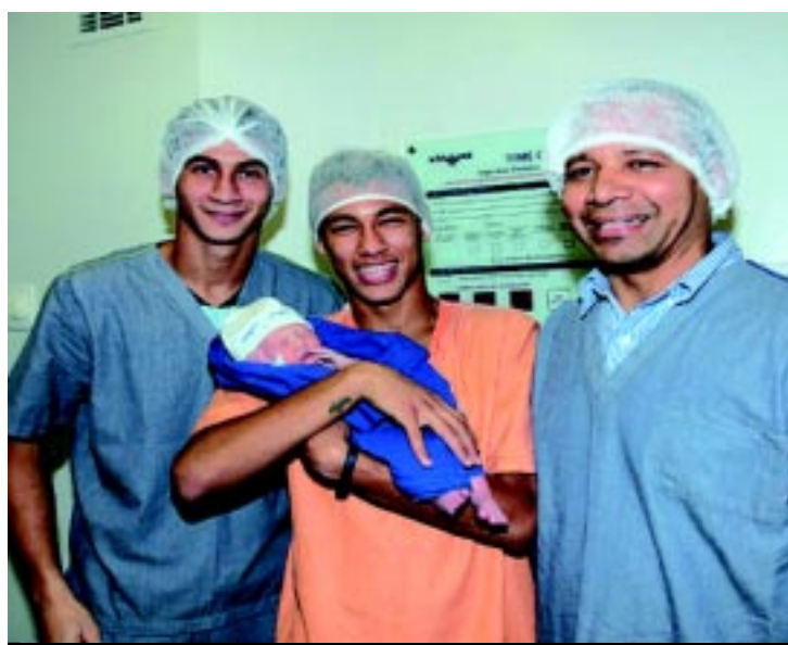
O atacante está muito feliz e não se cansa de colocar o filho nos braços

A mãe do filho de Neymar, cuja identidade não foi revelada ao público, foi submetida a uma ultrassonografia na Casa de Saúde de Santos na última terça-feira. De-