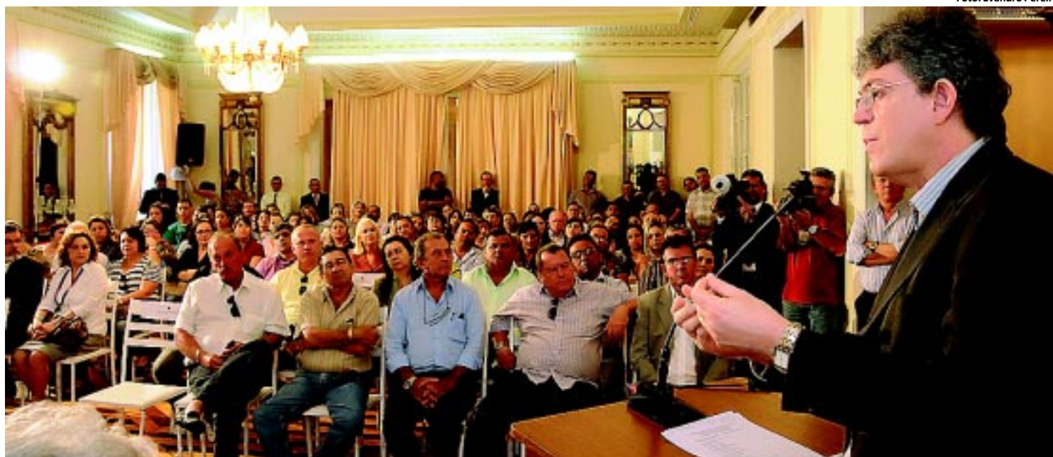
Já foram assinados convênios do Pacto pelo Desenvolvimento Social com 31 municípios do Estado nas regiões do Sertão, Litoral e Zona da Mata

Um padre de Vieirópolis está sendo acusado por fiéis da Igreja Católica de gerar constrangimento ao cobrar por alto-falante o foro da paróquia, tributo relacionado à venda de imóveis. PÁGINA 8