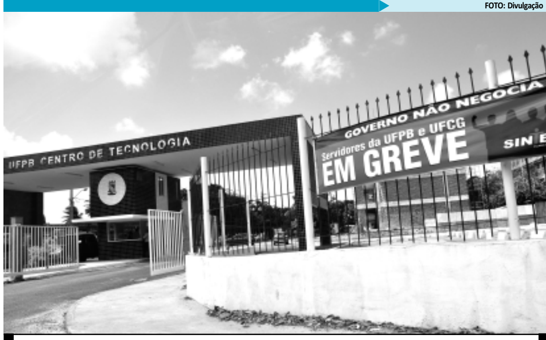
Ontem, os professores da Universidade Federal da Paraíba pararam suas atividades. Hoje, fazem assembleia

pelo Governo Federal para os docentes das instituições conta com a incorporação das gratificações por Exercício do Magistério Superior (Gemas) e a de Atividade Docente de Ensino Básico, Técnico e Tecnológico (Gedbt); correção de 4% na tabela para aos docentes da carreira de Ensino Superior e da