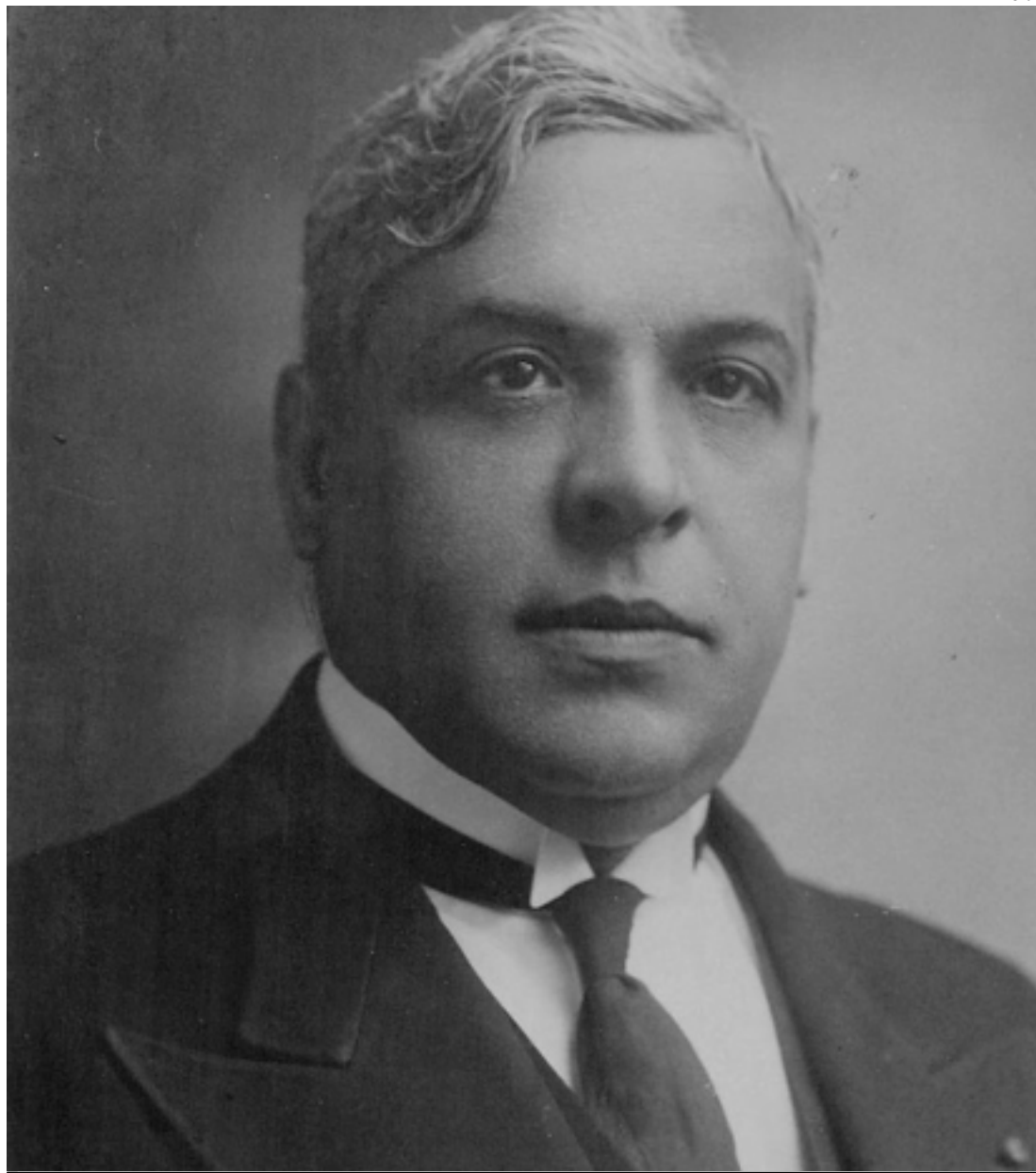
Sousa Mendes (foto) desafiou o ditador Antônio Salazar (1889-1970) e concedeu 30 mil vistos para refugiados

Biografia de Aristides de Sousa Mendes é lançada no Brasil pela Casa da Palavra