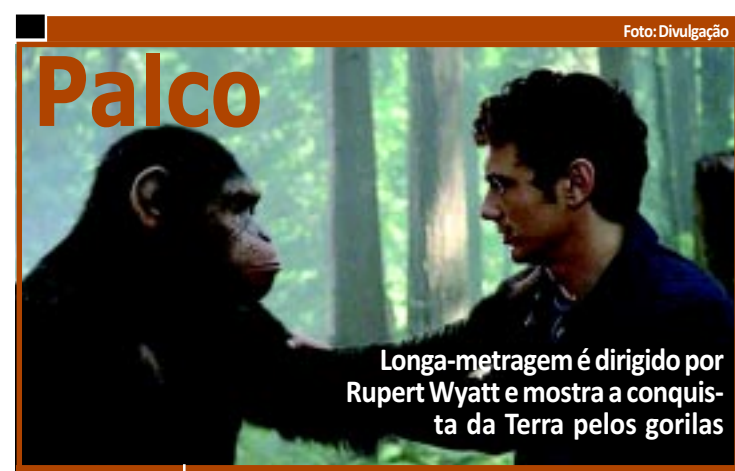
ESTREIA | Planeta dos Macacos: a Origem PÁGINA 17

vida pelos professores, que aderiram a um movimento nacional por melhores salários, realização de concurso público, efetivação do PCCR, entre outros benefícios. PÁGINA 10