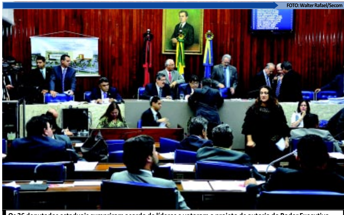
Os 36 deputados estaduais cumpriram acordo de líderes e votaram o projeto de autoria do Poder Executivo

O governador disse que ganha o Estado, o povo e os empresários que estão investindo na Paraíba. "Os contratos da permuta serão formatados e a Academia de Ensino de Polícia atual somente será desativada quando o novo prédio estiver construído, para que não haja paralisação dos cursos em andamento".