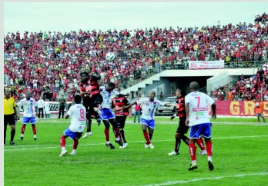
No próximo domingo, o Campinense volta a enfrentar o Fortaleza, agora na casa do adversário