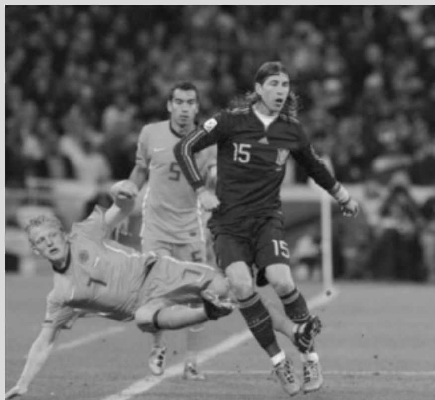
A Espanha, que ganhou a última Copa, perdeu a liderança para a seleção holandesa