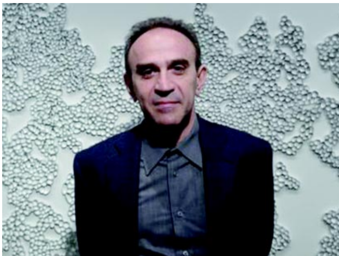
Cidade Livre é o quinto de uma série de livros de João Almino que tem a cidade de Brasília como pano de fundo

Quinto livro de uma série que tem Brasília como pano de fundo, Cidade Livre seguiu uma tradição das obras anteriores do autor ao superar 227 outros romances na escolha do júri - dos cinco títulos de Almino que envolvem a capital federal, apenas o segundo, Samba Enredo (1994), não recebeu nenhuma honraria importante no país. Mas o Zaffari & Bourbon, como lembra, oferece hoje ao vencedor "o maior prêmio brasileiro não estatal", R$ 150 mil. "Fico contente sobretudo