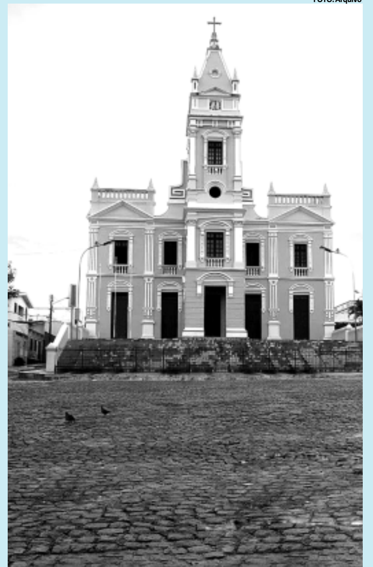
A Catedral de Nossa Senhora foi arrombada pela 2ª vez este ano

rombamento verificado à Catedral de Guarabira este ano. O primeiro aconteceu no mês de julho quando as mesmas caixas de oferta foram arrombadas e todo o dinheiro foi levado.