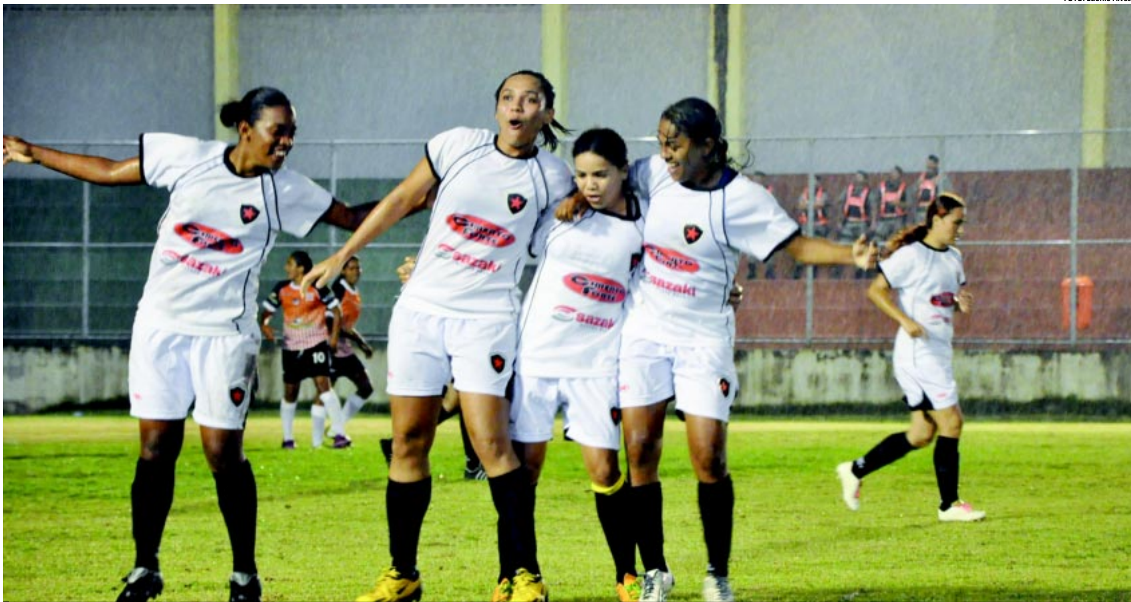
As meninas do Botafogo querem repetir o feito do ano passado, quando passaram para a segunda fase da Copa do Brasil de Futebol Feminino. Hoje voltam a enfrentar as alagoanas no Rei Pelé e têm chances de seguir na disputa