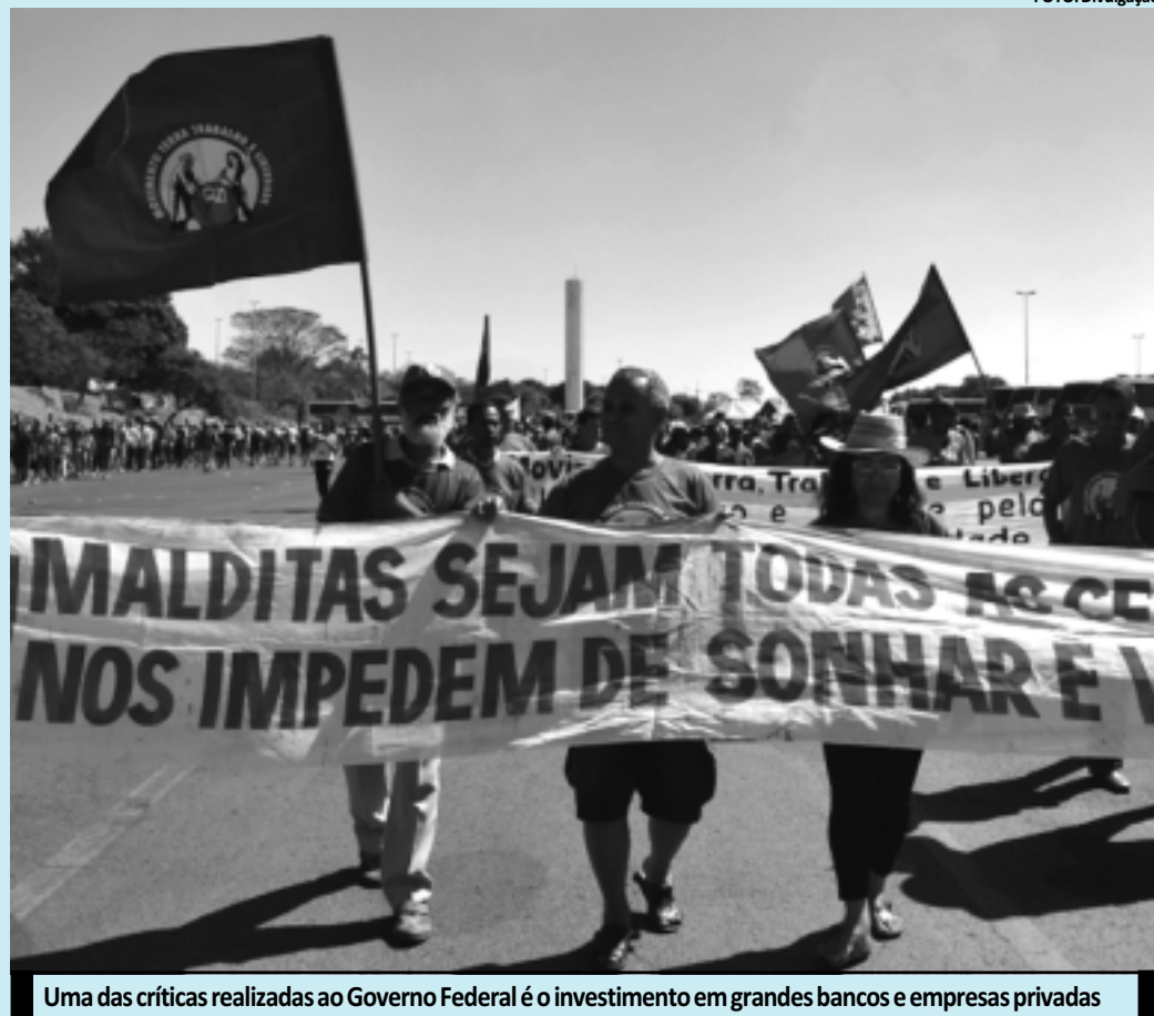
Uma das críticas realizadas ao Governo Federal é o investimento em grandes bancos e empresas privadas