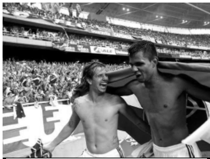
Ano passado, o Fluminense conquistou o título com o Engenhão lotado