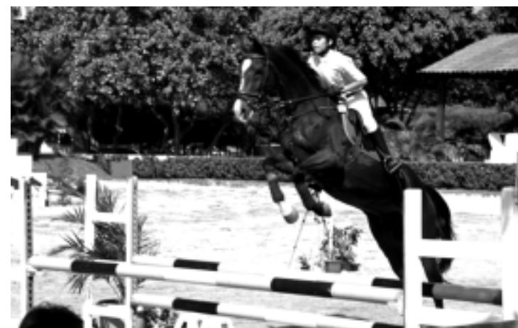
Cavaleiros e amazonas paraibanos querem surpreender os visitantes

A quarta etapa da mesma competição, realizada no mês