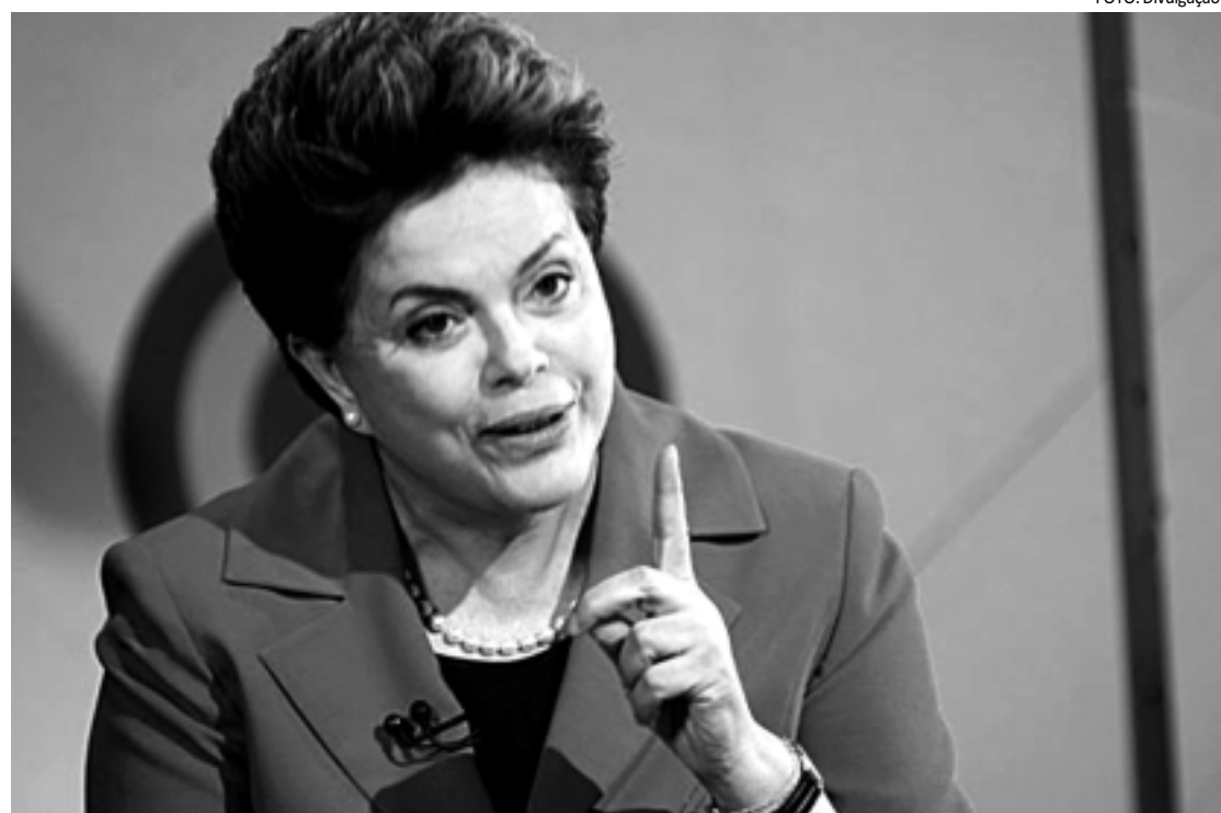
Dilma perde apenas para a chanceler alemã, Angela Merkel, e para a secretária americana, Hillary Clinton

quando afirma que a atual presidente foi ministra das Minas e Energia a partir de 2001. Na realidade, Dilma passou a ocupar o cargo em janeiro de 2003, após a eleição e posse de Lula: "Em 2001, quando foi indicada para o Ministério das Minas e Energia, Rousseff começou a alte-