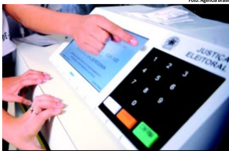
O prazo final para troca de partido e para filiação é 7 de outubro

Os radares instalados na BR-230 completaram dois meses de operação e foram responsáveis pela redução de 39% no número de acidentes e de 54% de feridos. PÁGINA 11