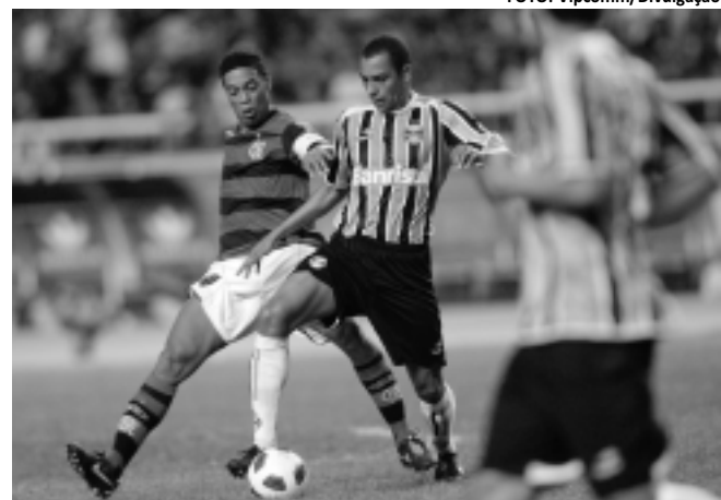
O Flamengo está brigando com o Corinthians pela liderança