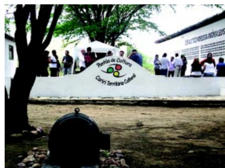
Pontão de Cultura