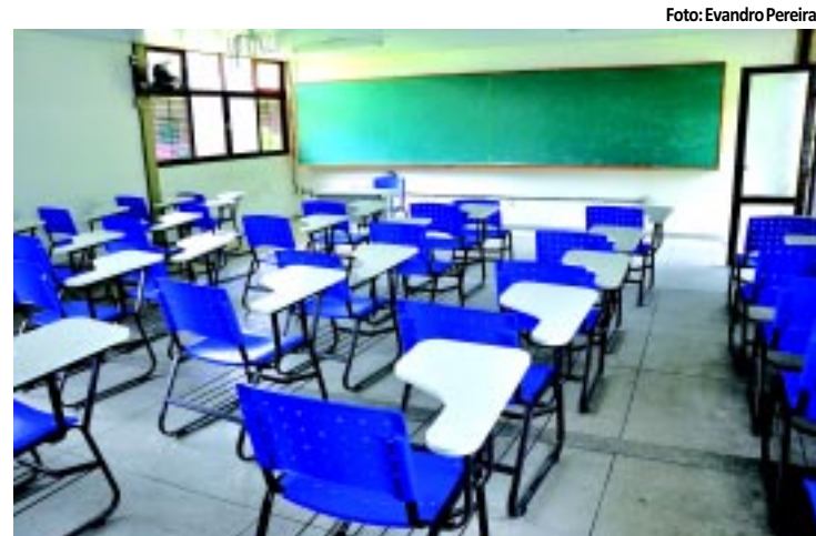
Professores querem a elevação do piso salarial para R$ 2.196,00

para troca de partido e filiações para quem vai concorrer às eleições municipais de 2012 e as legendas estão na corrida por novos filiados. PÁGINA 3