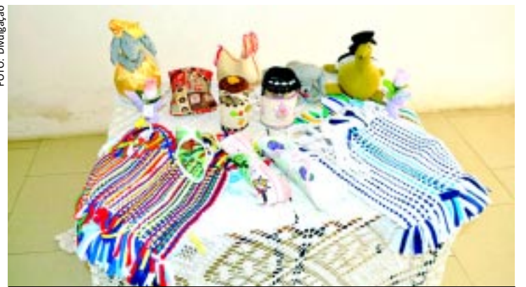
A Associação dos Pais e Amigos dos Excepcionais de Patos está comemorando a Semana Nacional do Excepcional. As atividades se estendem até amanhã com a EXPOARTE-APAE, com mostra de trabalhos feitos por professores e alunos da instituição.