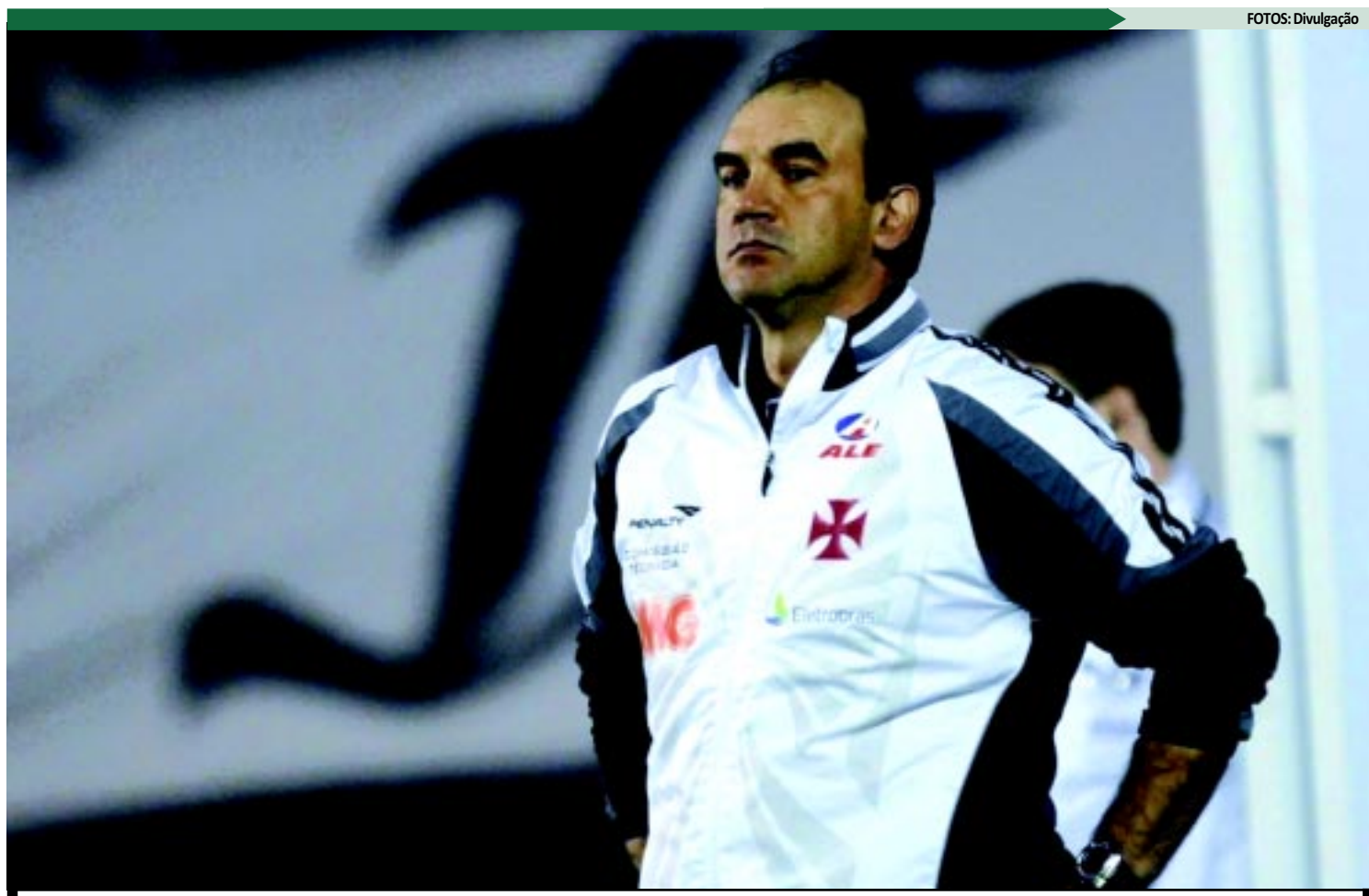
Com desejo de revanche após as duas derrotas seguidas para o gigante da colina, o técnico Ricardo Gomes espera por Felipe

Titulares como Anderson Martins, Eduardo Costa, Juninho Pernambucano, Eder Luis e Alessandro atuaram no treino tático no time reserva. Julinho, que se recupera de lesão, segue em tratamento e não apareceu no campo.