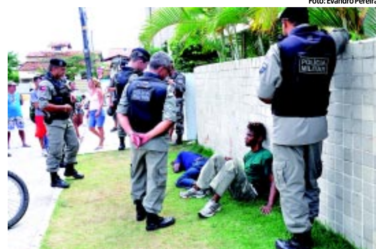
Os assaltantes tentaram fugir, mas foram cercados pela PM

Dois assaltantes foram baleados com tiros nas costas, nádegas e coxas, durante uma tentativa de assalto em João Pessoa. Eles foram atingidos por um motoqueiro. PÁGINA 11