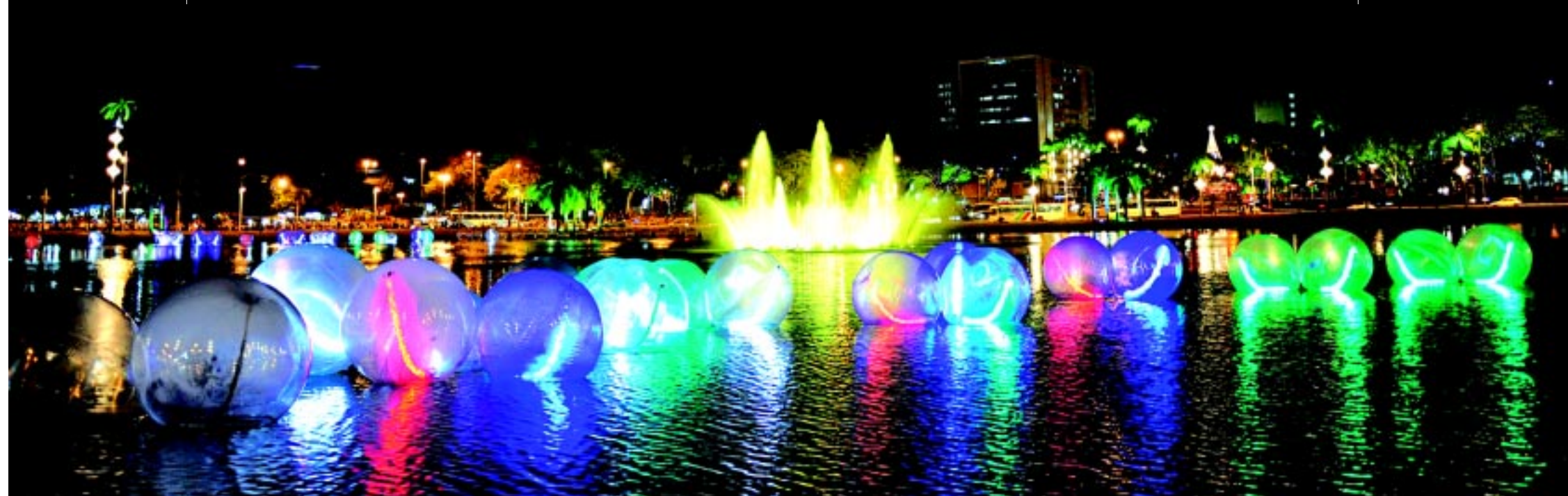
NA CAPITAL | A Lagoa do Parque Solon de Lucena ganhou um colorido todo especial com a iluminação de final de ano PÁGINA 8

João Pessoa, Paraíba | SÁBADO, 10 de dezembro de 2011 | ANO CXVIII - Número 269