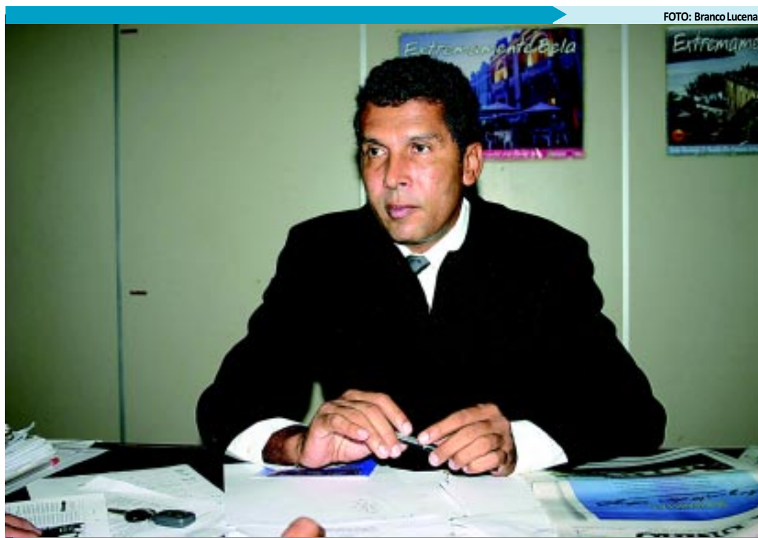
De acordo com o secretário executivo do PAC na Paraíba, verbas também servirão para obras de esgotamento

O prazo para contratação dos projetos de engenharia selecionados, com vistas à celebração do termo de compromisso, de acordo com o objeto que consta no plano de trabalho aprovado por área técnica competente de cada Superintendência Estadual, será 29 de fevereiro de 2012.