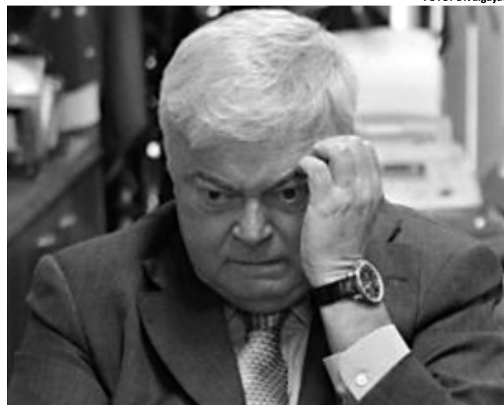
Situação do presidente Ricardo Teixeira anda cada dia mais complicada

"Apresentei uma ideia radical, por exemplo. Todos do Comitê Executivo ou de algum outro devem ser sistematicamente analisados pelo Comitê de Ética. Se houver algum registro criminal ou denúncias contra algum deles,