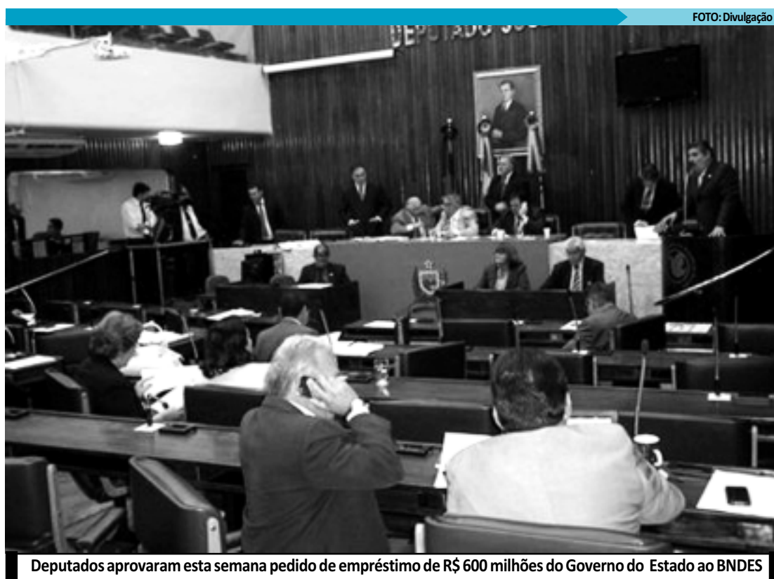
Deputados aprovaram esta semana pedido de empréstimo de R$ 600 milhões do Governo do Estado ao BNDES

"Os senadores da Paraíba possuem uma verba de R$ 35 mil por mês, para ressarcimento de despesas relativas ao exercício do mandato como, por exemplo, viagens. Todos os meses, irei divulgar, por aqui, os gastos da verba indenizatória do meu Gabinete. Segue prestação de contas do mês de novembro", disse no twitter o senador Cássio Cunha Lima.