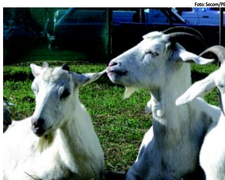
Cabra é uma das alternativas econômicas mais indicadas para o NE

A Paraíba ganhará 42 novos leitos e qualificados outros dois (totalizando 44) em enfermarias especializadas em álcool e drogas, destinados a internações de curta duração, além de oito novas unidades de acolhimento, sendo seis destinadas ao atendimento de adultos; e outras duas para crianças e adolescentes. O Ministério da Saúde vai investir R$ 36,9 milhões para a implantação destes serviços. PÁGINA 8