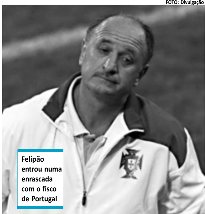
Felipão entrou numa enrascada com o fisco de Portugal

No Palmeiras, Felipão tem salários estimados em R$ 700 mil mensais, livres de impostos, e só acertou sua contratação, em 2010, porque o contrato previa que o clube ficaria responsável por isso, depois de ter problemas com a Receita Federal em sua passagem anterior.