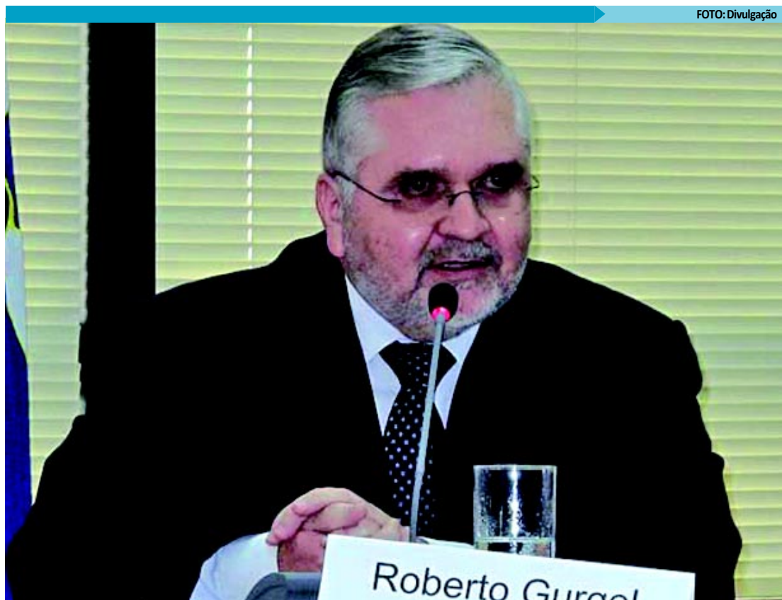
Procurador-geral da República entende que qualquer tentativa de reabrir discussão é meramente protelatória

Não há data prevista para o Congresso Nacional tratar da PEC dos Recursos: há 40 projetos de lei no Senado e 110 na Câmara dos Deputados (30 prontos para ir a plenário) aguardando decisão quanto à tramitação, in-