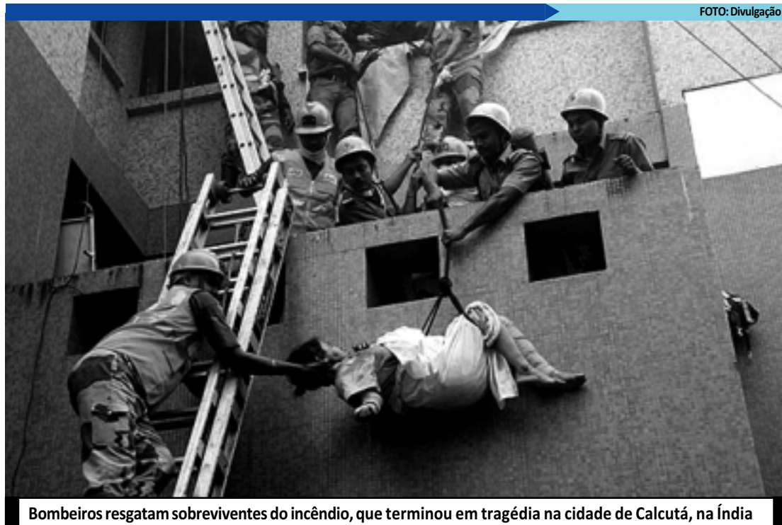
Bombeiros resgatam sobreviventes do incêndio, que terminou em tragédia na cidade de Calcutá, na Índia

O ministro local encarregado pela Saúde pública, Subrata Mukherjee, afirmou que membros superiores na hierarquia da equipe do hospital fugiram logo no início do incêndio, abandonando pacientes, incluindo muitos idosos, e enfermeiros. "É apavorante pensar que as autoridades hospitalares não fizeram nenhum esforço para salvar os pacientes presos", denunciou aos jornalistas.