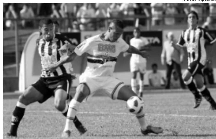
Os jogadores São Paulo vão ficar reclusos durante a pré-temporada

O Centro de Formação de Atletas (CFA) de Cotia existe desde 2005, e é a 'menina dos olhos' da administração do presidente Juvenal Juvêncio