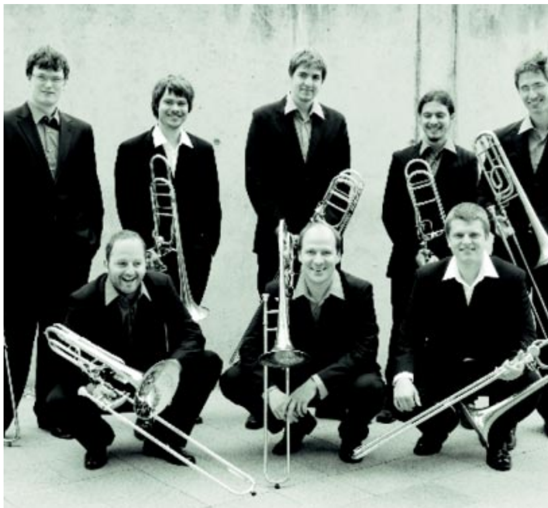
O grupo é formado por estudantes e ex-estudantes da Escola Superior de Música e Teatro de Hannover

Toda a programação do XIV Virtuosi é gratuita e pode ser verificada no site www.virtuosi.com.br .