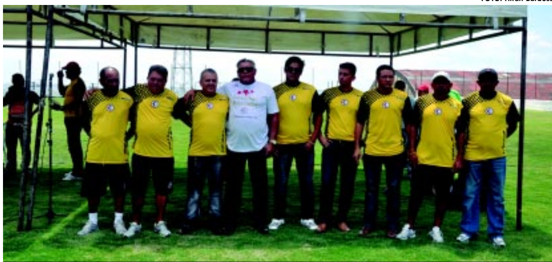
A apresentação dos novos jogadores aconteceu no último domingo no Estádio Renatão, na Bela Vista

Segundo o dirigente, que deixa o cargo amanhã, não existe nenhum interesse em continuar na presidência do CD, apenas retratar o que vem ocorrendo nas hostes alvirrubras. "Não posso me calar o que vem acontecendo no Auto Esporte. Saio com a consciência tranquila que fiz um grande trabalho no clube, porém, existem pessoas que não querem enxergar a verdade", explicou.