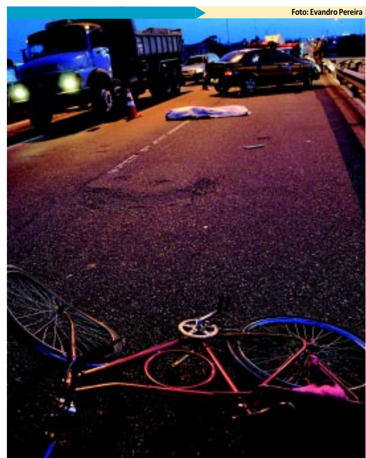
Ciclista morre atropelado na BR-101

Cerca de R$ 1,2 bilhão deve ser injetado na economia do Estado com o pagamento da 2ª parcela do 13º salário. Na próxima quinta-feira o Governo do Estado paga a segunda parcela do 13º salário dos servidores públicos, enquanto que a iniciativa privada tem até o próximo dia 20 para pagamento da 2ª parcela de seus funcionários. PÁGINA 12