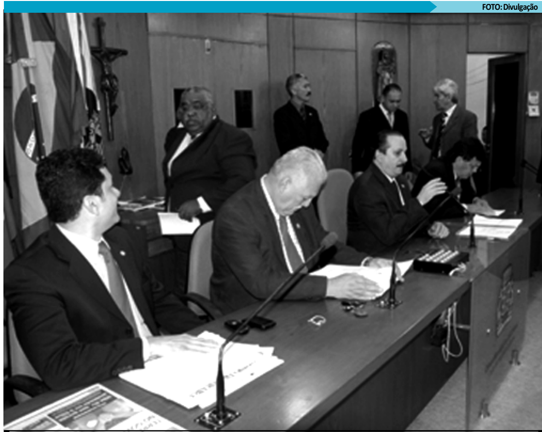
Parlamentares pretendem concluir relatório até amanhã e encaminhar para votação na próxima semana

O relator explicou ainda que essa emenda é geral porque vem sendo subscrita por todos os vereadores no sentido de evitar conflitos de interesse.