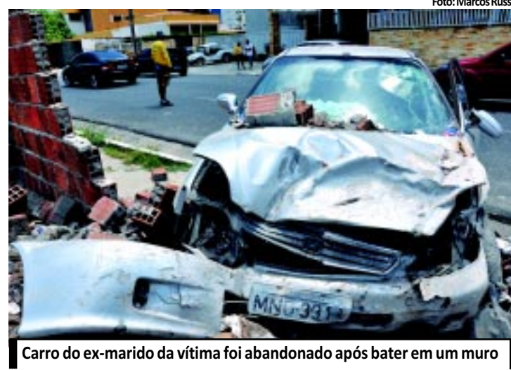
Carro do ex-marido da vítima foi abandonado após bater em um muro