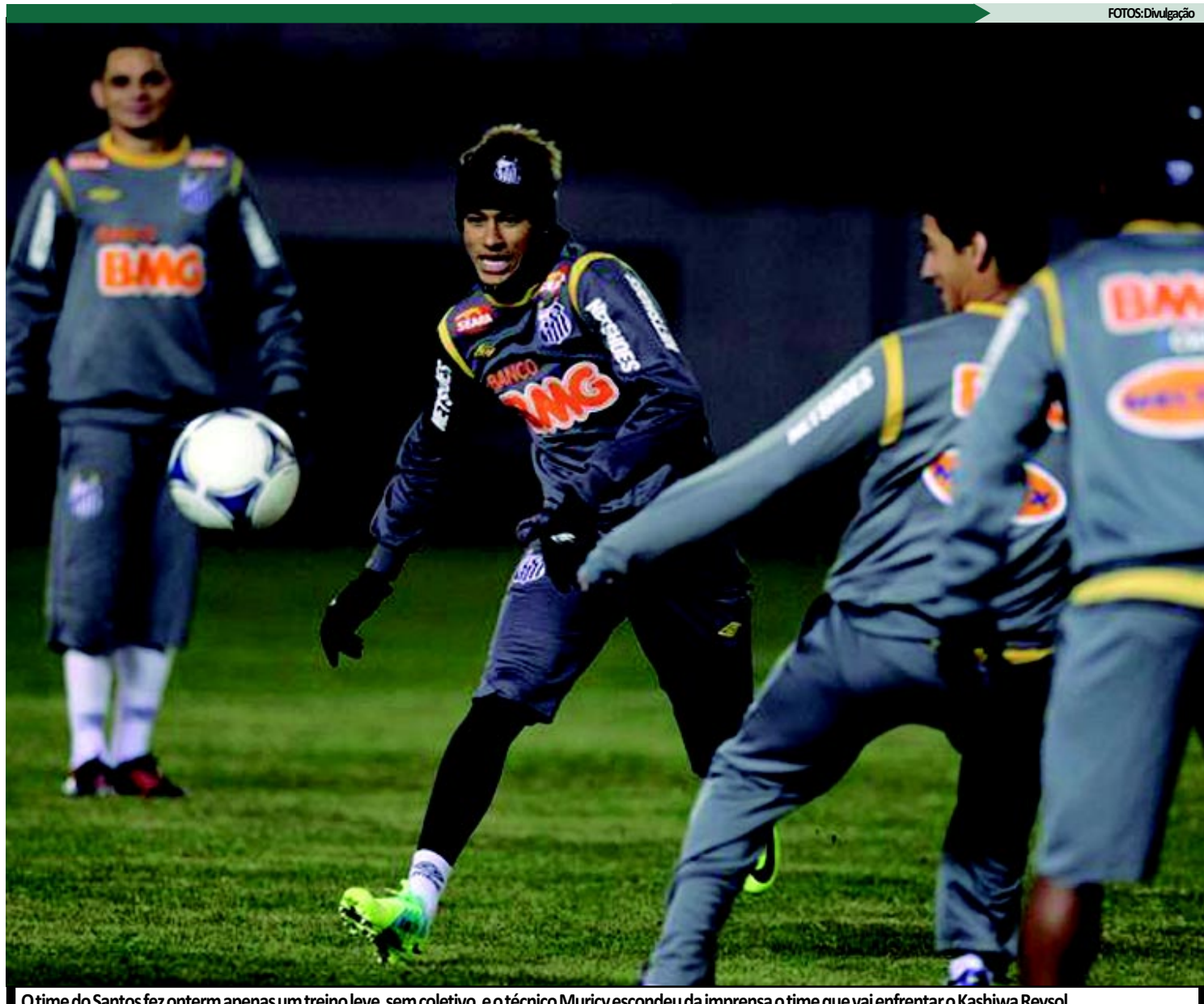
O time do Santos fez ontem apenas um treino leve, sem coletivo, e o técnico Muricy escondeu da imprensa o time que vai enfrentar o Kashiwa Reysol

O Peixe é o favorito, mas Dracena lembra que o Kashiwa também era considerado uma zebra contra o Monterrey. "Muito se falou que o time mexicano seria o nosso adversário e não foi o que aconteceu. Se não entrarmos em campo bastante concentrados vamos ter problemas. Futebol mostra a cada dia que vence quem quer mais e não quem tem mais nome".