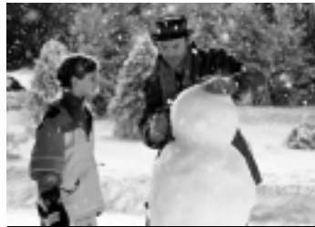
Uma Noite Mágica, filme do SBT

15h45 - Todo Mundo Odeia o Chris 19h00 - Jornal da Correio 19h30 - Jornal da Record 20h15 - Novela: Rebelde 21h15 - Série: CSI - Investigação Criminal 22h15 - Novela: Vidas em Jogo 23h15 - O Aprendiz 00h15 - Série: CSI Miami 01h15 - Programação IURD