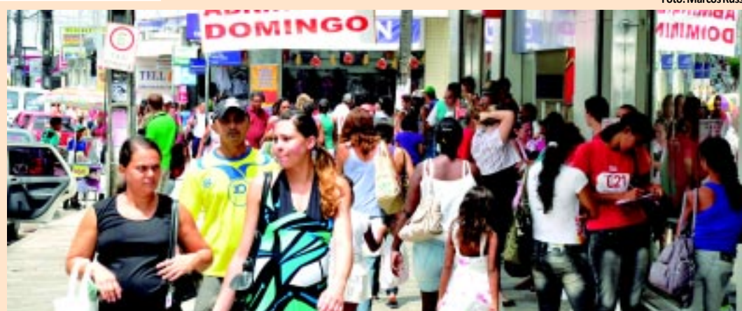
Pagamento da 2ª parcela do 13º salário deve movimentar a economia e aquecer as vendas de fim de ano