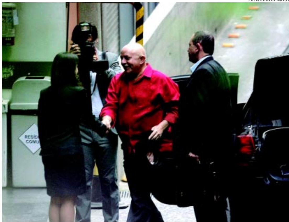
Ex-presidente chegou ao hospital Sírio-Libanês, em São Paulo, para a terceira e última sessão da quimioterapia

Apesar do aparente otimismo, o governo prorrogou ontem, por meio de decreto a suspensão de multas a proprietários rurais que descumprem a atual lei ambiental por desmatamento. A prorrogação vai até 11 de abril.