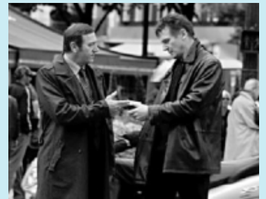
Liam Neesom em Busca Implacável, de Pierre Morel

>>> BUSCA IMPLACÁVEL - Kim, filha de Bryan Mills, um agente da CIA, vai passar as férias em Paris com uma amiga. Assim que chega à cidade Kim telefona para o pai e, nesse exato momento, ela e a amiga são seqüestradas. Pelo celular Bryan mantém contato com o chefe da quadrilha, mas não consegue convencê-lo a libertar a jovem. Agora ele precisa utilizar o conhecimento adquirido no serviço secreto para encontrá-la e se vingar dos seqüestradores. SE LIGUE: Hoje, às 20h30, no FX