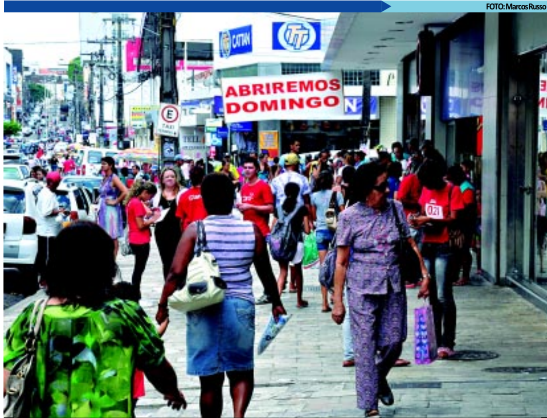
Com o pagamento do 13º, o comércio vive a expectativa no aumento de vendas para as festas de fim de ano