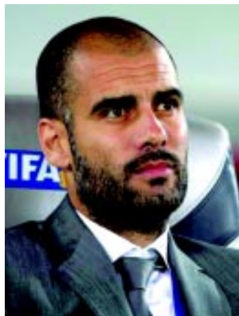
Técnico Guardiola na coletiva

Ele também disse que o seu time não pode ser considerado o "melhor do mundo" enquanto não conquistar o título do Mundial de Clubes da Fifa. "Não podemos perder a oportunidade de ganhar o torneio, muito prestigioso e importante. Se chega a ele poucas vezes", disse ele, que vê como fator motivacional para o duelo contra o Al Sadd