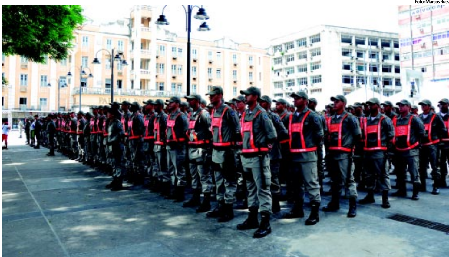
FIM DE ANO | 720 policiais reforçam a segurança em CG e na região metropolitana de João Pessoa PÁGINA 9

produtos comprados de forma não presencial. A compra online cresce 50% ao ano e o comércio local tem um incremento de 10%. O ICMS será dispensado quando o valor da compra for inferior a R$ 500. PÁGINA 4