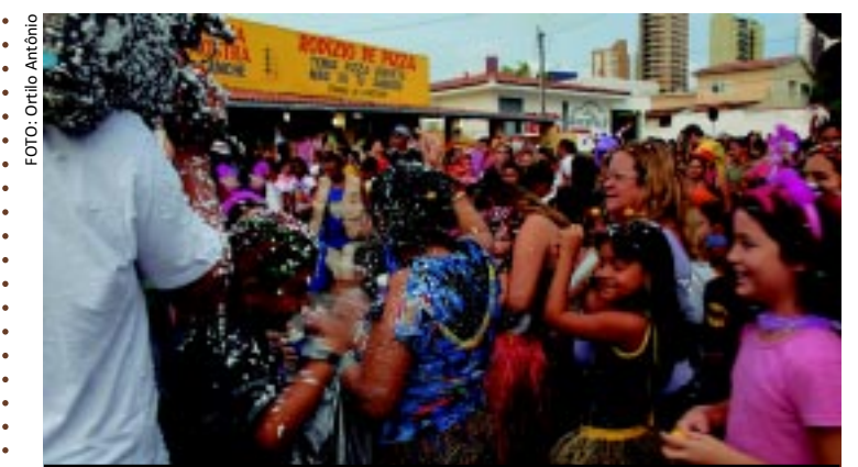
[FOTO&LEGENDA] O bloco Muriçoquinhas adotou o tema "Contra o Trabalho Infantil" para o desfile no Folia de Rua 2012, e o lançamento da campanha ocorrerá amanhã durante café da manhã, no Clube Cabo Branco, na Capital.