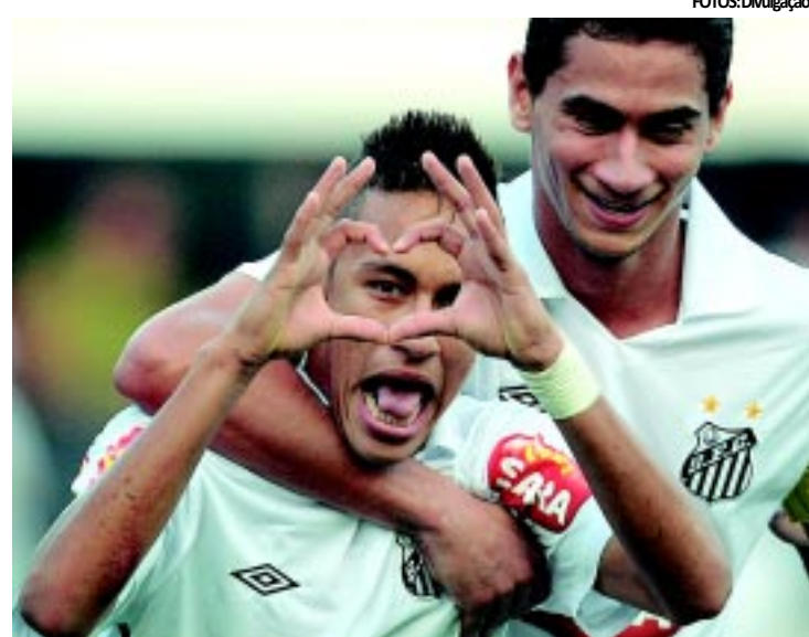
Paulo Henrique Ganso pode ser o diferencial no jogo ao lado de Neymar