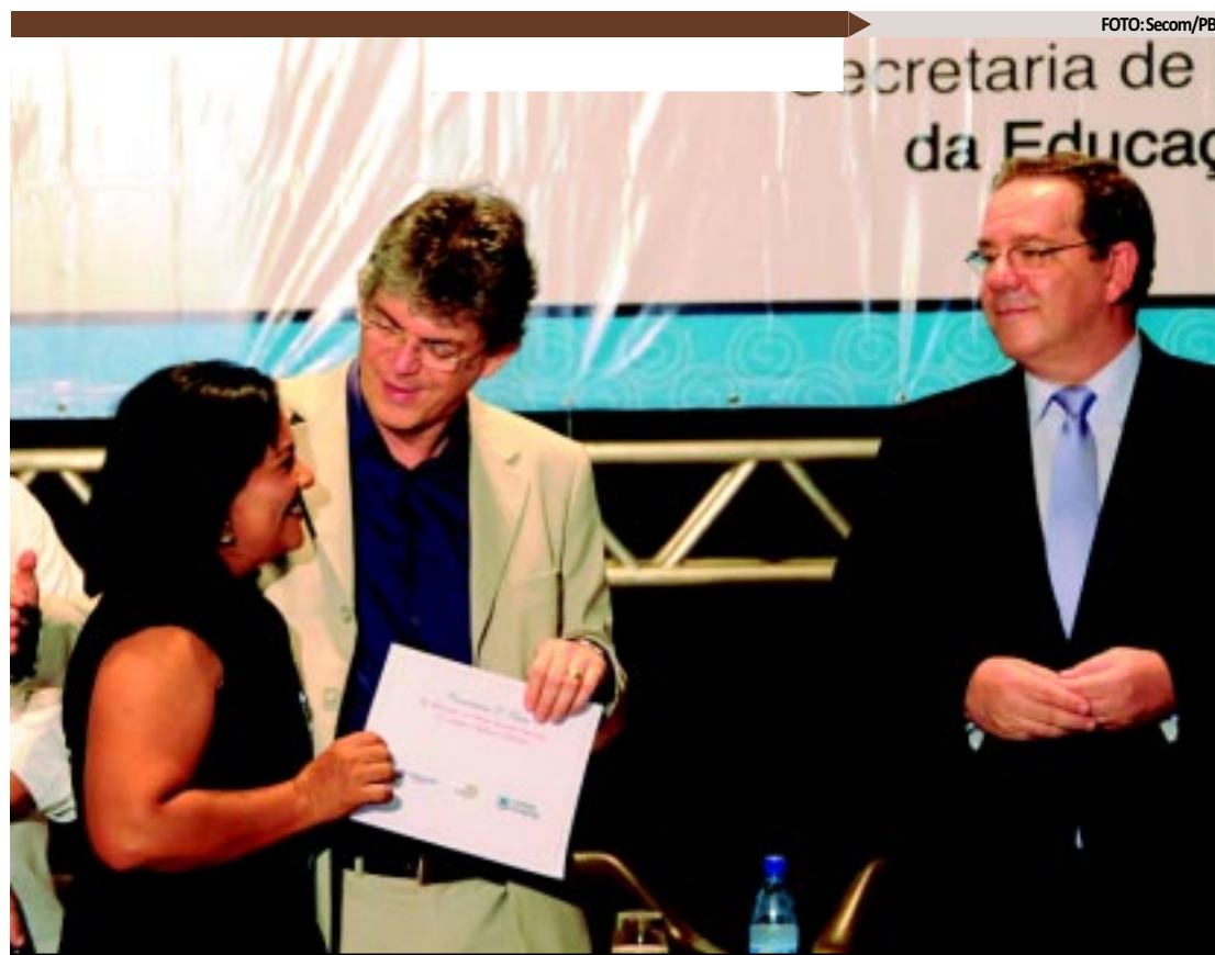
Governador Ricardo Coutinho e secretário Afonso Scocuglia entregaram certificados a profissionais premiados

BALANÇO - Em seu pronunciamento, o secretário da Educação, Afonso Scocuglia, aproveitou para fazer um balanço das ações durante o ano de 2011, destacando a alfabetização de cerca de 40 mil jovens e adultos, os quais somados aos 15 mil alfabetizados pela Universidade Estadual da Paraíba totalizam 55 mil alunos, além dos 80 mil integrantes do ciclo da Educação