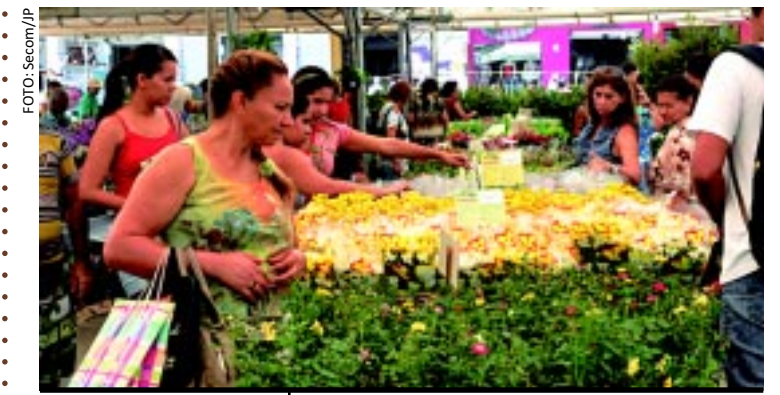
O 7º Festival de Flores de Holambra se encerra amanhã, no Ponto de Cem Réis, em João Pessoa. Mais de 200 espécies de flores e plantas estão à venda no local, com preço a partir de R$ 2,50. Hoje e amanhã, a feira funciona das 8h às 18h.