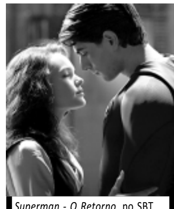
Superman - O Retorno, no SBT