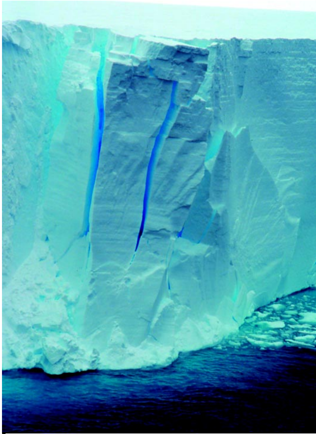
A partir de hoje, a Central de Monitoramento e Alerta de Desastres Naturais ficará atenta às chuvas no país

Na Europa, a média é cinco vezes menor e, nos Estados Unidos, vinte vezes menor. Aqui, a proposta é alcançar a Europa até 2014, segundo o secretário.