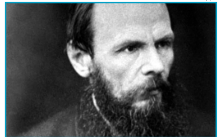
DOSTOIEVSKI NA DICTA & CONTRADICTA

# A revista Dicta & Contradicta , publicação do Instituto de Formação e Educação (IFE) em parceria com a Editora Civilização Brasileira, oferece importantes reflexões sobre arte e a literatura, incluindo textos sobre Dostoevski (foto) e temas atuais como as revoluções árabes e a questão das drogas. A revista traz também análises sobre a relação da Idade Média com o Renascimento, poemas, debates filosóficos e teológicos e um ensaio sobre as simbologias presentes na literatura.