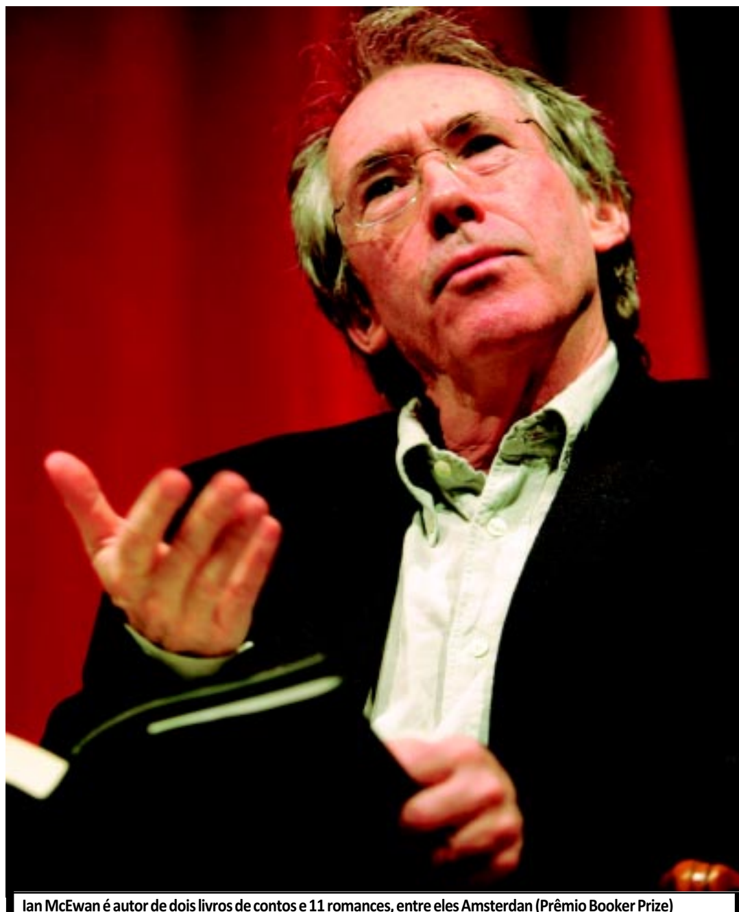
Ian McEwan é autor de dois livros de contos e 11 romances, entre eles Amsterdam (Prêmio Booker Prize)