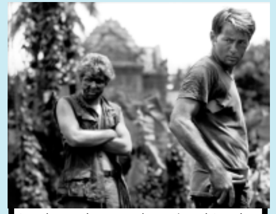
Cena de Apocalypse Now , de Francis Ford Coppola

>>> APOCALYPSE NOW - Raquel, uma jovem de classe média paulistana, se sente desajustada na escola e em casa, onde vive em conflito com a família. Um dia ela sai de casa e decide virar garota de programa. Em pouco tempo, ela se torna a garota mais disputada do local. Raquel se transforma em Bruna Surfistinha e passa a contar sua rotina em um blog na internet. Mas quando vê seu dinheiro e sua saúde serem consumidos pela cocaína, percebe que é hora de dar uma nova guinada em sua vida. SE LIGUE: Hoje, às 22h, no TCM