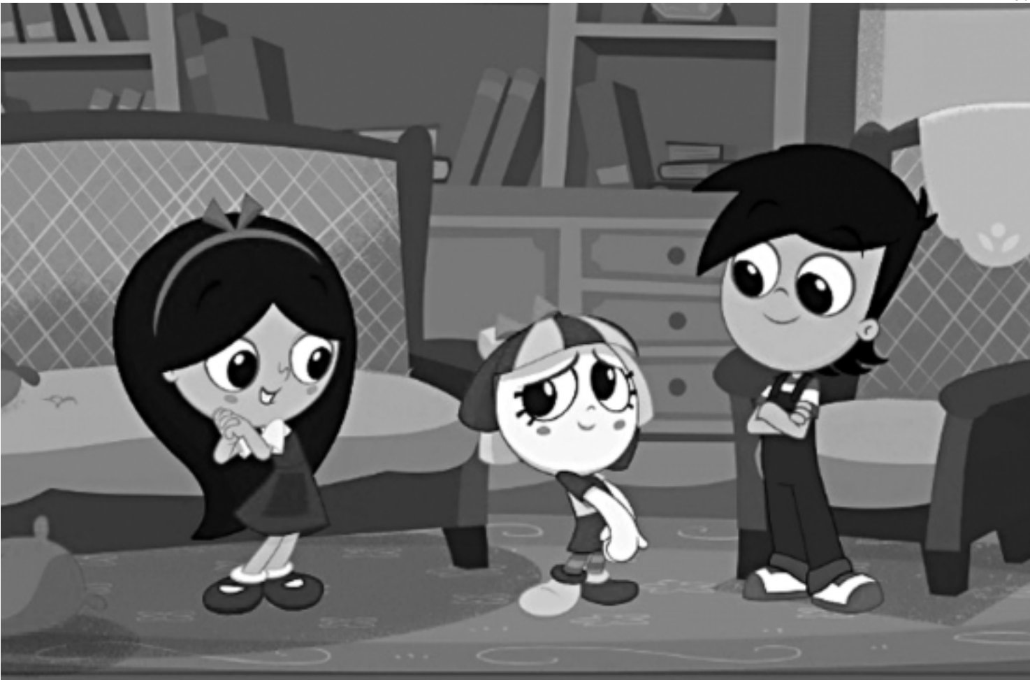
Criados por Bruno Okada, escolhido em concurso entre oito ilustradores, os desenhos têm algo das animações modernas dos EUA e do Japão