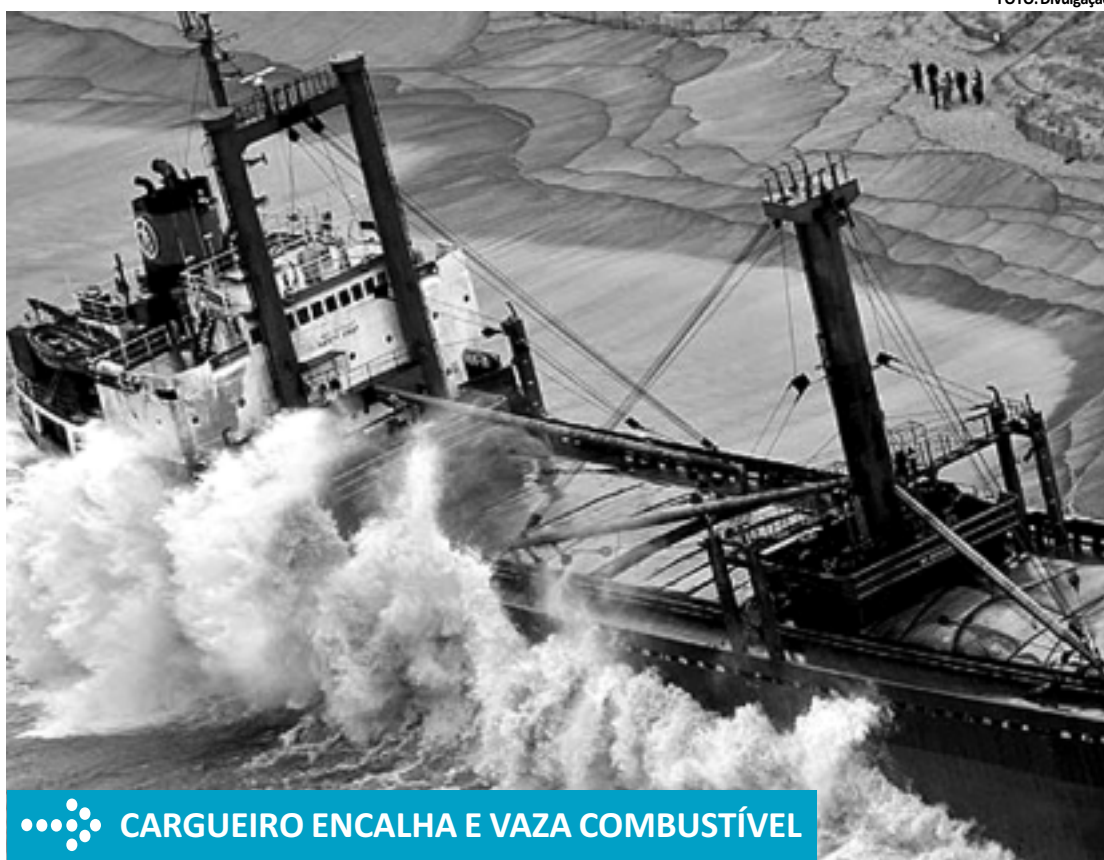
CARGUEIRO ENCALHA E VAZA COMBUSTÍVEL

Pesquisa Gallup divulgada neste ano revela que a maioria dos americanos é favorável à pena de morte - 61% do total. Entretanto, o número de apoiadores diminuiu. Em 1994, eram 80%.