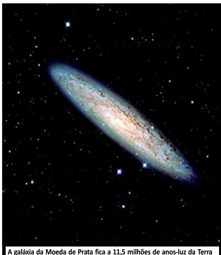
A galáxia da Moeda de Prata fica a 11,5 milhões de anos-luz da Terra

A imagem foi feita durante os testes com o telescópio terrestre VST, de 2,6 metros de diâmetro, o mais recente do observatório localizado no Chile. Com ela, os pesquisadores conseguem analisar a formação de novas estrelas nos braços em espiral. Ao fundo, é possível ver galáxias mais distantes.