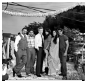
'Aprentando na Índia', na Record