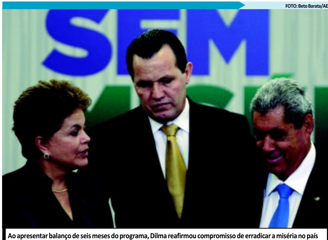
Ao apresentar balanço de seis meses do programa, Dilma reafirmou compromisso de erradicar a miséria no país

O ponto mais significativo do balanço, para ela "é que a erradicação da miséria entrou definitivamente na agenda nacional". "Espero que o Congresso tenha maturidade para priorizar o interesse nacional", arrematou.