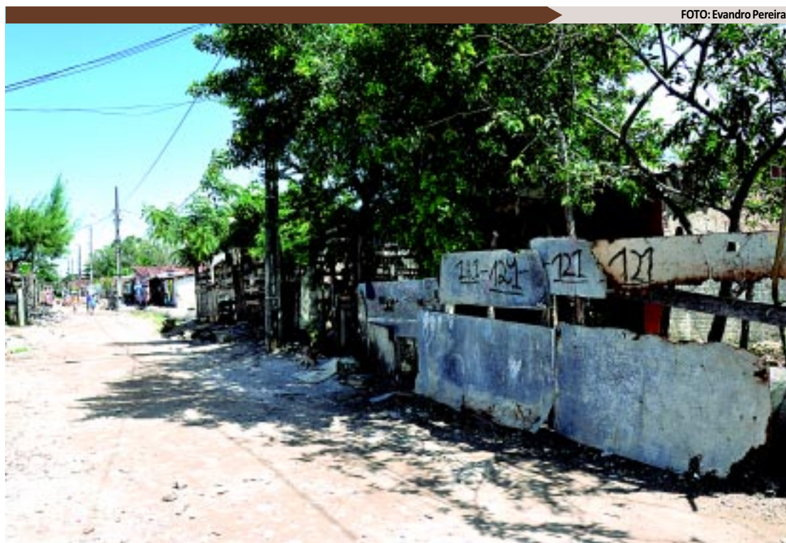
Na favela do S, em João Pessoa, grande parte dos domicílios não possui sequer banheiros ou sanitários

SERVIÇOS - De acordo com o IBGE, a energia elétrica chega a 99,59% dos 36.308 domicílios existentes nestas localidades, 6,7% deles não possuem medidor ou relógio, outros 7,8% são atendidos por com-