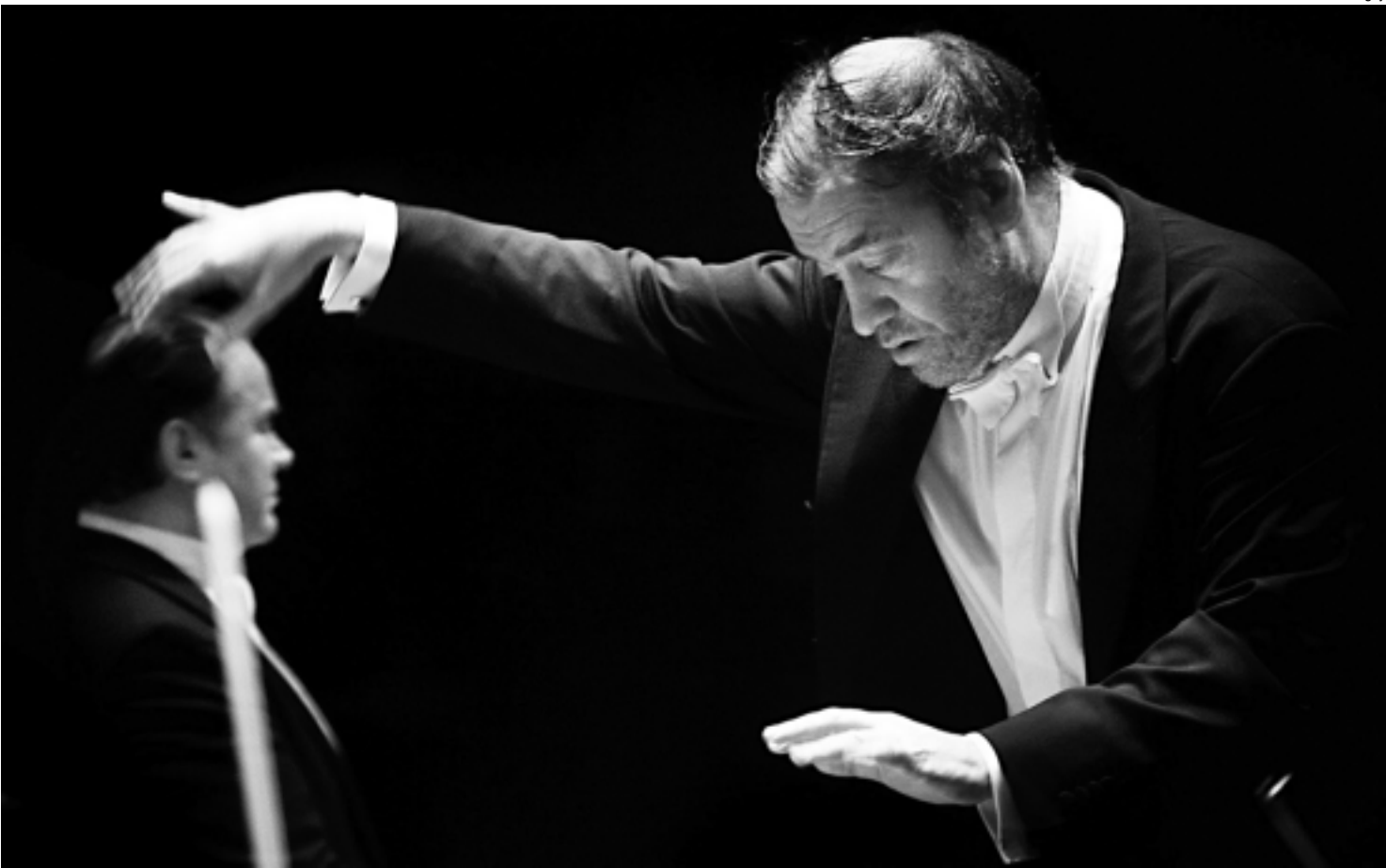
Gergiev tem rodado o mundo com a orquestra do Teatro Mariinsky (antigo Kirov) com ciclos integrais de alguns dos principais compositores russos