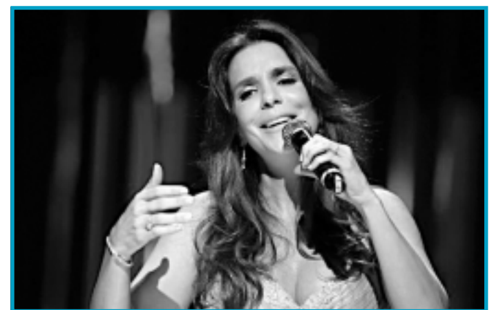
IVETE SANGALO DE VOLTA AO FEST VERÃO

Manifestos e abaixo-assinados já estão circulando nas redes sociais criticando a decisão da Prefeitura de Porto Alegre de remover a escultura Olhos Atentos , do artista plástico José Resende, de uma área localizada nas proximidades da Usina do Gasômetro, no centro da capital gaúcha, alegando que a obra está deteriorada e oferece risco às pessoas que circulam no local, às margens do Lago Guaíba. O artista plástico paraibano Raul Córdula, por exemplo, considera a retirada da escultura uma "tragédia cultural".