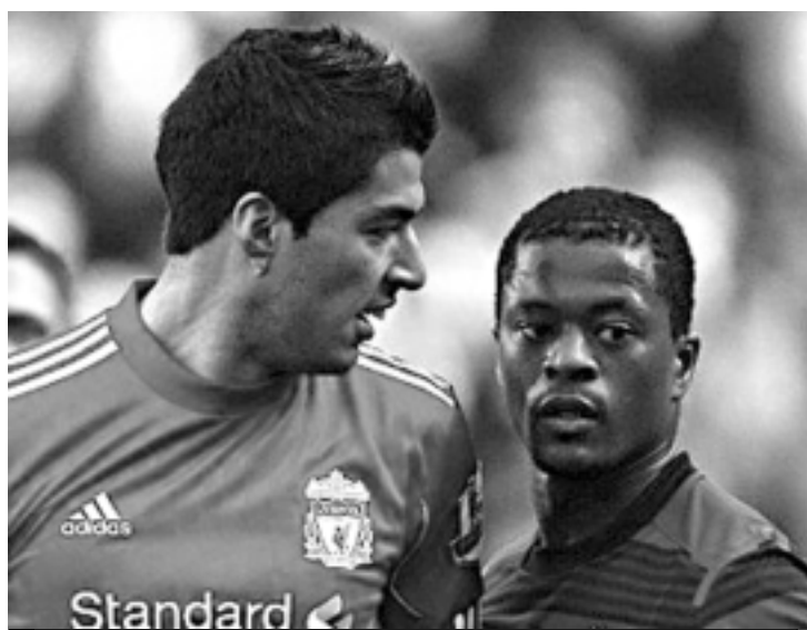
O atacante Luís Suárez, do Liverpool, e o lateral Evra, do Manchester

"Achamos um pouco demais o fato de Luís ter sido punido apenas com base nas declarações de Evra, sendo que ninguém mais em campo - incluindo os colegas de equipe dele e o trio de arbitragem - ouviu a conver-