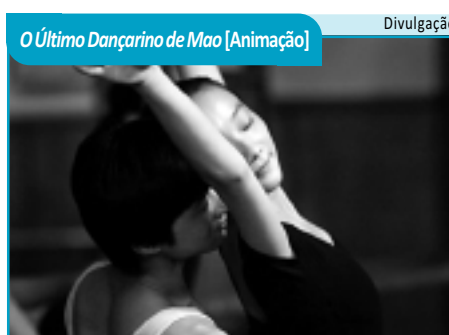
O Último Dançarino de Mao [Animação]

ASAGA DE CREPÚSCULO: AMANHECER - PARTE 1 (The Twilight Saga: Breaking Dawn - Part 1, EUA, 2011). Gênero: aventura. Duração: 135 min. Classificação: 14 anos. Direção: Bill Condon, com Kristen Stewart, Robert Pattinson, Taylor Lautner, Ashley Greene. Recém-casados, Bella Swan e Edward Cullen, viajam até o Rio de Janeiro para a lua-de-mel, onde finalmente se entregam a suas paixões. Bella logo descobre que está grávida, mas a chegada da filha, Renesmee, coloca em movimento uma perigosa cadeia de eventos. CinEspaço 4: 14h, 16h30, 19h e 21h30. Manairá 2: 14h, 16h40, 19h20 e 22h. Manairá 4: 13h, 15h40, 18h20 e 21h. Tambiá 4: 13h30, 16h, 18h30 e 21h.