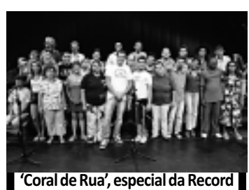
'Coral de Rua', especial da Record