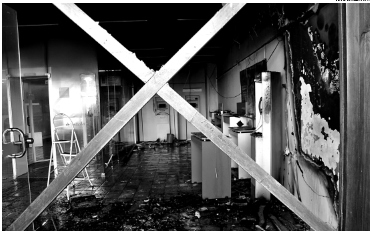
O fogo destruiu equipamentos e atingiu parte da agência. O expediente foi suspenso e, por causa da fumaça, outro banco também ficou sem funcionar

O foco da operação será intensificado na fiscalização dos condutores das embarcações no que diz respeito à habilitação, não ter ingerido bebida alcoólica, bem como verificar se a embarcação possui os itens de segurança ou se está com excesso de passageiros.