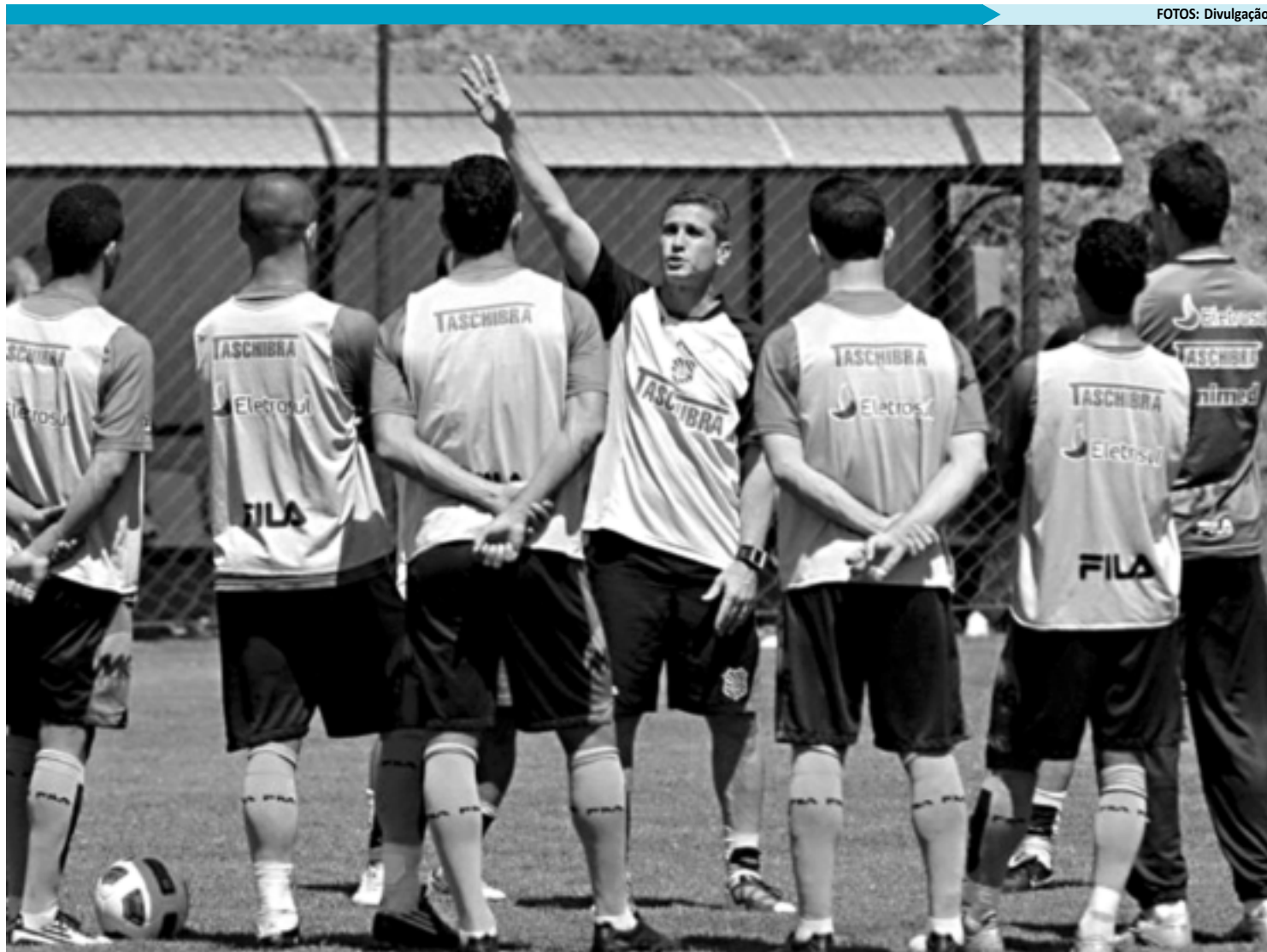
Jorginho dando instruções aos jogadores do Figueirense durante o Campeonato Brasileiro de 2011. Ele agora comandará o Kashima Antlers

Como jogador, Jorginho conquistou seis títulos pelo Kashima Antlers e virou ídolo da torcida nos três anos que esteve por lá, entre 1995 e 1999. A missão agora, fora de campo, é de substituir à altura Oswaldo de Oliveira, que tornou-se foi um dos treinadores mais vitoriosos da história do clube - é o único na história do futebol japonês a conquistar três vezes seguidas a J-League - 2007/08/09.