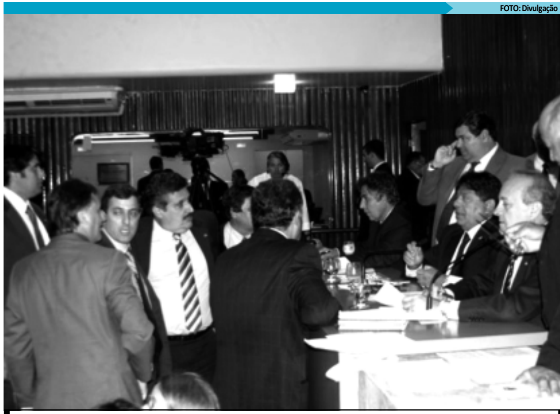
Depois de aprovarem a Lei Orçamentária Anual, deputados só voltam ao Plenário da Assembleia em fevereiro

A segunda destina R$ 150 milhões para projetos de expansão, interiorização, democratização e qualificação da oferta de cursos de educação profissional e tecnológica, e a terceira destina recursos da ordem de R$ 4,2 bilhões para o desenvolvimento de Cargueiro Tático Militar e para a melhor qualificação da Aeronáutica.