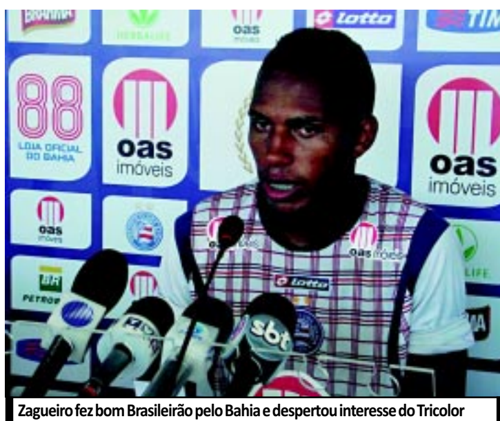
Zagueiro fez bom Brasileiro pelo Bahia e despertou interesse do Tricolor

O intuito do Cruzeiro é o de seguir com Montillo em seu elenco.