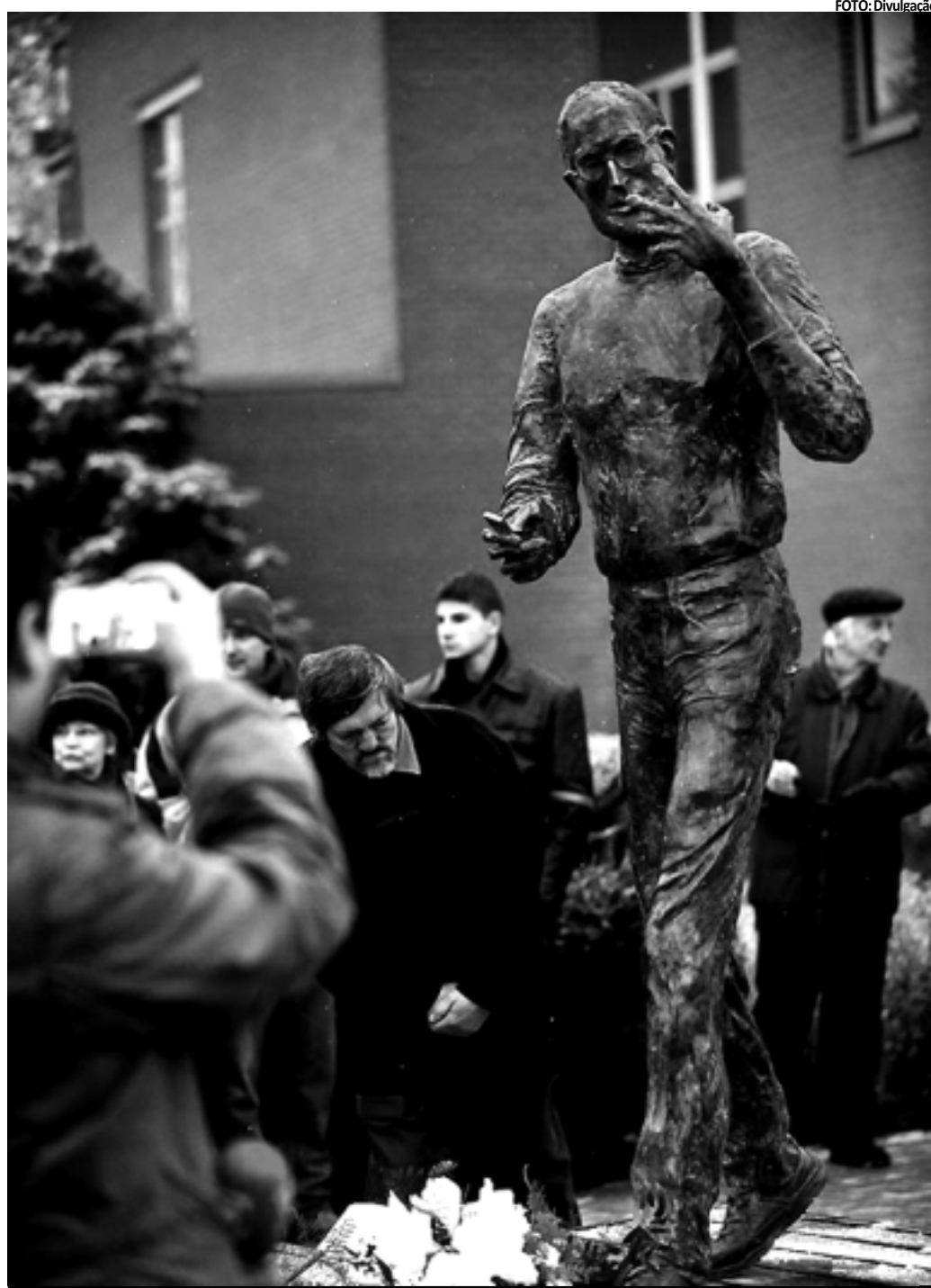
A obra de bronze, de autoria do escultor Erno Toth, está localizada no campus da fabricante de software