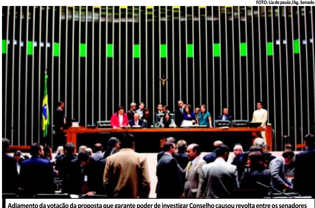
Adiamento da votação da proposta que garante poder de investigar Conselho causou revolta entre os senadores

Um dos focos das apurações foi concentrado nas atividades de qualificação profissional do projeto "Bem Receber Copa", relacionado à realização da Copa de 2014. O relatório recomenda a continuidade da suspensão de liberação de recursos para o programa, o aprofundamento das investigações e o ressarcimento dos prejuízos.