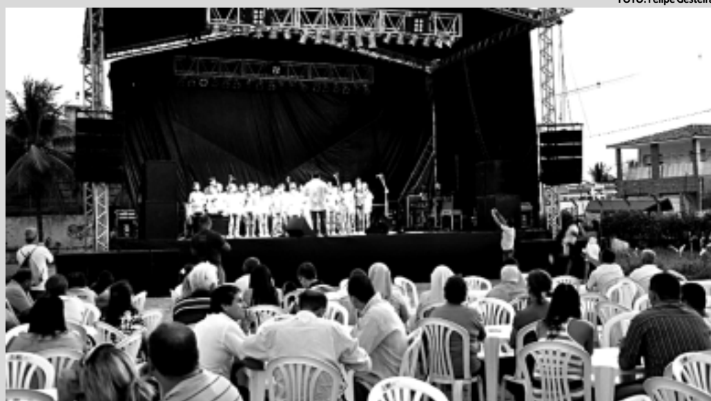
Servidores e dirigentes de 115 entidades filantrópicas assistem show durante aniversário do Banco de Alimentos