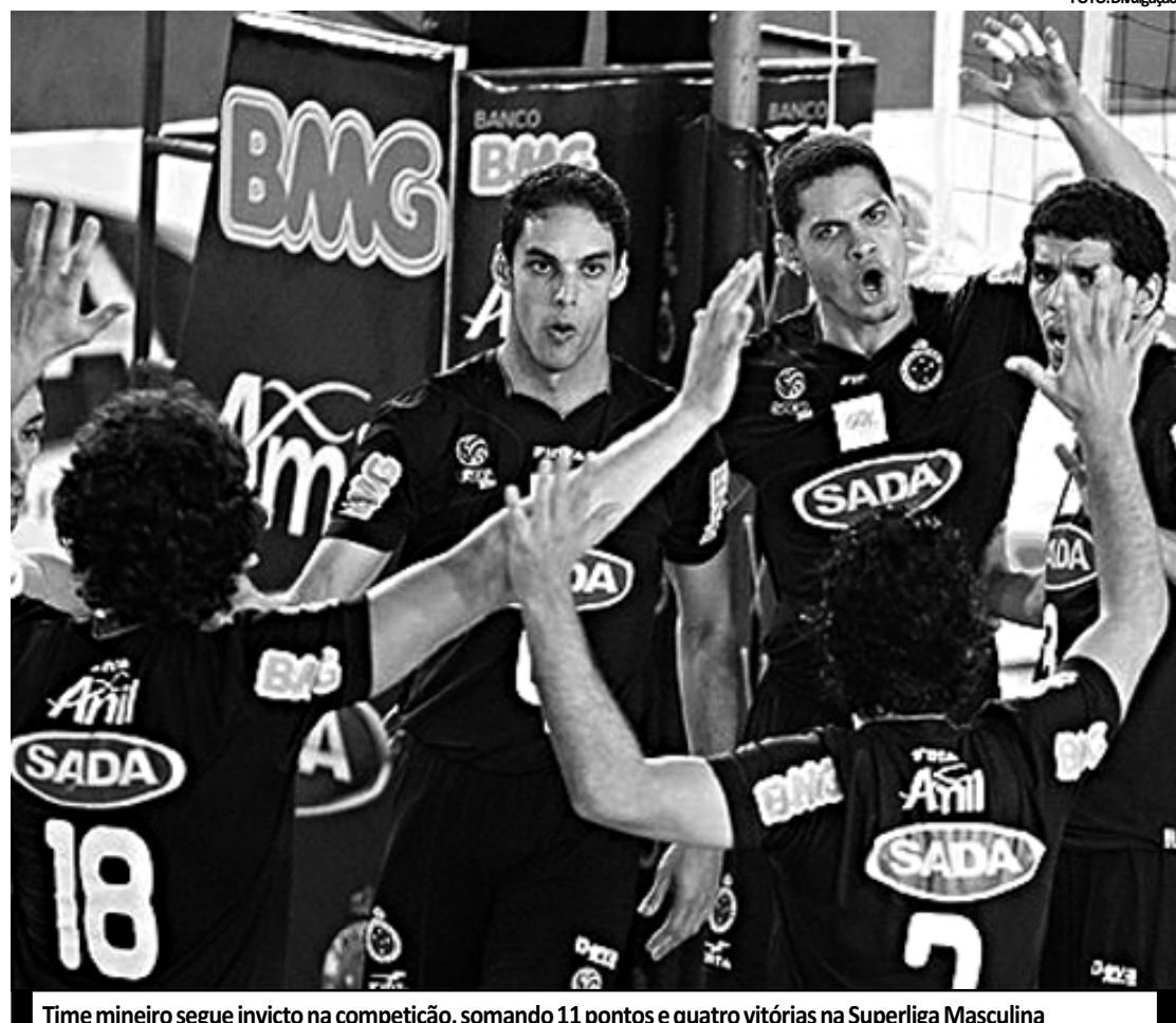
Time mineiro segue invicto na competição, somando 11 pontos e quatro vitórias na Superliga Masculina