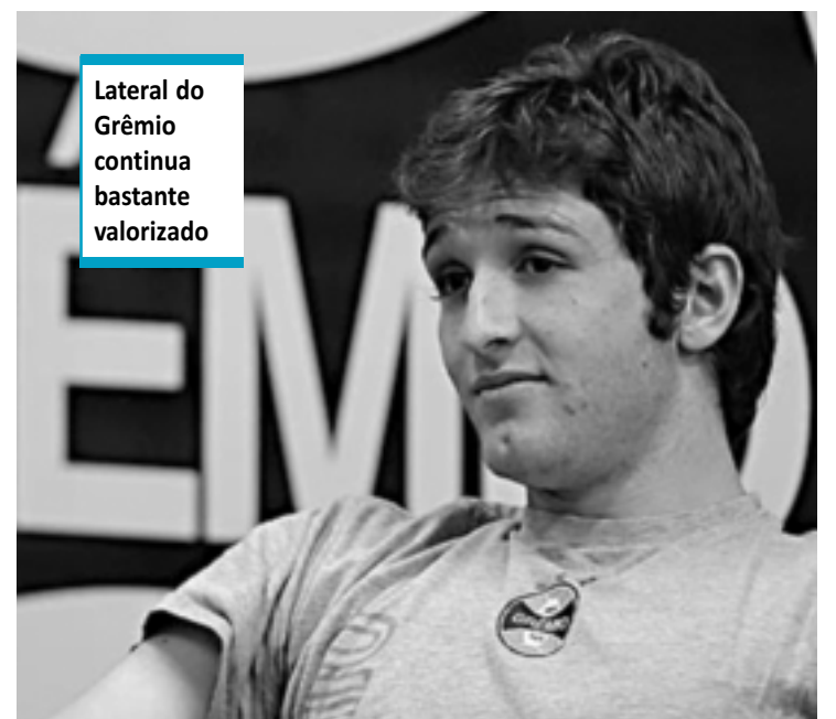
Lateral do Grêmio continua bastante valorizado