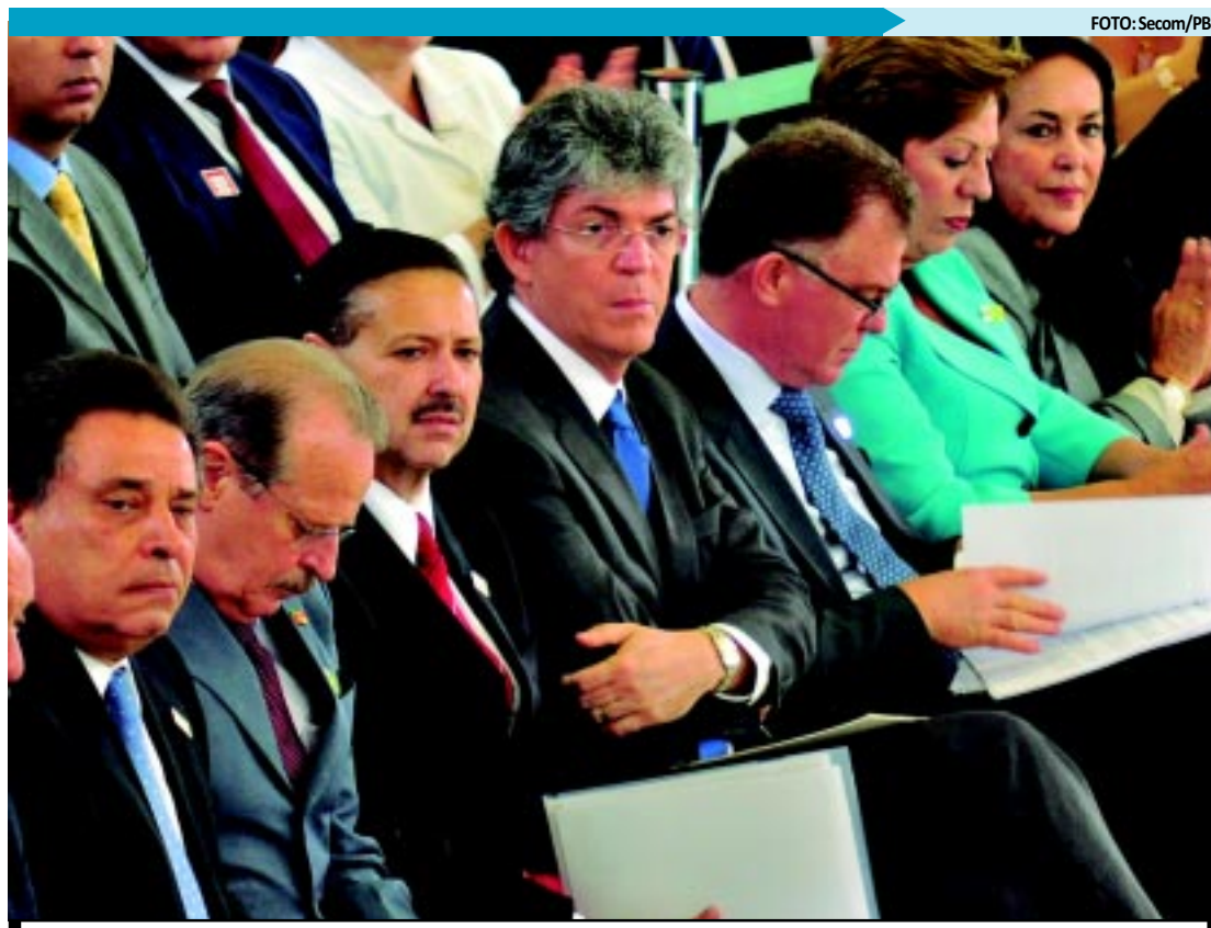
Governador Ricardo Coutinho foi a Brasília assinar contratos que deverão garantir benefícios para 17 municípios

A expectativa é de que os contratos de financiamento sejam feitos no primeiro semestre de 2012, já que há necessidade de realização de operação de crédito entre os mutuários e as instituições financeiras - Caixa Econômica Federal (CEF) e Banco Nacional de Desenvolvimento Social (BNDES). A decisão de escolha do agente financeiro e da fonte de recursos é das empresas de saneamento e dos governos estaduais.