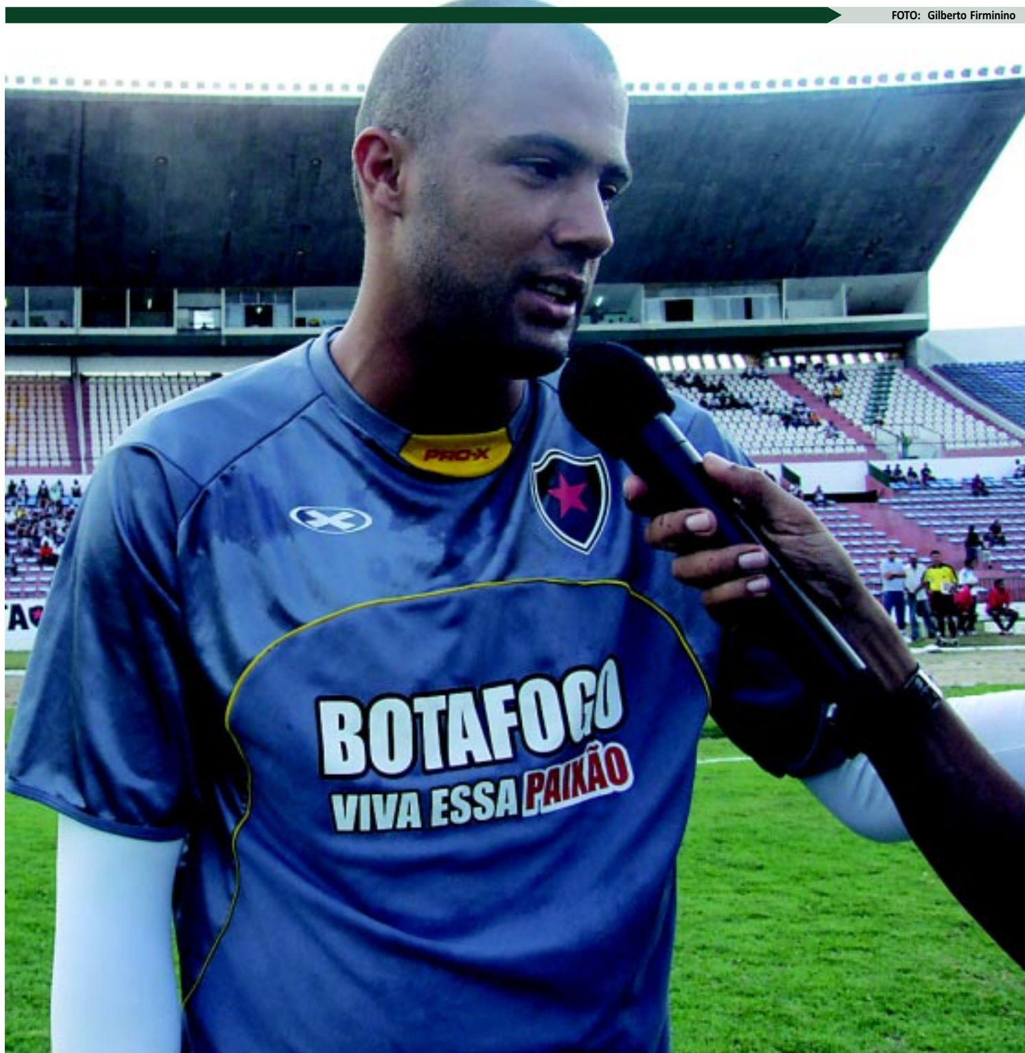
O goleiro do Botafogo-PB estará presente no jogo de amanhã, na Graça, juntamente com outras estrelas do futebol nacional e internacional