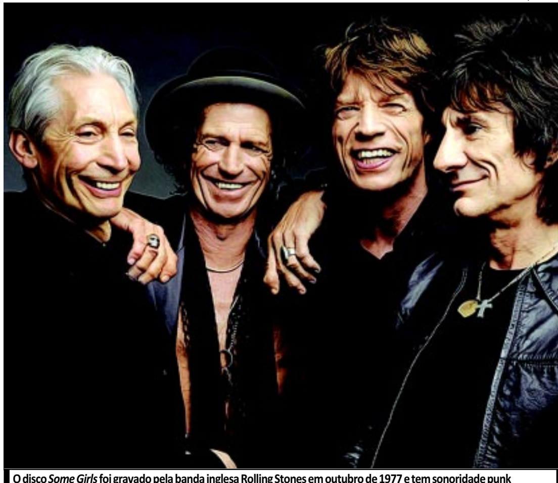
O disco Some Girls foi gravado pela banda inglesa Rolling Stones em outubro de 1977 e tem sonoridade punk

O disco, que acaba de ser relançado em edição de luxo, com 12 novas faixas, foi gravado em outubro de 1977, época em que o Sex Pistols incendiava a Inglaterra com o movimento punk. Acompanhou também o auge da disco music, rendendo influências palpáveis, que sintetizam a forma milagrosa com que os Stones sempre estiveram no topo sem perder a essência. Uma aula