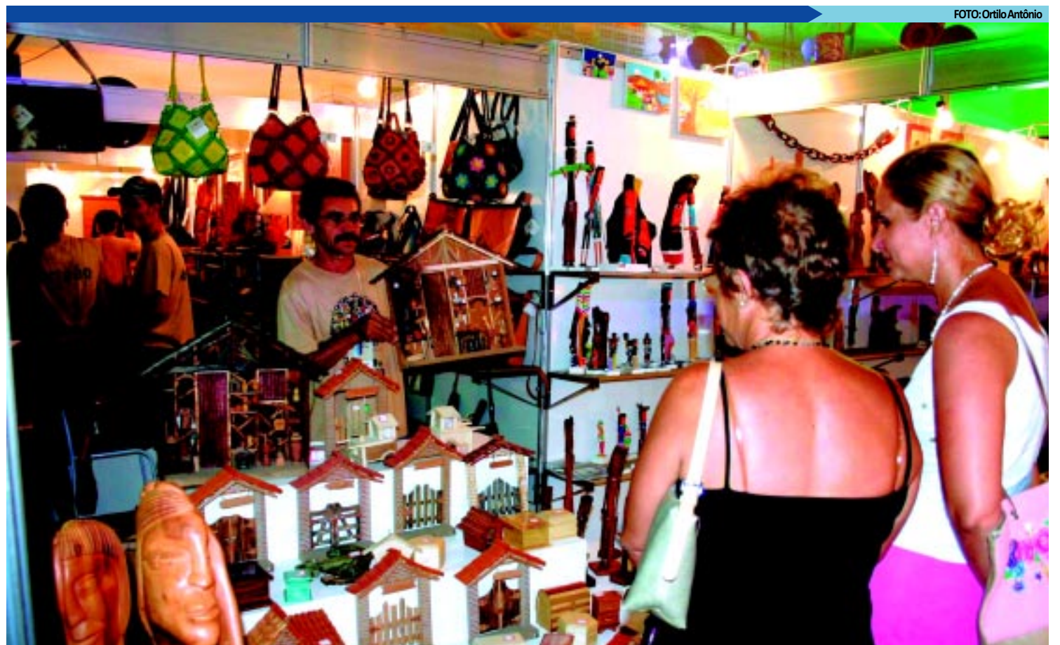
Salão de Artesanato vai funcionar das 15 às 22 horas e oferece produtos de artesãos de 81 municípios, com o uso de madeira, fibra, fios, couro e osso

O 15º Salão de Artesanato da Paraíba é uma promo-