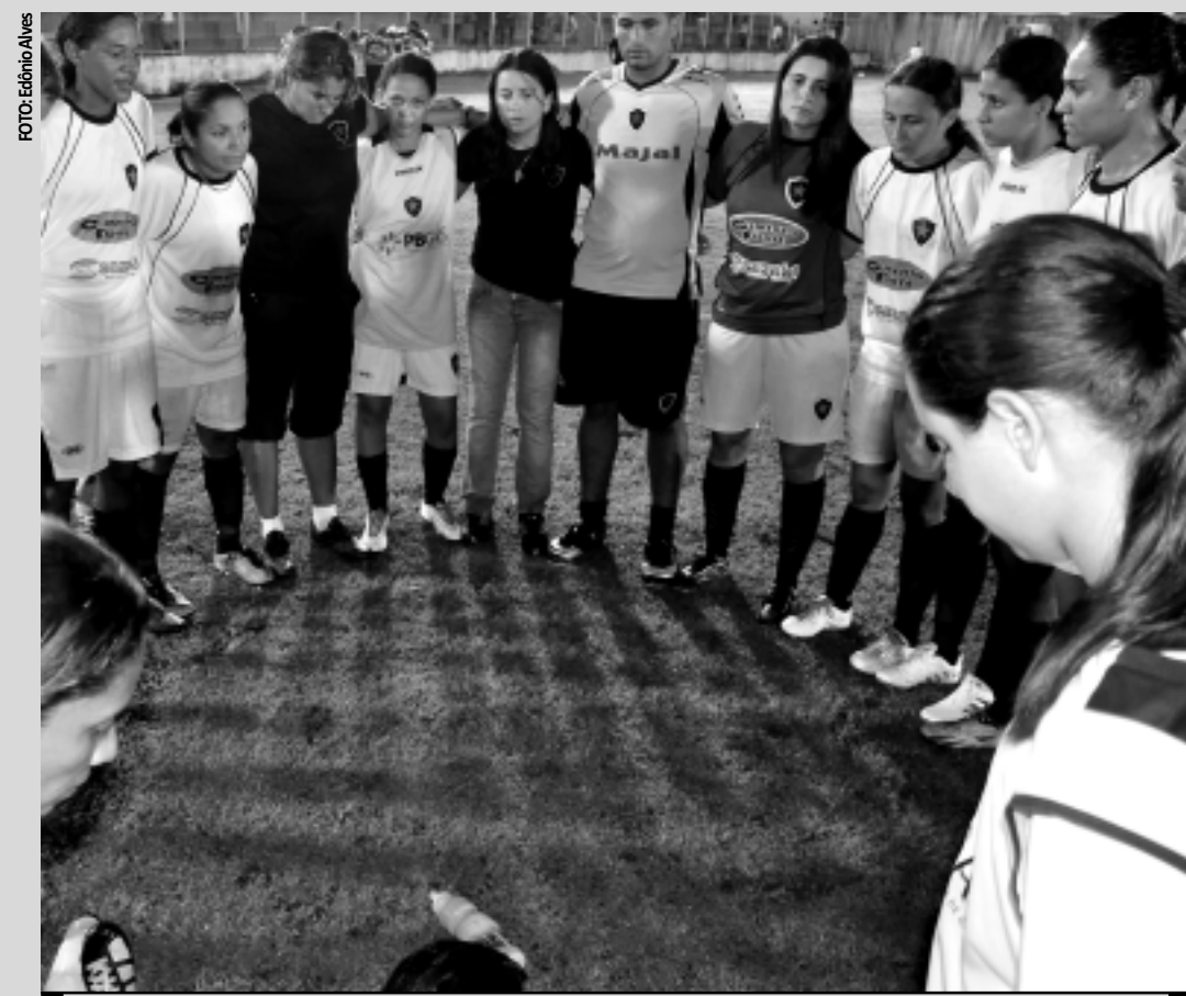
Melhor time do Estado na categoria, pode herdar a vaga por indicação da Federação Paraibana