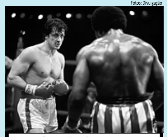
Sylvester Stallone e Carl Weathers em Rocky - O Lutador

>>> ROCKY - O LUTADOR - Rocky Balboa é um lutador de boxe mediocre que trabalha como "cobrador" de um agiota. Um dia ele é convidado para enfrentar o campeão mundial dos pesos-pesados, Apollo Creed, que decide colocar o título em jogo contra um lutador desconhecido. Para Apollo, a luta é mais uma exibição, mas para Rocky essa é a grande chance de sua vida, por isso ele passa a treinar de modo intensivo para terminar a luta sem ser nocauteado. SE LIGUE: Hoje, às 22h, no A&E