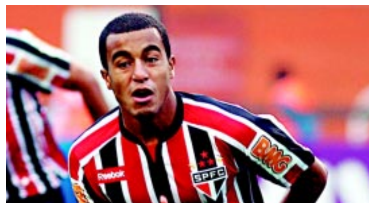
Tricolor paulista não abre mão de contar com jogador para 2012

A respeito da eterna busca pelo meia-armador, o vice afirmou que o clube espera poder ter boas notícias em janeiro. Ele, no entanto, disse que tanto Thiago Neves como Jadson, que estavam na lista de possíveis alvos, são contratações improváveis. "Já tivemos um interesse no Jadson, mas diante dos valores que nos foram colocados fica difícil. E o Thiago Neves pertence a clube árabe, que é sempre difícil negociar, e já