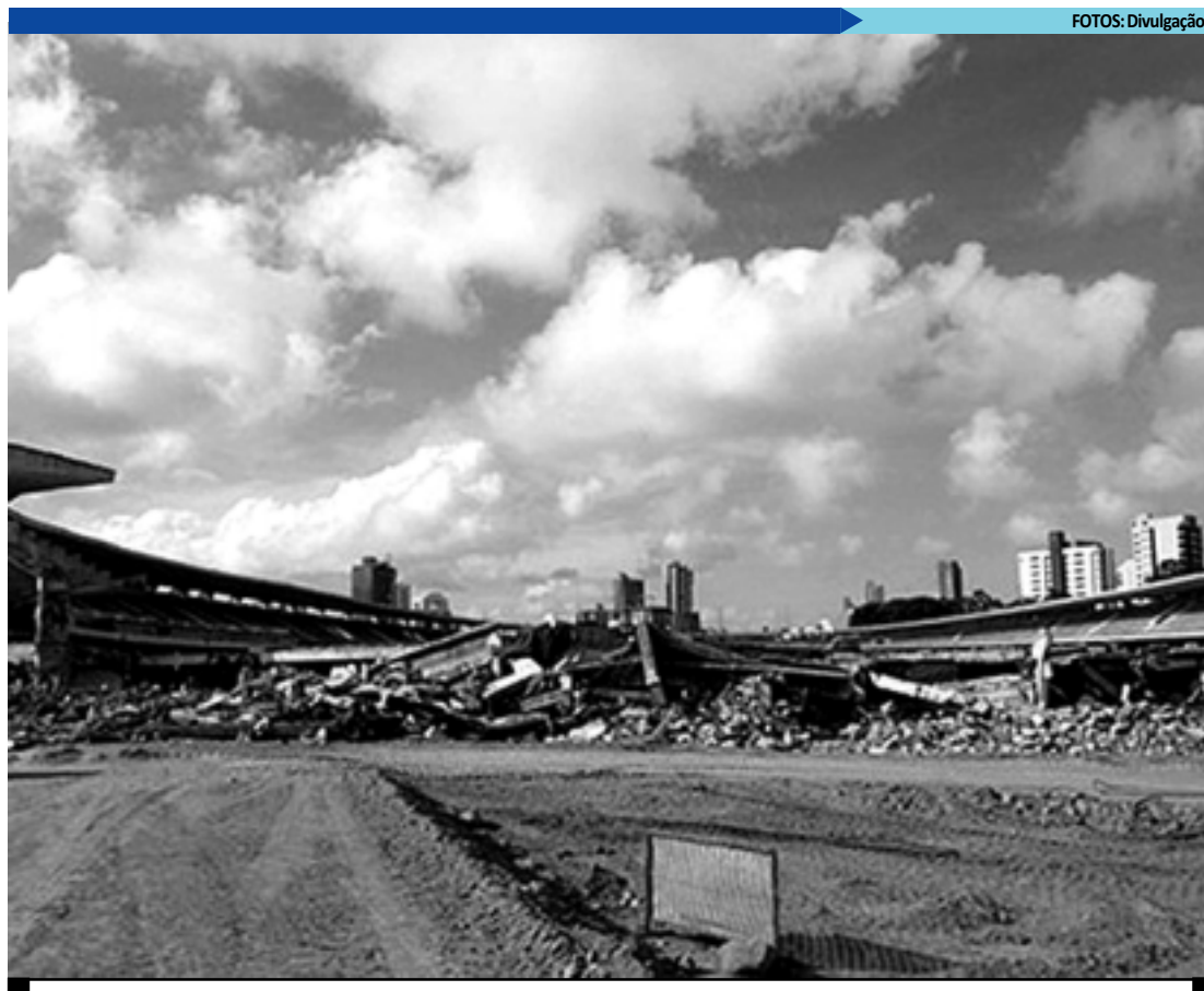
Em Natal, a única obra em andamento não é de mobilidade urbana, é do estádio onde acontecerão as partidas

A adoção do ponto eletrônico vem gerando divergências entre os setores sindicais e as confederações patronais. Para os sindicatos, exigência vai evitar que os trabalhadores façam horas extras e não recebam por elas. Já as entidades sindicais patronais argumentam que a adoção do ponto eletrônico pode gerar altos custos, principalmente para as pequenas empresas. Segundo o Ministério do Trabalho, a regra está sendo adotada para evitar fraudes na marcação das horas trabalhadas.