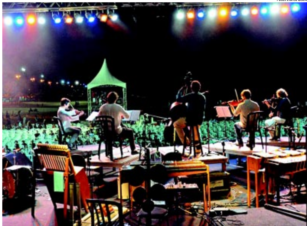
Apresentação do Quinteto da Paraíba, na noite de terça-feira (27), no Festival Música do Mundo

Desde o início da semana, a sétima edição do Festival Música do Mundo atrai centenas de pessoas para o Busto de Tamandaré, entre as Praias de Tambaú e Cabo Branco. Na terça-feira (27), por exemplo, a noite começou com o show do Quinteto da Paraíba, seguido pela música do Grupo Uakti, que fabrica os próprios instrumentos. E por fim, o último artista da noite foi um dos maiores instrumentistas brasileiros, o gaúcho Renato Borghetti.