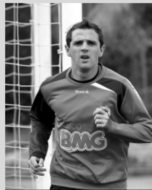
Montillo continua sendo disputado por clubes