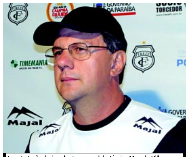
A contratação do jogador teve o aval do técnico Marcelo Villar

O dirigente afirmou que o substituto de Warley ainda está sendo conversado, sem pressa para definir um atacante mais experiente e goleador. "Queremos dar um grande