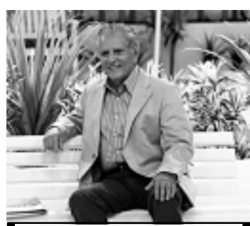
'A Praça É Nossa', hoje no SBT

23h15 - Especial: Uma Noite com Beyoncé 01h15 - Programação IURD