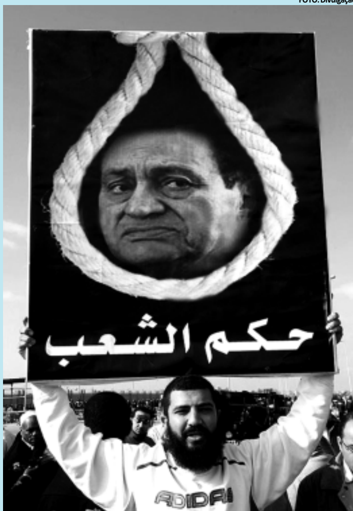
Manifestantes pediram justiça durante audiência com ex-ditador

Também assistiram a esta audiência, a sexta do julgamento, os demais acusados pela morte de manifestantes durante a Revolução de 25 de Janeiro: os dois filhos do ex-presidente, Gamal e Alaa, e o ex-ministro do Interior Habib el-Adly,