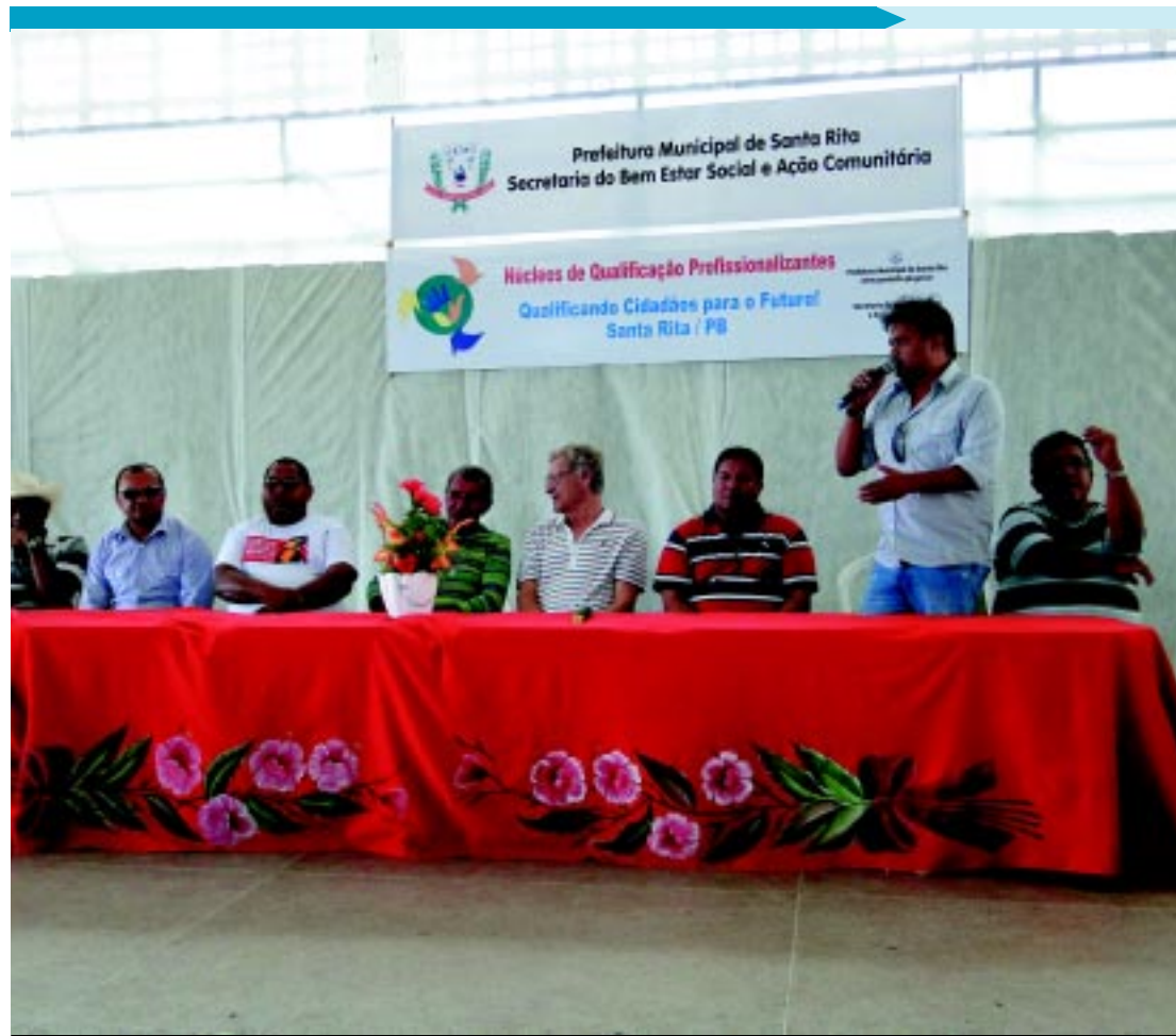
Mais de 400 profissionais foram capacitados para atuar no mercado como micros e pequenos empresários