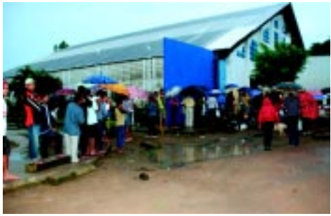
A prefeitura beneficia a população com entrega de peixes na Semana Santa

João Pessoa > Paraíba > QUINTA-FEIRA 29 de dezembro de 2011