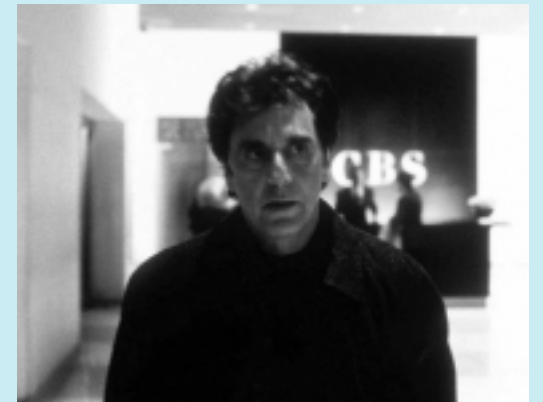
Al Pacino interpreta um jornalista em O Informante

>>> O INFORMANTE - Jeffrey Wigand, ex-executivo da indústria do tabaco afirma em entrevista ao programa '60 Minutos', da Rede CBS, que os diretores da empresa em que trabalhou sabiam da capacidade viciadora da nicotina e também aplicavam aditivos químicos ao cigarro para acentuar esta característica. Com a ajuda de Lowell Bergman, produtor do programa, Wigand irá enfrentar uma grande batalha para divulgar suas acusações. SE LIGUE: Hoje, às 23h, no Max Prime