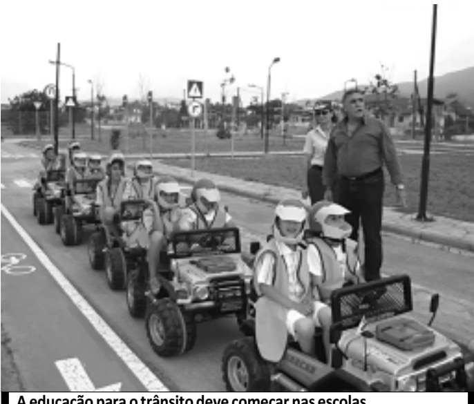
A educação para o trânsito deve começar nas escolas