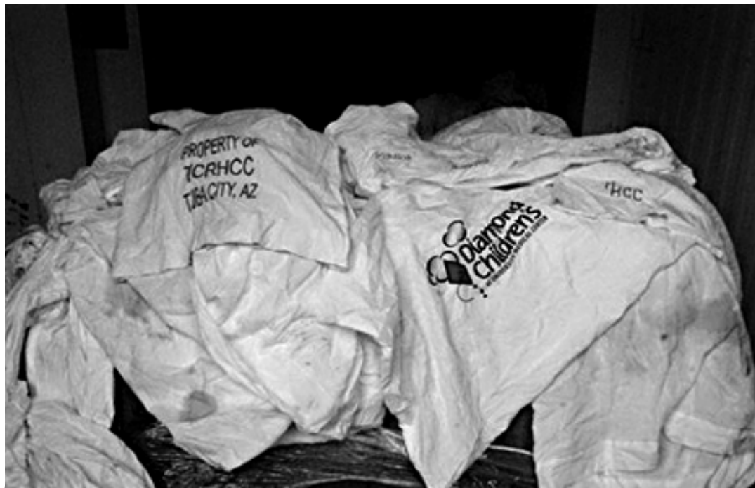
Agência Pernambucana de Vigilância Sanitária determinou incineração de 50 toneladas do lixo importado

As empresas N.A. Intimidades, que possuía depósitos nas cidades de Santa Cruz do Capibaribe e Toritama, e Império do Forro de Bolso, em Caruaru têm 15 dias para recorrer da decisão. Os depósitos estão interditados desde outubro.