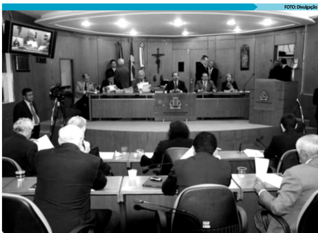
Sessão foi agitada e registrou mais de duas horas de atraso até decisão pela votação e inclusão das Zeis na pauta

De acordo com o prefeito, as alterações irão atender as determinações dos órgãos de controle, contemplarão um maior número de pessoas interessadas na carreira de procurador municipal, bem como permitirão que um maior número de candidatos possa inscrever-se no concurso para procurador, uma vez que o candidato poderá apresentar os requisitos para ingresso no cargo no ato da posse.