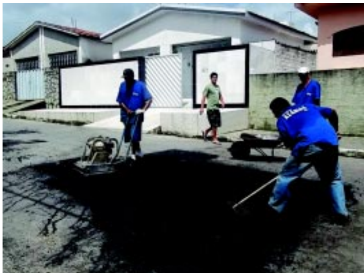
Marcus Odilon entrega ruas pavimentadas no centro da cidade.

O centro da cidade foi palco de mais uma grande inauguração. O prefeito de Santa Rita, Marcus Odilon, realizou a inauguração da Rua Vereador Reginaldo de Freitas, que fica localizada ao lado da Prefeitura da Cidade. A rua totalmente pavimentada e arborizada, agora conta com um amplo estacionamento para quem vier utilizar os serviços da Prefeitura.