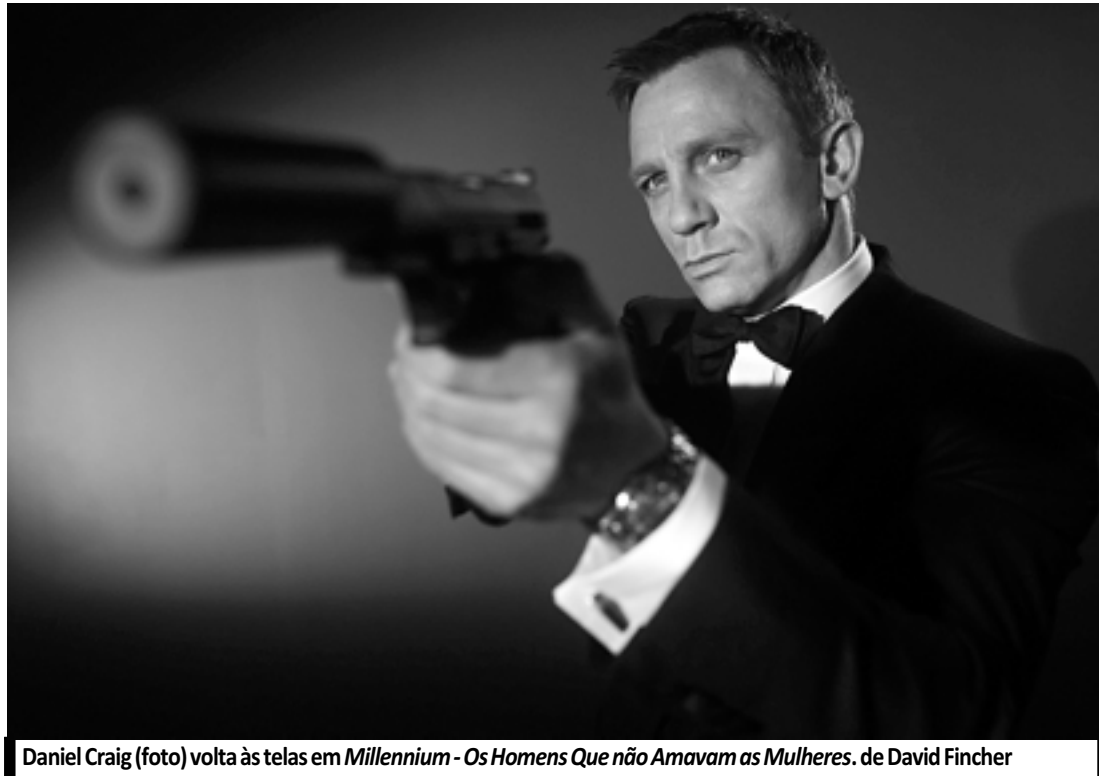
Daniel Craig (foto) volta às telas em Millennium - Os Homens Que não Amavam as Mulheres , de David Fincher

São homens, não? Mas até nisso diferem, pela maneira de se colocar diante da mulher. Mikael, embora seja um jornalista de prestígio e um cruzado na busca da verdade, é um homem co-