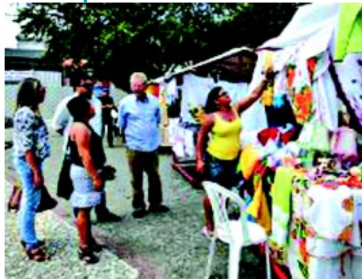
A Primeira Mostra Rita fará parte do calendário de eventos da cidade

A Mostra Rita também trouxe para a Praça Getúlio Vargas serviços como: corte de cabelo, manicure, pedicure, abertura de crédito através do stande do Banco do Nordeste (para Micro e Pequenas Empresas e Pequenos Comerciantes Informais), esteve também presente no evento como parceiro neste evento o Sebrae Paraíba dando todas as informações sobre abertura de empresas, crédito, qualificação para pequenos Empresários entre outros