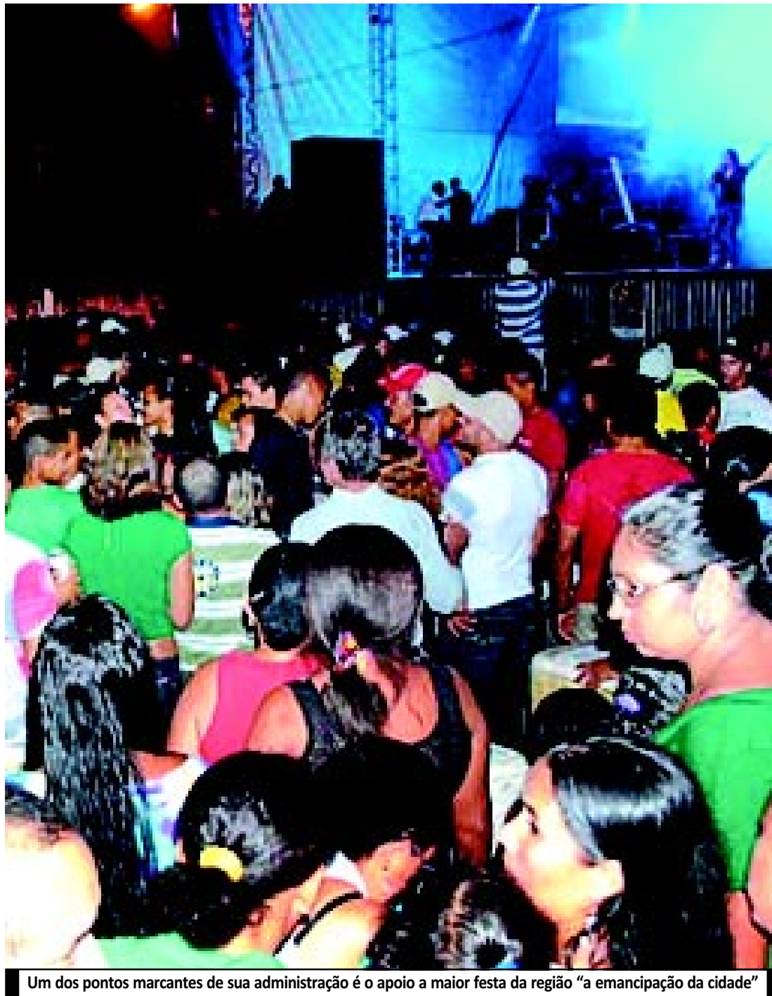
Um dos pontos marcantes de sua administração é o apoio a maior festa da região "a emancipação da cidade"