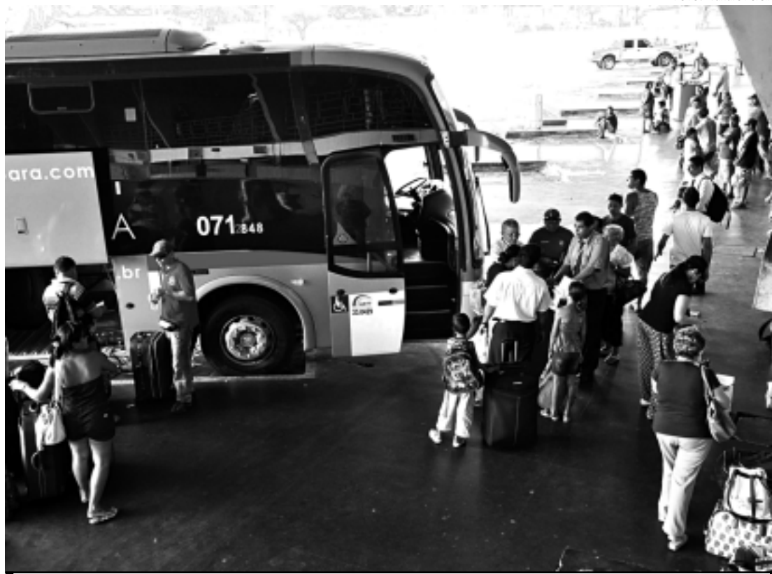
Terminal Rodoviário disponibilizou 155 ônibus extras para atender os passageiros neste final de semana

O Réveillon de João Pessoa conta ainda com apoio de outros órgãos da Prefeitura, além da Funjope, que vão trabalhar em esquema especial. É o caso, por exemplo, da Superintendência de Transportes e Trânsito (STTrans) e da Autarquia Especial Municipal de Limpeza Urbana (Emlur), além das Secretarias de Desenvolvimento Urbano (Sedurb), Saúde (SMS) e Infraestrutura (Seinfra). Os efetivos das polícias Civil, Militar e Corpo de Bombeiros vão manter a tranquilidade no entorno da festa, juntamente com a Guarda Municipal e seguranças particulares.