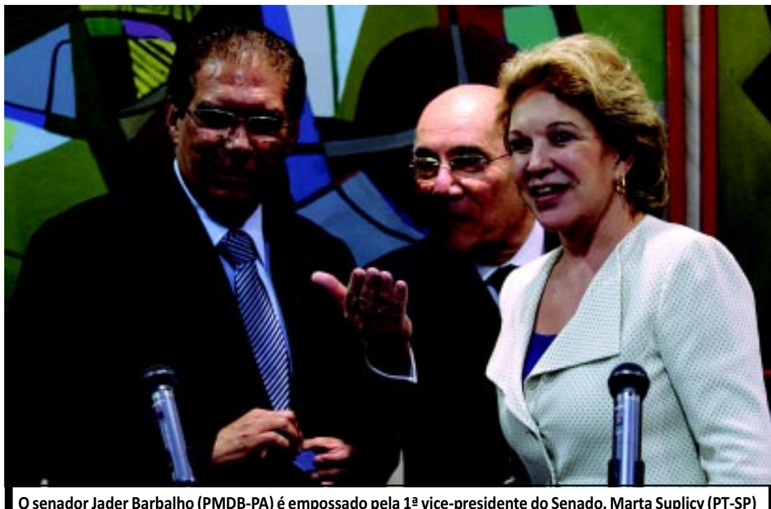
O senador Jader Barbalho (PMDB-PA) é empossado pela 1ª vice-presidente do Senado, Marta Suplicy (PT-SP)

No período em que passou no Rio Grande do Norte, Dilma participou da soltura de 100 filhotes de tartarugas marinhas, acompanhada por pesquisadores do Projeto Tamara. Ela também assistiu às apresentações de projetos desenvolvidos no Centro de Lançamento da Barreira do Inferno, vinculado ao Programa Espacial Brasileiro, como o que se refere ao Veículo Lançador de Satélites (VLS).