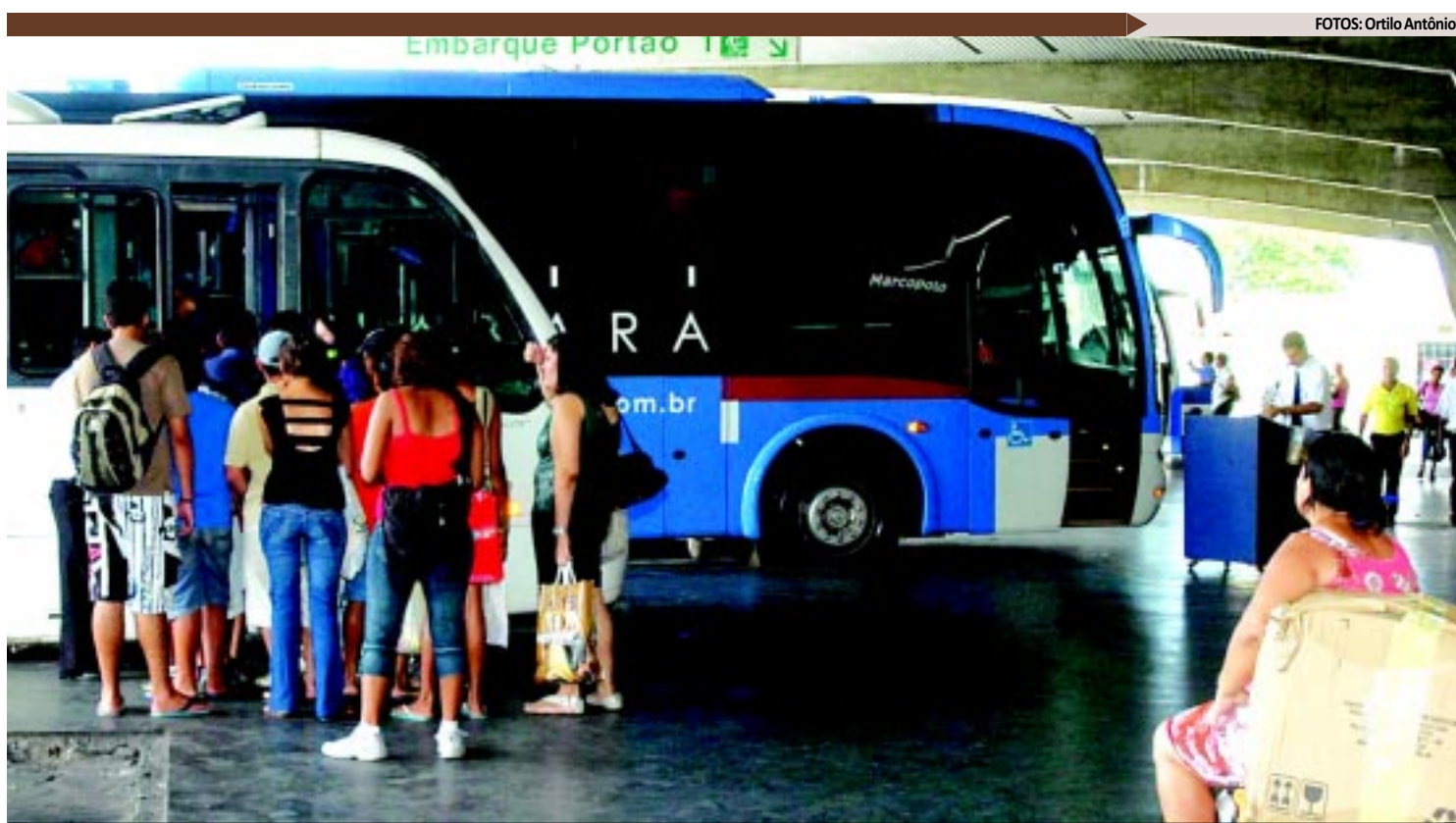
O texto do Decreto que será publicado no Diário Oficial de amanhã estabelece gratuidade para coletivos que fazem percursos intermunicipais

De acordo com a Secretaria de Comunicação do Estado, dois órgãos serão responsáveis pelo cadastro, emissão das carteiras e fiscalização do cumprimento deste serviço. A Secretaria da Segurança e Defesa Social irá cadastrar e emitir as carteiras e o Departamento de Estradas de Rodagem de Estradas de Rodagem do Estado da Paraíba (DER) fará a fiscalização.