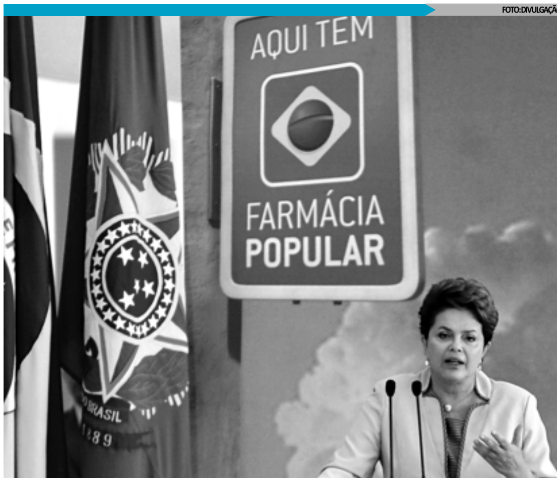
Em lançamento Dilma Rousseff destacou que cuidar da saúde da população é fazer justiça social

PROGRAMA - O Aqui Tem Farmácia Popular atualmente beneficia cerca de 1,3 milhão de brasileiros por mês. Destes, aproximadamente 660 mil são hipertensos e 300 mil, diabéticos. O programa é desenvolvido pelo governo federal em parceria com a rede privada de farmácias e drogas, que se credenciam espontaneamente ao firmarem convênio com o Ministério da Saúde.