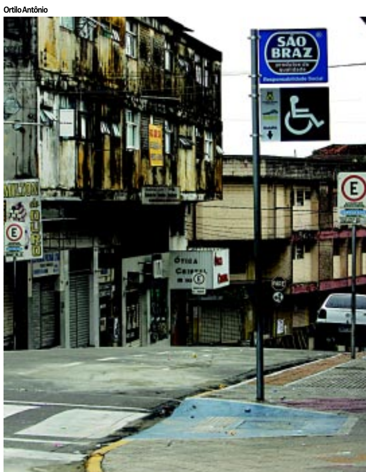
Curta denuncia a destruição do patrimônio histórico de Campina

que ligam Mamanguape a Araçagi, Pilões a Areia e Catolé do Rocha à divisa com o Rio Grande do Norte já estão em reforma. O governador também assegurou que as obras do Centro de Convenção de João Pessoa serão retomadas. PÁGINA 3