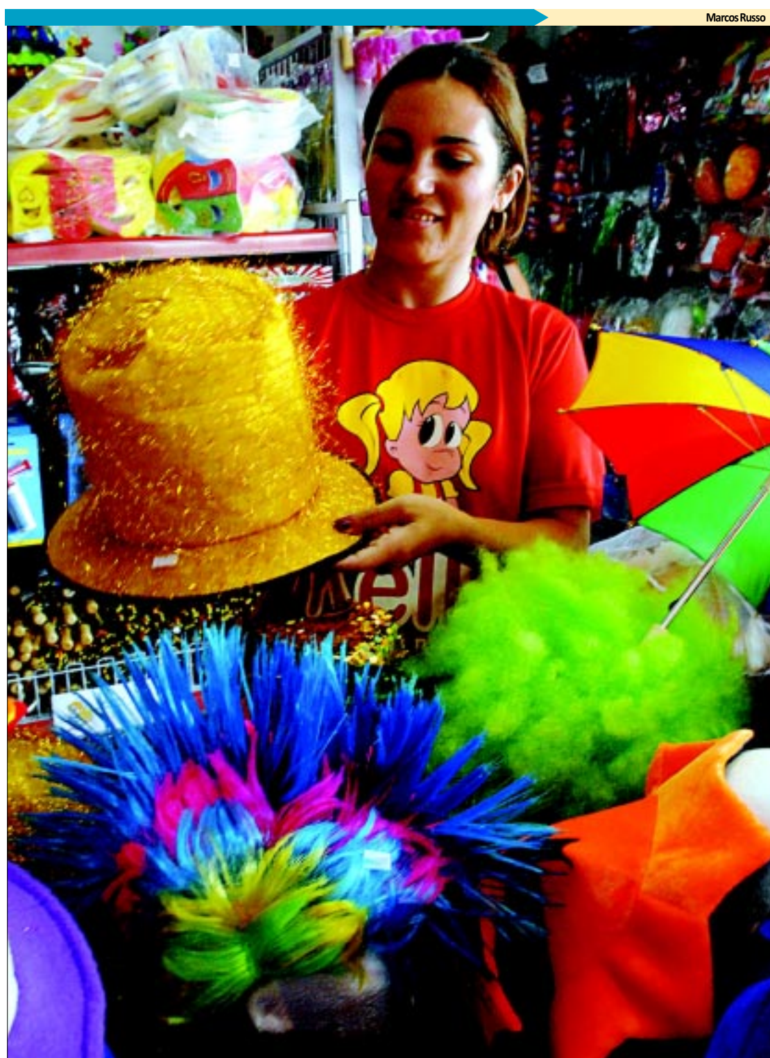
Comércio já vende produtos de carnaval

Documentário produzido pela arquiteta Rebecca Cirino denuncia a destruição do patrimônio histórico de Campina Grande. De acordo com a autora, as edificações estão sendo degradadas de forma acelerada. O filme está em processo de finalização e será lançada ainda este ano no Cine São José, marco da luta dos estudantes pela preservação arquitetônica e cultural da cidade - PÁGINA 20