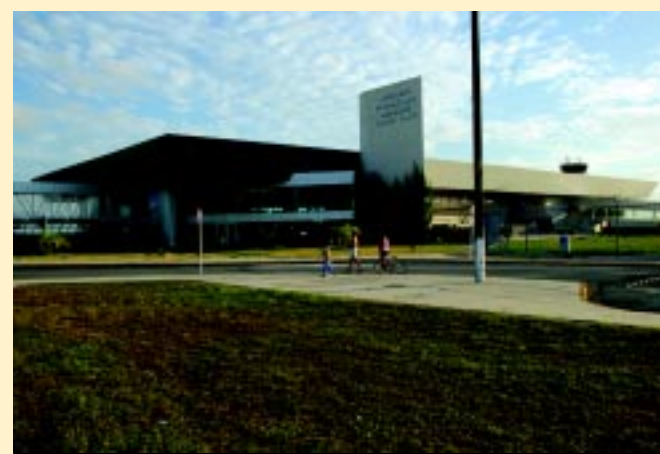
Apesar do absurdo, a mulher largou a ossada e acabou embarcando