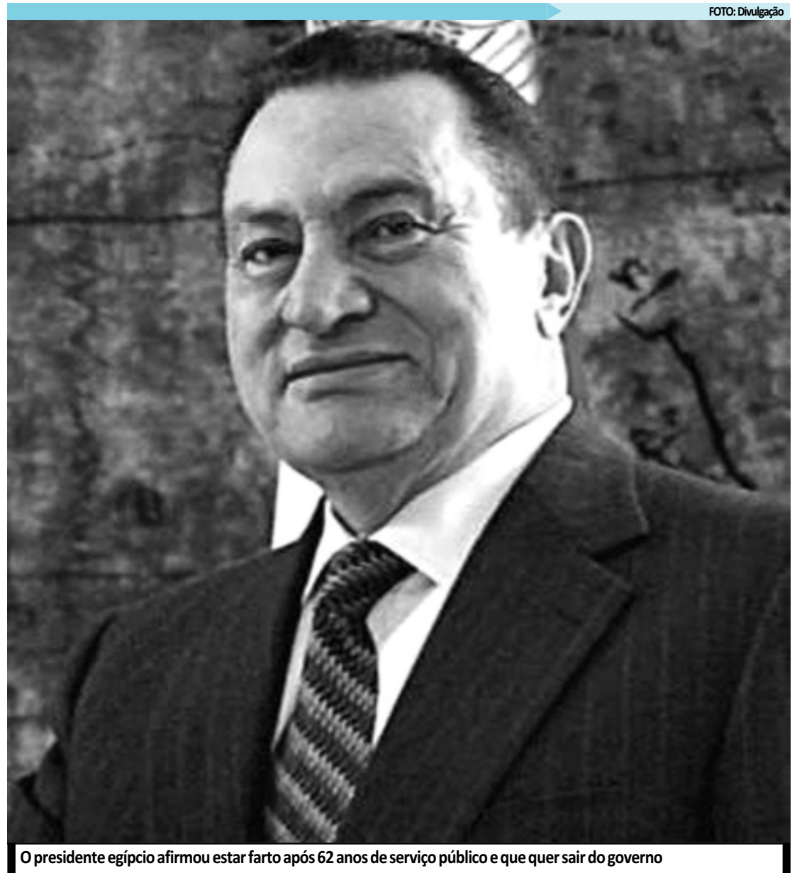
O presidente egípcio afirmou estar farto após 62 anos de serviço público e que quer sair do governo

Suleiman disse que o setor de turismo do país perdeu pelo menos US$ 1 bilhão nos últimos nove dias e que 1 milhão de turistas deixaram o Egito desde o início dos tumultos, na semana passada.