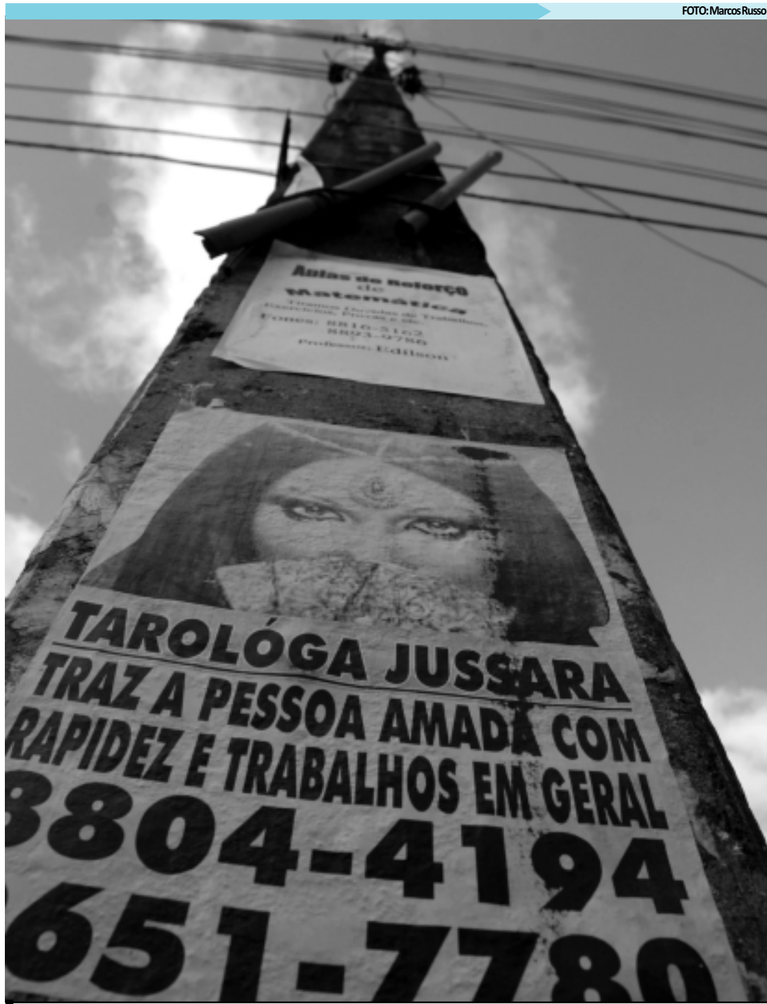
De cartazes colados em postes a placas e faixas irregulares serão fiscalizados pela Secretaria de Meio Ambiente

A portaria entrou em vigor na data de sua publicação e o prazo para a adequação deverá ocorrer até o próximo dia 8 de janeiro. Maiores informações podem ser obtidas na Sedurb, no Centro Administrativo Municipal (CAM), em Água Fria. O telefone é 3218.9151.