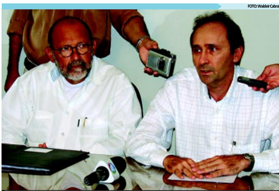
9,3% dos clientes estão inadimplentes, informou ontem presidente da Cagepa, Deusdete Queiroga

Entre as medidas para reduzir os custos da Cagepa, Deusdete elencou como a mais importante a redução na despesa de pessoal. "Dispensamos todos os comissionados e chamamos apenas oito assessores, o que permitiu uma diminuição na folha de R$ 400 mil", observou Deusdete, acrescentando que a redução de comissionados não prejudicou os serviços prestados pela estatal.