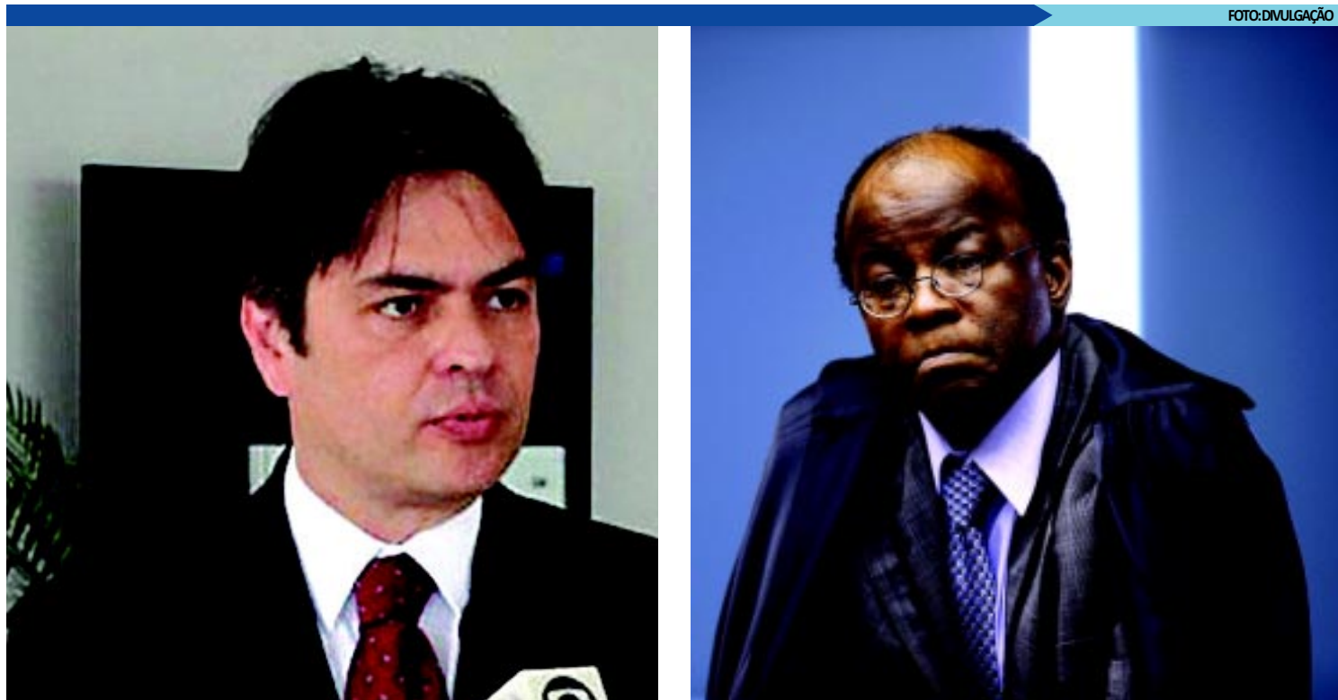
Joaquim Barbosa já foi relator de processo contra o ex-governador Ronaldo Cunha Lima, pai de Cássio, em 2007

Na Ação Cautelar, a defesa de Cunha Lima sustenta que seu caso é diferente dos já julgados pelo STF relativos à aplicação da Lei Complementar 135/2010 (Ficha Limpa). "Continuo acreditando na Constituição Federal e na soberania popular. Os advogados vão requerer a análise da Ação Cautelar por parte do ministro Joaquim Barbosa", disse o ex-governador ao site Política PB, na tarde de ontem.