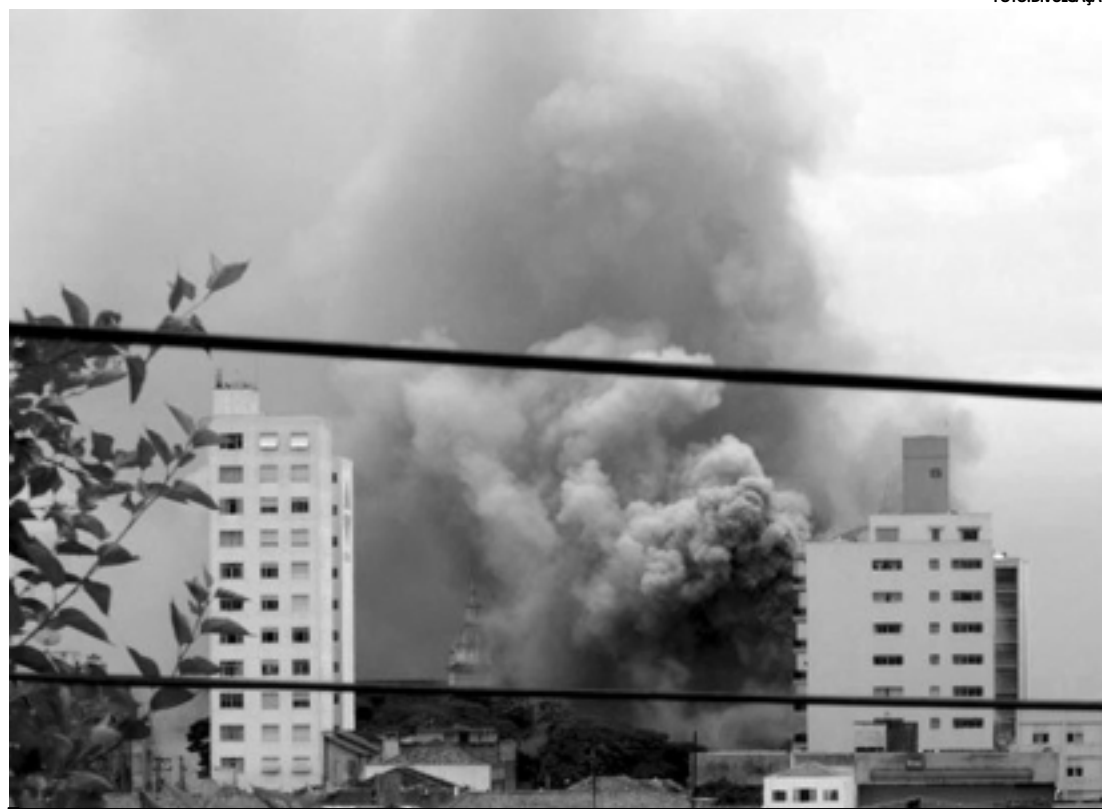
O incêndio atingiu três dos oito andares do prédio e levou duas horas para ser controlado pelos bombeiros