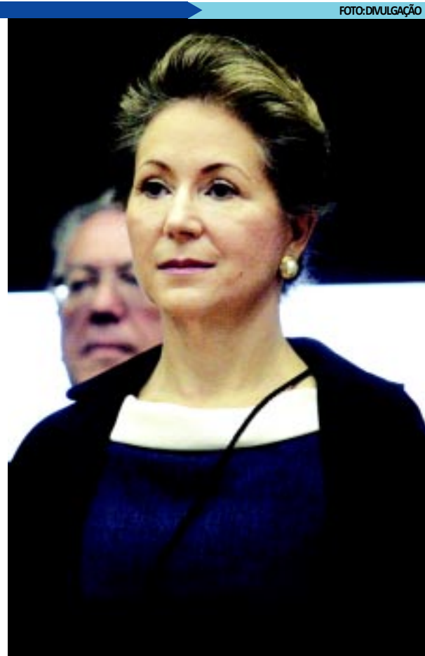
Os ministros Gilmar Mendes, Ayres Britto e Ellen Gracie serão os responsáveis pela relatoria das três primeiras ações movidas pela OAB Nacional contra o benefício dos ex-gestores

Um levantamento feito pela Folha de São Paulo aponta que os Estados gastam pelo menos R$ 31,5 milhões por ano com essas aposentadorias, beneficiando 135 pessoas, entre ex-governadores e viúvas. No entendimento da OAB, a previsão de pagamento de pensões nas Constituições Estaduais violam a Constituição Federal sob vários aspectos.