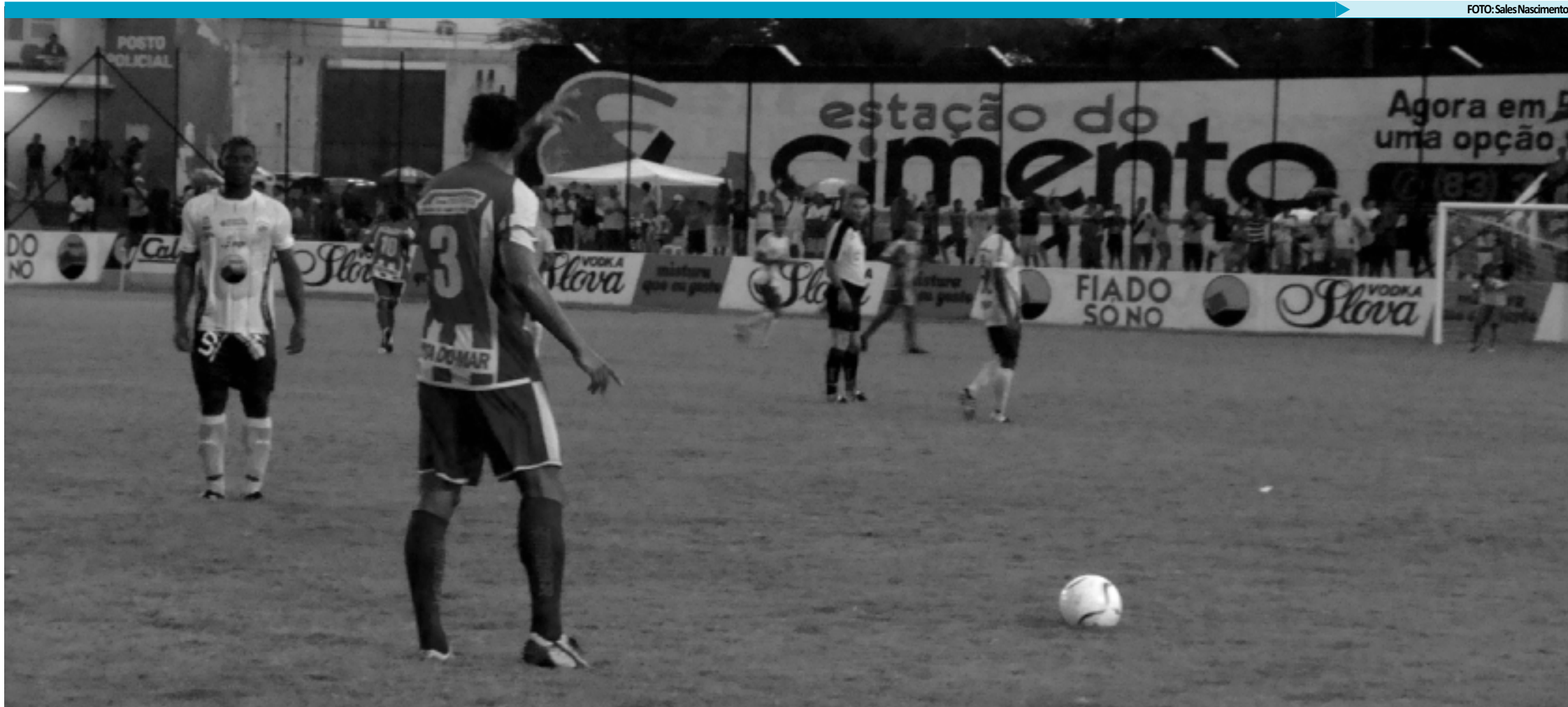
O estádio José Cavalcante deve receber um bom público no clássico entre Nacional e Esporte. O jogo começa às 17 horas e acabou sendo antecipado do domingo para o sábado por causa da decisão da Taça Guanabara

>>>NACIONAL X ESPORTE > Clubes de Patos se enfrentam no José Cavalcante em busca de afirmação