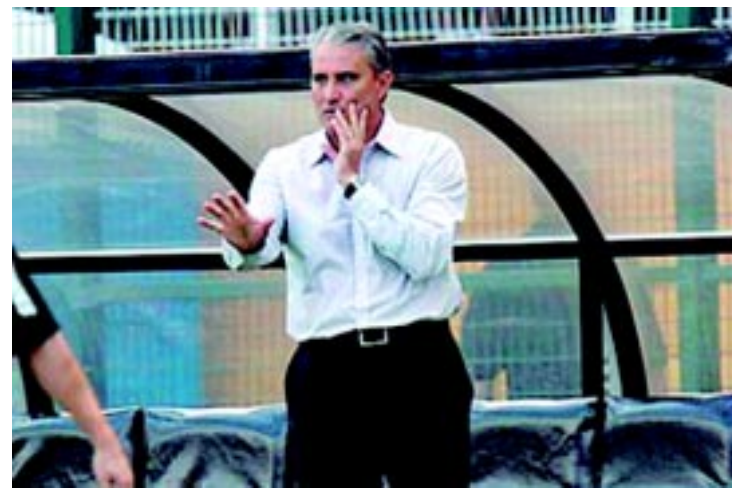
Para Tite, jogo serve para a equipe se firmar de vez entre os líderes

Apesar de o adversário deste sábado estar na zona de