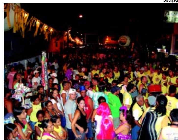
População foi ao Ponto de Cem Réis para a abertura do pré-carnaval

No primeiro dia de eventos, seis blocos tomaram conta das ruas da Capital. A abertura contou com apresentações da orquestra do Maestro Duda e com show de Alceu Valença no Ponto de Cem Réis. Hoje, a festa começa com o "Agitada Gang" e terá mais sete blocos. PÁGINA 9