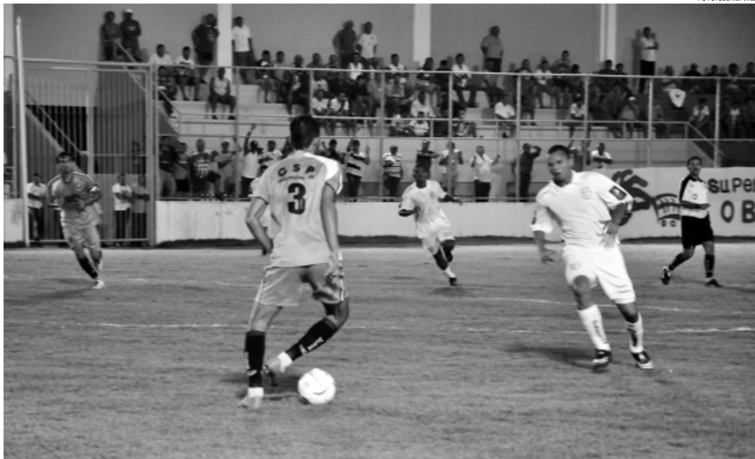
O CSP, que perdeu na quarta-feira para o Treze, busca a reabilitação neste sábado diante do Miramar para se manter entre os quatro melhores

> Wellington Sérgio wsrgionobre@yahoo.com.br