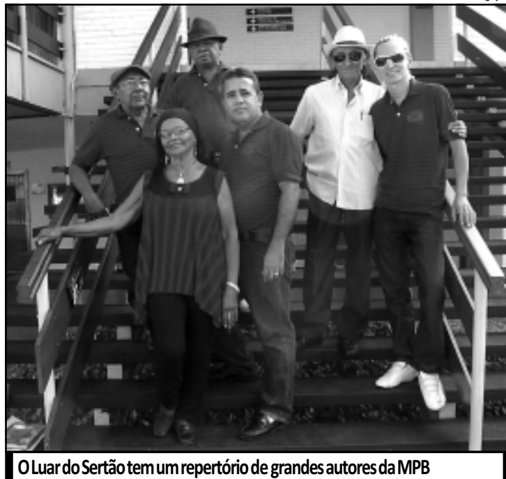
O Luar do Sertão tem um repertório de grandes autores da MPB

O grupo coordenado pelo produtor Juracy Lucena apresenta-se hoje na Feirinha de Tambaú com os grandes "clássicos" da música popular brasileira. O show faz parte do Circuito Cultural das Praças, da Funjope