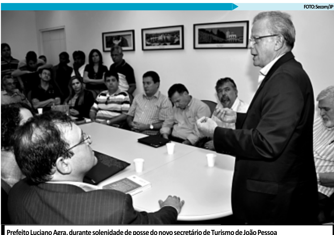
Prefeito Luciano Agra, durante solenidade de posse do novo secretário de Turismo de João Pessoa

"Isso não tem data para começar. É um processo natural. Não há vinculação entre a aprovação do salário mínimo e a composição do governo", afirmou o ministro.