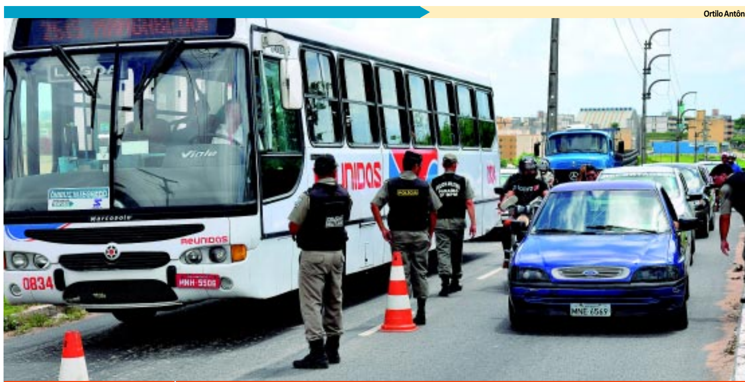
CIDADE SEGURA Operação especial da Polícia Militar apreende armas e drogas PÁGINA 11