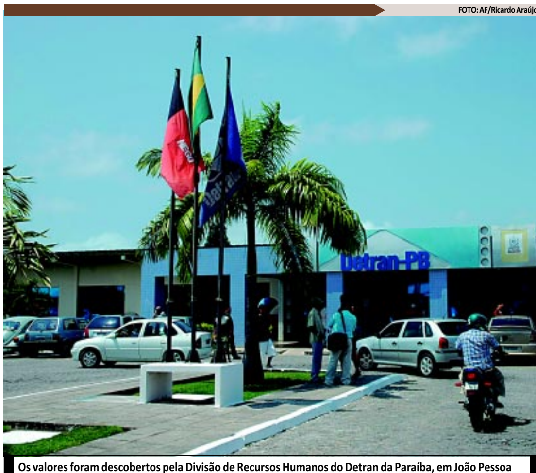
Os valores foram descobertos pela Divisão de Recursos Humanos do Detran da Paraíba, em João Pessoa

Os funcionários identificados com "supersalários" são de nível superior, com remuneração corrigidas com base no piso dos engenheiros. Entre eles, três já são aposen-