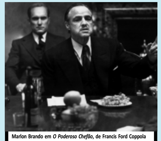
Marlon Brando em O Poderoso Chefão, de Francis Ford Coppola

>>> ESPECIAL OSCAR - Três produções premiadas serão exibidas em sequência. O primeiro é O Poderoso Chefão, de Francis Ford Coppola, com Marlon Brando, Al Pacino e James Caan, que recebeu 11 indicações ao Oscar em 1973 e arrematou as estatuetas de filme, ator (Marlon Brando) e roteiro. Na sequência, vem O Poderoso Chefão 2, continuação da saga da família Corleone, que teve 11 indicações e ganhou cinco prêmios no Oscar em 1975, incluindo filme, direção e ator coadjuvante (Robert de Niro). Para fechar o especial, Johnny & June, que conta a história do cantor e guitarrista Johnny Cash. O longa-metragem teve cinco indicações ao Oscar e Reese Witherspoon venceu na categoria de atriz. SE LIGUE: Amanhã, a partir das 7h15, no Megapix