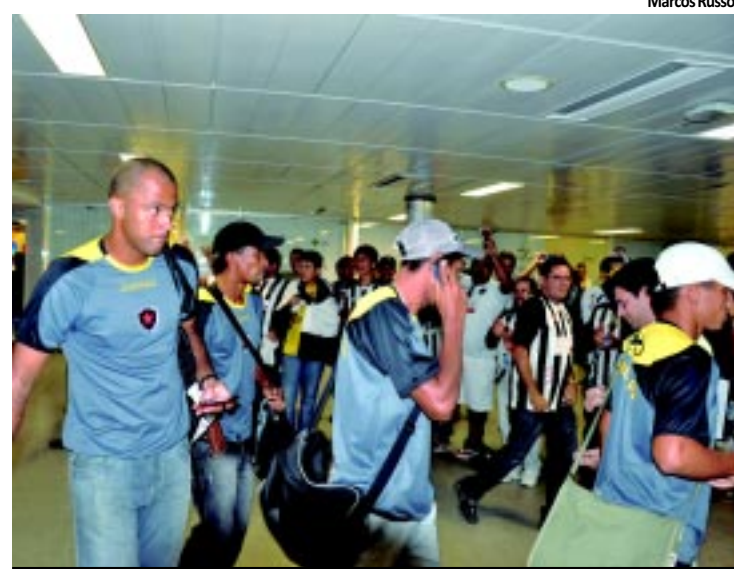
Jogadores do Bota desceram no Castro Pinto por volta das 14h

Vinte e dois anos depois da primeira participação na Copa do Brasil, o Botafogo conseguiu quinta-feira à noite uma classificação inédita para a segunda fase da competição. Para homenagear o time, torcedores de todas as idades foram ontem ao aeroporto Castro Pinto. PÁGINA 13