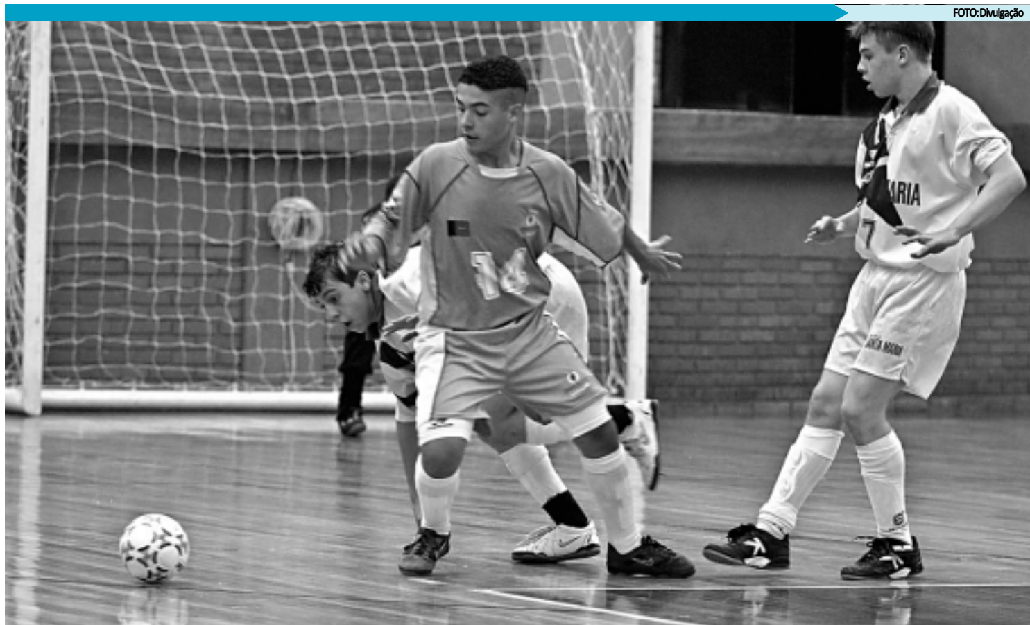
O futsal paraibano vai mostrar a sua força no Campeonato Brasileiro de seleções que acontece no próximo mês no interior de Pernambuco