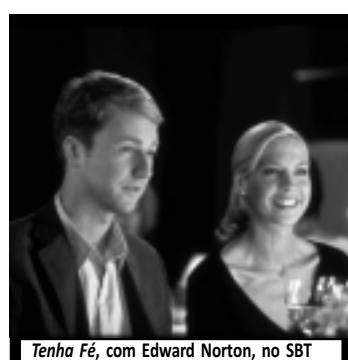
Tenha Fé, com Edward Norton, no SBT