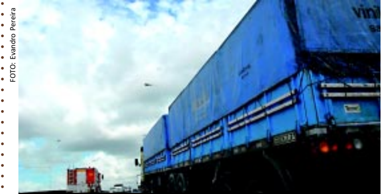
[FOTO&LEGENDA] Vale lembrar que veículos longos estão proibidos de circular nas estradas, de acordo com determinação da Polícia Rodoviária Federal. O objetivo é diminuir o número de acidentes nesse período. Para denunciar, ligue 3533-4747.