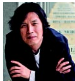
Lee Chang-dong Diretor

Mija carrega um peso, a doença. É idosa, mas tem o coração de uma garota. Precisava de uma atriz que pertencesse ao mundo real, com quem o público pudesse se identificar. Yun Jeong-hie foi uma grande estrela coreana nos anos 1960 e 70. Depois, ela se casou e se dedicou à família. Quando a conheci, achei que ela tinha o tipo de persona luminosa de que eu necessitava. A personagem é muito interiorizada, não tem uma grande cena. Sem a atriz certa, não funcionaria.