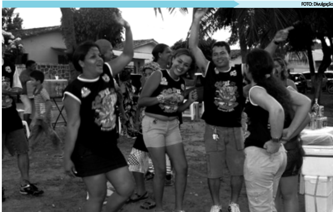
Foliões empolgados devem sair às ruas, em massa, neste segundo dia da maior prévia carnavalesca do Brasil

NOS BAIRROS, MAIS FESTA - Quem pensa que a folia vai ficar restrita apenas às praias do Cabo Branco e Tambaú,