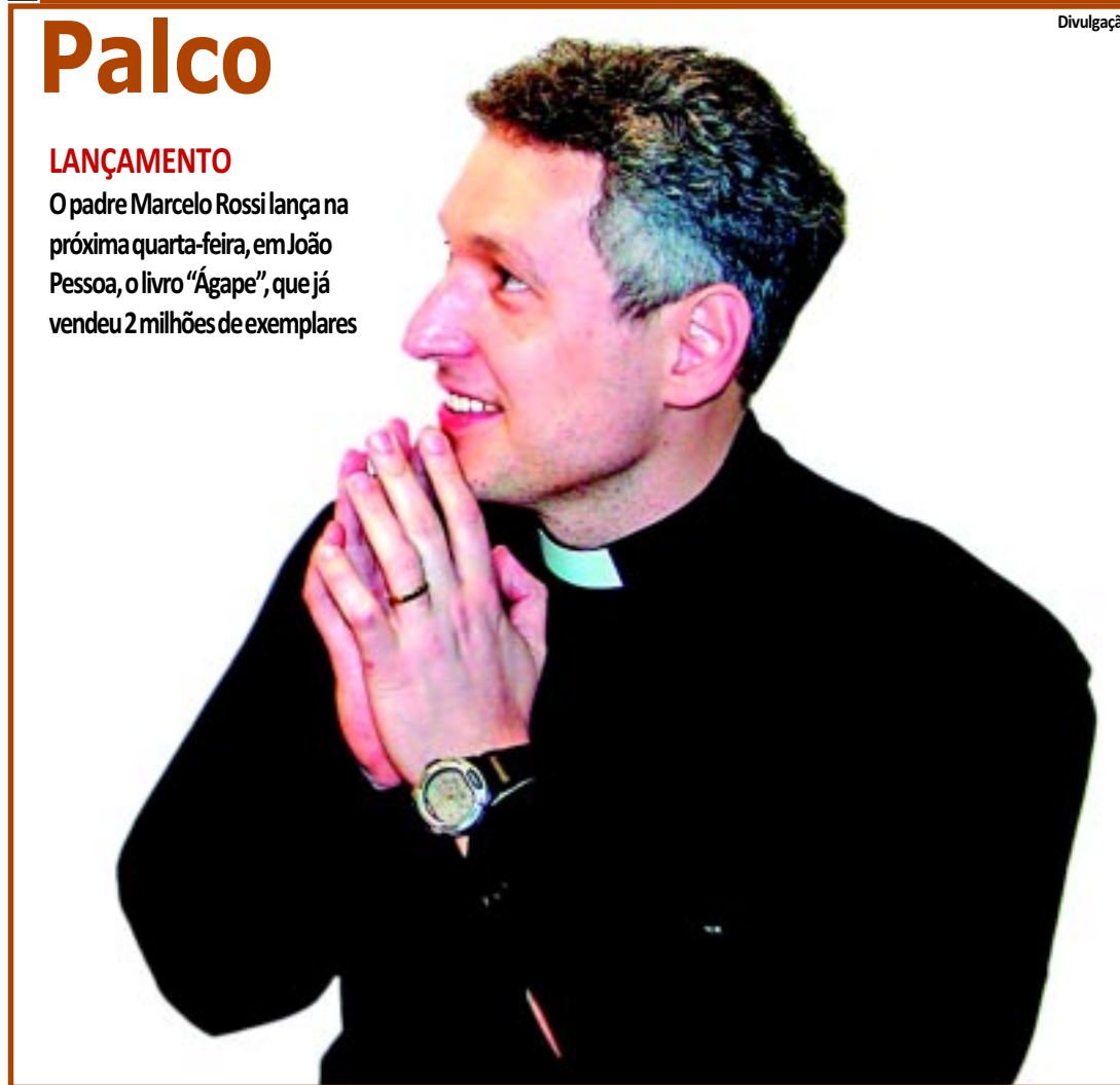
ORAÇÃO Obra pretende incentivar a leitura da Bíblia PÁGINA 17

LANÇAMENTO O padre Marcelo Rossi lança na próxima quarta-feira, em João Pessoa, o livro "Ágape", que já vendeu 2 milhões de exemplares