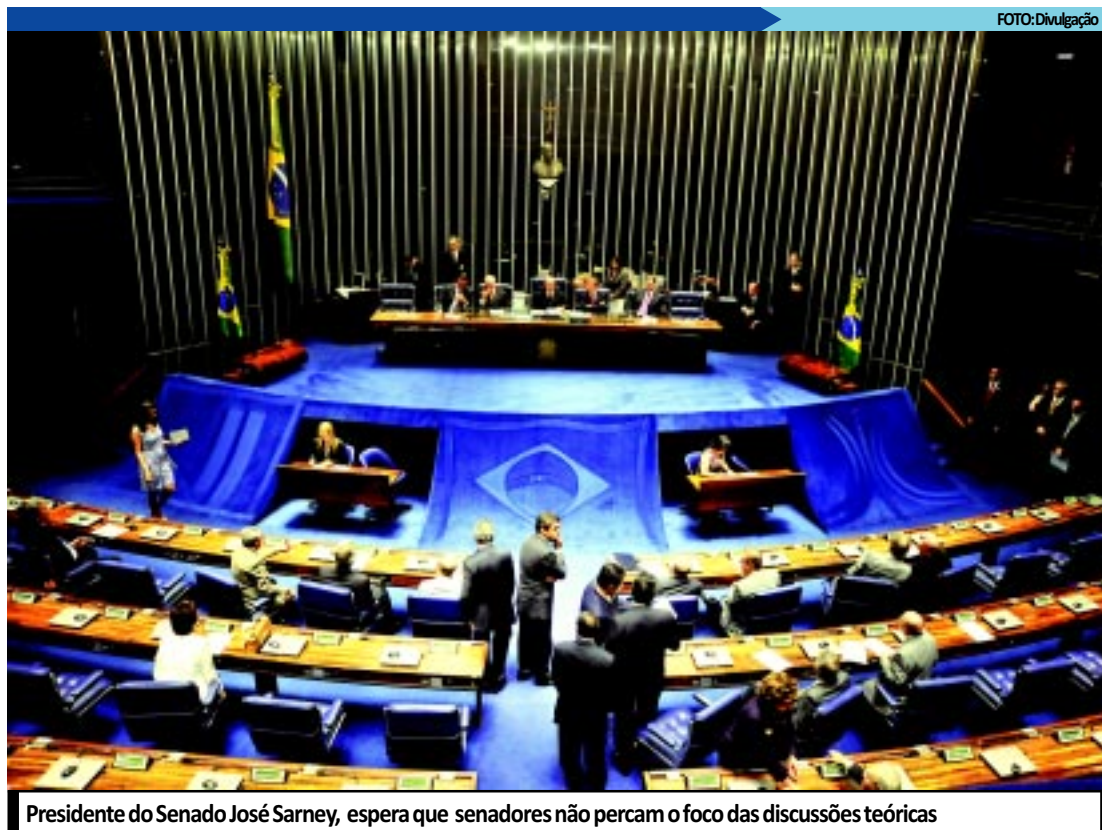
Presidente do Senado José Sarney, espera que senadores não percam o foco das discussões teóricas

terça-feira. Na sessão, Sarney pediu que os senadores não se percam em "discussões teóricas", uma vez que os principais pontos de mudanças já estariam amadurecidos.