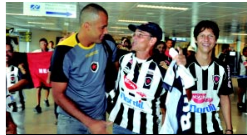
Goleiro é ovacionado pela torcida no desembarque

"Estou feliz por defender um clube grande da Paraíba. Graças a Deus, cheguei em um momento feliz, após essa classificação na Copa do Brasil.", declarou o atacante.