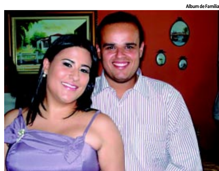
Album de Família