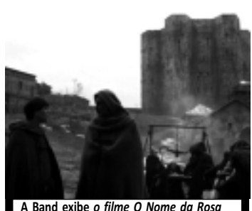
A Band exibe o filme O Nome da Rosa