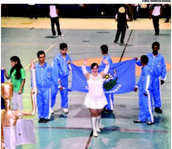
A abertura dos Jogos Escolares foi realizada ontem na Capital

O Ginásio do Colégio Marista Pio X, em João Pessoa, foi tomado no final da tarde de ontem por jovens atletas durante a abertura da etapa pessoense dos Jogos Escolares da Paraíba, que, até o dia 9 de junho, reunirá cerca de dois mil atletas de 91 escolas que disputarão 12 modalidades. O vice-governador, Rômulo Gouveia (PSDB), participou da abertura do evento. A novidade deste ano foi a criação dos Jogos Paraescolares. Os jogos não representam apenas disputas por títulos, mas, também, uma grande reunião com o propósito maior de incluir e unir os estudantes e todo o Estado. PÁGINA 14