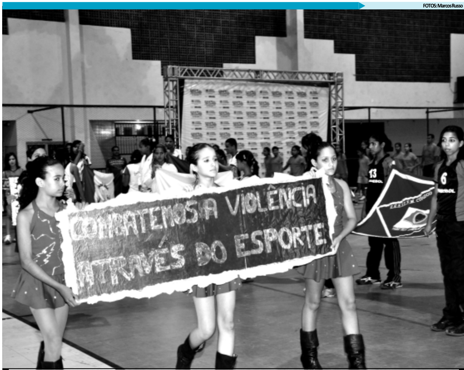
O tom da festa de ontem foi dado pelas palavras de união e inclusão social através do esporte expostas em cartazes durante o desfile