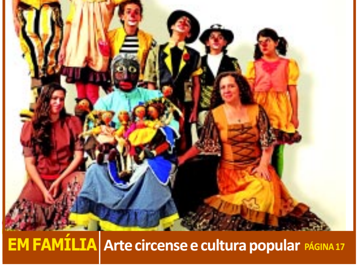
EM FAMÍLIA Arte circense e cultura popular PÁGINA 17

O estilo de viver e fazer arte dos Gomiteiros na Companhia Carroça de Mamulengos