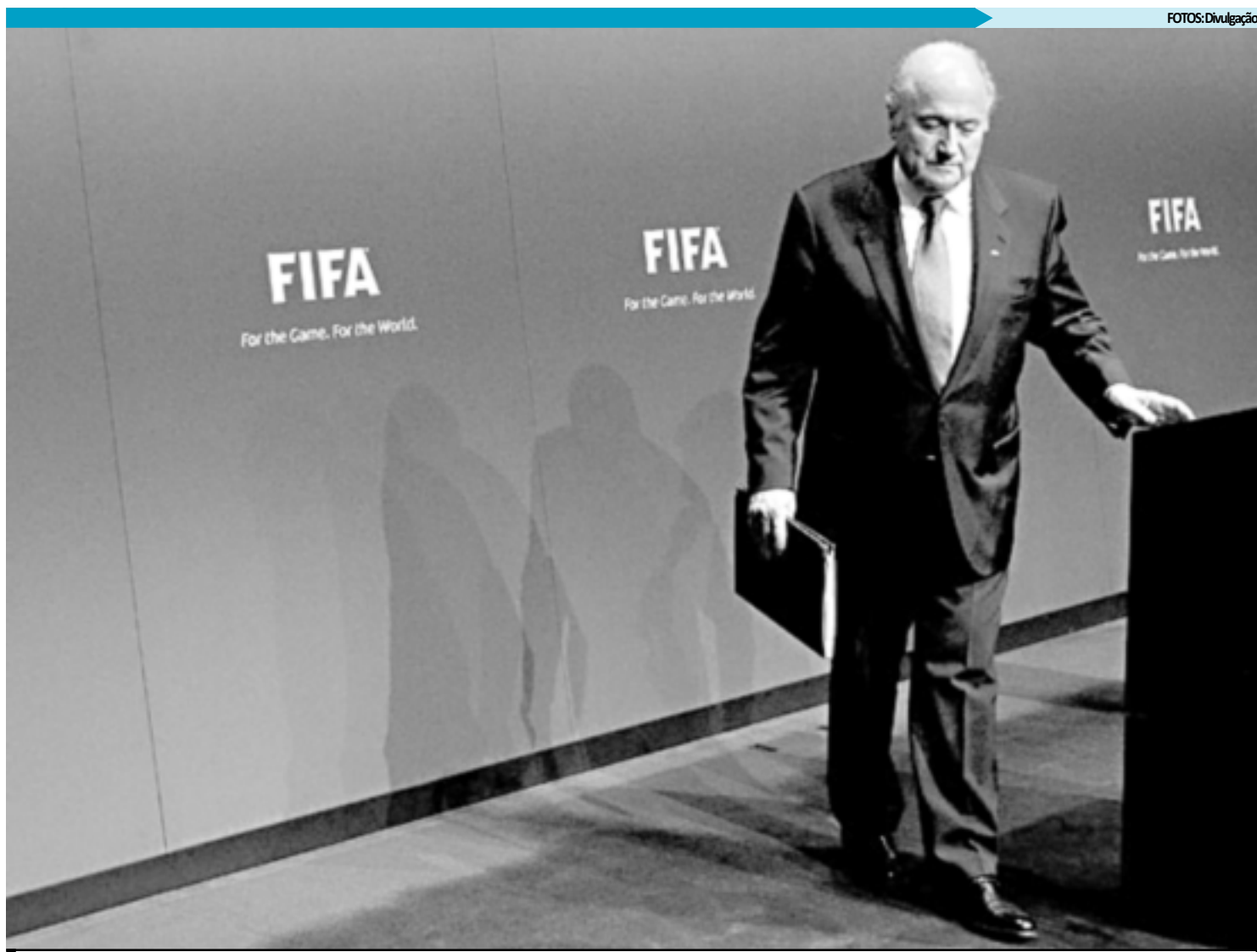
O presidente da Fifa, Joseph Blatter, deve ser reconduzido hoje no cargo para o seu quarto mandato apesar dos protestos da Federação Inglesa

Blatter é candidato único à terceira reeleição, pois Bin Hammam retirou sua candidatura momentos antes de ser suspenso pelo Comitê