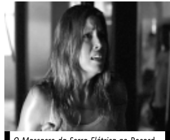
O Massacre da Serra Elétrica na Record