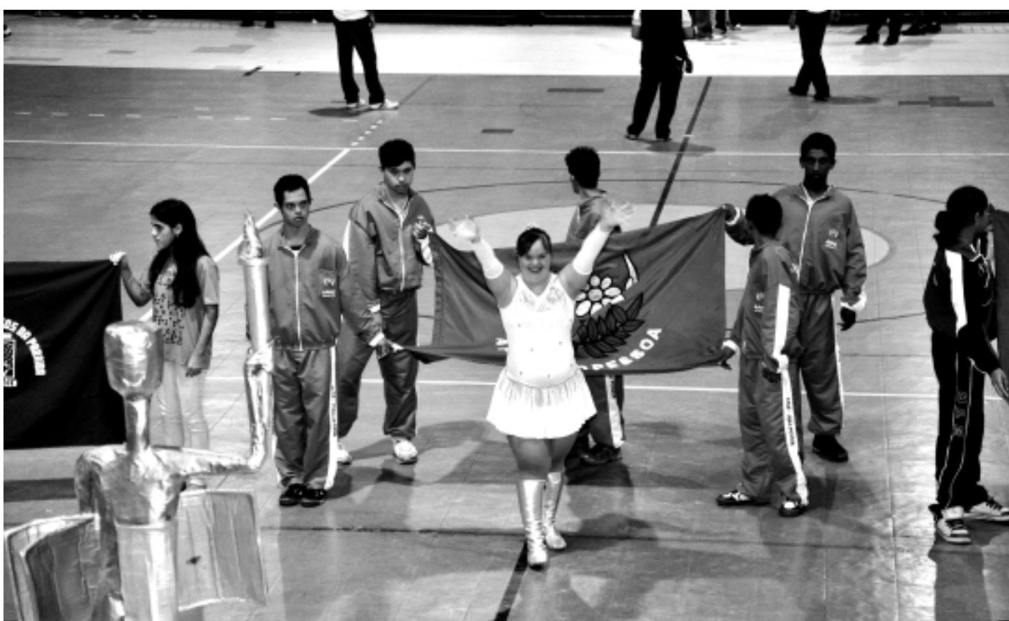
A primeira edição dos jogos para portadores de necessidades especiais terá a participação de 62 atletas de 26 escolas da Paraíba

Quanto as modalidades, a novidade deste ano é o badminton, esporte semelhante ao tênis, mas que se utiliza de uma peteca ao invés da bola. No ano passado, duas outras modalidades já tinham sido incluídas ao formato tradicional da competição, que foram o ciclismo e a ginástica rítmica.