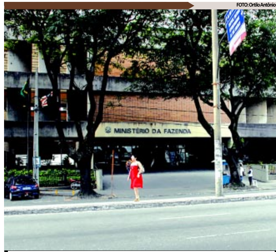
A Receita ainda não divulgou quantos contribuintes paraibanos serão contemplados

A restituição do Imposto de Renda significa que o contribuinte pagou mais imposto do que deveria, e por causa disso, poderá receber uma parte do valor pago no ano anterior, que poderá ser feita via depósito na sua conta-corrente.