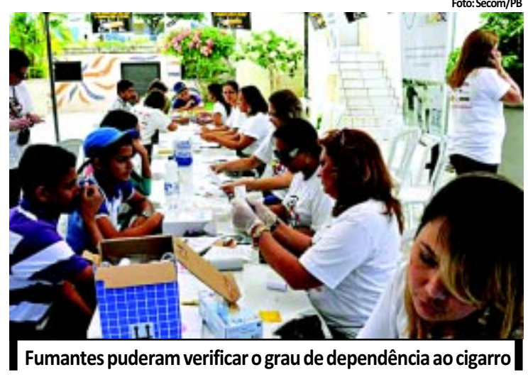
Fumantes puderam verificar o grau de dependência ao cigarro

O dia de ontem foi marcado por mobilizações contra o uso do cigarro na Capital. Equipes das Secretarias de Estado da Saúde e do Município de João Pessoa fizeram panfletagem com orientações à população sobre os malefícios causados pelo vício. Além disso, exames que indicam o grau de dependência do fumante foram realizados. Ontem foi o Dia Mundial sem Tabaco. O tabagismo é responsável por 90% de todos os cânceres. PÁGINA 10