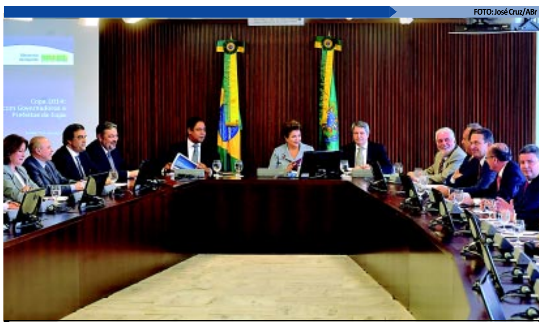
A presidente Dilma Rousseff se reúne com governadores e prefeitos das cidades-sede da Copa do Mundo de 2014

Na reunião, a presidente Dilma Rousseff também vai apresentar as suas queixas. Ela não está satisfeita com o andamento das obras em várias cidades, particularmente São Paulo e Manaus.