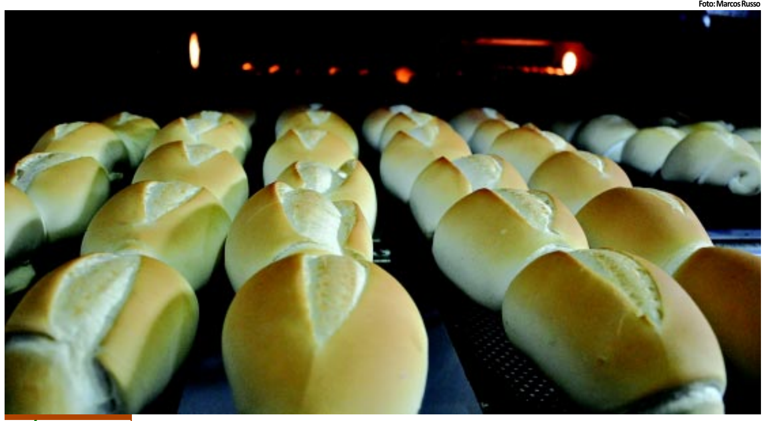
ATÉ JULHO Preço do pão deve sofrer aumento por causa da alta de até 20% da farinha PÁGINA 8