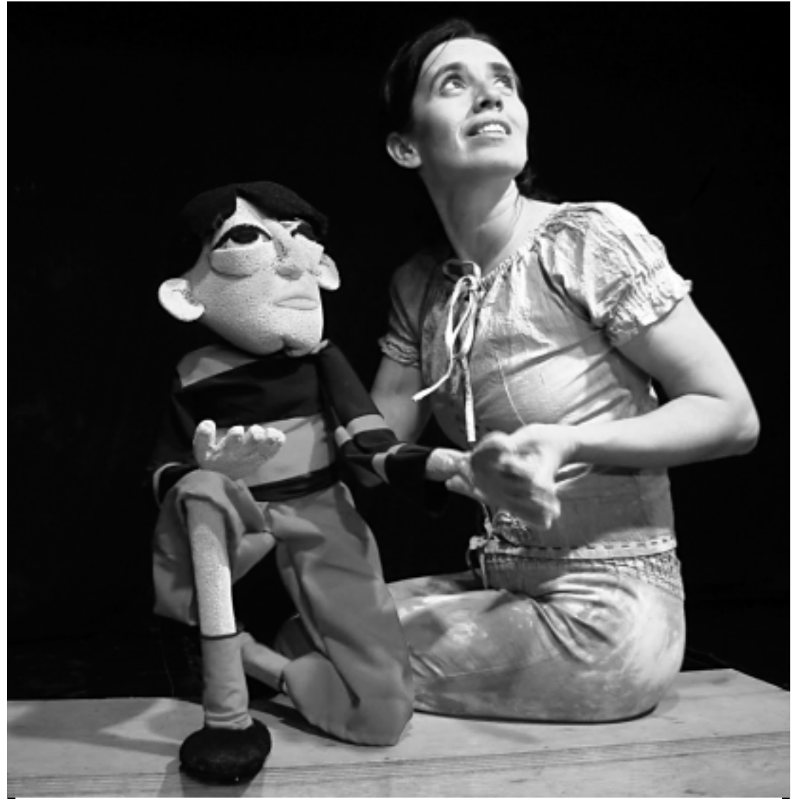
O espetáculo infantil Zé Lins - O Pássaro e o Poeta será apresentado hoje, às 15h30, no Teatro Paulo Pontes, com entrada grátis

Para os cinéfilos admiradores da obra de José Lins do