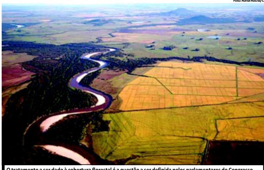
O tratamento a ser dado à cobertura florestal é a questão a ser definida pelos parlamentares do Congresso

Entre as obras que conseguiram avançar, ainda que parcialmente, estão a construção de adutoras na Bahia e no Ceará, com R$ 90 milhões pagas.