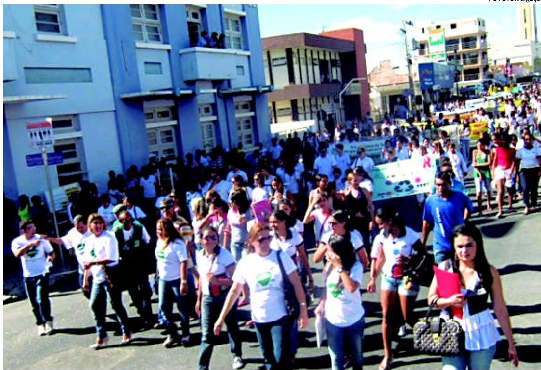
O evento contou com a participação de escolas públicas e particulares, além de representantes de entidades

Também como parte das comemorações da semana do meio ambiente da Emlur, os agentes de limpeza e demais servidores da autarquia receberam o projeto Cine Volante da Fundação Cultural de João Pessoa (Funjope). A sessão do 'Cine Verde' apresentou grandes produções que abordam a temática da preservação.