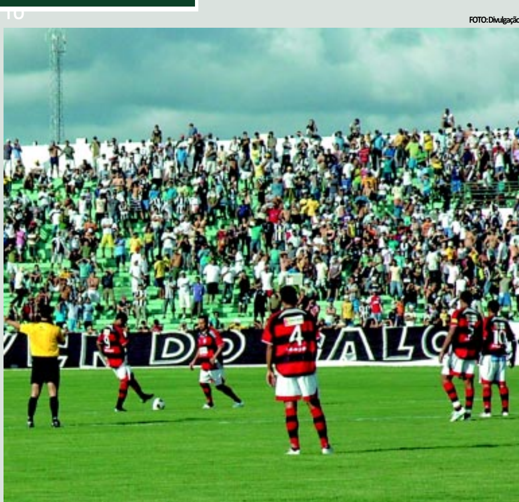
Em 2008, a equipe fez uma excelente campanha na Série C e conseguiu o acesso para 2009