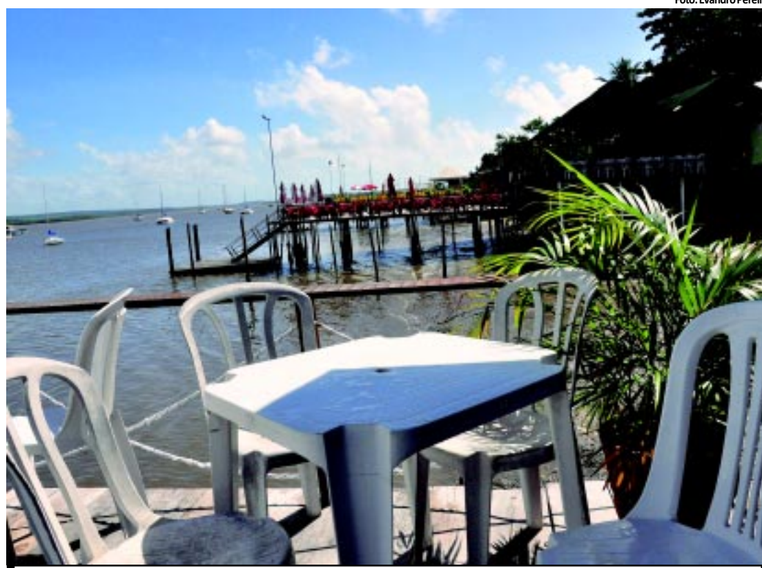
Barracas da Praia do Jacaré seriam retiradas hoje por determinação do Ministério Público

rodovia nas proximidades de uma das 15 passarelas do Estado construídas justamente para evitar os acidentes. Danos causados aos pedestres podem ser cobertos pelo seguro do DPVAT. Em caso de morte, os herdeiros da vítima recebem um valor relativo a 40 salários mínimos. PÁGINA 9