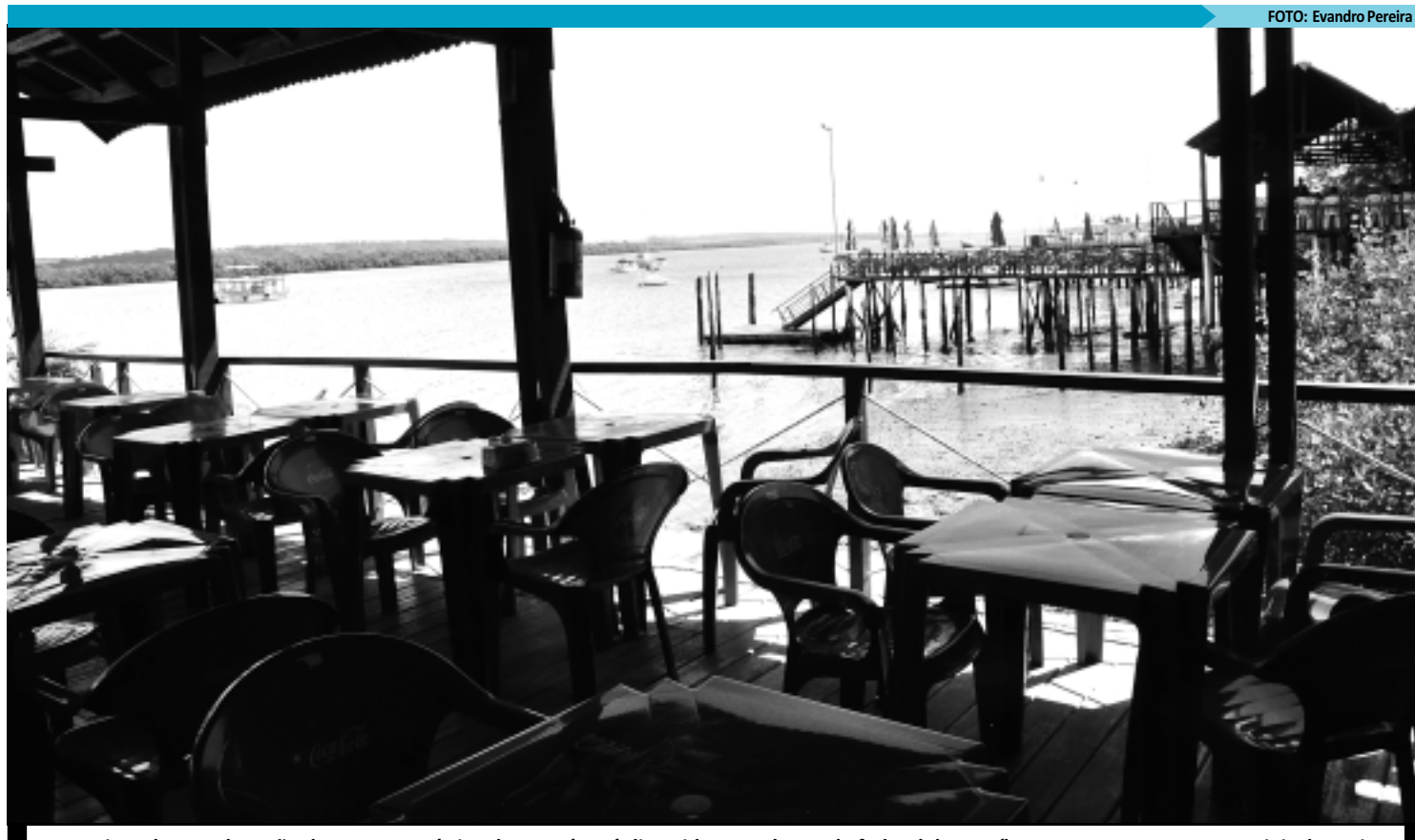
Um Projeto de Reordenação do Parque Turístico do Jacaré será discutido entre bancada federal da Paraíba e representantes comerciais da praia

"Pretendemos expor o projeto do Parque Turístico do Jacaré, na presença de toda a bancada federal da Paraíba. Acreditamos que com este comparecimento, ficará ainda mais fácil a liberação dos re-