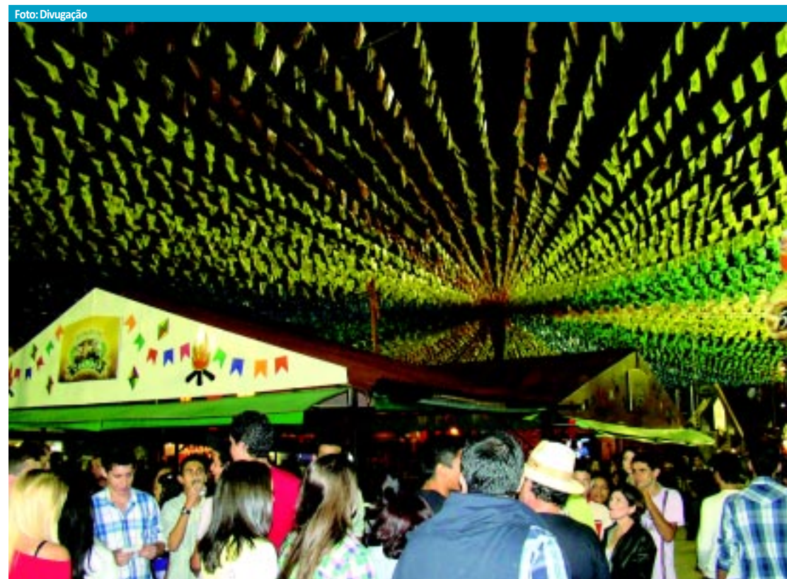
PARQUE DO POVO

Começou ontem o arrasta-pé em Campina Grande; na programação de hoje tem Amazan e Alcimar Monteiro