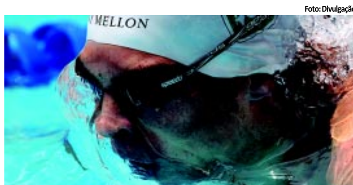
Nadador está testando o desempenho antes do Mundial

versários Takeshi Matsuda e Ryusuke Takada no mais famoso circuito europeu de natação: o Mare Nostrum começa hoje, em Barcelona. PÁGINA 14