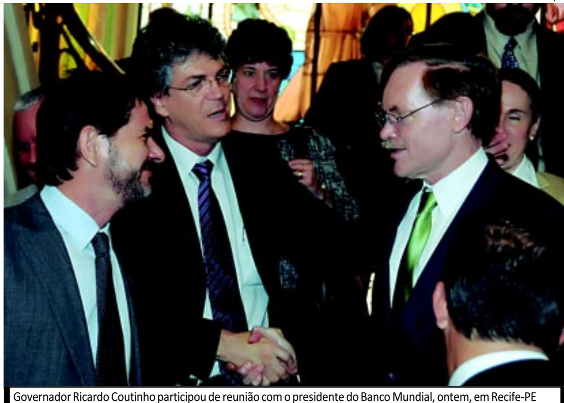
Governador Ricardo Coutinho participando de reunião com o presidente do Banco Mundial, ontem, em Recife-PE

O governador Ricardo Coutinho espera que nos próximos cinco anos a Paraíba tenha uma taxa mais baixa de analfabetismo, com mais crianças alfabetizadas e com acesso a internet; uma incidência menor de câncer no colo do útero e mais beneficiários do Bolsa Família articulados com a produção local dos municípios. Em uma segunda etapa serão lançados editais específicos para a instalação de academias de ginásticas nas praças ou locais públicos nos municípios e de ginásios esportivos.