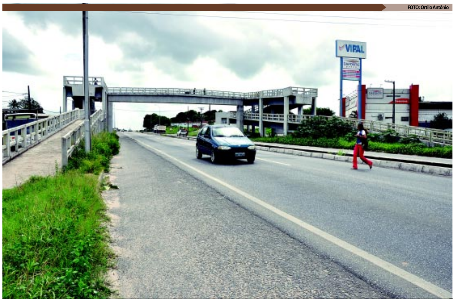
Muitos pedestres são flagrados atravessando as rodovias em locais inadequados e, pior, próximos a equipamentos como as passarelas feitas para isso

PASSARELAS - De acordo com o Departamento Nacional de Infraestrutura de Transportes