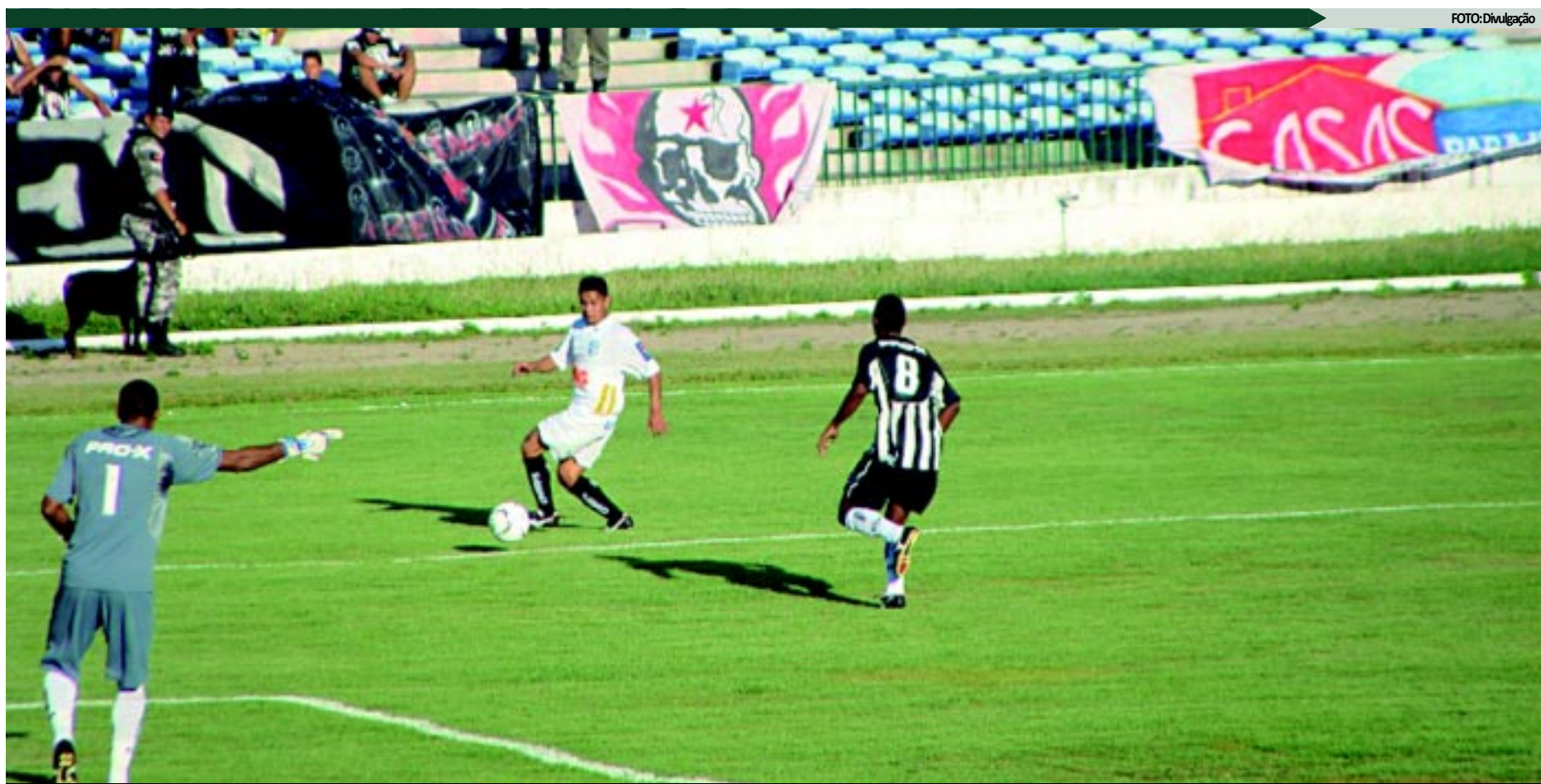
O Botafogo aguarda que o TJD obrigue a Federação Paraibana de Futebol a marcar as finais da segunda fase contra o Campinense e o Treze ganha tempo para aguardar decisões

Mais recentemente o Treze foi punido com a perda dos pontos e não pode ter o título homologado.