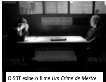
O SBT exibe o filme Um Crime de Mestre

07h30 - Bíblia em Foco 08h00 - Fala Brasil Especial 09h45 - Esporte Fantástico 12h00 - Correio Verdade 13h45 - Correio Esportes 14h00 - Record Kids 16h00 - Cine Aventura: Ela é o Cara 17h15 - O Melhor do Brasil 18h45 - Jornal da Record 19h15 - O Melhor do Brasil (Continuação) 22h45 - Legadário 00h30 - 50 por 1 00h15 - Programação IURD OBS. Programação sujeita à mudança