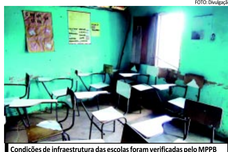
Condições de infraestrutura das escolas foram verificadas pelo MPPB