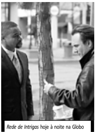
Rede de Intrigas hoje à noite na Globo

21h10 - Insensato Coração 22h15 - Zorra Total 23h15 - Supercine: Rede de Intrigas 01h00 - Altas Horas 03h00 - The Cleveland Show 03h25 - Corujão