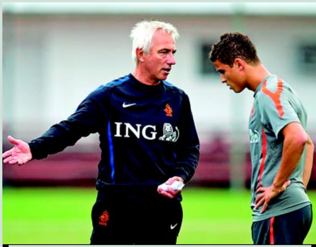
O técnico Bert van Marwijk encara a partida contra o Brasil como um grande teste para 2014