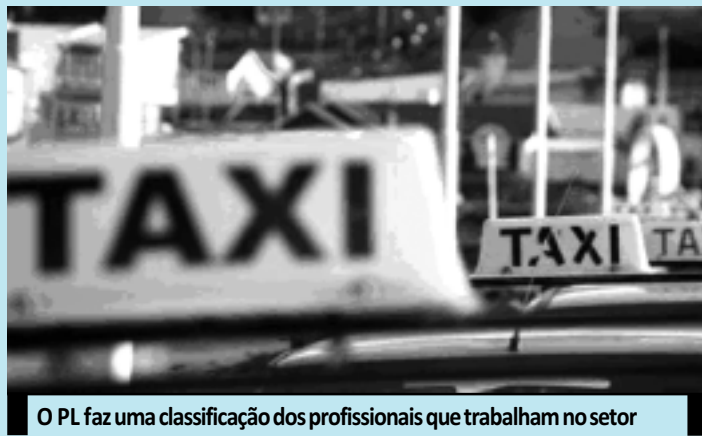
O PL faz uma classificação dos profissionais que trabalham no setor

A proposta classifica os taxistas como autônomo, empregado, auxiliar de condutor autônomo e locatário. Os taxistas empregados terão direito a piso salarial ajustado pelo sindicato da categoria e à aplicação das normas presentes na Consolidação das Leis do Trabalho (CLT) e no Regime Geral da Previdência Social. Nos contratos entre o condutor autônomo e seus auxiliares, deverão constar as condições e requisitos