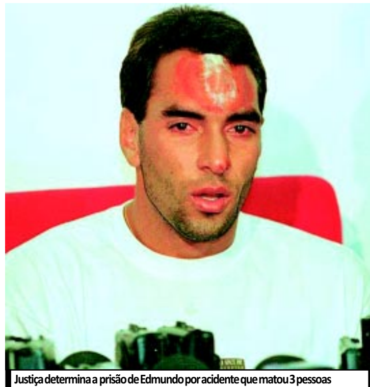
Justiça determina a prisão de Edmundo por acidente que matou 3 pessoas

HISTÓRICO DE INFRAÇÕES - Ídolo das torcidas de Vasco, Palmeiras e Flamengo, o ex-jogador e atual comentarista esportivo Edmundo Alves de Souza Neto, o "Animal", frequentou mais de uma vez as manchetes policiais por infrações de trânsito. O episódio mais grave foi um acidente ocorrido em 1995, no qual mor-