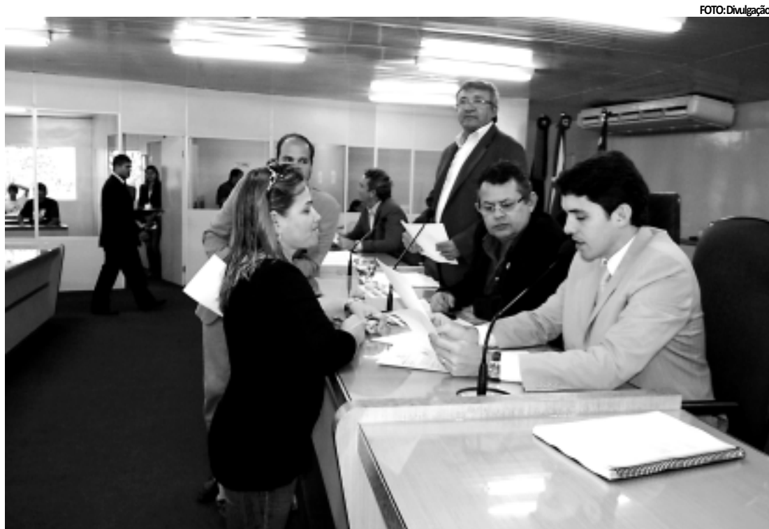
Câmara Municipal de Campina Grande aprovou o aumento no número de vereadores de 15 para 23 a partir de 2013