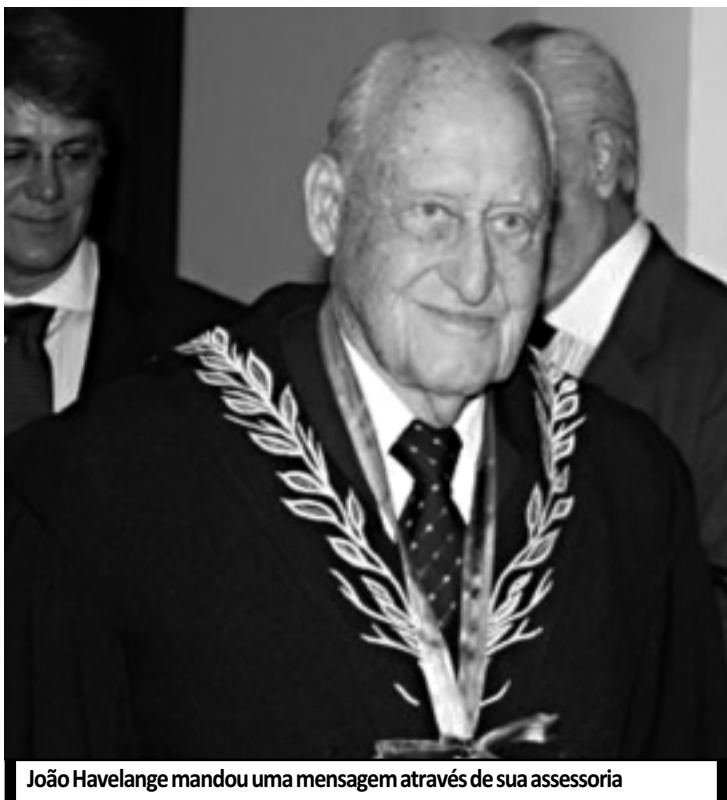
João Havelange mandou uma mensagem através de sua assessoria