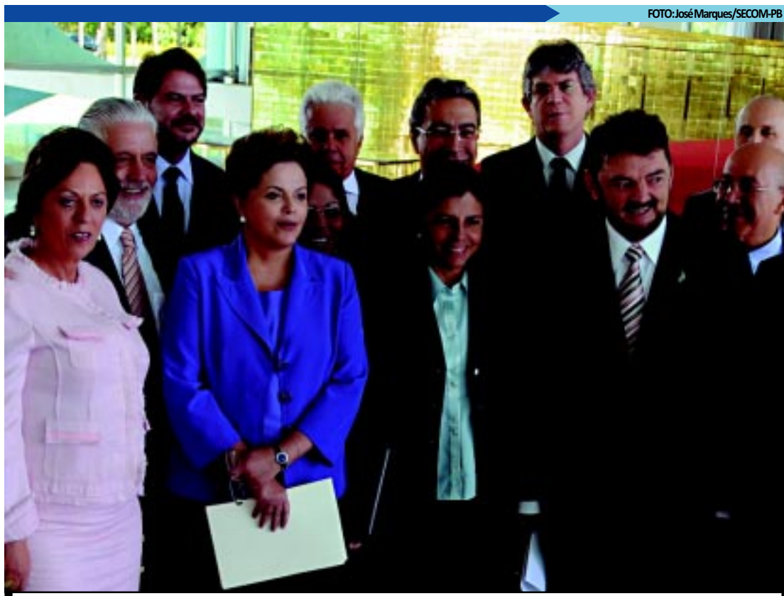
Documento entregue à presidente Dilma tenta pôr fim à guerra fiscal dos Estados para atrair a instalação de indústrias

"Se nós vamos ter um ICMS em que majoritariamente será repassado para o destino, restarão esses tributos para avançar no processo de industrialização das regiões menos desenvolvidas. Há uma concordância do Governo Federal de apresentar uma proposta na perspectiva de uma política de desenvolvimento regional", ressaltou.