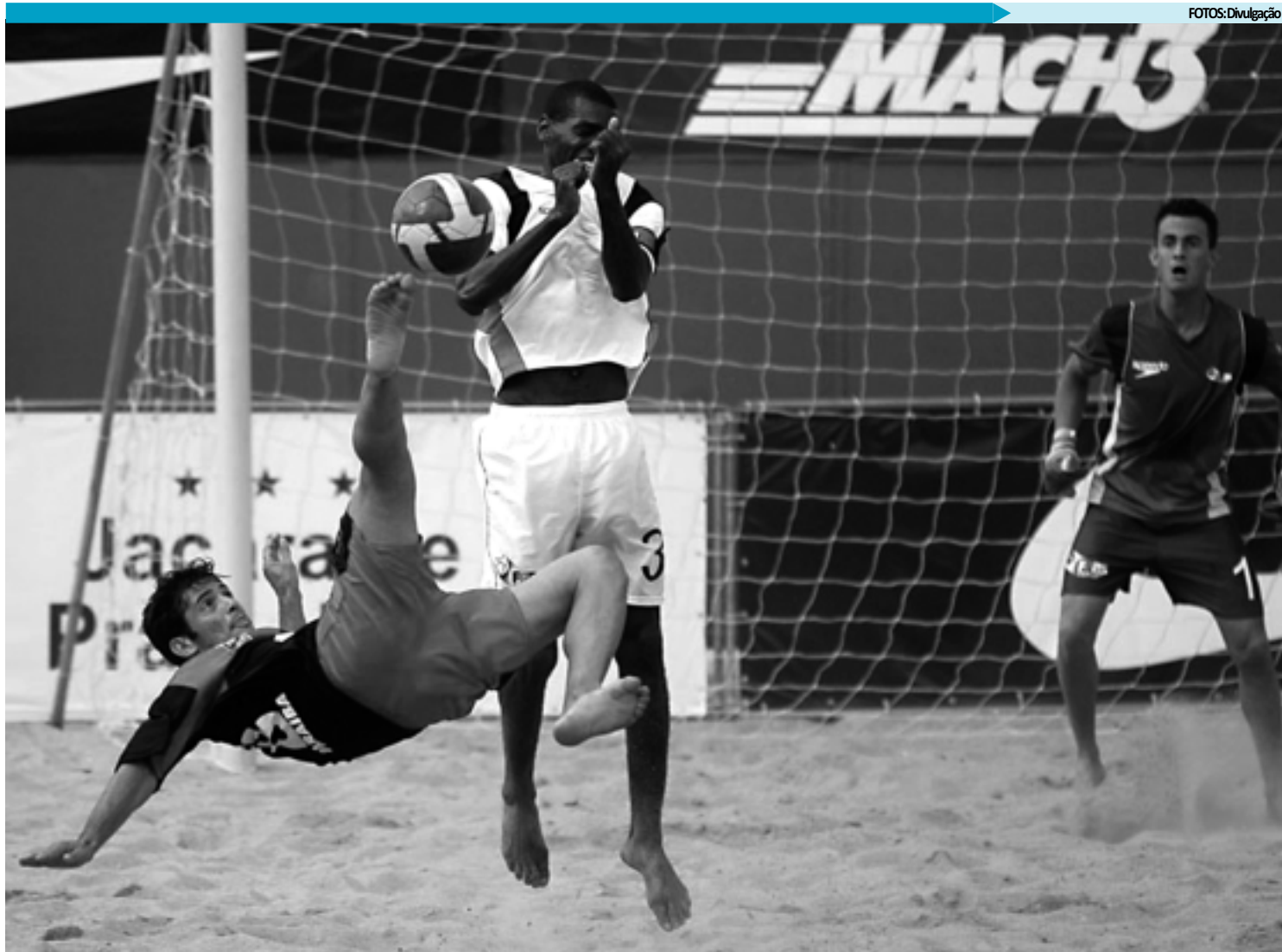
Principal disputa da modalidade no Estado começa dia 2 de julho e este ano terá a participação de 6 clubes, inclusive do Botafogo, que estreia nas areias

No entanto, uma nova era na modalidade se iniciou no Brasil, com uma avalanche de times profissionais invadindo as areias, como o Vasco, Flamengo e o Corinthians. O Nordeste também não ficou de fora e clubes como Vitória e Bahia (Bahia), Santa Cruz (Pernambuco), Sampaio Correa (Maranhão). Na Paraíba, o Botafogo segue essa tendência e investiu pesado visando competições nacionais.