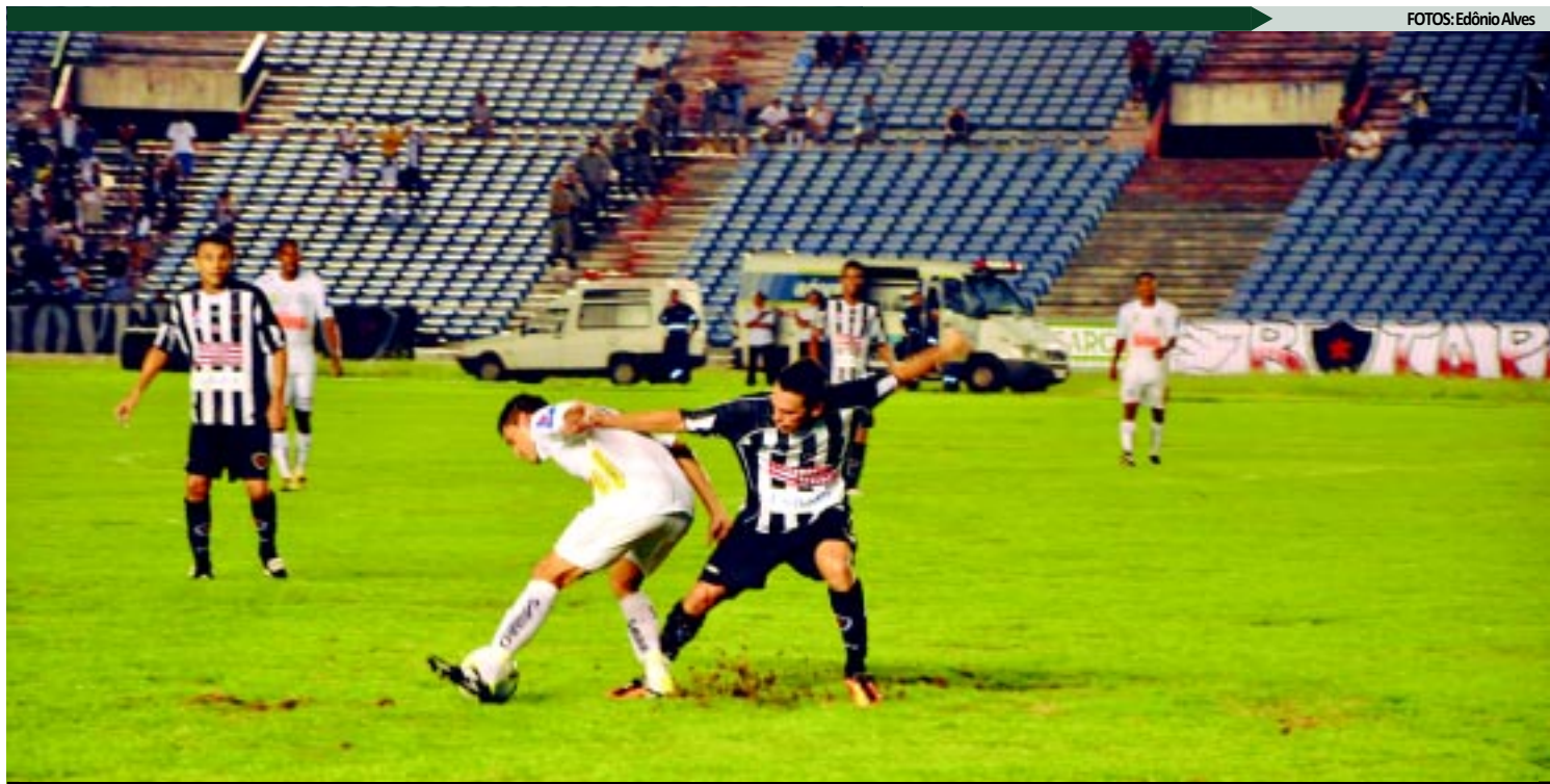
O jogo do dia 8 de maio continua rendendo bastante na Justiça Desportiva e, hoje, acontece mais um julgamento, desta vez no STJD