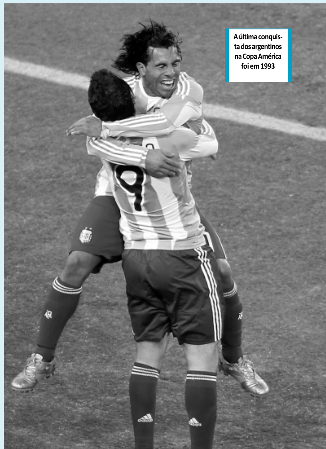
A última conquista dos argentinos na Copa América foi em 1993

Os dois principais aeroportos da Argentina chegaram a se preparar, na segunda-feira à noite, para a reabertura dos terminais, mas uma mudança nos ventos levou as cinzas vulcânicas novamente para a região. No fim de terça-feira, os voos para Buenos Aires foram retomados pelas empresas brasileiras Gol e TAM, com a ressalva de que as operações podem voltar a ser suspensas se houver novos problemas com as nuvens vulcânicas.