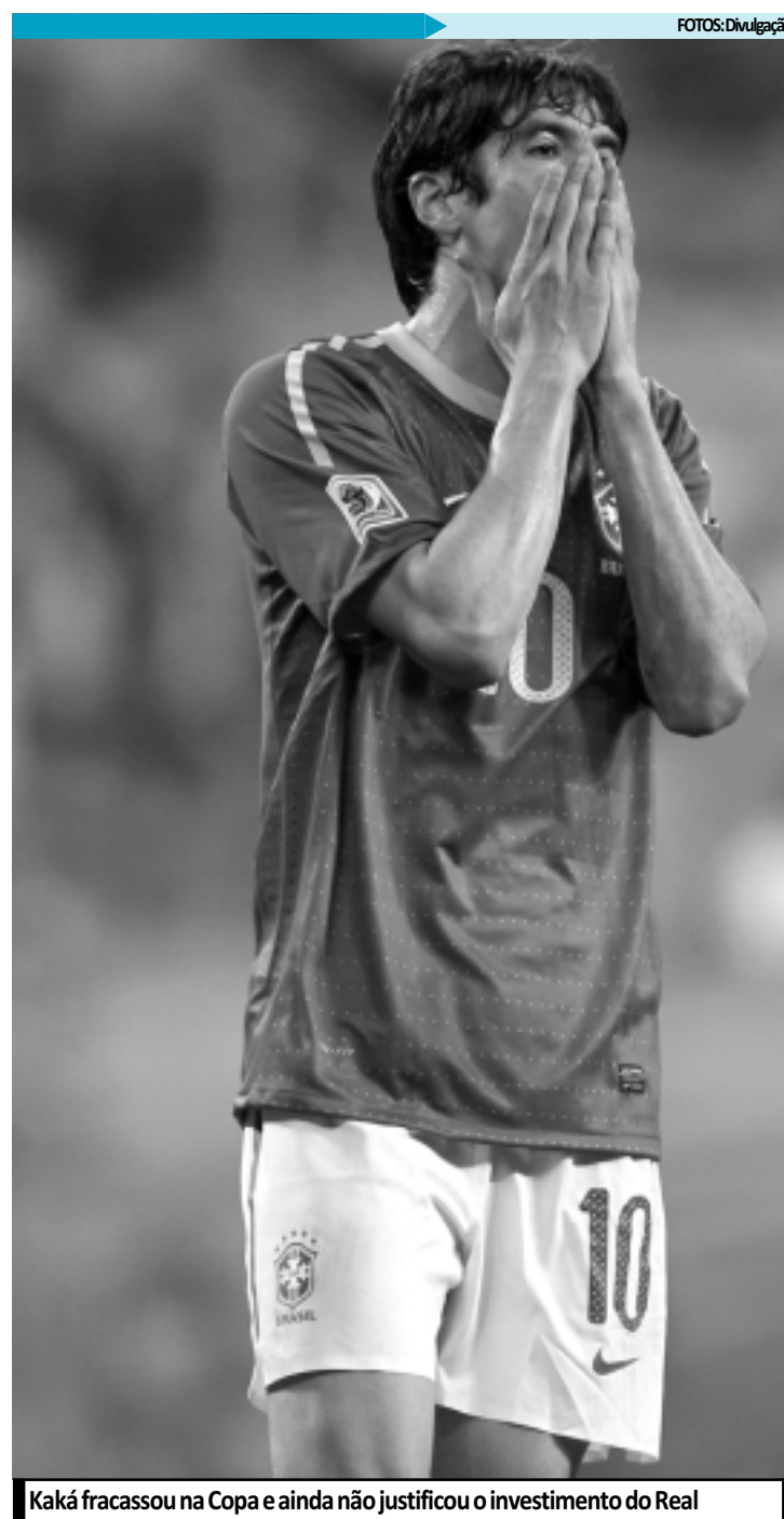
Kaká fracassou na Copa e ainda não justificou o investimento do Real

"Não caí da cadeira quando li sobre o interesse do Barcelona pelo Thiago Silva", disse Galliani.