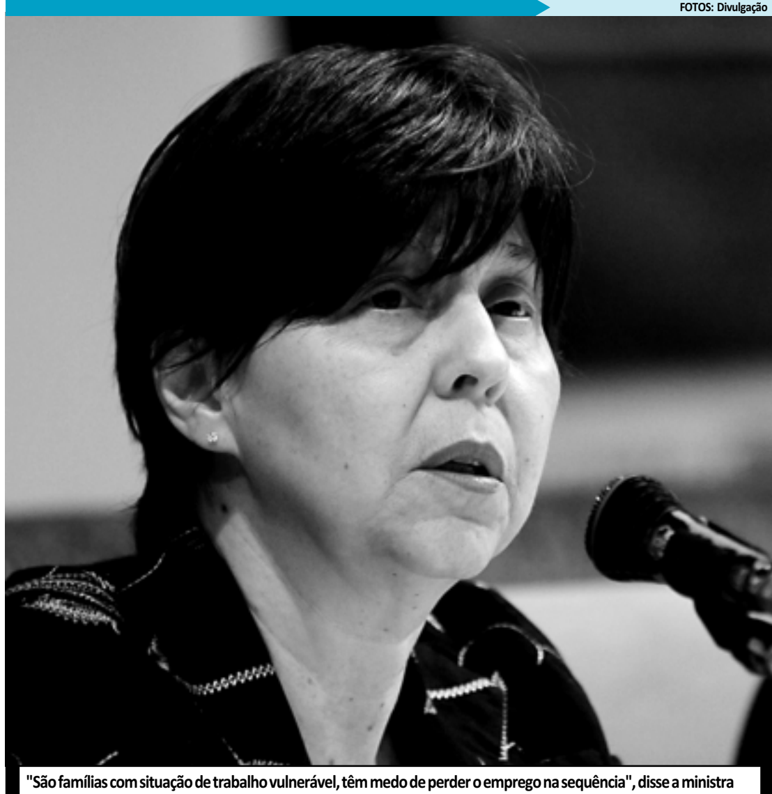
"São famílias com situação de trabalho vulnerável, têm medo de perder o emprego na sequência", disse a ministra

A ministra lembrou que uma das estratégias do governo é ampliar de três para sete o número de filhos que poderão ser considerados no cálculo do benefício do Bolsa Família. Desses sete, cinco são crianças com até 15 anos e dois, para adolescentes entre 15 e 17 anos. Outras medidas preveem a inclusão produtiva e maior oferta de serviços públicos.