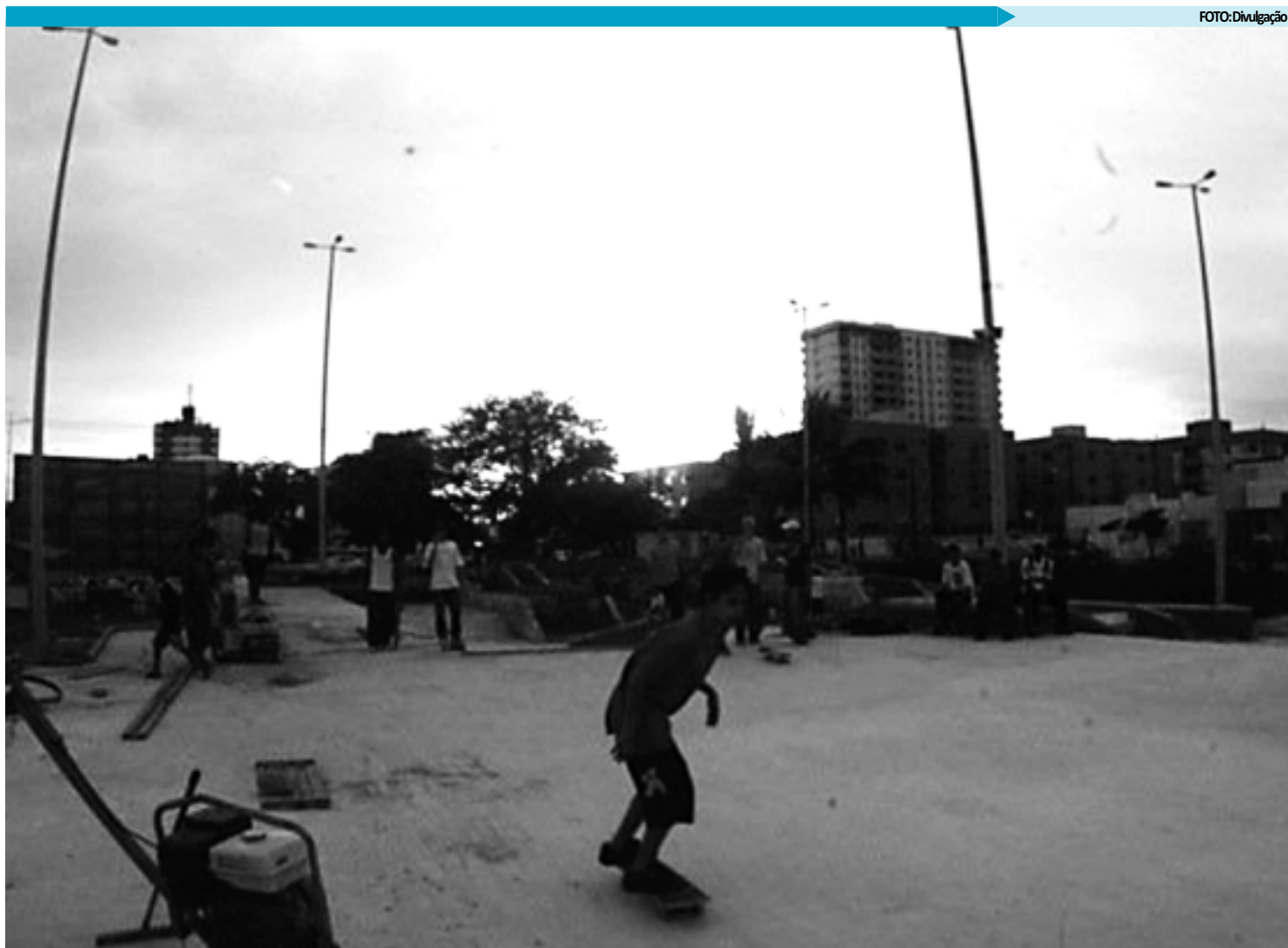
Dezenas de skatistas prometem manobras radicais hoje na pista Skate Plaza em Manáira para comemorar o Dia Mundial da modalidade