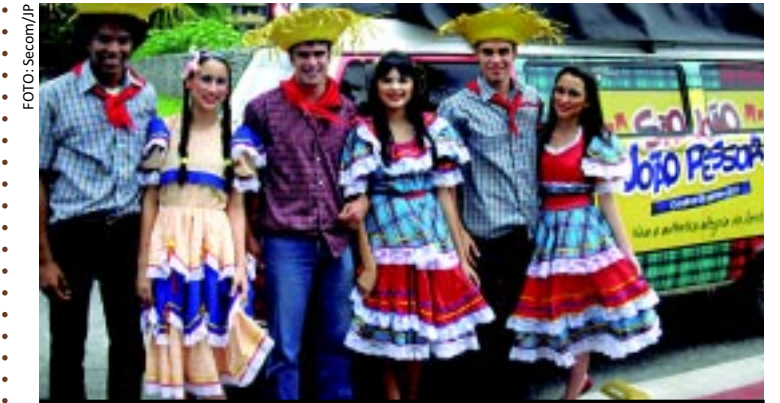
[FOTO&LEGENDA] O clima junino está nas ruas da Capital. É que a Secom e a Funjoje iniciaram a divulgação da programação do "São João de João Pessoa - O Melhor da Gente" através de uma kombi recheada de forró que está visitando diversos pontos da cidade.