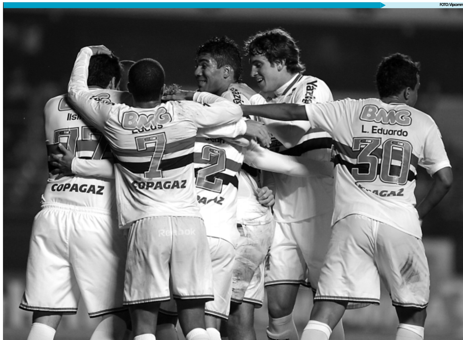
Jogadores do São Paulo atravessam um bom momento no Campeonato Brasileiro, conquistando vitórias em casa e mesmo longe de seus domínios no Campeonato Brasileiro de 2011

Um dos novatos no Brasileiro, o Figueirense segue