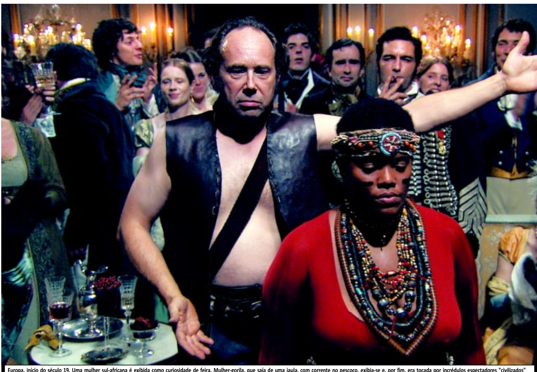
Europa, início do século 19. Uma mulher sul-africana é exibida como curiosidade de feira. Mulher-gorila, que saía de uma jaula, com corrente no pescoço, exibia-se e, por fim, era tocada por incrédulos espectadores "civilizados"

"Além disso, convém dizer, existe uma atualidade política em toda essa história", destaca Kechiche. Ele recorda que o discurso "científico"