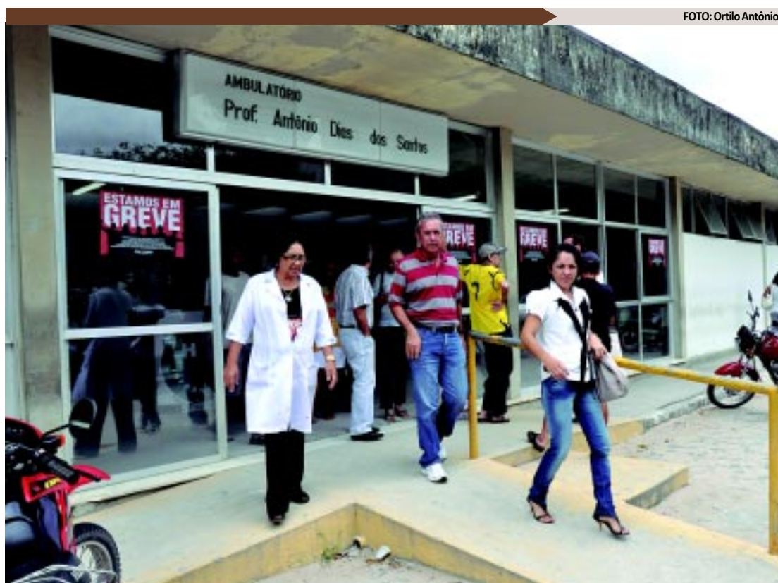
Fluxo de pacientes no ambulatório do Hospital Universitário Lauro Wanderley é intenso, mas atendimentos serão suspensos

dos trabalhadores a mudança no Anexo IV (incentivos de qualificação), devolução do vencimento básico complementar absorvido, isonomia salarial e de benefícios, contra a terceirização, revogação