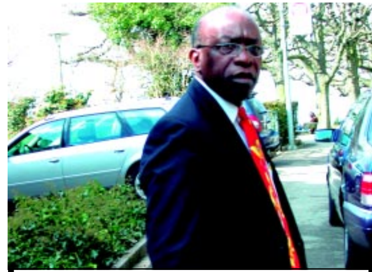
Vice da Fifa renuncia e investigação de corrupção acaba em pizza

tel Hotel Reserva Cardales, que fica a 60km de Buenos Aires. Além da Venezuela, adversário da estreia, a equipe de Mano Menezes vai encarar o Paraguai, no dia 9 de julho, e o Equador, quatro dias depois. As duas partidas serão em Córdoba.