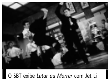
O SBT exhibe Lutar ou Morrer com Jet Li

19h00 - Rebelde 19h55 - Jornal da Correo - Edição da Noite 20h25 - Jornal da Record 21h15 - Série: CSI Investigação Criminal 22h15 - Novela: Vidas em Jogo 23h15 - Ídolos 00h15 - Série: CSI Miami 01h15 - Programação IURD OBS. Programação sujeita à mudança