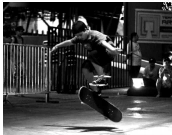
Durante o Game Skate, disputas com base nos fundamentos