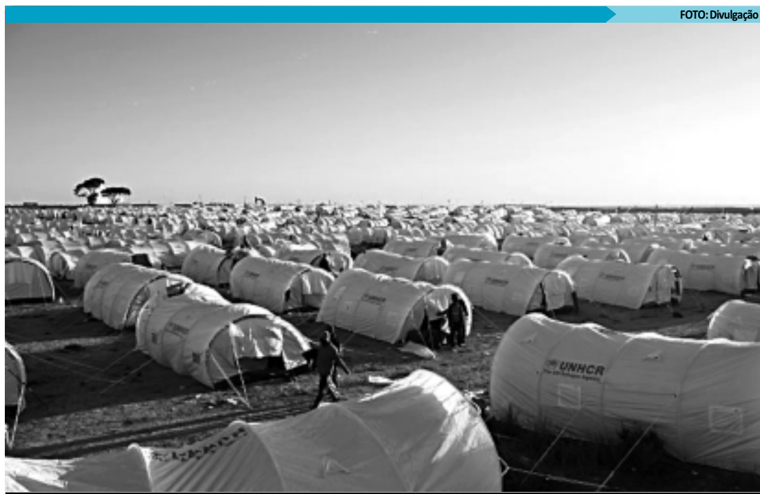
Acampamento de refugiados, na Tunísia, próximo à fronteira com a Líbia, país que desde janeiro passa por conflitos

Em um relatório divulgado nesta segunda-feira, no Dia Mundial do Refugiado, o Alto Comissariado da ONU para os Refugiados (Acnur) afirmou que os países em desenvolvimento receberam quatro quintos dos 15,4 milhões de refugiados no mundo. Na Líbia, por exemplo, quase 1 milhão de pessoas -