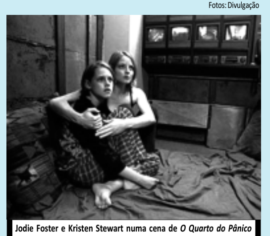
Jodie Foster e Kristen Stewart numa cena de O Quarto do Pânico

>>> O QUARTO DO PÂNICO - Recém-divorciada, Meg Altman vai morar com sua filha Sarah em uma nova casa. Quando três homens em casa invadem o local à procura de uma fortuna escondida, as duas se escondem em um quarto blindado, feito especialmente para essas emergências, de onde possível monitorar todo o lugar. Mas Meg, que sofre de claustrofobia, nem imagina que os bandidos buscam o algo que está dentro deste quarto. SE LIGUE: Hoje, às 23h50, no HBO Plus