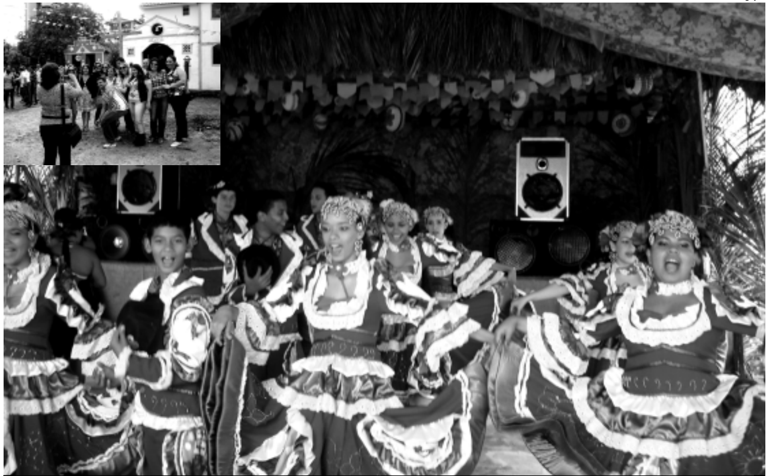
Quadrilha junina se apresentou durante a visita ao sítio São João de Campina Grande, onde turistas não pouparam os cliques para fotografias

A SES estará ainda fazendo avaliação de peso, altura e índice de massa corporal (IMC), com orientação nutricional, enfatizando a importância de hábitos de vida saudável. Os policiais também serão vacinados contra a gripe sazonal e H1N1, hepatite B e Tétano.