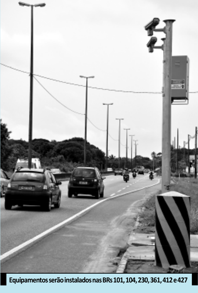
Equipamentos serão instalados nas BRs 101, 104, 230, 361, 412 e 427