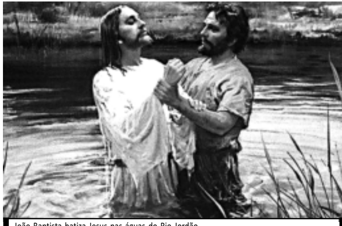
João Baptista batiza Jesus nas águas do Rio Jordão

Mas para São João, Jesus só tinha elogios e admiração: “o maior profeta de todos os tempos”. Hoje, ele merece deferências e reflexões. E menos fogueiras e foguetões.