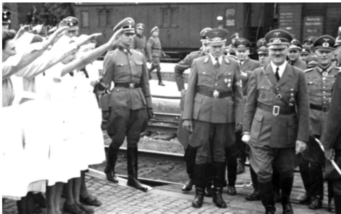
Hitler é saudado por enfermeiras alemãs em uma das fotos, até então desconhecida para o mundo

O Brasil também aparece como opção para espanhóis de alta formação. Um estudo elaborado pela consultora Adecco e pela Universidade de Navarra indica que os espanhóis com alto grau de formação e que também foram atingidos pela crise colocam o Brasil como um dos seis destinos preferidos para emigrar por emprego. O mercado brasileiro é visto como opção para 55% dos entrevistados, junto com Alemanha, França, Grã-Bretanha, Estados Unidos e Argentina. Homens, entre 25 e 35 anos, com formações em engenharia, arquitetura, informática, medicina, biologia e investigação científica são o perfil médio dos interessados em cruzar o Atlântico.