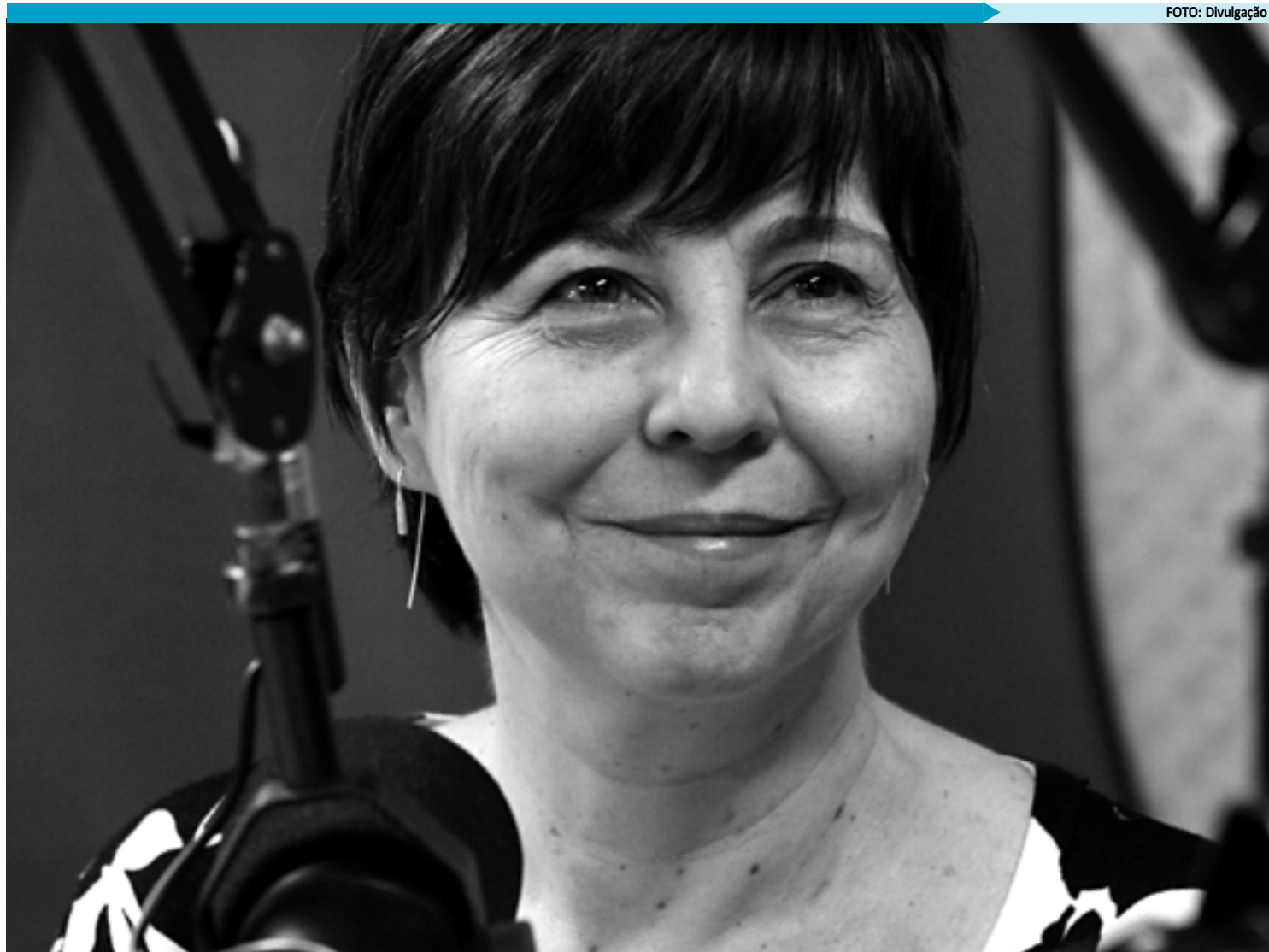
Mais 15 mil beneficiários dos programas sociais do governo vão ser contemplados com essa capacitação nos próximos 15 dias, segundo a ministra

A ministra Tereza Campello disse que espera "contar com o trabalho de todos os setores que podem ajudar a tirar da extrema pobreza, nos próximos quatro anos, 16,2 milhões de pessoas". Ela não acredita que a movimentação do ano eleitoral em 2012 venha reduzir o ritmo dessa cooperação, uma vez que o MDS conta com a promessa de participação ampla dos segmentos estaduais e municipais.