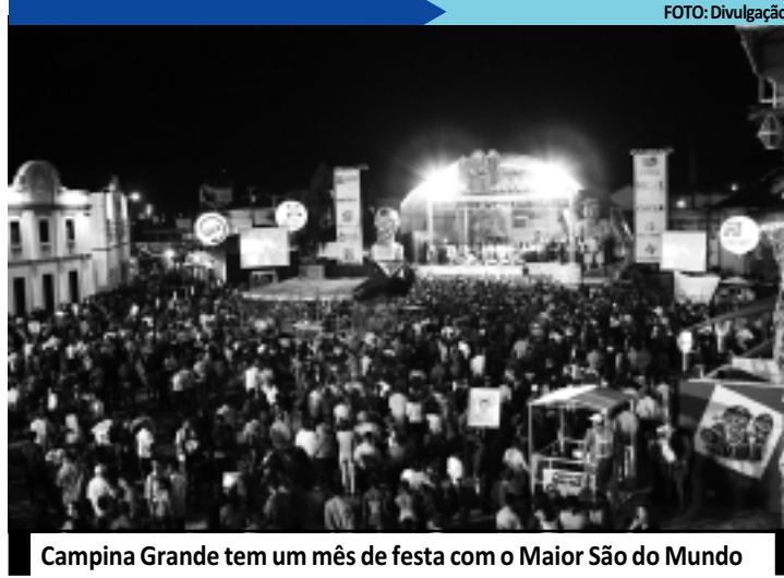
Campina Grande tem um mês de festa com o Maior São do Mundo