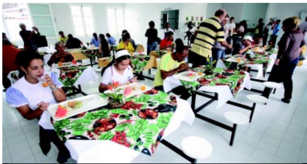
Muita gente prestigiou o primeiro dia de funcionamento do Restaurante que forneceu mil refeições

No primeiro dia aberto ao público, o Restaurante Popular de Campina Grande lotou e forneceu mil refeições. Catadores de material reciclável, comerciantes, ambulantes, trabalhadores da indústria, estudantes e desempregados elogiaram a qualidade e o preço do prato de comida, em R$ 1. O equipamento fica localizado na Avenida Floriano Peixoto, no Centro, ficou aberto até 13h.