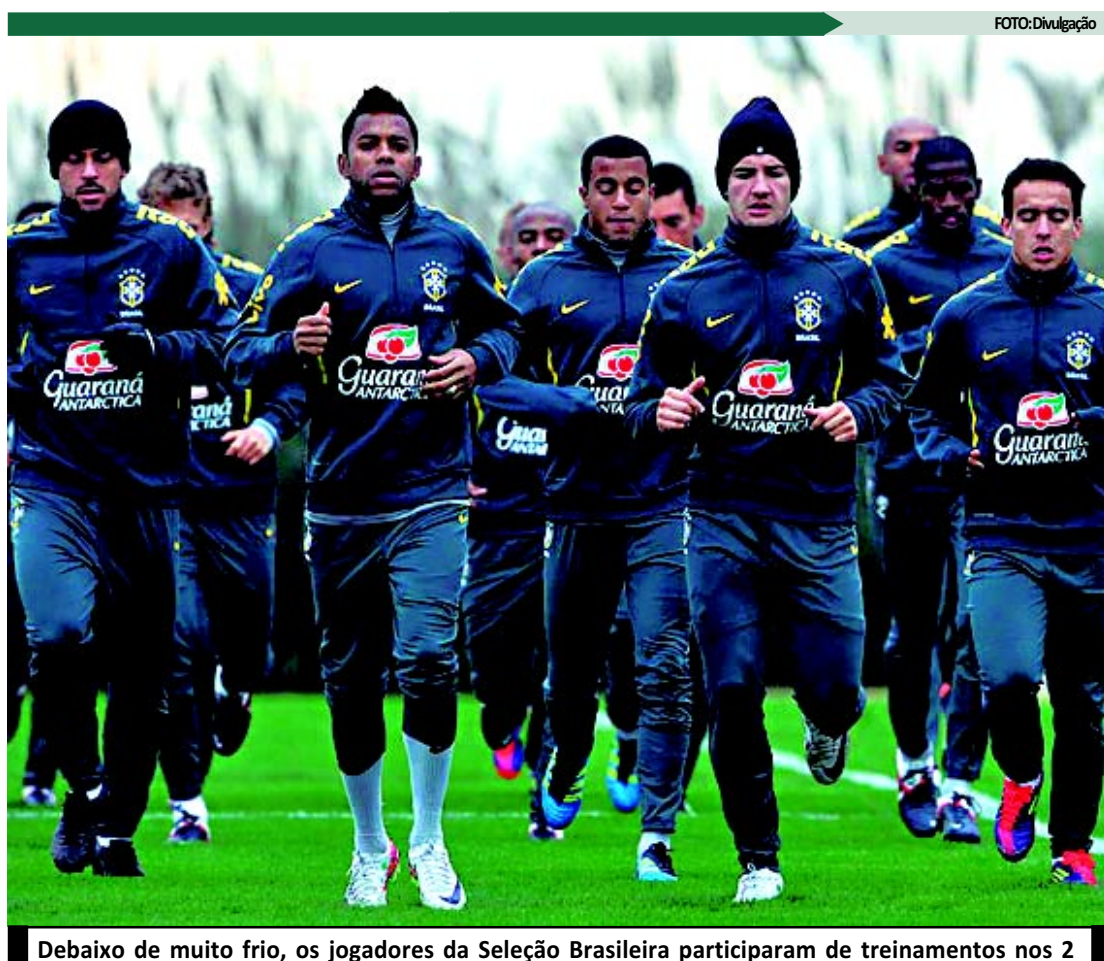
Debaixo de muito frio, os jogadores da Seleção Brasileira participaram de treinamentos nos 2 turnos