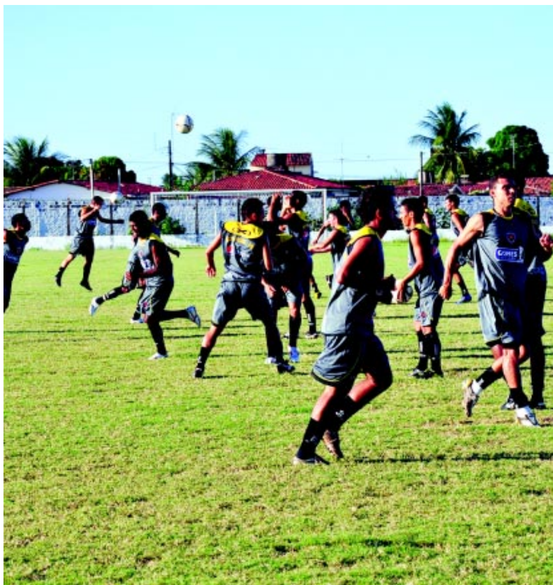
Sem jogos oficiais pelo Campeonato, o clube vem arcando com despesas altas com jogadores e funcionários