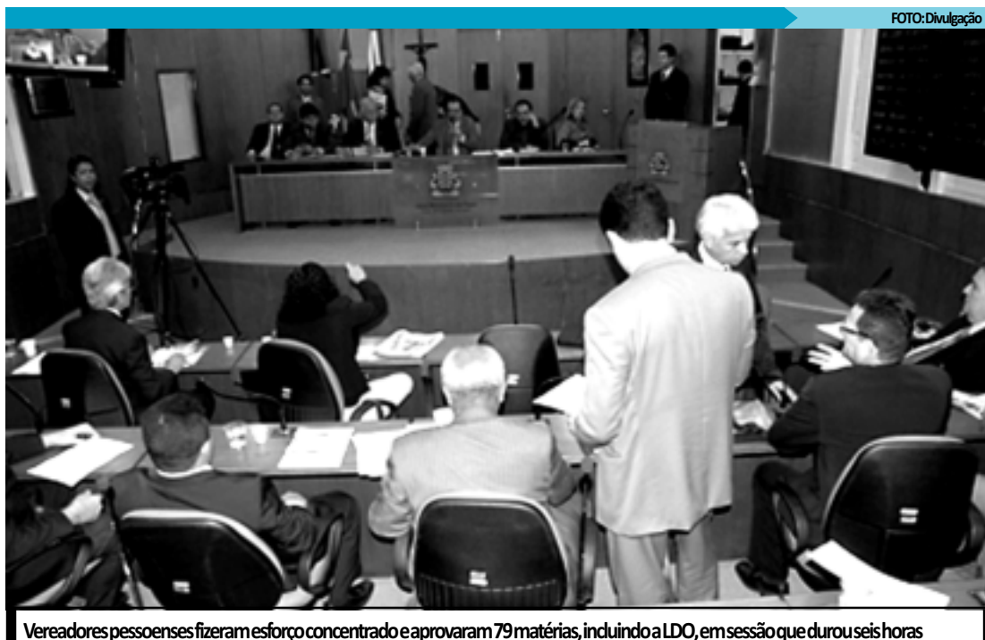
Vereadores pessoenses fizeram esforço concentrado e aprovaram 79 matérias, incluindo a LDO, em sessão que durou seis horas