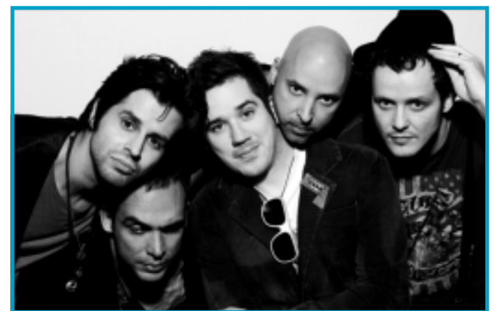
POP ROCK NA DOMUS HALL