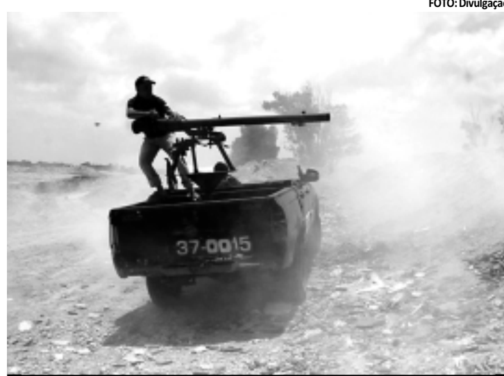
Rebelde em ação contra forças de Muamar Kadafi, próximo a Misrata

Uma coalizão internacional liderada pela França, Reino Unido e Estados Unidos iniciou em 19 de março ataques aéreos na Líbia, sob mandato da ONU,