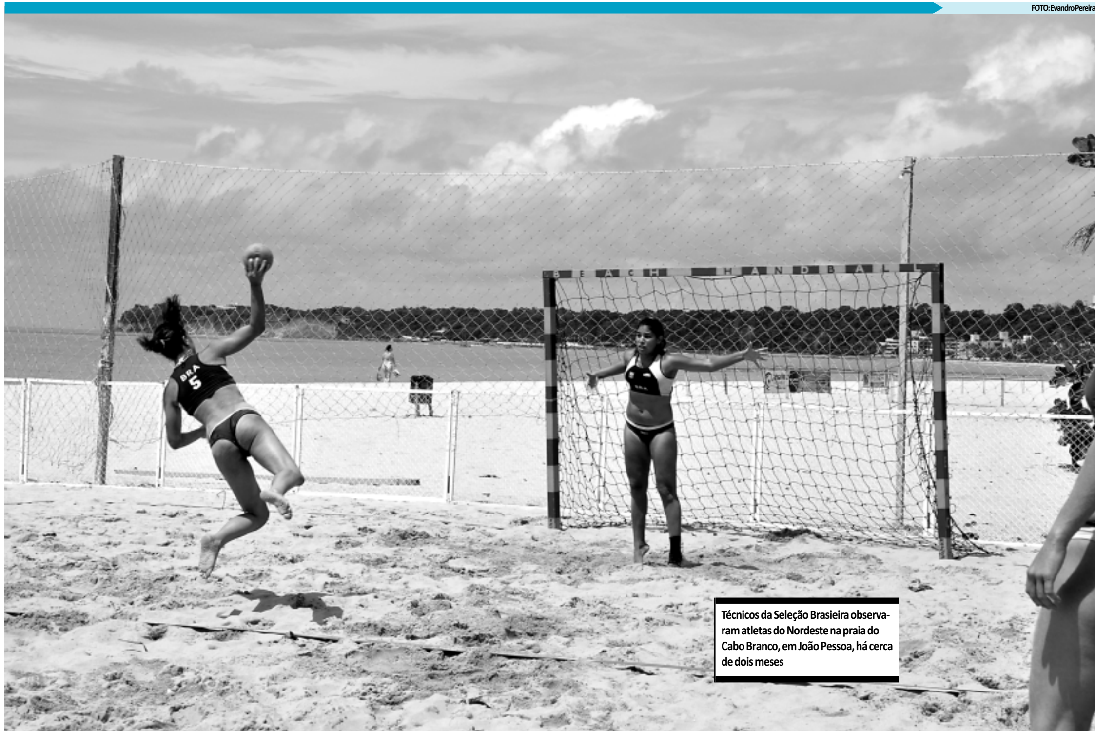
Técnicos da Seleção Brasileira observaram atletas do Nordeste na praia do Cabo Branco, em João Pessoa, há cerca de dois meses