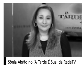
Sônia Abrão no 'A Tarde É Sua' da RedeTV