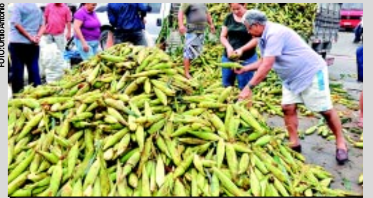
A Empasa está vendendo o milho a preços acessíveis a população

A direção do órgão acredita numa oferta de 150 toneladas do produto à disposição da população atacadista do Estado, totalizando assim um aumento de 41,51% em relação ao ano passado. Em 2010 foram disponibilizadas 106 toneladas. Segundo o presidente do ór-