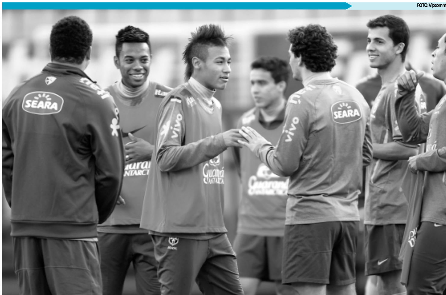
Depois de ter disputado a final da Taça Libertadores da América, o atacante Neymar vai se integrar à seleção na Argentina para a Copa América

O jornal publica ainda que a contratação de Neymar não impede que o clube também acerte com o argentino Agüero, do Atlético de Madri, mas nesse caso o Real teria de se desfazer de outro argentino, Higuaín, ou do francês