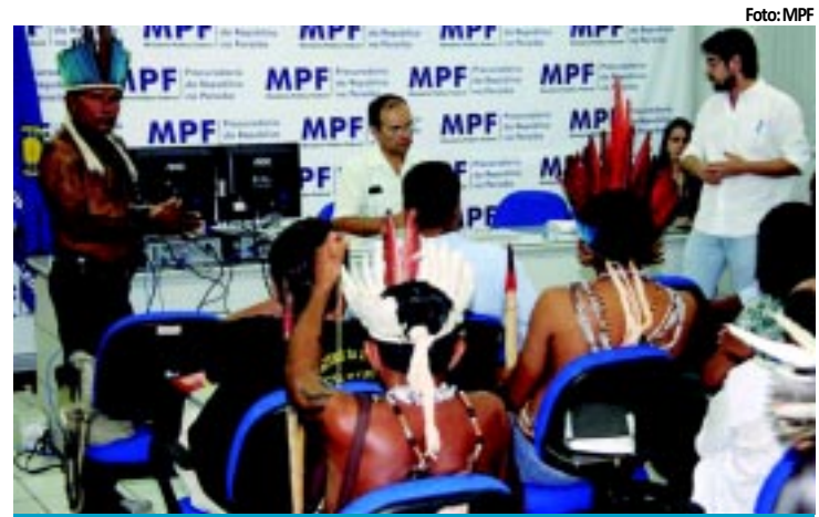
MPF discute reestruturação da Funai

teria sido morto com um tiro na cabeça. O corpo de Osama não foi mostrado e informações não oficiais dão conta que ele teria sido jogado ao mar. A morte gerou comemorações em várias cidades dos Estados Unidos. PÁGINA 7