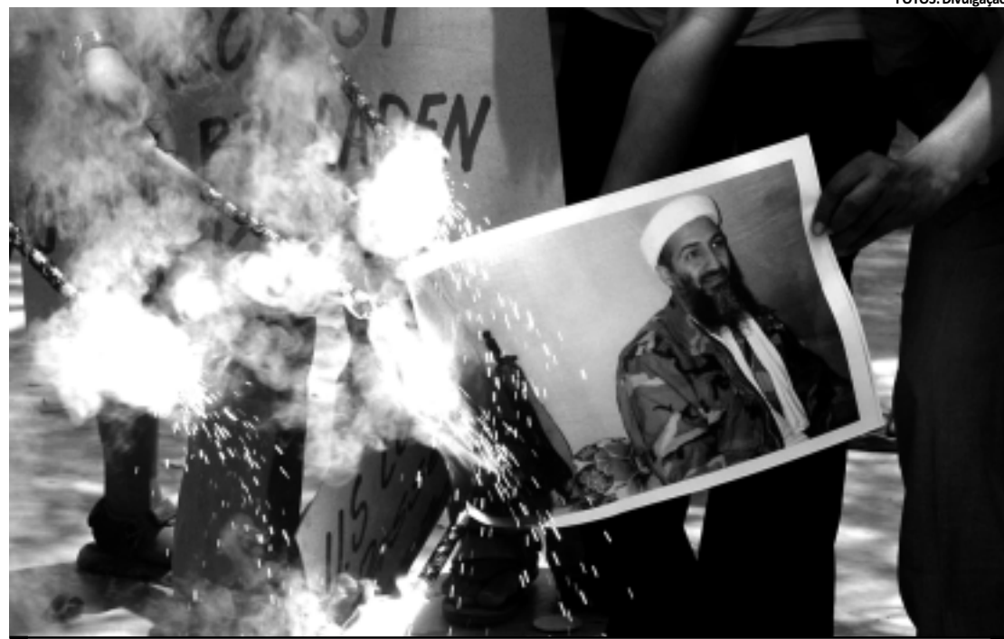
A morte do extremista foi comemorada em vários países, como na Índia, onde foram destruídas fotos de Obama

"MUNDO MAIS SEGURO" - O presidente dos Estados Unidos, Barack Obama, qualificou ontem como um "bom dia para a América". Segundo ele, o mundo está mais seguro sem o líder da Al Qaeda, Osama Bin Laden. "Nosso país manteve seu compromisso de ver que a justiça é feita. O mundo está mais seguro", disse Obama. O presidente falou na Casa Branca, onde estava concedendo, postumamente, a Medalha de Honra para dois soldados do Exército dos EUA, pela bravura destes durante a Guerra da Coreia.