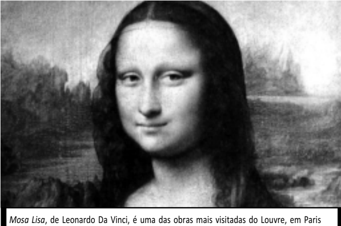
Mosa Lisa, de Leonardo Da Vinci, é uma das obras mais visitadas do Louvre, em Paris