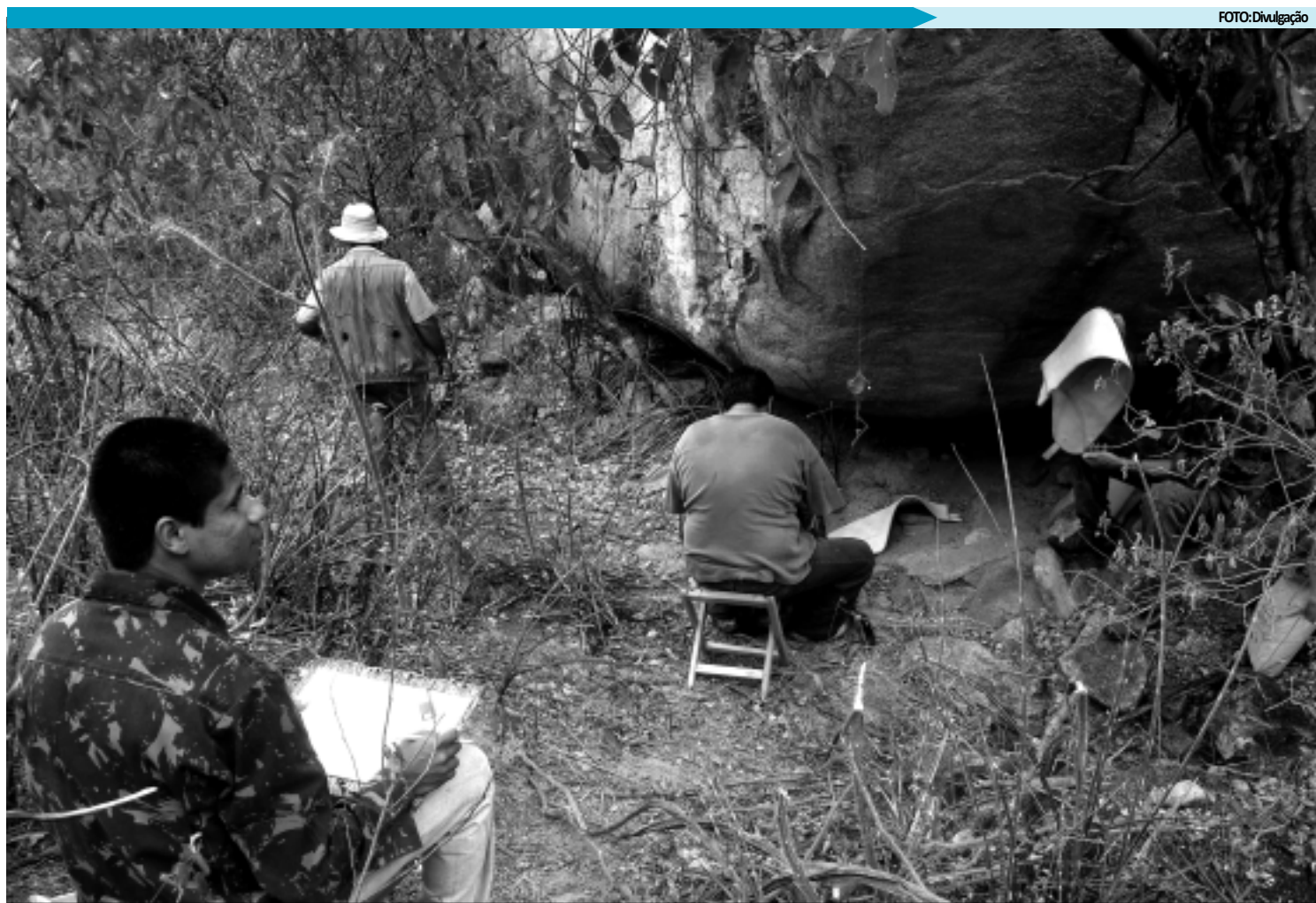
Pesquisadores visitam a Área de Proteção Ambiental das Onças, a 306 Km de João Pessoa, onde existem ossadas e inscrições rupestres importantes

mente como árvore símbolo nacional. A espécie, que já foi considerada extinta, é um marco na história do País. Entre os séculos XVI e XVIII foram cortadas oficialmente no Brasil quase 500 mil árvores, com 15 metros de comprimento. Dentre os europeus envolvidos com o comércio do pau-brasil, os holandeses foram os que mais se destacaram nessa atividade, tanto pela extração de corantes como pela utilização deles nas fábricas. O pau-brasil não foi importante apenas no início da colonização, mesmo depois da cana-de-açúcar, ele continuou sendo uma fonte de corante vermelho, fundamental para a indústria têxtil.