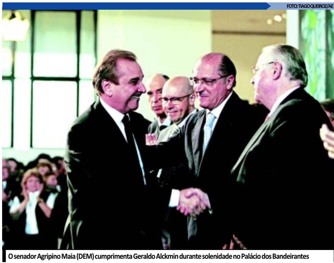
O senador Agripino Maia (DEM) cumprimenta Geraldo Alckmin durante solenidade no Palácio dos Bandeirantes

Ela chegou sábado à noite em São Paulo. No domingo, submeteu-se a uma bateria de exames no hospital. "Ela está bem, muito melhor", declarou Uip, hoje. "Nós orientamos para que ela diminua as horas de trabalho", acrescentou.