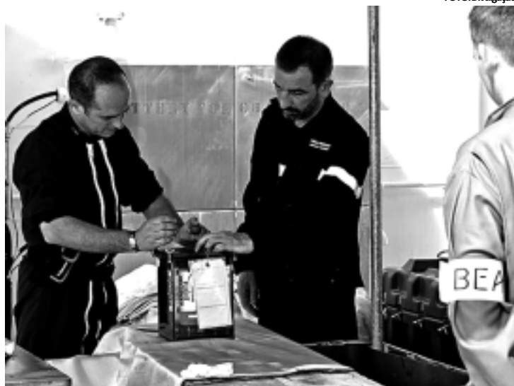
Peça recuperada no domingo dá esperança para que acidente seja solucionado

De acordo com a portaria, medidas de segurança tecnológica vão garantir que não seja violado o direito constitucional à intimidade, à vida privada, à integralidade das informações e à confidencialidade dos dados dos usuários.