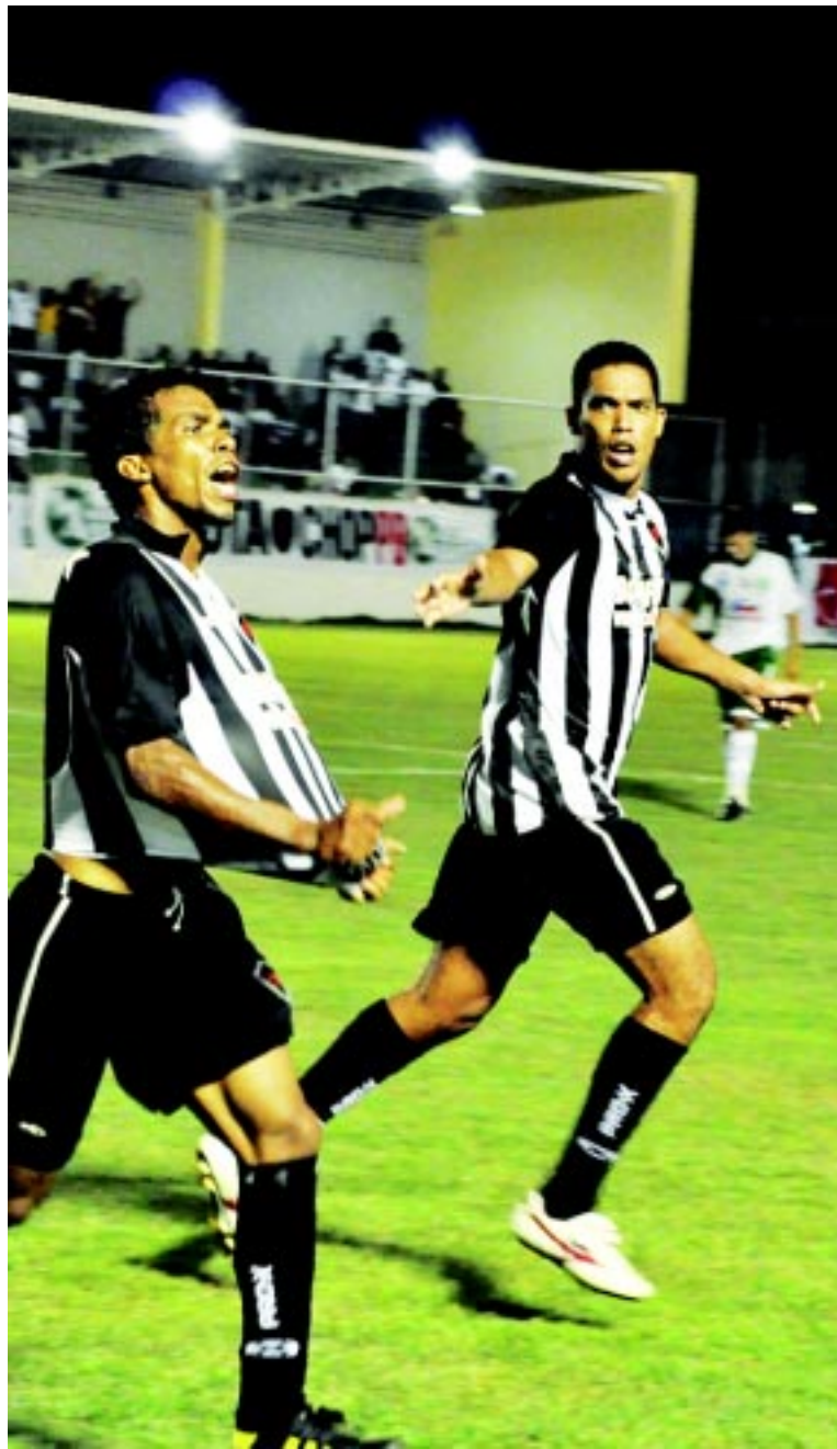
Treze e CSP, acima, foram os melhores do Campeonato Paraibano em sua primeira fase, principalmente o Alvinegro de Campina Grande que terminou na frente e invicto. Os dois vão se defrontar com Botafogo e Campinense, respectivamente, na segunda fase