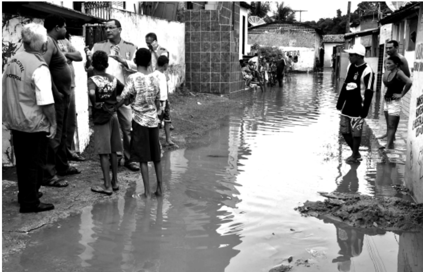
Durante inspeção da Defesa Civil da Capital foram registradas seis ocorrências, mas o plano emergencial tem evitado problemas mais sérios

André explicou que é necessário que a ficha seja preenchida corretamente e que sejam assinadas pelo secretário do órgão, já que o não cumprimento disso pode tornar nula a ficha de cadastro. Do dia 19 a 23 de maio, as secretarias devem enviar os dados à Secretaria de Administração. Durante o mês de maio, foi feito o recadastramento dos servidores da Sead. Após este recadastramento, será definido o prazo para os servidores das secretarias de Educação e Saúde, além dos inativos. Os servidores terão acesso à ficha de recadastramento na secretaria onde trabalham e aquele que quiser mais informações deve ligar para a Dicaf nos telefones 3218- 9030/9029.