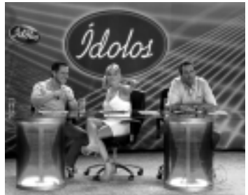
a equipe de jurados do 'Ídolos' da Record