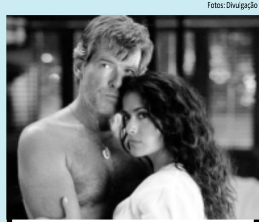
Pierce Brosnan e Salma Hayek numa cena de Ladrão de Diamantes

>>> LADRÃO DE DIAMANTES - Após um bem sucedido roubo do segundo dos três famosos diamantes de Napoleão, Max Burdett decide deixar o mundo do crime e aproveitar a vida em uma paradisíaca ilha ao lado de sua namorada Lola. Porém Stanley P. Lloyd, um agente do FBI que persegue Max há muito tempo, parte também para a ilha na intenção de assegurar que Max irá cumprir a promessa de encerrar sua carreira criminosa. Só que logo depois Max e Stanley iniciam um novo jogo de gato e rato. SE LIGUE: Hoje, às 22h, no TNT