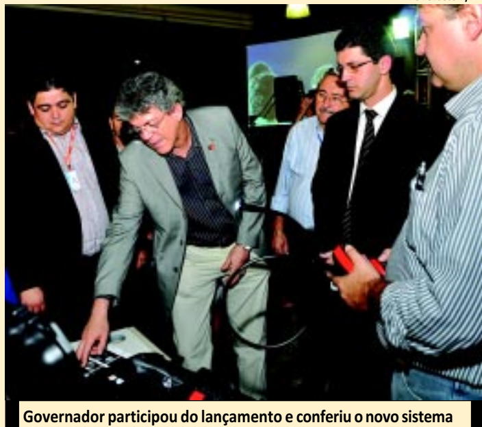
Governador participou do lançamento e conferiu o novo sistema

O governador Ricardo Coutinho, ao lançar o novo sistema, afirmou que a vistoria eletrônica será importante para o cidadão que ganhará tempo e um serviço mais eficiente, bem como proteger o servidor. "É fundamental reorganizar o Detran para que seja respeitado o direito do cidadão", ressaltou o governador. Em entrevista o governador afirmou que o Detran vai, com a vistoria eletrônica, oferecer um serviço ágil e correto, não permitindo que se crie dificuldades ao cliente. No momento da vistoria será protegido o cidadão e os funcionários que realizam a vistoria.