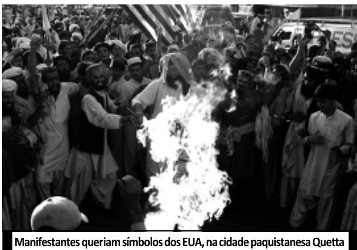
Manifestantes queriam símbolos dos EUA, na cidade paquistanesa Quetta

Após se ver desterrado na Arábia Saudita, Bin Laden encontrou refúgio no Sudão. Depois voltou para o Afeganistão, sendo recebido pelo governo de Burhanuddin Rabbani, Bin Laden e sua rede Al-Qaeda se prepararam para a guerra santa que tornou-o o inimigo número 1 dos EUA.