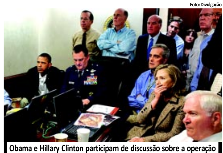
Obama e Hillary Clinton participam de discussão sobre a operação