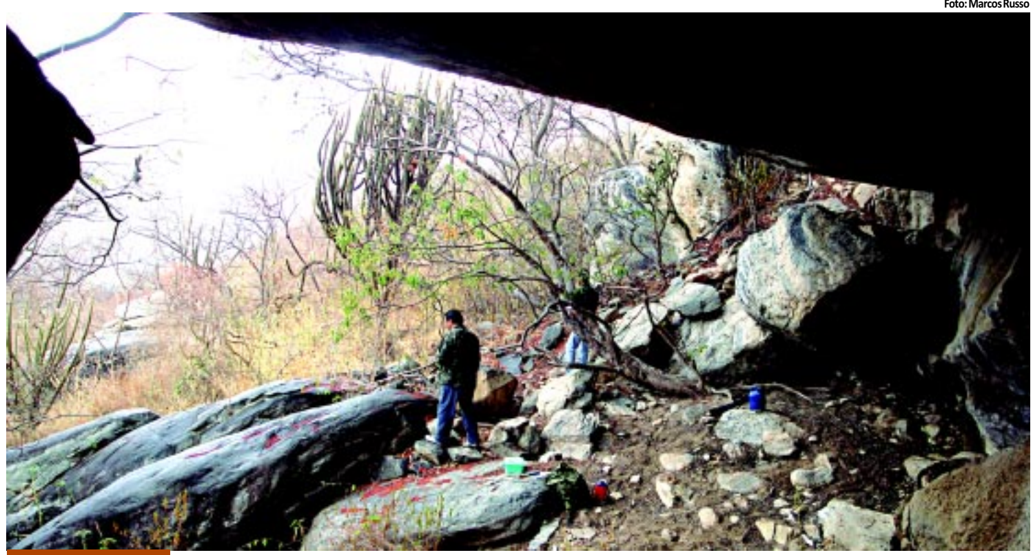
MOBILIZAÇÃO Sociedade de Arqueologia quer transformar APA das Onças em Parque Nacional PÁGINA 10

da Pessoa Física 2011 dentro do prazo regular, encerrado na última sexta. Segundo a Receita Federal na Paraíba, 238.209 pessoas prestaram contas ao Leão, de um total estimado em 250 mil para esse ano, o que representa 95,28%. PÁGINA 12