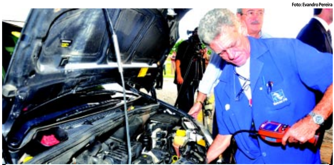
O Detran vai investir cerca de R$ 800 mil na implementação do sistema de vistoria eletrônica

Uma operação envolvendo 30 homens da Polícia Militar resultou na apreensão de várias armas, estiletes e drogas no interior da Colônia Penal Agrícola do Sertão, localizada às margens da BR 230, na cidade de Sousa. A operação foi denominada Águia. PÁGINA 11