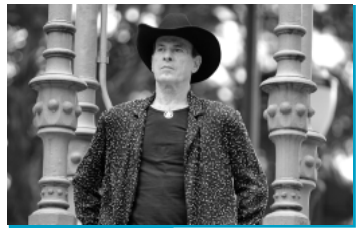
NEY NA DOMUS HALL

A 54ª Bienal de Arte de Veneza vai conceder o prêmio Leão de Ouro para a artista americana Sturtevant, que vive em Paris, e para o austríaco Franz West. A decisão foi anunciada pelo diretor da Biennale di Venezia, Paolo Baratta, e pela curadora da mostra, Bice Curiger. A exposição será inaugurada em 4 de junho para o público na cidade italiana e nesse dia ocorre a cerimônia de entrega do prêmio que homenageia os artistas por suas trajetórias. Elaine Sturtevant é precursora da arte conceitual. West trabalha com esculturas, colagens e instalações.