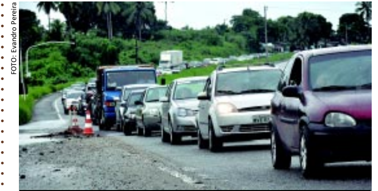
Tráfego lento por causa das chuvas até mesmo nas rodovias da Grande João Pessoa. Pior, porém, são as marcas deixadas pelas águas que prejudicam ainda mais o tráfego, como o buraco que surge na beira da estrada, na BR-230, na Capital. [FOTO&LEGENDA]