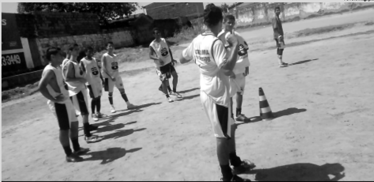
Os garotos do Kashima, do Cristo Redentor, já estão treinando para participar da competição. A equipe está inserida no Grupo D

O Campeonato Paraibano de Futebol Infantil (Sub-15) é destinado apenas a atletas nascidos nos anos de 1996, 1997 e 1998.