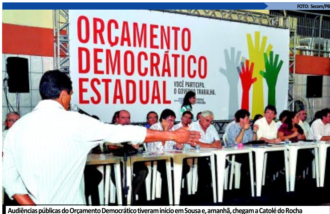
Audiências públicas do Orçamento Democrático tiveram início em Sousa e, amanhã, chegam a Catolé do Rocha