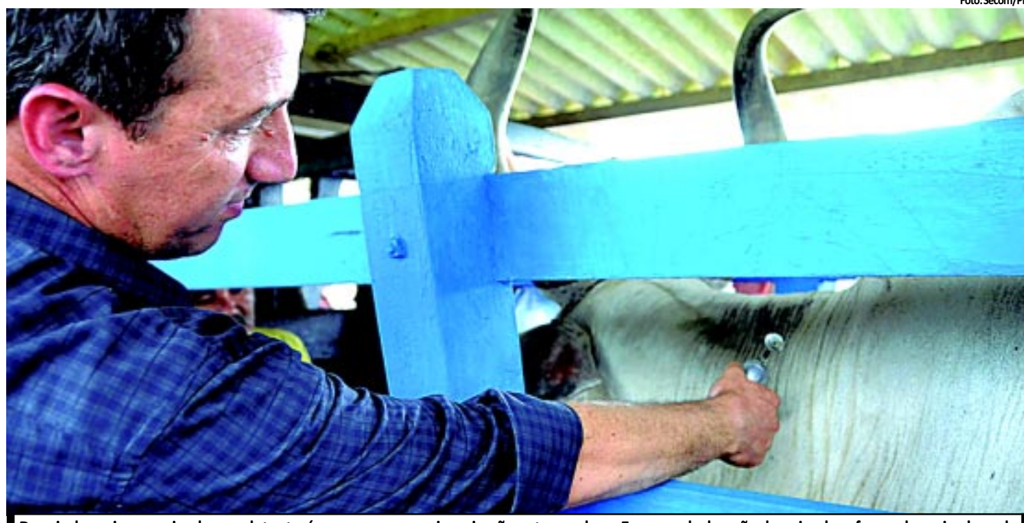
Depois de vacinar o animal, o produtor terá que comprovar a imunização entregando na Emepa a declaração do animal e o frasco de vacina lacrado

e BR. O Sindipetro-PB emitiu nota reclamando dos sucessivos aumentos repassados pelas distribuidoras na Paraíba aos postos, o que estaria interferindo no valor do combustível que chega ao consumidor. PÁGINA 9