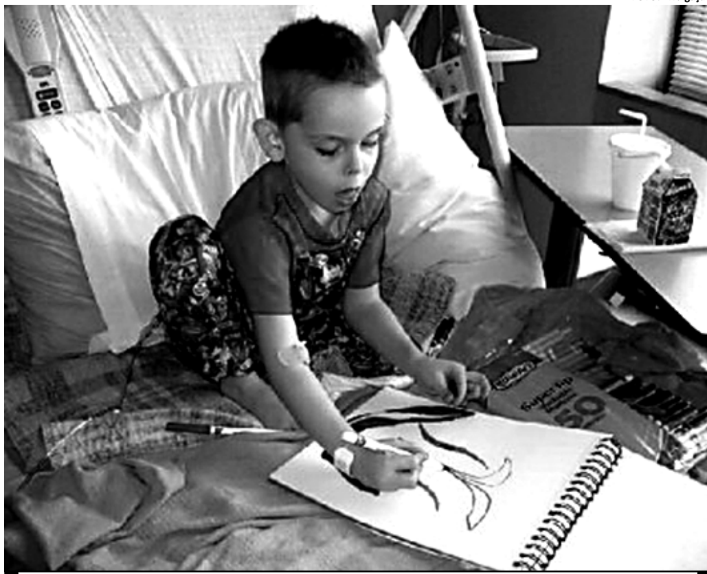
O pequeno norte-americano de cinco anos já vendeu 3 mil desenhos para custear tratamento para leucemia