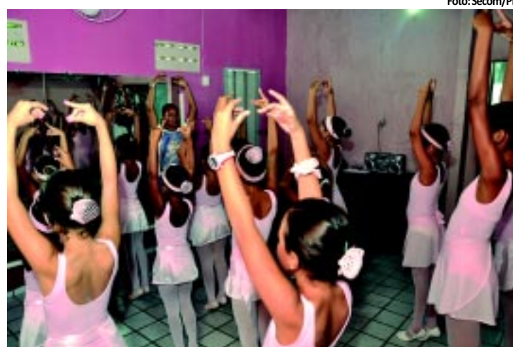
Balé muda vida de meninas carentes

O Governo do Estado lançou ontem, na Emepa, a Campanha Estadual de Vacinação Contra a Febre Aftosa deste ano. A meta é imunizar mais de 90% do rebanho de bovinos e búfalos da Paraíba, que se encontram em estado de risco médio da febre aftosa. Os 108 mil produtores do Estado terão até o dia 31 de maio para vacinar os animais. PÁGINA 10