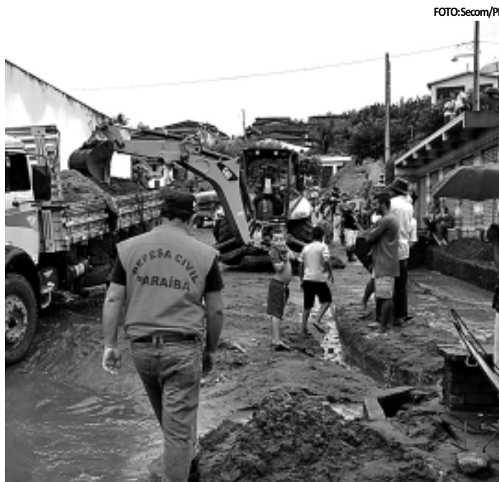
A Defesa Civil estadual tem atuado em vários municípios, como Natuba