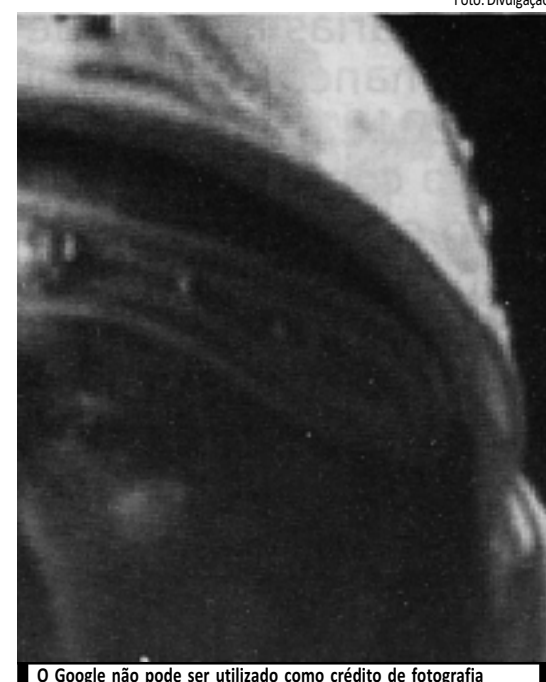
O Google não pode ser utilizado como crédito de fotografia

O Google, Sr. editor, é uma ferramenta internética de busca, nunca poderá ser creditada como elemento profissional. É um buscador, jamais fonte de pesquisa e muito menos crédito de fotografia. Percebe-se a ignorância desta condição não pela crassidade da informação, mas, principalmente, pela intenção honesta em creditar uma publicação num ambiente onde é notório o descumprimento à lei dos direitos autorais. Há muito pouco tempo um crédito acintoso estampava uma imagem nas páginas de um jornal de circulação local. Caiu a direção e todo o corpo editorial. Este foi honesto, tratava-se de um boicote que inadvertidamente ou descuidadamente foi publicado. Honesto por se tratar de uma ação deliberada sem o mascaramento de imprimir uma influência intelectual falseteada em atualidades tecnológicas que servem apenas como colaboradoras na produção do bom e velho jornalismo. O Dr. Avany Maia sempre esteve certo. Rarearam os bons profissionais na imprensa paraibana.