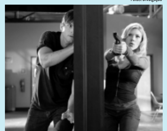
Ashton Kutcher e Katherine Heigl em Par Perfeito , de Robert Luketic

>>> PAR PERFEITO - Numa viagem com os pais, Jen Kornfeldt conhece Spencer. Os dois se apaixonam, casam e vivem uma vida tranquila até ela descobre que aquele a quem imaginava o homem perfeito é, na verdade, um assassino profissional contratado pelo governo. Spencer se torna alvo de uma caçada milionária e precisa se defender e também sua esposa. Além disso ele precisa lidar com a descrença de Jen por ter escondido esta situação por tanto tempo. SE LIGUE: Hoje, às 18h20, no Telecine Pipoca