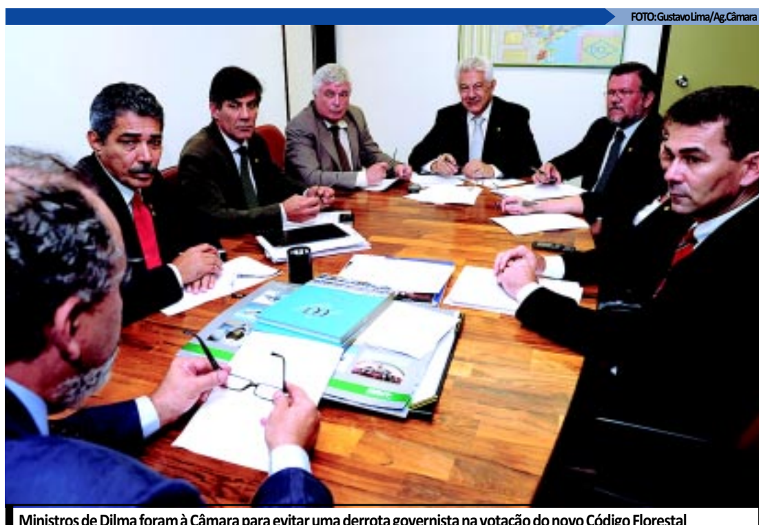
Ministros de Dilma foram à Câmara para evitar uma derrota governista na votação do novo Código Florestal

O primeiro projeto apresentado é uma proposta de emenda à Constituição (PEC) que obriga o Governo Federal a compensar financeiramente os Estados e municípios pelas perdas com benefícios fiscais (como reduções de alíquotas e concessões de crédito presumido), que impactam negativamente as receitas estaduais e municipais.