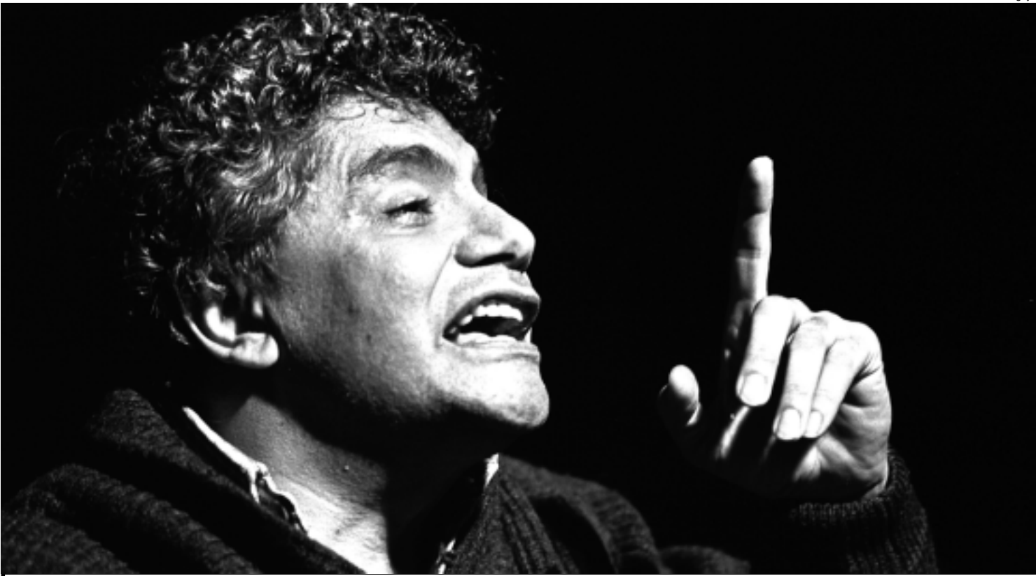
O filme Pan-Cinema Permanente , de Carlos Nader, que será exibido no Cineclube Sanhauá, é um documentário sobre o poeta baiano Waly Salomão (foto)