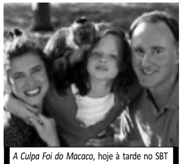
A Culpa Foi do Macaco, hoje à tarde no SBT