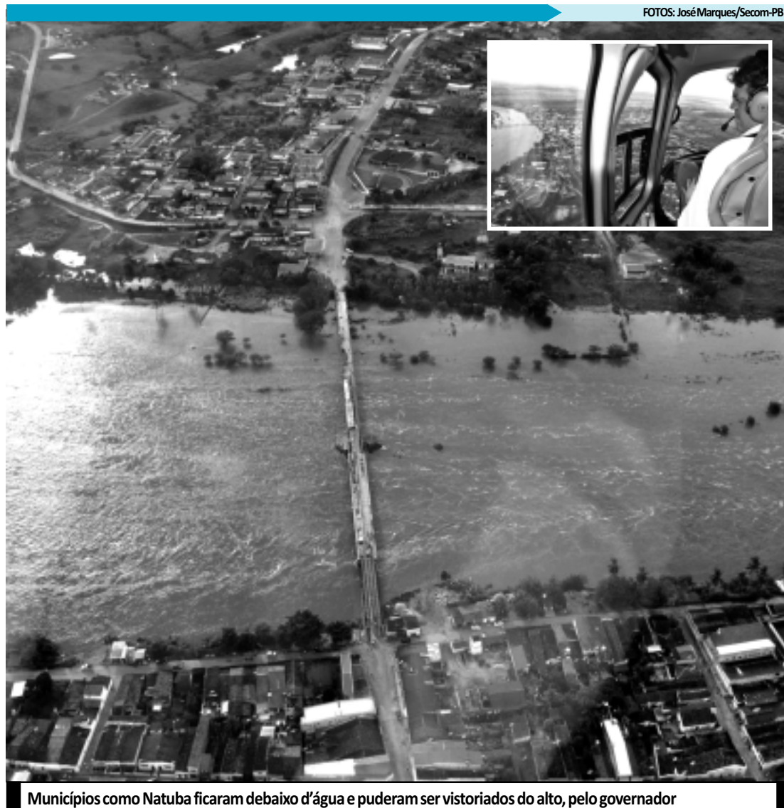
Municípios como Natuba ficaram debaixo d'água e puderam ser vistoriados do alto, pelo governador

NÍVEL DOS AÇUDES - O aumento do nível de água no