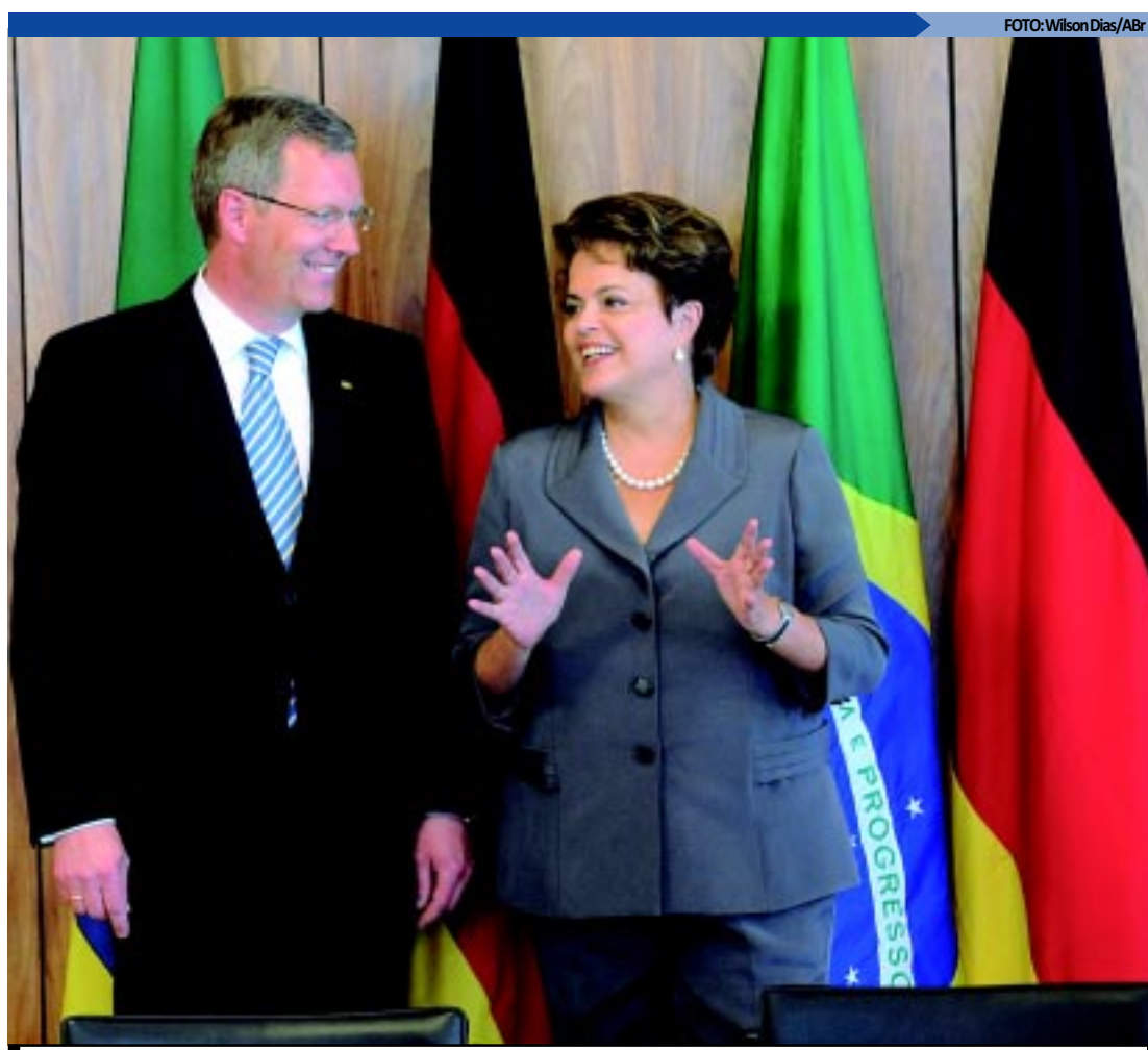
A presidenta Dilma Rousseff e o presidente da Alemanha, Christian Wulff, durante declaração no Planalto

Dilma lembrou também que Brasil e Alemanha são parceiros "na defesa de uma ordem mundial mais justa, democrática e que respeita os direitos humanos". Em relação ao G-20, ela disse que, embora o pior momento da crise tenha passado, "todos nós concordamos da necessidade de aprimoramento das governanças financeiras internacionais". Ela aproveitou o discurso para alfinetar a política econômica protecionista dos Estados Unidos. "Percebemos que países desenvolvidos, mas com crescimento fraco, têm adotado políticas monetárias (EUA) extremamente expansionistas, com evidentes efeitos negativos sobre a inflação mundial".