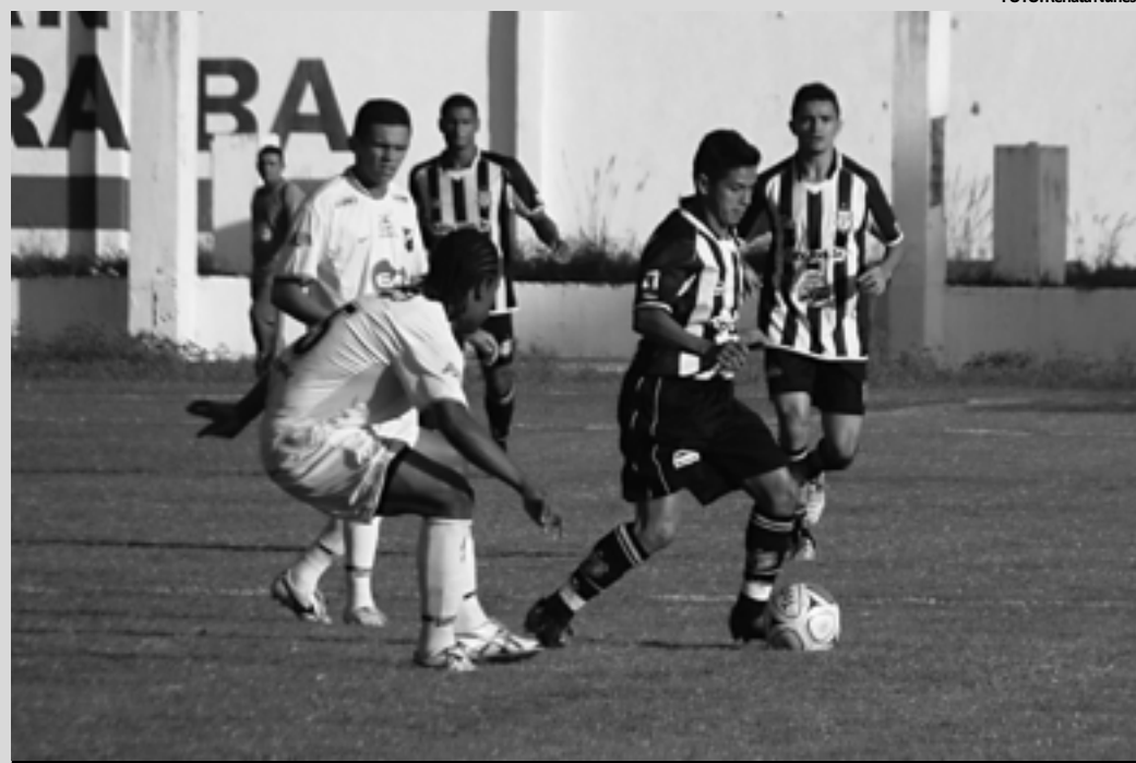
O Treze disputou a competição no ano passado e não conseguiu êxito. Este ano tenta a vaga de novo