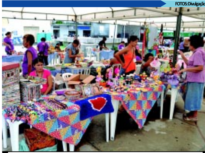
A feira funciona até este sábado, das 10h às 17h, no Centro de JP

Quem for à feira vai encontrar uma variedade de produtos como flores artesanais, sabonetes, bijuterias, sandálias, artigos de decoração, roupas, mosaicos, tricô, bordados, plantas e objetos feitos com material reciclado. A feira pode ser aproveitada como opção para compra do presente do Dia das Mães, comemorado no próximo domingo (8).