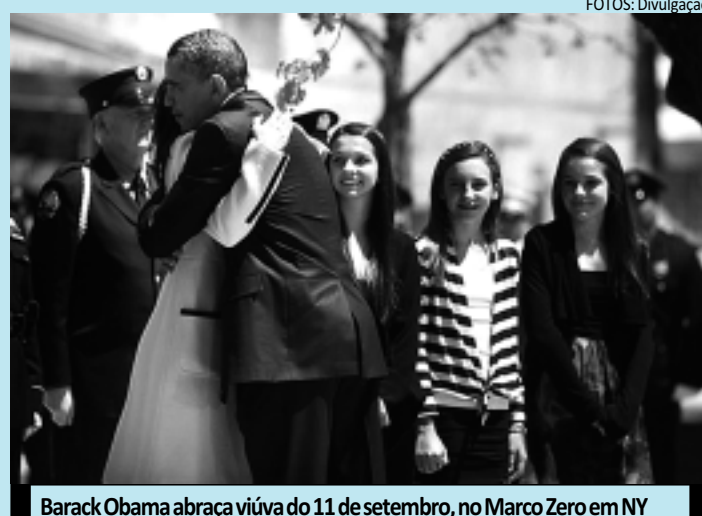
Barack Obama abraça viúva do 11 de setembro, no Marco Zero em NY

Após o discurso, um dos chefes de bombeiros mostrou ao presidente uma pla-