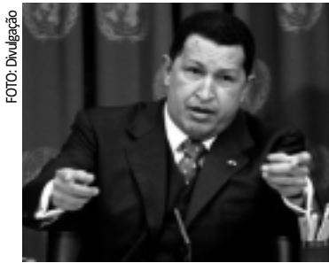
HUGO CHÁVEZ NO BRASIL

O presidente da Venezuela, Hugo Chávez, visita Dilma Rousseff na próxima terça-feira, em Brasília. Na pauta, ainda indefinida, deve estar a ampliação de parcerias nas áreas de energia elétrica e combustíveis. Encontro faz parte dos planos para América Latina.