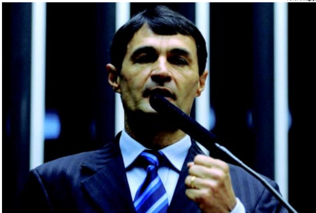
Deputado entende que o terminal é uma forma de permitir as condições mínimas de concorrência no Nordeste

Os crimes eleitorais estão na segunda posição da lista com 19 ocorrências, seguidos dos chamados crimes de responsabilidade, desvios de conduta relacionados ao exercício de outros cargos públicos, que geraram 11 investigações. Há também 11 acusações dos crimes de menor gravidade, como calúnia e difamação.