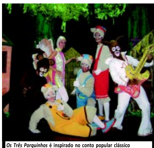
Os Três Porquinhos é inspirado no conto popular clássico

Cia. apresenta espetáculos neste fim de semana para comemorar uma década de atividades