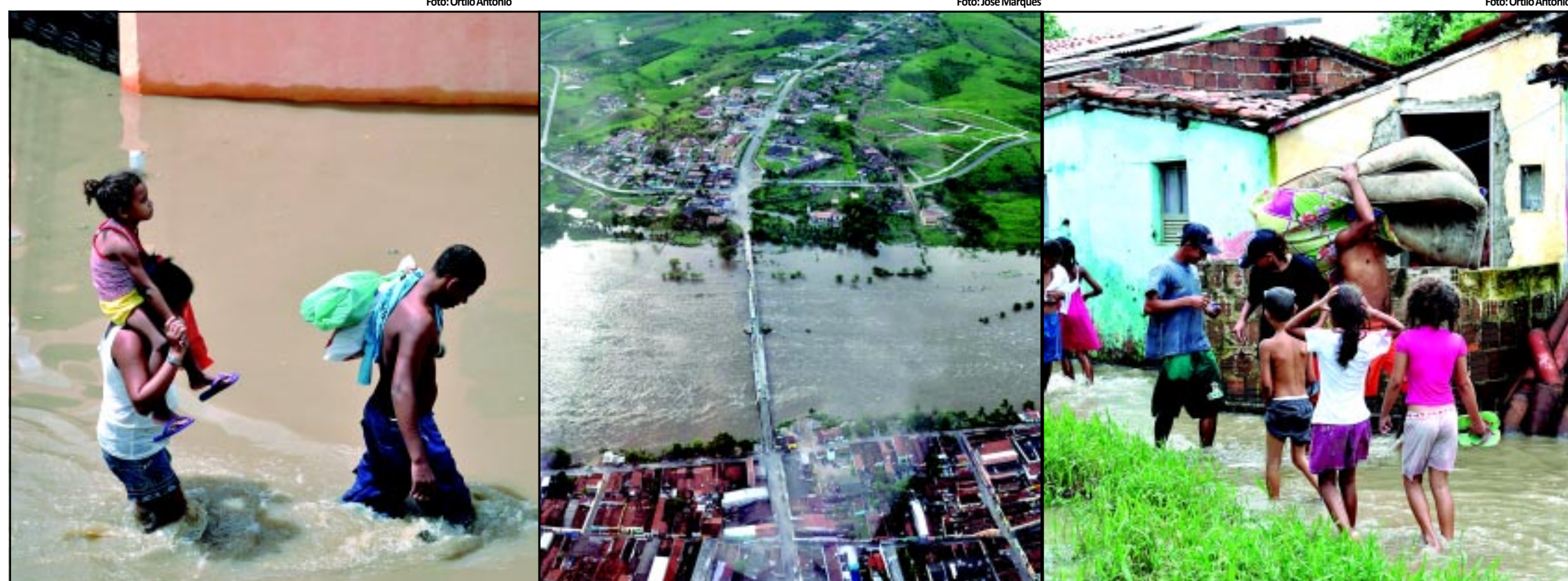
As chuvas que vêm caindo no Estado nos últimos dias destruíram 58 casas e danificaram 455 moradias, afetando cerca de 3.800 pessoas. Ricardo Coutinho visitou ontem áreas afetadas pelas enchentes