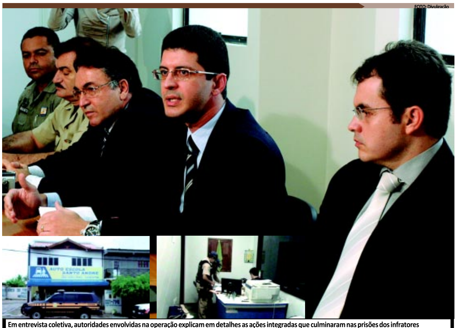
Em entrevista coletiva, autoridades envolvidas na operação explicam em detalhes as ações integradas que culminaram nas prisões dos infratores