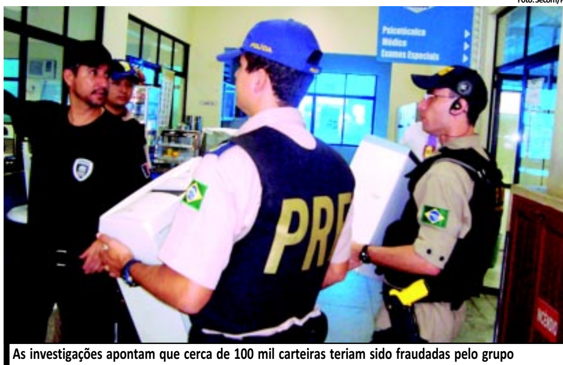
As investigações apontam que cerca de 100 mil carteiras teriam sido fraudadas pelo grupo