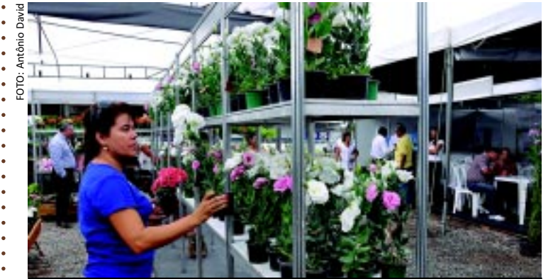
A terceira edição da Feira de Flores do Estado continua na Empasa, no bairro do Cristo, em João Pessoa. Ali, além de flores, arranjos e plantas ornamentais dão aos visitantes boas opções de presentes para as mães. A Feira termina amanhã.