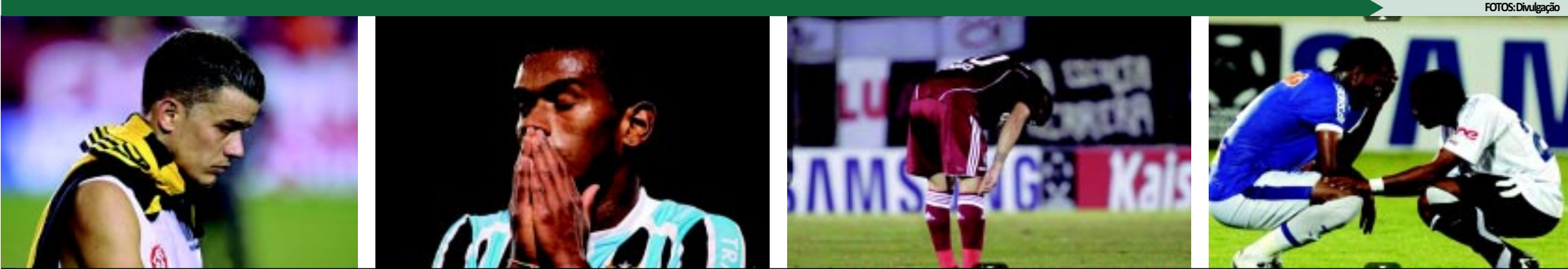
A reação dos jogadores do Internacional, Grêmio, Fluminense e Cruzeiro, todos derrotados nesta quarta-feira, foi de muita tristeza e perplexidade diante dos resultados e da eliminação precoce das equipes na Libertadores

>>> DECEPÇÃO > Clubes brasileiros fazem a pior campanha na Libertadores desde o ano de 2000