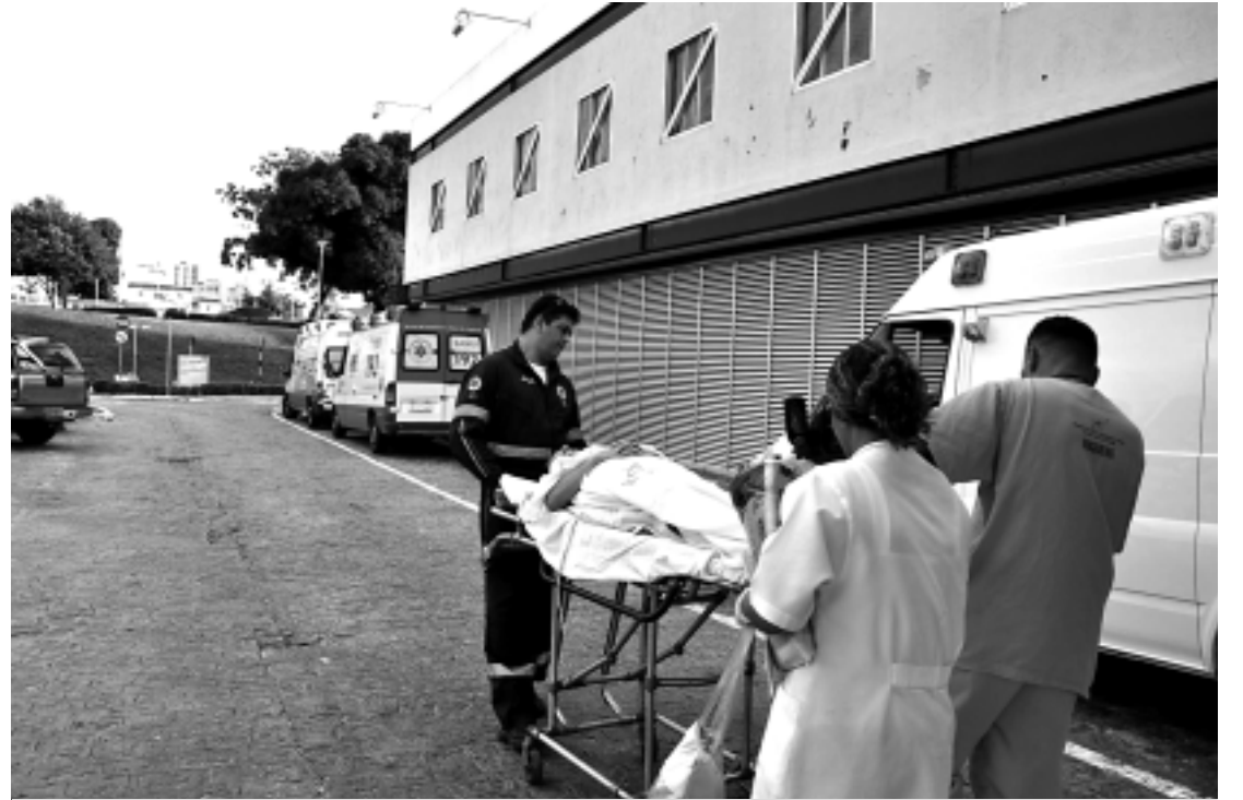
A transferência de 30 pacientes, seguindo o direcionamento da Justiça, aconteceu durante a tarde de ontem

Os municípios paraibanos que receberão a visita técnica dos auditores do Ministério da Saúde são: Bayeux, Cajazeiras, Campina Grande, Guarabira, João Pessoa, Monteiro, Patos, Piancó, Picuí, Pombal, Princesa Isabel, Santa Rita e Sousa.