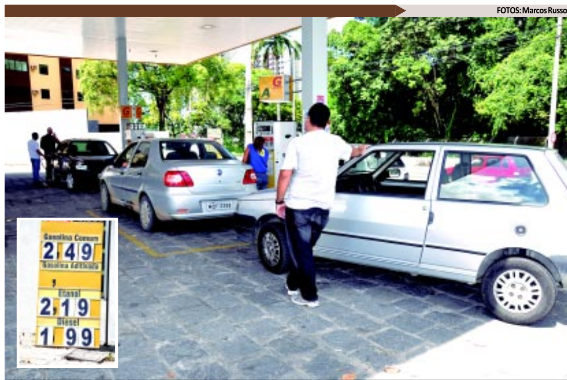
Ontem, havia postos em João Pessoa praticando preços mais baixos, com o litro da gasolina a R$ 2,49

Como os resultados obtidos com movimento "Na Mesma Moeda", foi positivo em João Pessoa, outros municípios paraibanos também apoiam a manifestação. Campina Grande deverá ser um destes já que na pesquisa realizada na última segunda-feira pelo Procon Municipal, os valores do litro da gasolina comum para o pagamento à vista, está custando entre R$ 2,59 e R$ 2,89, sendo uma variação de 11,58%, com diferença de preço entre o mais caro e o mais barato de R$