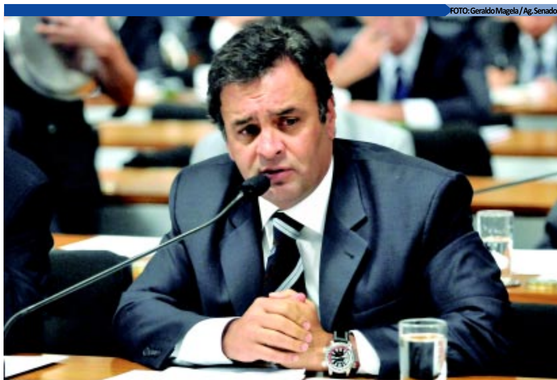
O senador afirmou que aposta num "clima de convergência" durante a convenção tucana, no próximo dia 28

Durante dez dias, ela foi submetida a um tratamento com uma associação de dois antibióticos. O uso do remédio terminou nesta semana.