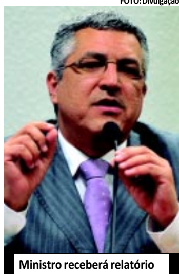
Ministro receberá relatório

Serão levados em conta fatores como a quantidade de exames produzidos em um determinado intervalo de tempo, localização, marcas e modelos dos aparelhos. Também serão registradas informações do quadro de profissionais de saúde envolvidos na operacionalização dos mamógrafos, como