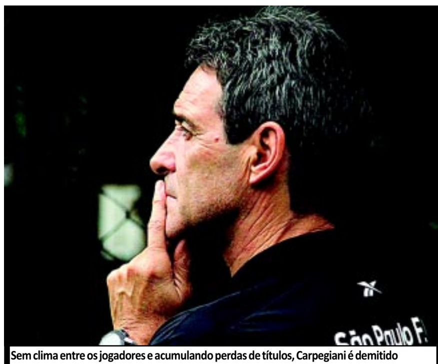
Sem clima entre os jogadores e acumulando perdas de títulos, Carpegiani é demitido

"Os bons técnicos estão empregados. É assim mesmo. Mas é claro