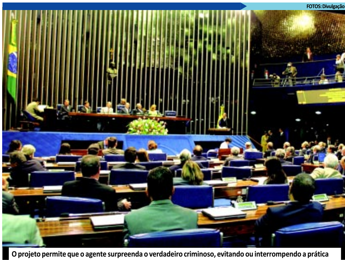
O projeto permite que o agente surpreenda o verdadeiro criminoso, evitando ou interrompendo a prática

De acordo com o texto, "a infiltração será sempre precedida de autorização judicial