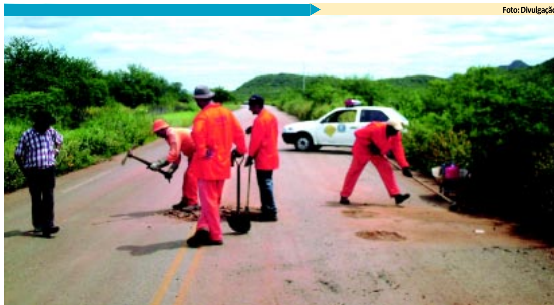
DNIT recupera trechos de estradas no Sertão paraibano

Treze municípios paraibanos vão receber até 17 de junho a visita técnica do Ministério da Saúde, que fará uma auditoria em 26 mamógrafos disponíveis na rede pública e conveniada ao Sistema Único de Saúde (SUS). A ação também contará com a participação de auditores das Secretarias Estadual e Municipais de Saúde. A auditoria do Ministério da Saúde, iniciada ontem, vai abranger 2.190 mamógrafos espalhados em 823 municípios de todos os estados do país, além do Distrito Federal. PÁGINA 10