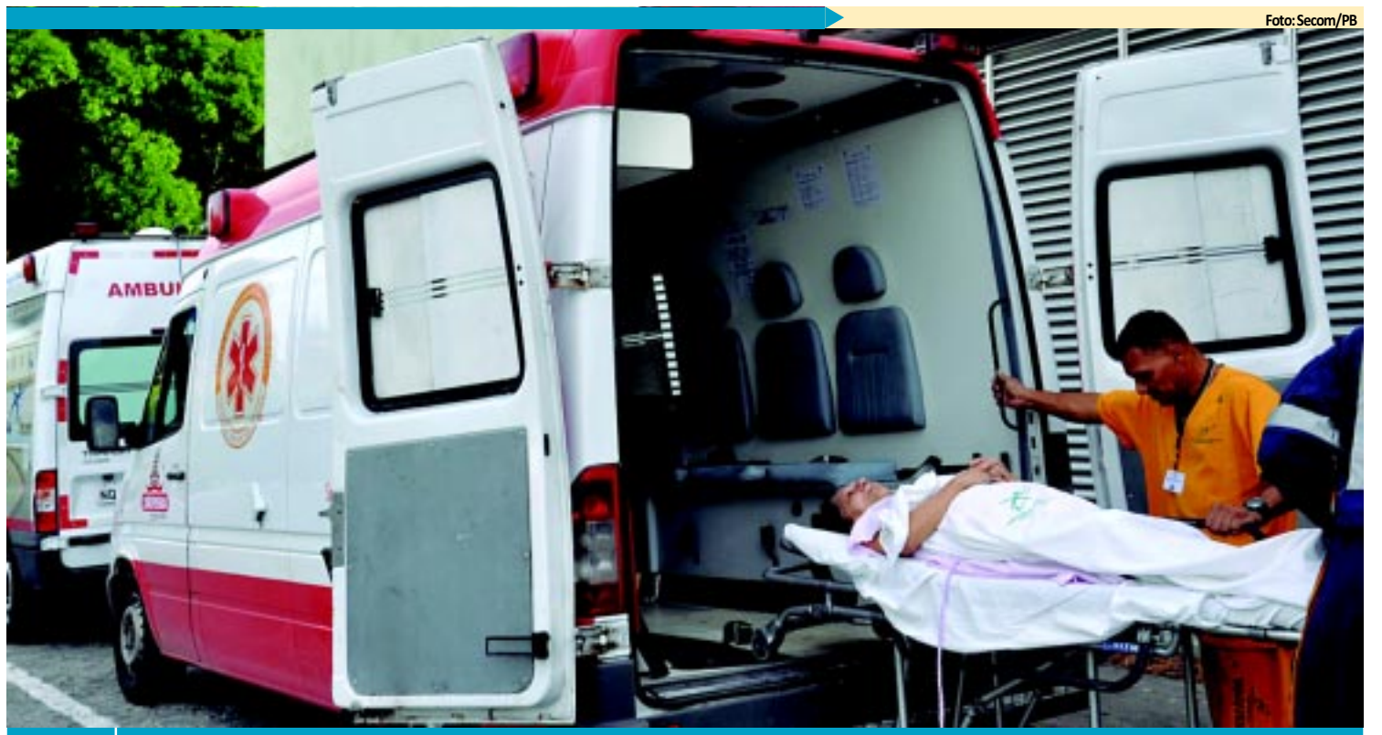
EM JP Trauma começa a transferir pacientes dos hospitais Monte Sinai e Santa Isabel PÁGINA 10

o Conselho Regional de Medicina na Paraíba (CRM-PB) questiona a qualificação desses profissionais e se posicionou contrário a abertura indiscriminada de novos cursos de Medicina. De 2000 a 2010, foram criadas 80 escolas de Medicina no país. PÁGINA 10