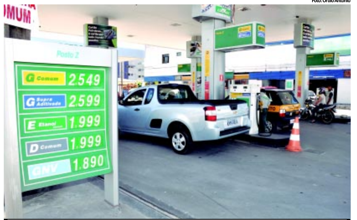
Durante os protestos, os consumidores de JP abasteceram seus veículos com R$ 1 e pagaram no cartão

ESTE é o valor mais alto que está sendo cobrado na Capital pela gasolina