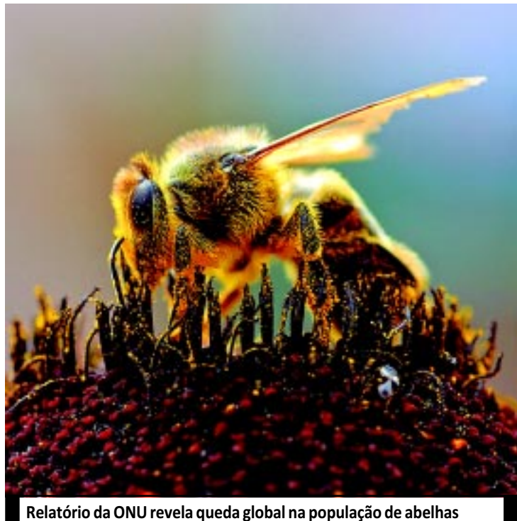
Relatório da ONU revela queda global na população de abelhas

Favre expôs a abelha a ondas de celulares por 20 horas. O pesquisador fixou esse período porque, segundo ele, estudos anteriores já mostraram que a exposição prolongada a celulares fez com que abelhas não mais encontrassem o caminho de volta para a colmeia, e deixando-a praticamente vazia entre 5 e 10 dias. Mas já no período de 20 horas no experimento, as abelhas fizeram sons como se es-