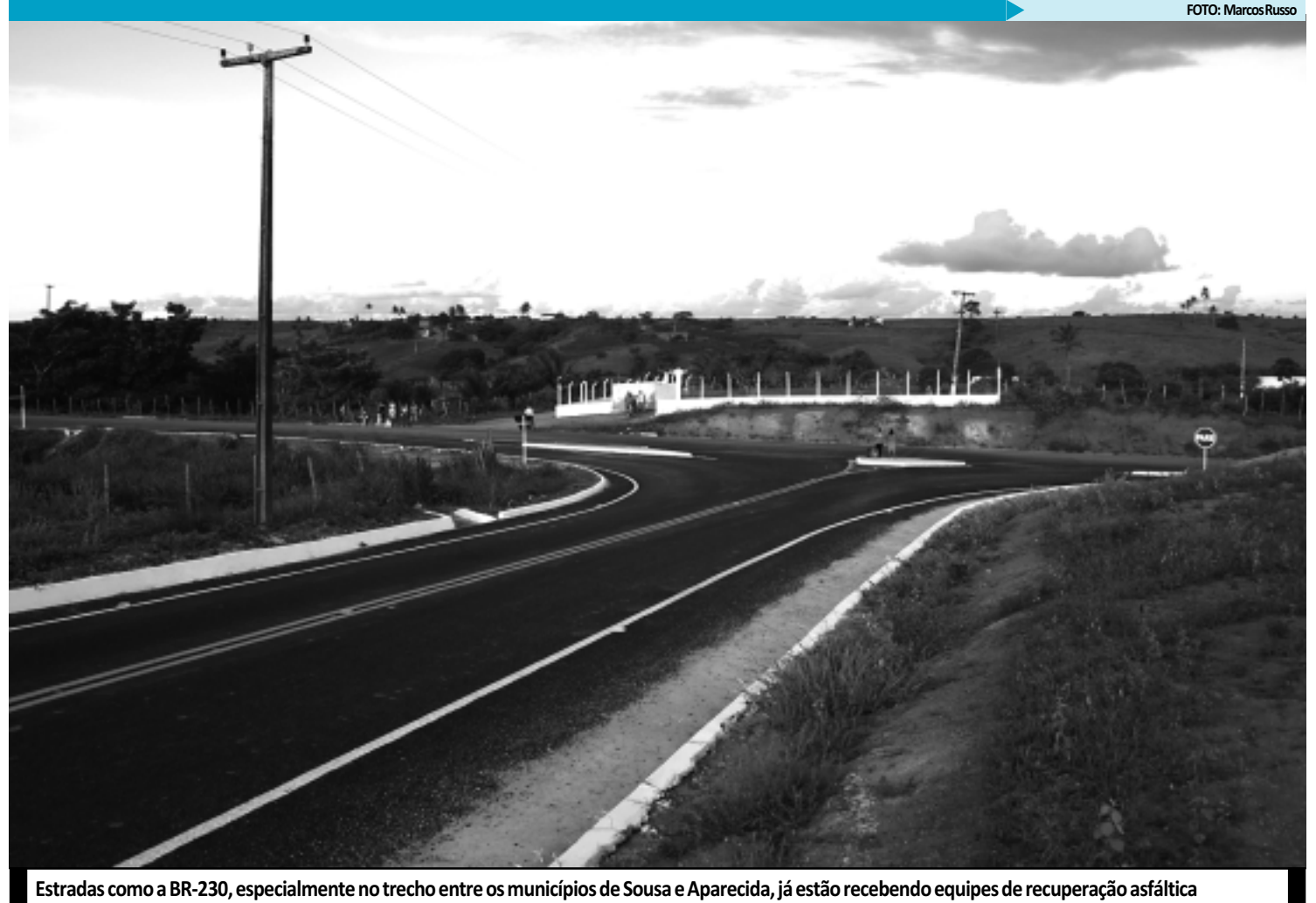
Estradas como a BR-230, especialmente no trecho entre os municípios de Sousa e Aparecida, já estão recebendo equipes de recuperação asfáltica

"Naquela região, sofremos com o solo compressível, que tem baixa capacidade de carga. Por isso, a estrada se desgasta e necessita de reparos", explicou. Segundo ele, os buracos são comuns nesta época de chuvas. "Entretanto, com chuva, não podemos jogar a massa quente para tapá-los. Fica impossível trabalhar. Por isso, precisamos