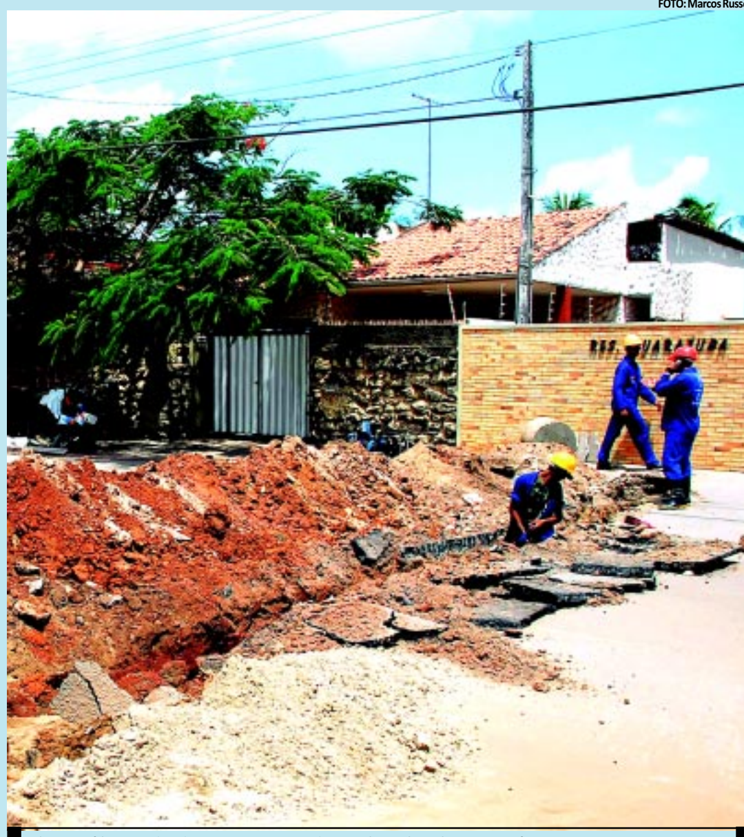
Objetivo é levar redes de esgoto para 90% da população brasileira nos próximos 20 anos

“Quando lançamos o PAC, em 2007, não havia pro-