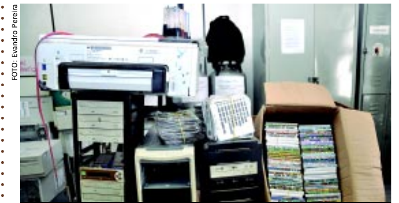
[FOTO&LEGENDA] Policiais da Delegacia de Ordem Econômica da Capital apreenderam no Bairro de Cruz das Armas, em JP, diversos computadores que, segundo a polícia, serviam para reproduzir CDs e DVDs piratas para serem distribuídos a ambulantes da Grande João Pessoa.