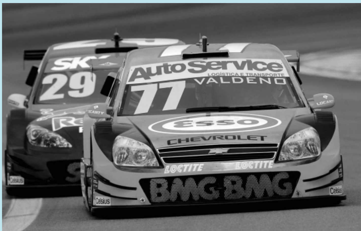
Valdeno tem amanhã a chance de se recuperar dos maus resultados na temporada, num autódromo onde ele sempre obtém bons resultados