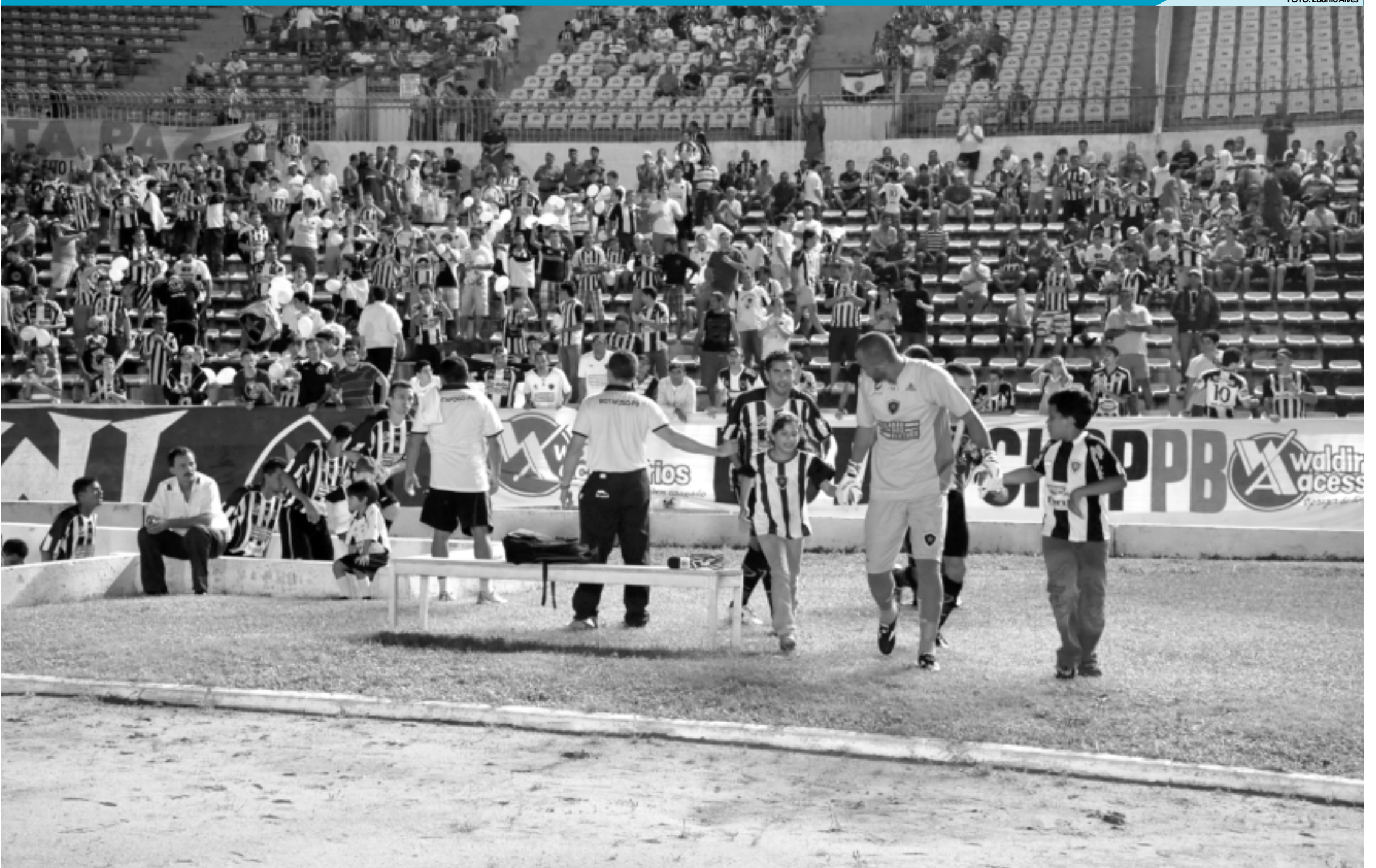
Enquanto aguarda uma definição por parte do Tribunal de Justiça Desportiva, a diretoria do Botafogo analisa a situação do elenco no tocante à validade dos contratos para não ter problemas se o calendário do Estadual for prorrogado

>>> CONTRATOS > Com a paralisação do Campeonato Paraibano, a diretoria avalia situação de jogadores