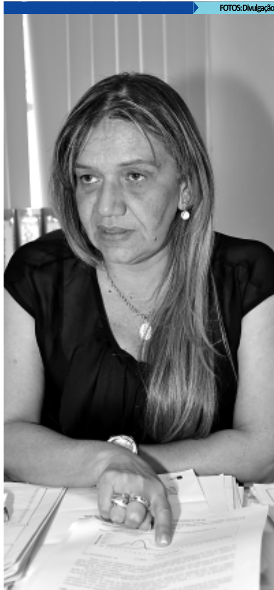
Para Júlia Vaz, casos da doença estão caindo na PB