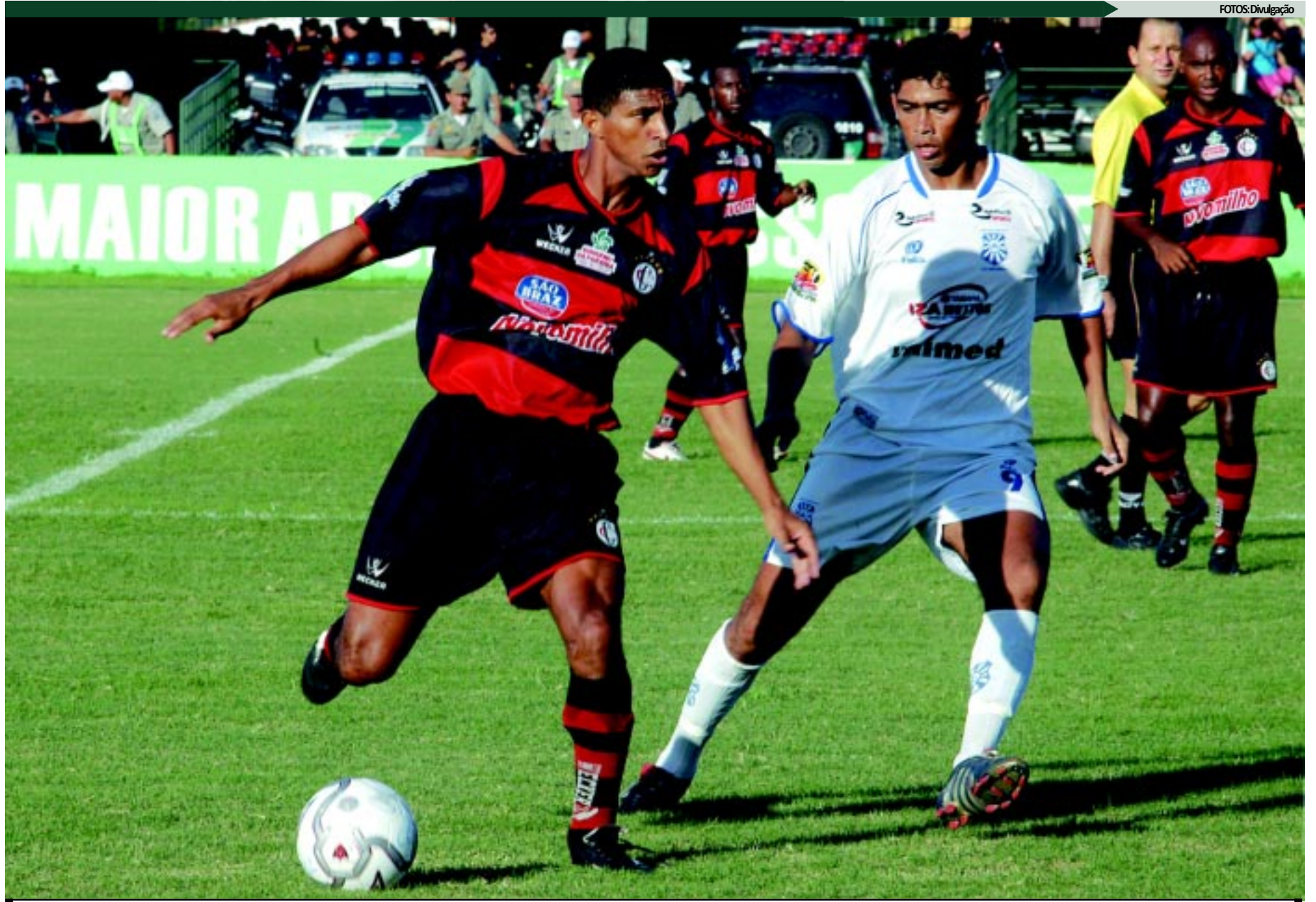
O Campinense vai novamente enfrentar o CRB pelo Campeonato Brasileiro da Série C e terá jogos mostrados ao vivo pela TV Brasil no estádio Amigão, em Campina, e no PV, em Fortaleza

Ao final do campeonato, os quatro clubes que tenham disputado a terceira fase (semifinais) ascenderão à Série B de 2012. Já o último colocado de cada um dos grupos ao final da primeira fase cairá para a Série D de 2012, totalizando