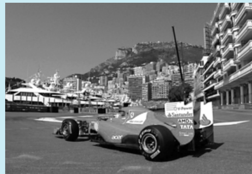
Fernando Alonso com a sua Ferrari foi o grande destaque do treino de ontem

- Sempre gostei deste circuito e isto é importante porque é um dos difíceis do campeonato. É um lugar onde o piloto pode fazer a diferença. Por outro lado, é um fim de semana longo. Algumas coisas podem te incomodar, mas você precisa levá-las em todos os dias. Você não pode mudá-las, nem sempre as podemos olhar as coisas objetivamente aqui. Para ser rápido, tudo tem de estar certo. Você precisa de confiança e o carro precisa estar de acordo com o que você gosta. Você precisa estar confortável. Não existe espaço para erros, mas você precisa forçar. Esta é a chave - diz Vettel, em entrevista à imprensa inglesa.