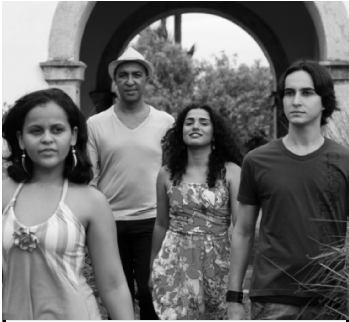
Os quatro estudantes estão em fase de conclusão do curso de bacharelado de Canto e Sequencial em Música Popular da UFPB

Show será realizado sábado e domingo, às 17h, no auditório da instituição