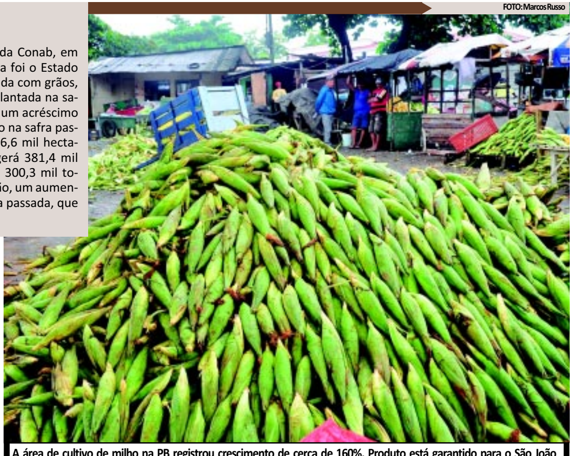
A área de cultivo de milho na PB registrou crescimento de cerca de 160%. Produto está garantido para o São João

junho serão armadas tendas para venda de comidas típicas e um trio de forró animará quem for até a Empasa para comprar milho. "Nos acreditamos que este ano a comercialização será incrementada, porque, além dos preços baixos, nós possuímos um amplo estacionamento e segurança, diferente dos mercados públicos", enfatizou.