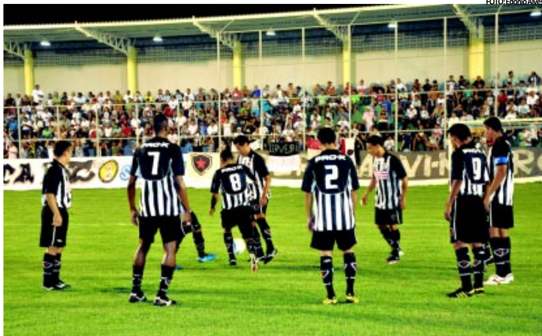
Jogadores do Botafogo continuam aguardando a decisão do Tribunal para que a bola volte a rolar no Estadual