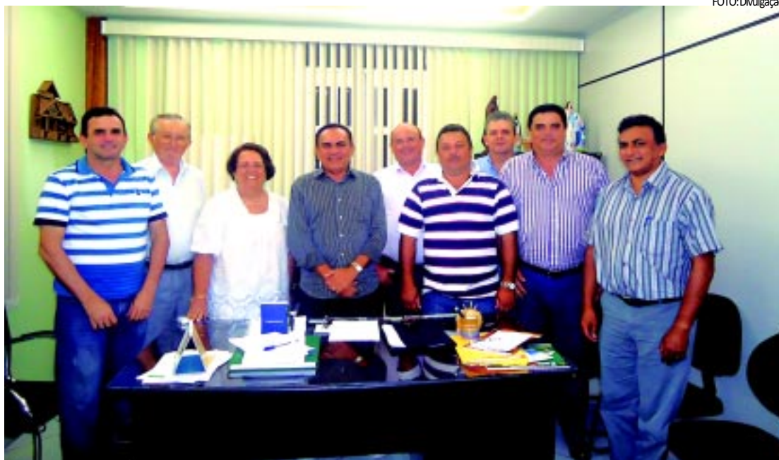
Prefeitos elaboraram um documento chamado de "Carta de Bananeiras" para apresentar ao governador

Os recursos transferidos pelo Estado aos municípios que aderirem ao Pacto pelo Desenvolvimento Social da Paraíba não poderão ser aplicados para pagamento de servidores, custeio de despesas ou investimentos anteriores ou posteriores à vigência do convênio, gastos com comunicação e/ou publicidade e realização de eventos e/ou festividades. Entre os critérios exigidos para que os municípios possam aderir ao pacto destaca-se a aprovação das contas pelo Tribunal de Contas do Estado.