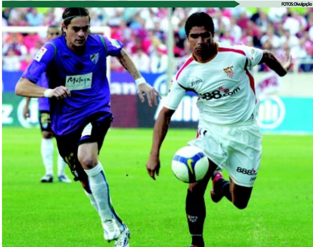
Após sete anos no futebol europeu, Renato retorna ao Brasil e confessa que estava com saudades do país

CONQUISTAS - Nas sete temporadas no Sevilla, Renato conquistou seis títulos. Foram duas Copas Uefa 2004/05 e 2006/07, duas Copas do Rey 2007/07 e 2009/10, uma Supercopa Uefa em 2006 e uma Supercopa da Espanha em 2007.