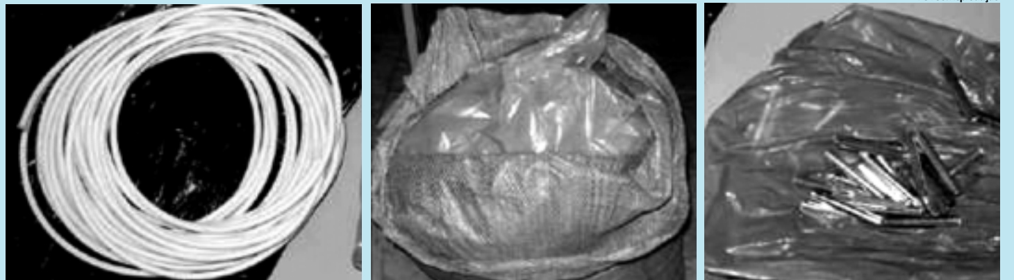
No posto, a polícia encontrou 60 quilos de explosivo, um cabo de 12 metros de fio e um saco com 40 espoletas

O tenente Thiago Feitosa, comandante do Grupo de Choque da Polícia Militar, disse que as investigações continuam e a polícia já tem informações sobre supostos fornecedores do produto, "estamos apurando mais fatos e nas próximas horas poderemos ter mais prisões".