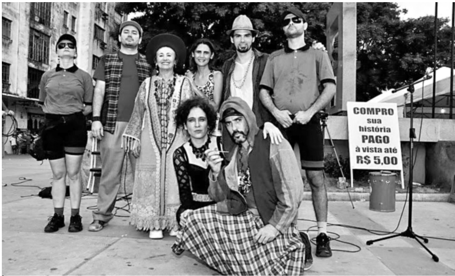
Para conceber a peça, o Coletivo Alfenim foi ao Ponto de Cem Réis estudar o modo como se estabelecem as relações de convivência entre as pessoas