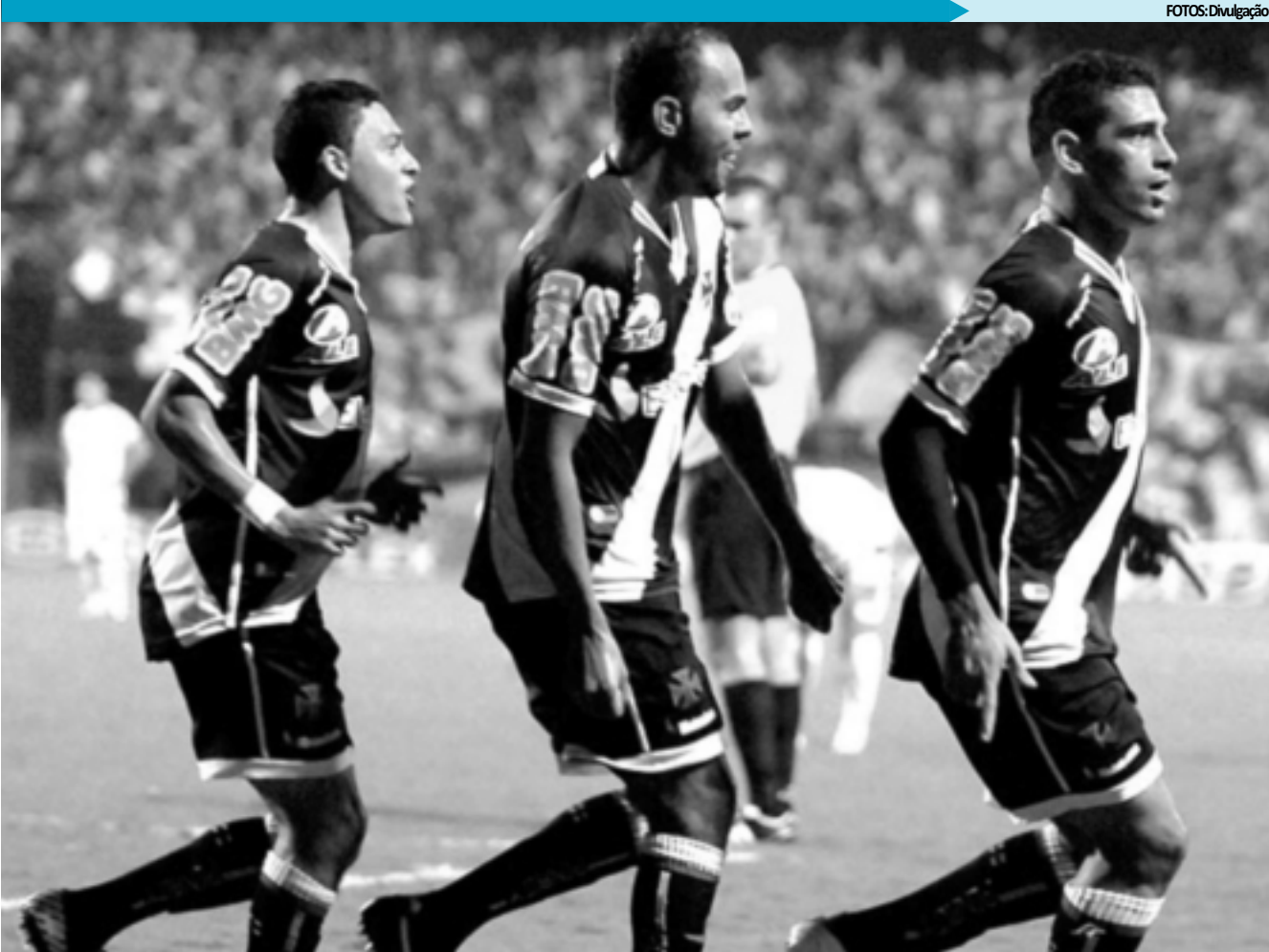
O Trem Bala do Vasco já está na última estação e segue firme em direção ao título da Copa do Brasil. Agora só falta vencer o Coritiba