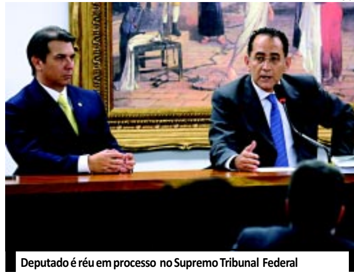
Deputado é réu em processo no Supremo Tribunal Federal

Após ser escolhido, no mês passado, o agora presidente da CCJ negou que o andamento do processo possa atrapalhar seu desempenho na comissão.