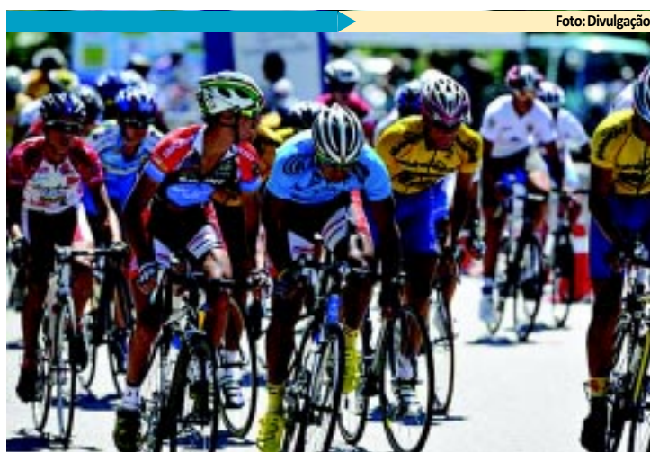
CICLISMO Paraibano representará Brasil PÁGINA 15

Escolas já estão fazendo os últimos acertos nas alegorias para garantir o sucesso dos desfiles de domingo e segunda-feira na "passarela do samba" do Rio de Janeiro. Banheiros, lanchonetes, e relógios que vão marcar o tempo de cada desfile estão espalhados ao longo dos 13 setores do Sambódromo. Pela primeira vez, os deficientes visuais poderão ouvir a narração dos desfiles do Grupo Especial. PÁGINA - 8