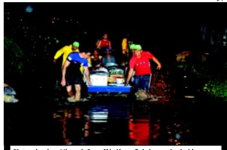
Rio transbordou e Várzea da Cruz e Sítio Abreu são bairros mais atingidos

Pela 1ª vez, os deficientes visuais poderão ouvir a narração dos desfiles do Grupo Especial na Sapucaí. Segundo a Secretaria Municipal de Turismo, o serviço de audiodescrição será gratuito e estará disponível no setor 13 do Sambódromo. Durante os desfiles, uma pessoa vai narrar ao vivo toda a passagem da escola, contando os detalhes de cada alegoria, das alas e dos enredos.