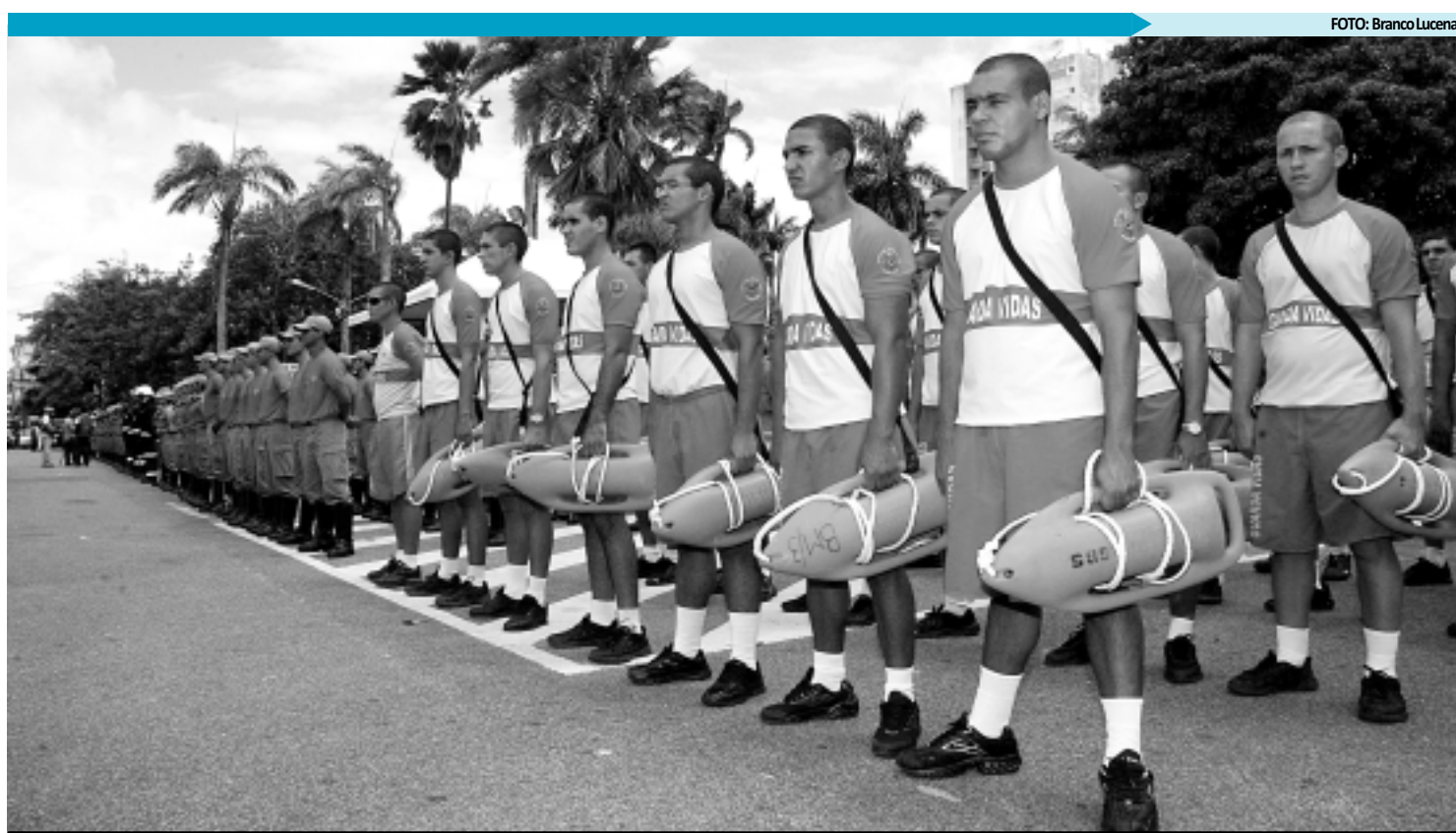
Os homens e mulheres do Corpo de Bombeiros estarão de guarda nas praias de Jacumã, Barra de Gramame, Praia Bela e Barra de Camaratuba

PULSEIRAS - Durante as prévias carnavalescas o Corpo de Bombeiros está distribuindo pulseiras para as crianças. Nessas pulseiras são colocadas informações dos pais ou responsáveis e os números de telefone, para facilitar a localização, caso as crianças se percam. Colocar uma pulseira dessas nas crianças pode ser uma boa dica também nas praias, que ficam lotadas nessa época do ano.