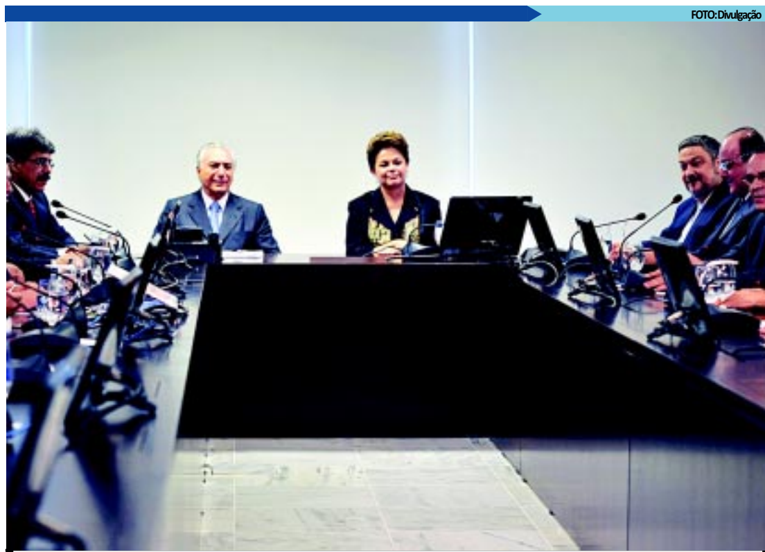
Dilma Rousseff e Michel Temer e líderes políticos na primeira reunião para a formação do Conselho do Governo