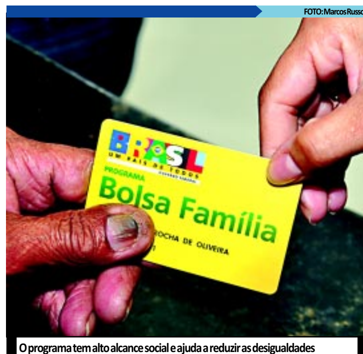
O programa tem alto alcance social e ajuda a reduzir as desigualdades

No Brasil, o impacto financeiro do reajuste é de R$ 2,1 bilhões e atenderá 12,9 milhões de famílias, cerca de 50 milhões de pessoas com renda mensal per capita de até R$ 140. O investimento no Programa Bolsa Família representa cerca de 0,4% do Produto Interno Bruto (PIB). De acordo com o Instituto de Pesquisa Econômica Aplicada (Ipea), cada R$ 1,00 investido no Bolsa Família aumenta em R$ 1,44 o PIB brasileiro.