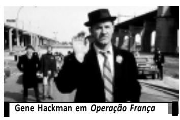
Gene Hackman em Operação França