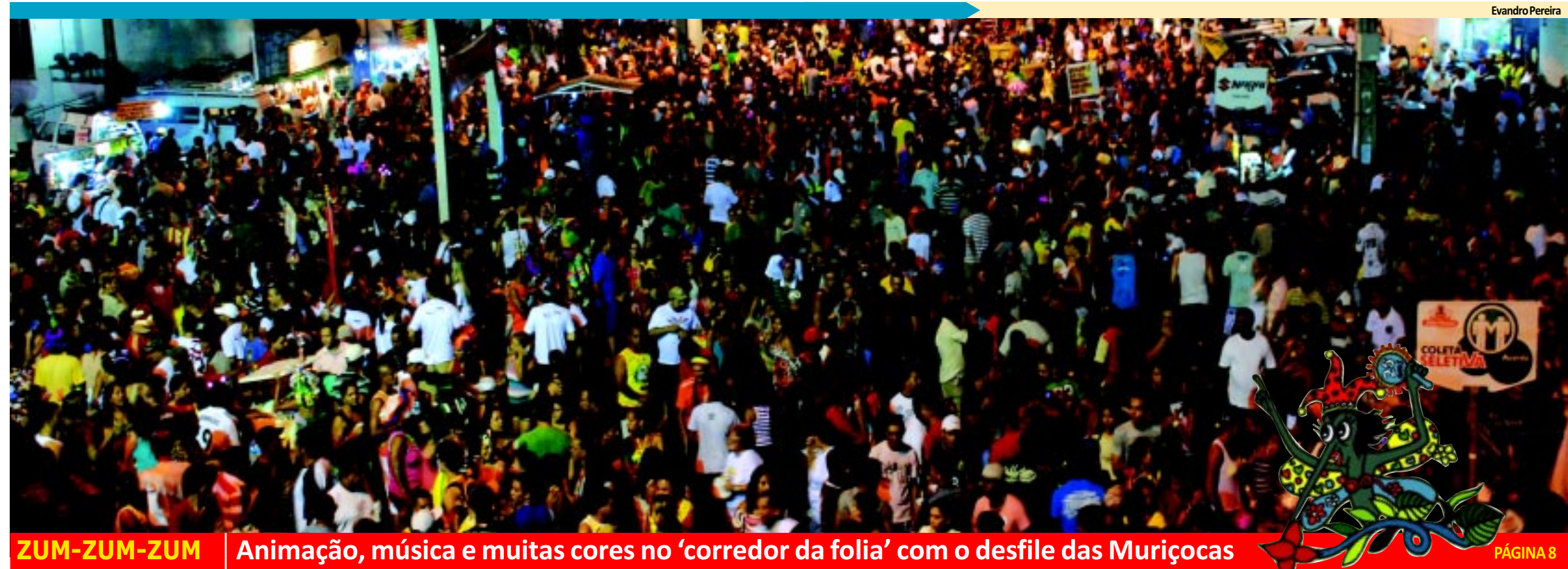
ZUM-ZUM-ZUM Animação, música e muitas cores no 'corredor da folia' com o desfile das Muriçocas PÁGINA 8