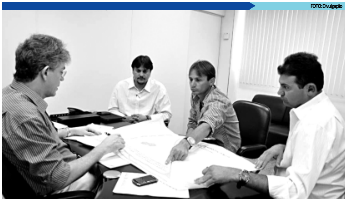
Governador Ricardo Coutinho recebe adesões e bancada conta agora com 19 aliados; os dois últimos são do PMDB

Para o vereador Hervázio Bezerra (PSDB), o ritmo ainda desacelerado entre os vereadores se deve em parte à proximidade do Carnaval. "Tão logo passe o período, eu espero que o presidente da Casa, Durval Ferreira, reúna os líderes dos partidos para definir as prioridades das comissões, em especial as mais cobçadas, como a de Legislação e Justiça", destacou.