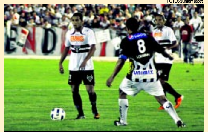
Lance do jogo entre São Paulo e Treze realizado no Amigão