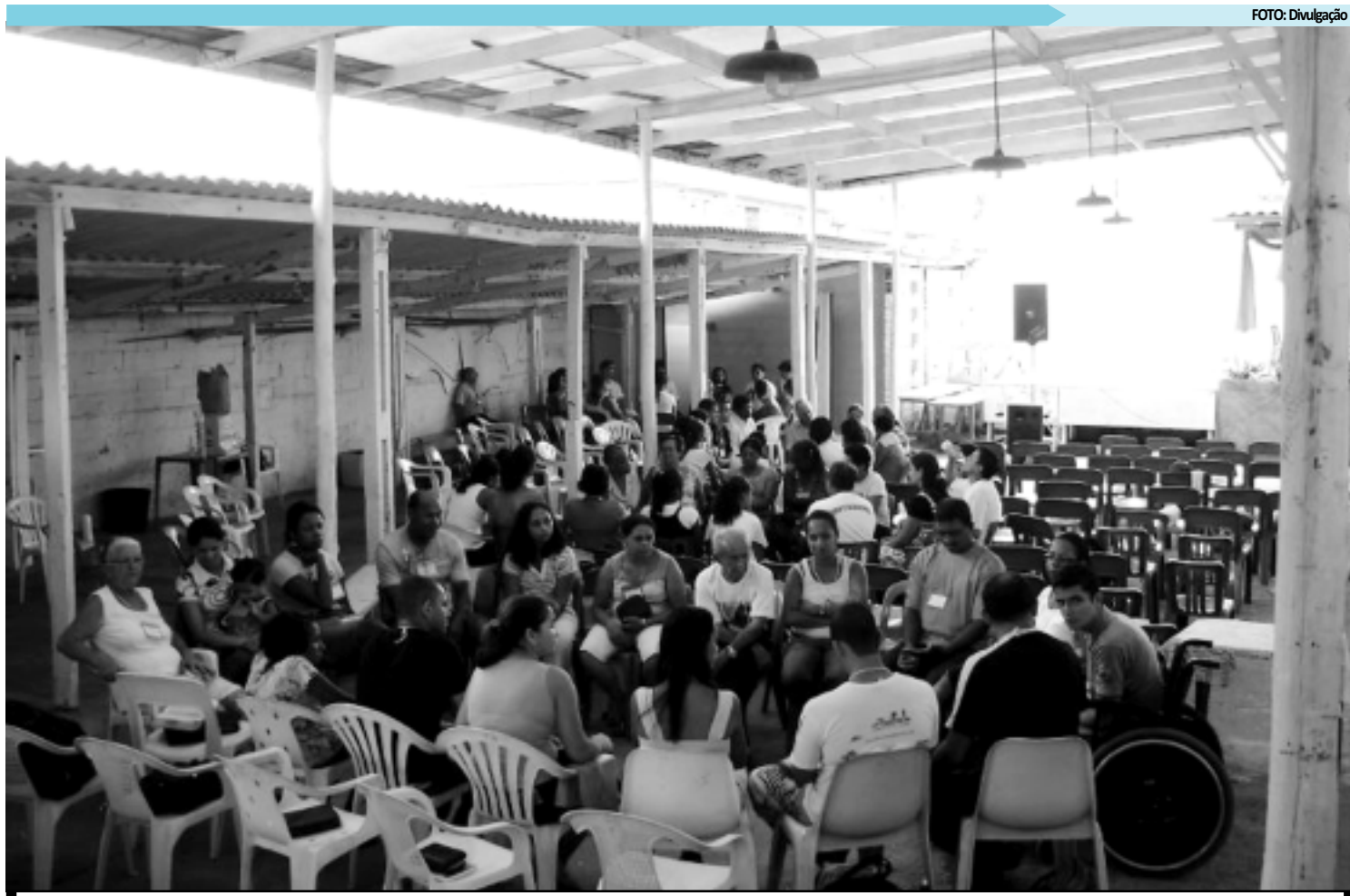
Para quem prefere a tranquilidade ao agito da folia, uma boa opção é participar de retiros espirituais oferecidos por diversas igrejas e religiões

É recomendado que os foliões optem por irem de táxi ou de ônibus para o local da folia, pois o trânsito normalmente fica complicado nas imediações das concentrações dos blocos. Por esse mesmo motivo, é recomendado para quem não vai curtir os blocos, que procurem caminhos alternativos, para não passarem perto das concentrações.