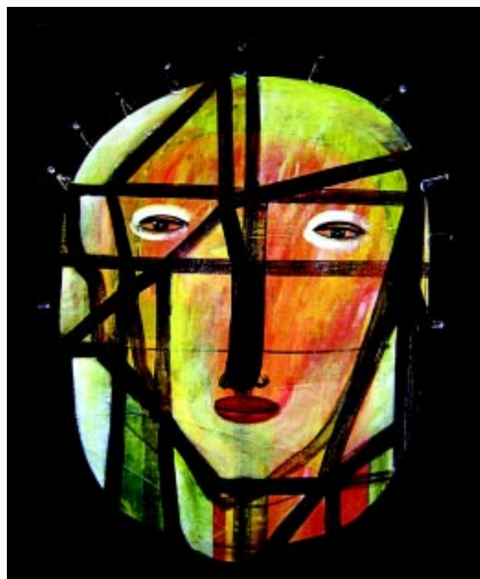
GAMELA Svendsen abre exposição PÁGINA 17