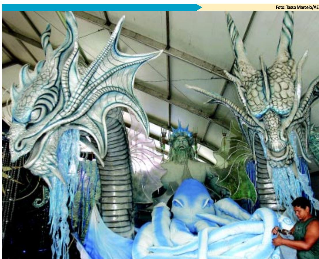
Escolas se preparam para espetáculo na Marquês

O Corpo de Bombeiros pretende garantir a segurança do folião que estiver nos 138 quilômetros de litoral e também nas regiões onde acontece o carnaval molhado. Todos os dias, 360 homens estarão de serviço. PÁGINA 11