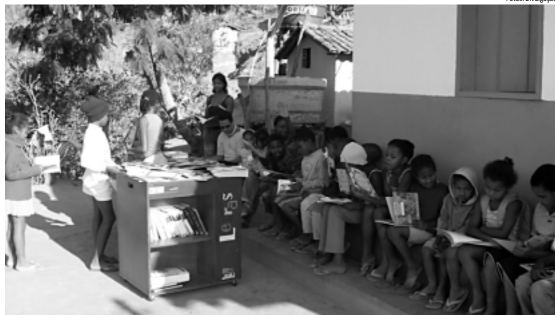
Crianças da zona rural participam de roda de leitura do Programa Arca das Letras

Parceria com o Governo Federal leva 32 bibliotecas para comunidades rurais da Paraíba. Utilização dos equipamentos será monitorada por voluntários residentes no campo