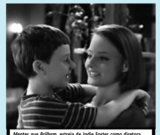
Mentas que Brilham, estreia de Jodie Foster como diretora

>>> MENTES QUE BRILHAM - O filme de estreia de Jodie Foster como diretora, conta a história de Fred Tate, um garoto de sete anos com inteligência acima da média e sérias dificuldades de relacionamento. Timido e solitário, o menino se vê afastado do convívio social. Como não consegue matricular o filho em escolas comuns, a mãe procura por uma instituição para crianças superdotadas, onde o menino participa de uma espécie de olimpíada para pequenos gênios e tem um desempenho notável, mas acaba agravando seu estado psicológico. SE LIGUE: Hoje, às 18h25, no Telceline Touch >>> A CIÊNCIA DO CINEMA - Os cinefilos pode acompanhar, no episódio de hoje, os modelos em três dimensões. Nar é transformado em boneco nos estúdios Gentle Giant (Homem de Ferro). Já os estúdios Zoic demonstram como criam os efeitos "vampirescos" da série "True Blood". SE LIGUE: Hoje, às 23h36, Discovery Science >>> NIKKI, O CÃO SELVAGEM - Um filme para matar a saudade. Nikki, o Cão Selvagem do Norte , produção de 1961, baseada no livro de James Oliver Curwood, mostra as aventuras de Andre Dupas e seu cão Nikki. Eles navegam por um rio que atravessa o Banff National Park. Mas a forte correnteza acaba virando a canoa os dois se eseparam. O cachorro enfrenta a natureza e gente cruel, Nikki terá de lutar para sobreviver. Mas como indica o título. SE LIGUE: Hoje, às 12h40, HBO Family