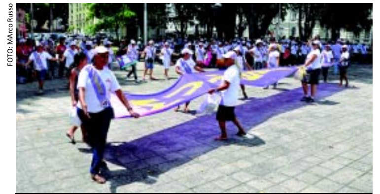
[FOTO&LEGENDA] Cerca de 400 pessoas participaram da sétima edição da Caminhada das Mulheres da Emlur, ontem, no Centro da Capital. O tema deste ano foi "Mulher: Histórias e Lutas". Durante a caminhada foram lembradas reivindicações em favor das mulheres.