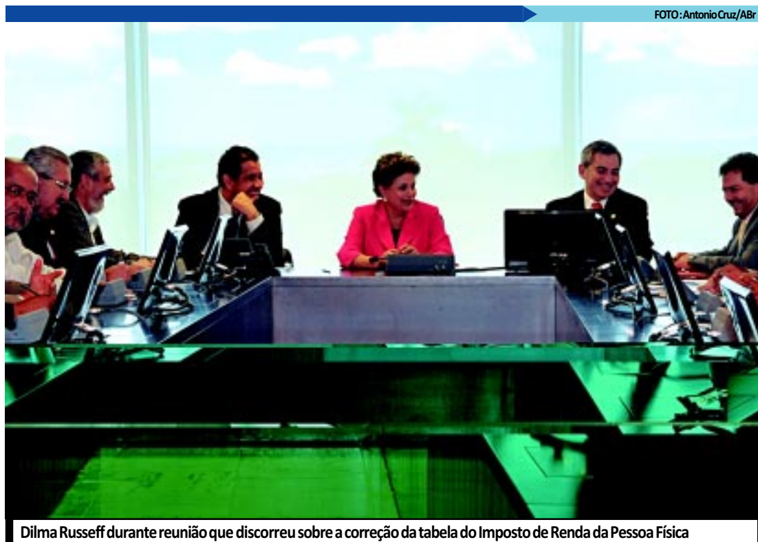
Dilma Rousseff durante reunião que discorreu sobre a correção da tabela do Imposto de Renda da Pessoa Física

Maia voltou a defender que o Executivo mande a proposta de reajuste da tabela do IRPF para Câmara como projeto de lei, e não como medida provisória, para permitir maior debate sobre o tema.