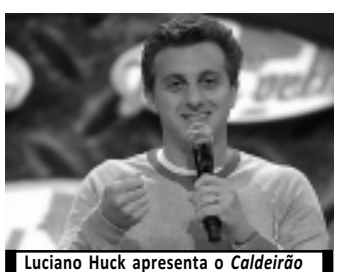
Luciano Huck apresenta o Caldeirão

06h05 - Globo Educação 06h25 - Globo Ciência 06h50 - Globo Ecologia 07h15 - Globo Universidade 07h40 - Ação 08h05 - TV Globinho 11h20 - Turma da Mônica 11h40 - Hannah Montana 12h05 - JPB - 1ª Edição 12h50 - Globo Esporte 13h20 - Jornal Hoje 13h50 - Estrelas 14h40 - Sessão de Sábado: O Auto da Compadecida 16h30 - Caldeirão do Huck 18h30 - Araguaia 19h15 - JPB - 2ª Edição 19h30 - Ti-ti-ti 20h30 - Jornal Nacional 21h10 - Insensato Coração 22h20 - Big Brother Brasil 11 22h45 - Zorra Total 23h45 - Supercine: Inimigo do Estado 01h55 - Altas Horas 03h57 - Flash Big Brother Brasil 11 04h02 - American Dad 04h25 - Corujão I