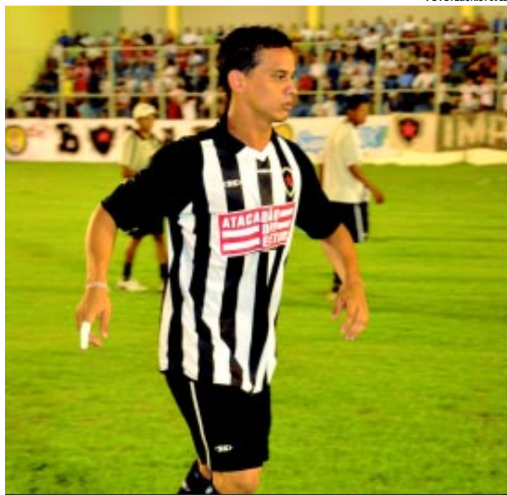
Peixinho entrou num acordo com o Botafogo e voltou para o Muricy