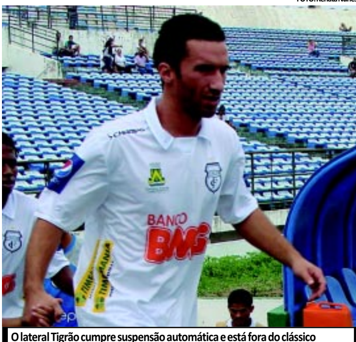
O lateral Tigrão cumpre suspensão automática e está fora do clássico