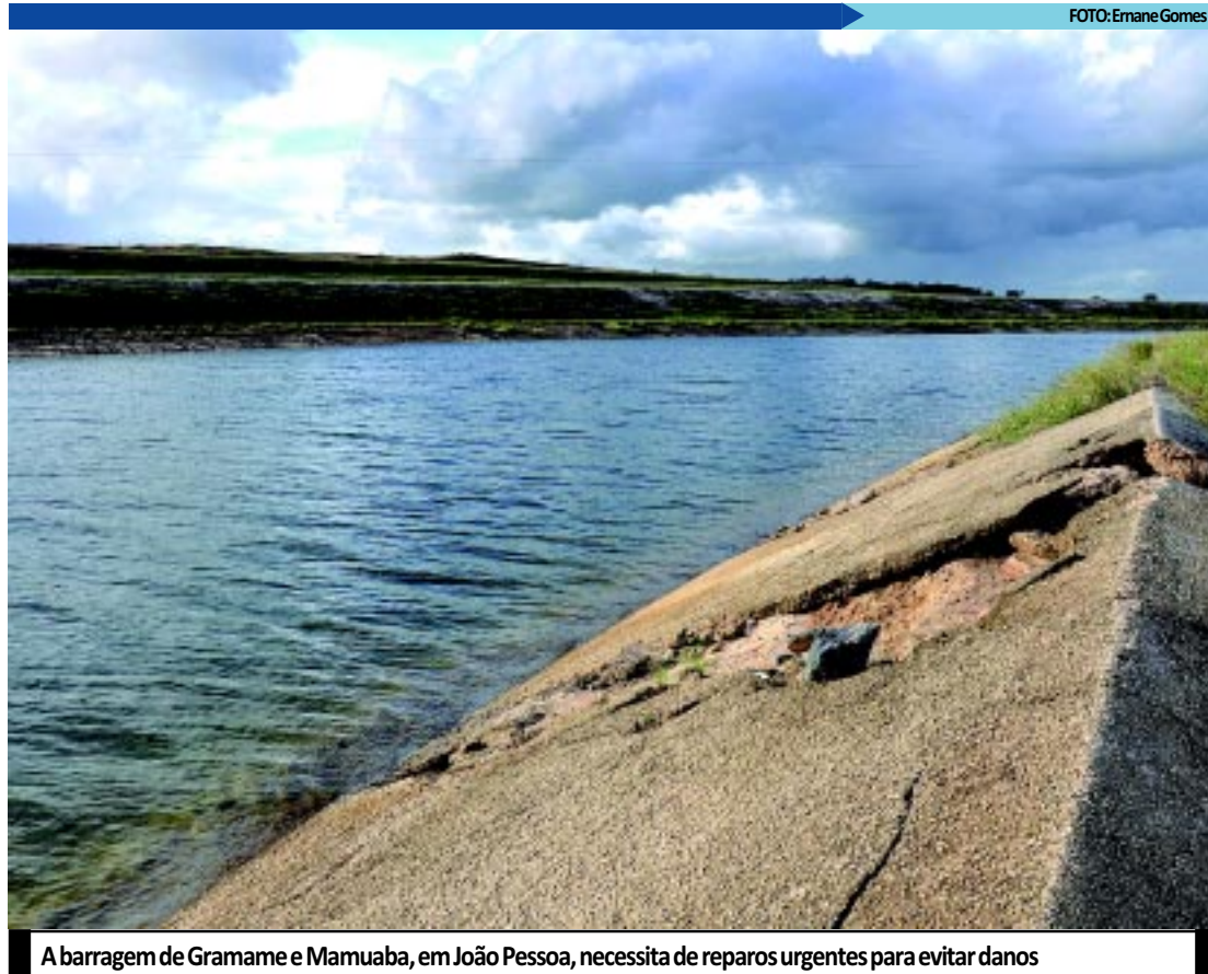
A barragem de Gramame e Mamuaba, em João Pessoa, necessita de reparos urgentes para evitar danos