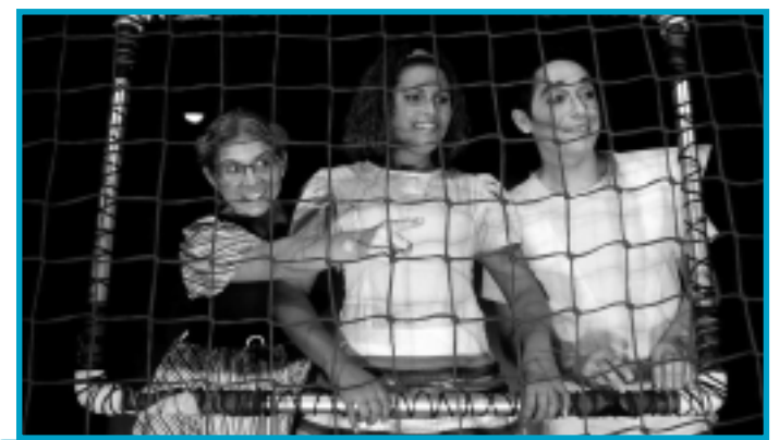
DO OUTRO LADO DA CHUVA

# Ainda em relação às comemorações pelo Dia Internacional da Mulher, duas exposições estão programadas para ter início no dia 17 deste mês: uma no Centro Cultural da Câmara e outra no Casarão 34, ambos localizado no Centro da Capital paraibana. No Centro Cultural acontece a exposição de trabalhos de várias mulheres fotógrafas que atuam na Paraíba, a ser coordenada pelo fotógrafo Ricardo Peixoto. Já o Casarão 34 prepara a exposição de artes Mulher. Na tarde do dia 17 de março, a Câmara também irá promover uma sessão solene em homenagem às mulheres.