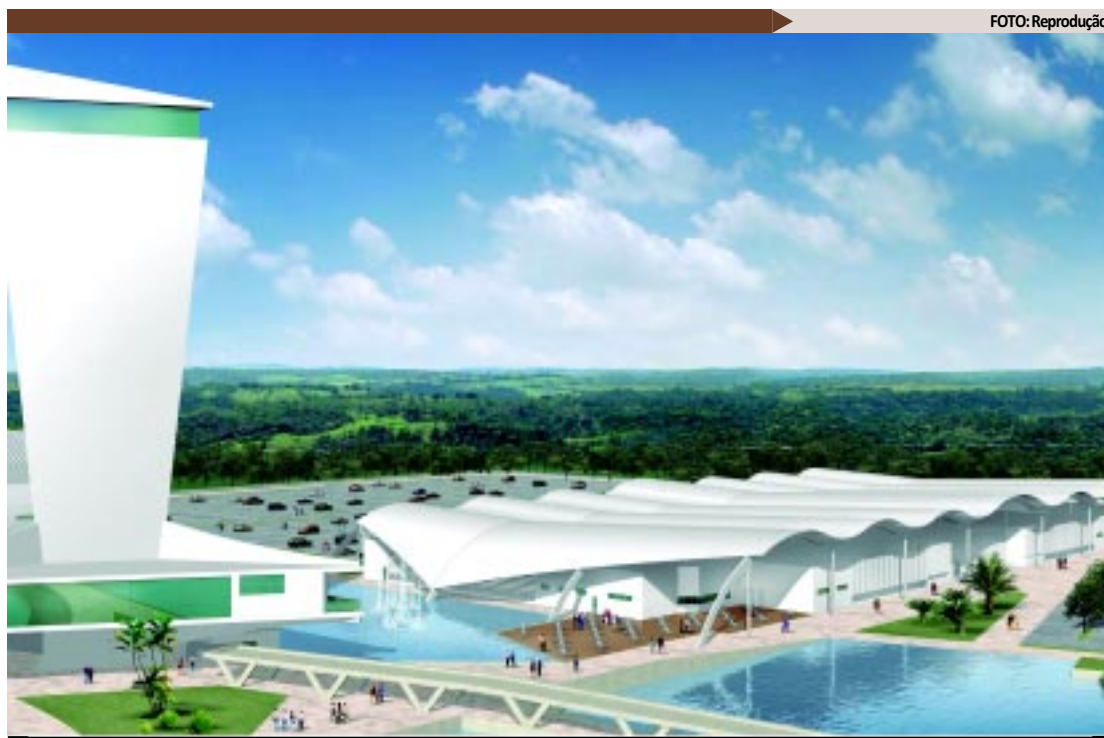
Maquete eletrônica dá uma ideia de como ficará a estrutura do Centro de Convenções da Paraíba, quando pronto

O Centro de Convenções ainda inclui a construção de teatro e de auditório para a realização de congresso. A previsão é que o projeto seja totalmente concluído em 30 meses. Ou seja, até o início de 2013.