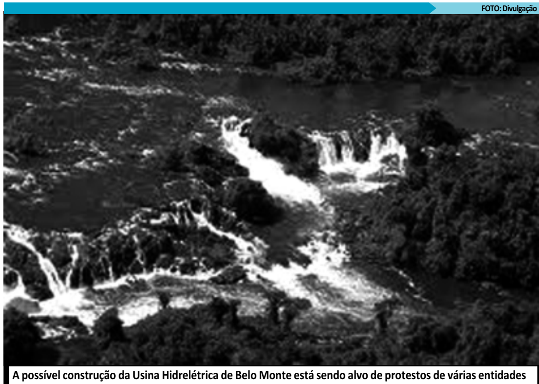
A possível construção da Usina Hidrelétrica de Belo Monte está sendo alvo de protestos de várias entidades

A exposição será instalada na Sala Visconde de São Leopoldo, da Faculdade de Direito do Largo São Francisco da Universidade de São Paulo (USP), e ficará aberta ao público nos dias 18 e 19 de maio. Esta será a primeira atividade do projeto Marcas da Memória, que seleciona iniciativas de entidades sociais de todo o Brasil voltadas para a organização de eventos culturais que contribuam para o resgate da memória dos anos de repressão no país.