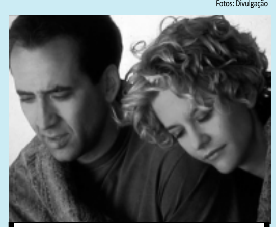
Nicolas Cage e Meg Ryan numa cena de Cidade dos Anjos

>>> CIDADE DOS ANJOS - Uma cirurgia fica arrasada quando perde um paciente durante uma operação. O anjo que estava na sala de cirurgia começa a se sentir atraído por ela. Ele se apaixona pela médica e resolve ficar visível para ela, o que provoca uma atração cada vez maior entre os dois. O anjo não sente calor, nem o vento no rosto, o gosto de uma fruta ou o toque da sua amada, assim ele cogita em deixar de ser um imortal para poder amar e ser amado intensamente. SE LIGUE: Hoje, às 13h45, no HBO Plus