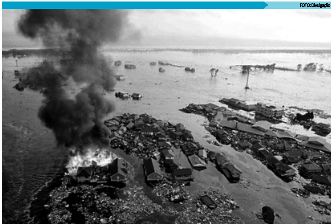
Água provocada pelo tsunami arrastou casas e causou destruição após o terremoto na costa leste do Japão

Em Sendai, uma das cidades mais atingidas, edifícios ficaram em chamas, o aeroporto, no distrito de Miyagi, foi fechado depois de ser inundado com carros e demais veículos que estavam nos arredores durante o tremor, e as estradas ficaram repletas de lamas. O governo enviou barcos da Força Naval do país para a área.