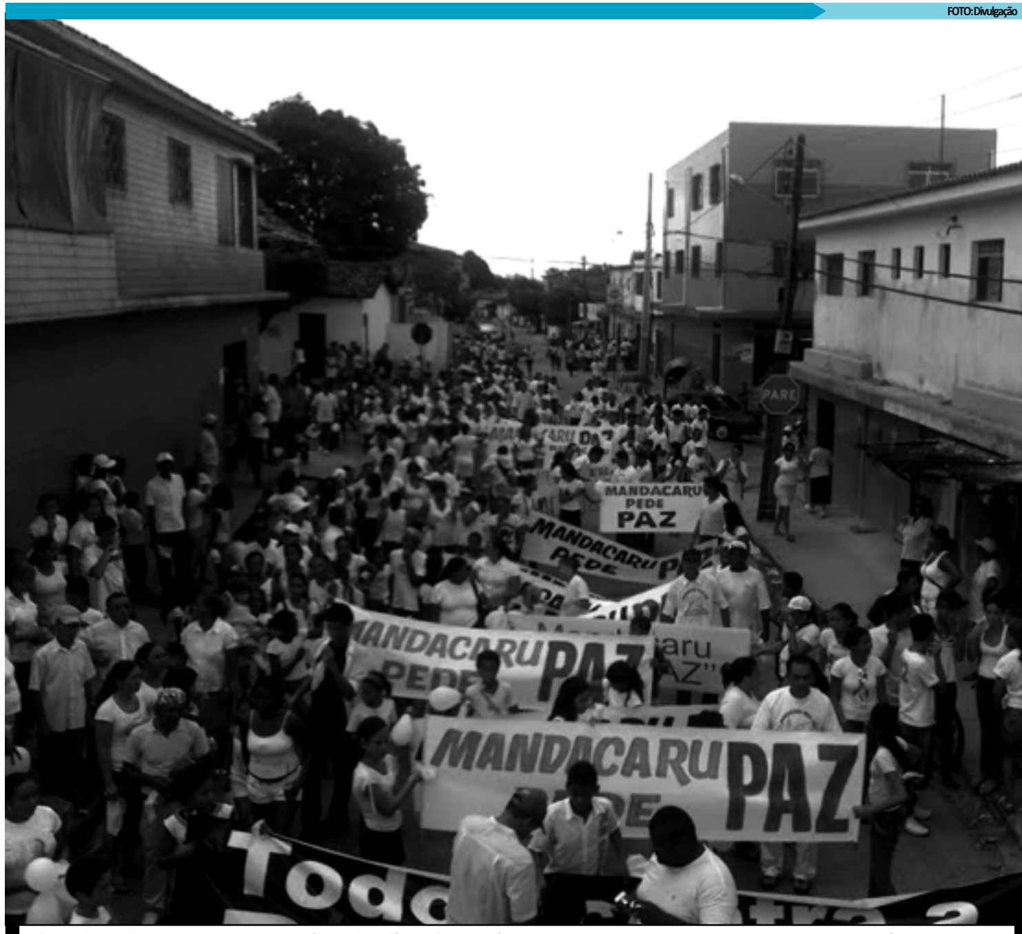
O bairro de Mandacaru, em João Pessoa, tem índice de violência elevada até mesmo para patamares nacionais. Moradores pedem paz na área

"O Bairro sem Medo vai exigir políticas públicas para o combate da violência não apenas em Mandacaru, bem como em outras regiões do Estado. Vamos exigir também que as empresas façam pro-