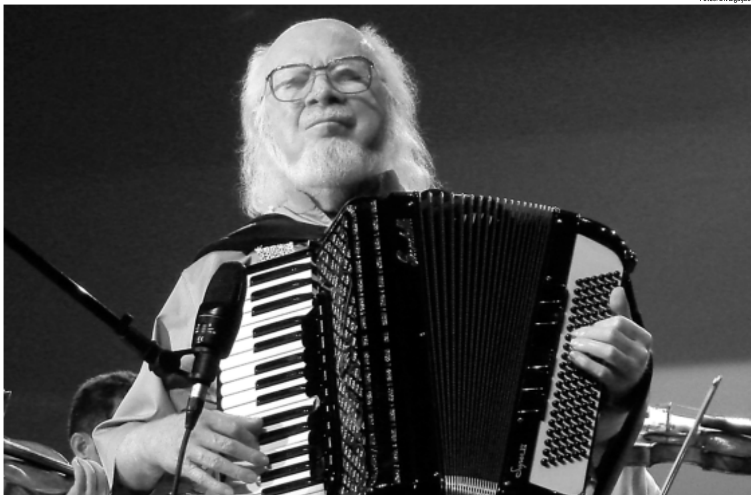
Composições do mestre sanfoneiro Sivuca (foto) estão no repertório do grupo Choramigo, assim como Pixinguinha, Ernesto Nazareth e outros bambas