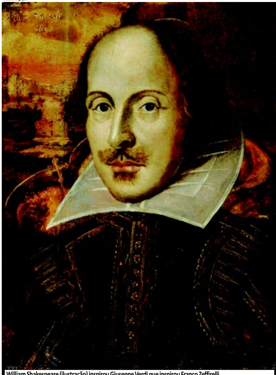
William Shakespeare (ilustração) inspirou Giuseppe Verdi que inspirou Franco Zeffirelli

Otello marca a maturidade de Giuseppe Verdi e exige grandes intérpretes.