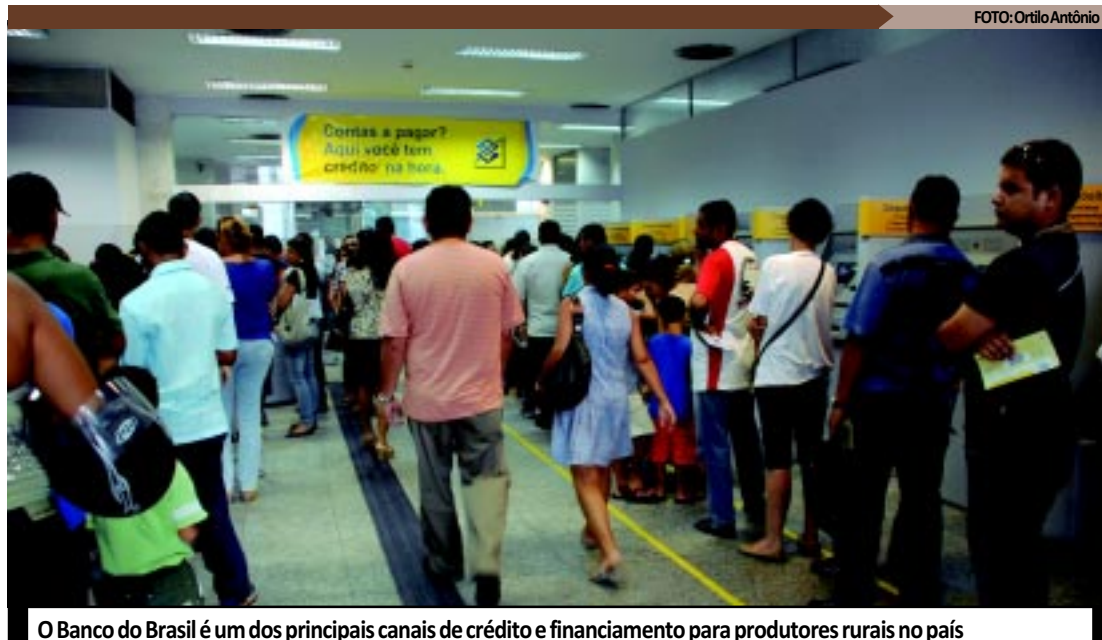
O Banco do Brasil é um dos principais canais de crédito e financiamento para produtores rurais no país

até 12 de junho os produtores rurais devem estar com suas propriedades em situação ambiental regularizada. Essa regularização pode ser feita por meio da averbação da reserva legal - fração da propriedade que não pode ser desmatada - ou por adesão ao programa Mais Ambiente, do Ministério do Meio Ambiente, de acordo com o Decreto 7.029/2009. O Banco do Brasil é um dos principais canais de crédito e financiamento para produtores rurais no país.