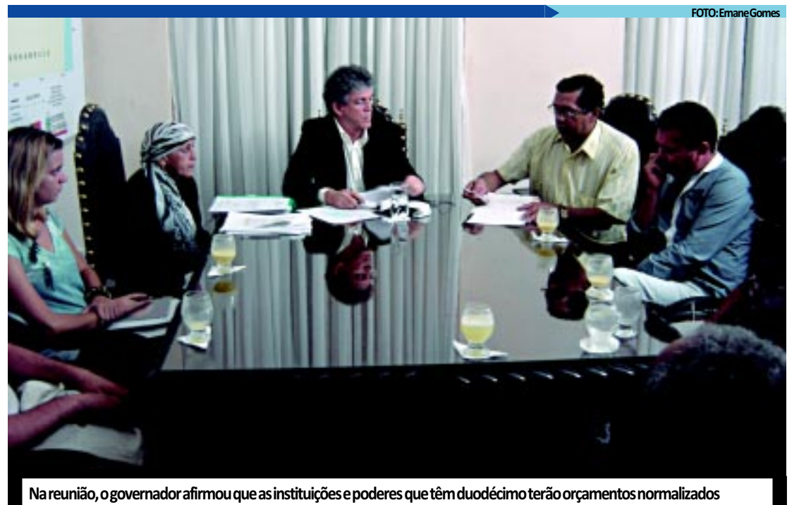
Na reunião, o governador afirmou que as instituições e poderes que têm duodécimo terão orçamentos normalizados