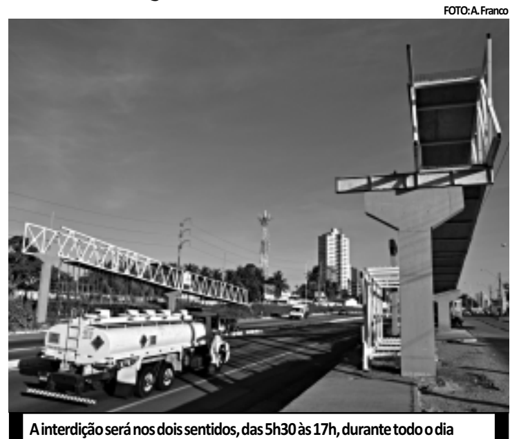
A interdição será nos dois sentidos, das 5h30 às 17h, durante todo o dia

Esta semana os serviços estão concentrados na instalação das rampas laterais, que darão suporte para a montagem da parte aérea que liga os dois sentidos da BR-230. A parte aérea da passarela está sendo montada no solo, inclusive a concretagem do piso e as proteções laterais. A estrutura será