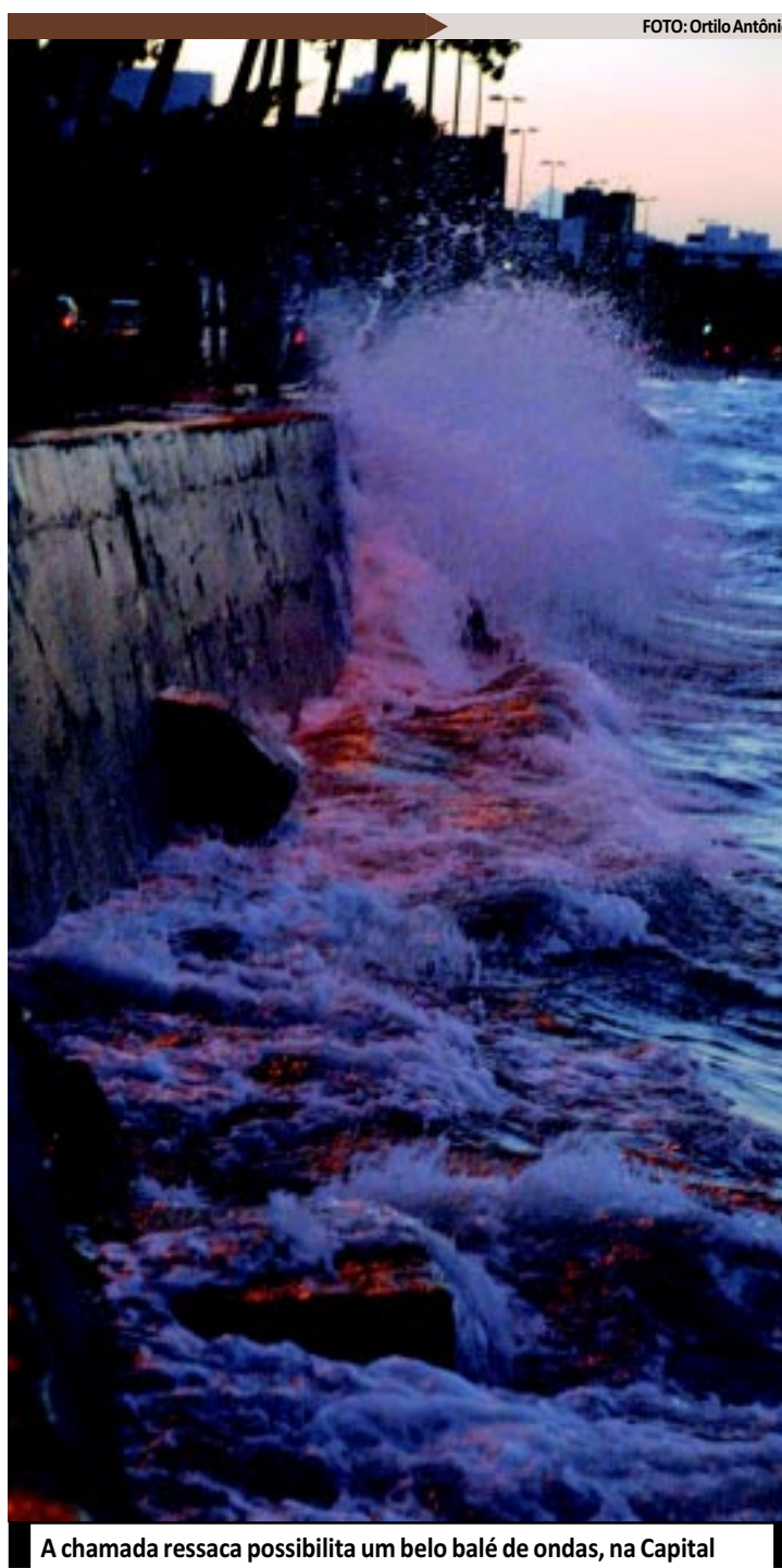
A chamada ressaca possibilita um belo balé de ondas, na Capital

Para algumas pessoas, a elevação da maré em 2,8 metros é um fenômeno que acontece anualmente devido à conformação da terra, da lua e do sol. Contudo, a maré alta deste final de semana, segundo o astrônomo Marcos Jerônimo, a lua de hoje terá influência direta no fenômeno marítimo. "As marés são provocadas pela influência das luas. Neste sábado, a lua estará mais próxima da Terra - a uma distância de