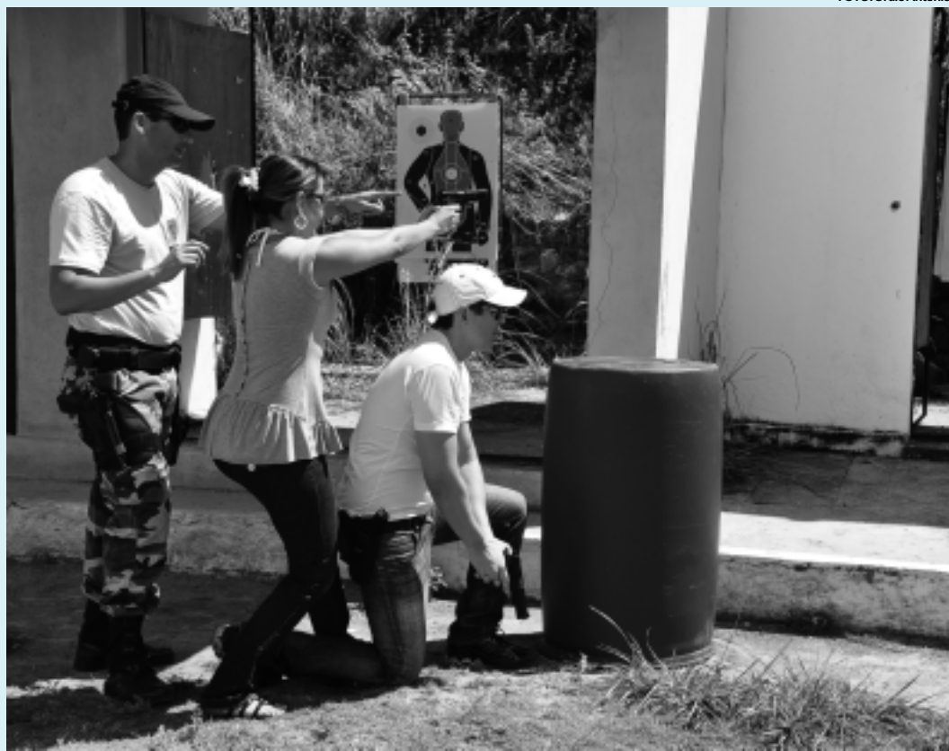
Ontem, vinte policiais participaram de treinamento de tiro, dentro do curso de Tática e Abordagem