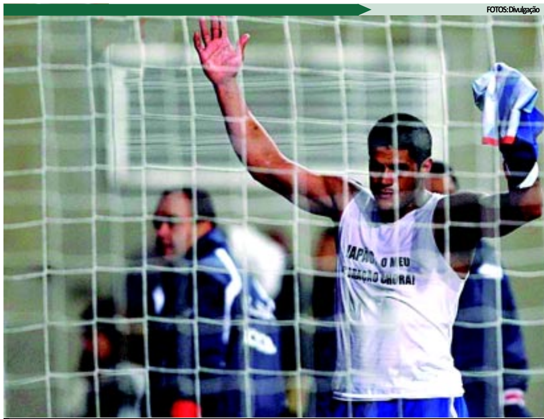
Hulk atravessa grande fase no clube do Porto e espera ser lembrado por Mano Menezes para a Copa América

"Foi um cruzamento com a intenção de que algum companheiro conseguisse tocar de cabeça. Tive sorte e a bola acabou entrando. Foi importante para nos dar tranquilidade para o restante da partida, contra um adversário muito difícil.