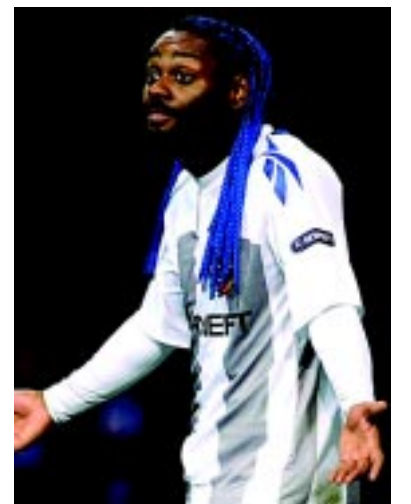
Wagner Love permanece no CSKA

nega é que continua em contato direto com o Flamengo. Em especial, com um jogador que não esconde que gostaria de vê-lo ao seu lado com a camisa rubro-negra: Ronaldinho Gaúcho.