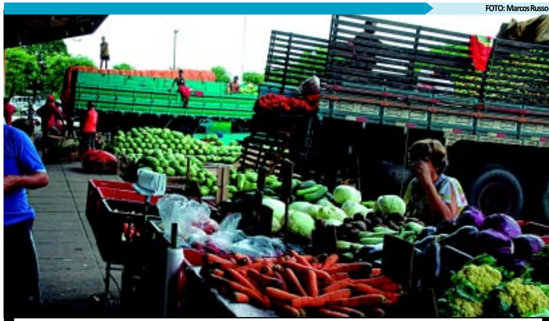
A comercialização de frutas e verduras a preços baixos faz parte das ações desenvolvidas pela Empasa

RETOMADA DE PROGRAMAS —O diretor ressaltou a importância da retomada de antigos programas como Programa de Segurança Alimentar e Nutricional da Empasa (Sane), antigo Sopão. O programa beneficia duzentas famílias na Capital e mais duzentas em Campina Grande, que recebem sopa e baião de dois. Dessas, 63 são atendidas com o Programa Pão e Leite da Fundação de Ação Comunitária (FAC), que tem a parceria da Empasa na distribuição do benefício.