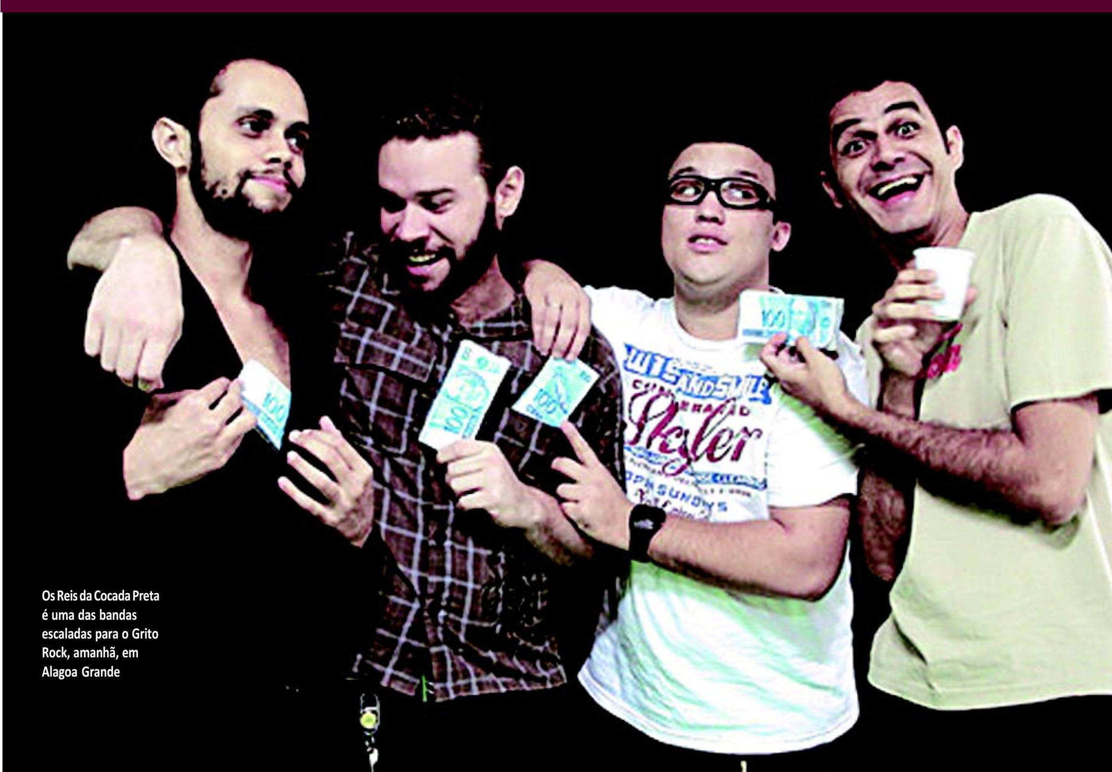
Os Reis da Cocada Preta é uma das bandas escaladas para o Grito Rock, amanhã, em Alagoa Grande