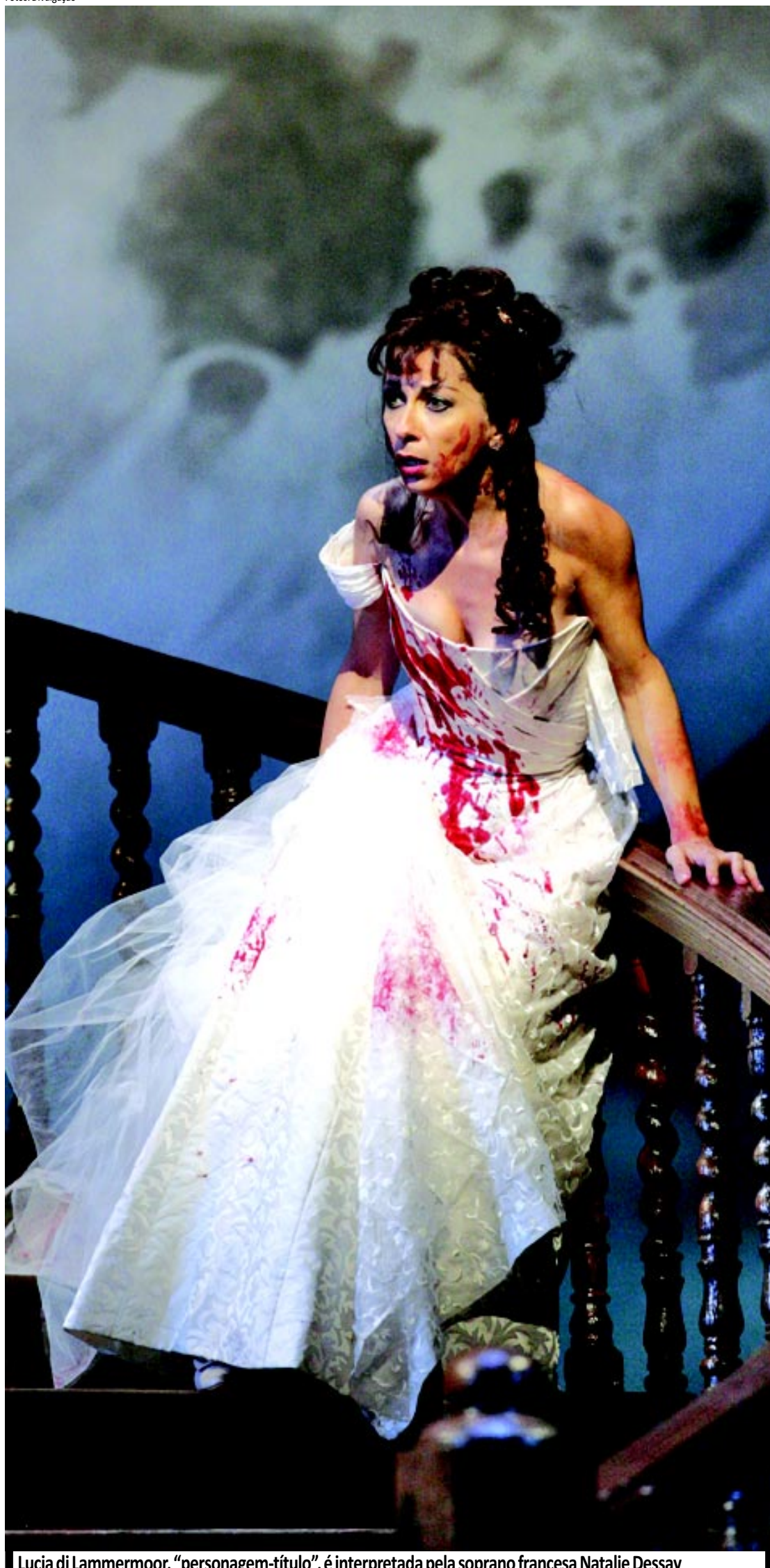
Lucia di Lammermoor, "personagem-título", é interpretada pela soprano francesa Natalie Dessay