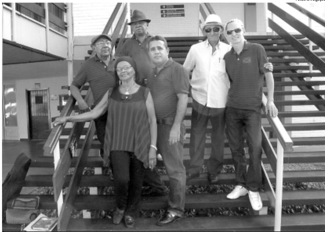
O Luar do Sertão homenageia o centenário do compositor Assis Valente, hoje, a partir das 12h, no Hotel Tambau

Para o Carnaval de 1934, Carlos Galhardo gravou a marcha 'Marcolina' e o samba 'Sinos da Penha'. Assis Valente vai se firmando no cenário artístico nacional e é reconhecido por Noel Rosa.