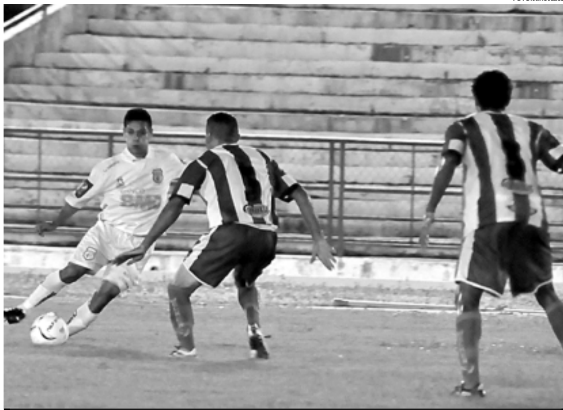
Na última quarta-feira, o Miramar foi goleado pelo Treze no estádio Amigão e permaneceu na lanterna

Na mesma situação do concorrente, a Desportiva Guarabira chega a Capital disposta a surpreender o lanterna e terminar a primeira fase com uma vitória. A expectativa da diretoria é fazer novas contratações para a segunda fase da competição. Lamentando a falta de sorte na derrota para o Auto Esperte (1 a 0), na última quarta-feira, quando o time chutou três bolas na