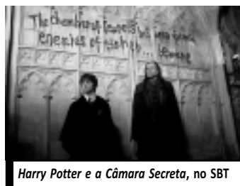
Harry Potter e a Câmara Secreta, no SBT

16h45 - Todo Mundo Odeia o Chris 18h45 - Record Kids 19h55 - Jornal da Correio - Edição da Noite 20h25 - Jornal da Record 21h15 - Série: CSI Investigação Criminal 22h15 - Novela: Ribeirão do Tempo 23h15 - Troca de Família 00h15 - Série: CSI Miami 01h15 - Programação IURD Obs. Programação sujeita à mudança