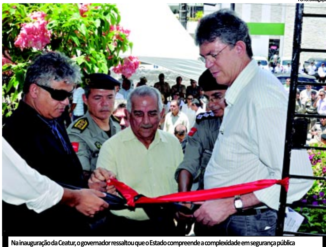
Na inauguração da Ceatur, o governador ressaltou que o Estado compreende a complexidade em segurança pública