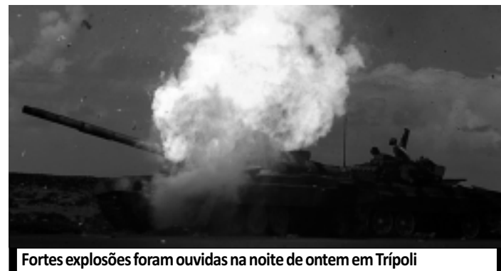
Fortes explosões foram ouvidas na noite de ontem em Trípoli

Como parte de sua viagem à América Latina,