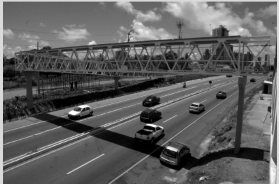
A estrutura superior da passarela da BR 230, em frente à Faculdade Asper, foi colocada no último domingo

Juntas, as duas passarelas possuem um percurso de 390 metros, sendo 170m a que estará à disposição da população no próximo dia 30 e