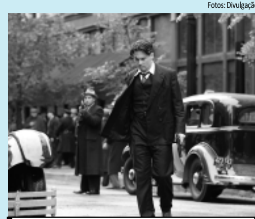
Johnny Depp é o bandido John Dillinger em Inimigos Públicos