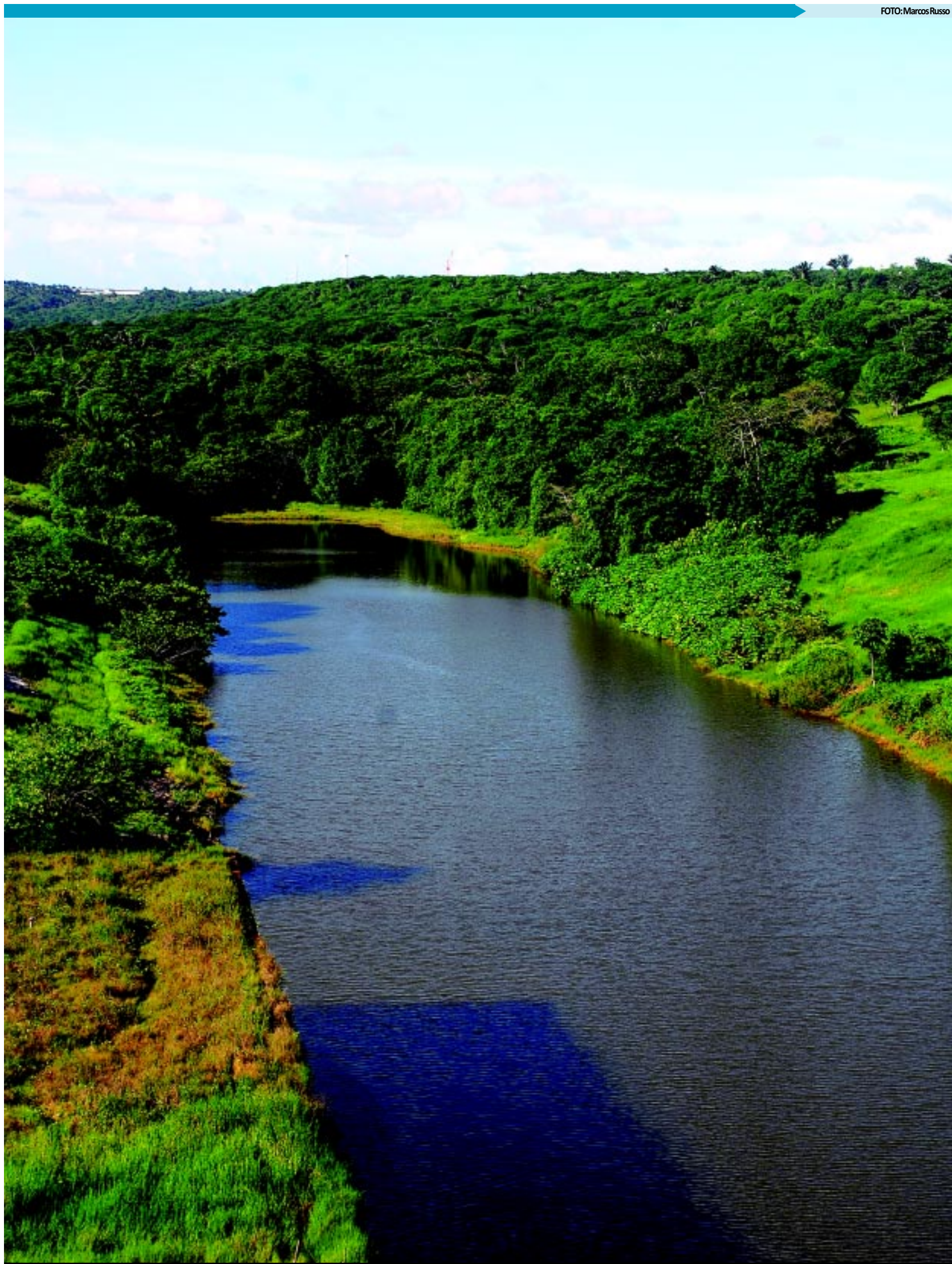
A Paraíba se mobiliza para debater a obra de integração do rio São Francisco, que irá beneficiar 120 municípios diretamente e 103 indiretamente

Na Paraíba, segundo última Pesquisa Nacional de Saneamento Básico divulgada pelo IBGE, até 2008 foram feitas cerca de 774.206 ligações de água e 234.418 ligações de esgoto. A Companhia de Água e Esgoto da Paraíba (Cagepa) administra sistemas de abastecimento de água de 219 municípios, dos 223 que compõem o Estado. Outros sistemas são administrados por prefeituras e por órgãos federais como o Dnocs.