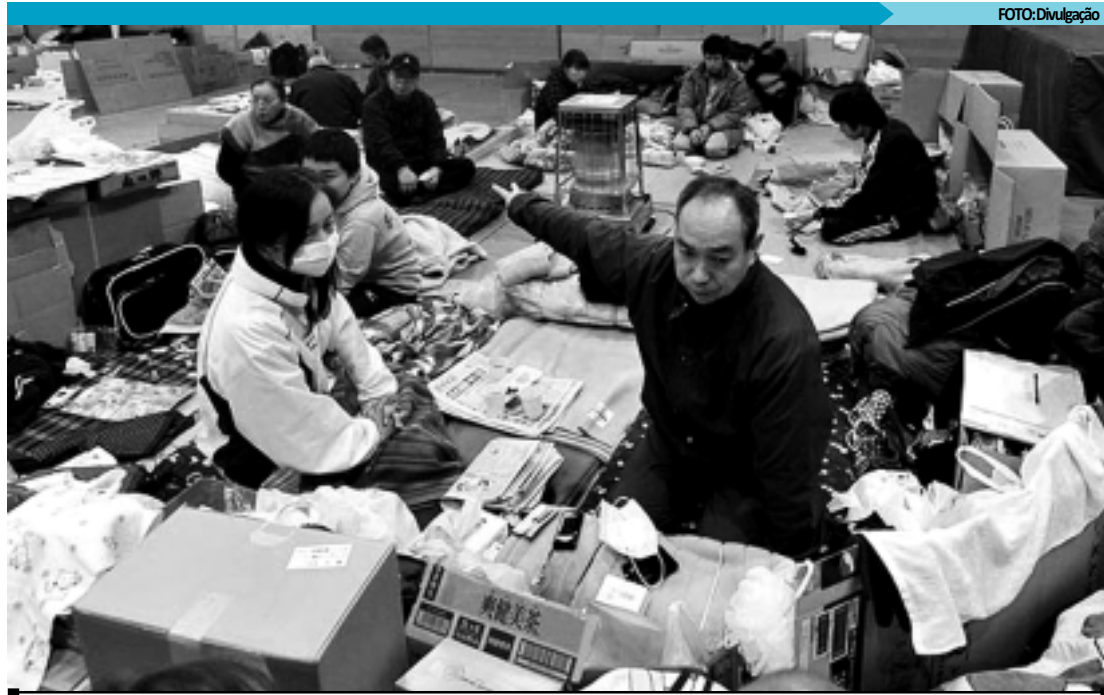
Dos 4,8 mil refugiados da cidade, cerca de 70% são pessoas que moravam muito próximo da usina nuclear

Centenas de milhares de pessoas tiveram de deixar suas casas e estão em centros para desabrigados.