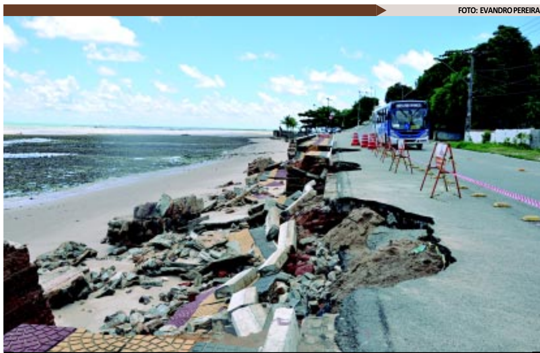
Nas proximidades da falésia do Cabo Branco, os sinais da erosão causada pelo avanço surpreendente do mar

Outras reformas naquela área serão feitas com base