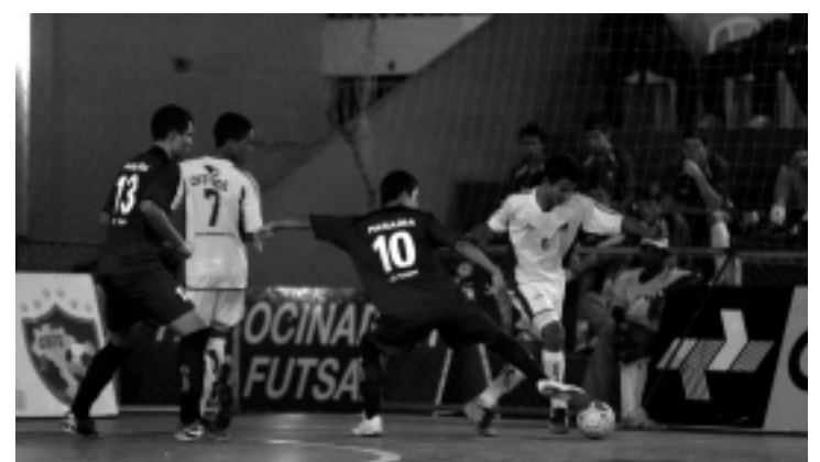
Paraíba se despede do Brasileiro perdendo para Minas Gerais

“Nosso objetivo era ficar na divisão especial e nós conseguimos isso. Já a classificação para as semifinais ficou prejudicada