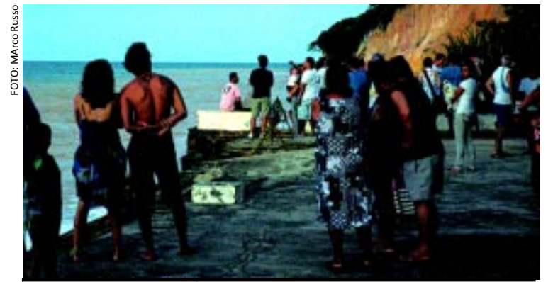
[FOTO&LEGENDA] A noite ainda não havia chegado, no último sábado, quando a lua surgiu no horizonte chamando a atenção de centenas de pessoas ao longo da orla de João Pessoa. Na chamada Praça de Iemanjá, um bom número de admiradores compareceu.