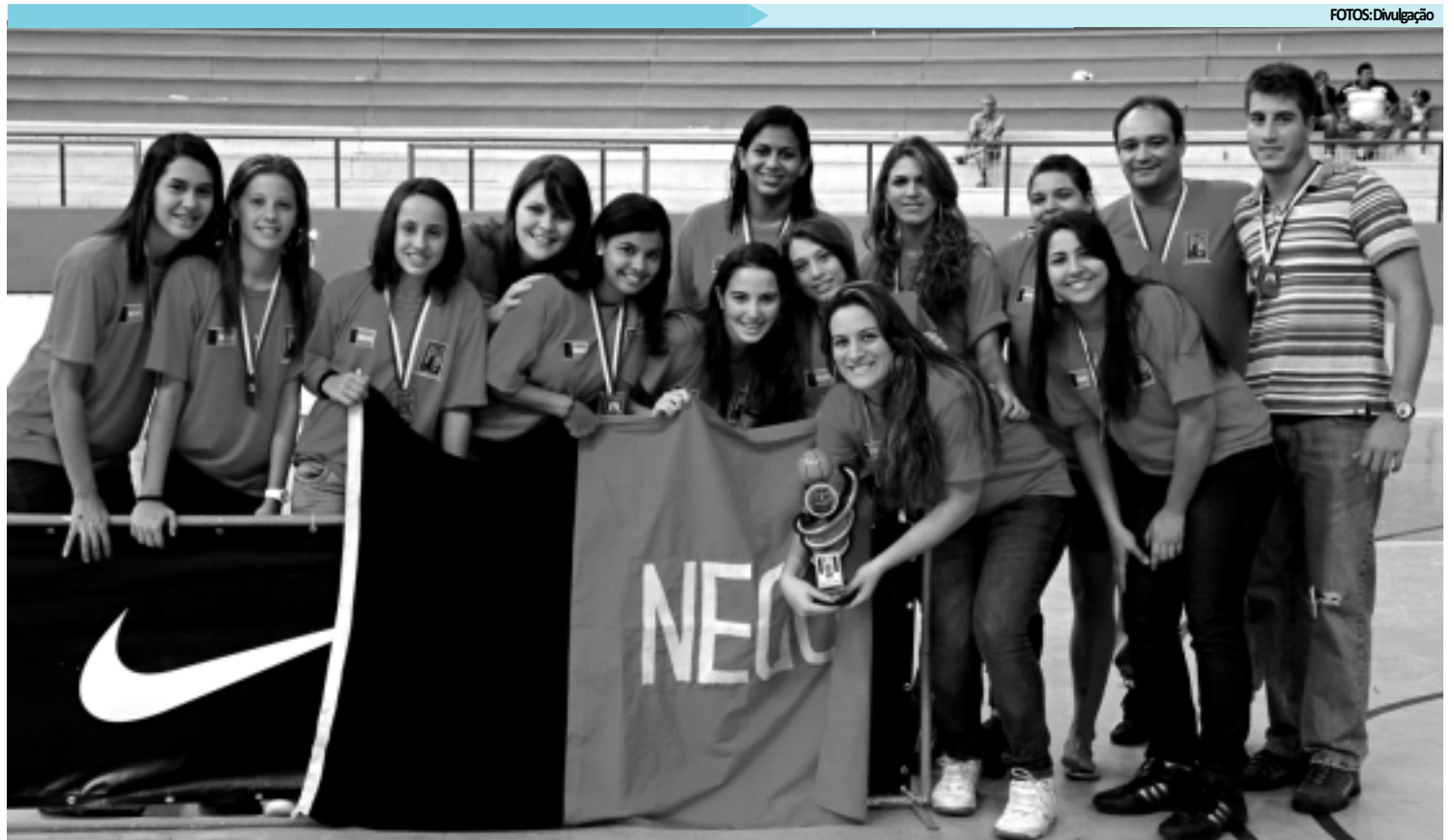
A equipe Sub-19 feminina da Paraíba ficou com a medalha de bronze no Brasileiro de Seleções Estaduais, disputado em Campina Grande

em Campina Grande servirá também como seletiva para a formação do ranking nacional. As duas primeiras equipes se classificam para a primeira divisão e as terceira e quarta vão para a segunda. As demais, ficarão na última.