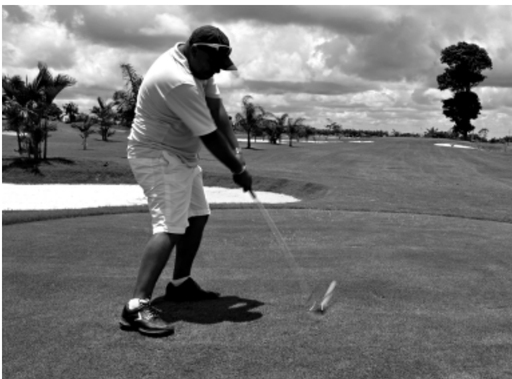
Campo de Golfe em Bananeiras é o primeiro da Paraíba e o oitavo no Nordeste

Bananeiras se transformou na capital do golfe na Paraíba. Isso porque, no último sábado, foi inaugurada o primeiro campo do esporte no Estado - e o oitavo em todo o Nordeste. Ele fica em um condomínio no município, mas é aberto ao público. No lançamento, foi realizado um torneio comemorativo que contou com a participação de quase cinquenta golfistas, de iniciantes aos já experientes na atividade.