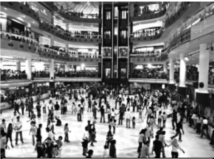
Só os manequins é que não compram no shopping