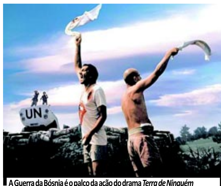
A Guerra da Bósnia é o palco da ação do drama Terra de Ninguém

O engajamento internacional se materializa na atuação da Unprofor das Nações Unidas, que investida em seu papel de defesa dos direitos humanos, buscando um desfecho pacífico, resolve, ingressar na questão. Mas, a burocracia kafkiana dessa máquina anti-bélica com seus conflitos internos de competências e segmentados interesses, só torna o impasse ainda mais confuso. Some-se a tudo isso, os diversos interesses