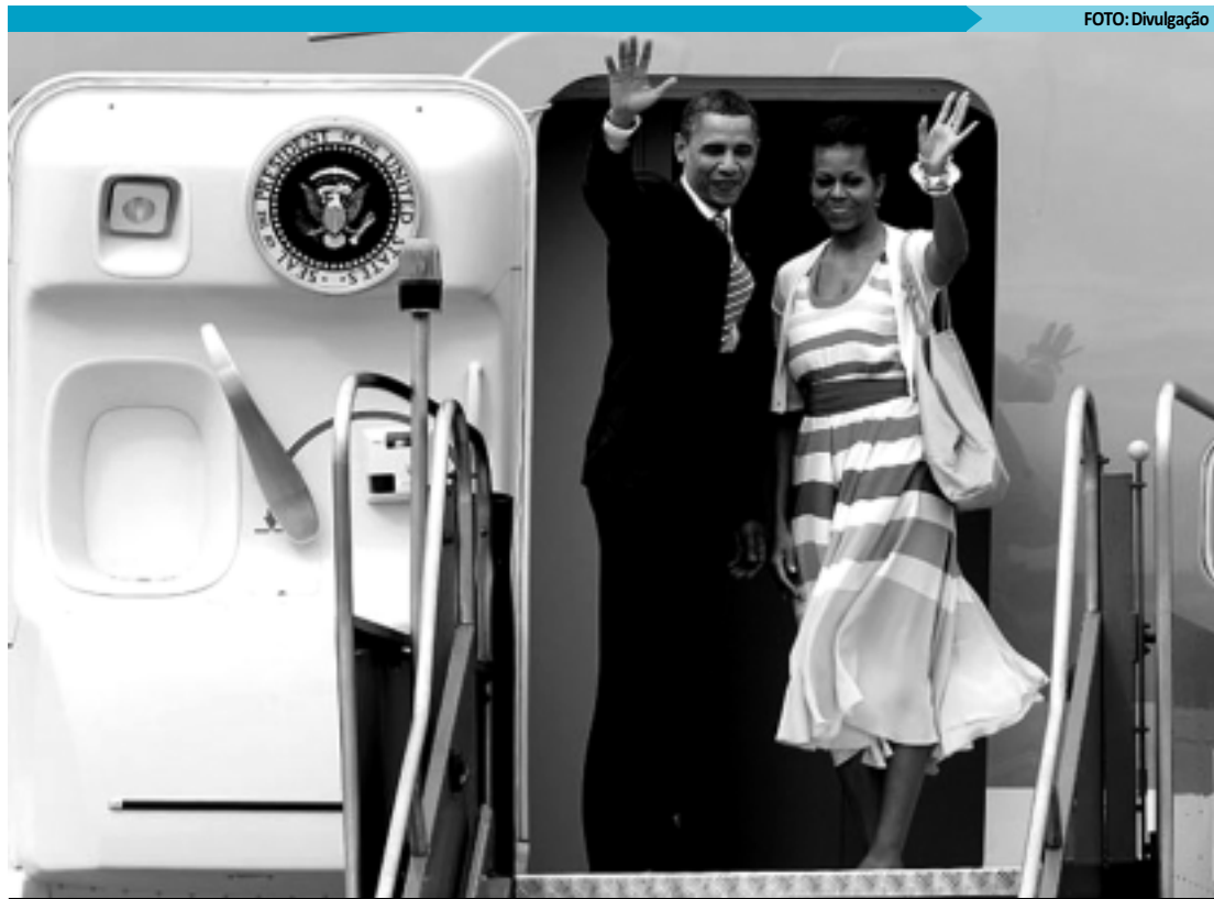
Obama se despediu dos brasileiros ao lado de Michele e prometeu ao governador do Rio retornar à cidade