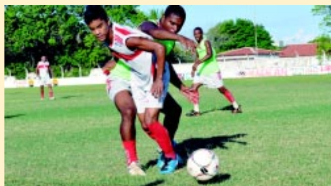
O Auto Esporte segue treinando para o seu próximo compromisso

Este ano, apenas o clássico Botafogo 0 x 2 Treze foi disputado no estádio Almeidão, além dos jogos Botafogo 3 x 1 Vitória e Botafogo 0 x 1 Caxias pela Copa do Brasil.