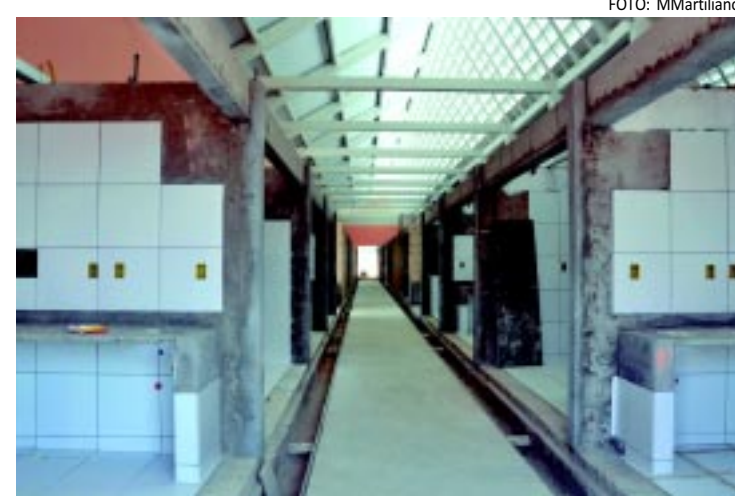
Todos os boxes do Galpão 2 estão em fase avançada de conclusão

Os galpões II e III vão abrigar 120 boxes para a comercialização de frangos, laticínios, peixe e carnes vermelhas. No momento, esses comerciantes estão acomodados