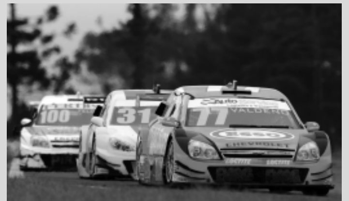
Valdeno não começou a temporada deste ano da Stock Car

“O meu carro e o do Nonô Figueirêdo estão com um ótimo acerto de suspensão, mas eles simplesmente não andam nas retas. Troca-