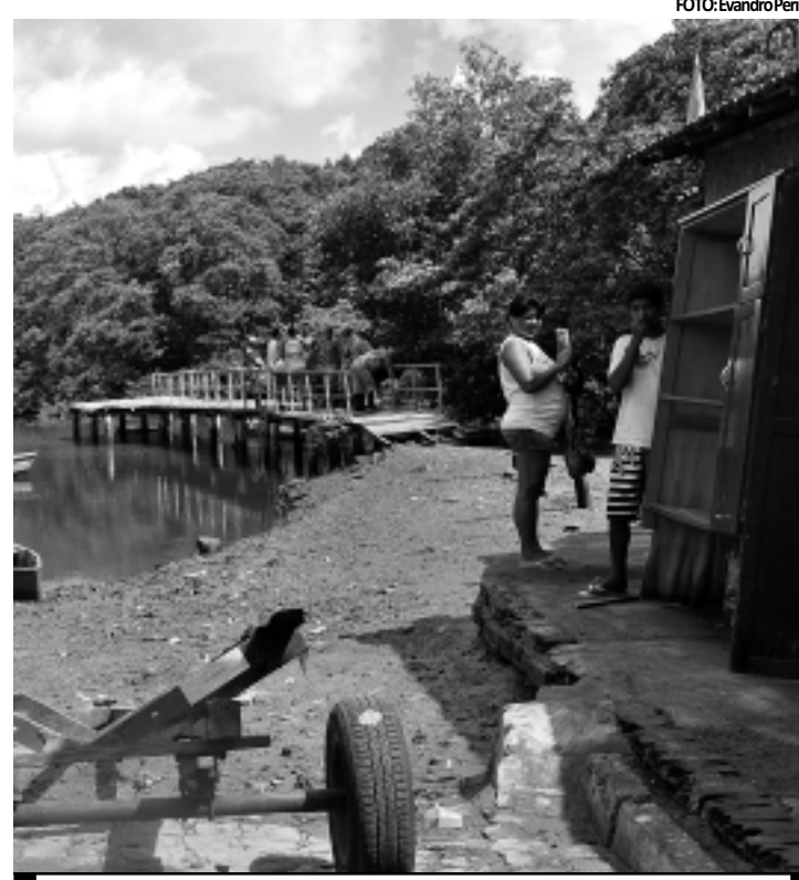
Bombeiros estiveram no Porto do Capim para procurar o corpo

O capitão explicou que o mais provável é que o menino de cinco anos já esteja morto, por causa das condições do desaparecimento. "Continuamos as buscas. Mas provavelmente encontraremos o corpo boiando