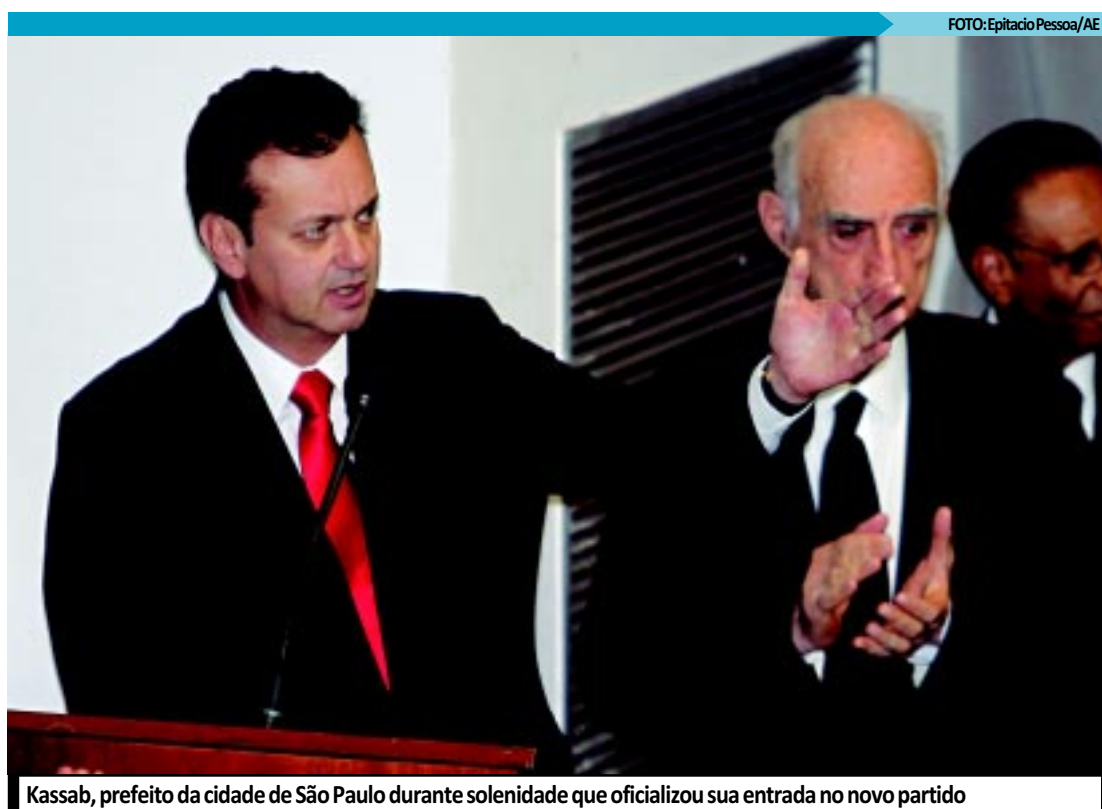
Kassab, prefeito da cidade de São Paulo durante solenidade que oficializou sua entrada no novo partido

Agora, a Secretaria da Administração deve abrir um prazo de cinco dias para que os ex-governadores apresentem suas contestações.