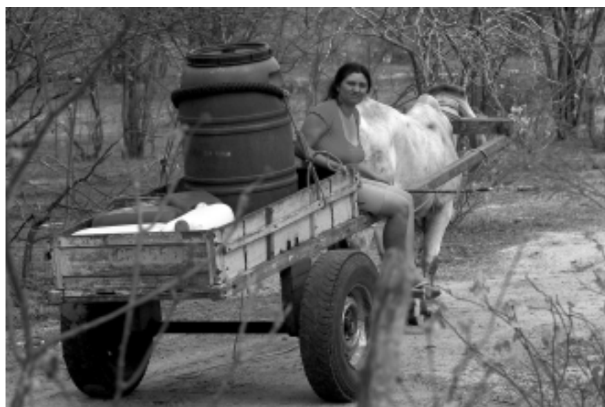
O risco de perder seu plantio, seus animais e consequentemente sua sobrevivência