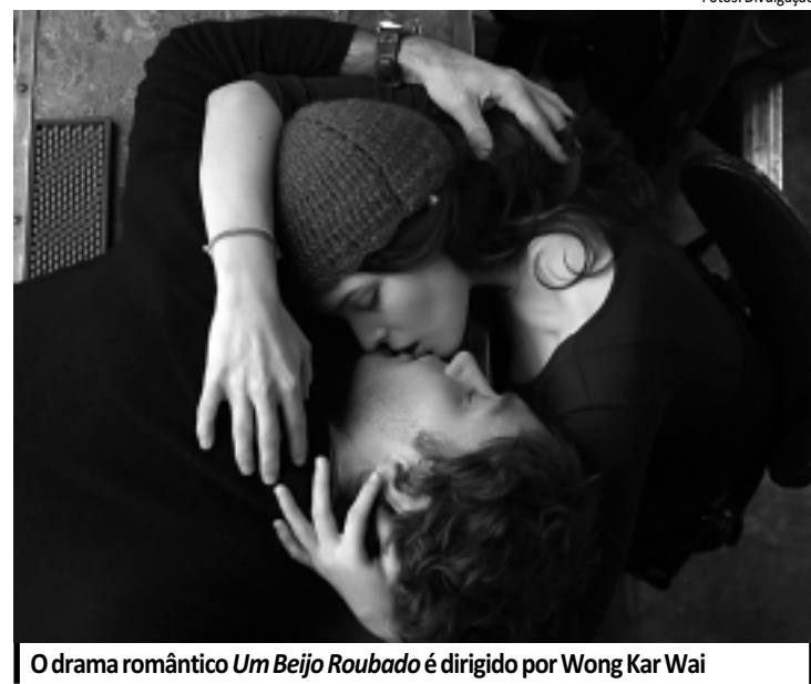
O drama romântico Um Beijo Roubado é dirigido por Wong Kar Wai