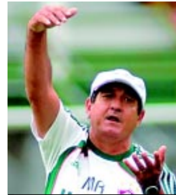
Muricy deve acertar com o Santos

ideia (sobre as férias) é estar preparado. Sou muito consciente do que faço, sei a responsabilidade que é ser um técnico de futebol. Precisa me convencer que o ambiente é muito bom. Porque eu peso muito isso. Isso pode mudar muito a minha maneira de pensar. É algo que me conquistou", disse o treinador em entrevista à Rádio Bandeirantes.