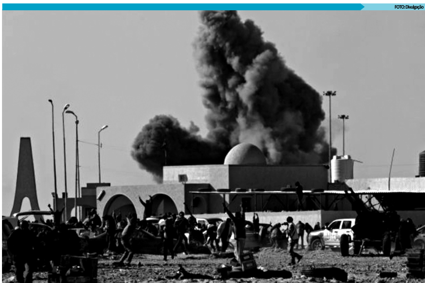
A aeronave líbia era um monomotor e foi derrubado pouco depois de pousar na cidade de Misrata, segundo informações da agência Associated Press

O comandante da aviação britânica que opera sobre a Líbia, o marechal Greg Bagwell, afirmou nessa quarta-feira (23), que a Força Aérea do coronel Muamar Kadafi "não mais existe como força de combate". Segundo o militar, os aliados operam agora quase "impunemente" sobre os céus do país do norte da África.