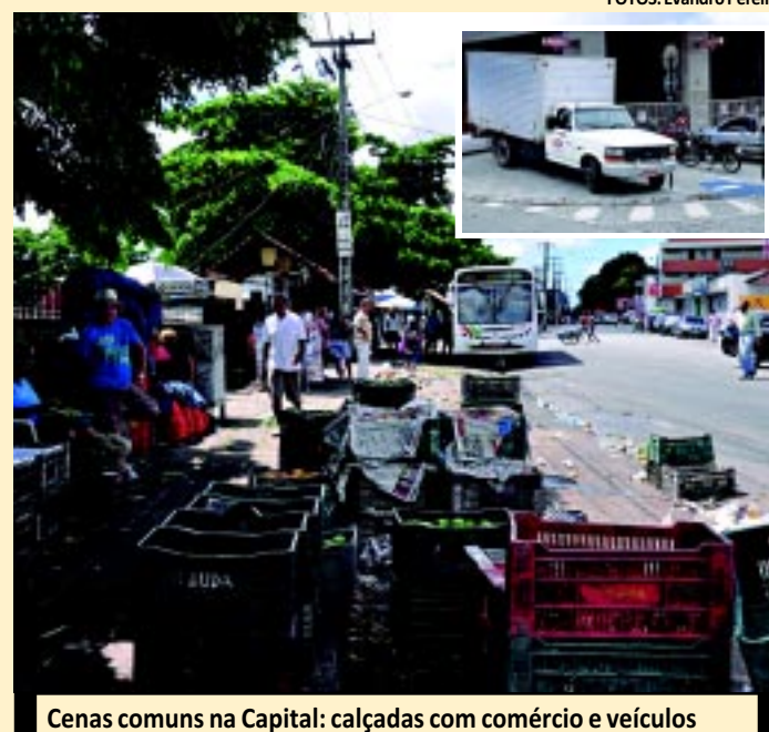
Cenas comuns na Capital: calçadas com comércio e veículos