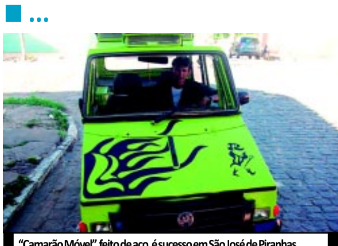
"Camarão Móvel", feito de aço, é sucesso em São José de Piranhas