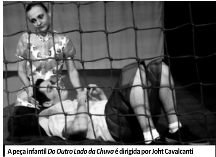
A peça infantil Do Outro Lado da Chuva é dirigida por Joht Cavalcanti

Na peça, duas crianças moram em seus respectivos apartamentos. E, como acontece com tantos outros garotos, em ambos imóveis existe telas de proteção. Apesar disso, elas experimentam a comunicação entre si, tentando fugir da solidão da cidade grande. Por serem filhos únicos, e tendo pouco espaço em casa, usam uma babá como elo para uni-los, podendo, assim, embora