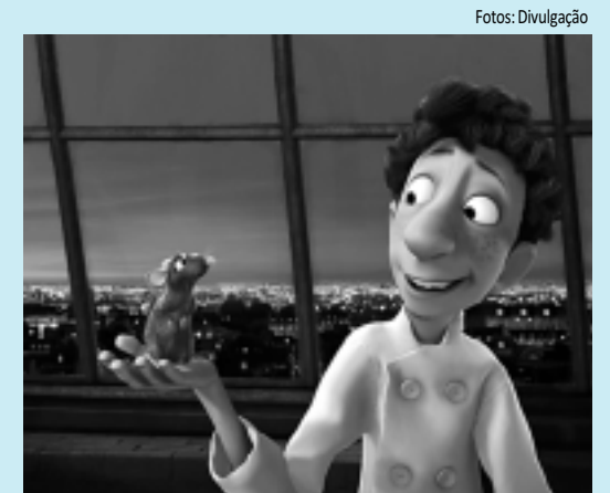
Ratatouille conta a história de Remy, um ratinho cozinheiro

>>> RATATOUILLE - Remy é um rato simpático que sonha em ser um grande chef, mas a família é contra a idéia, além do fato de que, por ser um rato, ele sempre é expulso das cozinhas que visita. O destino o leva a Paris e ele vai morar num beirão que fica embaixo de um famoso restaurante. Ele decide visitar a cozinha do lugar, onfr conhece Linguini, um ajudante atrapalhado que não sabe cozinhar. SE LIGUE: Hoje, às 17h15, no HBO Family