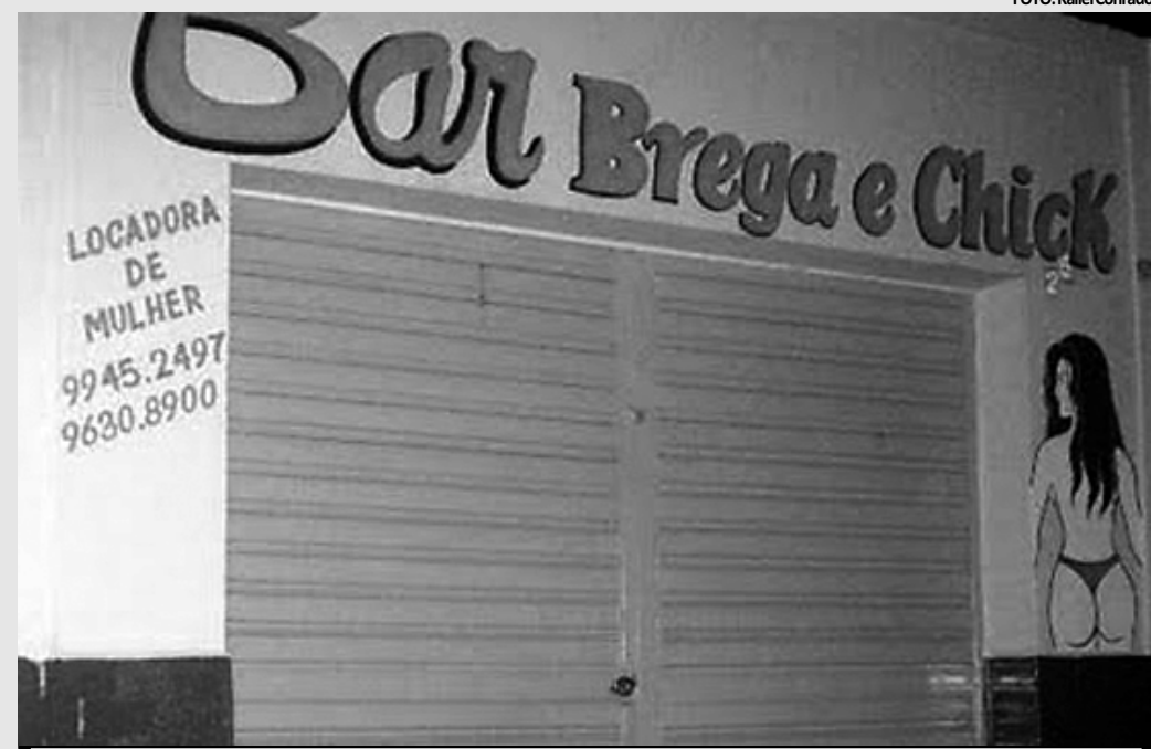
Proprietária disse que as mulheres oferecidas são de PE; ela só poderá ser punida após inauguração do local