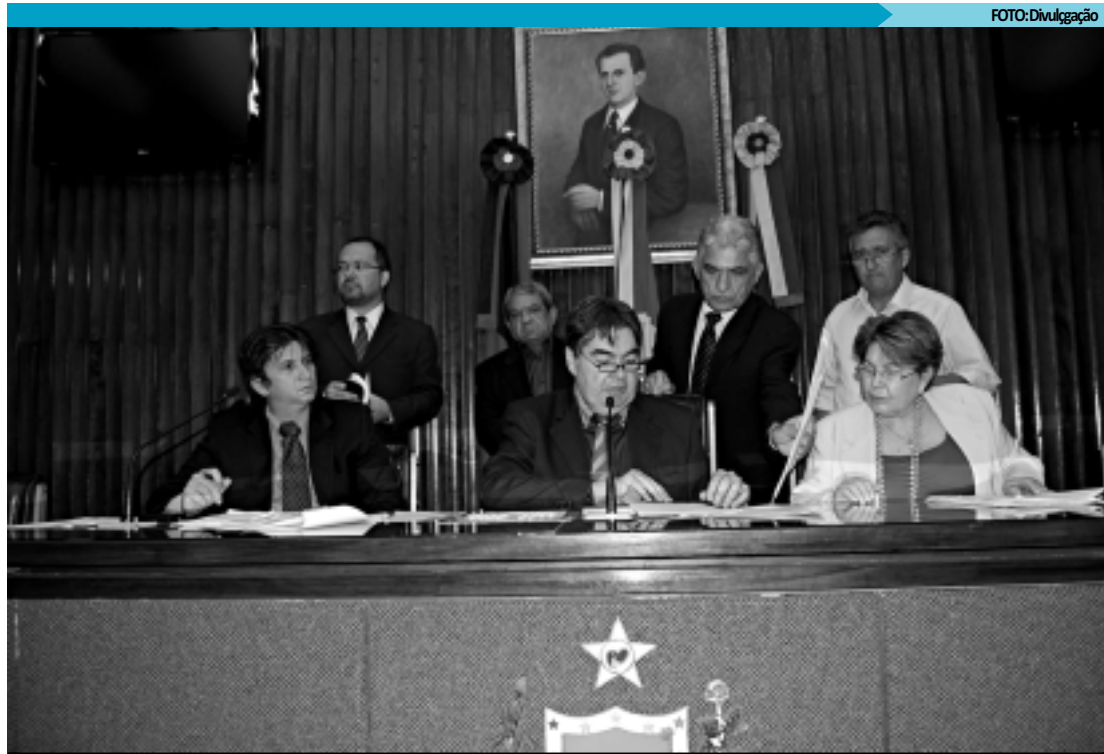
Comissão de Constituição e Justiça aprovou dez projetos de lei e seis medidas provisórias na primeira reunião

Além da Medida Provisória que estava pendente da legislatura passada, os deputados da CCJ aprovaram 17 matérias, entre Medidas Provisórias, Projeto de Lei Complementar e Projeto de Lei, tanto do Executivo Estadual quanto do Poder Legislativo. Entre as medidas provisórias