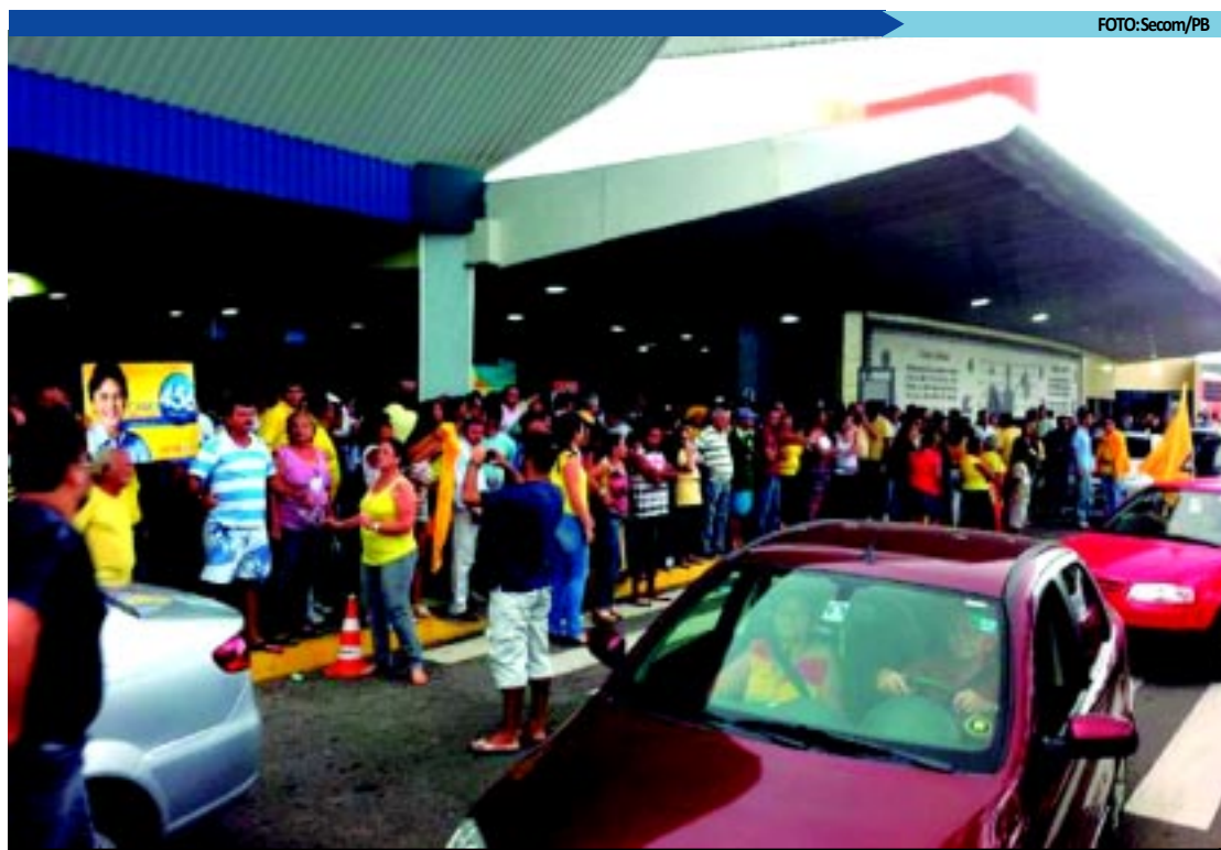
Milhares de pessoas se concentraram em frente ao Aeroporto João Suassuna e nos percursos pelas ruas da cidade

ENCONTRO - Antes de chegar à Paraíba, Cássio Cunha Lima revelou, que se encontrou com Wilson Santiago (PMDB) logo após o julgamento no STF. De acordo com o tucano, o encontro aconteceu por acaso em um restaurante de Brasília. "Fui jantar e por mera coincidência, encontrei com Wilson Santiago. Sentei na mesa dele e conversamos civilizadamente", disse.