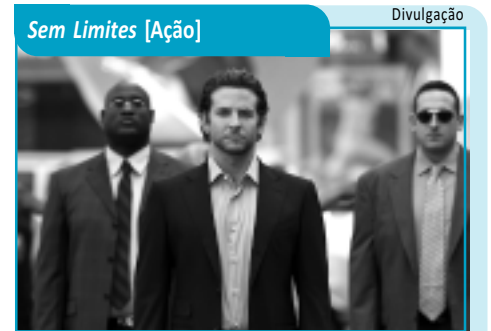
Sem Limites [Ação]

● Funesc [3211-6280] ● Mag Shopping [3246-9200] ● Shopping Tambaí [3214-4000] ● Shopping Iguatemi [3337-6000] ● Shopping Sul [3235-5585] ● Shopping Manaira (Box) [3246-3188] ● Sesc - Campina Grande [3337-1942] ● Sesc - João Pessoa [3208-3158] ● Teatro Lima Penante [3221-5835] ● Teatro Ednaldo do Egypito [3247-1449] ● Teatro Severino Cabral [3341-6538] ● Bar dos Artistas [3241-4148] Galeria Archidy Picado [3211-6224] ● Casa do Cantador [3337-4646]