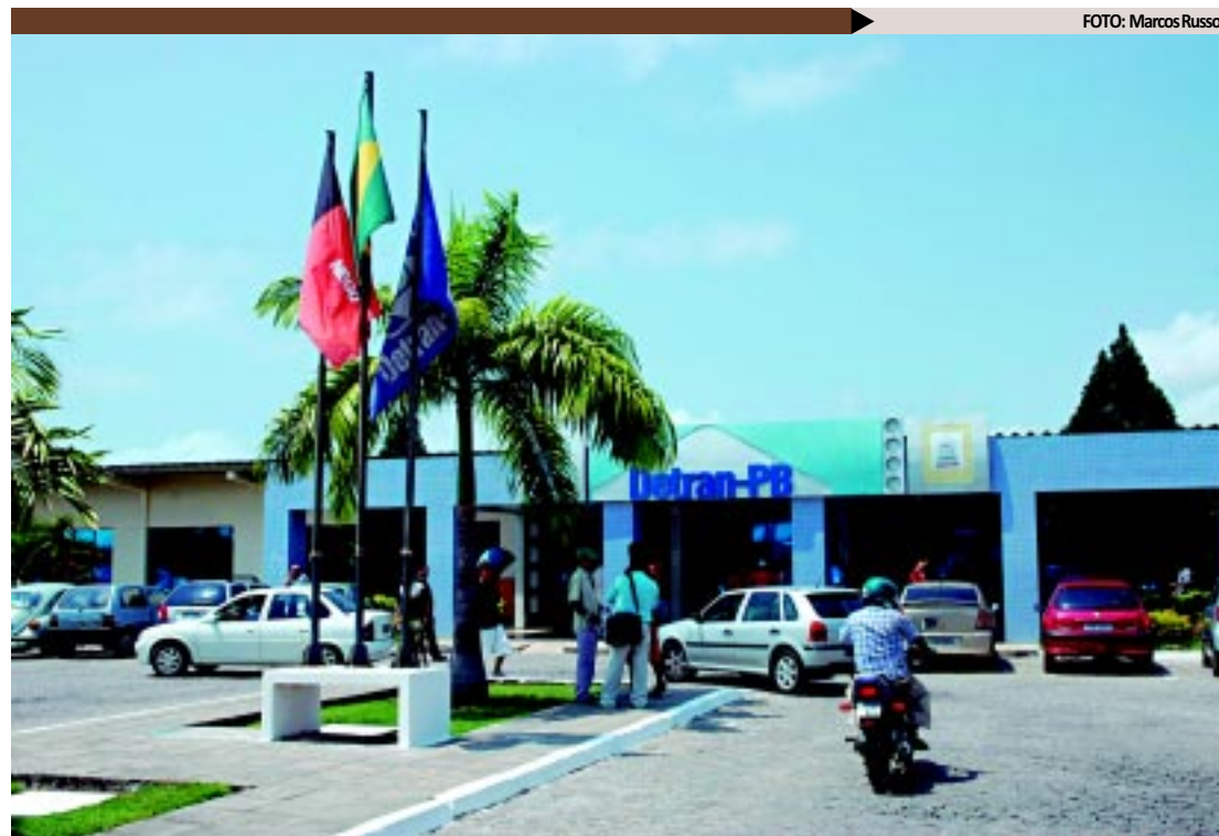
O Detran fechou acordo com a empresa contratada, que garante a redução dos gastos para emitir a CNH

O dinheiro arrecadado com o pagamento de guias de serviços oferecidos pelo Detran já foi depositado na conta do órgão e está disponível para novos investimentos.