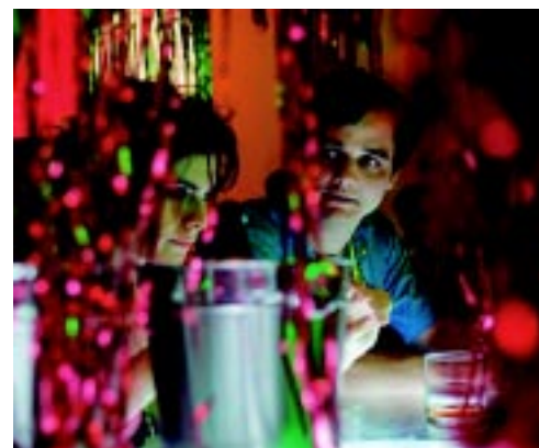
Wagner Moura em cenas do longa em que interpreta Marcelo, um personagem bem diferente dos que viveu em trabalhos mais recentes