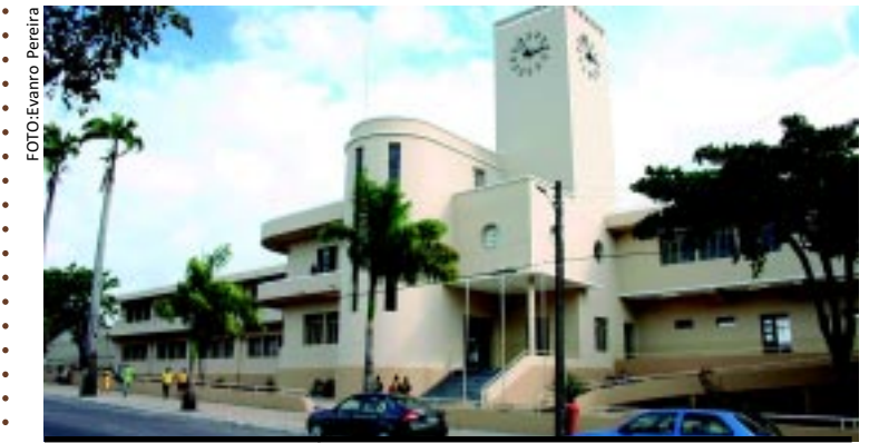
[FOTO&LEGENDA] Escola mais tradicional da Paraíba, o Liceu Paraibano completou ontem 175 anos. Referência no Estado, a escola tem como ex-alunos Celso Furtado, Elba Ramalho, Augusto dos Anjos, José Américo de Almeida e João Pessoa, entre outros. Hoje, o Liceu conta com 2.400 estudantes.