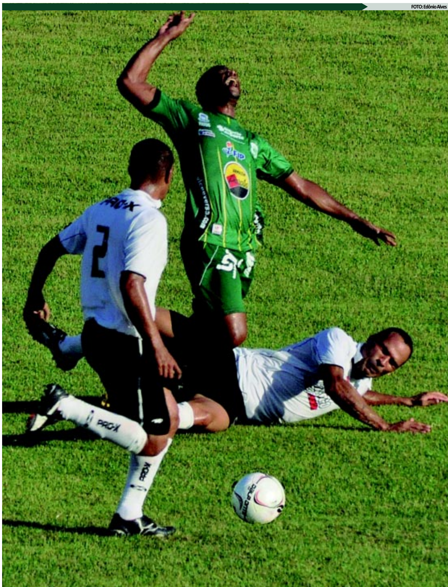
Na sua segunda apresentação na cidade de Patos, o Botafogo perdeu para o Nacional num jogo bastante disputado e cercado de muita polêmica