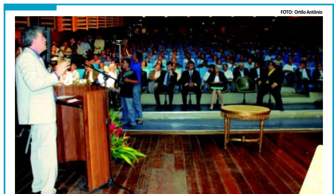
Ricardo Coutinho falou a um auditório lotado e anunciou benefícios para as micro e pequenas empresas

Sobre a 1ª Conferência, Ricardo Coutinho disse que o Governo sabe de sua importância, no entanto, "queremos mais ouvir do que falar. Sabemos que normalmente o Estado mais fala do que ouve, mas agora será diferente. Queremos escutar ideias que contribuam para o desenvolvimento econômico da Paraíba", afirmou. Na manhã de hoje, o governador fará o encerramento oficial do evento, que conta com representantes de todos os 223 municípios do Estado.