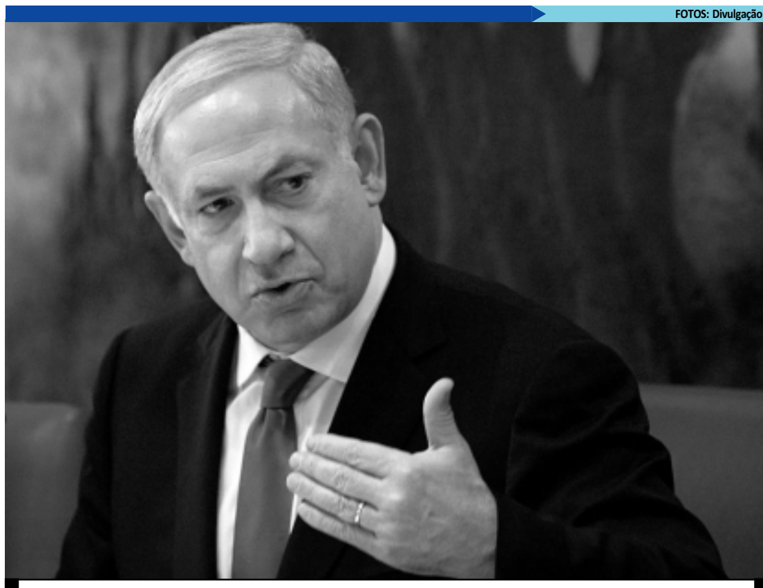
Benjamin Netanyahu quer atacar bases nucleares no Irã e pede apoio do governo Israelense para o conflito

O chefe das Forças Armadas do Irã, general Hassan Firouzabadi, disse que o país está em alerta e que vai "punir" qualquer ataque israelense contra seu território. "Nós conside-