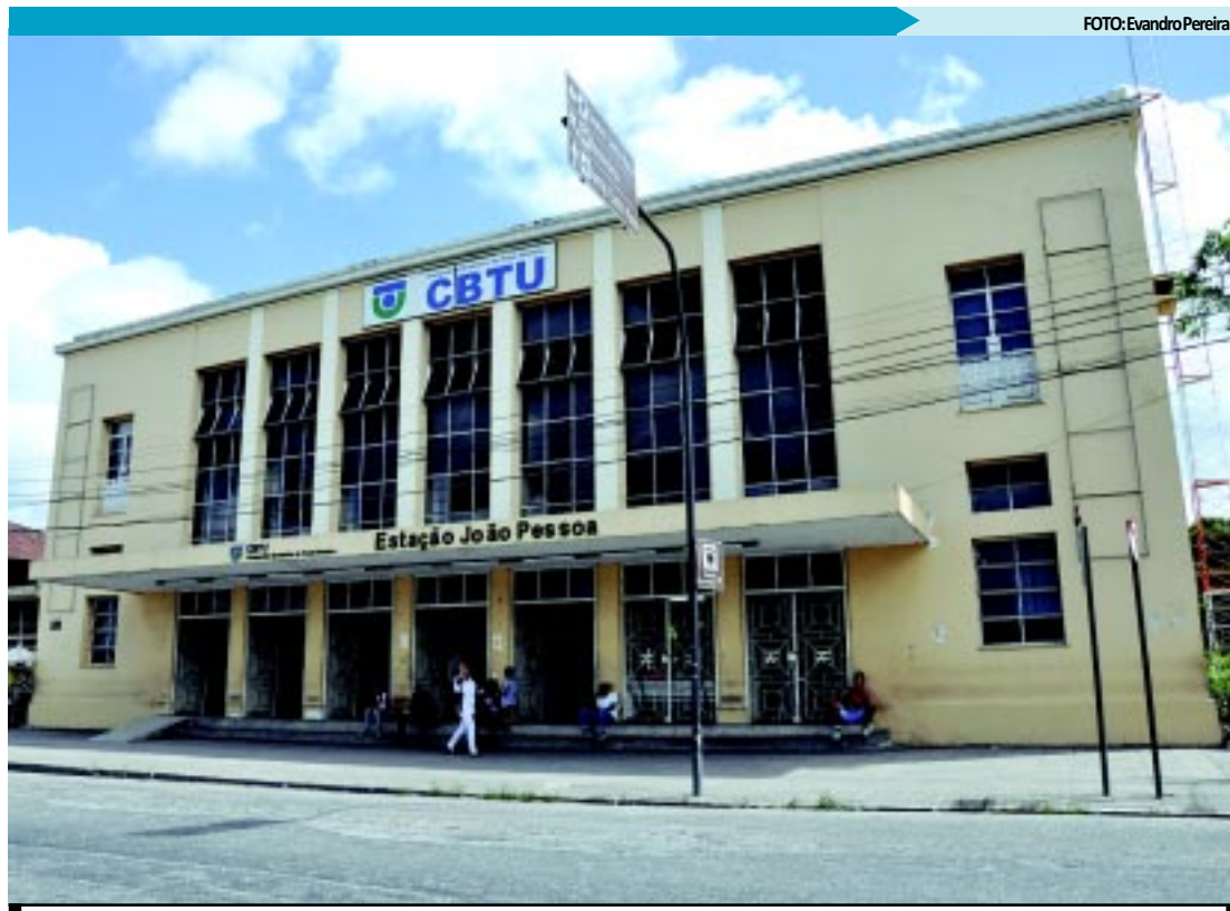
CBTU também oferece boa parcela de cargos comissionados, superintendência, e a vaga de quatro gerências

Além do próprio PT, partido da presidente Dilma Rousseff, na Paraíba as principais siglas aliadas ao governo, a exemplo do PSB e PMDB travam uma verdadeira batalha para ocupar cargos em órgãos federais, principalmente diante do orçamento para 2011 - que deve chegar aos R$ 5 bilhões até o final do ano, sem contar com os repasses da Caixa Econômica Federal, Banco do Brasil e das Empresas de Correios e Telégrafos, que dispõem de recursos próprios