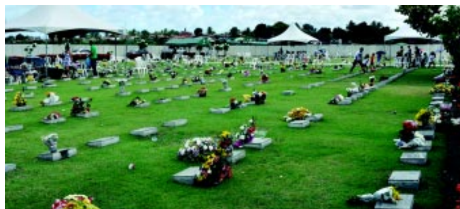
DIA DE FINADOS | Cemitérios ficam lotados durante o feriado. Chinês (esquerda) faz ritual usando comida para familiar morto PÁGINA 9