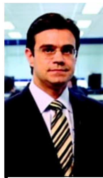
Deputado Federal Gabriel Chalita

Em entrevista ao Estado, o presidente municipal do DEM, Alexandre de Moraes, destacou que o projeto nacional do DEM é ter candidaturas próprias em 2012 para fortalecer o partido e então lançar um candidato próprio na disputa presidencial de 2014. Embora a candidatura de Garcia vá ao encontro da estratégia de-