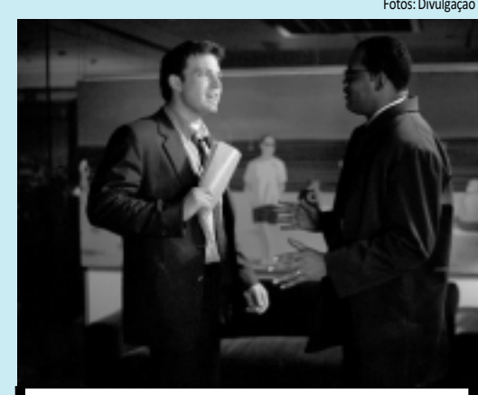
Ben Affleck e Samuel L. Jackson em Fora de Controle

>>> FORA DE CONTROLE - O advogado Gavin Banek e o vendedor de seguros Doyle Gipson se envolvem em um pequeno acidente de trânsito quando estão a caminho do tribunal. Banek está com um caso que envolve uma quantia milionária, enquanto Gipson vai a uma sessão que envolve a custódia de seus filhos. Eles discutem e perdem os prazos. A partir daí cada um passa a tentar destruir a vida do outro por causa daquilo que perderam. SE LIGUE: Hoje, às 22h, no TNT