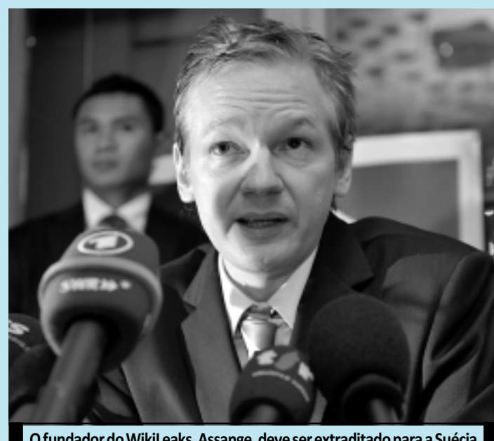
O fundador do WikiLeaks, Assange, deve ser extraditado para a Suécia

A sentença do tribunal é dada num momento em que o WikiLeaks afirma que está enfrentando sérias dificuldades financeiras. No mês passado, o WikiLeaks afirmou que vai fechar em seis