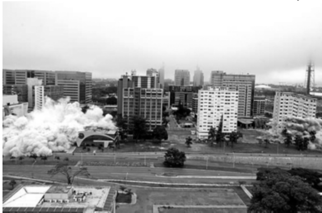
No local onde ficavam os hotéis será erguido um complexo hoteleiro com mais de 500 apartamentos