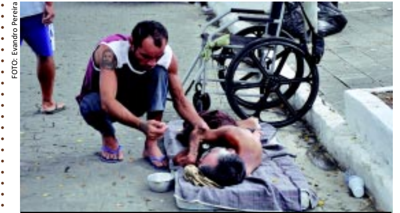
No Dia de Finados, um senhor procurou o cemitério Senhor da Boa Sentença para buscar esmolas pela própria sobrevivência. Em meio a pessoas que passavam para visitar seus mortos, ele insistia em viver apesar de todas as dificuldades.