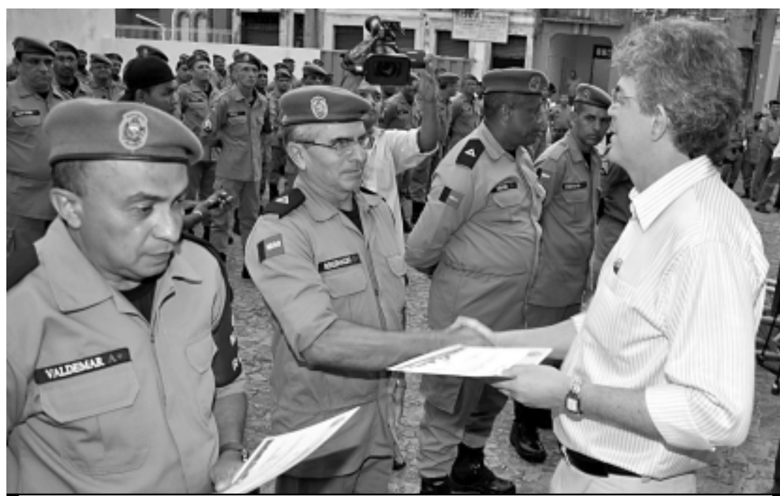
Ricardo Coutinho disse que a criação da Guarda Militar da Reserva vai tirar muitos PMs dos "bicos"

O governador ainda salientou que a Guarda Militar da Reserva vai reforçar o efetivo de policiais nas ruas e contribuir com o resgate do sentimento de tranquilidade por parte da população paraibana. "Essa é uma forma de não só reconhecer o trabalho feito anteriormente por esses policiais que voltam hoje à ativa, mas ao mesmo tempo reforçar nos-