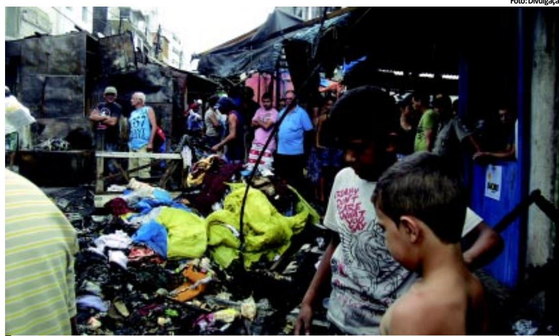
Fogo começou no box dos CDs e o Corpo de Bombeiros demorou 4 horas para apagar