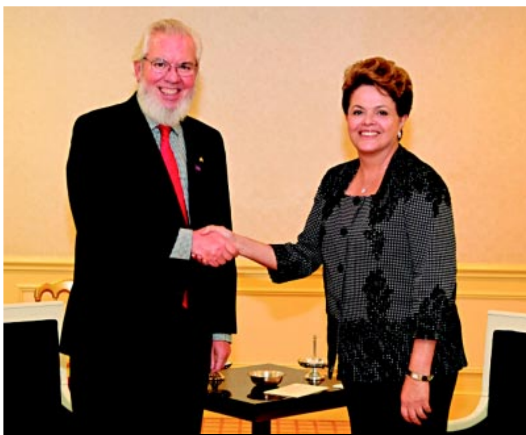
Amanhã, Dilma participa de almoço de trabalho sobre o sistema econômico global e mais duas sessões de trabalho

Amanhã, Dilma participa de almoço de trabalho sobre o sistema econômico global e mais duas sessões de trabalho. Em pauta, um plano de ações para o crescimento econômico mundial, o marco do sistema monetário internacional e a dimensão so-