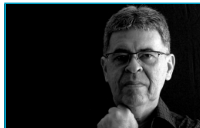
OBRAS DE DENIS CAVALCANTI NA ESTAÇÃO

#O escritor Paulo Coelho foi um dos escolhidos para a próxima edição do World Book Night, que distribuiu gratuitamente um milhão de livros na Grã-Bretanha e Irlanda. A primeira edição do evento foi este ano e a de 2012 será no dia 23 de abril. O Alquimista foi o livro escolhido do brasileiro para figurar entre as 25 obras eleitas por um comitê de vendedores de livros, bibliotecários e membros da mídia, inclusive da BBC. Entre as obras escolhidas para a distribuição neste ano estão Um Conto de Duas Cidades , de Charles Dickens.