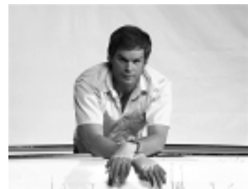
A RedeTV exhibe a série 'Dexter'