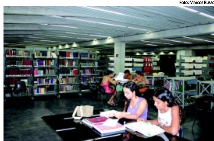
Lei vale para bibliotecas de instituições públicas e particulares

Foi sancionada a lei que estabelece que as bibliotecas de universidades e faculdades estão liberadas para serem usadas por pessoas inscritas em concurso público. PÁGINA 10