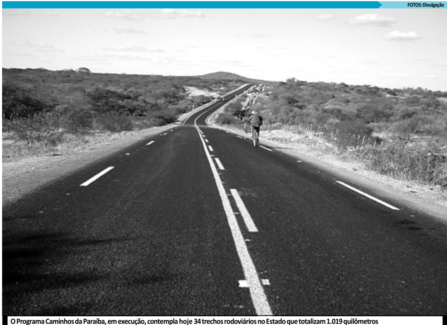
O Programa Caminhos da Paraíba, em execução, contempla hoje 34 trechos rodoviários no Estado que totalizam 1.019 quilômetros