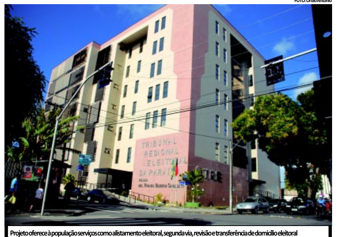
Projeto oferece à população serviços como alistamento eleitoral, segunda via, revisão e transferência de domicílio eleitoral

A Escola Judiciária Eleitoral da Paraíba (EJE-PB) está participando da campanha, conscientizando alunos das escolas próximas de onde o posto da Justiça Eleitoral é instalado, divulgando o serviço oferecido, o local, data e horário de atendimento. Para receber atendimento no posto da Justiça Eleitoral, o cidadão deve apresentar apenas um documento oficial com foto e o comprovante de residência.