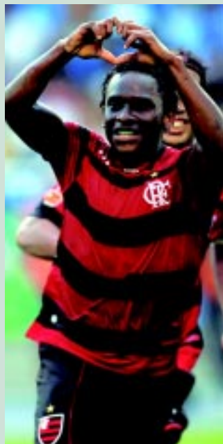
O atleta se diz arrependido

Luxemburgo esteve reunido com o jogador na parte da manhã. Por isso, o treinador não participou do treino no Ninho. Leonardo Moura,