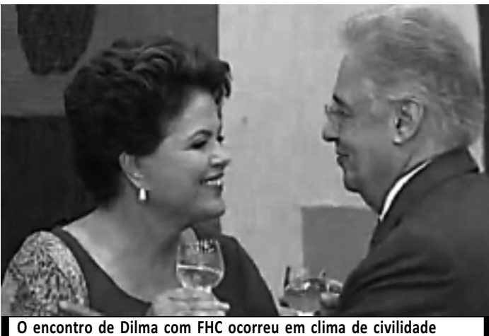
O encontro de Dilma com FHC ocorreu em clima de civilidade

Por essas e outras, volto a dizer: gostei, e muito, do abraço da Dilma!