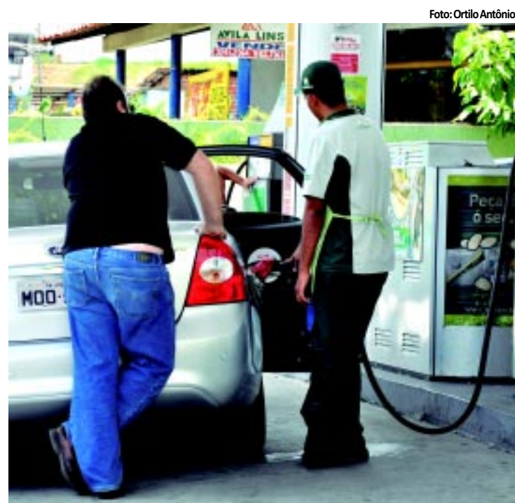
Em uma semana 68 postos elevaram preços dos combustíveis

distância. O programa permite que profissionais de saúde troquem informações sem sair dos postos de atendimento, por meio de videoconferência e internet. PÁGINA 8