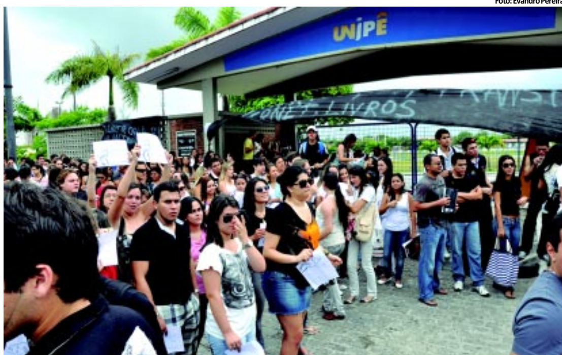
Estudantes realizaram protesto contra reajustes nas mensalidades do Unipê

O Procon de João Pessoa notificou oito postos de combustíveis sob a alegação de reajuste indevido. O aumento foi de 66%, conforme pesquisa feita em 102 estabelecimentos. Eles terão 48 horas para apresentar a planilha de custos e notas fiscais. Os fiscais constataram que em menos de uma semana, 68 postos elevaram os preços. PÁGINA 8