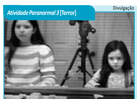
Atividade Paranormal 3 [Terror]

CAPITÃES DA AREIA (Brasil, 2011). Gênero: Romance. Duração: 96 min. Classificação: 16 anos. Direção: Cecília Amado, com Jean Luis Souza de Amorim, Ana Graciela, Romário Santos de Assis. Menores abandonados por suas famílias vivem nas ruas de Salvador. Liderados por Pedro Bala, os "Capitães da Areia" praticam vários crimes em busca da sobrevivência. Mais atual do que nunca, a história destes personagens imortais da literatura mundial nos emociona e inspira de forma profunda. Manaira 8: 14h45 e 16h45.