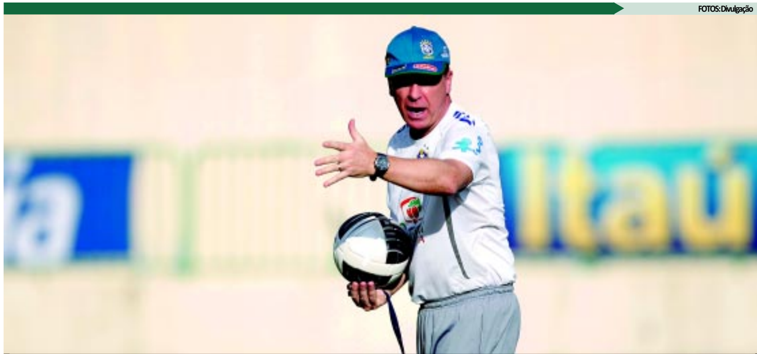
Com uma seleção formada apenas por jogadores que atuam fora do Brasil, Mano Menezes não fez segredo e anunciou a escalação sem mistérios

A partida está sendo aguardada com muita expectativa pelos torcedores locais, que receberam a delegação brasileira com muito carinho. A expectativa é que todos os ingressos postos à venda se-