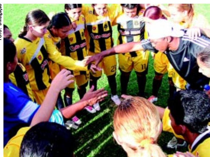
As meninas do Kashima tem presença confirmada na competição

Seis times vão participar da competição que será concluída no dia 7 de dezembro. Todos os jogos serão realizados no Estádio da Graça. Na abertura, estarão se enfrentando as equipes do CCLB x Varadouro. O Kashima só faz sua estreia na próxima quarta-feira, dia 16, às