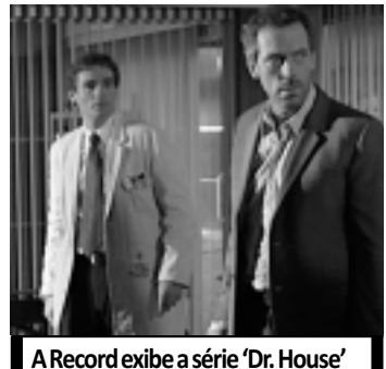
A Record exibe a série 'Dr. House'