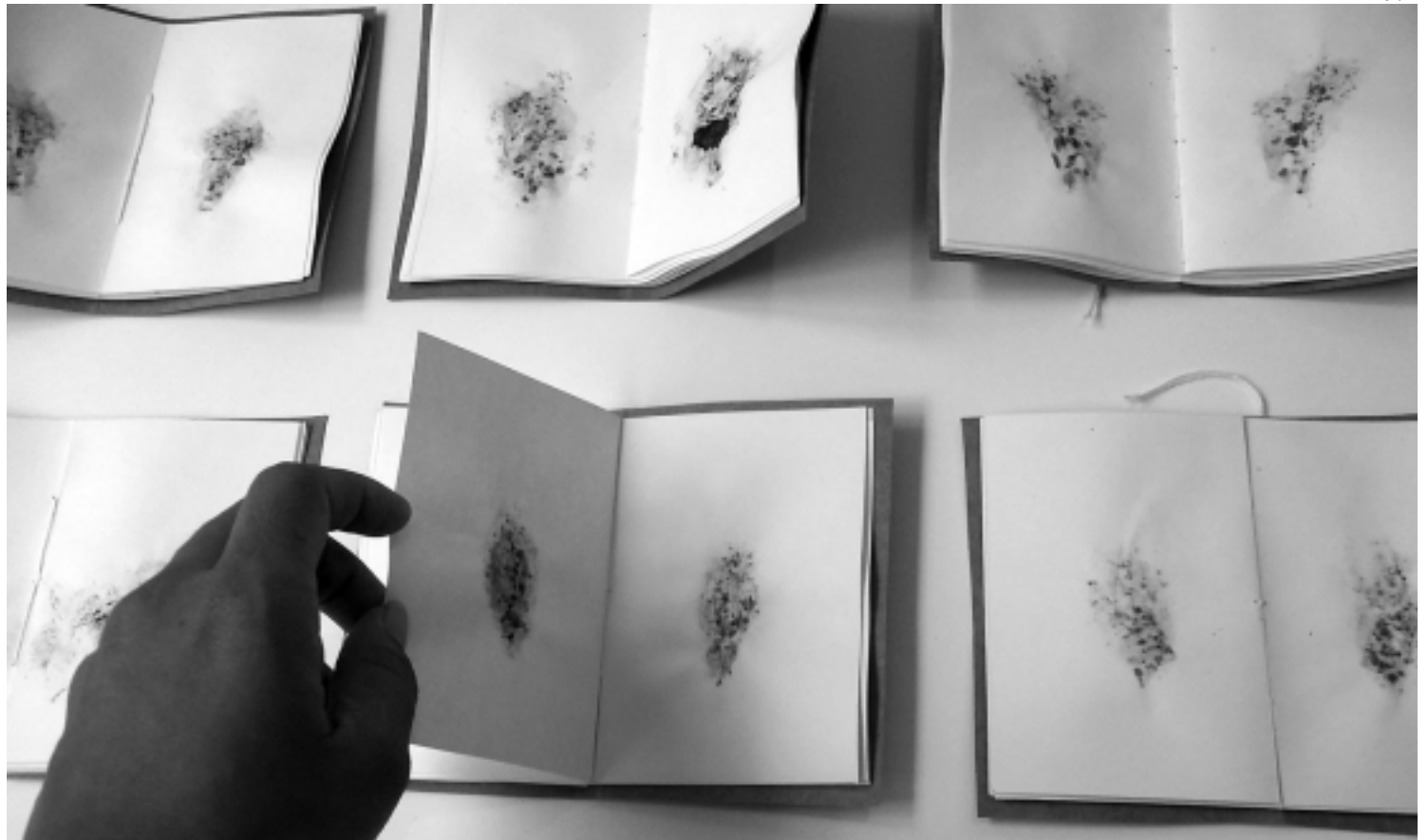
Trabalhos de Scheilla Sílvia integrantes do acervo da mostra Quando Verdejar , que permanecerá aberta ao público até o final deste mês