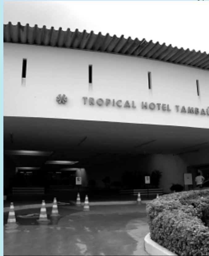
Hotel Tambaú recebeu visita da Vigilância Sanitária Municipal