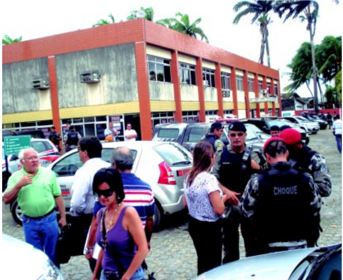
As equipes se preparam para o início da Operação. Ao alto, policiais atuando diretamente em lojas de shoppings