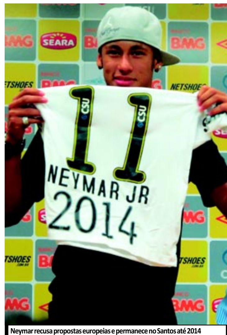
Neymar recusa propostas europeias e permanece no Santos até 2014

Para garantir o craque na Vila Belmiro, o Peixe irá abrir mão dos 30% a que tem direito dos contratos futuros de publicidade do atacante e o liberará após o Mundial. Segundo o mandatário, o Banco do Brasil não está participando do pagamento dos salários do atleta. No entanto, há uma negociação em andamento para que o craque se torne garoto propaganda da estatal. No novo acordo, foi acertada a redução do tempo de contrato, que vai agora até agosto