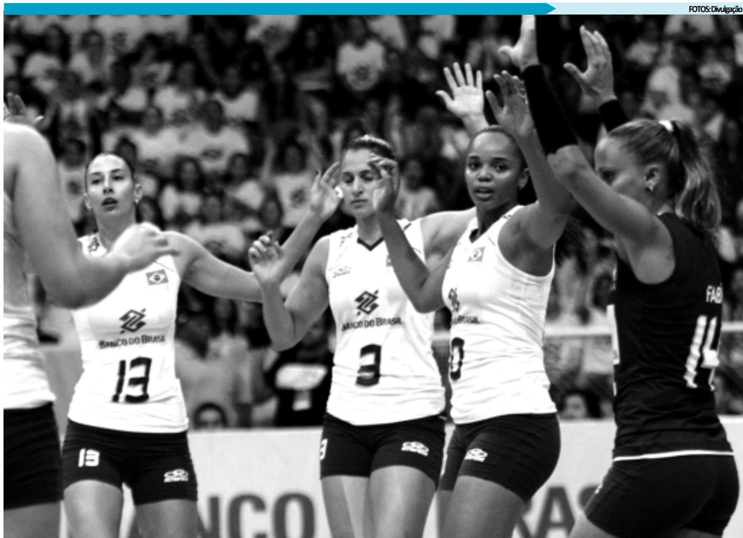
Mesmo depois da vitória contra a Sérvia, o Brasil está apenas em quinto lugar na Copa do Mundo e precisa vencer a China amanhã em Sapporo no Japão

O ritmo não foi mantido no início do 4º set, quando a Sérvia chegou a ter três pon-