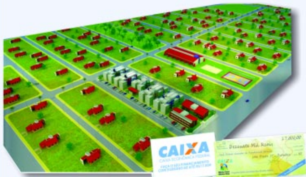
Perspectiva ilustrativa do bloco 01