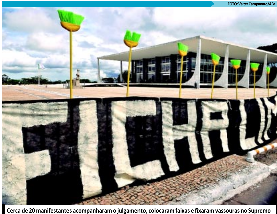
Cerca de 20 manifestantes acompanharam o julgamento, colocaram faixas e fixaram vassouras no Supremo

O ministro também entendeu que todas as causas de inelegibilidade contidas na lei contêm importante conteúdo de reprovação social. "A liberdade individual de se candidatar não supera os benefícios soci-