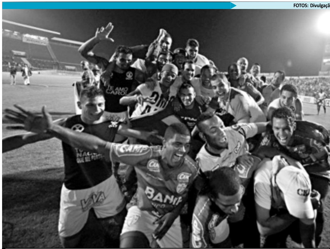
Muita comemoração dos jogadores após o apito final do jogo contra o Sport em que a Lusa fez história

"Neste momento passa um filme. Quando que eu cheguei aqui, algumas pessoas