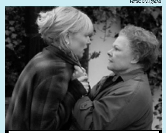
Cenas de Notas Sobre Um Escândalo de Richard Eyre

>>> NOTAS SOBRE UM ESCÂNDALO - Barbara Covett é uma professora dominadora, que controla com mão de ferro os alunos de um grupo de escavadores escola pública de Londres. Ela não tem amigos e vive apenas com seu gato, Portia. Ela se torna amiga de Sheba Hart, a nova professora de arte da escola. Mas quando Sheba se envolve com Steven Connolly, um de seus alunos mais jovens, Barbara ameaça revelar seu segredo para o marido dela, Richard, e para todos à sua volta. SE LIGUE: Hoje, às 22h, no Megapix