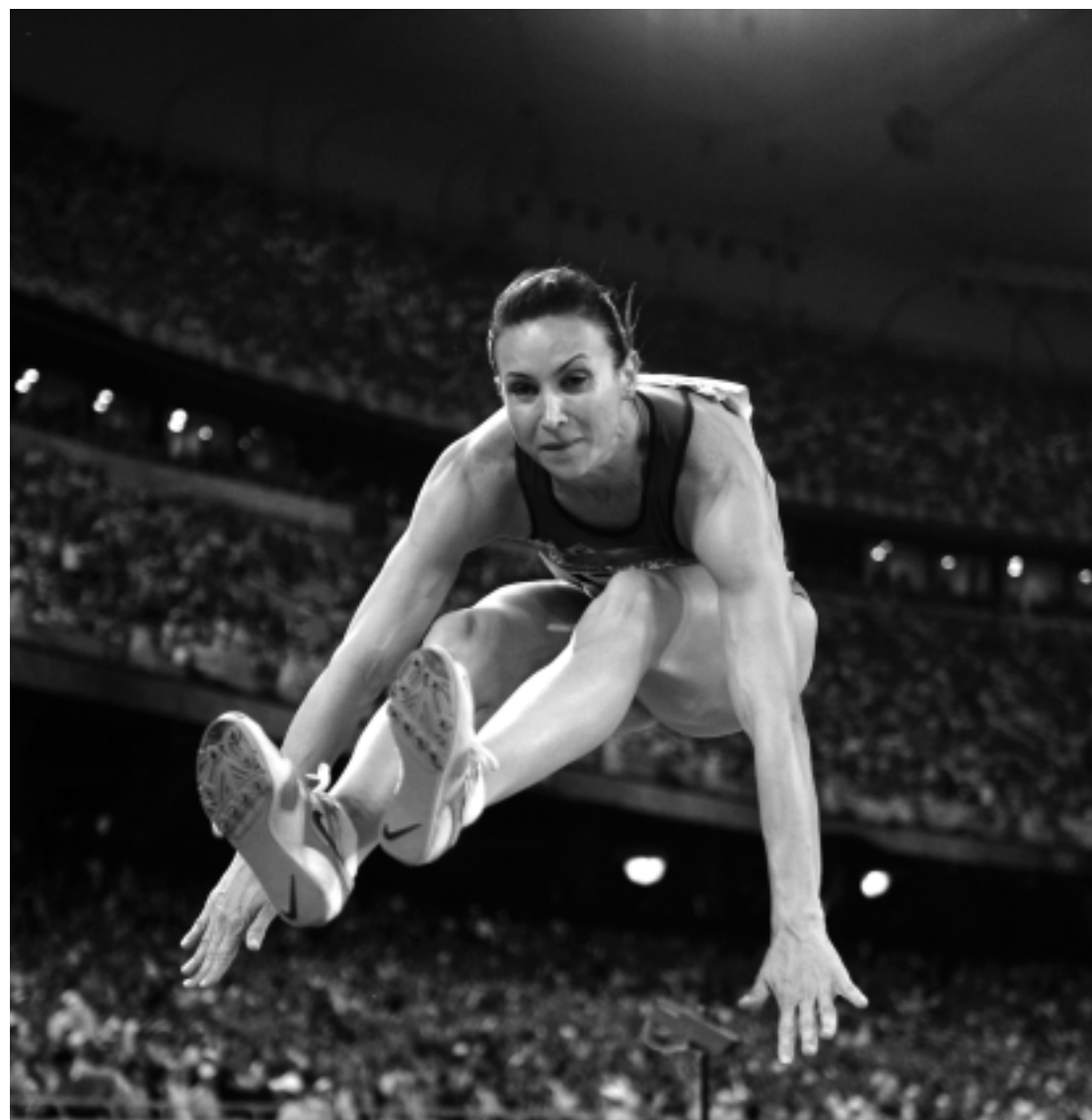
Maurren Maggi acredita que precisa saltar acima de sete metros para buscar a medalha de ouro em Londres

Maurren fez uma temporada marcada por altos e baixos, esse ano. No mês de agosto, a atleta fez um péssimo mundial em Daegu, na Coreia do Sul, ficando com uma singela décima primeira colocação. A reabilitação veio no mês passado, no Pan de Guadalajara, onde a saltadora conseguiu saltar bem e levar o ouro pela terceira vez na competição.