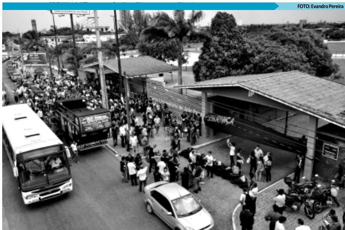
Portões foram fechados e o trânsito ficou lento em frente ao Unipê, durante protesto que reuniu 500 alunos

A Reitora do Unipê informou também que pretende continuar fazendo este repasse para as entidades representativas dos estudantes, bem como os R$ 20 mil para as caloradas. No entanto, faz-se necessário a comprovação das despesas. "O que a instituição