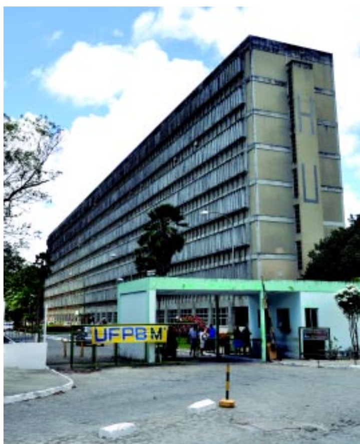
Com cirurgias paralisadas, HU aguarda recursos do Ministério da Educação

"O ministro Aloísio Mercadante, que já teve oportunidade de conhecer a obra, garantiu que iria repassar o convite à presidente Dilma para a inauguração do novo equipamento".