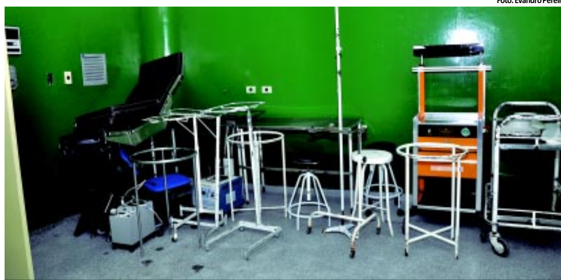
Das 11 salas do bloco cirúrgico do Hospital, apenas duas continuarão funcionando