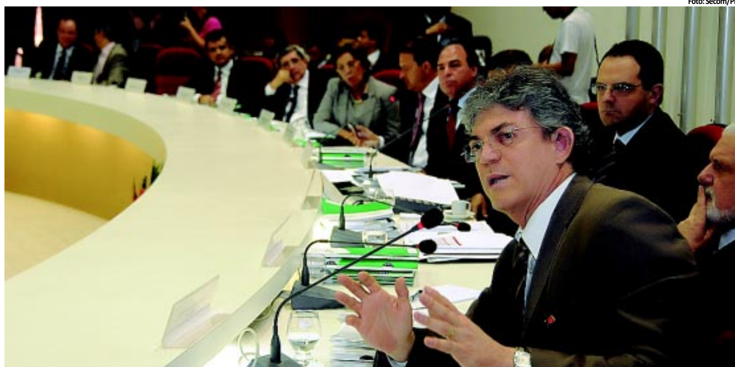
SUDENE Governador defende mais equilíbrio no desenvolvimento do Nordeste PÁGINA 4

deverão começar em 15 dias e podem durar até 70 dias. O serviço está orçado R$ 31 mil, mas a unidade ainda não tem recursos. Das 11 salas do bloco cirúrgico do HU, apenas duas continuarão funcionando. PÁGINA 9