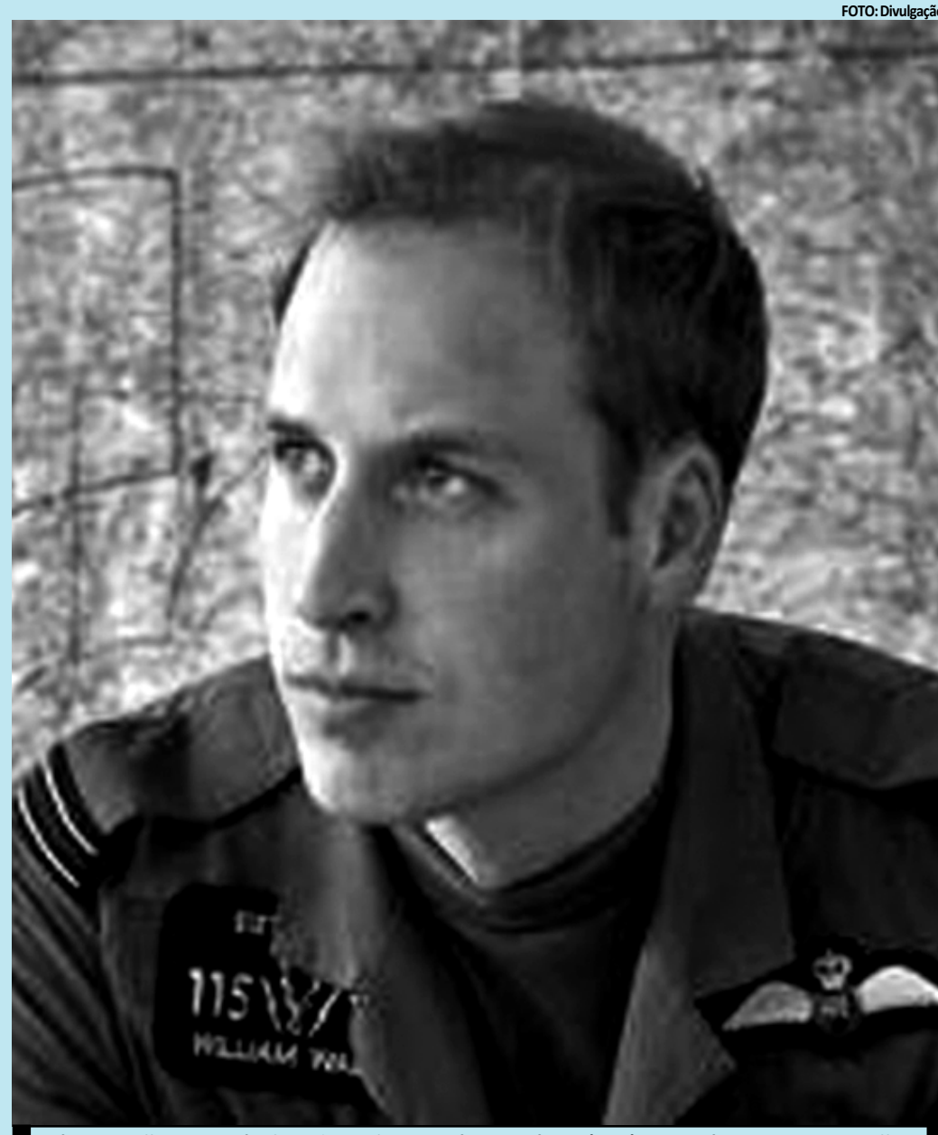
Príncipe William, que é piloto da Real Força Aérea Britânica (RAF), passará seis semanas na ilha