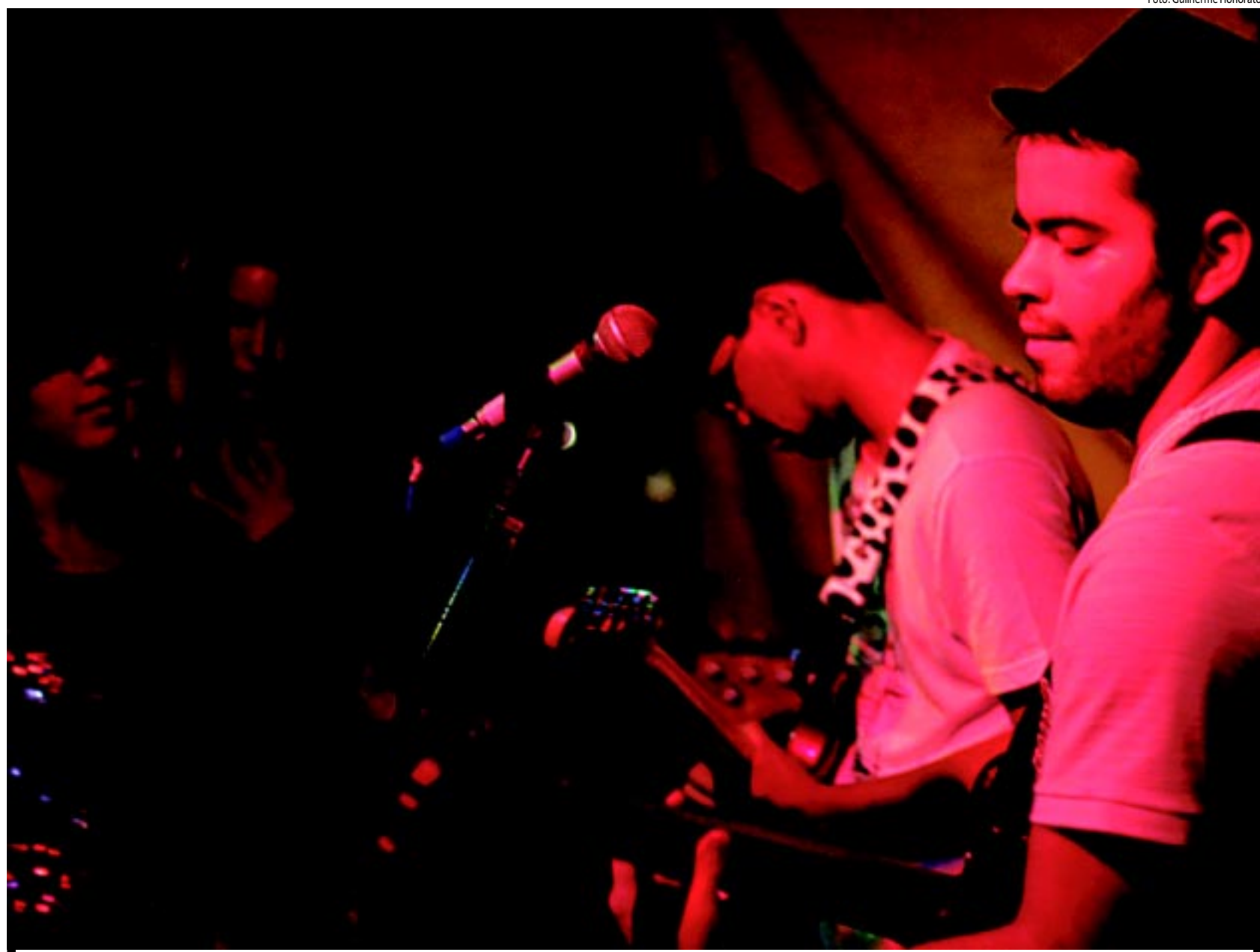
O "rock sem afetação" da banda Noir Sound Club vai animar a noite de hoje na Praça Antenor Navarro, no Centro Histórico de João Pessoa. A entrada é gratuita

A banda Baluarte tocará na Praça Coqueiral, em Mangabeira, às 19h. No repertório do grupo estão músicas autorais no estilo MPB, como 'Cordas', 'Intempestiva', 'Território' e 'Semaforizado'. Essa última empresta nome ao último ál-