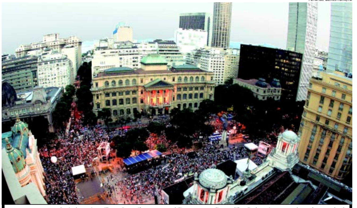
Em passeata no centro do Rio de Janeiro, milhares de manifestantes se mobilizaram para pedir a modificação do projeto aprovado na Câmara Federal

A última pesquisa Latinobarômetro/Ibope mostra que Dilma teve uma queda de 11 pontos percentuais em sua avaliação positiva. Nada aconteceu que justificasse, a não ser talvez o aumento da percepção de que ela só age quando a reputação do ministro em questão está liquidada até na bacia das almas.