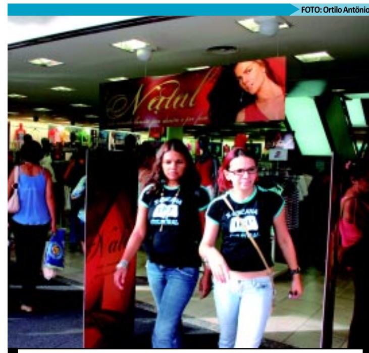
Faturamento do comércio varejista paraibano teve expansão de 12%

Quanto ao comércio varejista ampliado, o crescimento de 0,9% no volume de vendas sobre o mês anterior, com ajuste, interrompe a sequência de dois meses de taxas negativas, enquanto a receita nominal, com acréscimo de 1,3% em relação a agosto, recuperou-se da queda do mês anterior. O volume de vendas do varejo ampliado assinalou taxas de 4,8% sobre setembro do ano passado; de 8,0% no acumulado janeiro-setem-