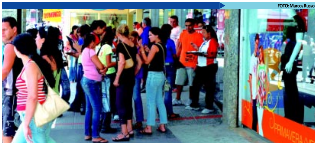
A pesquisa destaca as mulheres como sendo as mais endividadas na Capital, com uma taxa de 65,1%

Sobre a inadimplência, o sexo masculino possui maior taxa: 5%. A faixa de idade com maior taxa de inadimplência é a de 35 anos ou mais: 4,9%. A faixa de escolaridade Ensino Fundamental é a que apresenta maior taxa de inadimplentes: 6,5%. Em termos de renda familiar, a maior taxa de inadimplência concentra-se em quem percebe acima de cinco salários mínimos: 6,3%.