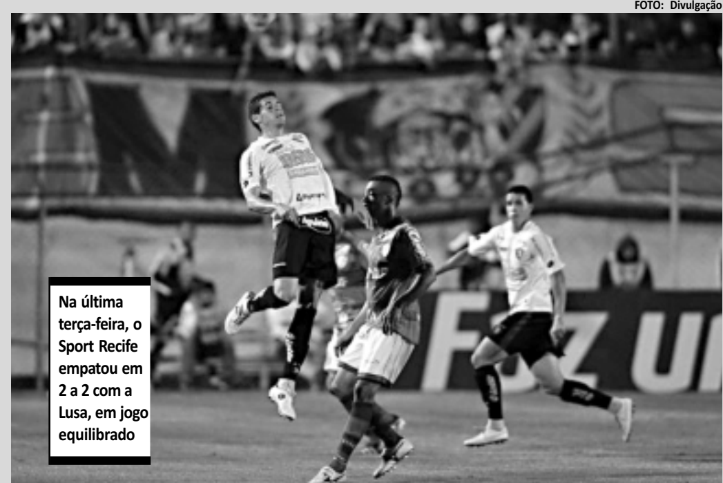
Na última terça-feira, o Sport Recife empatou em 2 a 2 com a Lusa, em jogo equilibrado

A rodada de confrontos diretos ainda se completa, porque a Ponte Preta, que ocupa a terceira colocação, com 59 pontos, pode garantir sua classificação em confronto contra o Boa Esporte (que ocupa a décima posição e ainda tem chances matemáticas de chegar ao acesso).