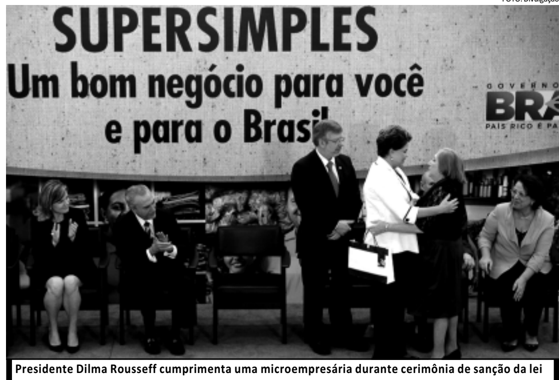
Presidente Dilma Rousseff cumprimenta uma microempresária durante cerimônia de sanção da lei

Após o acidente, dados preliminares das investigações indicaram um congelamento das sondas Pitot, responsáveis pela medição da velocidade da aeronave, como principal hipótese para a causa do acidente. No final de maio de 2011, um relatório do BEA confirmou que os pilotos tiveram de lidar com indicações de velocidades incoerentes no painel da aeronave.