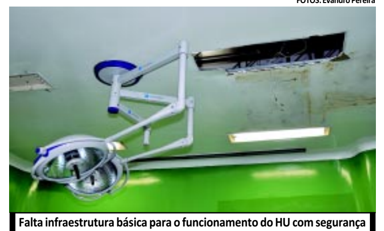
Falta infraestrutura básica para o funcionamento do HU com segurança