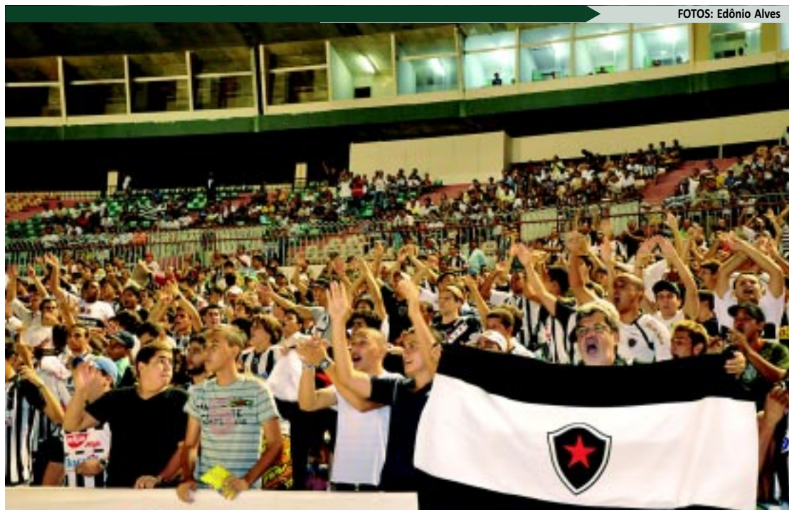
A torcida do Botafogo-PB tem um papel importante para aumentar o número de apostas na Timemania