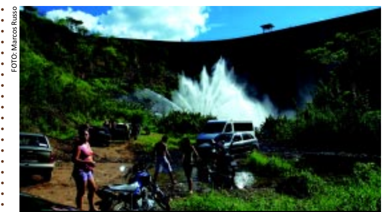
[FOTO&LEGENDA] Na barragem Saco, em Nova Olinda, banhistas se refrescam com o chafariz que ajuda a abastecer parte da região. A barragem tem capacidade hídrica de 97,4 milhões de metros cúbicos e, apesar de iniciada na década de 1980, foi inaugurada em 1996.