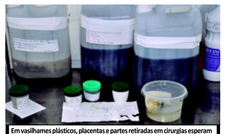
Em vasilhames plásticos, placentas e partes retiradas em cirurgias esperam