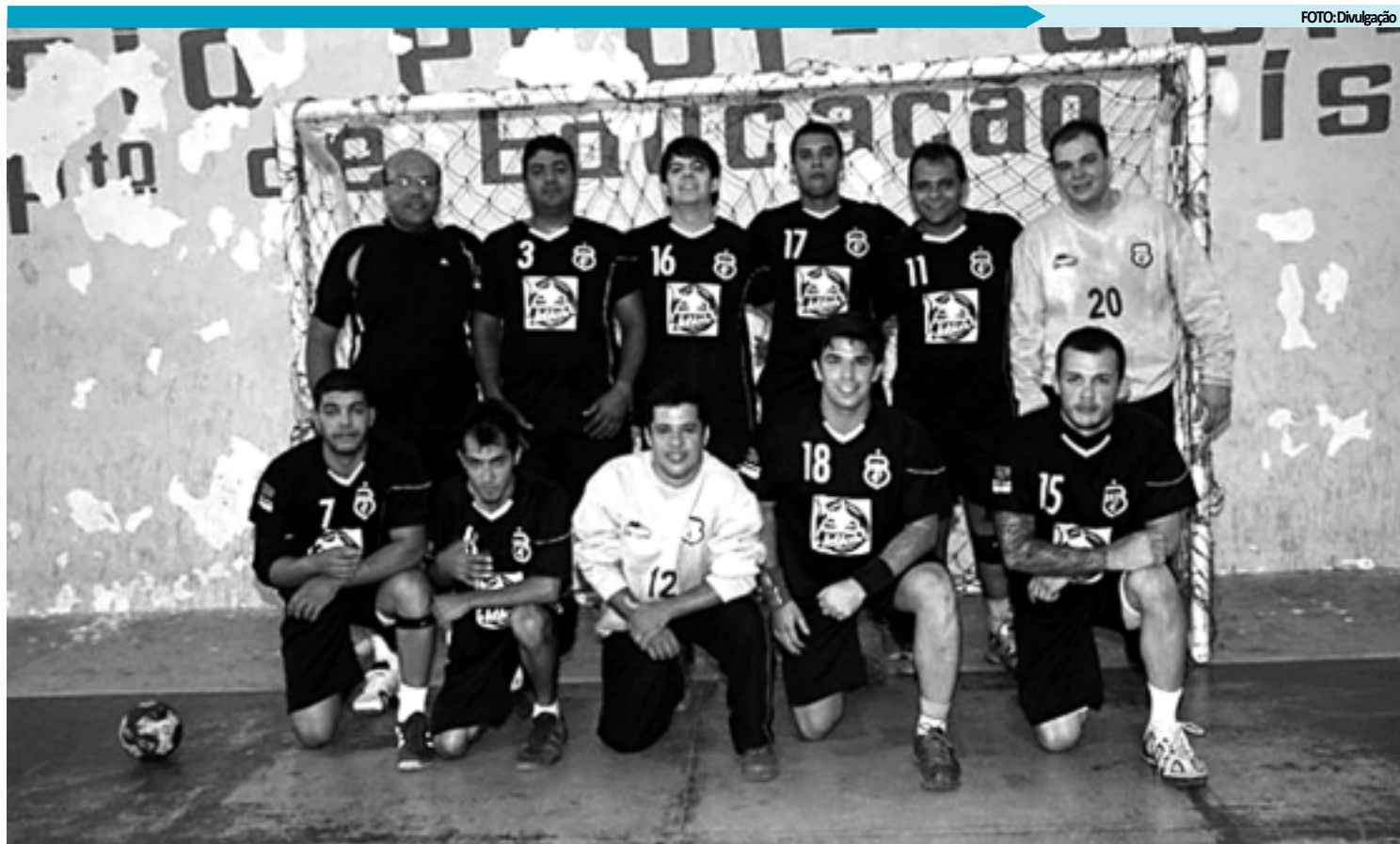
A equipe adulta do Treze está entre as melhores da Paraíba e vem sendo considerada uma das favoritas ao título da 4ª edição da Taça Campina Grande de Handebol

Na categoria mais esperada da competição, o adulto masculino, três times paraibanos vão em busca da taça. Na chave A, o Treze/Unimix enfrenta os times CHBI/AABB da Bahia, o Crateús do Ceará e o Sertânia H.C de Pernambuco. Na chave B mais duas equipes paraibanas. O Campinense juntamente com o Master de