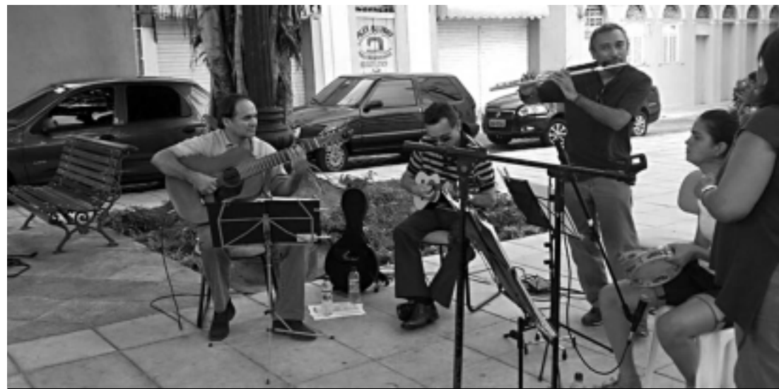
O Oitavas no Choro tem como uma de suas características tocar clássicos do mais genuíno gênero musical brasileiro