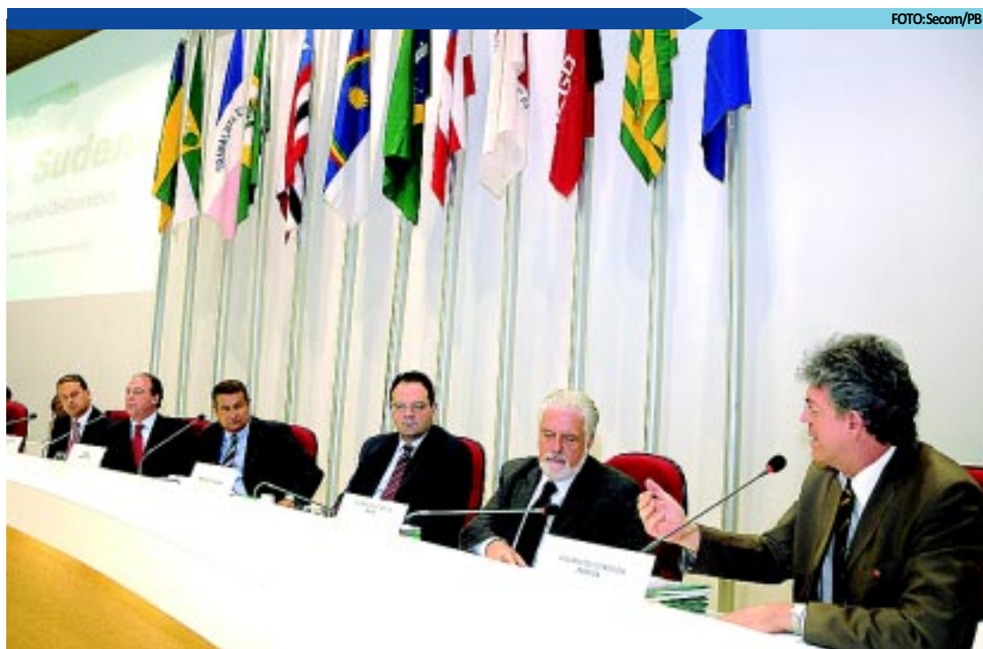
Ricardo Coutinho participou, no Recife, de encontro com governadores do Nordeste e o ministro da Integração Nacional

Participando pela primeira vez da reunião do Conselho Deliberativo da Sudene, Ricardo Coutinho ressaltou a satisfação de estar no colegiado e espera contribuir na consolidação de uma identidade regional. "Porque o avanço do Nordeste representa o avanço do Brasil", destacou. Além de Ricardo, estavam presentes os governadores Eduardo Campos, de Pernambuco; Jaques Wagner, da Bahia; Wilson Martins, do Piauí; e Rosalba Ciarlini, do Rio Grande do Norte.