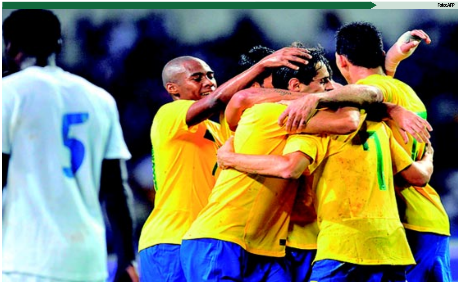
Com um gramado terrível e com muita lama, a Seleção jogou apenas o suficiente para ganhar do fraco Gabão, em amistoso caça-níquel

Jonas e Hulk, que formaram uma interessante dupla, tiveram chance de ampliar e o jogo parecia que seria tranqui-