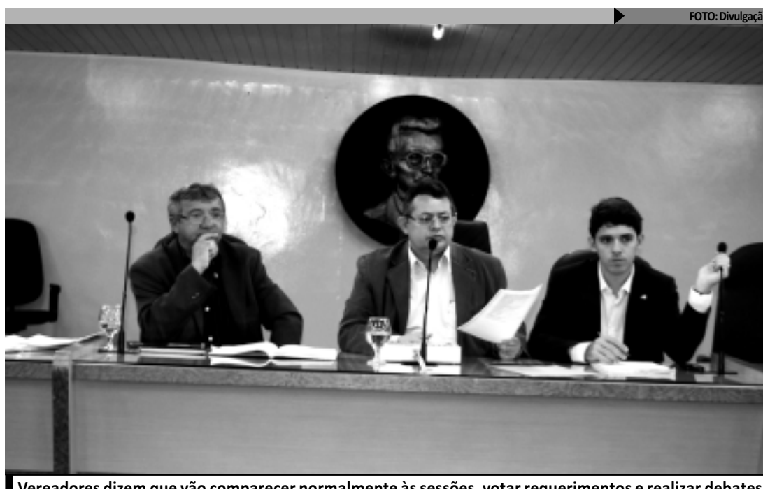
Vereadores dizem que vão comparecer normalmente às sessões, votar requerimentos e realizar debates