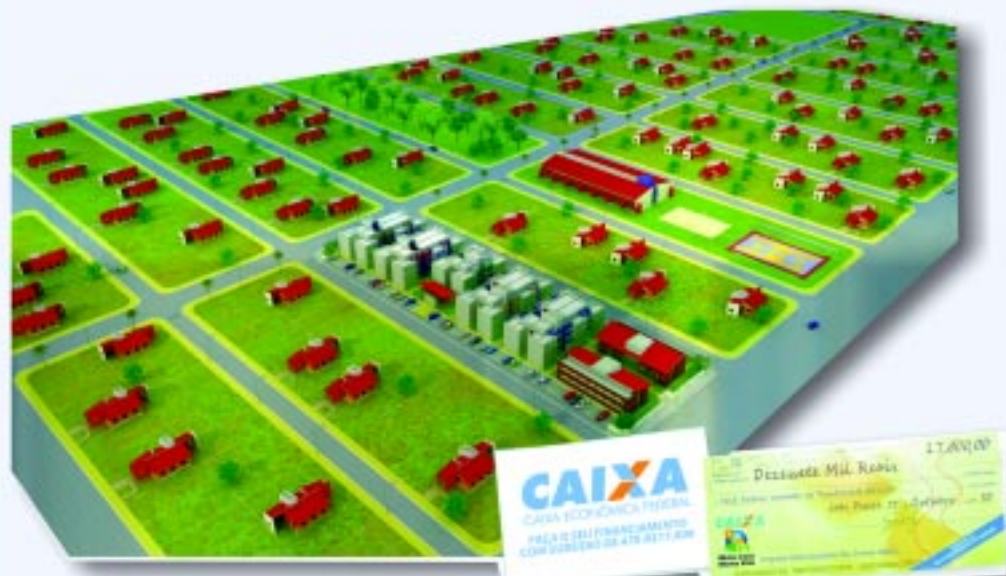
Perspectiva ilustrativa do bloco 01