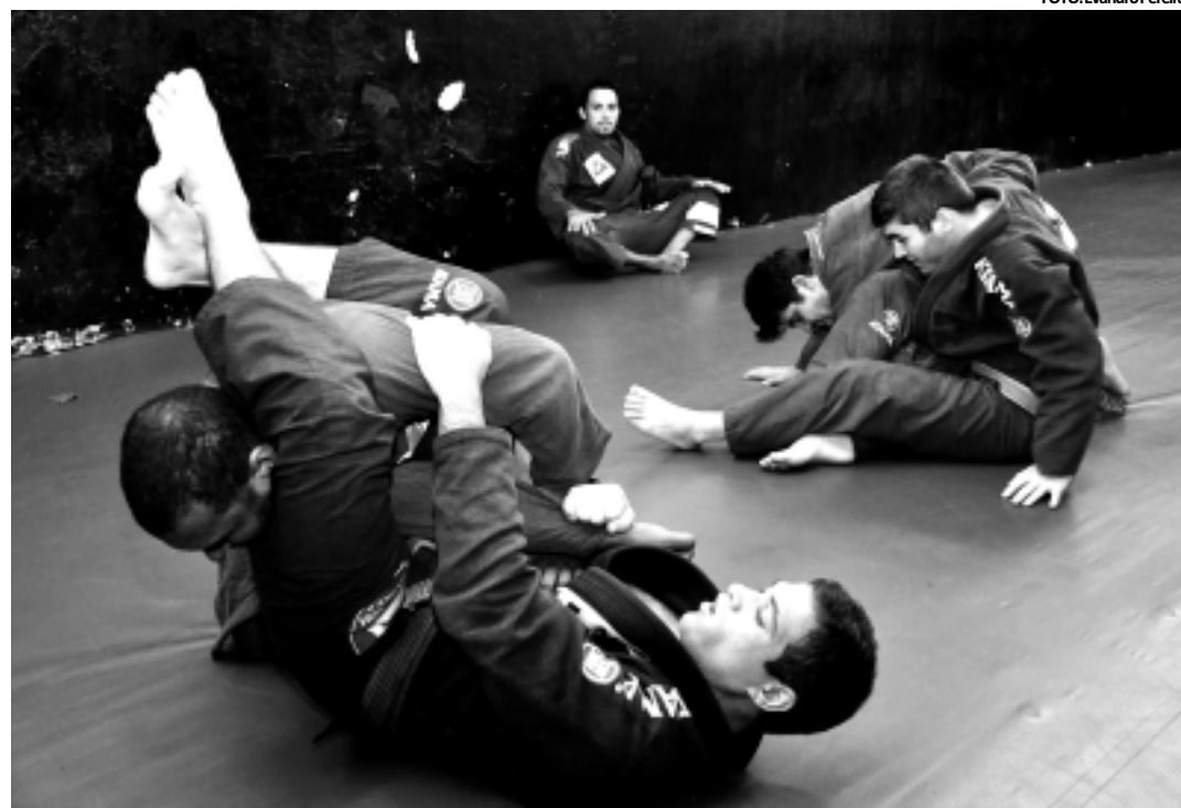
Considerados os melhores do Nordeste, os lutadores de jiu-jitsu da Paraíba querem confirmar o favoritismo

INFRAESTRUTURA - O campeonato terá uma estrutura adequada e ideal para o porte do evento que é um dos mais importantes da região. Para o Campeonato Brasil Norte Nordeste, os tatames serão novos, placares eletrônicos serão utilizados para uma melhor disseminação de