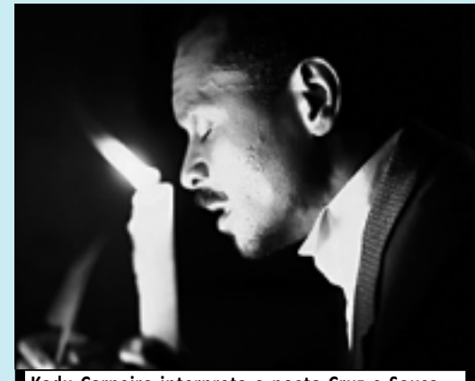
Kadu Carneiro interpreta o poeta Cruz e Sousa

>>> CRUZ E SOUSA - O POETA DO DESTERRO - História de vida, a obra e a morte do poeta catarinense João Cruz e Sousa, fundador do Simbolismo na Literatura Brasileira e considerado o maior poeta negro da língua portuguesa. Através de 34 quadros, chamados de "estrofes visuais", ou seja, poemas ditos e encenados, mostra desde as arrebatadoras paixões do poeta em Florianópolis até o seu emparedamento social, racial e intelectual, e o trágico fim no Rio de Janeiro. SE LIGUE: Hoje, às 22h, no Canal Brasil