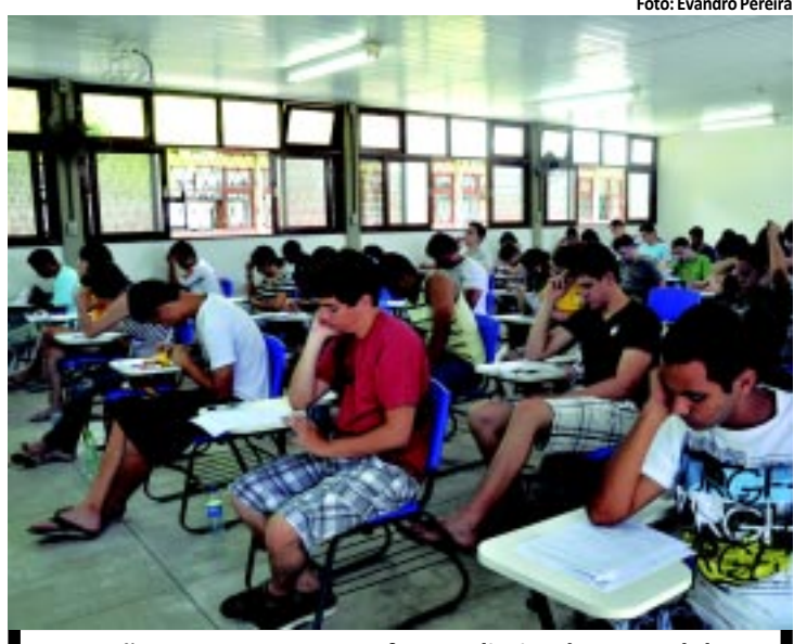
5.586 não compareceram ou foram eliminados por celular

Dos 38.152 candidatos inscritos para fazer as provas do Processo Seletivo Seriado 2012 da UFPB, 5.586 não compareceram no horário ou foram eliminados por entrar na sala com aparelho celular. Apesar da proibição do acesso de pessoas com o telefone às salas, 90 candidatos na Capital desobedeceram a regra e foram excluídos, o que representou um aumento de 12,5% em relação ao ano passado. PÁGINA 9