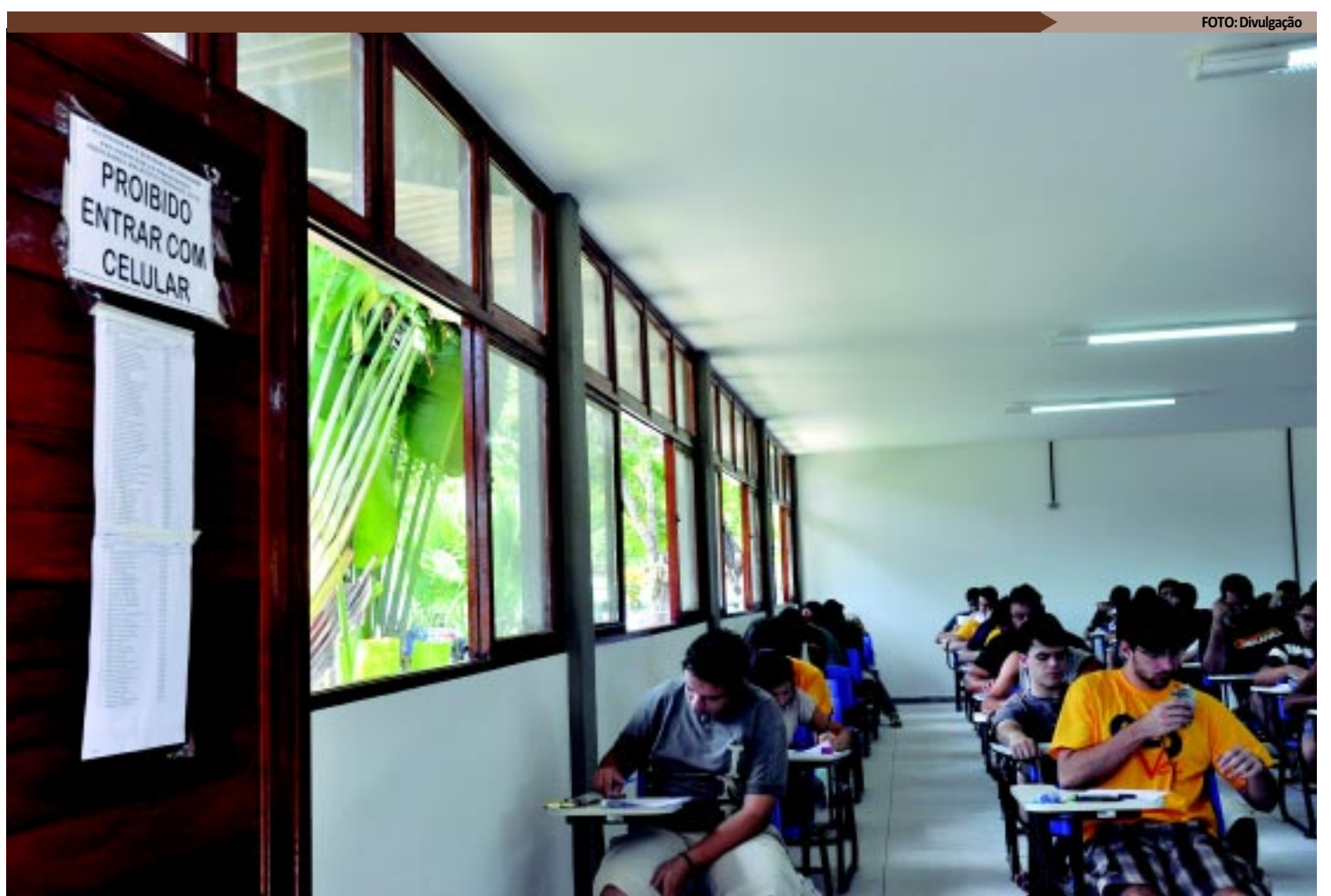
Na Capital, 90 candidatos foram eliminados pelo porte de celular. O resultado final, em todo o Estado, deverá ser divulgado hoje, segundo a Coperve

Mediante a reclamação por escrito, entregue à Coperve pessoalmente ou através de procuradores, a comissão de vestibular tem até sete dias para responder as alegações interpostas pelos inscritos.