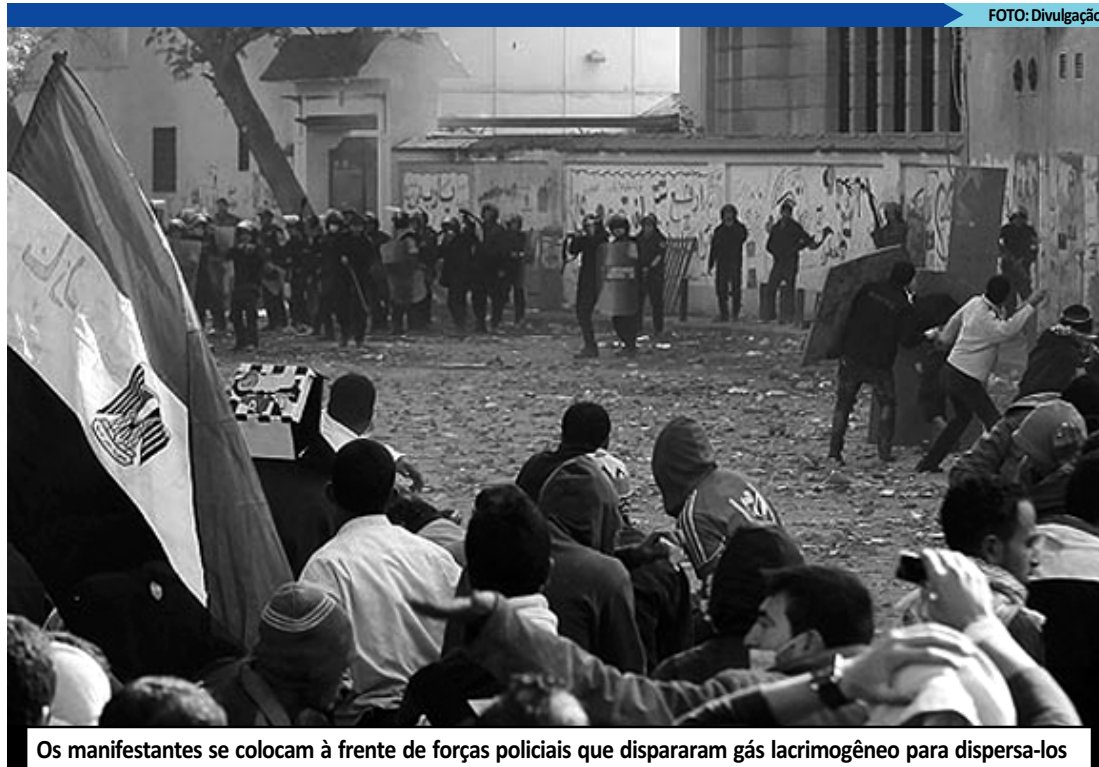
Os manifestantes se colocam à frente de forças policiais que dispararam gás lacrimogêneo para dispersá-los

Na manhã de ontem, o ministro egípcio da Cultura, Emad Abu Ghazi, informou sua renúncia para protestar contra a reação do governo diante dos