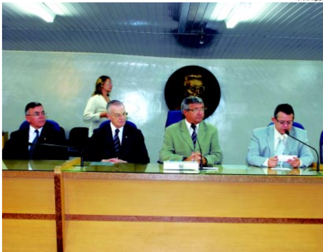
Durante seu discurso, príncipe defende Monarquia e elogia a atuação das Câmaras Municipais do Brasil

O governador destacou que a fusão das antigas pastas para a criação da Secretaria da Fazenda vinha sendo estudada desde o início da gestão, por ser um modelo adotado pela maioria dos estados da federação. "O novo modelo tem como objetivo a modernização, eficiência na máquina administrativa, além de economia dos recursos. A intenção é racionalizar os custos e melhorar o funcionamento", informou o governador.