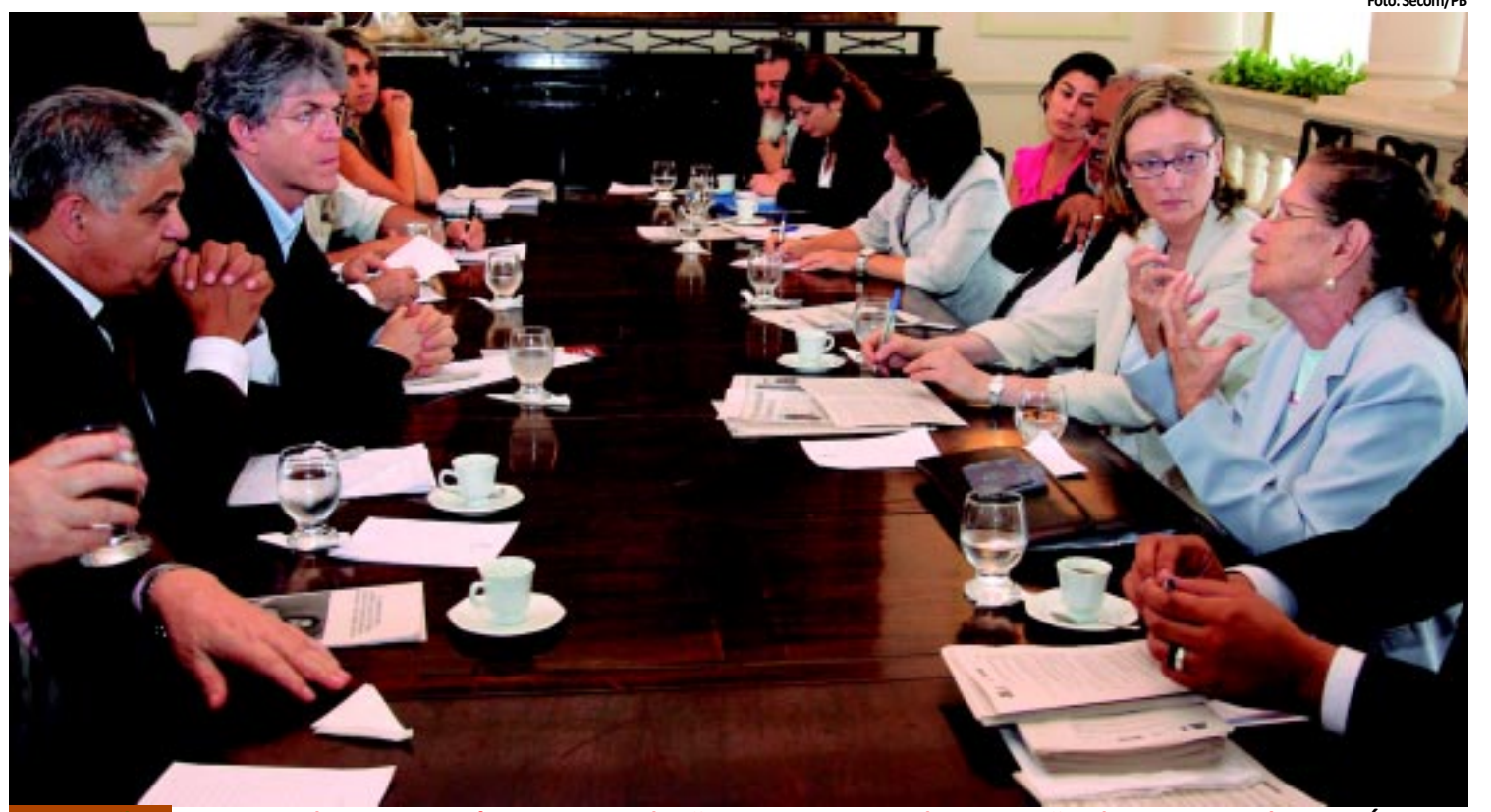
REUNIÃO Governador garante à ministra adesão a programas de proteção de testemunhas PÁGINA 3

como principal objetivo racionalizar custos e melhorar. Outra medida do gestor foi destinar 20% dos cargos comissionados do governo que passarão a ser ocupados por efetivos. PÁGINA 4