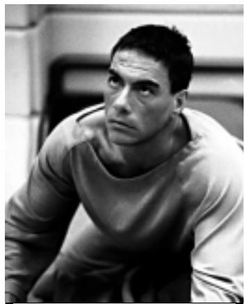
O SBT exibe o filme Replicante