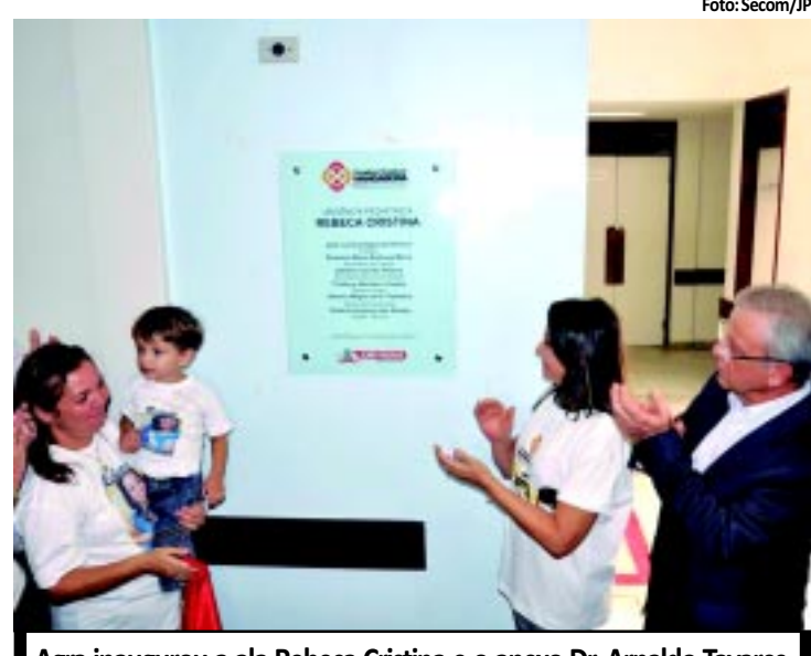
Agra inaugurou a ala Rebeca Cristina e o anexo Dr. Arnaldo Tavares

da atualização dos parâmetros econômicos utilizados na proposta orçamentária de 2012. O anúncio foi enviado em ofício do Ministério do Planejamento. PÁGINA 6