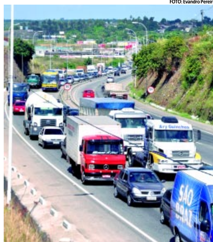
O trânsito ficou lento das 7h30 às 8h30 entre os quilômetros 17 e 24

A PRF explicou que o congestionamento no referido trecho da BR-230, nos dois sentidos, começou às 7h30. A pressa de alguns motoristas provocou três colisões traseiras, duas das quais no acesso ao viaduto da entrada do bairro de José Américo - sentido Bayeux, o que complicou mais ainda o trânsito na rodovia. Segundo o órgão, os acidentes não tiveram vítimas.