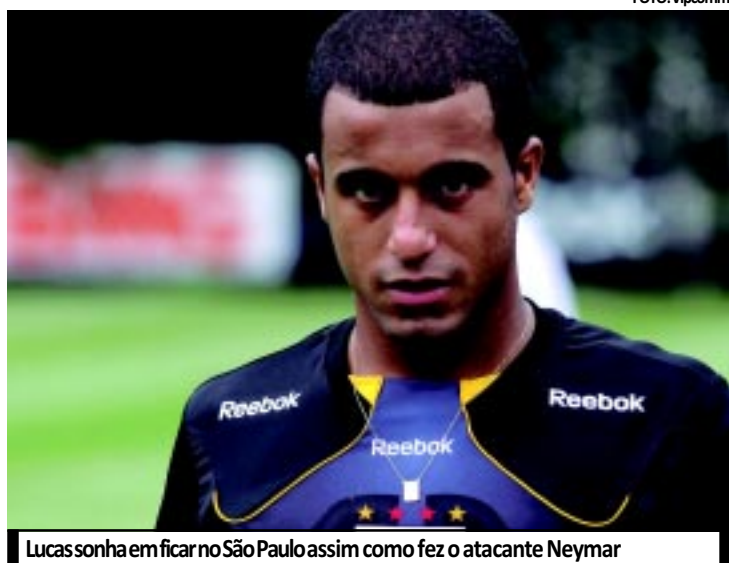
Lucas sonha em ficar no São Paulo assim como fez o atacante Neymar

O assédio do futebol da Europa é cada vez maior. São várias as propostas: Manchester United (ING), Liverpool (ING), Juventus (ITA), Internazionale (ITA), além de times da Rússia e da Ucrânia. Mas Lucas não quer saber de sair agora. Tem como meta disputar uma Taça Libertadores da América pelo São Paulo. E, baseado no que ocorreu com Neymar no Santos, ele até já fala na possibilidade de permanecer no Tricolor até a Copa do Mundo de 2014. Para isso, o clube do Morumbi terá que, além de abrir o cofre, montar um projeto que viabilize a sua permanência.