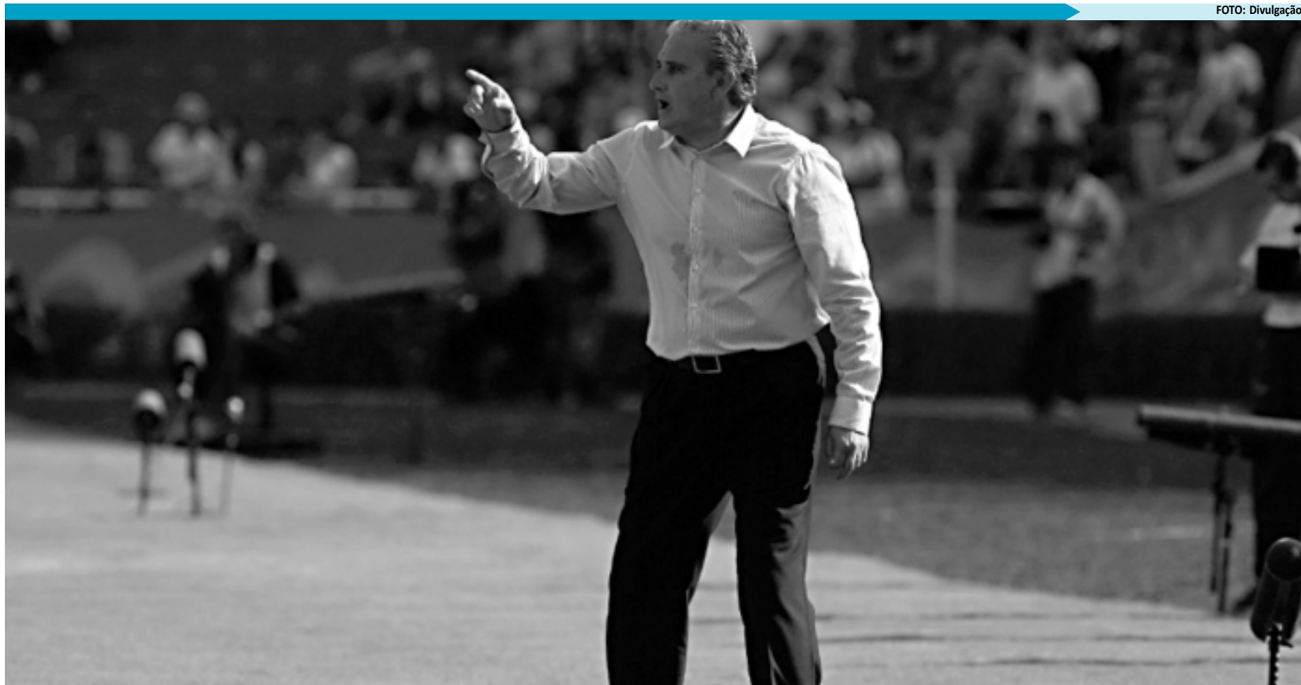
Tite quer o time ainda mais concentrado nos dois últimos jogos e mostra o caminho para não ser surpreendido. O Corinthians pode ser campeão no próximo domingo em Santa Catarina

Esse cenário parecia improvável quando o time perdeu do América-MG, há 15 dias. Naquela ocasião, o Corinthians estava empatado em pontos com o Vasco e ain-