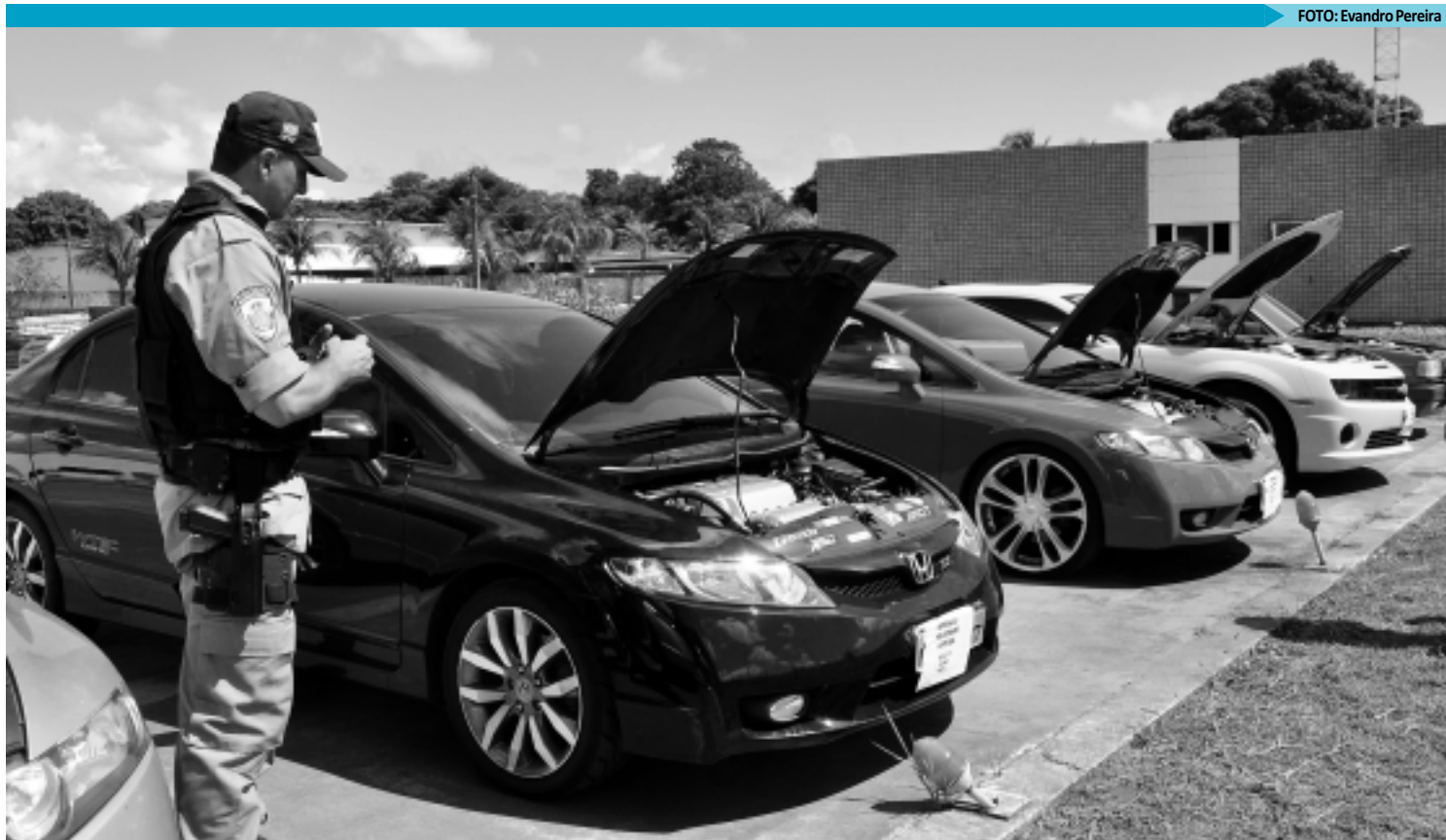
Carros de luxo equipados foram apreendidos pela PRF-PB na sexta-feira passada e tinha motor modificado para a prática de corrida nas rodovias