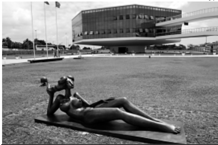
A escultura de Abelardo da Hora já pode ser contemplada pelo público

Aurora I, de Abelardo da Hora, está instalada junto a outras três obras do artista