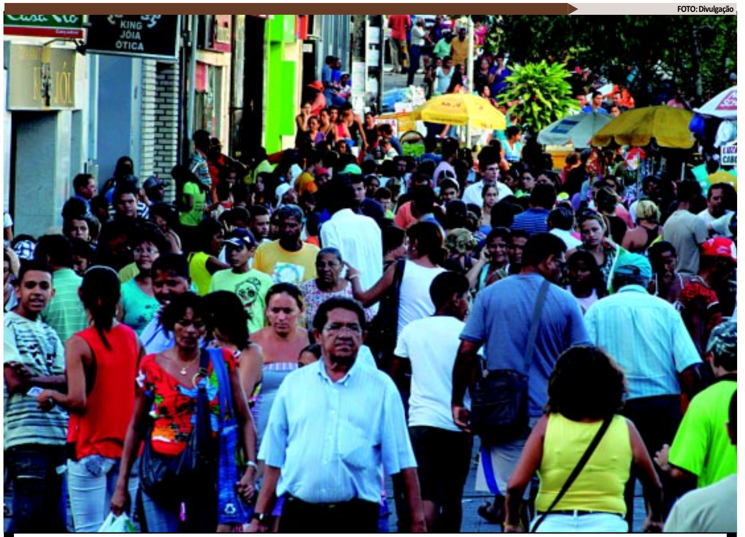
Os dados, a partir de estimativas do IBGE, apontam João Pessoa e Campina Grande como cidades mais populosas da PB, seguidas de Santa Rita e Patos

A pesquisa do IBGE também aponta que 73,5% dos municípios paraibanos (163) apresentaram ganhos popu-