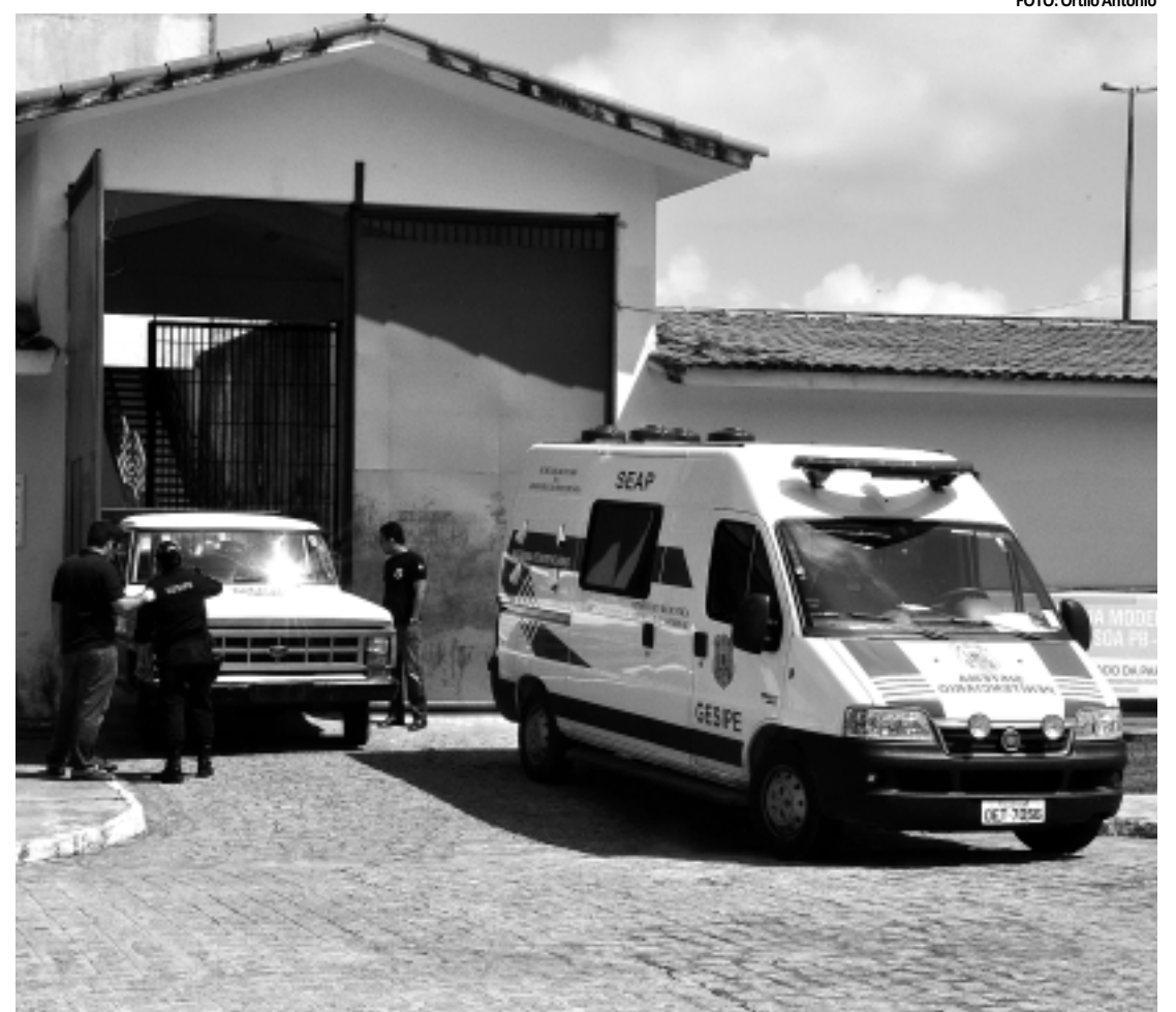
O objetivo é alcançar a meta da Estratégia Nacional de Segurança Pública, que prevê conclusão de inquéritos

Os indivíduos encontram-se presos em Guarabira e serão enquadrados no crime de estelionato, que tem como pena detenção de um a cinco anos de prisão.