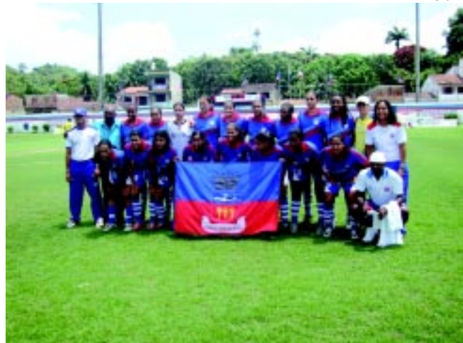
A equipe baiana tem obtido bons resultados na Copa do Brasil