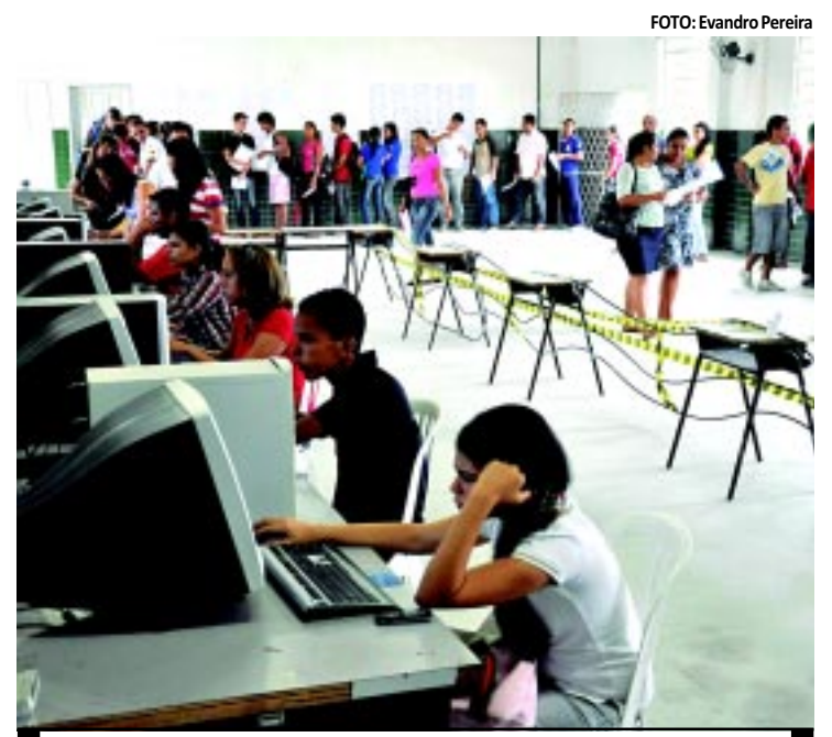
A concorrência dos cursos só deve ser divulgada no mês de outubro

A concorrência dos cursos deverá ser divulgada em outubro próximo e a previsão da Coperve é de que mais de 37 mil candidatos tenham efetivado a sua inscrição. Este ano a UFPB oferece 8.070 vagas e conta com quatro cursos novos para o ano letivo de 2012, sendo o de Cinema e Audiovisual para o campus de João Pessoa, o de Química para o campus de Areia e o de Letras e em Mamanguape.