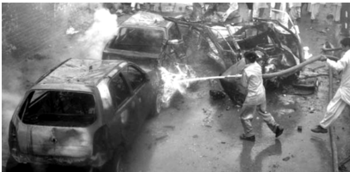
A explosão de carro-bomba aconteceu num estacionamento e se junta a outros atentados que ocorreram no país

"Até o momento não há reivindicação e todas as hipóteses são possíveis, mas a bomba explodiu em um bairro xiita", declarou à AFP Mohamad Hashim, oficial de polícia de Quetta.