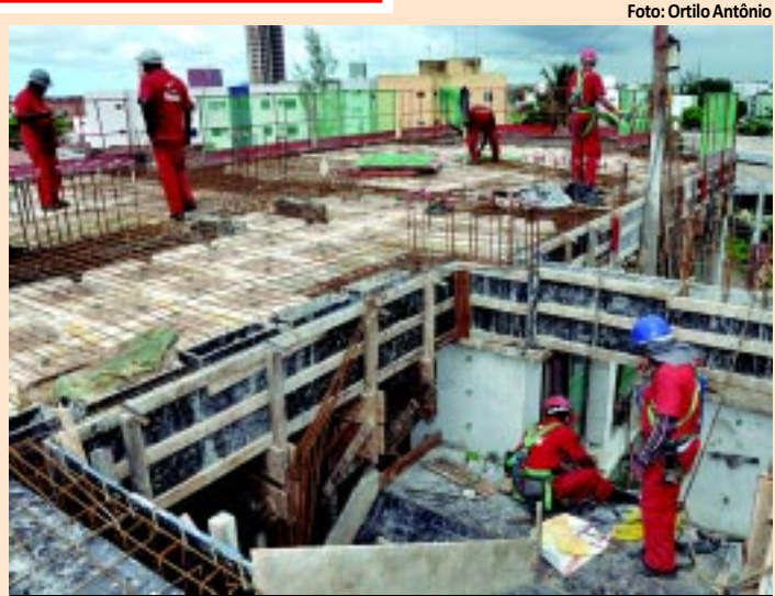
Construção tem maior proporção de empresas empreendedoras