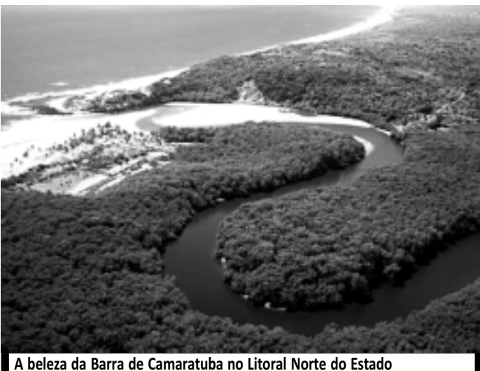
A beleza da Barra de Camaratuba no Litoral Norte do Estado

Mas não quero mais voltar, p'ra não ter que ter saudade, da magia que tem lá, que me faz tanto sonhar... Muito mais do que sonhar!