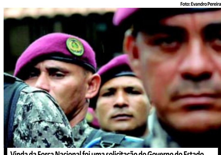
Vinda da Força Nacional foi uma solicitação do Governo do Estado