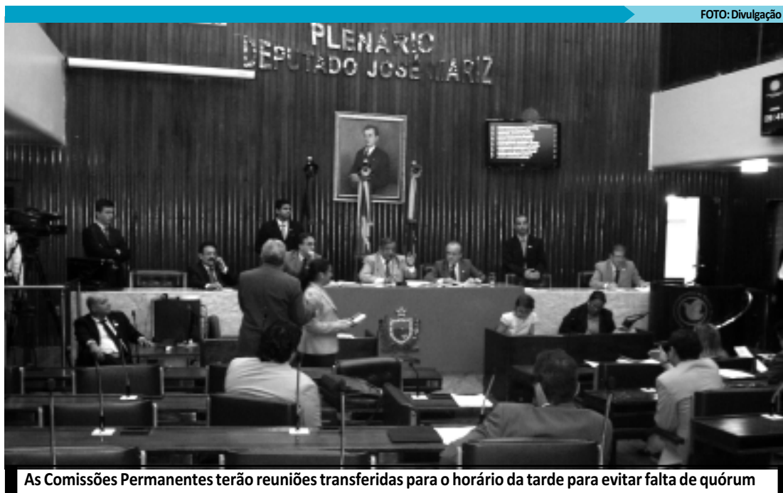
As Comissões Permanentes terão reuniões transferidas para o horário da tarde para evitar falta de quórum