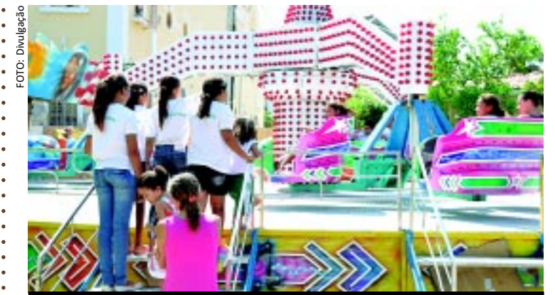
[FOTO&LEGENDA] A Secretaria de Ação Social e Educação de Sousa promoveu ontem uma "Manhã no Parque" com todas as crianças integrantes dos programas sociais desenvolvidos pelo Município e das escolas municipais. A criançada teve acesso livre às atrações.