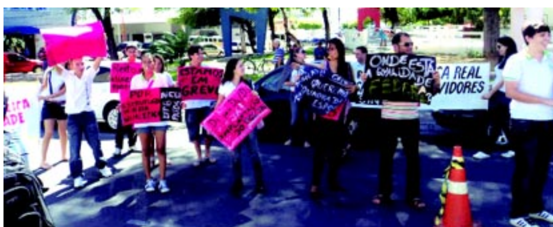
MANIFESTAÇÃO Servidores mantêm greve na UFPB, no IFPB e na UFCG; ontem foi dia de mobilização em vários campi PÁGINA 9