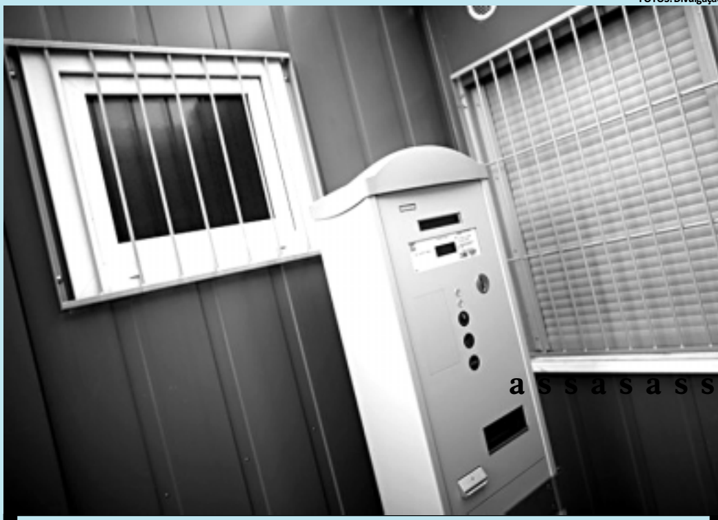
Com a instalação do equipamento, a Prefeitura de Bonn espera arrecadar R$ 458 mil com a taxaço