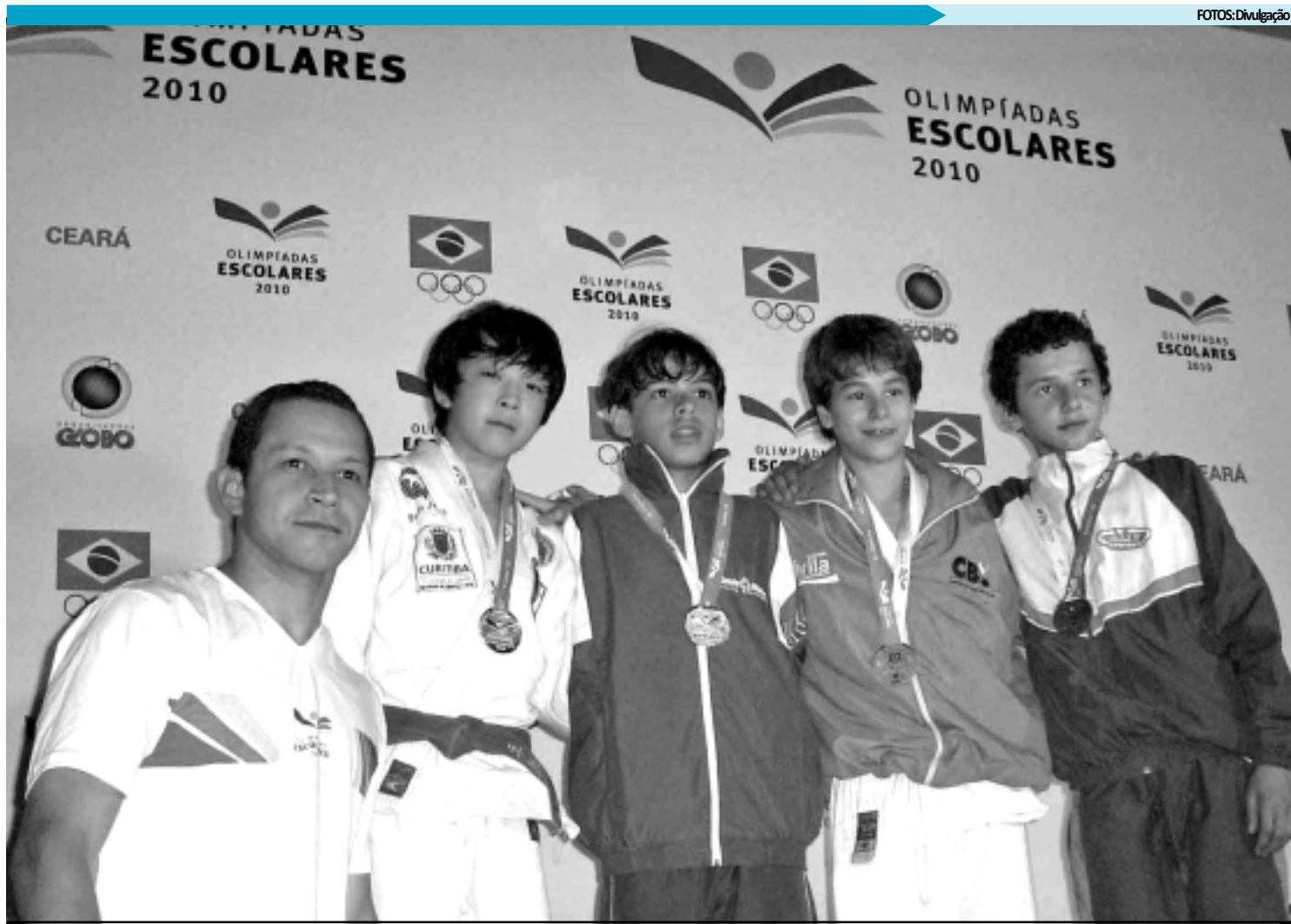
Apesar de já ter sediado duas olimpíadas escolares brasileiras, esta será a primeira vez que João Pessoa receberá os jogos da categoria 12 a 14 anos

O evento é realizado em duas etapas em cidades diferentes, com faixas etárias distin-