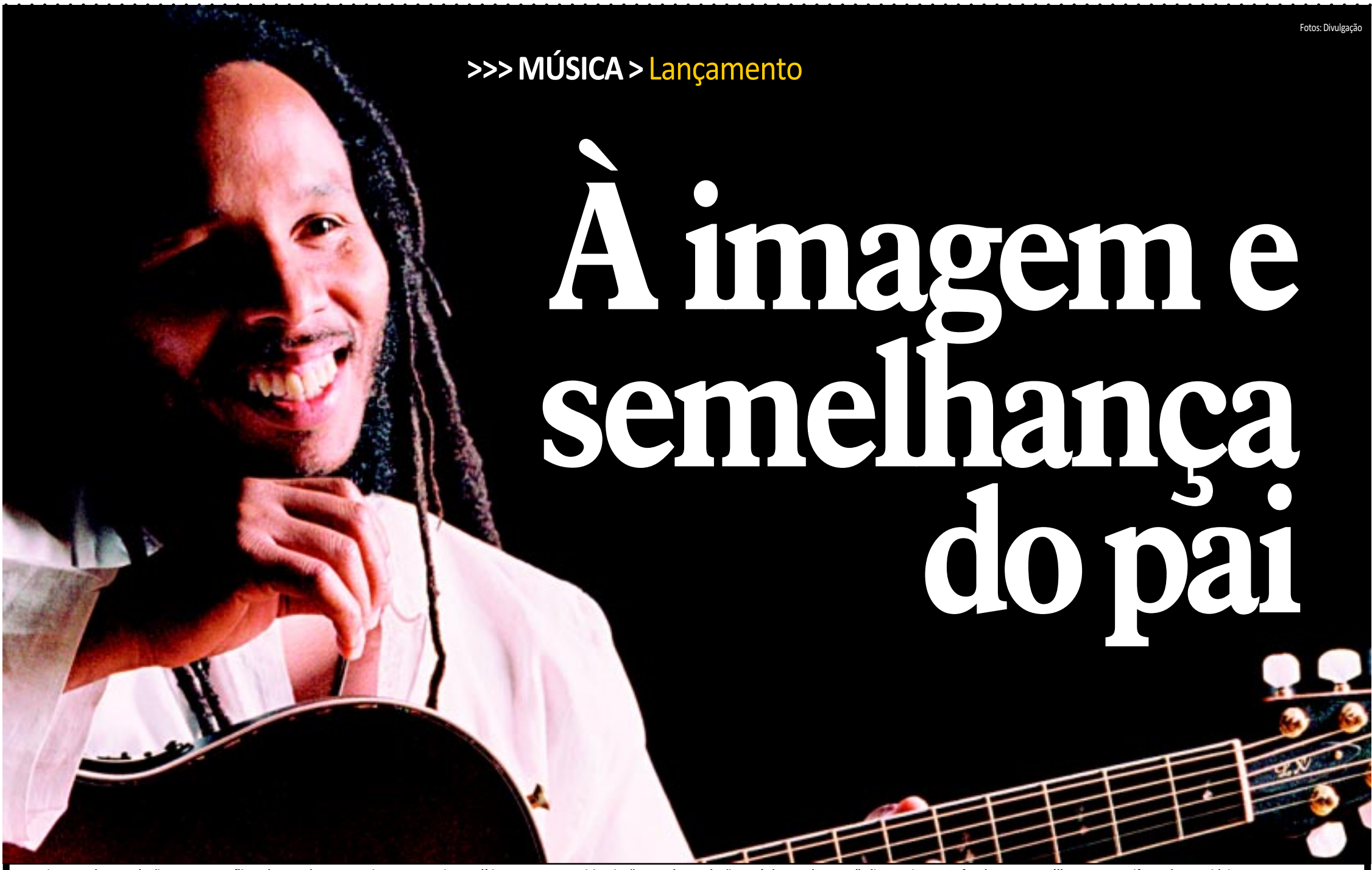
Para Ziggy Marley, a solução para os conflitos do mundo nunca vai estar nas coisas políticas, mas nas espirituais. "A grande revolução está dentro da gente", diz o artista, que faz de seu novo álbum um manifesto de suas ideias

Artista está engajado na luta pela aprovação da Proposition 19, na Califórnia