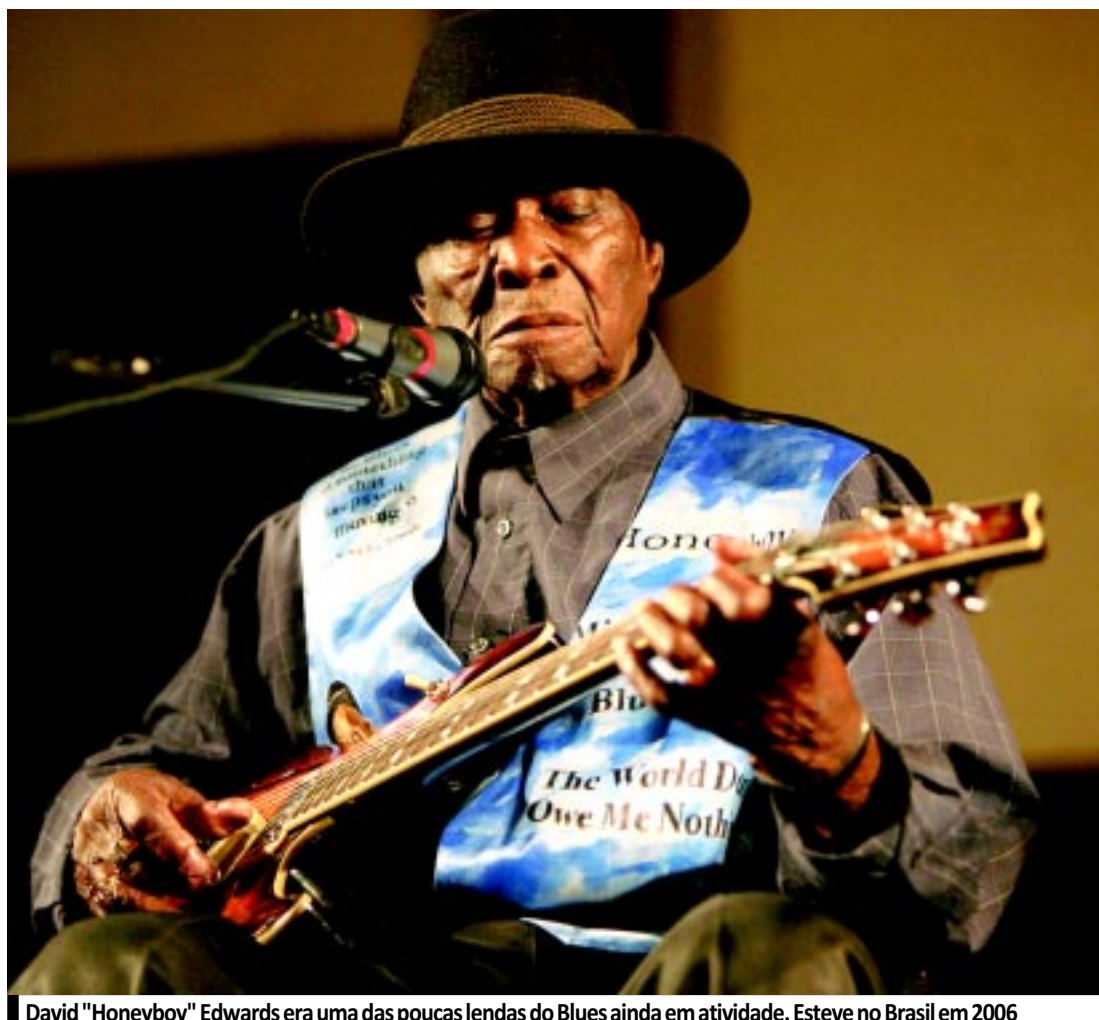
David "Honeyboy" Edwards era uma das poucas lendas do Blues ainda em atividade. Esteve no Brasil em 2006

Alguns discos parecem fadados a transformar-se em docu-