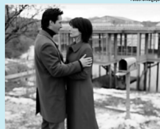
Keanu Reeves e Sandra Bullock em A Casa do Lago

>>> A CASA DO LAGO - Alex Wyler é um arquiteto frustrado que mora numa casa à beira de um lago, onde antes morou a solitária médica Kate Forster. Os dois passam a se comunicar por meio de cartas colocam na caixa de correio da residência. Eles mantêm esse misterioso relacionamento à distância por dois anos. Um dia percebem que estão apaixonados um pelo outro e decidem se encontrar. Refilmagem do longa-metragem coreano Siwora . SE LIGUE: Hoje, às 23h, no Warner