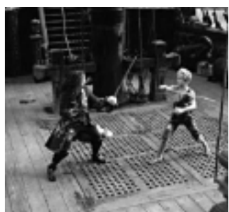
Peter Pan à tarde no Globo