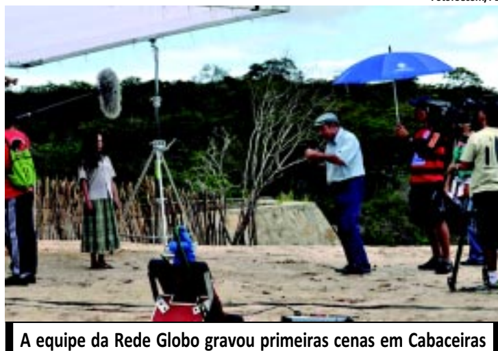
A equipe da Rede Globo gravou primeiras cenas em Cabaceiras

íba. Na Capital, o set de gravação retoma o trabalho com cenas no Centro Histórico, envolvendo o Hotel Globo, o Largo São Frei de Pedro Gonçalves e a Praça Antenor Navarro. PÁGINA 8