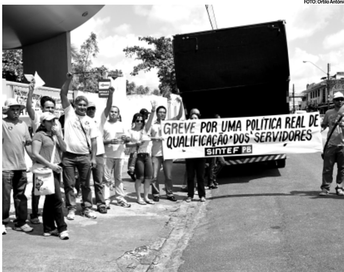
Professores e técnicos da IFPB distribuíram panfletos informativos sobre reivindicações nas ruas de Jaguaribe

Nesta quinta-feira ocorrerá uma assembleia na AdufCG (Associação dos Docentes da Universidade Federal de Campina Grande), onde sairá uma decisão sobre possível movimento de greve.