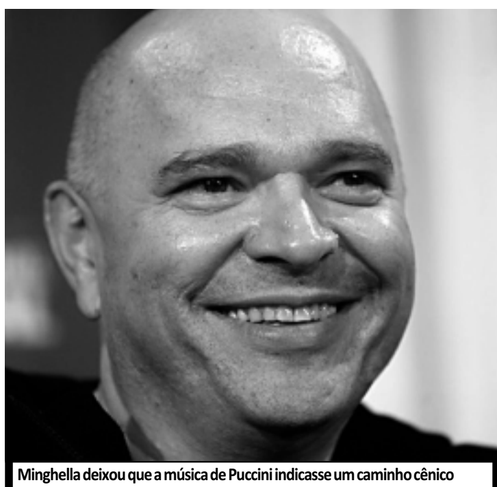
Minghella deixou que a música de Puccini indicasse um caminho cênico

uma mulher com quem poderá se casar. Da noite de amor do casal, no entanto, nasce um filho, ao lado de quem a moça japonesa, ainda apaixonada, espera ansiosamente o retorno do amante americano.