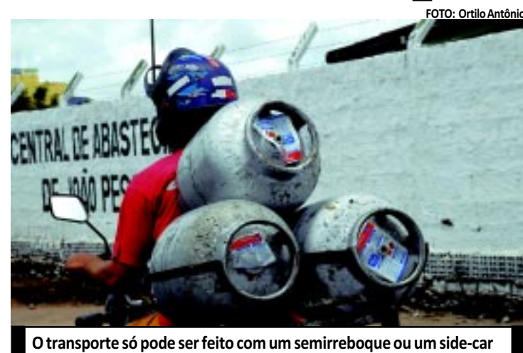
O transporte só pode ser feito com um semirreboque ou um side-car

> Josélio Carneiro joseliocarneiro@gmail.com