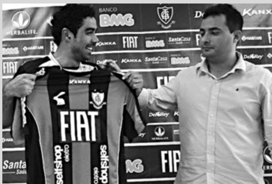
Jogador quando foi apresentado ao América. Ele já atuou em grandes clubes do Brasil

"Eu acho que, independentemente de qualquer situação, tem que estar sempre buscando a titularidade, porque é uma coisa pessoal. Procuro pensar mais no grupo que no individual, mas não pos-