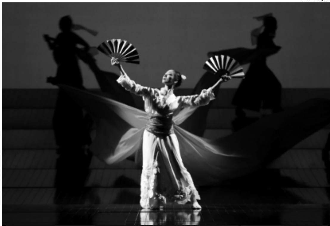
Em Madama Butterfly , Minghella faz uso de recursos simples, abstratos e mágicos nos momentos de maior lirismo

No Japão assolado pela guerra, Cio-Cio-San se apaixona por Pinkerton, soldado americano que, por sua vez, vê nela pouco mais do que uma aventura, a ser vivida antes do retorno aos Estados Unidos e a