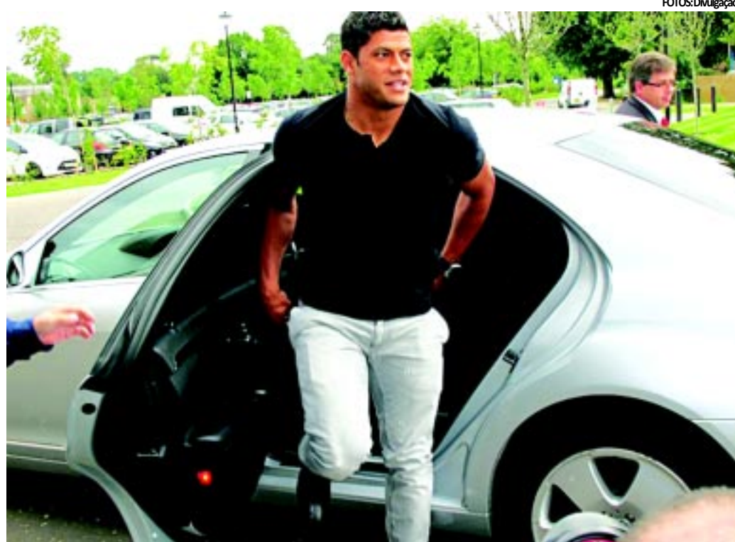
Paraibano, que joga no Porto, não consegue esconder o desejo de ter uma chance no time titular