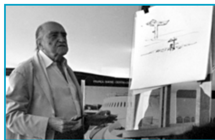
OS TEMPLOS DE OSCAR NIEMEYER