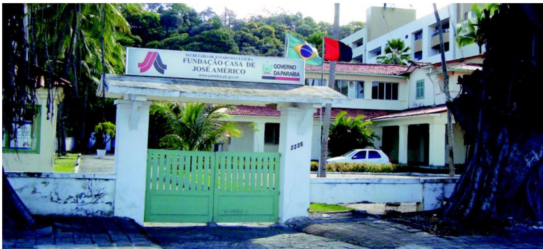
A sede da Fundação Casa de José Américo, localizada na Av. Cabo Branco, 3336, é um dos principais polos de atividades artísticas e culturais da cidade de João Pessoa. A agenda da instituição fica ainda mais rica com a Sessão Cultural