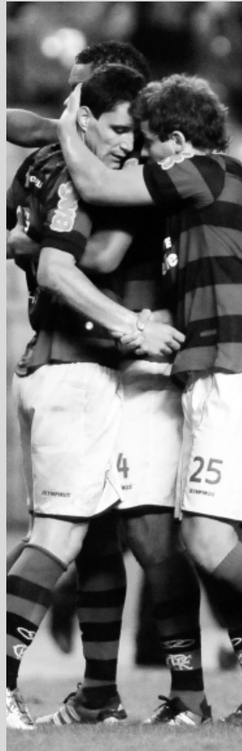
Flamengo joga dia 5 pela Sul-Americana