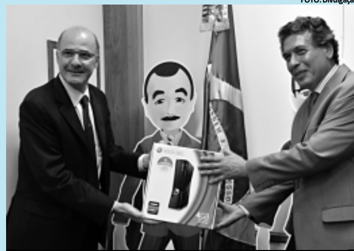
Representantes do Microsoft e do ministério apresentam o produto

A produção do console Xbox 360 no Brasil deve reduzir em 40% o preço para o consumidor final. O produto já montado no Brasil começa a chegar ao mercado no dia 5 de outubro. Para o governo, a produção do console em território brasileiro é resultado das políticas adotadas para atrair fabricantes de tecnologia da informação (TI), como os incentivos fiscais para a instalação de fábricas de computadores em forma de prancheta (tablets). O console deverá cumprir o mesmo processo de nacionalização previsto para os tablets, disse à Agência Brasil o secretário de Política de In-