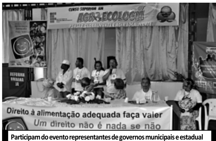
Participam do evento representantes de governos municipais e estadual

Durante a conferência também está sendo discutido o plano de segurança alimentar e nutricional para o Estado, ligado ao Sistema Nacional de Segurança Alimentar e Nutricional (Sisan), que é responsável pela promoção do direito humano à alimentação adequada e saudável.