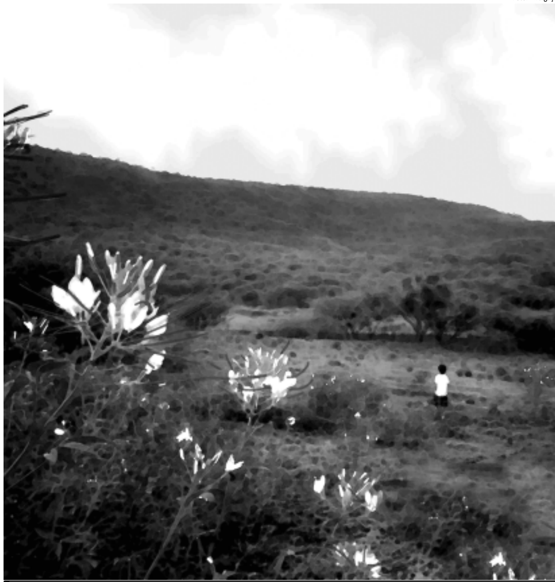
Flor de Muçambê, fotografia de Rachel Lúcio que integra a exposição Le Soleil Se Lève À Cinq Heures

do exposições ao longo dos últimos quatro anos, Rachel Lúcio garantiu que não parou de produzir, durante esse tempo. Ela confessou que o retorno, agora - representado pela individual que acontece na sede da Aliança Francesa, na cidade de Natal - é cercado de boa expectativa. "É um reencontro com a pintura e com a presença de amigos", afirmou ela, que pretende levar a mostra para a cidade de João Pessoa, embora ainda não tenha definida a data.