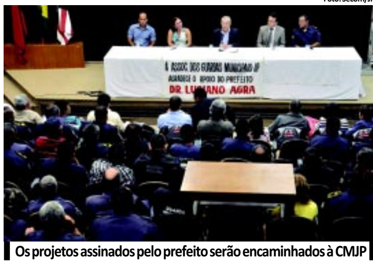
Os projetos assinados pelo prefeito serão encaminhados à CMJP