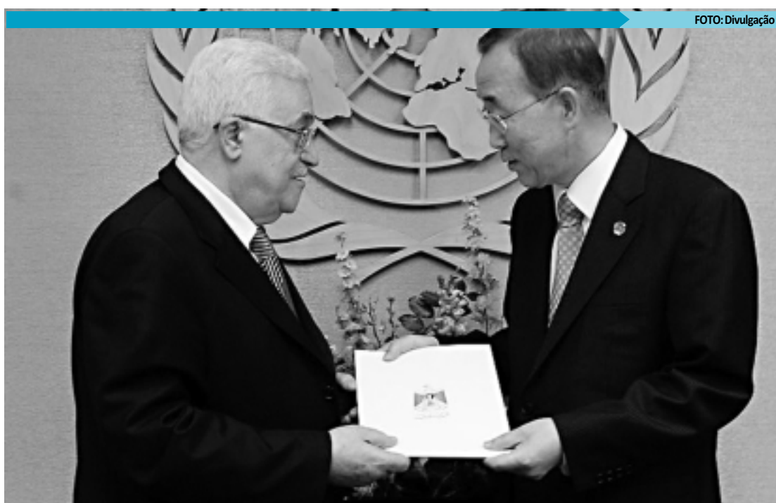
Presidente da ANP, Mahmoud Abbas, entregou pedido de reconhecimento ao secretário-geral da ONU, Ban Ki-moon

A nota conclui que "o governo brasileiro confirma que sua disposição de cooperar com a Bolívia no contexto da obra se desenvolve no entendimento de que se trata de projeto de grande importância para a integração nacional e que atende aos parâmetros relativos a impacto social e ambiental previstos na legislação boliviana".