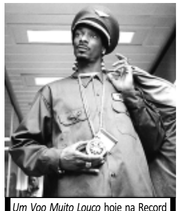
Um Voo Muito Louco hoje na Record