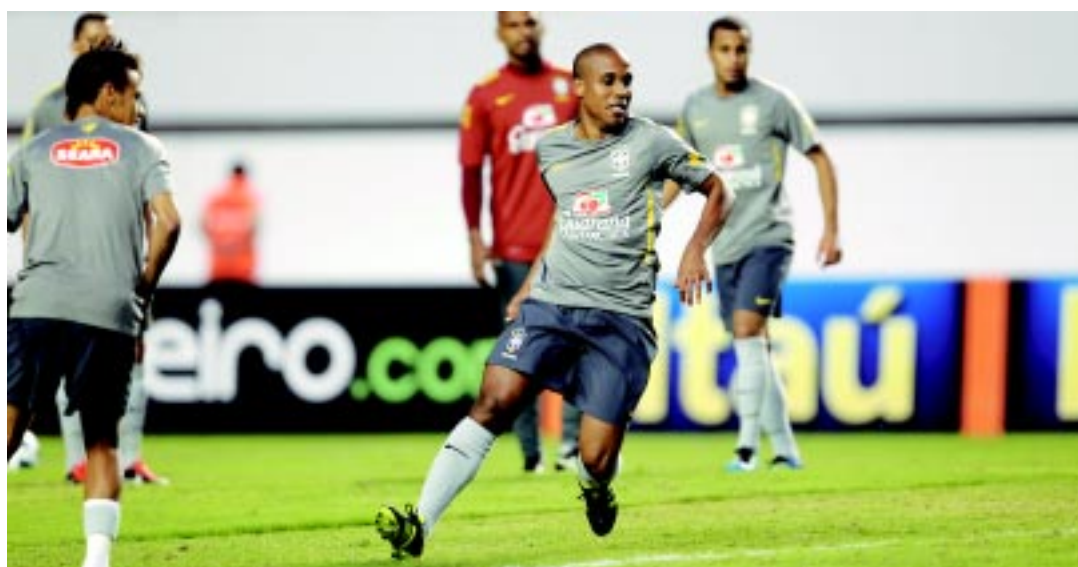
Artilheiro do Campeonato Brasileiro, o atacante Borges não vê a hora de fazer um gol com a camisa da Seleção

"Vou dar uma camisa para a minha esposa. A outra é para a minha mãe. Servir a Seleção é sempre muito importante", avaliou o sorridente artilheiro.