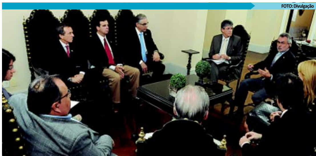
O governador Ricardo Coutinho recebeu os representantes da AACD, no Palácio da Redenção, ontem à tarde