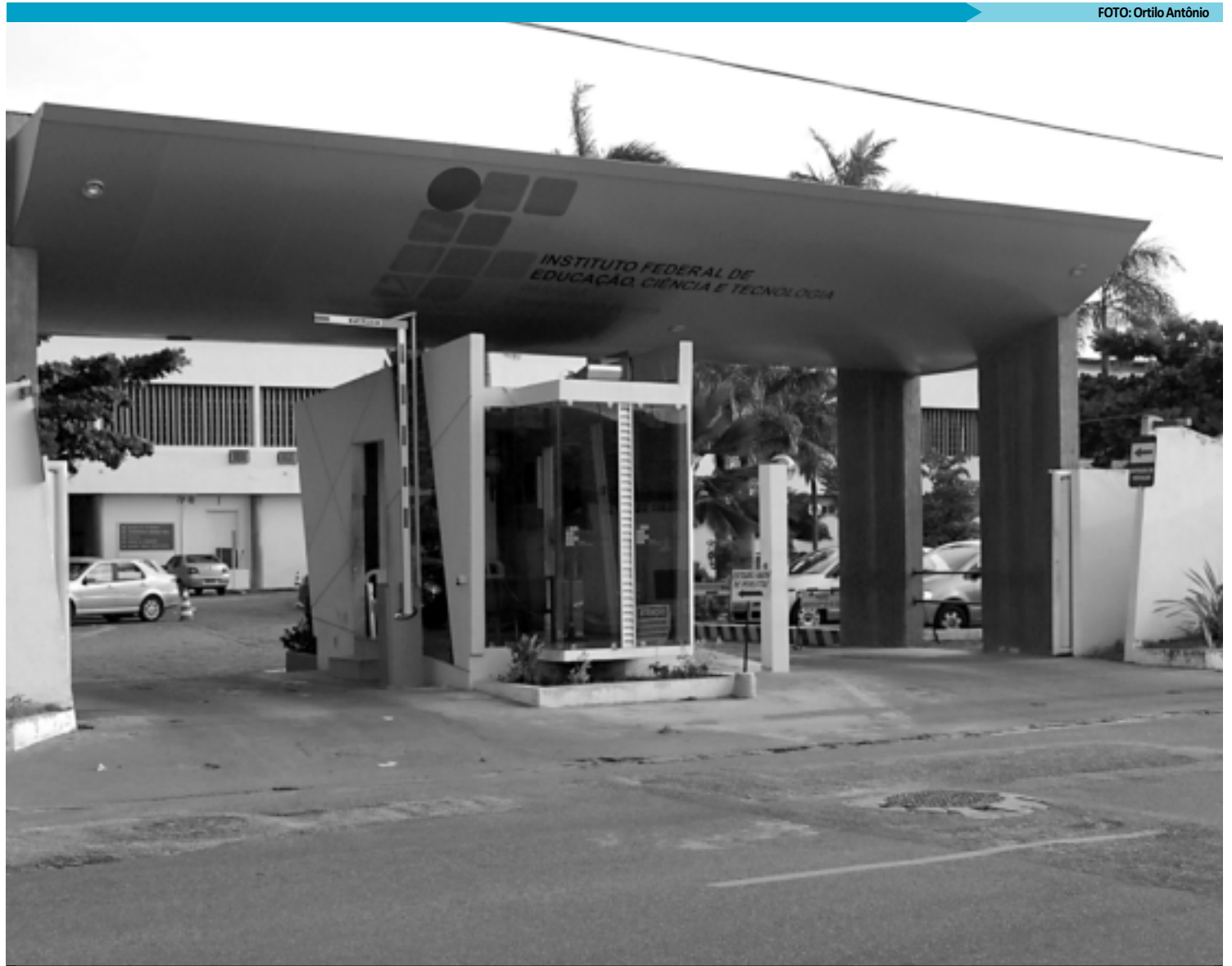
Com calendário letivo prorrogado para o dia 26 de janeiro de 2012, os alunos do Instituto, em João Pessoa, devem ter aulas de reposição aos sábados

"Na proposta inicial para elaboração do novo calendário acadêmico, nós além de estendermos o final do semestre letivo para o dia 26 de janeiro do próximo ano, também propomos repor os 200 dias de aulas, conforme determina a Lei, com aulas que serão realizadas aos sábados. Porém, isso ainda é uma proposta inicial