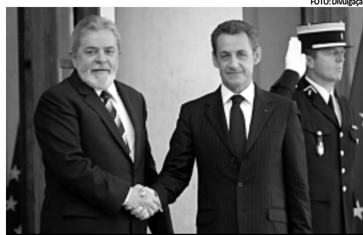
Sarkozy convidou Lula para participar de uma série de debates

Lula chegou segunda-feira (26) a Paris, onde se reuniu com o presidente da Fran-