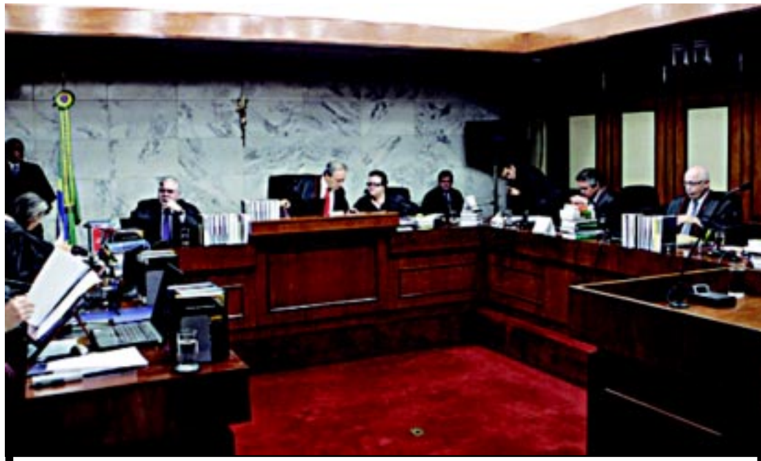
Tribunal Superior Eleitoral decidiu conceder o registro definitivo do Partido Social Democrático por 6 votos a 1

Já o PSDB protocolou uma representação no TCU solicitando uma auditoria especial no Ministério do Trabalho em razão das denúncias de distribuição de cargos públicos para atendimento a interesses partidários e contratação irregular de entidades para prestação de serviços públicos de capacitação, em convênios sem fins lucrativos, “notadamente aqueles destinados ao emprego do Fundo de Amparo ao Trabalhador (FAT)”.