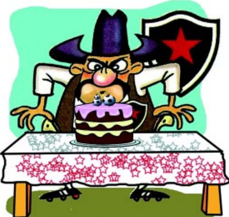
Ilustração: Domingos Sávio