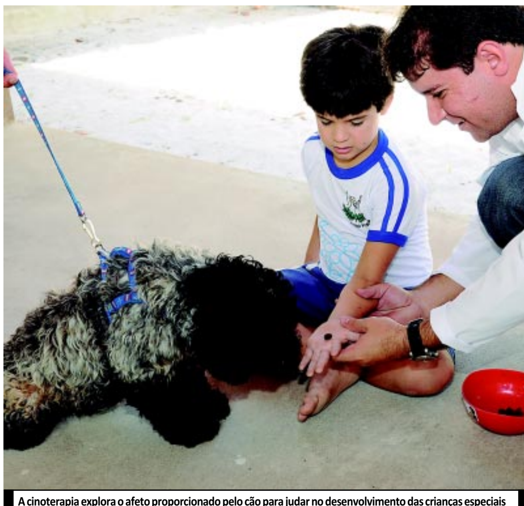
A cinoterapia explora o afeto proporcionado pelo cão para judar no desenvolvimento das crianças especiais

Explorando o afeto proporcionado pelo cão, a Cinoterapia é empregada em diversas áreas - Psicologia, Psiquiatria, Fonoaudiologia e Fisioterapia. Este tipo de trabalho não serve apenas para as crianças excepcionais, mas para todos aqueles envolvidos no projeto. "É extremamente útil na auto-