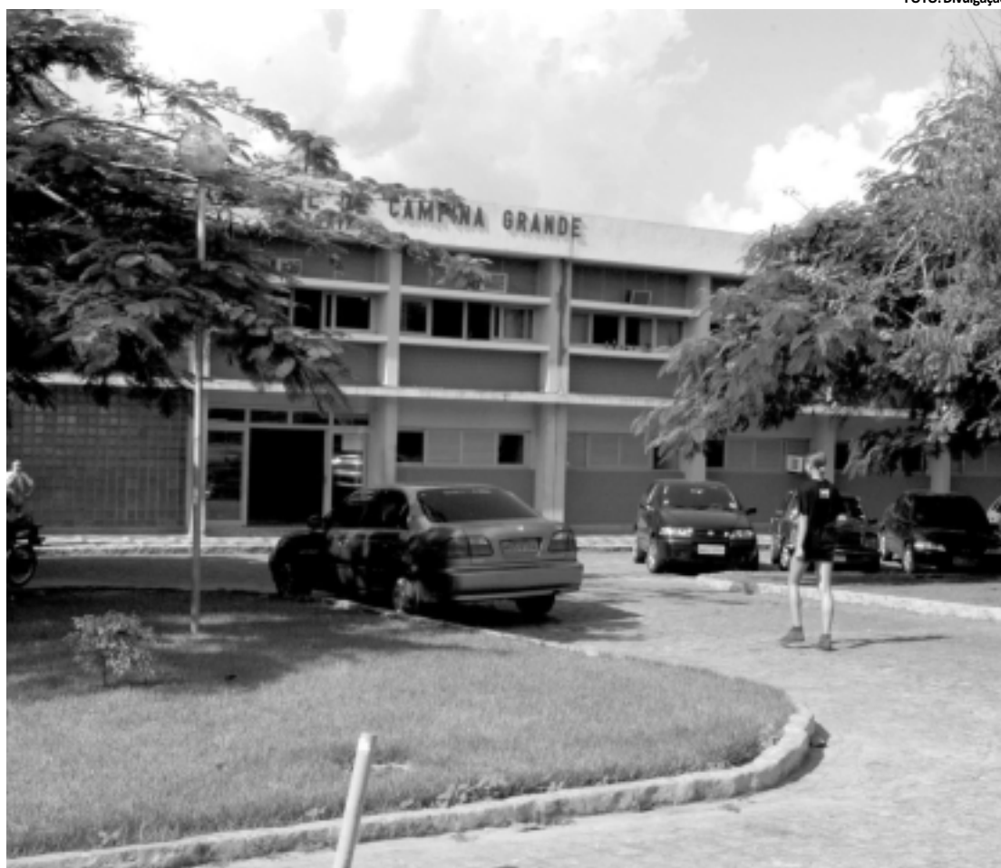
Ao todo, 72.181 candidatos vão concorrer a 4.765 vagas nos 75 cursos oferecidos pela Universidade de Campina

O servidor pode imprimir, preencher seus dados e enviá-la via fax: (83) 3214-1991. A inscrição também pode ser feita pessoalmente na sede da Espep. Informações mais detalhadas podem ser obtidas pelo telefone (83) 3214-1984.