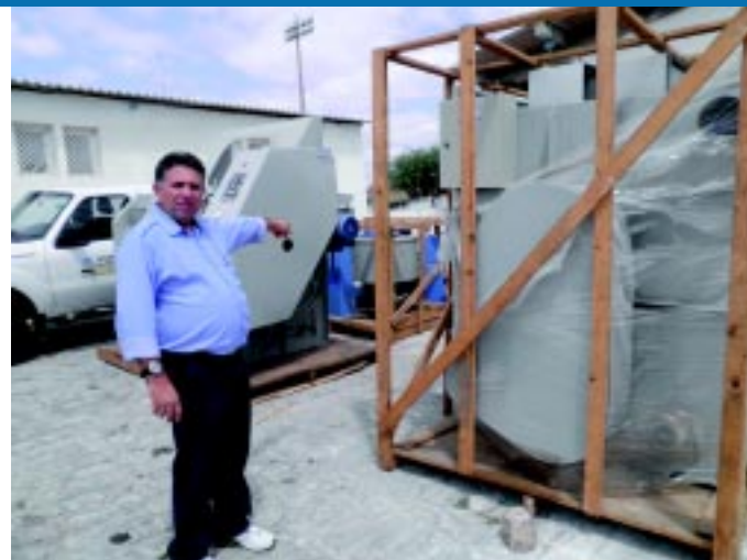
A nova lavanderia terá uma máquina para lavar, outra para secar e uma terceira para espremer roupas mais pesadas

Três equipamentos avaliados em torno de R$ 200 mil foram entregues ao Hospital Regional de Patos Deputado Janduhy Carneiro para a instalação de uma nova lavanderia. Ela vai atender àquela unidade hospitalar, além do Hospital Infantil Noaldo Leite e da Maternidade Peregrino Filho.