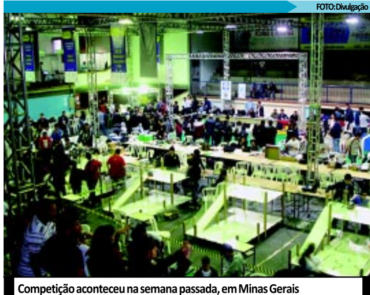
Competição aconteceu na semana passada, em Minas Gerais

ROBÓTICA - A ferramenta foi implantada na Rede Municipal em 2007 e atualmente atende a 52 escolas, com previsão, em curto prazo, de ser expandida a todas as unidades de ensino. Os laboratórios instalados