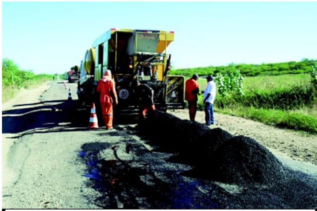
Várias frentes de trabalho foram formadas visando a recuperação das estradas danificadas

A operação tapa-buraco nas rodovias da malha estadual está sendo intensificada nesta semana pelo Departamento de Estradas de Rodagem (DER). Várias frentes de trabalho foram formadas visando a recuperação das estradas danificadas pelas chuvas de inverno, com prioridade inicial para os trechos com estragos maiores. PÁGINA 10