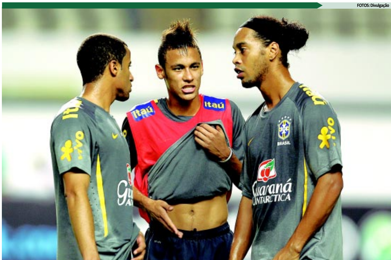
Neymar e Ronaldinho são as grandes estrelas do jogo e as principais esperanças de gol do torcedor paraense, que promete lotar o Mangueirão e apoiar o Brasil

"A expectativa é enorme. Estou contente e feliz pela convocação, mesmo sem sa-