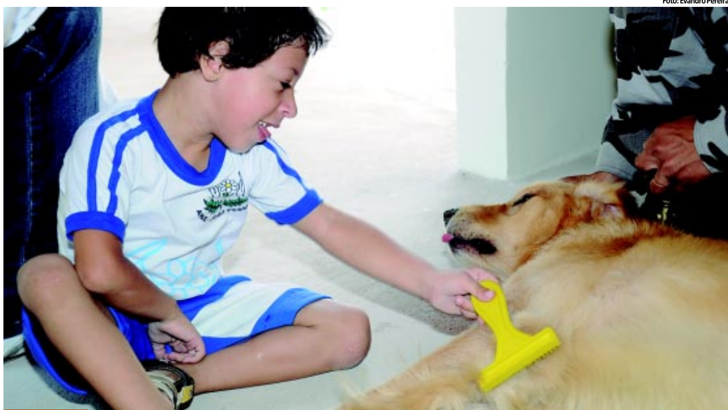
TERAPIA | Cães foram utilizados por policiais do Canil da PM em sessão de cinoterapia na Apae PÁGINA 8

bre o combustível dos atuais R$ 0,23 por litro para R$ 0,19 por litro. O tributo incide sobre a importação e comercialização de petróleo, gás natural e derivados. PÁGINA 6