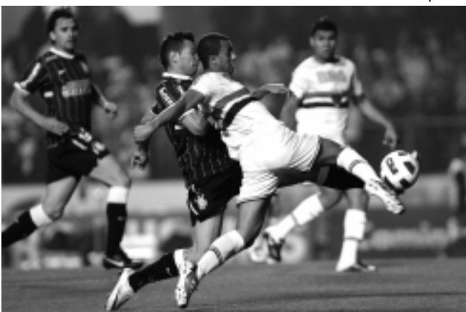
São Paulo e Corinthians têm jogos difíceis no próximo domingo