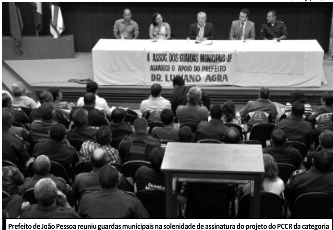
Prefeito de João Pessoa reuniu guardas municipais na solenidade de assinatura do projeto do PCCR da categoria