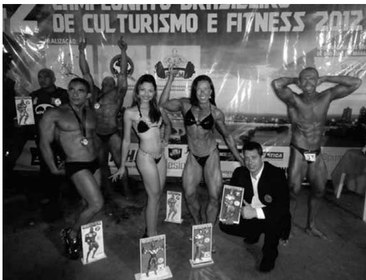
Equipe paraibana que brilhou na II Etapa do Campeonato Brasileiro