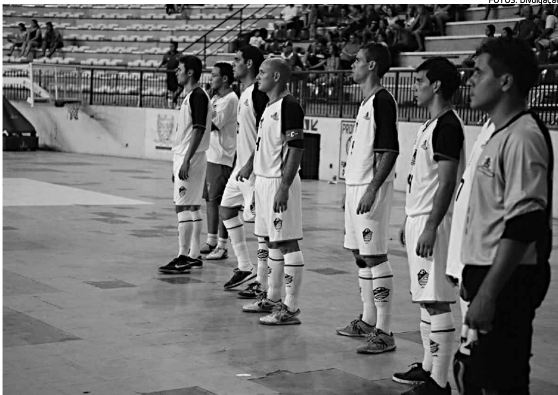
A equipe do João Pessoa Futsal está na disputa pelo título estadual com o Brejo do Cruz em dois jogos