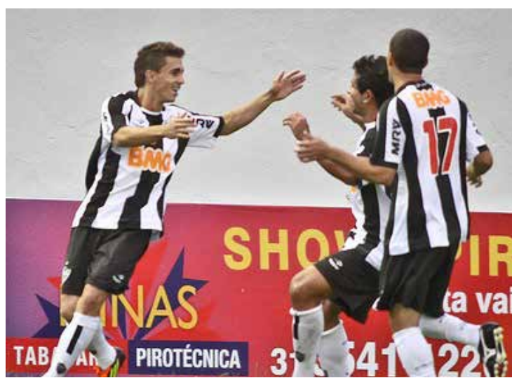
Time mineiro só foi crescimento com chegada do técnico Cuca