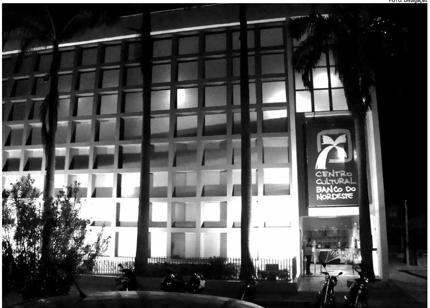
A unidade cultural oferece cinema, biblioteca, salas de exposição e espaço ao ar livre para apresentação de shows e peças de teatro

Cerca de quatro mil pessoas devem visitar a feira e conhecer de perto produtos e serviços de agências de viagens e receptivo, hotéis-fazenda, equipamentos rurais (pousadas, hotéis e restaurantes), roteiros turísticos da região Nordeste, empresas da área de turismo de aventura, agroturismo e artesanato.