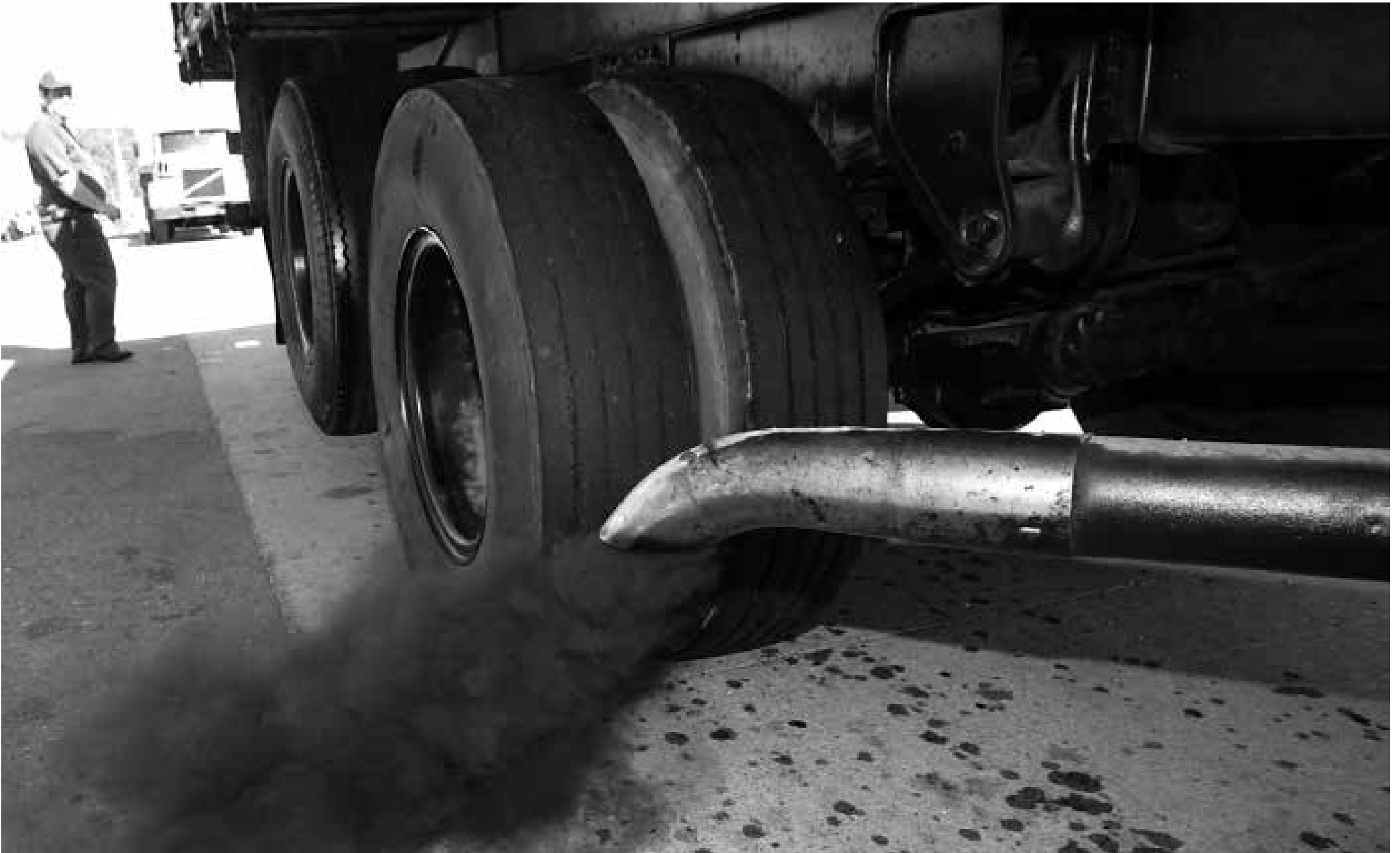
Fumaça do diesel foi classificada pela Organização Mundial da Saúde como cancerígena e afeta toda a população e principalmente profissionais como caminhoneiros, mineiros e mecânicos