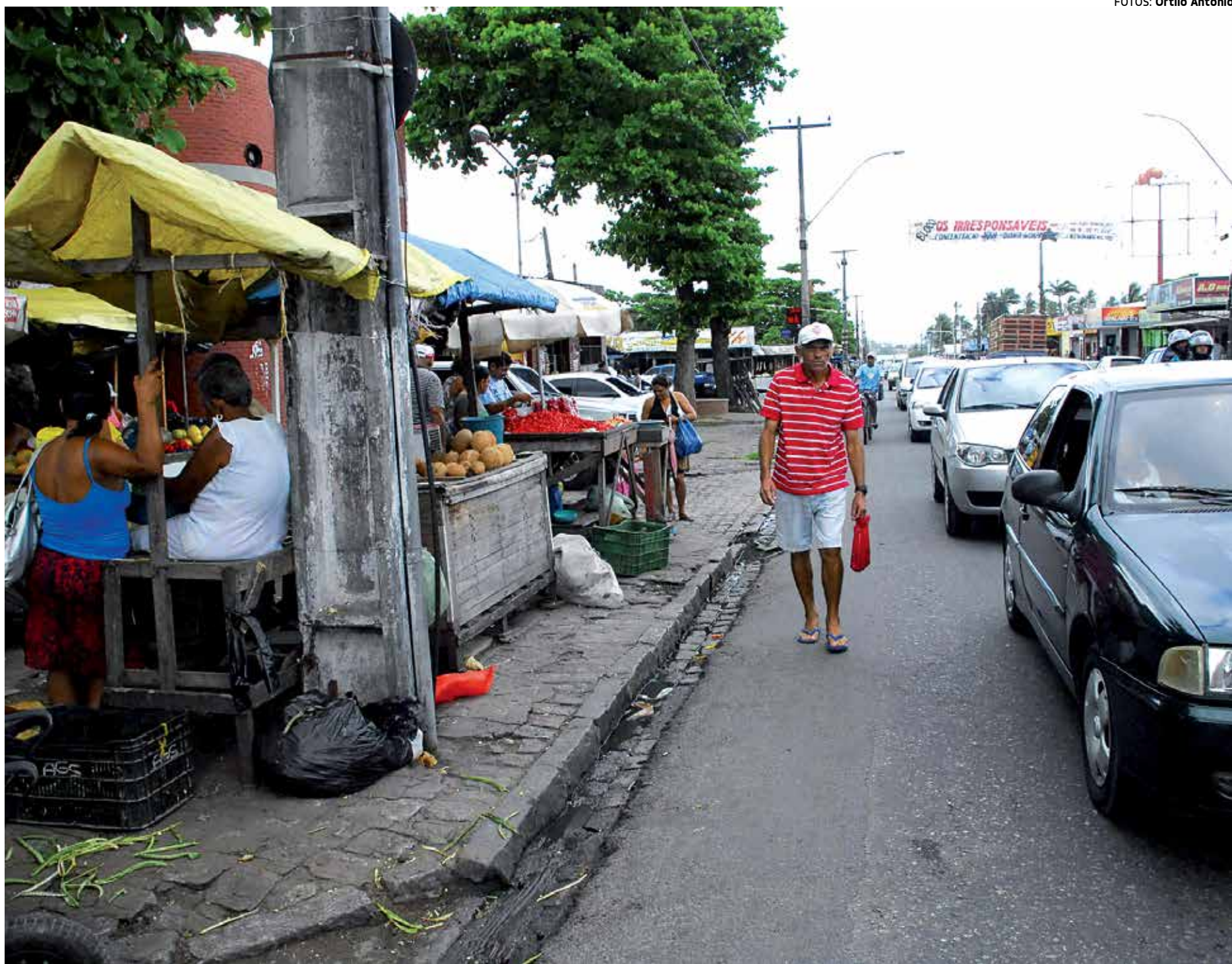
O Ministério Público vai trabalhar em conjunto com a Prefeitura na ação de fiscalização e desocupação de áreas públicas, principalmente em relação às calçadas

“Vamos juntar forças para garantir o espaço público, temos que agir e não permitir as irregularidades”