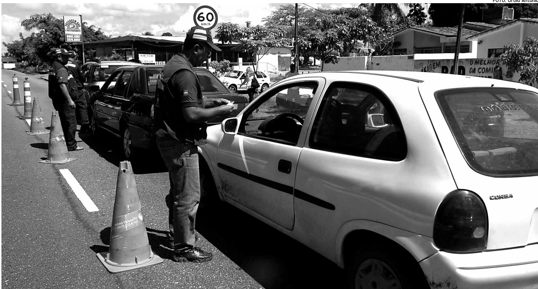
O Departamento Estadual de Trânsito vem realizando fiscalizações constantes em parceria com a Polícia, com a Semob e com a Secretaria do Meio Ambiente

Nos dados apresentados de janeiro a julho deste ano pela Divisão de Policiamento de Trânsito do Detran, foram fiscalizados 16.680 veículos, dos quais, 920 automóveis apreendidos; 139 motonetas de 50 cilindradas recolhidas; 9 quadriciclos retirados de circulação; 333 carteiras de habilitação recolhidas; 544 condutores flagrados sem CNH; 94 pilotos sem capacetes; 171 dirigindo sob efeitos de álcool e 3.604 notificações lavradas.