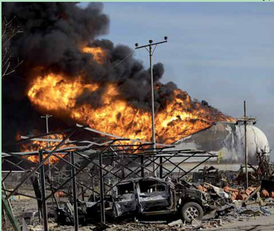
O incêndio na refinaria de petróleo começou no último sábado e matou 48 pessoas