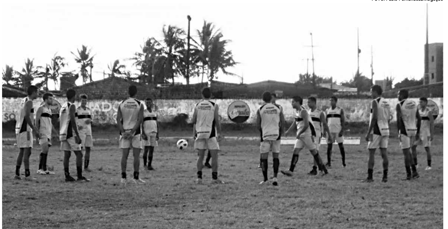
Os jogadores do Botafogo intensificam os treinamentos na Maravilha Contorno para buscar uma vaga na Copa Paraíba Sub-21

Segundo o ex-treinador do Santa Cruz de Santa Rita no Campeonato Paraibano da Segunda Divisão, a proposta é montar um grupo que possa brigar pelo título e a vaga na Copa do Brasil. “Estamos avaliando os jogadores que estão chegando para que possamos montar um grupo forte. A meta é conseguir o título e a vaga na disputa nacional”, avaliou.