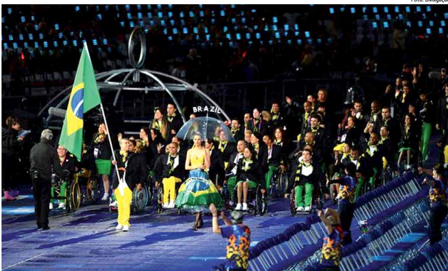
A delegação brasileira chamou a atenção do público presente ao estádio durante seu desfile na cerimônia oficial da abertura dos Jogos

Além dos 181 atletas, a delegação brasileira é composta por 16 acompanhantes de atletas (atletas-guia, calheiro e timoneiro), quatro tratadores de cavalos, 31 profissionais da área de saúde e 86 oficiais técnicos e administrativos. No total, são 319 pessoas representando o país em Londres.