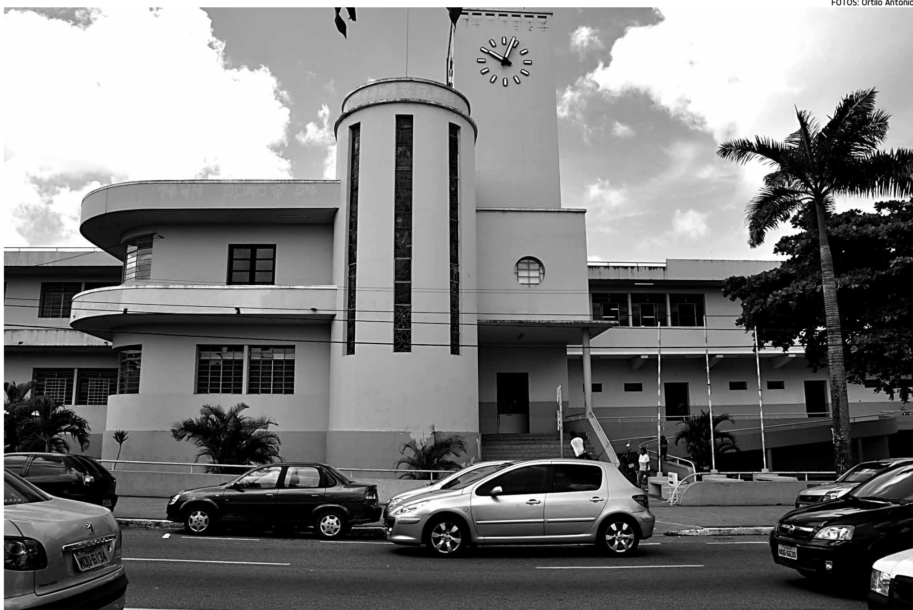
Toda a rede de hotéis e escolas públicas e privada em JP está sendo fiscalizada pela Promotoria de Justiça da Defesa do Cidadão do Ministério Público da Paraíba

No caso das edificações, algumas alterações devem ser observadas para garantir a mobilidade