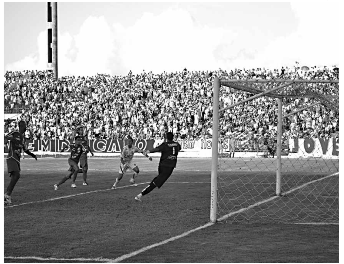
O Galo se deu mal no domingo passado e quer se reabilitar diante do Salgueiro ainda no Amigão