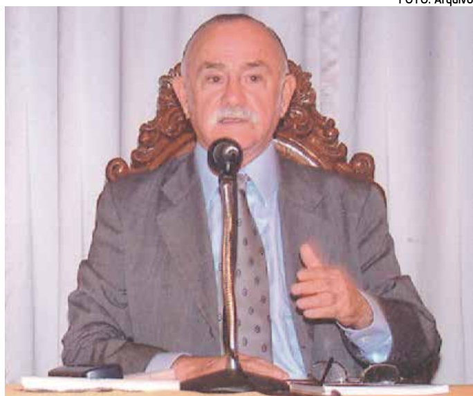
Escritor estava internado desde o último sábado