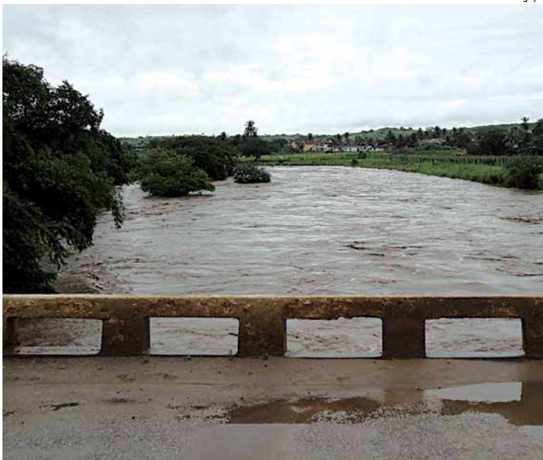
Rio Mamanguape, alvo do projeto de revitalização da Petrobras, visto de uma ponte durante uma cheia

Sete municípios já fazem parte das ações, entre eles: Esperança, Matinhas, Lagoa Seca, São Sebastião de Lagoa de Roça, Alagoa Nova, Areial e Montadas. Outras ações também ganharam destaque como a criação dos conselhos municipais de meio ambiente, negociações e execuções dos projetos de Agenda 21