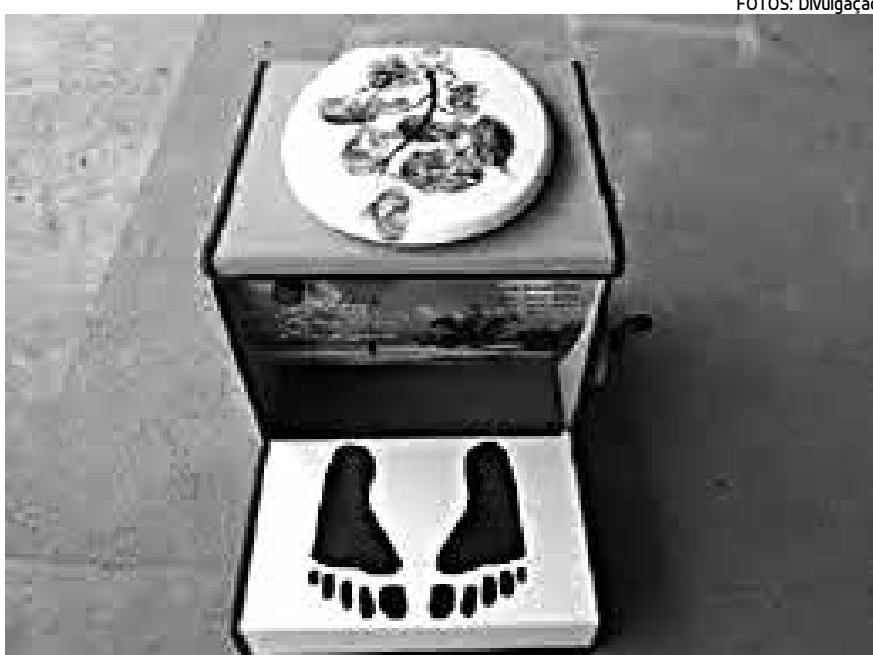
Equipamento transforma os dejetos em pó pela ação da cal que mata os germes

As conclusões foram apresentadas em um evento do BID na Conferência das Nações Unidas sobre Desenvolvimento Sustentável, Rio+20, na capital fluminense.