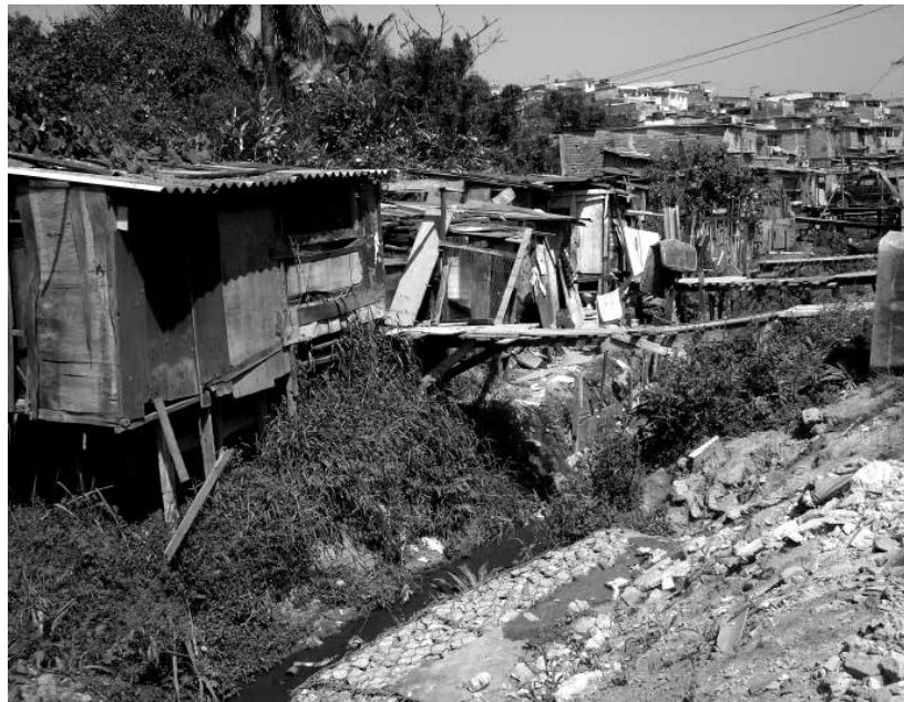
Coleta de esgotos é ausente em quase metade de 100 maiores cidades

Na média, os 100 municípios destinaram 28% de sua receita em obras de saneamento a maioria num total de 60 não chegou a utilizar 20% dos recursos na ampliação dos serviços. E entre as oito cidades que aplicaram mais de 80% da verba os destaques são: Ribeirão das Neves (MG), Recife (PE), Teresina (PI), Praia Grande (SP) e Vitória (ES).