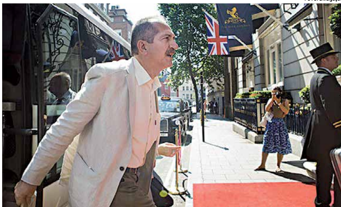
Aldo Rebelo, em Londres, está confiante no bom desempenho dos atletas brasileiros nos Jogos

Naquela ocasião, o país levou 188 atletas, que participaram de 17 modalidades, apenas três atletas mais do que nesta edição londrina,