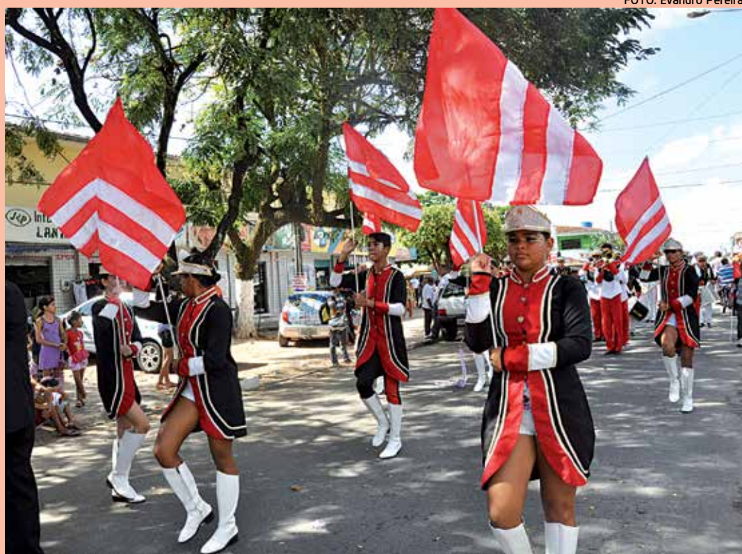
Alunos da Escola Moema Tinoco, no Funcionários II, desfilaram ontem pelas ruas do bairro

Os desfiles dos bairros têm a participação de cerca de 10 mil alunos do Ensino Fundamental I e II e dos Centros de Referência de Educação Infantil (Creis). A sequência do desfile foi definida por meio de sorteio realizado durante reunião com os diretores das escolas. "Esperamos mais uma vez superar as expectativas e