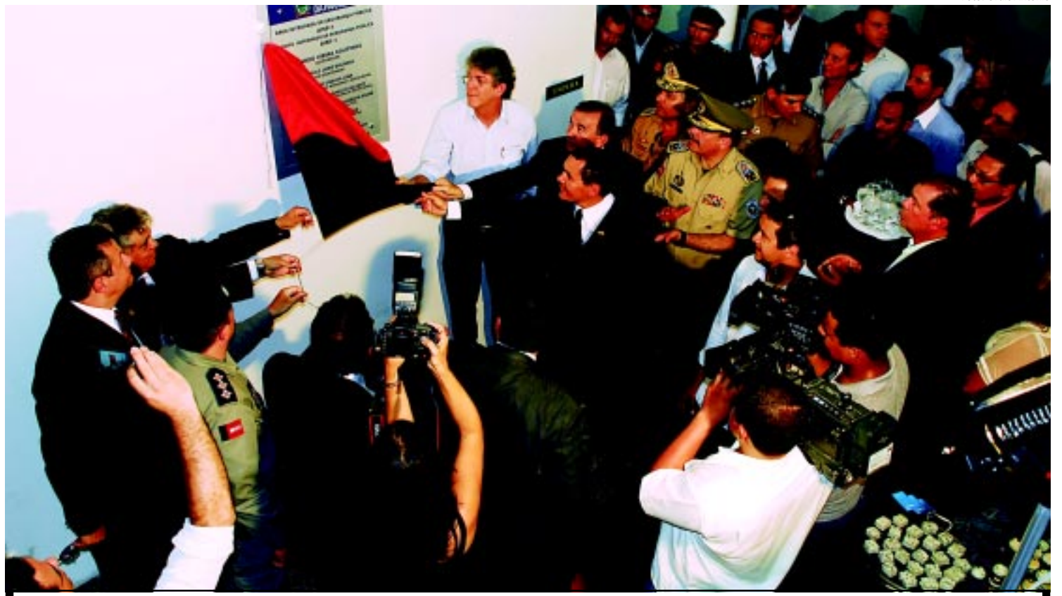
O Governo do Estado inaugura um novo modelo de gerenciamento em Segurança Pública, integrando atividades policiais para agilizar resultados

agilizar a resposta policial à demanda social. O atendimento será de 24 horas. No prédio do 1º Disp, funciona uma unidade da Polícia Civil, com uma Central de Flagrantes, e uma da Polícia Militar. PÁGINA 9