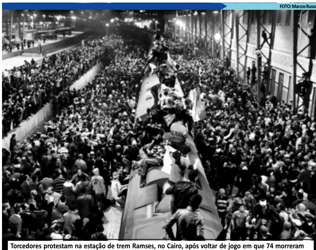
Torcedores protestam na estação de trem Ramses, no Cairo, após voltar de jogo em que 74 morreram

O premiê informou à Câmara Baixa do Parlamento e ao presidente da Federação de Futebol do Egito que destituiu os chefes dos serviços de Segurança e Inteligência de Port Said após a tragédia. A junta militar decretou luto de três dias em memória às vítimas do confronto.