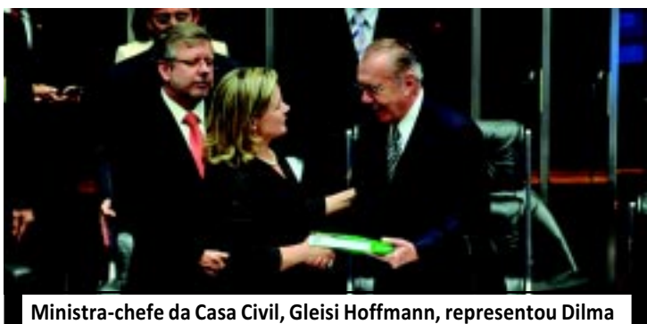
Ministra-chefe da Casa Civil, Gleisi Hoffmann, representou Dilma

Matéria do jornal Folha de São Paulo acusa o ex-presidente da Casa da Moeda de receber propina de fornecedores da instituição, por meio de duas offshores nos Estados Unidos.