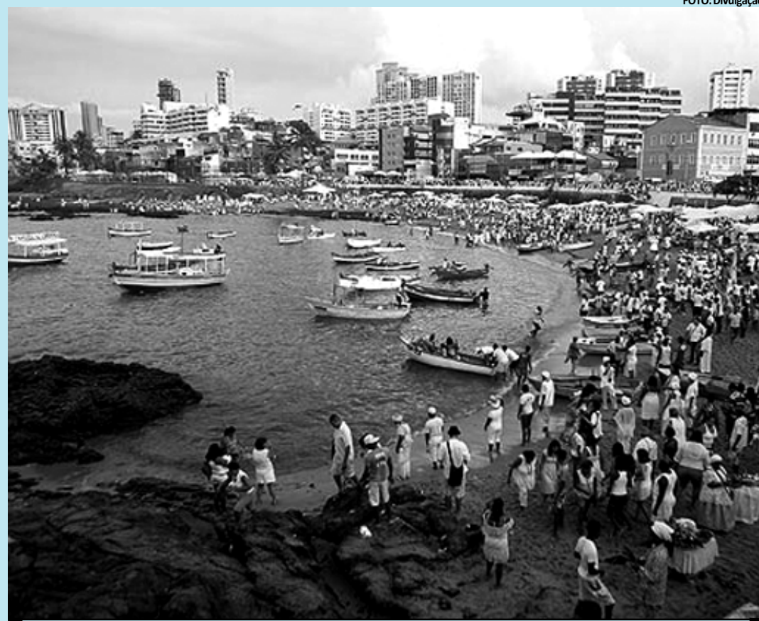
A festa religiosa acontece na Praia do Rio Vermelho, em Salvador e é uma tradição realizada desde 1923

"Estou aqui para agradecer a recuperação do meu marido, que teve um câncer de próstata. Vim dizer obri-