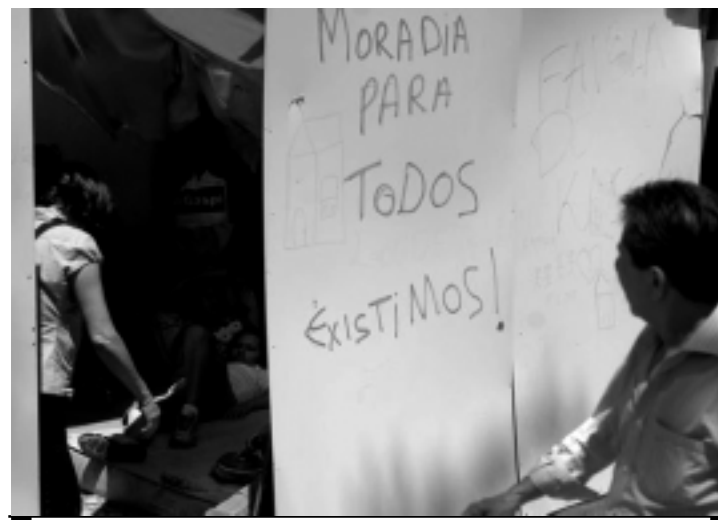
A prefeitura está desocupando 50 prédios na região do Centro da Capital

"Os integrantes da FLM não são os únicos que enfrentam problemas de moradia na cidade. Segundo o Plano Municipal de Habita-