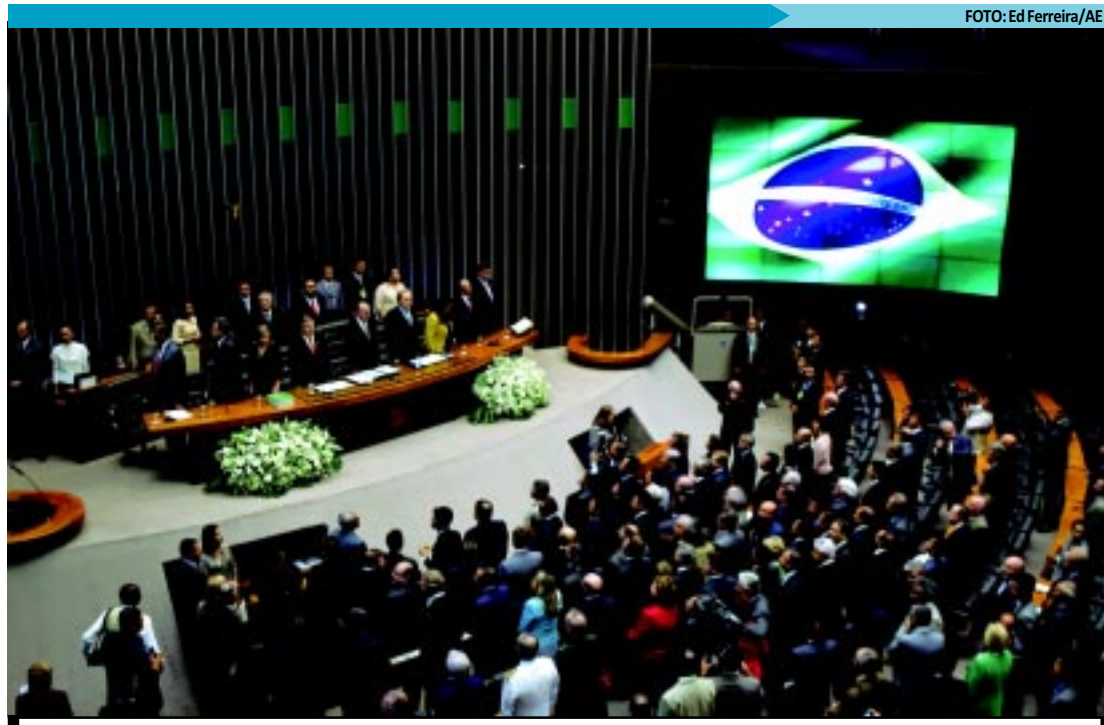
Dilma foi criticada por não ter comentado sobre a corrupção, no dia em que o oitavo ministro deixou o cargo

CORRUPÇÃO - A ministra das Relações Institucionais, Ideli Salvatti, afirmou que ações tomadas pela presidente no combate a corrupção são mais importantes do que a ausência do tema na mensagem presidencial. "É melhor fazer do que, em determinadas situações, falar. A presidente tem colocado de forma sempre clara que não é meta, é responsabilidade e compromisso com a boa aplicação do dinheiro público", disse Ideli.