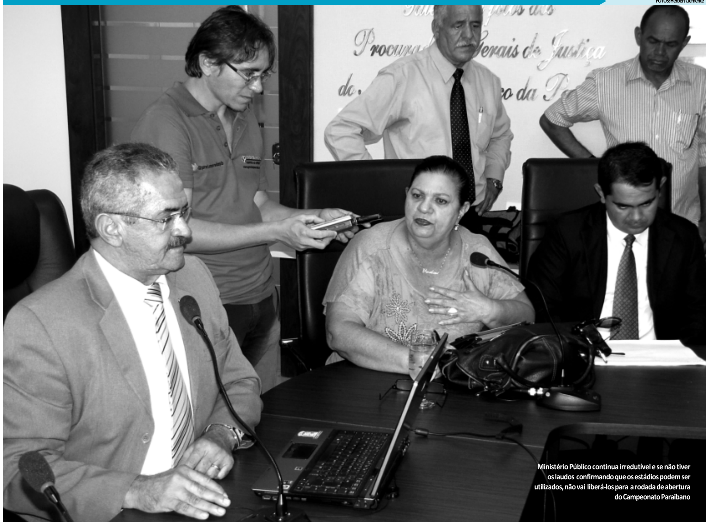
Ministério Público continua irredutível e se não tiver os laudos confirmando que os estádios podem ser utilizados, não vai liberá-los para a rodada de abertura do Campeonato Paraibano

>>> SEM EVOLUÇÃO > Apesar dos clubes terem assinado um TAC, MP aguarda resultado dos laudos para liberação