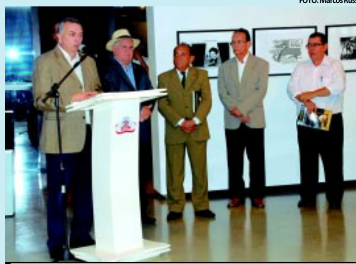
A solenidade reuniu autoridades, jornalistas e servidores do Estado

A solenidade reuniu jornalistas, representantes de órgãos públicos, políticos e a sociedade em geral, sobretudo leitores fiéis do jornal. No total, estão sendo expostos 18 registros dos fotógrafos que integram a equipe do jornal, além de 16 char-