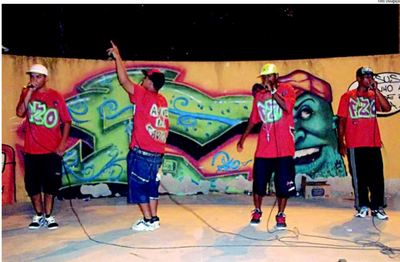
Uma das atrações de hoje do Circuito Cultural é a banda Família Z/O, que se apresenta na Praça Coriolano Coutinho, no Bairro dos Ipês, está gravando seu primeiro disco

MANAÍRA - Na Praça do Skate, em Manaíra, às 19h, terá o show de rock alternativo da banda Sob Aviso, que tem influência de bandas como Ramones, Social Distortion, The Hellcopters, Queens of the Stone Age, Raimundos e Matanza. O grupo surgiu em 2003 como um trio e atualmente é composto por um quarteto. No repertório, músicas autorais como 'Segunda visão', 'Causa perfeita', 'Inconsciência' e 'É mentira'. A banda está em fase de gravação do primeiro CD, previsto para ser lançado ainda este ano.