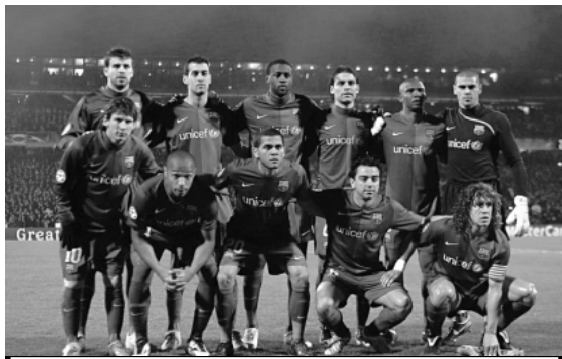
Equipe espanhola está em 1º lugar, segundo a Federação Internacional de História e Estatística do Futebol

O Barcelona começou o ano de 2012 no topo do ranking mundial de clubes elaborado pela Federação Internacional de História e Estatística do Futebol (IFFHS), enquanto o Santos foi o brasileiro mais bem colocado, na 6ª posição.