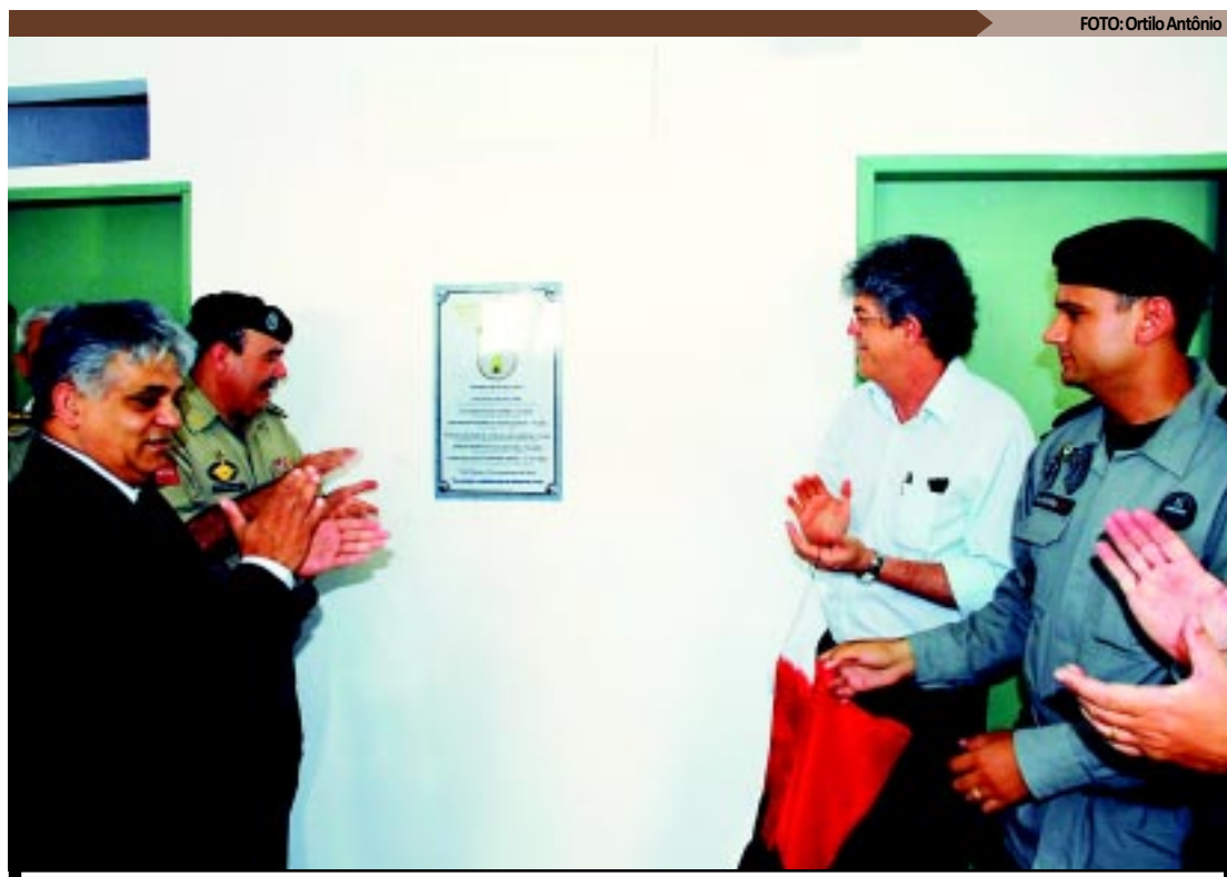
O governador Ricardo Coutinho participou da inauguração e andou pelas ruas de um dos bairros mais violentos de JP

O 1º Distrito Integrado de Segurança Pública da Paraíba (Disp) pertence a 1ª Área Integrada de Segurança Pública (Aisp), ou seja, a primeira área geográfica estabeleci-