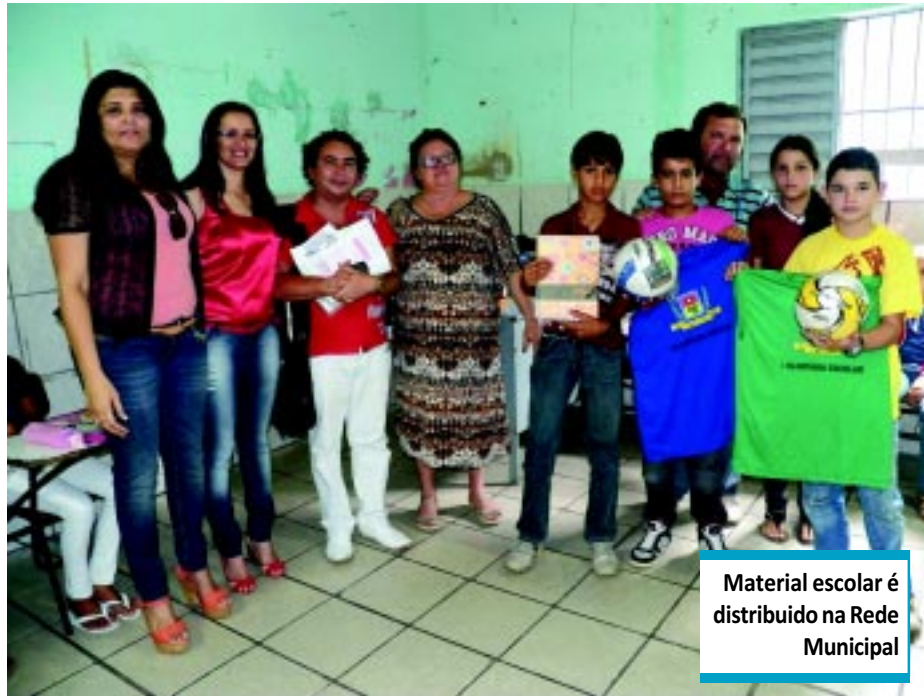
Material escolar é distribuído na Rede Municipal