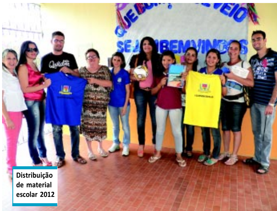
Distribuição de material escolar 2012