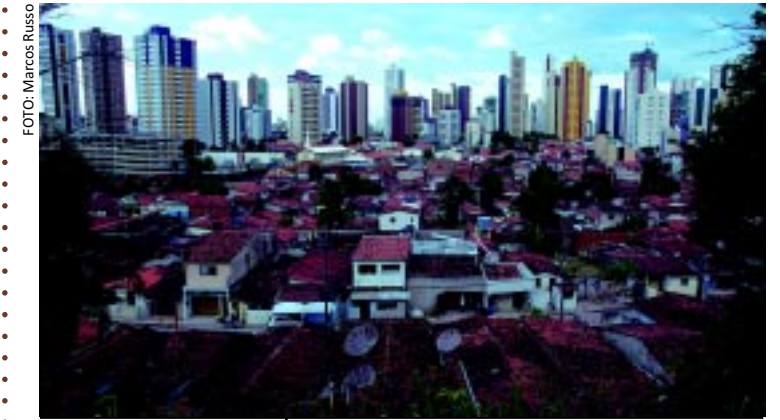
[FOTO&LEGENDA] O bairro São José, entre a falésia e os espigões do bairro de Manaíra, breve será totalmente reurbanizado, o que trará melhorias para toda a comunidade. Novas casas, praças, creches e escolas vão ser construídas no local.