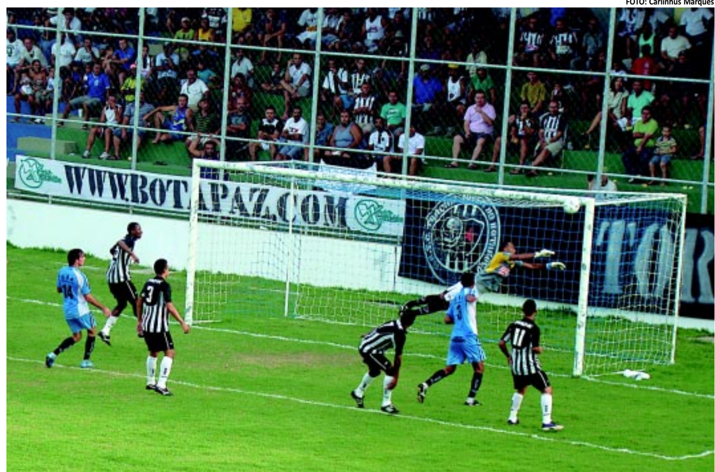
Ano passado, o CSP se impôs jogando no Estádio da Graça quando venceu o Botafogo. Este ano, no mesmo local perdeu para o Bota e o Treze