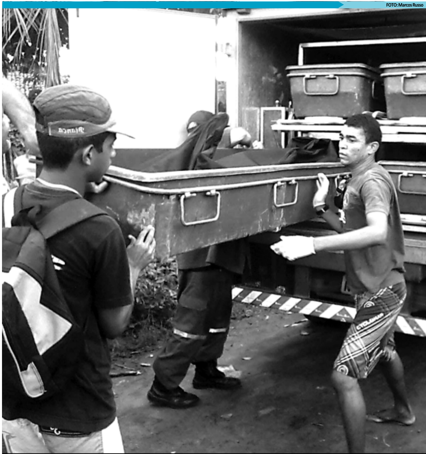
O corpo da adolescente tinha mutilações. O rosto estava inteiramente desfigurado e até os cabelos foram cortados, o que dificultou a identificação