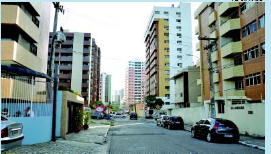
Capital possui bairros onde é difícil encontrar árvores e só se vê uma 'selva de concreto'