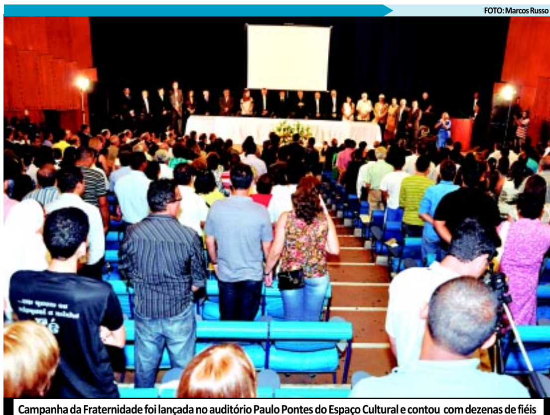
Campanha da Fraternidade foi lançada no auditório Paulo Pontes do Espaço Cultural e contou com dezenas de fiéis

Hoje, às 8h, a programação envolvendo os representantes das quatro arquidioceses em João Pessoa segue com um café da manhã no Hospital Padre Zé, no bairro do Tambiá. Na ocasião, acontecerá a assinatura do Protocolo de Intenção para a construção da UTI do hospital. Em seguida, a partir das 10h, será celebrada uma missa na Catedral Basílica de Nossa Senhora das Neves, no Centro.