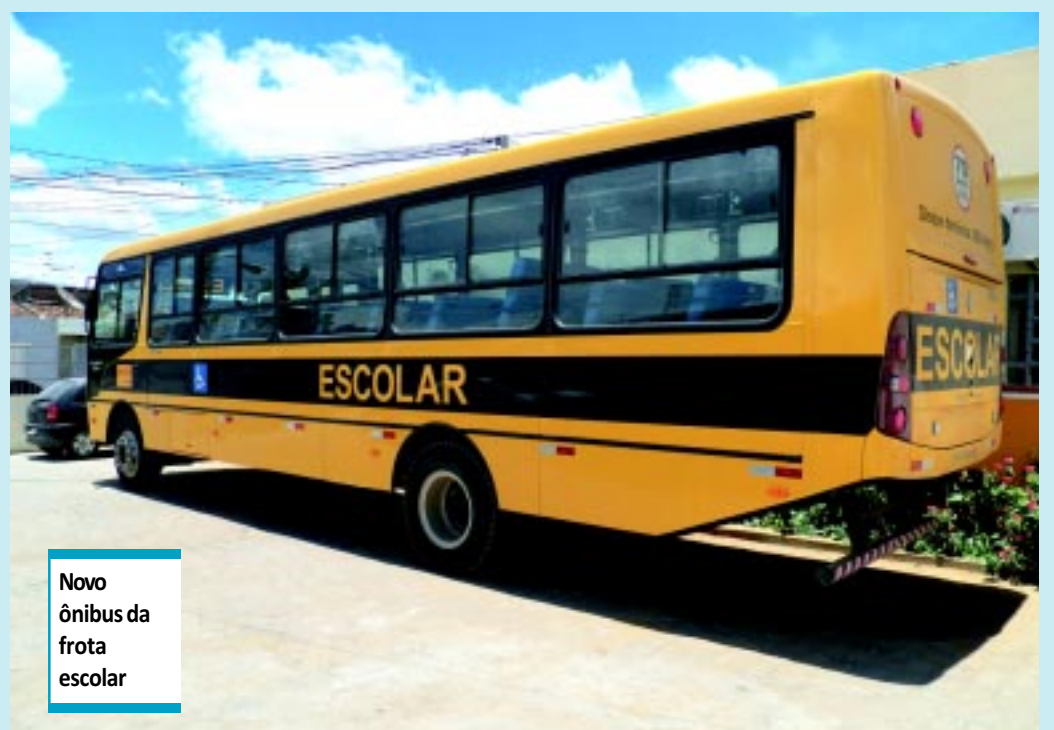
Novo ônibus da frota escolar

"O sindicato é uma ferramenta de defesa do trabalhador rural, já temos 37 pessoas cadastradas, mais o nosso papel é legalizar cada agricultor, para que em breve eles recebam sua moradia", citou.