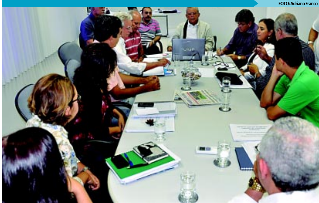
Prefeito da Capital se reuniu com secretários municipais e representantes do governo para acertar detalhes da obra

A vinda dos representantes de Guiné-Bissau deverá acontecer possivelmente no mês de junho. A comitiva será composta por técnicos do Município no reconhecimento de ações nas áreas de saneamento básico, habitação social, educação, saúde, formação profissional, tratamento do lixo e empreendedorismo.