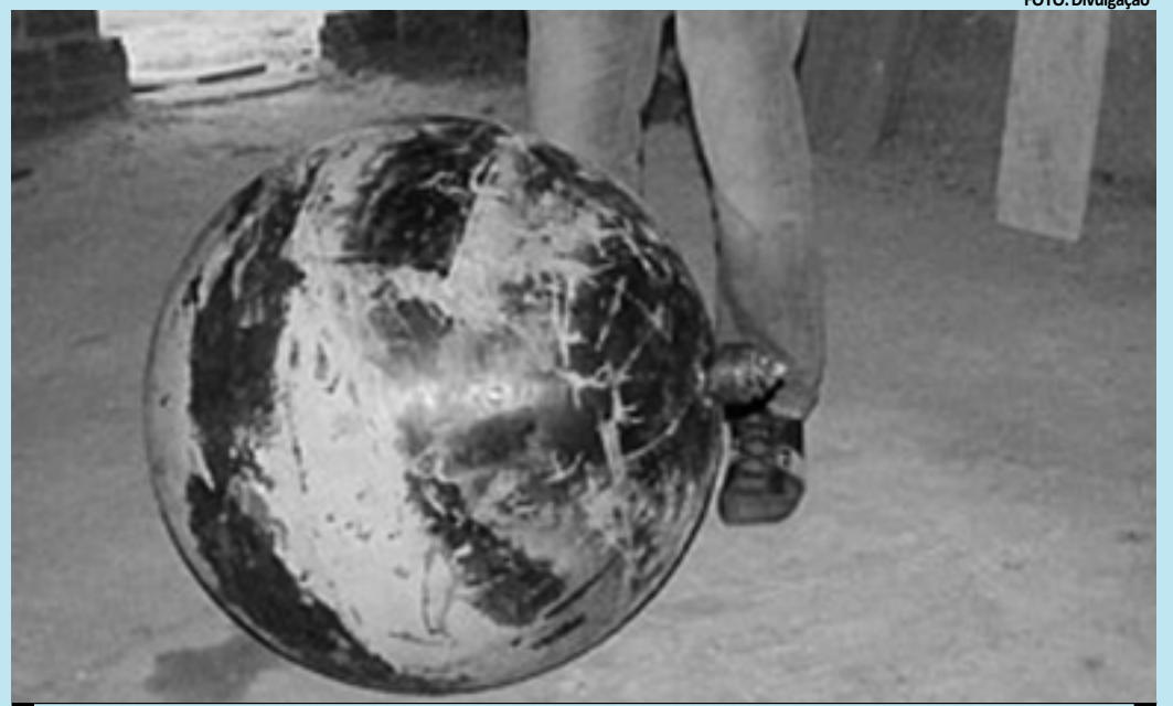
A esfera foi retirada por policiais militares e levada para quartel da PM, na cidade de Chapadinha