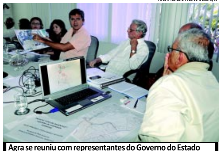
Agra se reuniu com representantes do Governo do Estado

nadas a alunos que não foram aprovados na 1ª opção. Estão sendo disponibilizadas 261 vagas, sendo 124 para o primeiro semestre e 137 para o segundo. PÁGINA 10