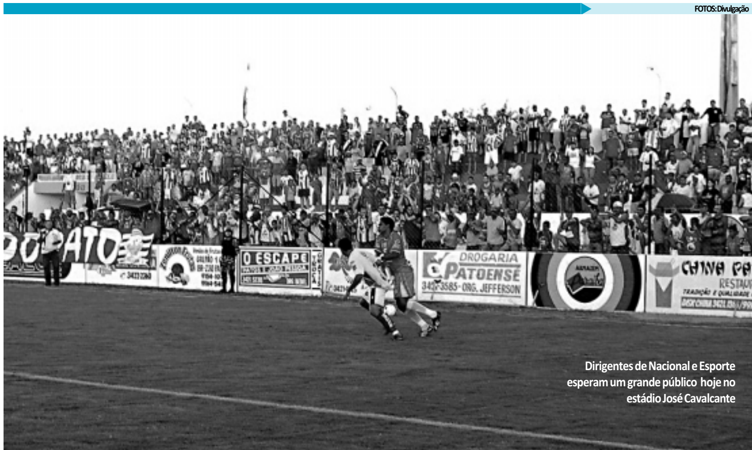
Dirigentes de Nacional e Esporte esperam um grande público hoje no estádio José Cavalcante

Como se não bastasse o momento pior do Nacional em relação ao Esporte, o Canário