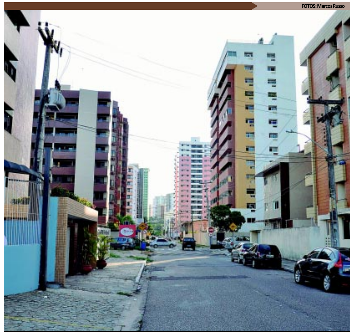
Na rua Geraldo Costa, em Manaíra, praticamente não existe arborização. A única sombra é dos prédios