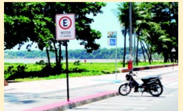
Cidade tem hoje mais de 68 mil motos e motonetas circulando

A medida atende à necessidade de vagas para este tipo de veículo, tendo em vista o