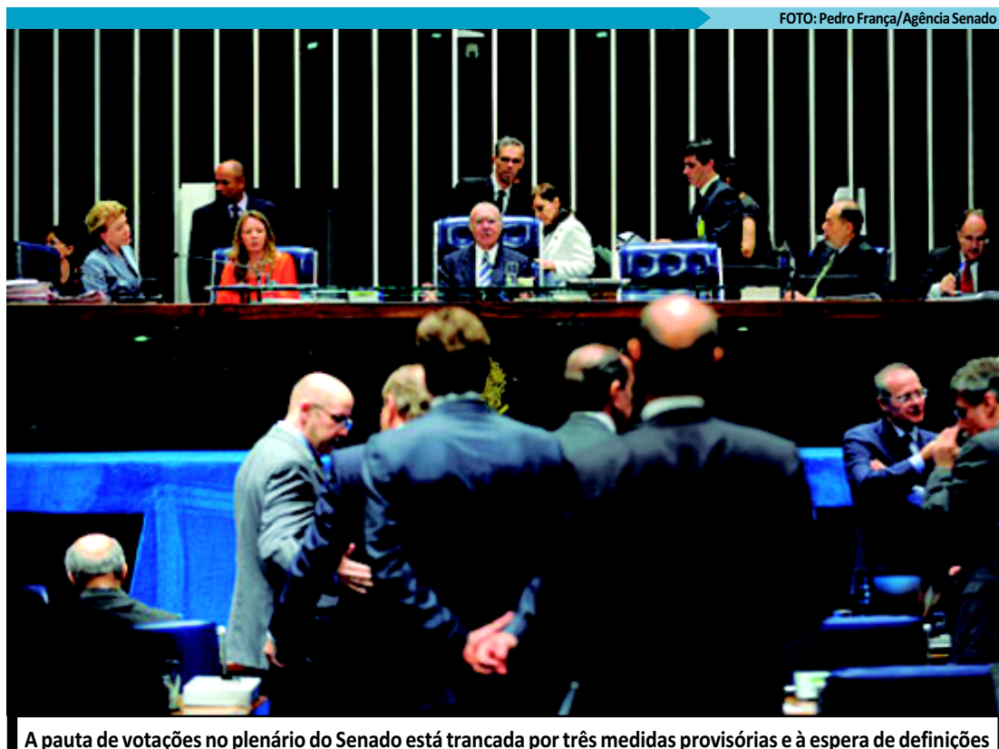
A pauta de votações no plenário do Senado está travada por três medidas provisórias e à espera de definições