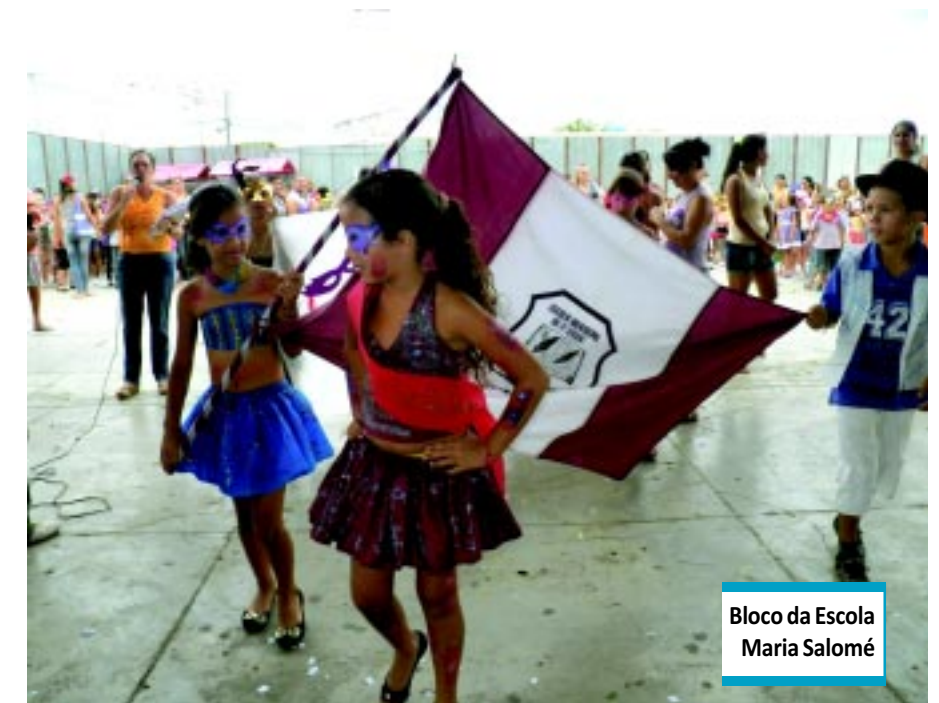
Bloco da Escola Maria Salomé

tícias boas, por exemplo, iremos apresentar palestras para os alunos e realizar atendimento em saúde bucal dentro do Programa Saúde na Escola", informou.