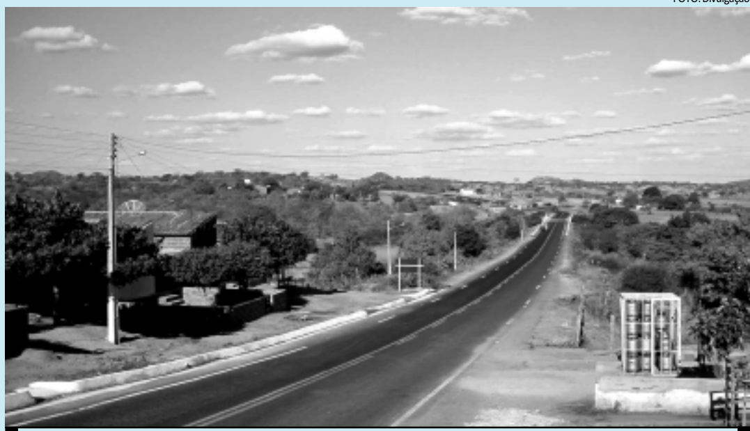
Mais 35 quilômetros de estrada serão integrados aos 5.030 quilômetros da malha rodoviária estadual