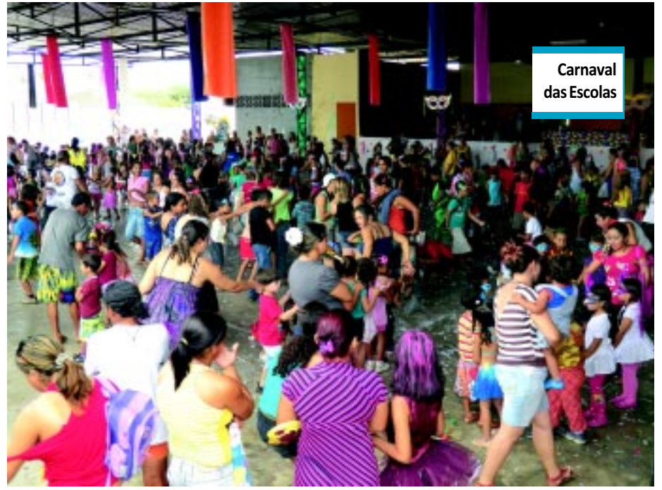
Carnaval das Escolas