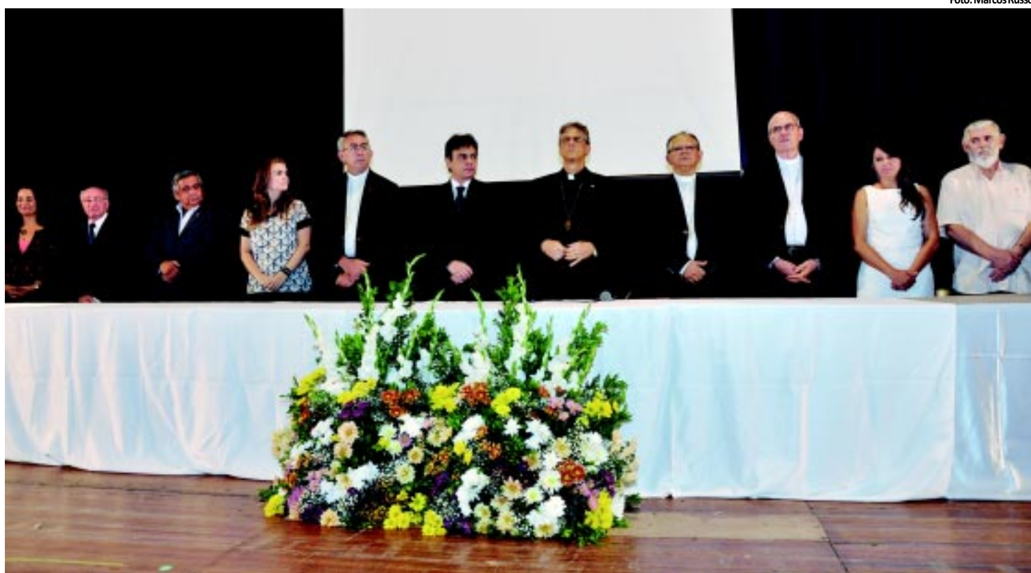
IGREJA | Arquidiocese abre Campanha da Fraternidade que aborda tema Saúde Pública PÁGINA 8

2012. A obra é uma parceria entre a Prefeitura da Capital e o Governo do Estado e prevê investimentos de R$ 9,1 milhões. PÁGINA 4