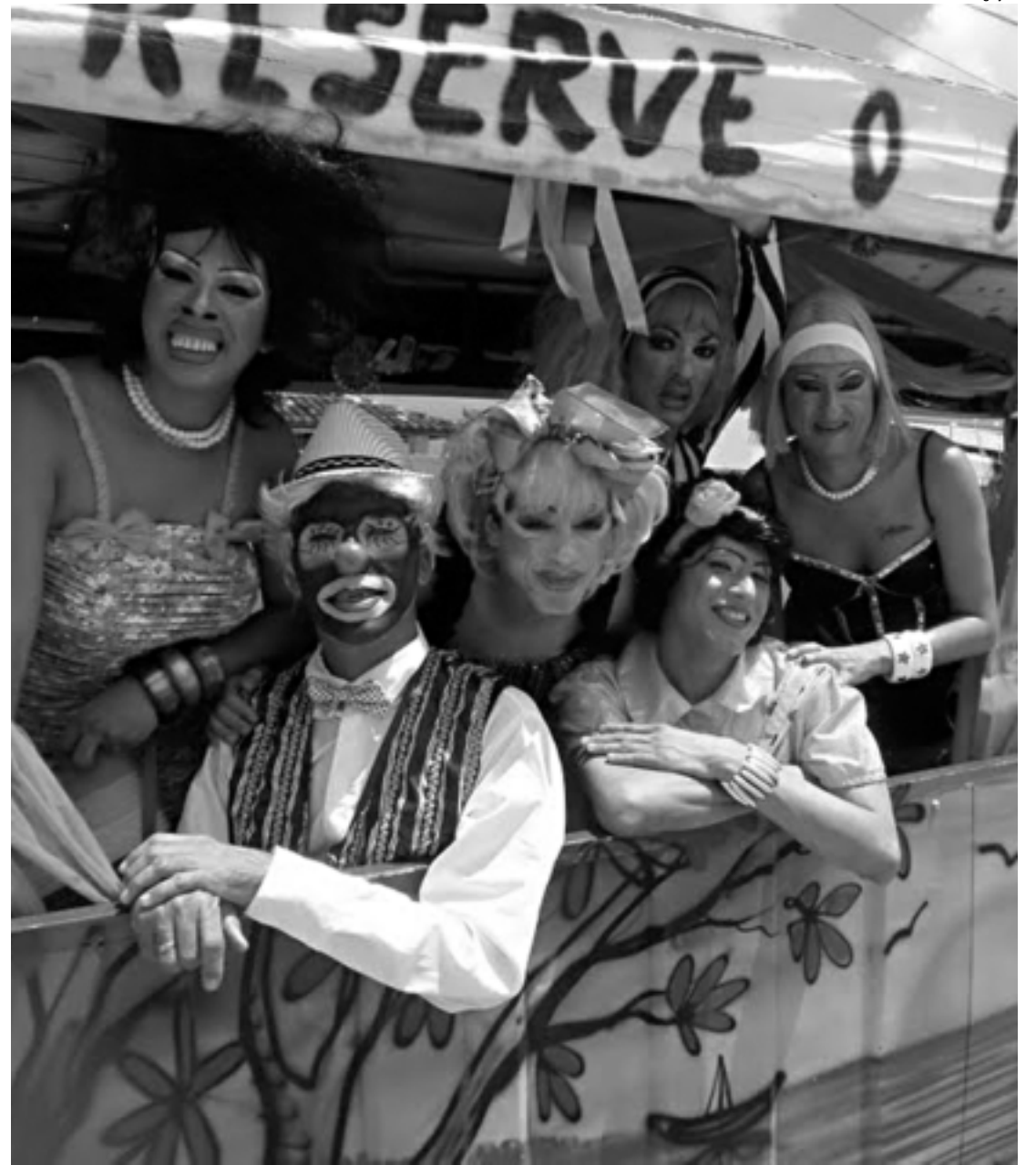
A Cia. Paraibana de Comédia vai gravar, hoje e amanhã, cenas para o 12º DVD do espetáculo Pastoril Profano

O espetáculo - que cumpriu temporada no mês passado, no Teatro Paulo Pontes do