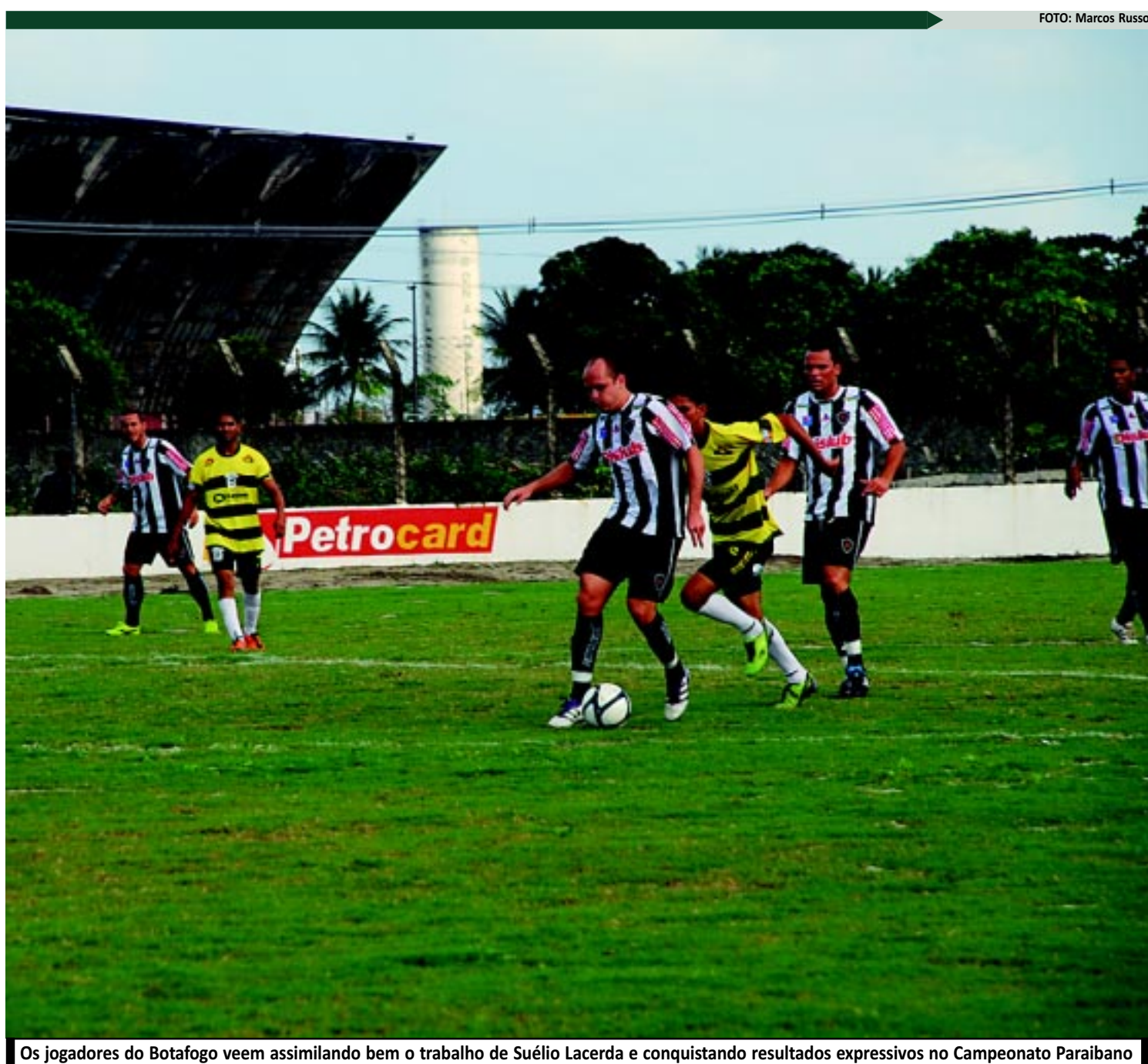
Os jogadores do Botafogo veem assimilando bem o trabalho de Suélio Lacerda e conquistando resultados expressivos no Campeonato Paraibano

O adversário ocupa a segunda posição na tabela com 10 pontos. O Galo venceu o Flamengo, no Almeidão, por 3 a 1 e pode assumir a liderança se vencer o Campinense, num dos jogos mais esperados do primeiro turno. Completam o G4 o Sousa, que empatou em 2 a 2 com o Esporte; e o Botafogo que goleou o CSP o pior 3 a 0. O time da Capital tem um jogo a menos em relação a dupla de Campina Grande.