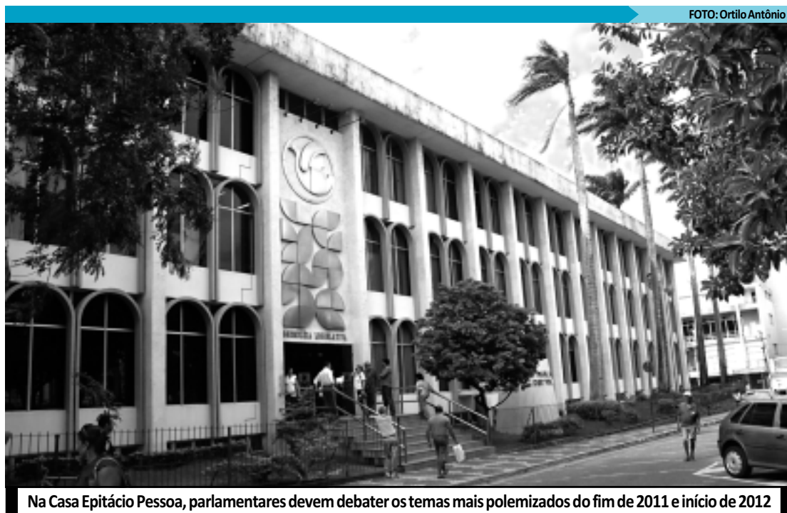
Na Casa Epitácio Pessoa, parlamentares devem debater os temas mais polemizados do fim de 2011 e início de 2012

O governador Eduardo Campos (PSB/PE) rebateu duramente que as informações de que o Estado estaria sendo beneficiado. "Nunca houve nenhuma priorização para Pernambuco por parte do ministro. Em 2010, quando o Ministério da Integração era comandado pelos ministros ligados ao PMDB da Bahia, Pernambuco recebeu R$ 275 milhões da pasta. Isso representa 22,5% do total de repasses feitos pela União ao Estado. Em 2011, recebemos R$ 62,6 milhões. Isso dá 7,8% de tudo o que foi repassado voluntariamente pela União para PE. Ou seja, recebemos com Fernando à frente da pasta", sentenciou.