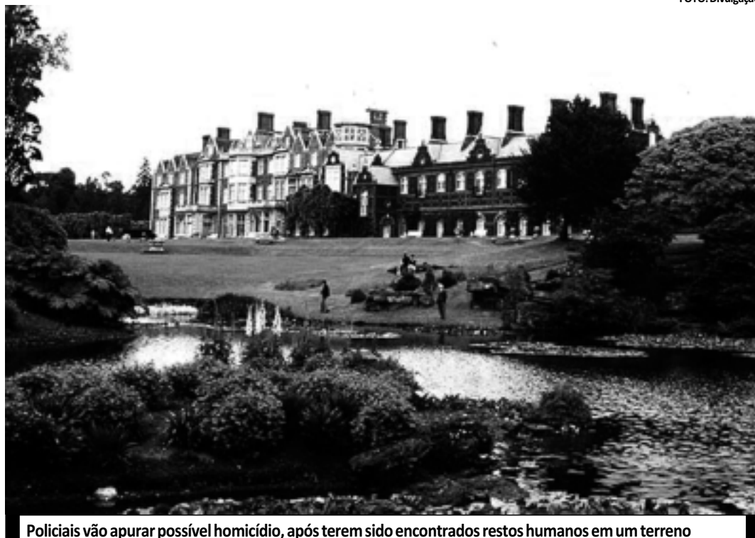
Policiais vão apurar possível homicídio, após terem sido encontrados restos humanos em um terreno

Parte da área do terreno foi fechada para as investigações policiais e análises forenses.