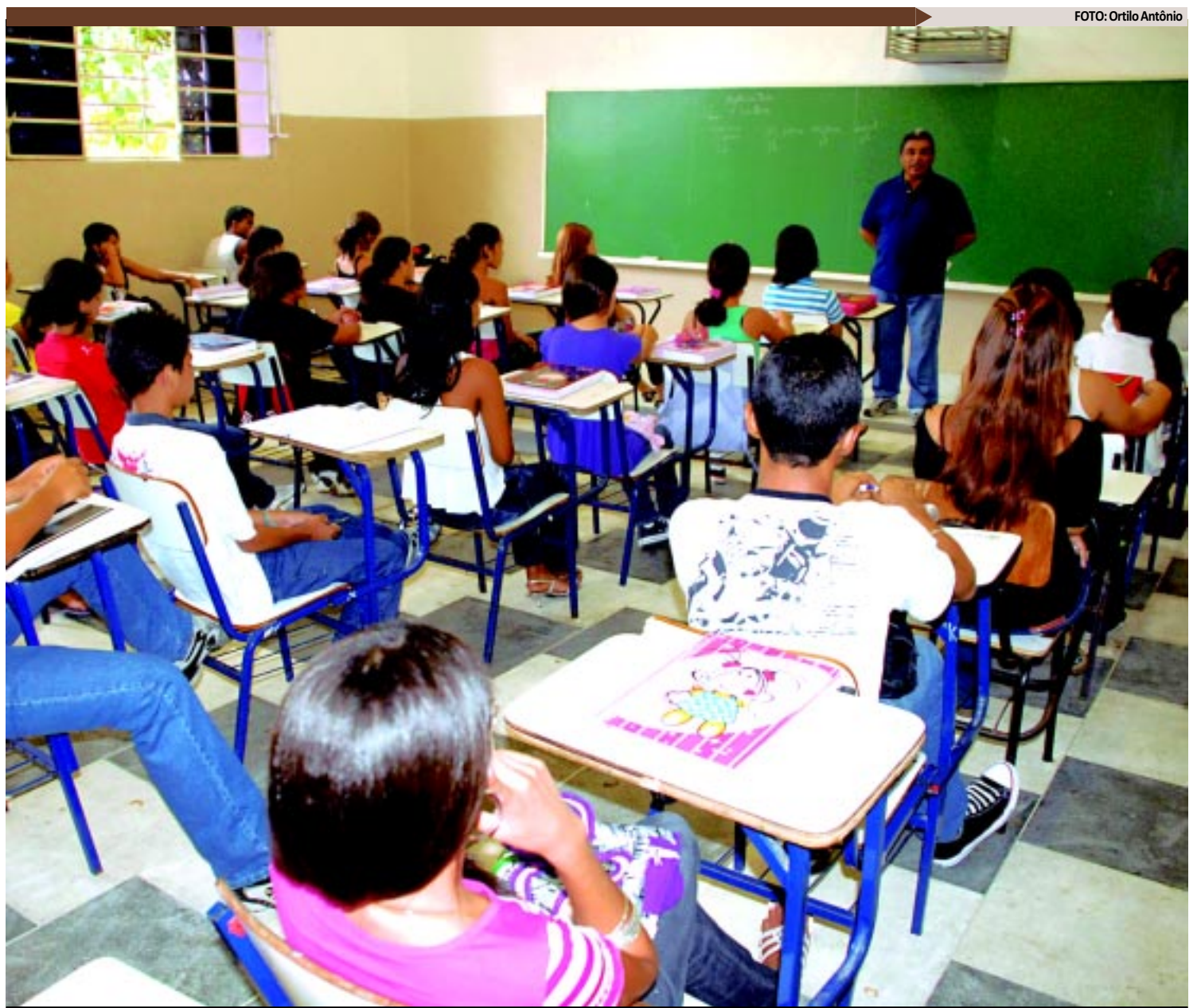
Os recursos para a PB serão destinados à continuidade dos 33 projetos na Educação do Estado, que incluem reformas de escolas e formação continuada

Segundo o secretário de Estado da Educação, Afonso Scocuglia, com os recursos do Fundeb, o Governo da Paraíba dará continuidade aos 33 projetos na área da Educação, iniciados em 2011. "Nisso entram ações de reforma de escolas, educação de jovens e