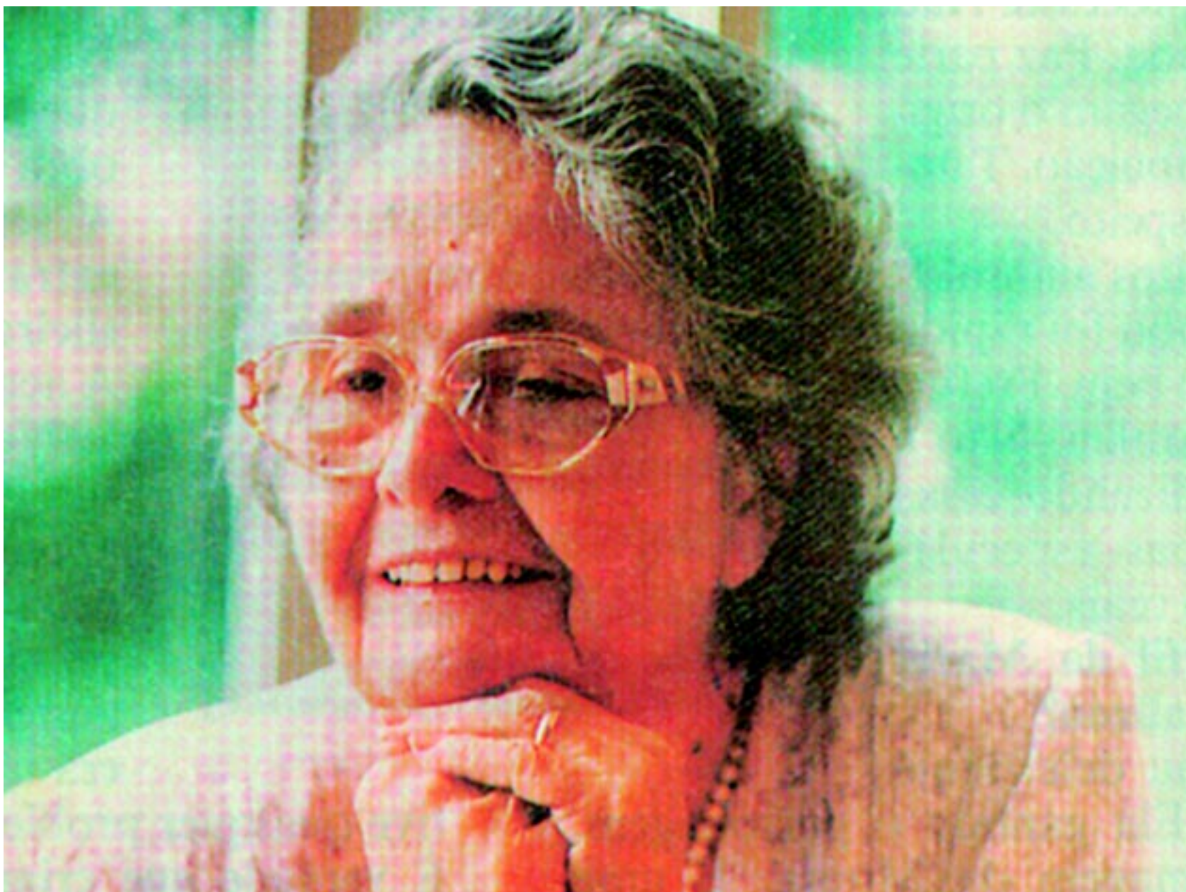
A cearense Rachel de Queiroz, autora do romance regionalista O Quinze , também enveredou pela ficção científica com o conto 'Ma-Hôre'