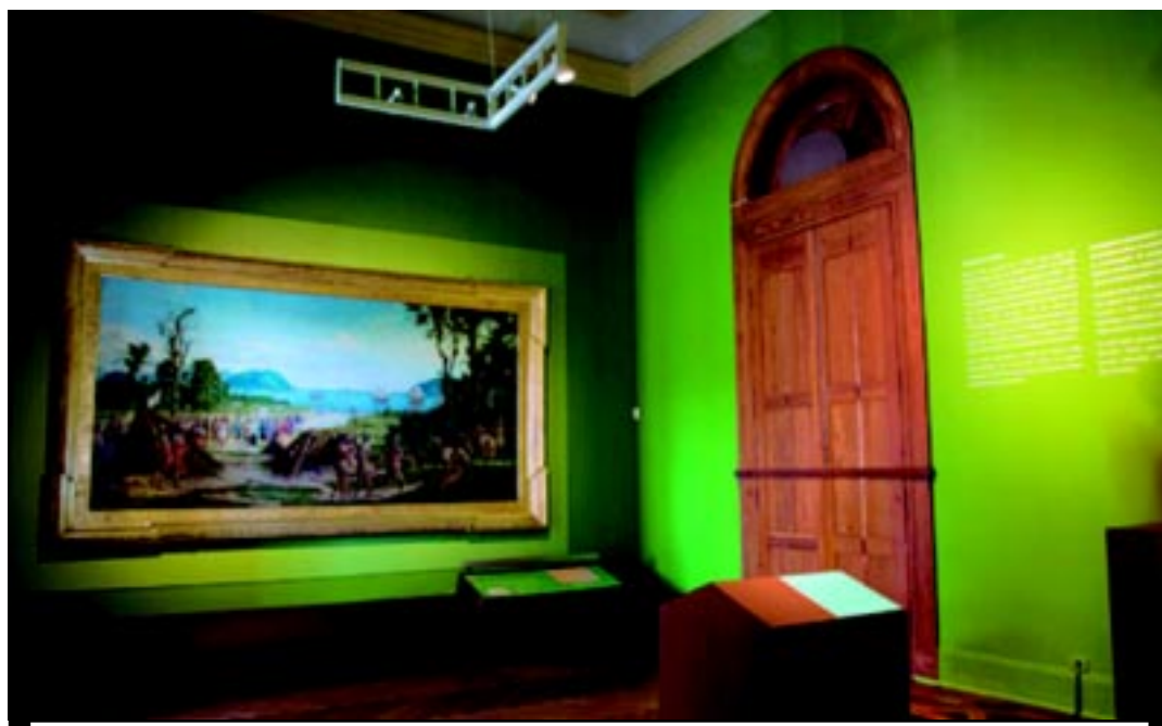
O sensor mostrou que o Museu do Ipiranga tem condições menos favoráveis para a conservação das obras de arte

Cristais de quartzo captam as transformações do material no ambiente, como variações de frequência, que são registra-