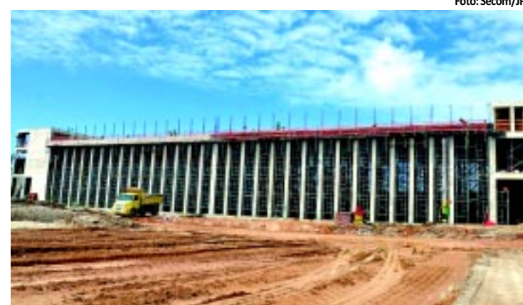
São 130 obras em execução em diversos pontos

Já começou o corre-corre dos pais em busca do material escolar. As livrarias já estão com seus estoques garantidos para atender a demanda e o bom senso recomenda que o consumidor realize uma cuidadosa pesquisa de preço, avaliando sempre a relação entre o preço e a qualidade dos produtos. Para quem quer economizar na compra de livros, ótimas opções são as feiras e os sebos. A economia pode chegar a 50%. PÁGINA 12