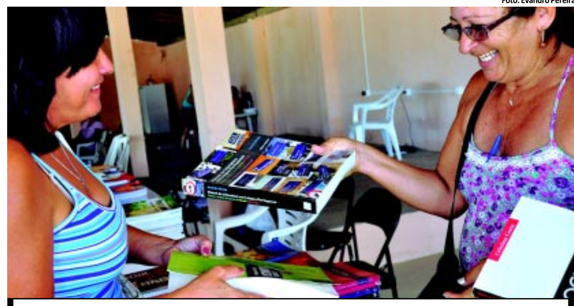
Pais devem pesquisar, mas as feiras de livros usados e sebos são opções para quem quer economizar

Já começou o corre-corre dos pais em busca do material escolar. As livrarias já estão com seus estoques garantidos para atender a demanda e o bom senso recomenda que o consumidor realize uma cuidadosa pesquisa de preço, avaliando sempre a relação entre o preço e a qualidade dos produtos. Para quem quer economizar na compra de livros, ótimas opções são as feiras e os sebos. A economia pode chegar a 50%. PÁGINA 12