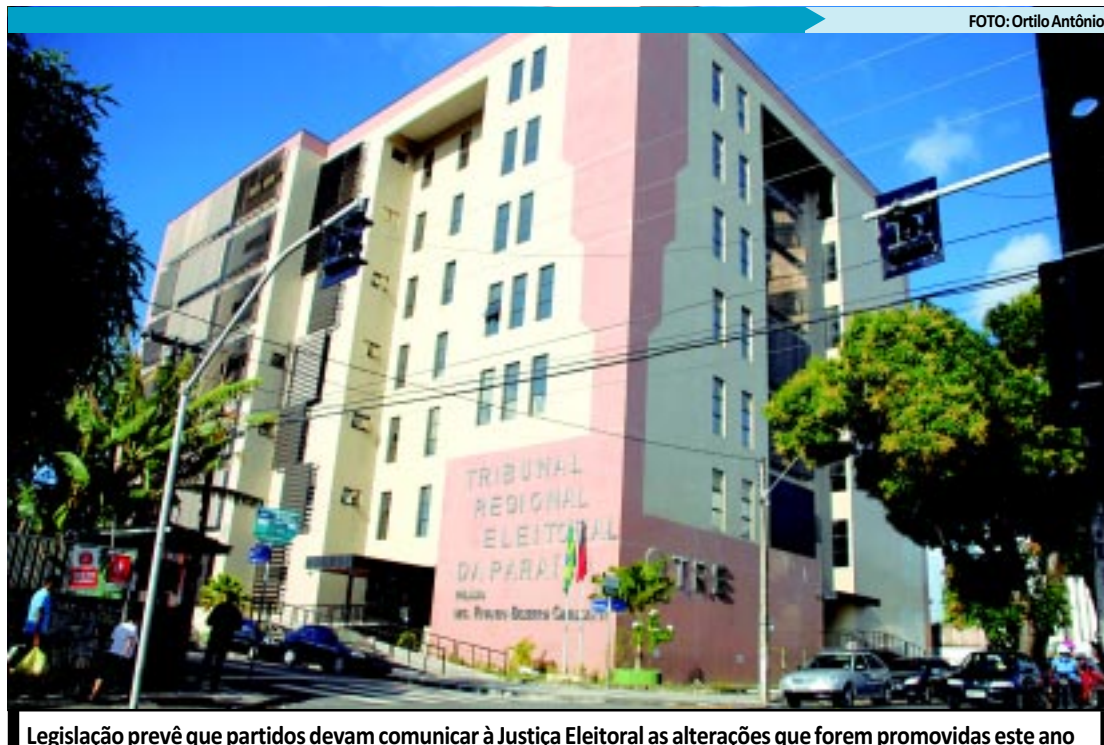
Legislação prevê que partidos devam comunicar à Justiça Eleitoral as alterações que forem promovidas este ano

Os eleitores têm até o dia 9 de maio, cinco meses antes das eleições municipais 2012, para requerer inscrição eleitoral, realizar transferência de domicílio e pedir alteração do endereço no título eleitoral. O prazo é o mesmo para os eleitores que possuem alguma deficiência ou mobilidade reduzida solicitarem transferência para uma Seção Eleitoral Especial.