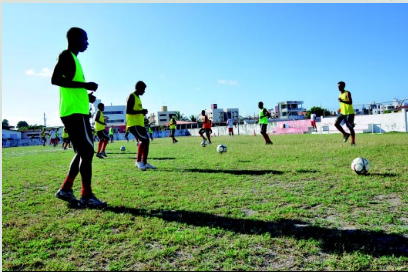
Atletas do Clube do Povo continuam treinando diariamente no Mangabeirão, visando a estreia da equipe no Campeonato Estadual