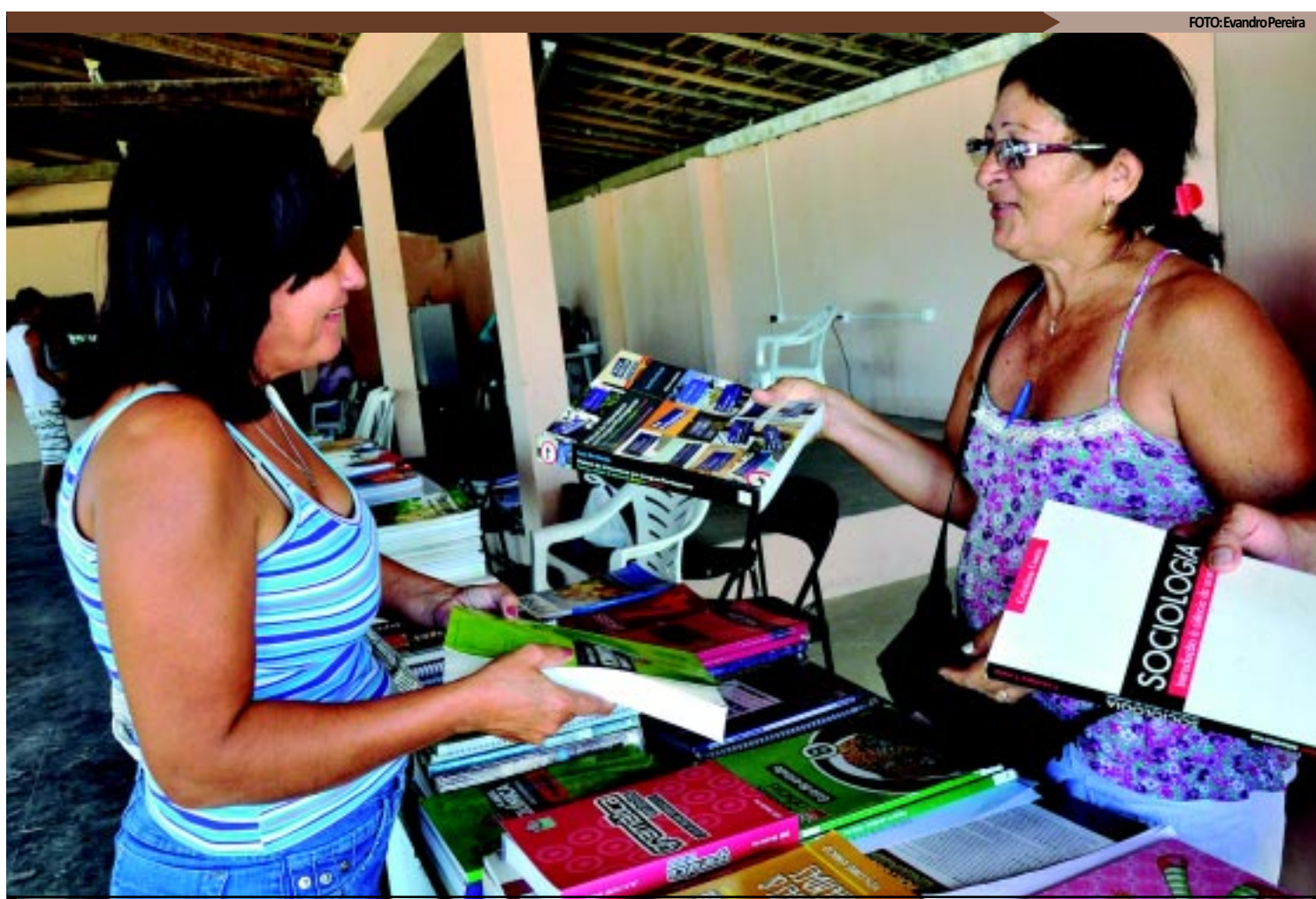
Feira de Livros Usados oferece promoção, compra, troca e aceita doação de voluntários e funcionará até 17 de março de 2ª feira a sábado, na Capital

Para quem prefere tudo novo, a melhor opção é pesquisar os preços nas livrarias e papelerias. A gerente da