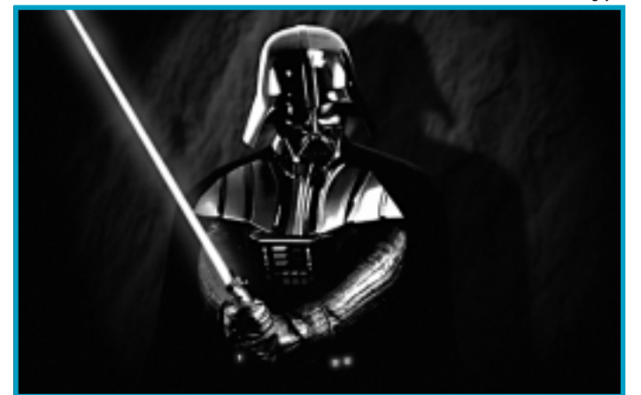
Morre o espadachim que interpretou Darth Vader