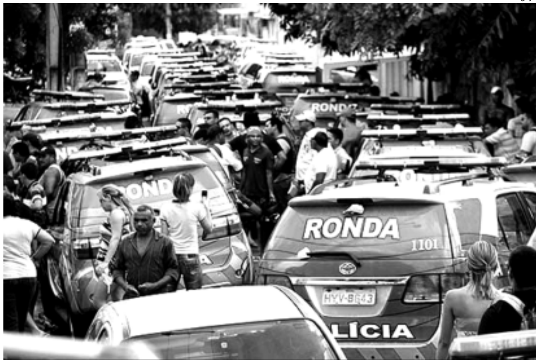
Clima de tensão: os grevistas furaram os pneus das viaturas e o comércio de Fortaleza fechou ontem

As inscrições para o Sisu começam no sábado (7). A ferramenta foi criada pelo Ministério da Educação (MEC) em 2009 para unificar o processo de seleção de universidades públicas e permite ao estudante disputar vagas em diferentes instituições a partir da nota obtida no Enem. Para o primeiro semestre de 2012, serão disponibilizadas 108.552 vagas em 95 instituições.