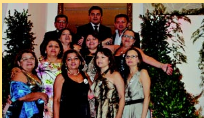
Os irmãos Lacerda