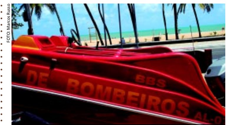
[FOTO&LEGENDA] Equipes do Corpo de Bombeiros continuam atentas à movimentação de banhistas na orla da Capital. A maré ainda alta, porém, também precisa de cuidados por parte de banhistas, especialmente pais de crianças e pessoas idosas.