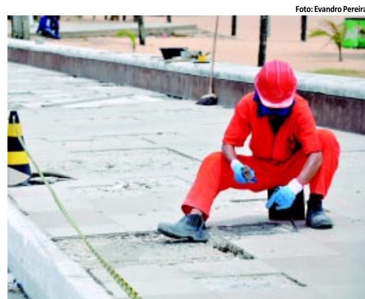
Recuperação da calçada da orla

Paraíba foi o sétimo Estado brasileiro em volume de verbas do "Prevenção e Preparação a Desastres" da Integração Nacional. PÁGINA 3