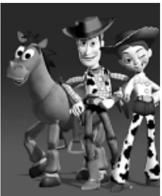
A Globo exibe hoje Toy Story 2