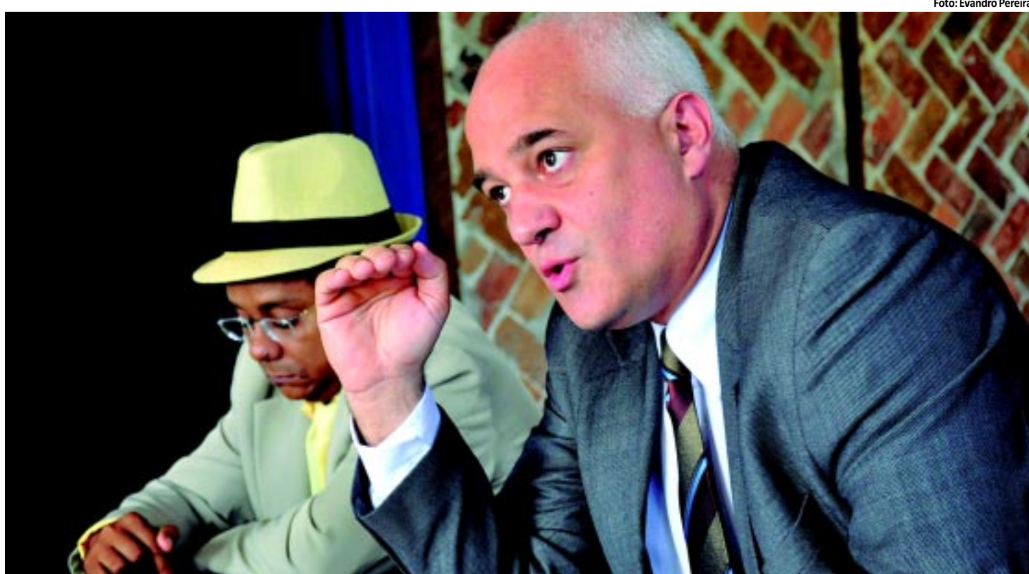
CULTURA | Alex Klein é anunciado novo regente da Orquestra Sinfônica da Paraíba PÁGINA 17

receberão R$ 834 mil para a compra de equipamentos que vão diagnosticar casos de excesso de peso. No país foram contemplados com os recursos 1.809 municípios. PÁGINA 10