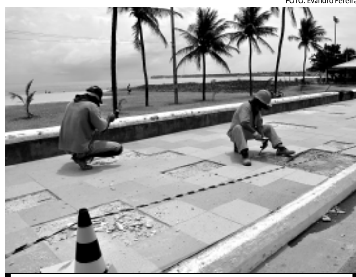
Operários executam obra de recuperação de calçadão na orla da Capital