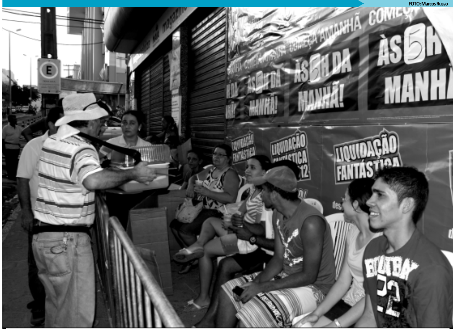
No final da tarde de ontem, muita gente aguardava a abertura da loja, no dia seguinte. Oportunidade para ambulantes que garantiram o lanche dos clientes

A maior parte das ofertas é de produtos negociados diretamente com os fabricantes para atender exclusivamente aos clientes da liquida-