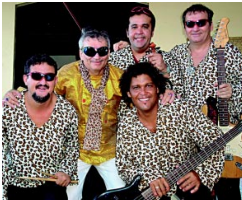
A banda Omelete promete boas risadas e música à Feirinha de Tambaú