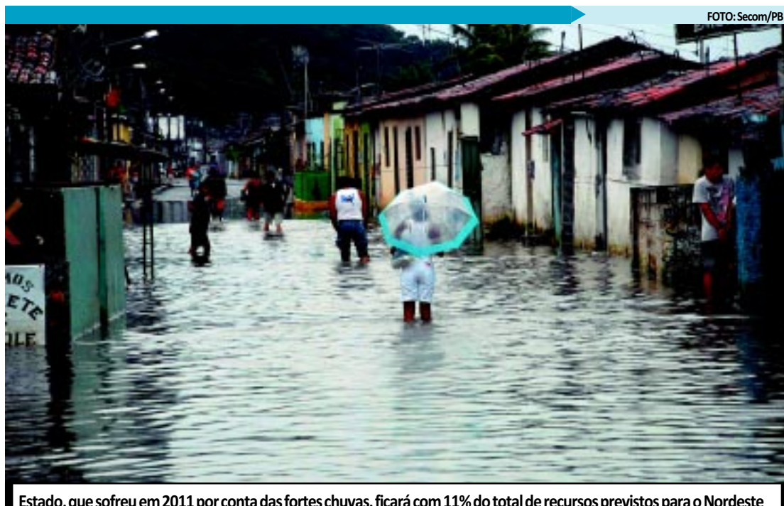
Estado, que sofreu em 2011 por conta das fortes chuvas, ficará com 11% do total de recursos previstos para o Nordeste

Além das duas pastas, o Ministério da Ciência, Tecnologia e Inovação deverá realizar repasses que somam R$ 100,3 milhões, o Ministério de Minas e Energia disponibilizará R$ 8,7 milhões e o Ministério do Meio Ambiente vai direcionar para os estados R$ 200 mil, com o intuito de promover a prevenção de desastres. Os repasses serão realizados, principalmente, para os municípios mais suscetíveis a inundações, enxurradas, deslizamentos e seca.