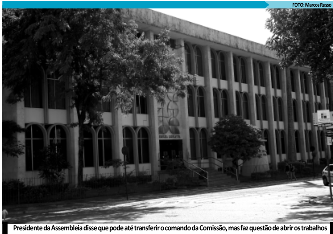
Presidente da Assembleia disse que pode até transferir o comando da Comissão, mas faz questão de abrir os trabalhos