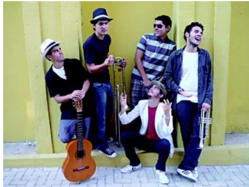
Mafiota une música e intervenções teatrais na Praça da Amizade no bairro do Rangel

de death metal melódico formada em 2006 na Capital paraibana. O grupo se apresenta na Praça do Skate, a partir das 19h. O estilo consiste na fusão de death metal melódico, thrash metal e heavy metal tradicional, influenciado por bandas como In Flames, At The Gates, Dark Tranquillity, Iron Maiden, Metallica e Blind Guardian. A temática lírica geral-