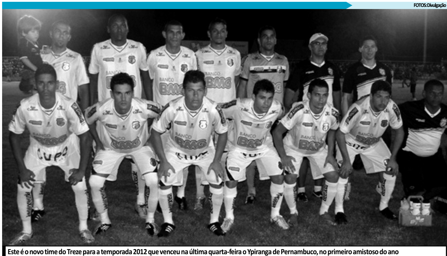
Este é o novo time do Treze para a temporada 2012 que venceu na última quarta-feira o Ypiranga de Pernambuco, no primeiro amistoso do ano

A vitória por 3 a 1 diante do Ypiranga-PE, na última quarta-feira, em Campina Grande, no primeiro teste para a temporada 2012, deixou o técnico do Treze, Marcelo Vilar, um tanto surpreso e feliz com o desempenho da equipe.