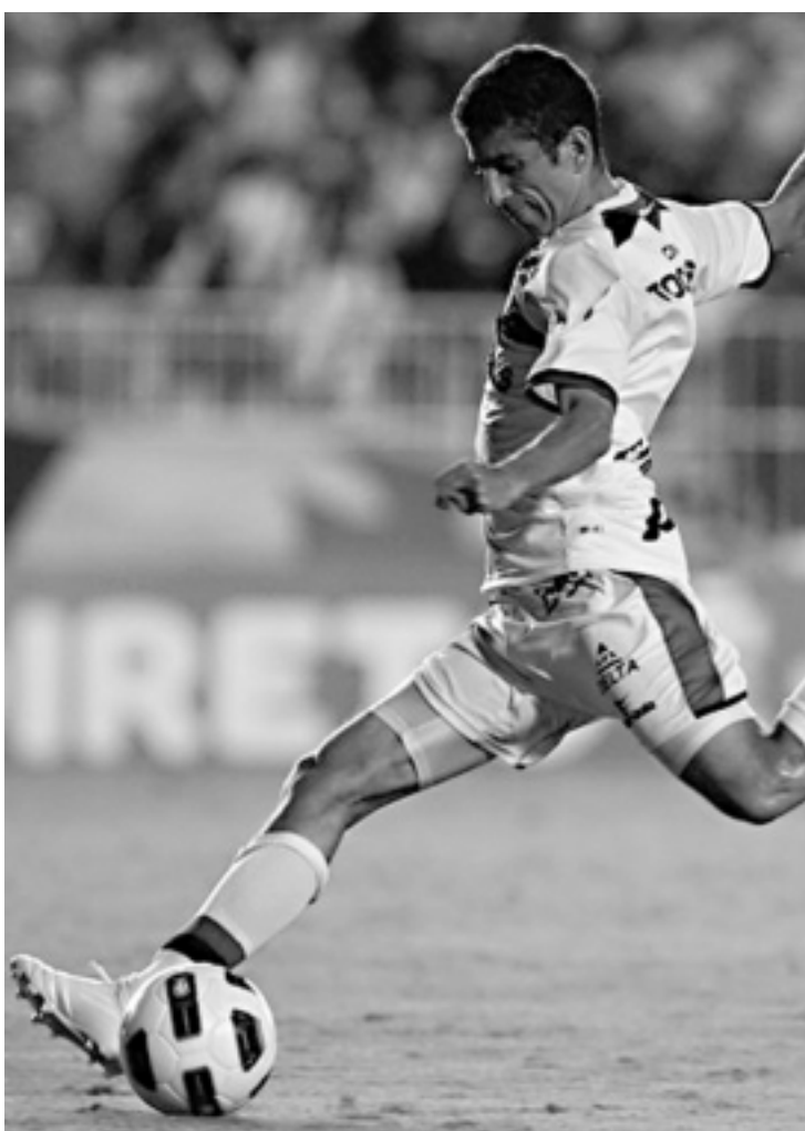
Jogador, ex-Atletico-GO, chega para ocupar a posição deixada por Ramon