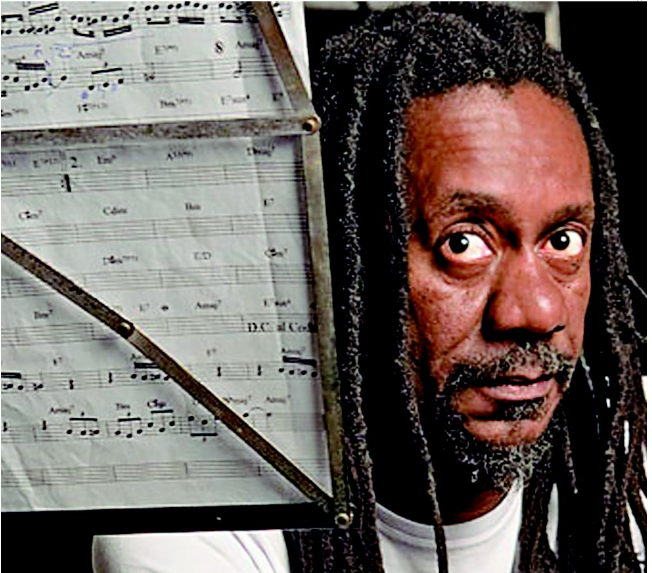
Luiz Melodia, grande atração da primeira noite do Projeto Estação do Som e que começa a gravação do novo disco em março, mostra repertório com clássicos da Música Popular Brasileira