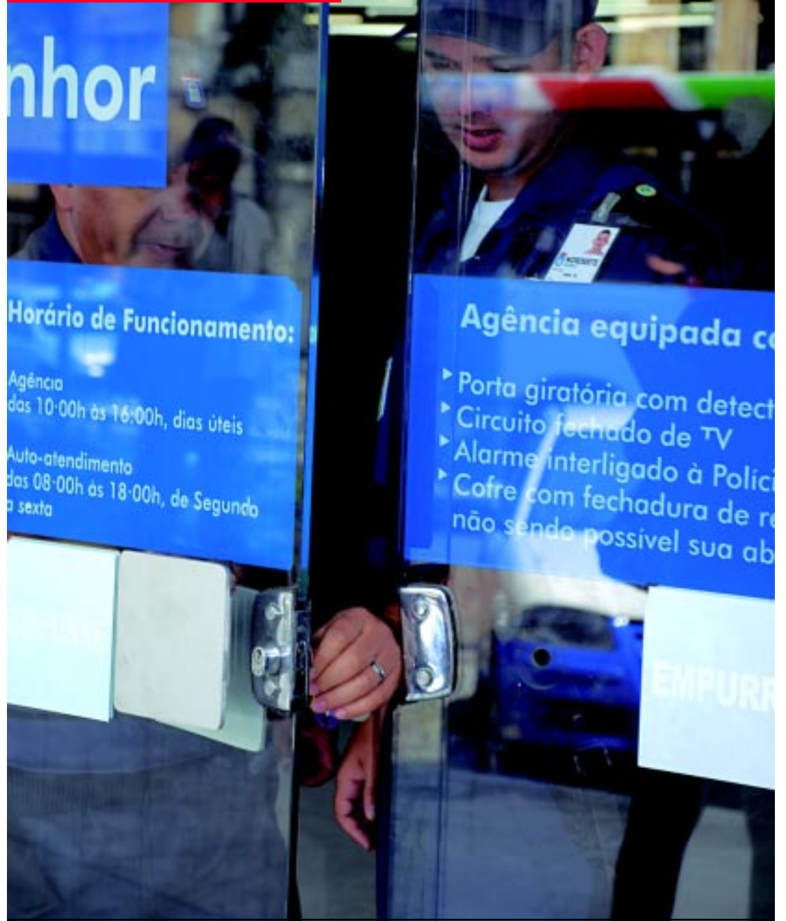
A entrada na agência (detalhe) aconteceu pela porta principal, depois que uma fechadura foi forçada e aberta