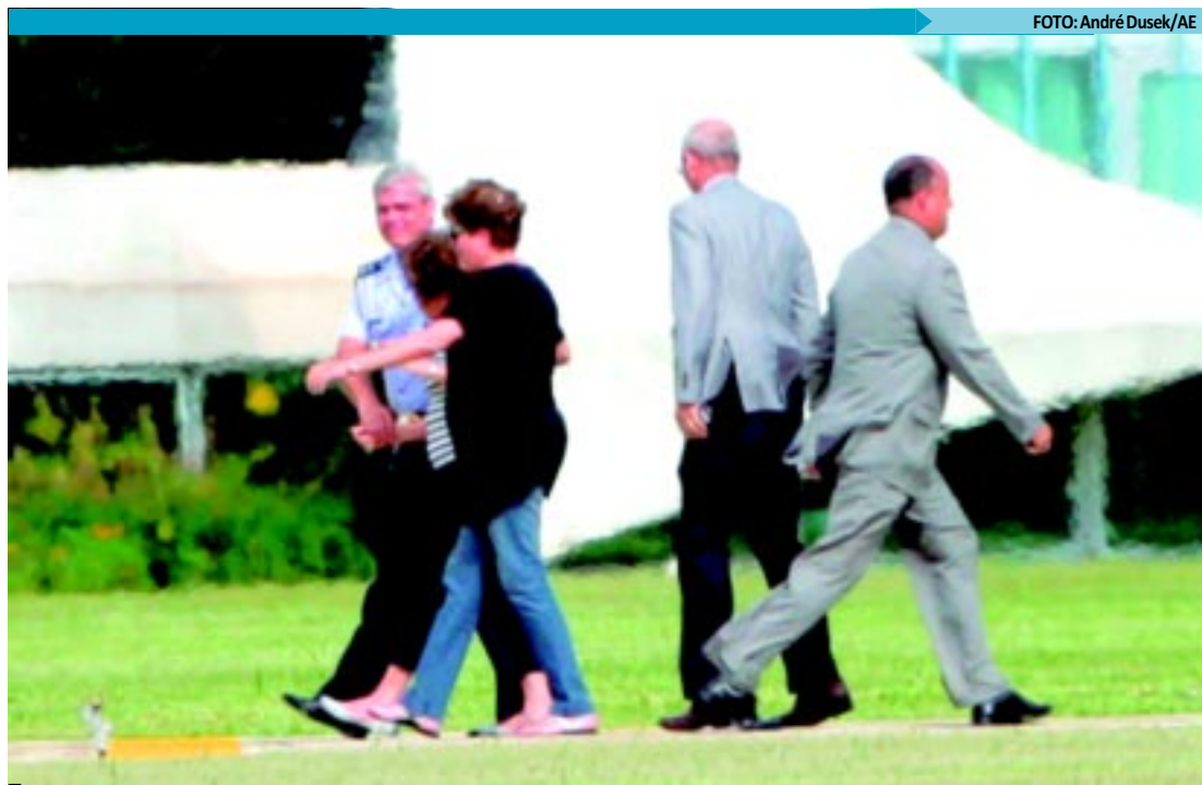
Retorno deve fazer com que presidente acompanhe de perto as ações do Governo para combater os prejuízos da chuva

OUTROS TEMAS - Outros processos que tratam de matérias de grande relevância para a sociedade podem ser julgados até o final de 2012. É o caso da Arguição de Descumprimento de Preceito Fundamental (ADPF) 54, que requer a autorização do aborto de fetos anencéfalos, e o Habeas Corpus (HC) 84548, que discute a atribuição do Ministério Público para realizar investigações. A situação de cerca de três mil comunidades quilombolas (ADI 3239) e a correção monetária nas cadernetas de poupança, em razão dos planos econômicos Cruzado, Bresser, Verão e Collor I e II (ADPF 165) também são temas que podem compor a pauta de julgamentos do STF em 2012.