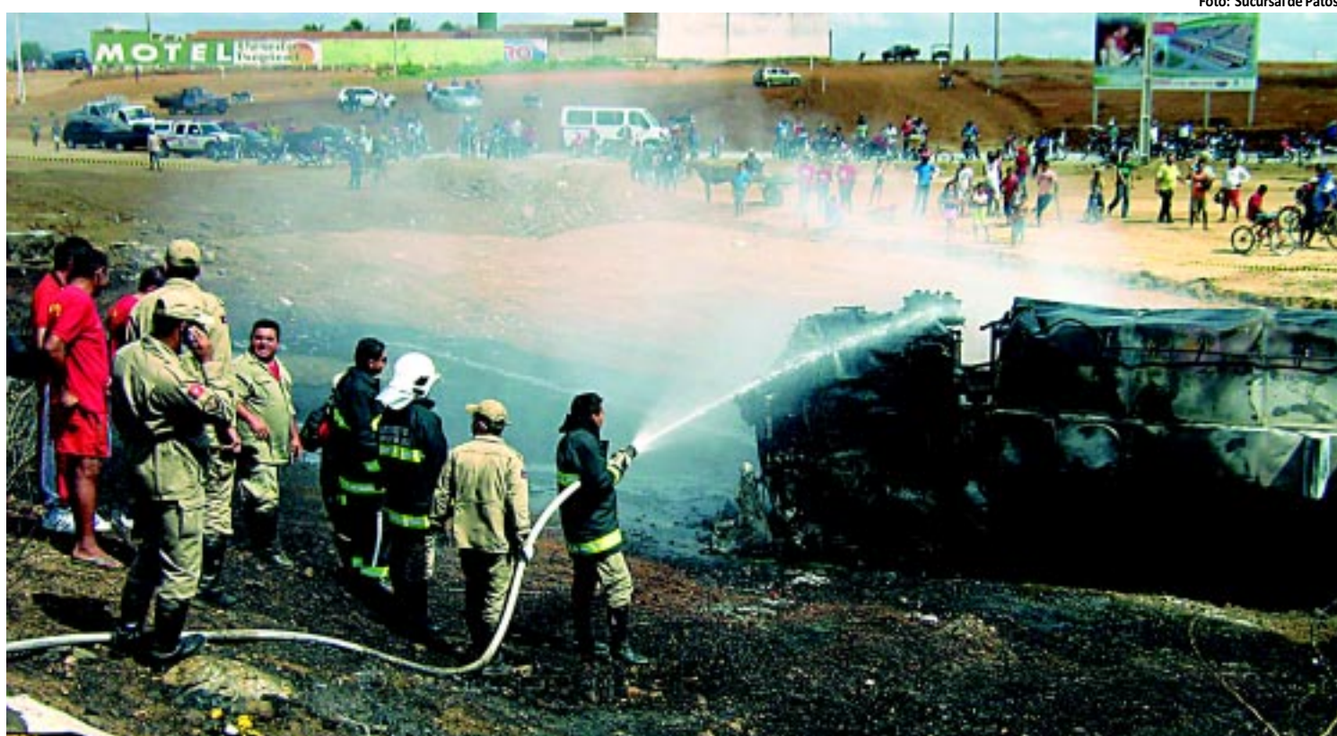
ACIDENTE | Após tombar, caminhão tanque explode e deixa um morto em Patos PÁGINA 11

tos. Entre 2009 e 2010, a cidade teve um crescimento de 12,2% nas despesas com Saúde, e ficou no sexto lugar no ranking dos 10 maiores investimentos em Saúde do Nordeste. PÁGINA 10