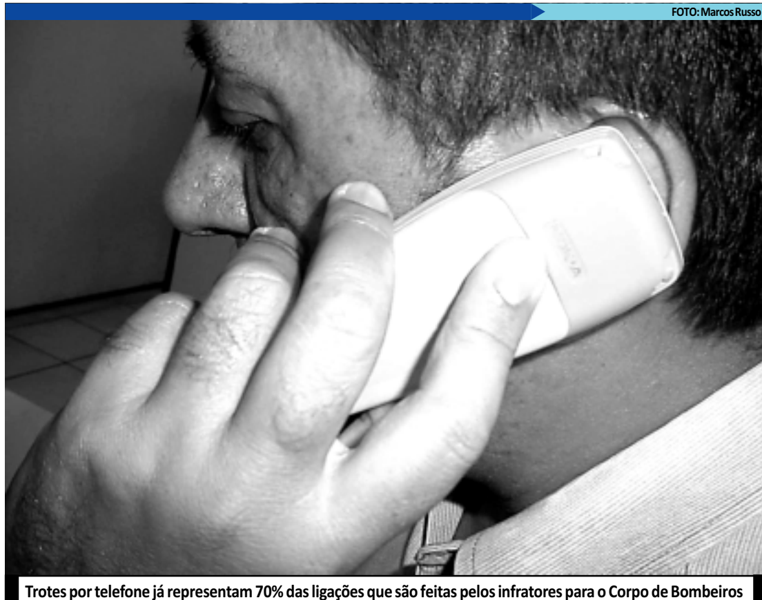
Trotes por telefone já representam 70% das ligações que são feitas pelos infratores para o Corpo de Bombeiros