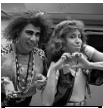
A Globo exibe hoje 'Zorra Total'