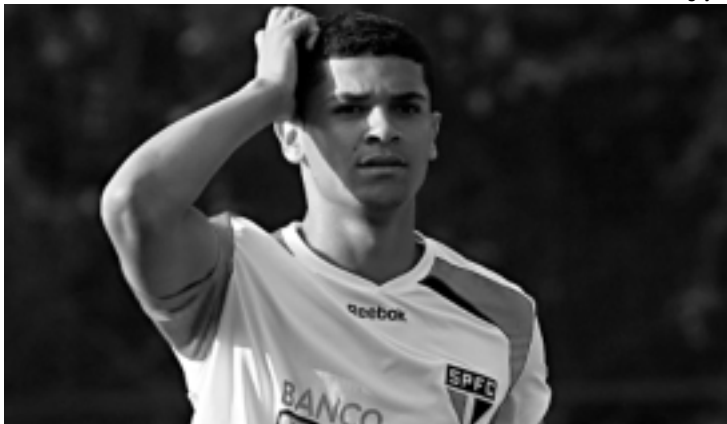
Jogador vai enfrentar disputa mais acirrada por uma vaga de titular