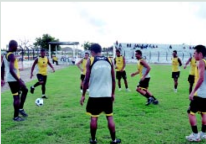
Jogadores intensificam treinos para jogo contra o Confiança