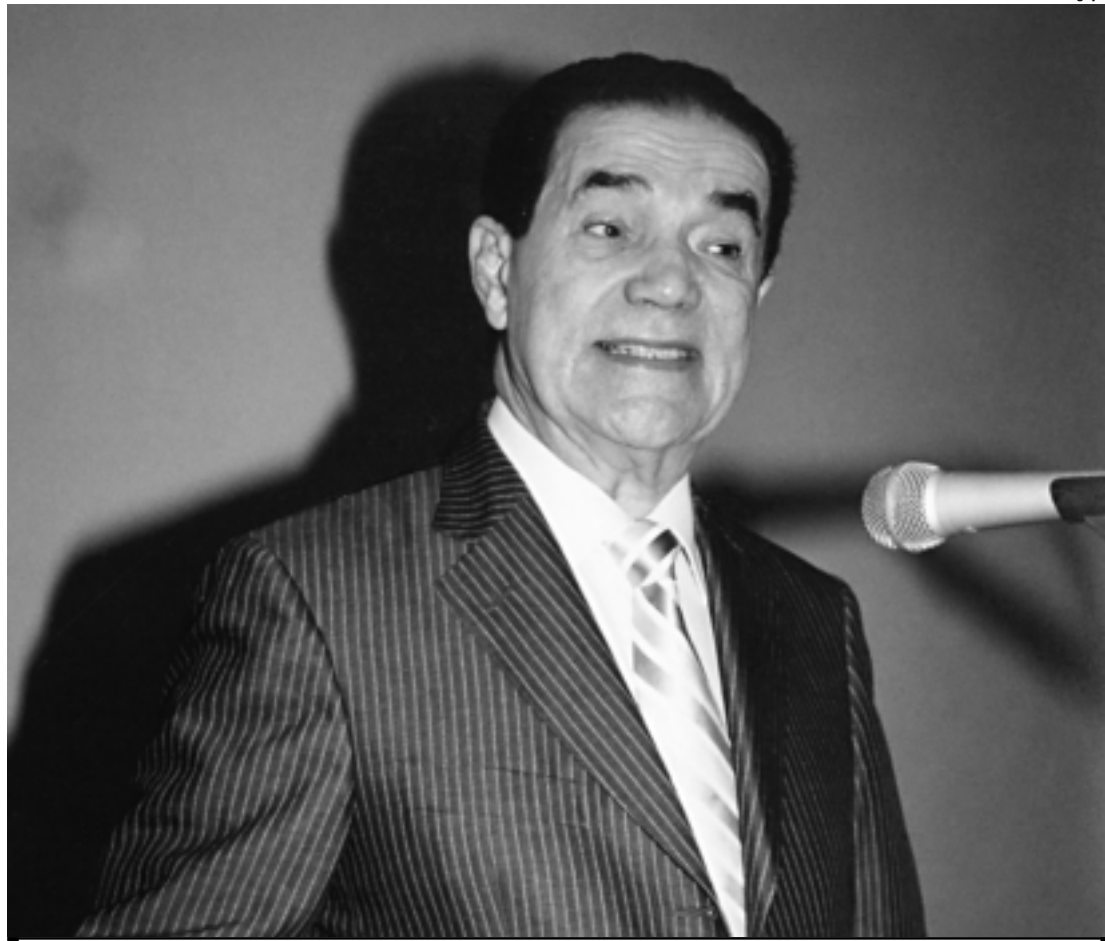
O baiano Divaldo Franco, um dos médiuns oradores mais conhecidos da atualidade, faz palestra na Capital

O livro Transição Planetária (Editora Leal, 248 páginas), do espírito Manoel Philomeno de Miranda e psicografado por Divaldo Franco, já ultrapassou - em poucos meses no mercado - a marca de mais de 100 mil exemplares vendidos. Um dos trechos da obra destaca que a humanidade "está no limiar da grande transição, em que o planeta passará da condição de mundo de provas e expiações para mundo de regeneração. Isso já constava no planejamento celestial há muito tempo e não se dará, obviamente, num passe de mágica, pois se trata de um processo de transformação lento e gradual, porém, impostergável".