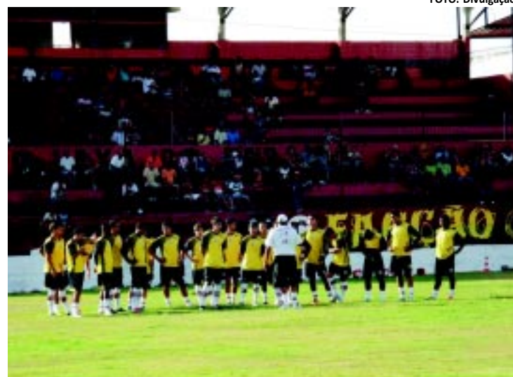
Atletas da Raposa seguem se preparando para a estreia no Estadual

O atacante avaliou positivamente a movimentação, mesmo se tratando de um adversário de caráter amador. "Nós sabemos que esse tipo de jogo-treino é importante para a preparação. O que a gente quer é ficar logo na ponta dos cascos para começar bem o campeonato no dia 5 de fevereiro".