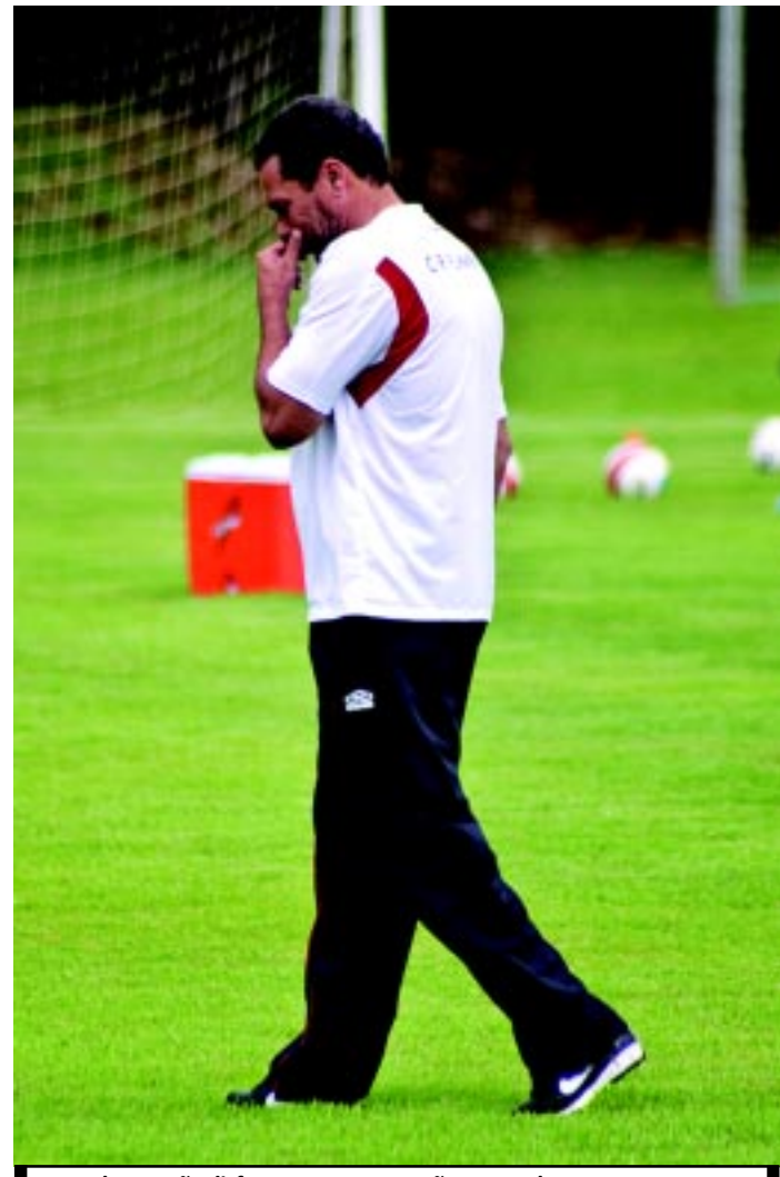
Luxemburgo não disfarça sua preocupação com o elenco que tem