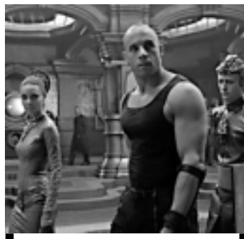
A Batalha de Riddick, na Record

11h00 - Correo Esporte 11h20 - Correo Verdade 13h00 - Verão É na Correo 14h23 - Viver Bem 14h30 - Cine Aventura 16h30 - O Melhor do Brasil 17h45 - Jornal da Record 18h15 - O Melhor do Brasil (Continuação) 21h45 - Tela Máxima: A Batalha de Riddick 00h00 - Programação IURD