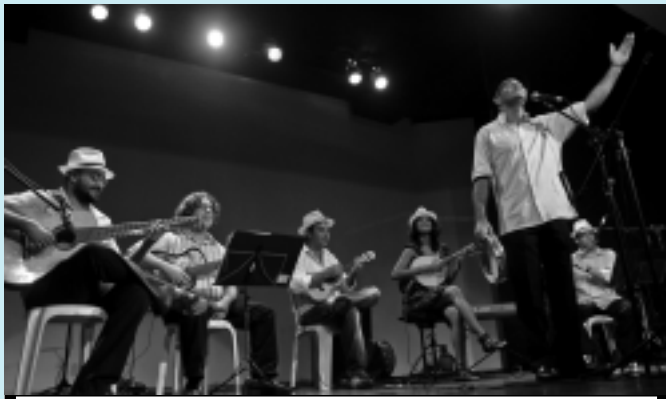
O cantor Moura vai interpretar canções de Nelson Gonçalves