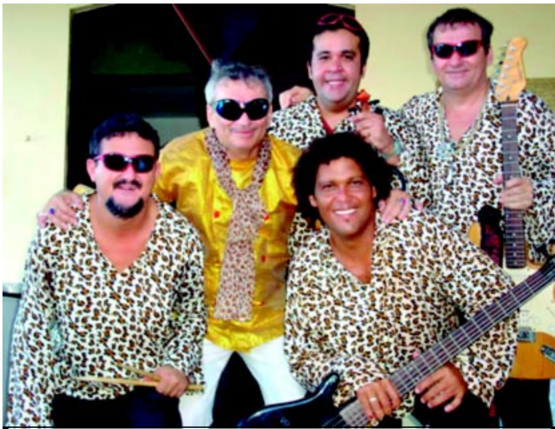
A banda paraibana Omelete canta músicas de Evaldo Braga, Waldick Soriano e outros 'clássicos' do brega

cidade de escrever canções espirituosas e românticas, Jorge Aragão costuma afirmar que "esse negócio de cantar" não foi planejado e que sente-se realmente como um autor. Com mais de 30 anos de carreira, o sambista só seguiu carreira solo nos anos 90, mas, logo alcançou reconhecimento e sucesso. Uma de suas mais conhecidas canções 'Coisinha do Pai' tocou além das fronteiras terrestres e "acordou" o robô da Nasa em Marte.