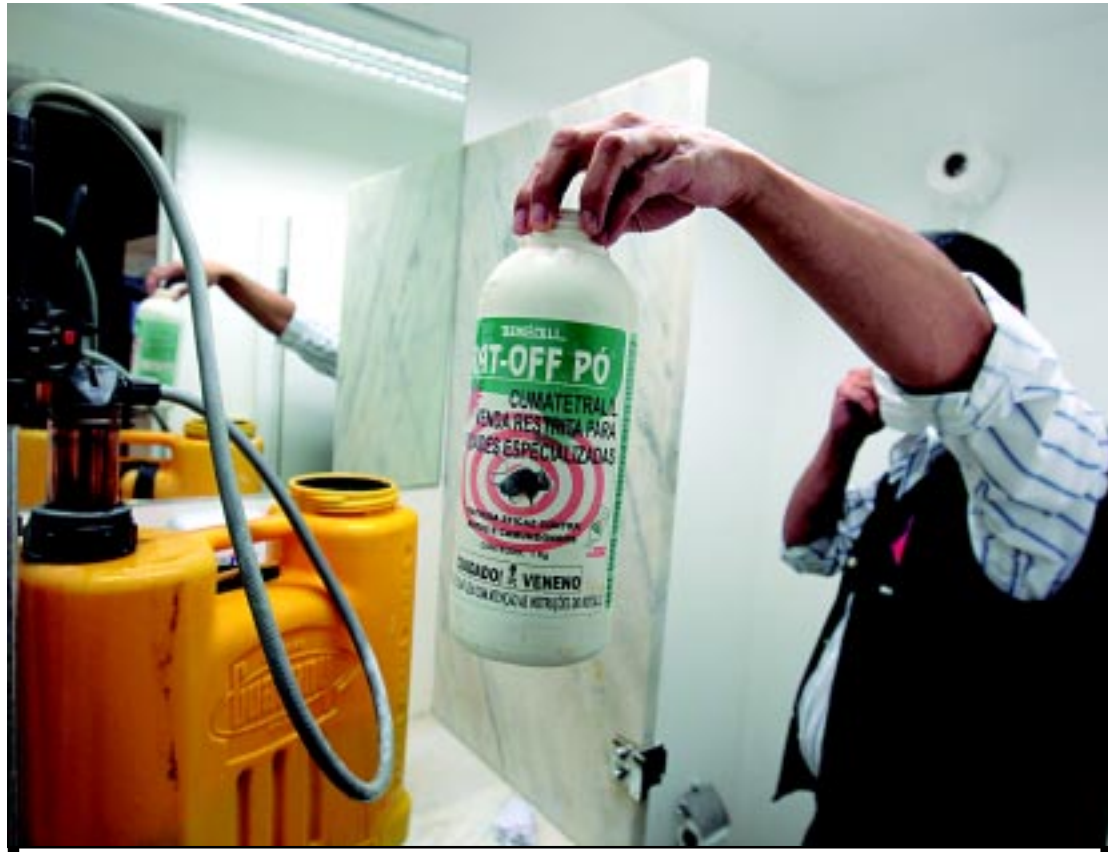
Após ser mordida por um rato, servidora da Secretaria-Geral do Senado está sob observação médica em Brasília