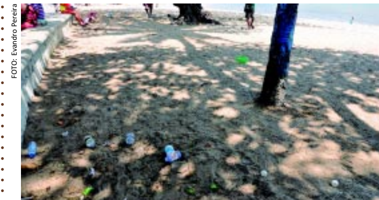
A beleza das praias da Capital tem sofrido com a falta de educação de quem deixa seu lixo nas areias e, não raro, no mar. São garrafas, sacolas plásticas, latas e objetos pessoais que bem poderiam estar nas lixeiras, instaladas a poucos metros da sujeira. [FOTO&LEGENDA]