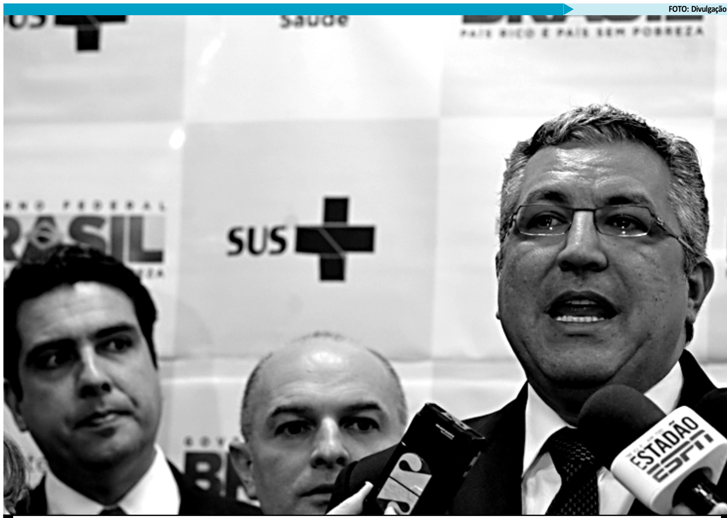
O ministro Alexandre Padilha disse que as mulheres com implantes de mama devem procurar os serviços de saúde para fazer uma avaliação

Padilha reforçou que a orientação para mulheres com implantes de mama é procurar os serviços de saúde da rede pública ou privada para fazer uma avaliação da situação da prótese. A troca da prótese com ruptura só será custeada pela rede pública e pelos planos de saúde quando houver indicação médica. Na próxima semana, segundo ele, serão definidas as diretrizes para avaliação clínica e re-