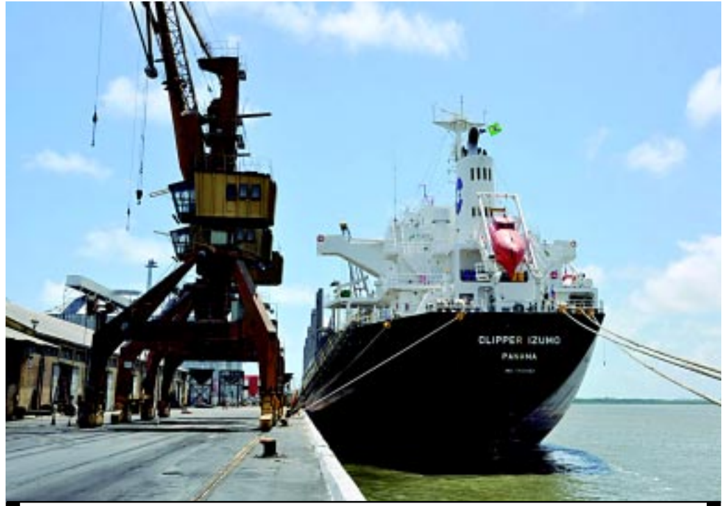
O porto vai se modernizar para buscar o desenvolvimento, que é prioridade do Governo do Estado