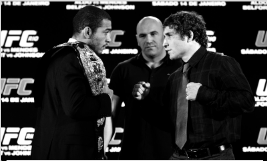
A luta principal do UFC 142 será entre o brasileiro José Aldo e o americano Chad Mendes