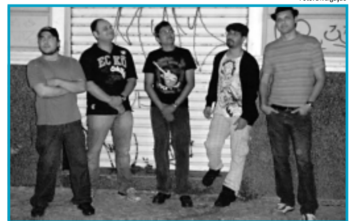
IN THE MOOD HARD BLUES