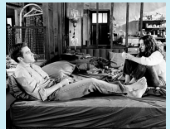
Cena de Amor e Outras Drogas, de Edward Zwick

>>> AMOR E OUTRAS DROGAS - Jamie Randall, um sedutor incorrigível, é demitido de uma loja de eletrodomésticos por ter seduzido uma funcionária e passa a trabalhar num laboratório da indústria farmacêutica. A função dele é convencer os médicos a prescrever os produtos da empresa para os pacientes. Em uma dessas visitas, ele conhece Maggie Murdock, uma jovem que sofre de mal de Parkinson. Jamie fica atraído pela beleza dela, mas aos poucos descobre que existe algo mais forte. SE LIGUE: Hoje, às 22h, no Telecine Premium