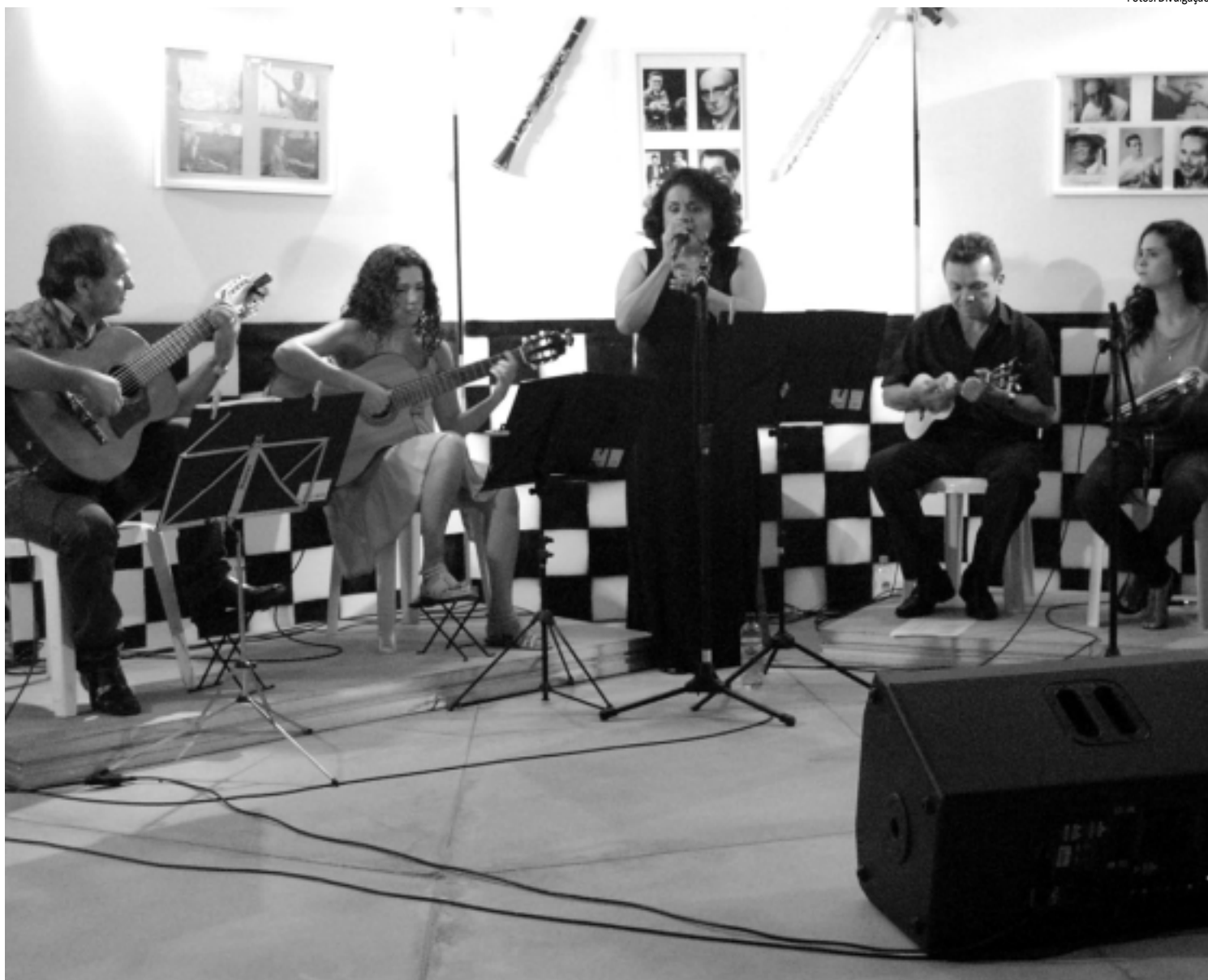
A banda EmCanto e Choro montou um repertório com músicas de compositores como Cartola, Pixinguinha, Jacob do Bandolim e Paulinho da Viola