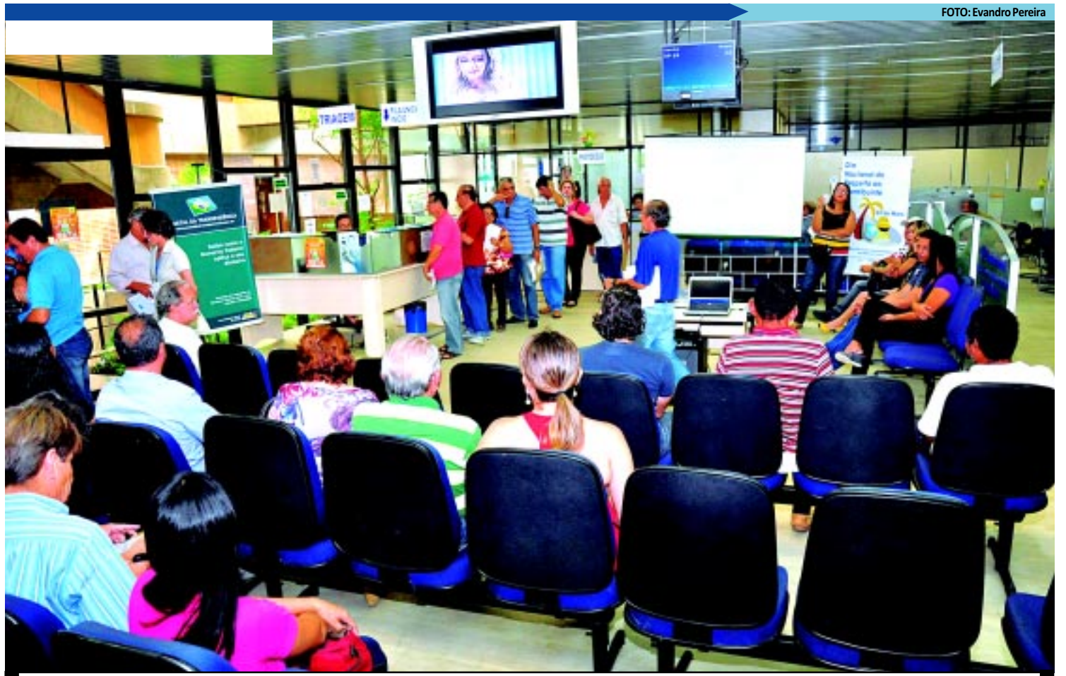
Contribuintes são alvo de golpistas que enviam correspondências fraudulentas via email para as suas caixas postais com timbres oficiais

Criado em 2007, o Simplex Nacional reúne, em sua única guia de recolhimento, seis tributos federais: Imposto de Renda da Pessoa Jurídica (IRPJ), Imposto sobre Produtos Industrializados (IPI), PIS/Pasep, Contribuição para o Financiamento da Seguridade Social (Cofins), Contribuição Social sobre o Lucro Líquido (CSLL) e contribuição patronal para o INSS, além do Imposto sobre Circulação de Mercadorias e Serviços (ICMS), de responsabilidade do Estado, e o Imposto Sobre Serviços (ISS), principal tributo dos municípios.