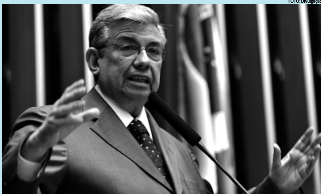
Garibaldi disse que não há país que dê uma pensão tão grande à família de quem contribuiu apenas uma vez

"Esse regime [sem carência] é de uma generosidade muito grande, não há hoje nenhum país no mundo que dê uma pensão tão grande à família de quem contribuiu apenas uma vez. Hoje isso está custando R$ 60 bilhões por