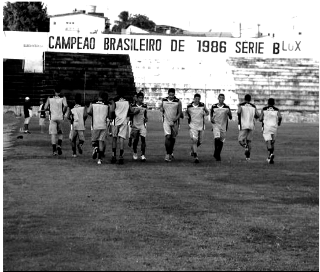
O Treze, campeão da Primeira Divisão, enfrentará o Paraíba, vencedor da Segundona em 2012

A programação do Treze marca treinamentos em dois períodos para hoje, uma atividade de fortalecimento neste sábado e folga para o domingo. Os jogadores devem se reapresentar na segunda-feira pela manhã.