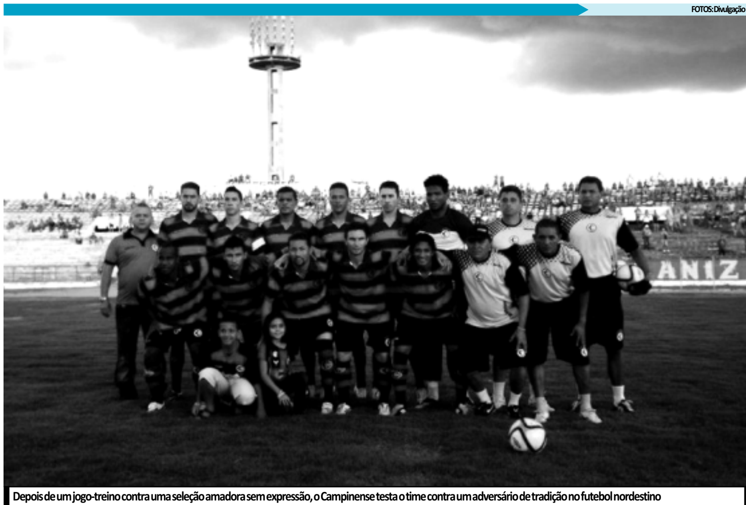
Depois de um jogo-treino contra uma seleção amadora sem expressão, o Campinense testa o time contra um adversário de tradição no futebol nordestino

Os preços dos ingressos foram definidos pela diretoria: R$ 10,00 (geral), R$ 20,00 (arquibancada), R$ 40,00 (cadeiras), crianças até 12 anos terão acesso gratuito, enquanto estudantes e idosos pagam a metade. Para este jogo o treinador Freitas Nascimento deve efetuar várias mudanças, observando a equipe para estreia no Campeonato Paraibano, que terá início no dia 5 de