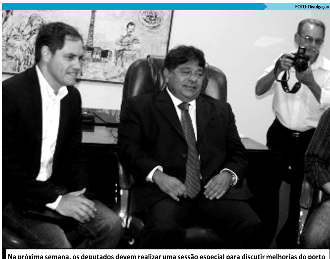
Na próxima semana, os deputados devem realizar uma sessão especial para discutir melhorias do porto

A responsabilidade também pode recair sobre os particulares que concorrerem para a prática ilícita ou que tenham se beneficiado da malversação dos recursos públicos.