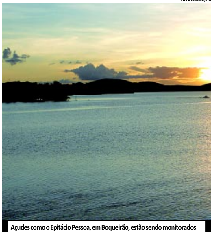
Açudes como o Epitácio Pessoa, em Boqueirão, estão sendo monitorados