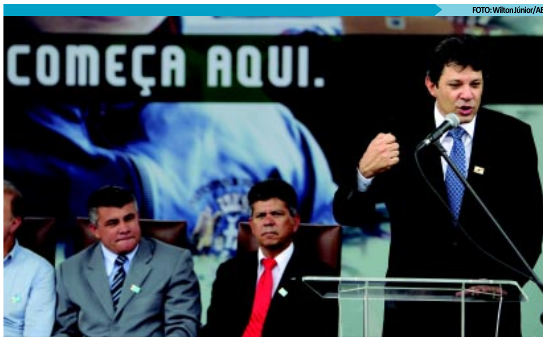
Haddad discursou durante a cerimônia de inauguração do Centro Municipal de Educação Infantil no Rio de Janeiro

Na próxima terça-feira, será realizada a transmissão de cargo. Um dia antes, o Palácio do Planalto prepara um grande evento de bolsas do ProUni - Programa Universidade Para Todos para marcar a saída de Haddad do governo. No mesmo dia, está prevista uma reunião ministerial, à qual devem comparecer Haddad, Mercadante e Raupp.