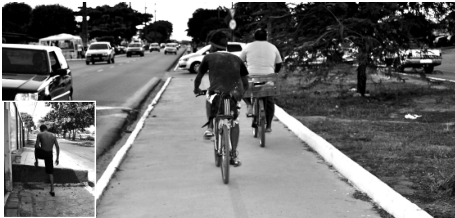
Somado aos trabalhos do Projeto Caminho Livre a administração municipal deve implementar novas ciclofaixas e fazer ordenamento das calçadas

O Caminho Livre é feito com recursos próprios da Prefeitura de João Pessoa (PMJP) e está orçado em R$ 10 milhões. A expectativa é que as obras sejam concluídas em dezembro deste ano.