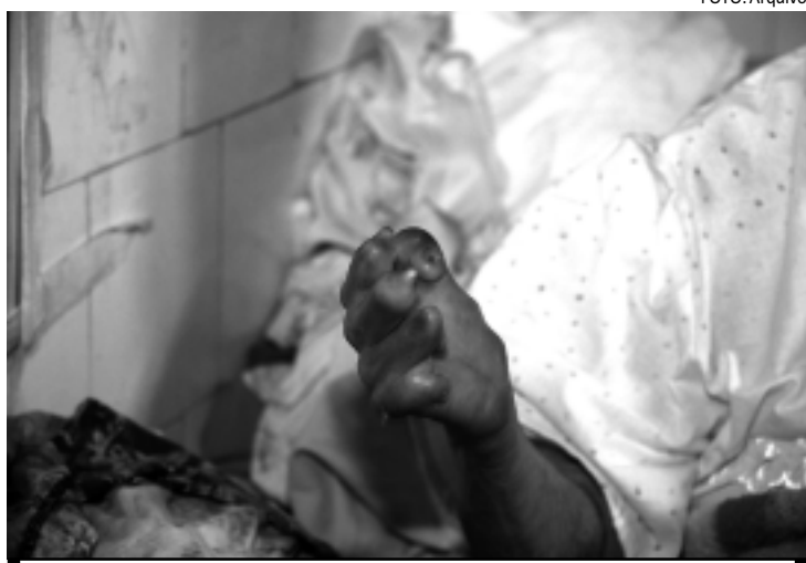
648 casos de hanseníase foram registrados na Paraíba no ano passado