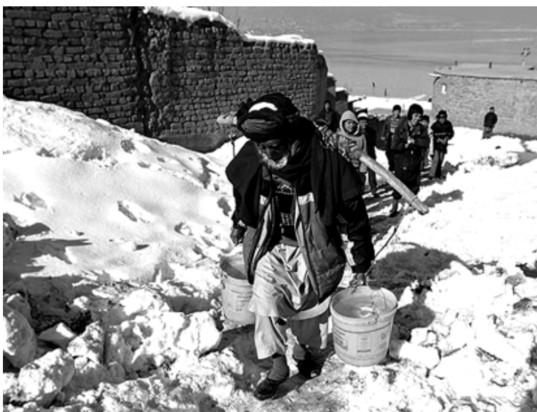
As avalanches de neve acontecem desde o último domingo na província de Badakhshan, no norte do país

Em fevereiro de 2010, pelo menos 166 pessoas morreram em avalanches na região de Salang, onde a neve afetou a principal via de comunicação entre essa província e Cabul.