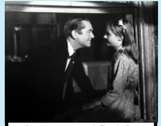
Cena de Laços Humanos, segundo filme de Elia Kazan

>>> LAÇOS HUMANOS - Apesar da pouca idade e da família problemática que possui, Francie busca aproveitar sua infância da melhor forma possível e tenta se transferir para uma escola melhor. Morando com um pai alcoólatra, uma tia, vive se envolvendo em escândalos por causa de seus vários casamentos e com mãe, que luta manter a família unida, a menina ainda acredita que, mesmo com a família desestruturada, pode ter um futuro diferente e mais feliz.