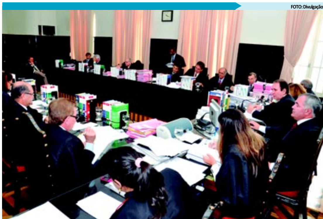
Decisão do Pleno do Tribunal de Justiça deve ser cumprida em até 180 dias, a contar do comunicado oficial

O governador Ricardo Coutinho deve assinar nos próximos meses a ordem de serviço para a construção da Rodovia da Produção, 15 quilômetros entre Sousa e distrito de São Gonçalo. O DER também investe na Operação Tapa Buraco realizando pequenos reparos em rodovias danificadas no período de chuvas.