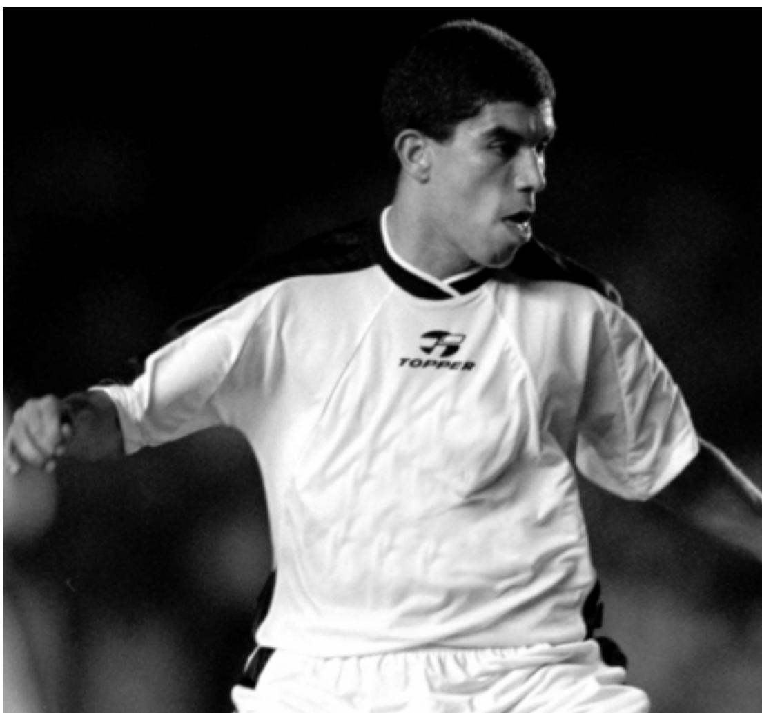
Ricardinho, de 35 anos, fazia parte da Seleção Brasileira na conquista do pentacampeonato em 2002