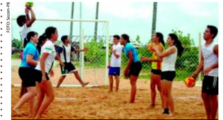
[FOTO&LEGENDA] Crianças e adolescentes das escolinhas do projeto "Verão em Ação" movimentaram as areias das praias de Miramar, em Cabedelo, Manaíra e Bessa, em João Pessoa, ontem. Ali eles praticaram handebol de praia, futvôlei, frescobol, entre outros esportes.