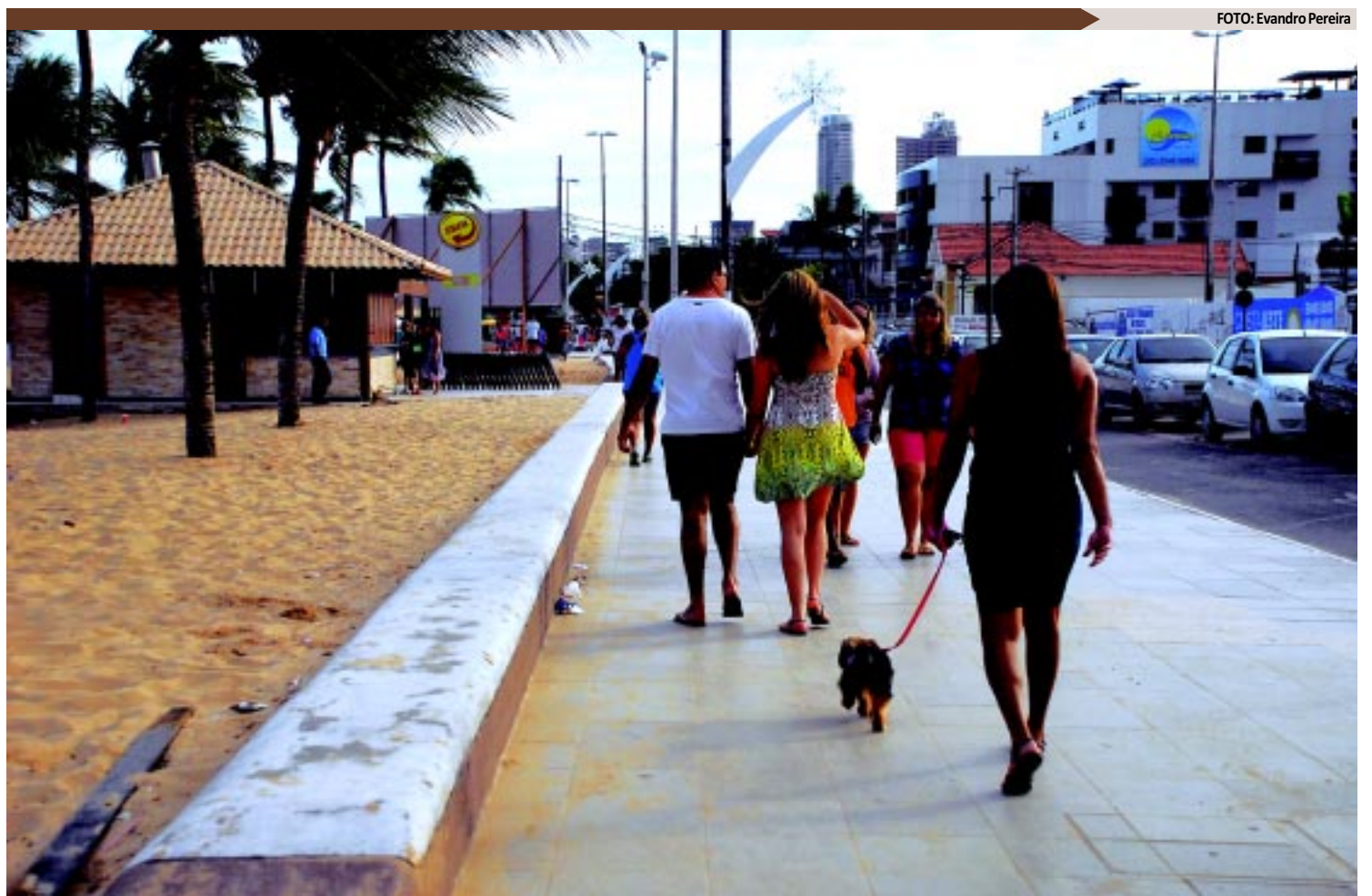
O simples passeio com o cãozinho pela orla pode se transformar em um problema de saúde caso o dono do "pet" não recolher as fezes do animal

SEM REGULAMENTAÇÃO - A Lei Municipal 11.880/2010, sancionada em fevereiro de 2010, é de autoria da vereadora Eliza Virgínia e dispõe sobre a obrigatoriedade de recolhimento dos resíduos de