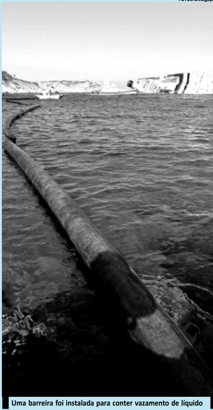
Uma barreira foi instalada para conter vazamento de líquido

O governo italiano afirmou ontem que já ocorreu "dano ambiental", embora muito restrito ao fundo do mar da ilha de Giglio em consequência do naufrágio de sexta-feira passada do navio Costa Concordia, que contém em seu interior 2.380 toneladas de combustível.