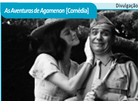
As Aventuras de Agamenon [Comédia]

GATO DE BOTAS (Puss in Boots, EUA, 2011). Gênero: Animação. Duração: 90 min. Classificação: Livre. Dublado. Direção: Chris Miller. Antes de conhecer Shrek, Fiona, Burro e companhia, o Gato de Botas vivia suas próprias aventuras. Ao lado de Humpty Dumpty e de uma gata de rua, irá tentar roubar a famosa gansa que botou ovos de ouro. Tâmbiá 2: 13h40, 15h20, 17h e 18h40.