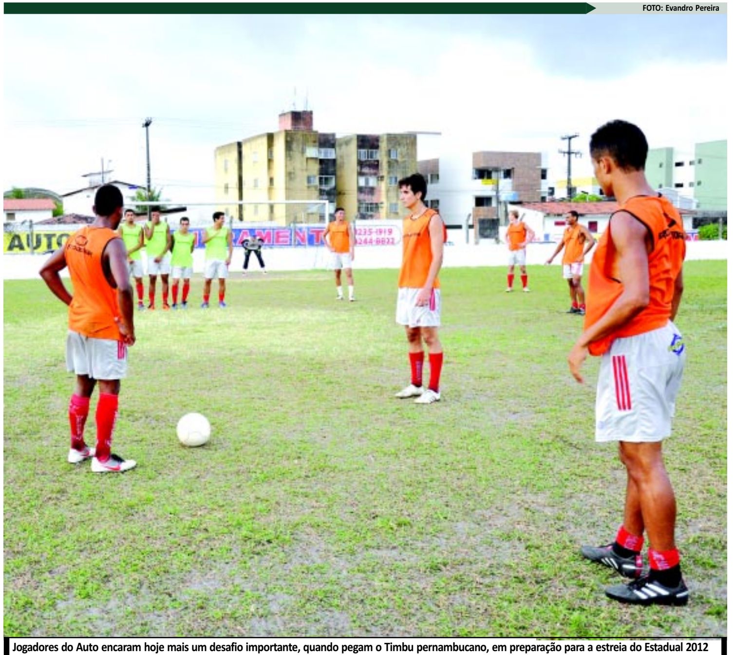
Jogadores do Auto encaram hoje mais um desafio importante, quando pegam o Timbu pernambucano, em preparação para a estreia do Estadual 2012