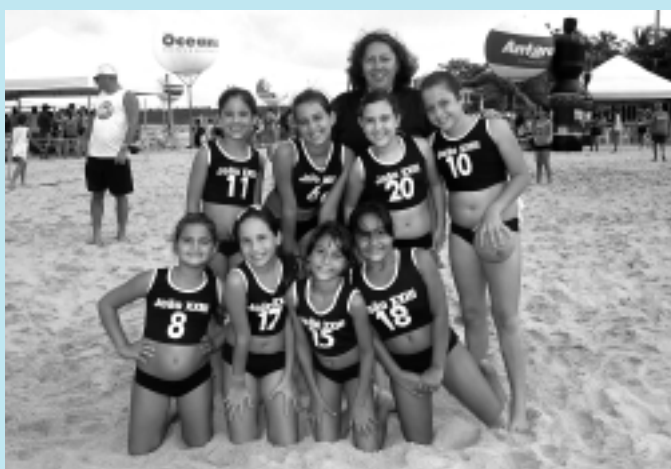
A Taça Kika também será disputada nas categorias mirim e infantil