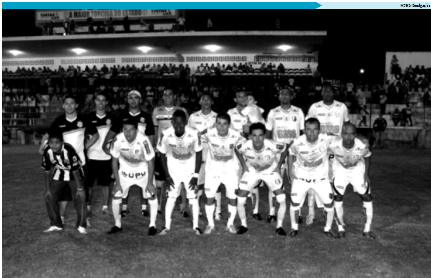
Na preparação para conquistar o tricampeonato, o Treze já disputou quatro partidas tendo vencido duas e empatado as outras duas

"O teste contra o Paraíba será muito difícil, talvez o mais difícil até o momento. Conhecemos o treinador que