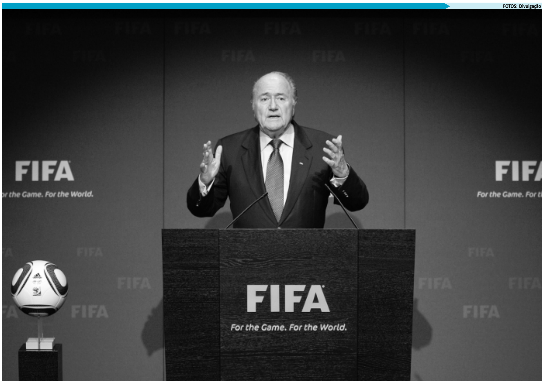
"Nós não podemos voltar a permitir um desastre como o do gol da Inglaterra contra a Alemanha no Mundial de 2010", disse o presidente da Fifa, Joseph Blatter, a uma revista alemã