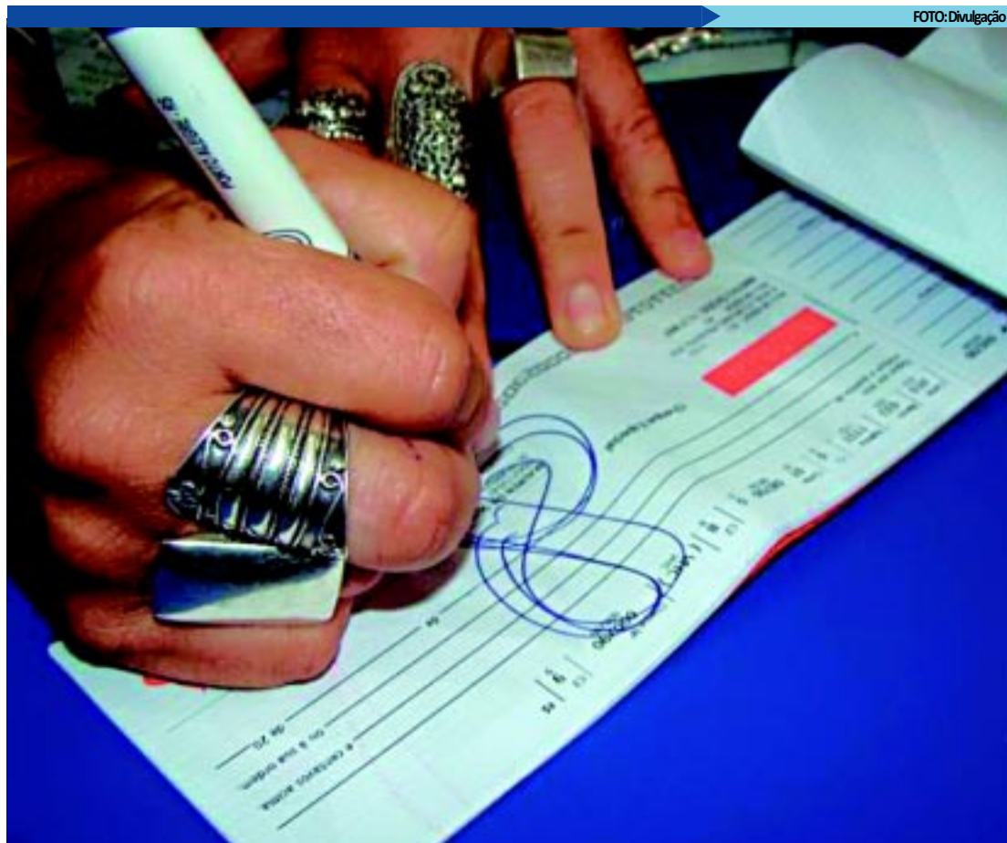
Seis milhões de cheques foram compensados em 2011; desse total, 4,4% tiveram devolução, segundo a Serasa

Já a queda verificada na relação cheques sem fundos frente aos compensados em dezembro de 2011, segundo os economistas, indica que, além do uso de parte do 13º salário para o pagamento dessas pendências,