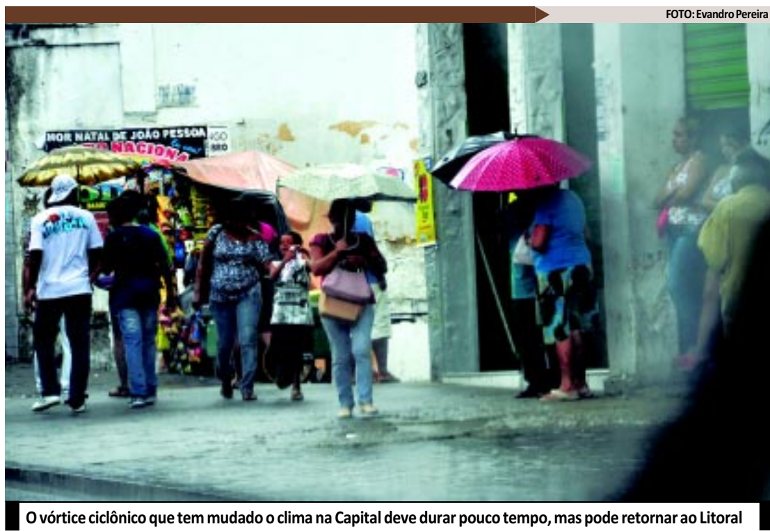
O vórtice ciclônico que tem mudado o clima na Capital deve durar pouco tempo, mas pode retornar ao Litoral