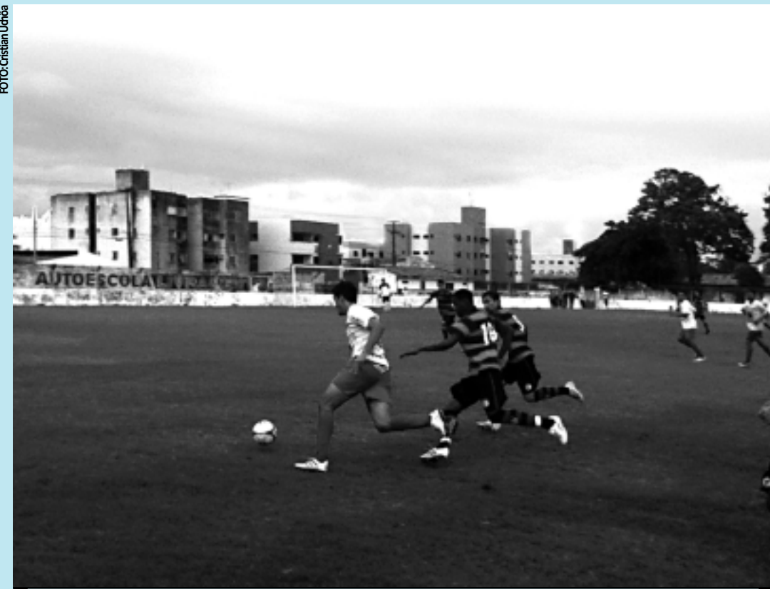
No último amistoso nesta pré-temporada, o Campinense acabou perdendo de virada para o Auto Esporte