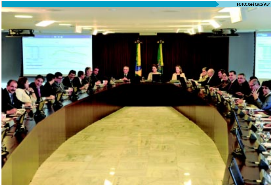
36 dos 38 ministros se reuniram, inclusive Haddad que será substituído por Mercadante para disputar eleição

Um relatório da CGU, divulgado no fim de 2010, apontou desvios de recursos públicos em obras do Dnocs de combate às secas no Ceará.