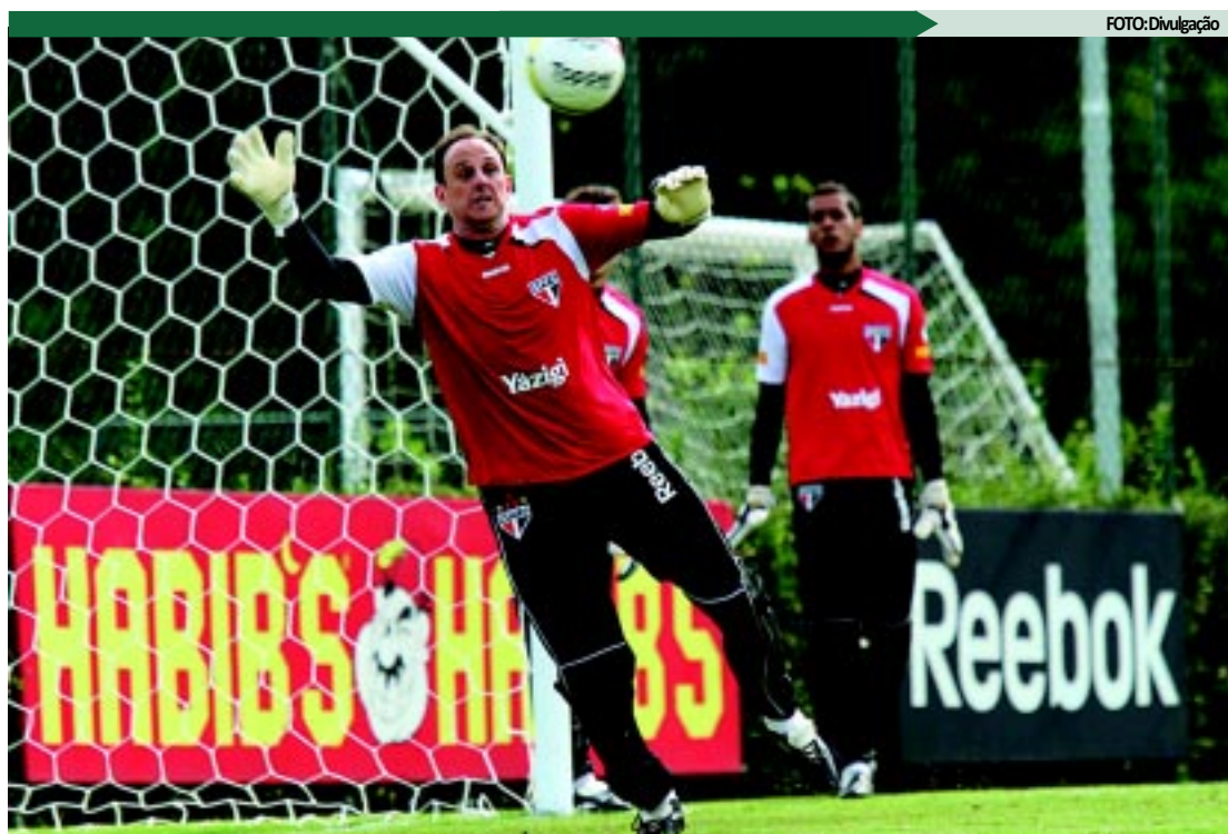
O goleiro Rogério Ceni faz fisioterapia no ombro direito tentando evitar uma cirurgia delicada

paciente que não está confiante. Ele acha que está com um pensamento errado e deixa para a semana que vem, acreditando que estará com um pensamento melhor. Imagine na cabeça de um goleiro famoso, titular de um time há muitos anos por mérito, que faz 39 anos e recebe a notícia