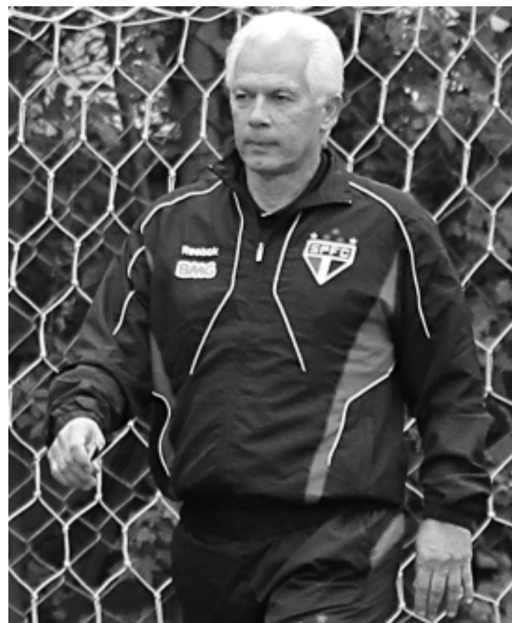
Para o treinador do Tricolor, o novo reforço chegou fora de forma