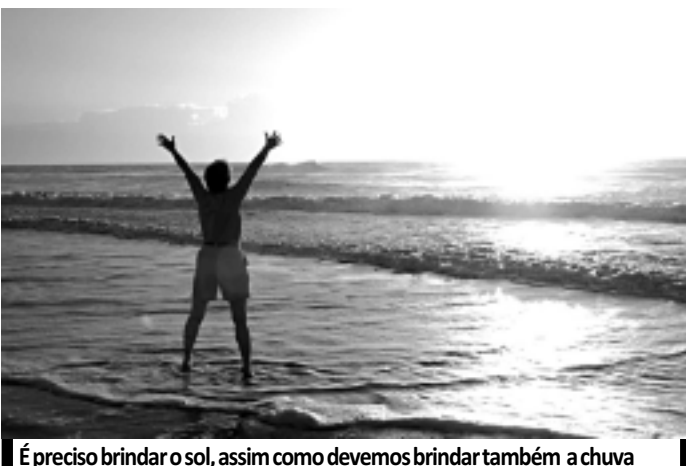
É preciso brindar o sol, assim como devemos brindar também a chuva

E viva o nosso poder de discernimento, sobretudo, de compreensão, pois a vida é uma dança de contrastes.