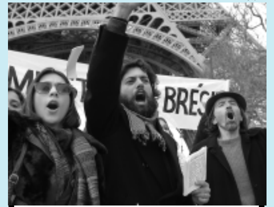
Cena do filme Em Teu Nome , de Paulo Nascimento

>>> EM TEU NOME... - Nos Anos 70, Boni, um estudante de engenharia de origem humilde, adere a luta armada, mas carrega dúvidas e medos sobre se este seria realmente o melhor caminho. Ele teme pela família, pela namorada e pelo futuro, que parece mais incerto a cada dia. Boni acaba sendo preso e é exilado após ser trocado, junto com outros 69 presos políticos, pelo embaixador suíço. No exílio no Chile, ao lado da companheira Cecília, passa a compreender a sociedade de outra maneira. SE LIGUE: Hoje, às 22h, no Canal Brasil