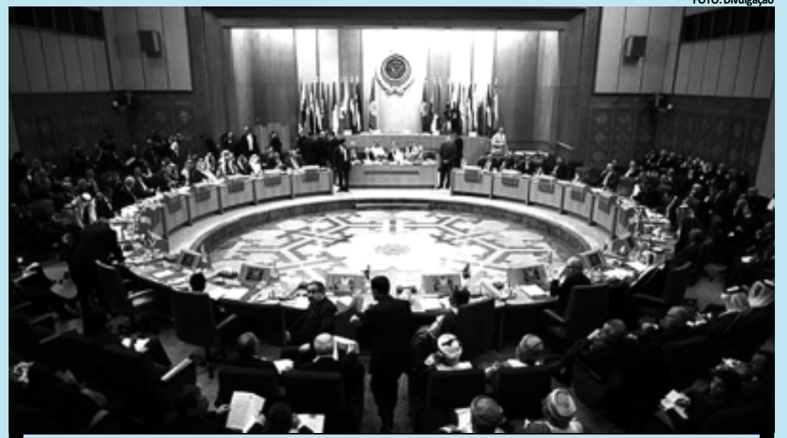
No Cairo, chanceleres da Liga Árabe se reuniram no último domingo e exigiram a saída do ditador Bashar

A Liga Árabe, que prolongará a missão dos observadores na Síria em um mês, também revela que o futuro governo deverá criar em três