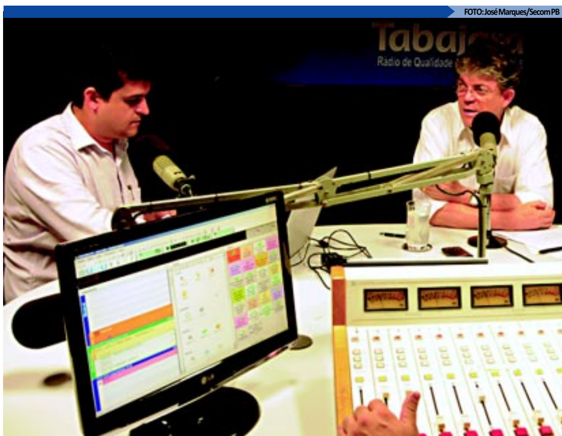
Balanço foi divulgado por Ricardo Coutinho, durante programa semanal Fala Governador na Rádio Tabajara

IMPACTO - O reajuste de 14,13% no salário mínimo, que entrou em vigor no dia 1º de janeiro, deverá provocar um aumento de R$ 380 milhões nas despesas com pessoal nos 223 municípios da Paraíba. A previsão foi calculada pelo gestor do Observatório de Informações Municipais da Associação Transparência Municipal, François Bremaeker, a partir da análise dos dados das despesas municipais fornecidos pela Secretaria do Tesouro Nacional. No ano passado, a despesa com pessoal na Paraíba chegou a R$ 2,683 bilhões.