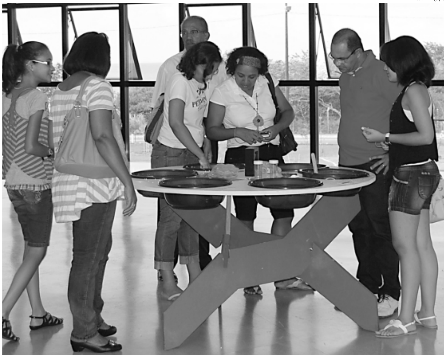
O público é convidado a interagir com os experimentos na exposição Ciência, Essa é a Minha Praia , inspirada em uma mostra francesa