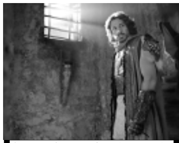
'Rei Davi', minissérie da Record

19h00 Jornal do Correiio 19h30 Jornal da Record 20h15 Novela: Rebelde 21h15 Série: CSI Las Vegas 22h15 Novela: Vidas em Jogo 23h00 Rei Davi 00h00 Série: CSI Miami 01h00 Programação IURD