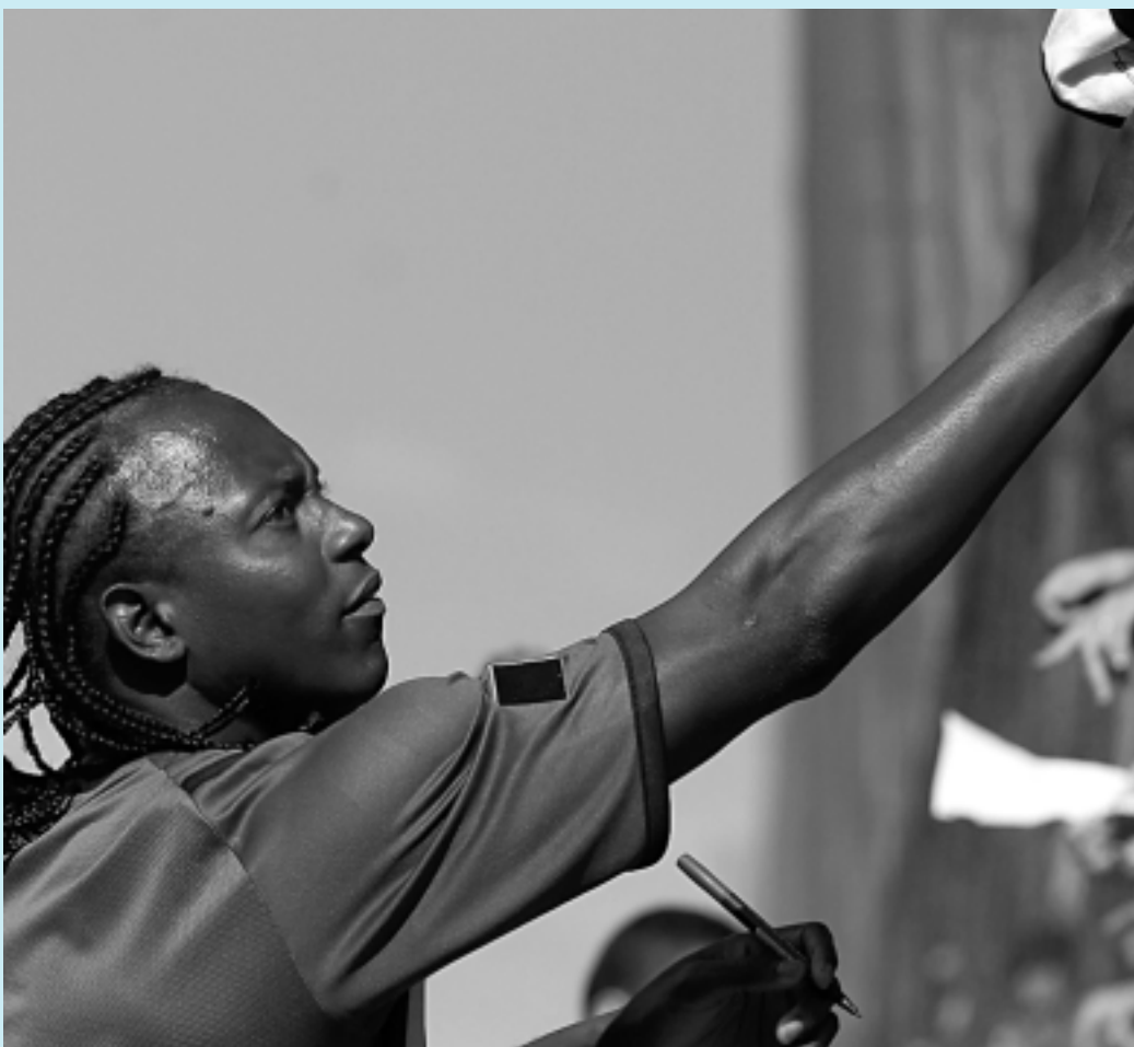
Jogador trocou bons passes com seus companheiros e agradou ao torcedor que foi ao Engenhão