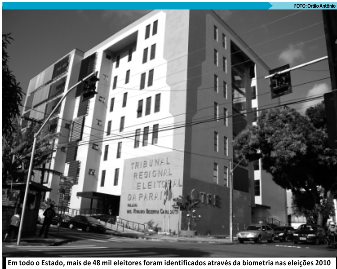
Em todo o Estado, mais de 48 mil eleitores foram identificados através da biometria nas eleições 2010

De acordo com a deputada, o grande desafio é estimular a participação das mulheres na vida política do município e da região. "Desde o início de abril do ano passado, quando assumimos a direção do PMDB Mulher na Paraíba, estamos trabalhando no sentido de estimular a participação feminina na vida político-partidária em nível municipal, estadual e federal, dando maior ênfase aos municípios, tendo em vista as eleições de outubro deste ano", observou.