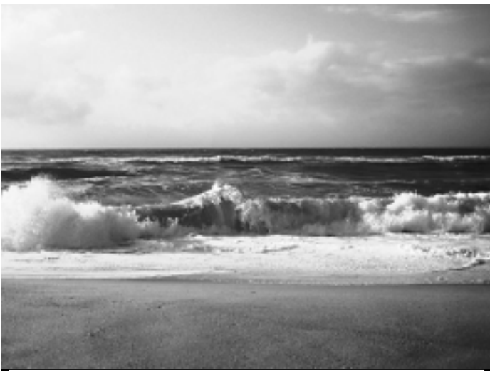
O mar é um rei que, mesmo em calmaria, jamais refletirá a lua

E a terra? Sim, e a terra? Sem ela, que seria do mar, do rio, do lago? A terra, na sua humildade, sustenta a todos. Mas vamos encerrar a crônica, que já começa a chover. Mais chuva, mais água no mar, nos rios, nos riachos, nos lagos. A vida é isto, leitor. Todos nós vivemos em total interdependência.