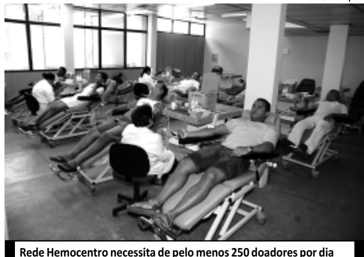
Rede Hemocentro necessita de pelo menos 250 doadores por dia