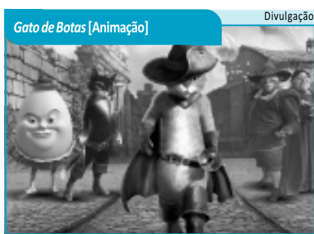
Gato de Botas [Animação]

GATO DE BOTAS (Puss in Boots, EUA, 2011). Gênero: Animação. Duração: 90 min. Classificação: Livre. Dublado. Direção: Chris Miller. Antes de conhecer Shrek, Fiona, Burro e companhia, o Gato de Botas vivia suas próprias aventuras. Ao lado de Humpty Dumpty e de uma gata de rua, irá tentar roubar a famosa gansa que bota ovos de ouro. Tambiá 1: 14h10, 16h10, 18h10 e 20h10.