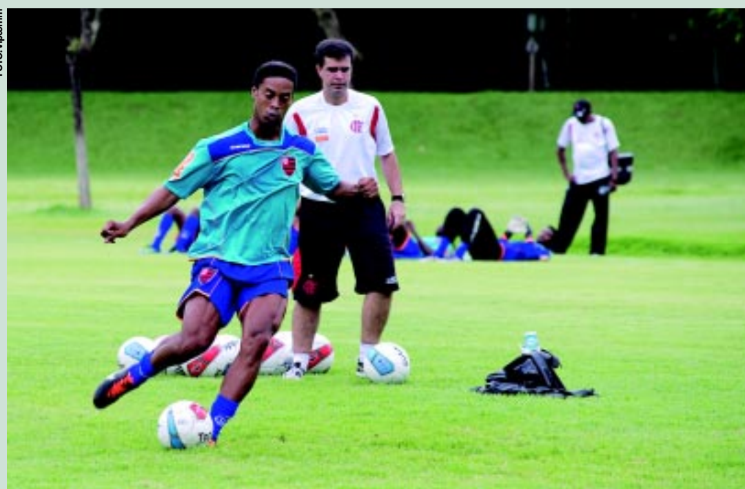
Ronaldinho, sem explicação, chegou ontem atrasado para o treino do Flamengo no período da tarde