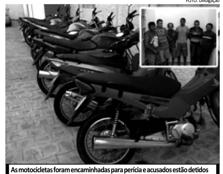
As motocicletas foram encaminhadas para perícia e acusados estão detidos