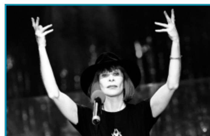
RITA LEE É PRESA EM SHOW DE APOSENTADORIA

# Stevie Wonder e Christina Aguilera cantaram em homenagem a Etta James durante o funeral da cantora, no sábado (28) em Los Angeles. Uma das maiores vozes da história do jazz e do blues, Etta James morreu em 20 de janeiro, aos 73 anos, vítima de leucemia. A cantora também sofria de mal de Alzheimer, tinha problemas nos rins e, desde 2010, havia passado por várias internações. Wonder fez uma rápida apresentação com o coral da igreja, com a faixa Shelter in the Rain . Aguilera cantou a música At Last , um dos maiores sucessos de James.