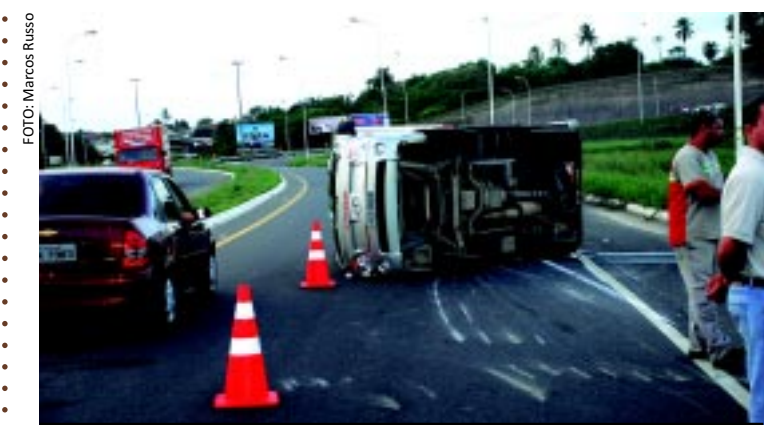
[FOTO&LEGENDA] No final da tarde de ontem, um caminhão baú da empresa Coca-Cola tombou na alça do viaduto das Três Lagoas, sentido João Pessoa - Recife. Apesar do susto, ninguém saiu ferido e mesmo o tráfego foi rapidamente restabelecido no local.