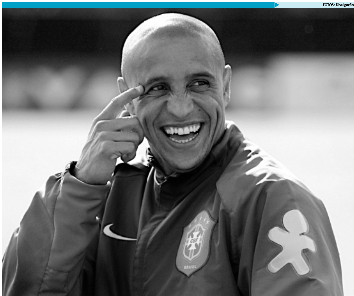
Campeão do mundo de 2002 com a Seleção Brasileira, Roberto Carlos começou a carreira no início da década de 90, no União São João, em São Paulo

"Joguei futebol por muitos anos e não acho que meu corpo aguente mais tanto trabalho, as viagens, os hotéis. Joguei como profissional por 17 anos, mas no total foram 22 anos", disse o lateral. "Não estou parando, porque estou machucado, mas sim, porque minha carreira está completa. Joguei por Palmeiras, Real Madrid, Inter de Milão. Tive todas as experiências como jogador e agora quero descansar e passar mais tempo com a minha família", concluiu.