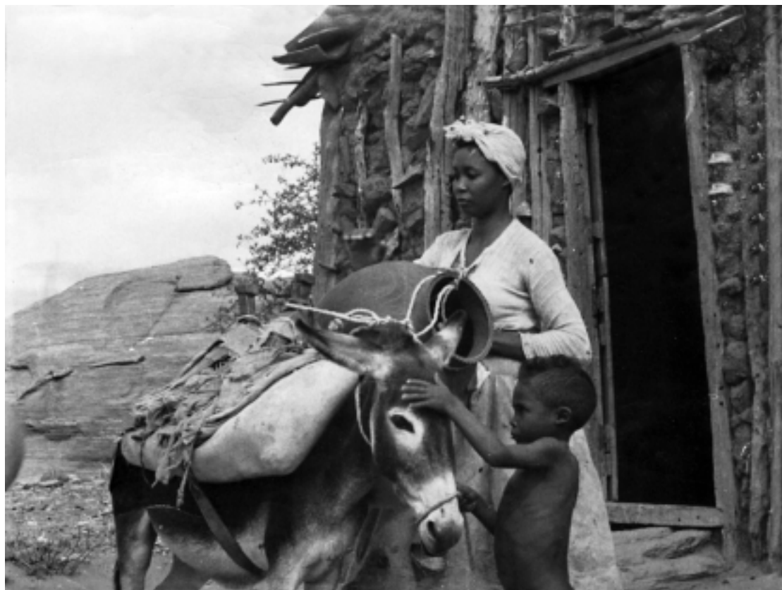
O curta-metragem Aruanda retrata a fundação de um quilombo de escravos na Serra do Talhado, em Santa Luzia

Neste mesmo curta-metragem, a expressão da miséria é um elemento da realidade retratada pela lente da câmera, que respinga na produção da obra. Mais tarde, essa constatação evoluiu ao ponto de se transformar em uma ideia - repercutida por Glau-