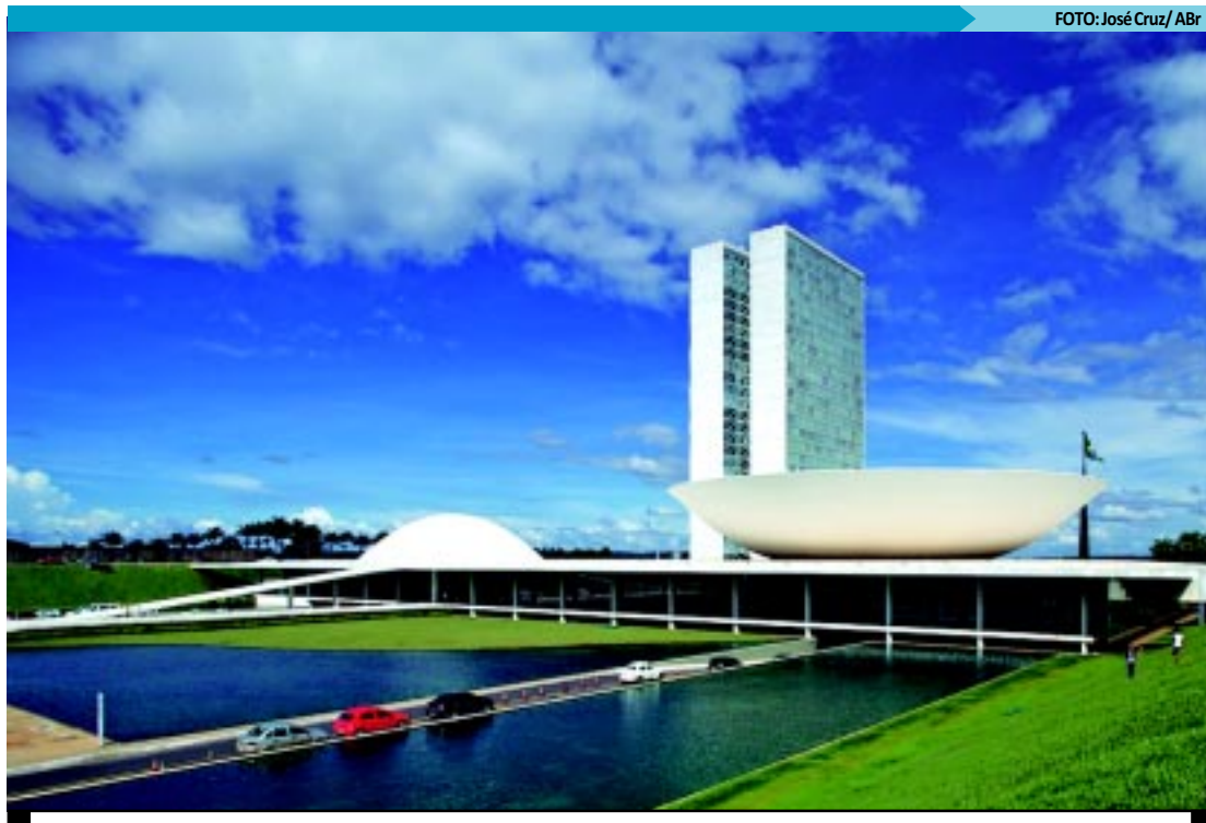
Sem funcionamento de comissões, partidos dedicarão esse tempo para contornar problemas nas bancadas