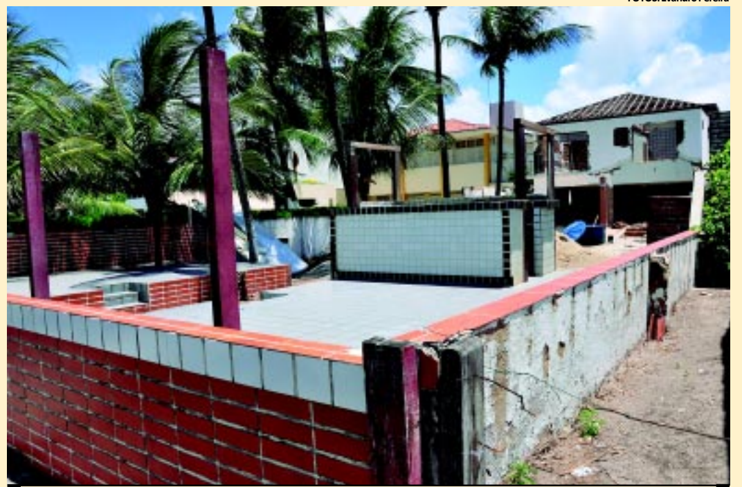
Alguns imóveis já estão se ajustando à determinação do Patrimônio da União. Outras estão sob liminar