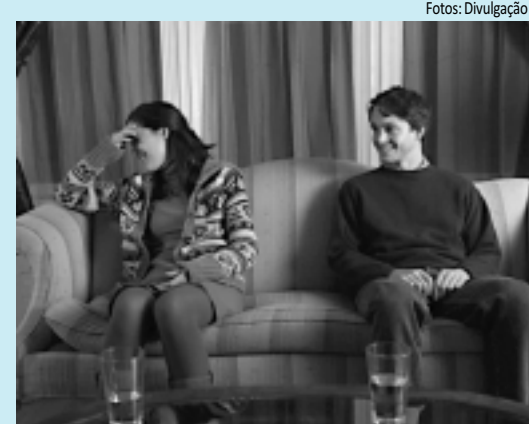
Rose Byrne e Hugh Dancy em Adam , de Max Mayer

>>> ADAM - O engenheiro de Adam Raki, um rapaz brilhante e solitário, é portador da síndrome de Asperger e tem dificuldade de se relacionar com as pessoas, por isso vive isolado em seu apartamento. Um dia ele conhece Beth Buchwald, uma escritora jovem e bastante extrovertida que mudou recentemente para o andar de cima. Os dois se aproximam e desenvolvem uma estranha relação e Beth consegue puxá-lo para mundo real. SE LIGUE: Hoje, às 20h, no FX