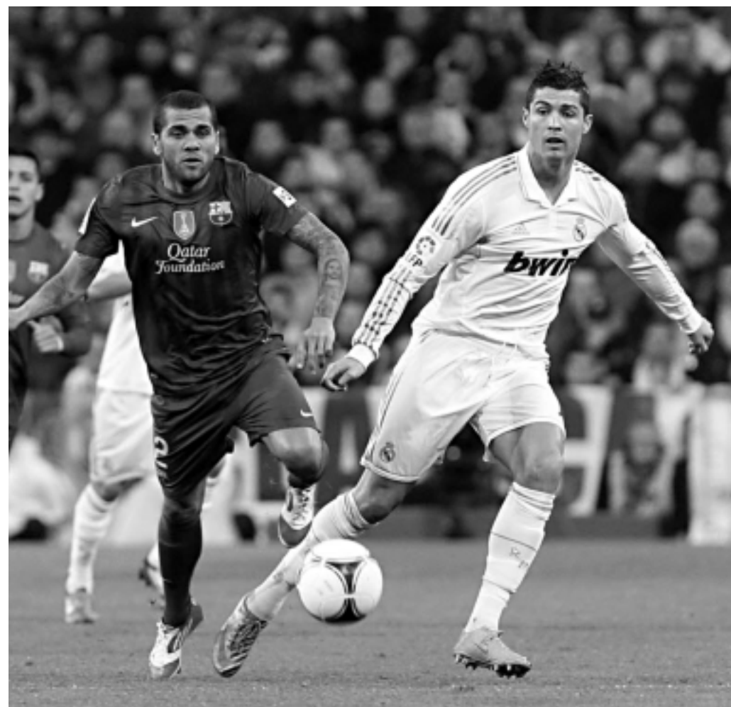
Entre os principais interessados em Cristiano Ronaldo (D) parecem estar Manchester City e Milan

Entre os principais interessados em Ronaldo parecem estar Manchester City e Milan. Os ingleses parecem ter mais chances em um negócio. Na última janela, teriam até oferecido 170 milhões, mas, na ocasião, o atacante nem quis analisar a proposta. Já os italianos têm mais sonho do que chances de contratar Cristiano. O português é o grande desejo de Silvio Berlusconi, mas o clube não parece ter dinheiro para competir pelo jogador.