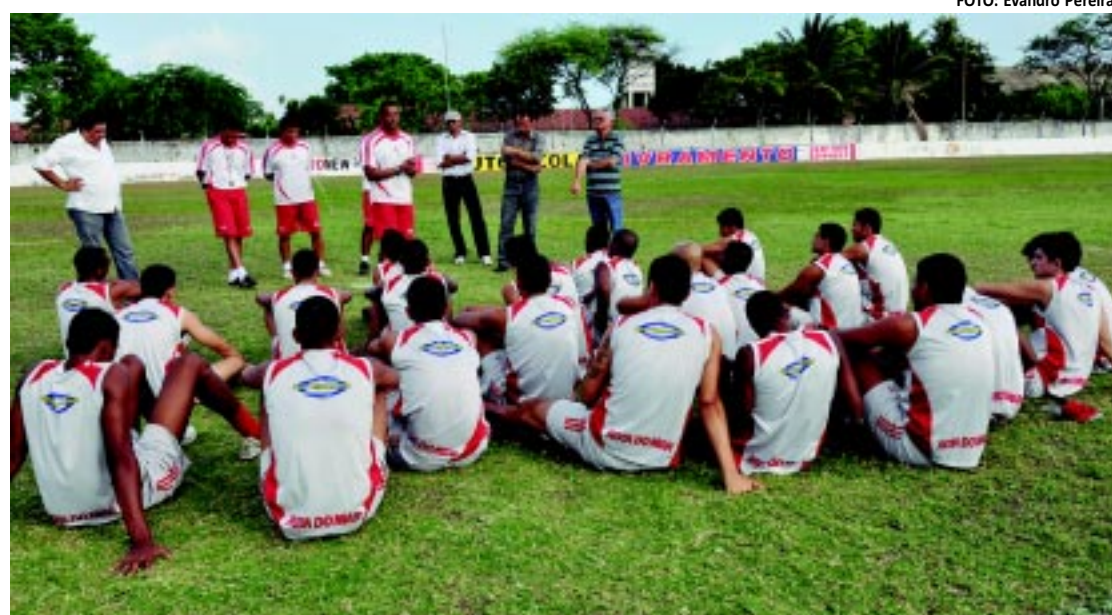
Atletas estavam sendo observados e avaliados pela comissão técnica do Clube do Povo para o Estadual