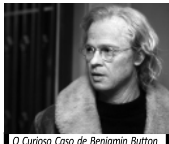
O Curioso Caso de Benjamin Button