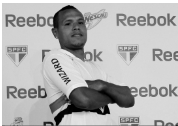
O atacante fez exames e teve diagnosticado um estiramento leve