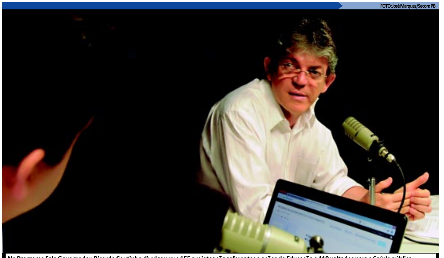
No Programa Fala Governador, Ricardo Coutinho divulgou que 155 projetos são referentes a ações de Educação e 119 voltados para a Saúde pública

UEPB NÃO SERÁ PRIVATIZADA - Ricardo Coutinho aproveitou o 'Fala Governador' de ontem para esclarecer os boatos de que a Universidade Estadual da Paraíba (UEPB) seria privatizada ou federalizada. "Isso é mais uma mentira daqueles que pensam que podem fazer política desrespeitando a verdade", assegurou. O governador destacou que, só no ano passado, o Estado repassou R$ 196 milhões de duodécimos à UEPB, um aumento de 8,7% de receita líquida. "É uma amostra do nosso investimento na universidade. E não para por aí. Estamos crescendo em todas as responsabilidades que o governo tem na Educação, que passa pelo Ensino Superior, mas também pela Educação Básica", salientou.