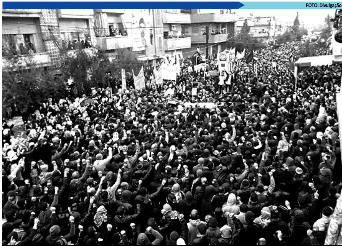
Opositores ao regime do ditador sírio fazem funeral de manifestantes, mortos próximo a cidade de Homs

Na semana passada, a alta comissão para os direitos humanos na ONU, Navi Pillay, anunciou que a organização desistiu de compilar os dados sobre as vítimas da repressão na Síria devido às dificuldades existentes para obter informações.