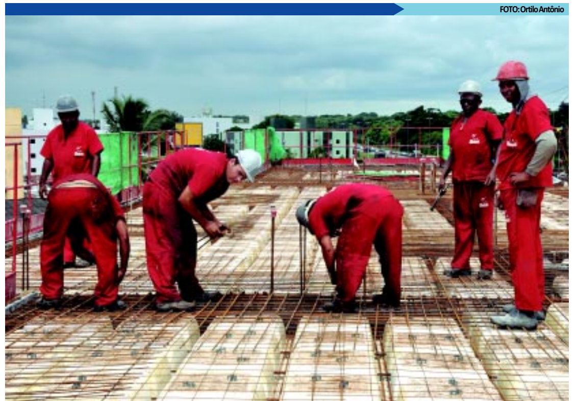
Empresas da construção civil empreendem treinamento de trabalhador nos canteiros de obras a fim de qualificá-los

Segundo ele, a previsão é de que o Centro de Educação Profissional da Construção Civil de Bayeux promova a formação de 5.675 pessoas este ano, nas modalidades de curso de aprendizagem industrial (por meio de processo seletivo) e de cursos de iniciação, qualificação e aperfeiçoamento profissional. Os cursos são gratuitos.