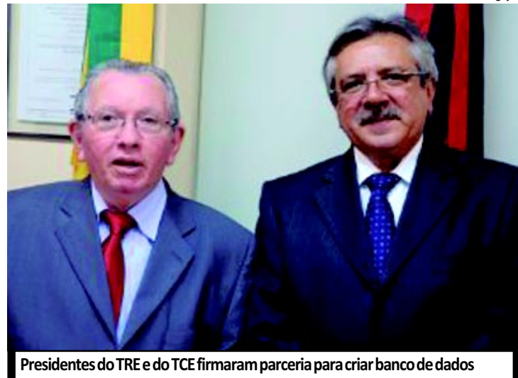
Presidentes do TRE e do TCE firmaram parceria para criar banco de dados