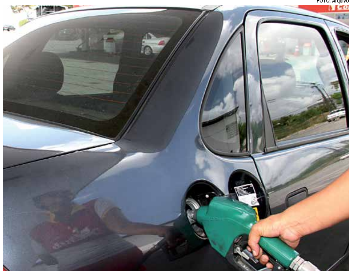
Setenta e cinco postos de gasolina baixaram os preços, enquanto 20 mantiveram e 3 aumentaram

O menor preço foi encontrado pelos pesquisadores no posto Pichilau, na BR-101, e o mais alto no Ayrton Senna, nos Ipês.