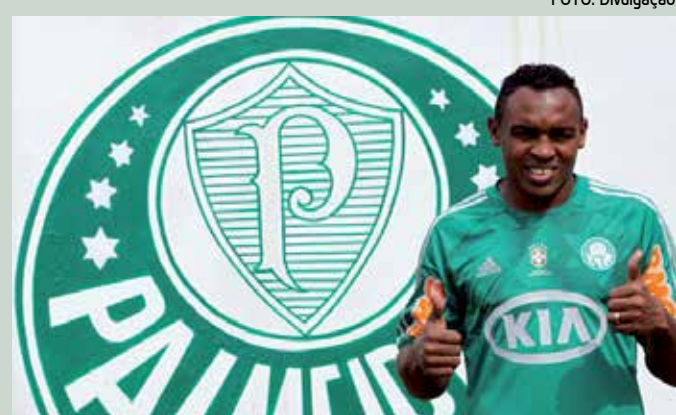
Atleta foi emprestado até fim da temporada