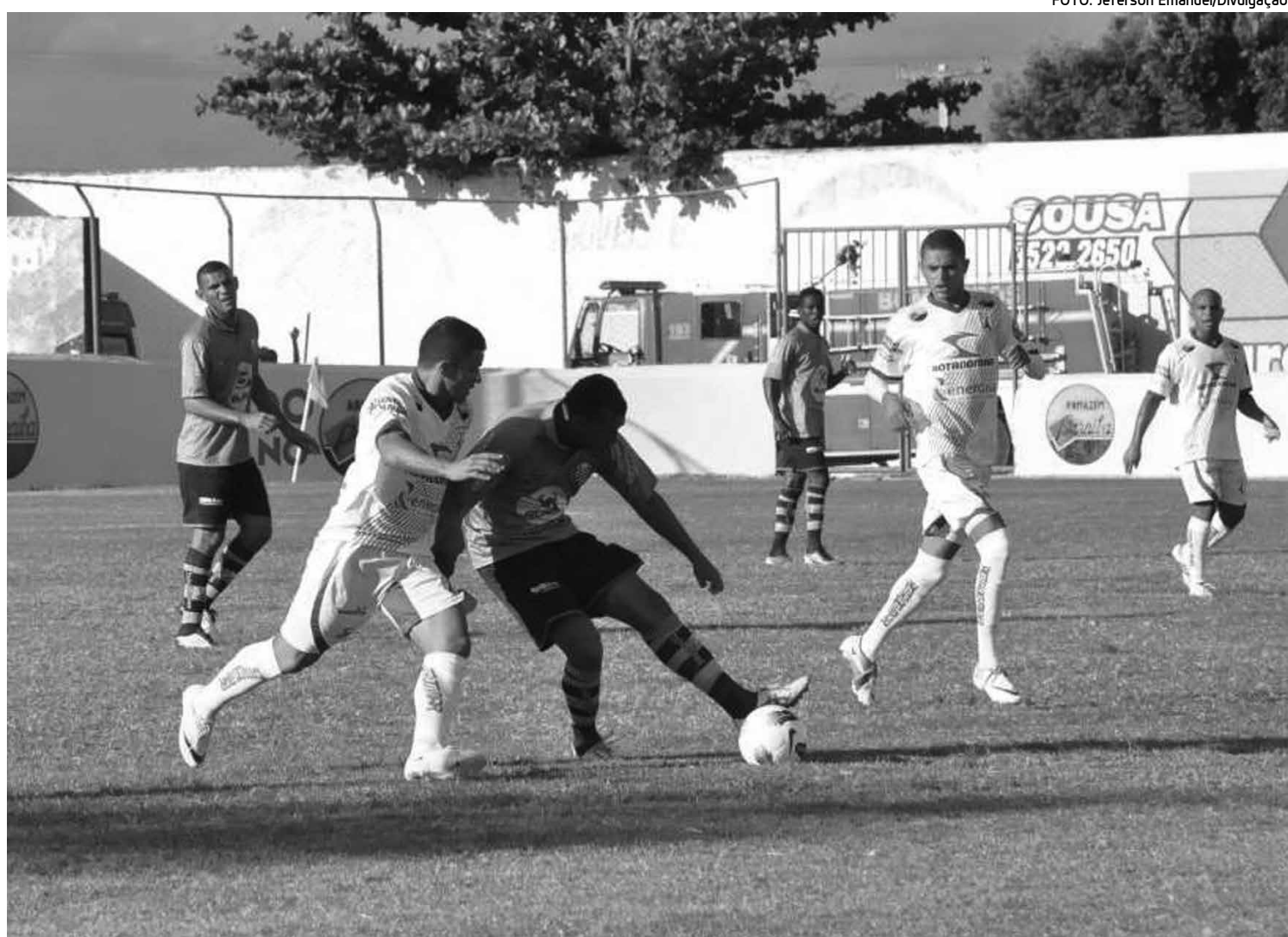
No domingo passado, em seus domínios, o time paraibano empatou sem gols diante do CSA e manteve a segunda posição do grupo A4