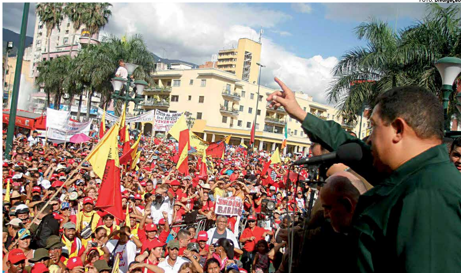
No relatório, a organização Human Rights Watch diz que Chávez não recuou no controle do Congresso e da Suprema Corte de Justiça

De acordo com o documento, a defensora de direitos humanos Rocío San Miguel foi acusada publicamente por Chávez de ser uma "agente da CIA" e de "incitar a insurreição" por ter denunciado, em um programa de TV, a filiação de militares venezuelanos ao partido político do presidente. Essa atitude é proibida pela Constituição venezuelana.