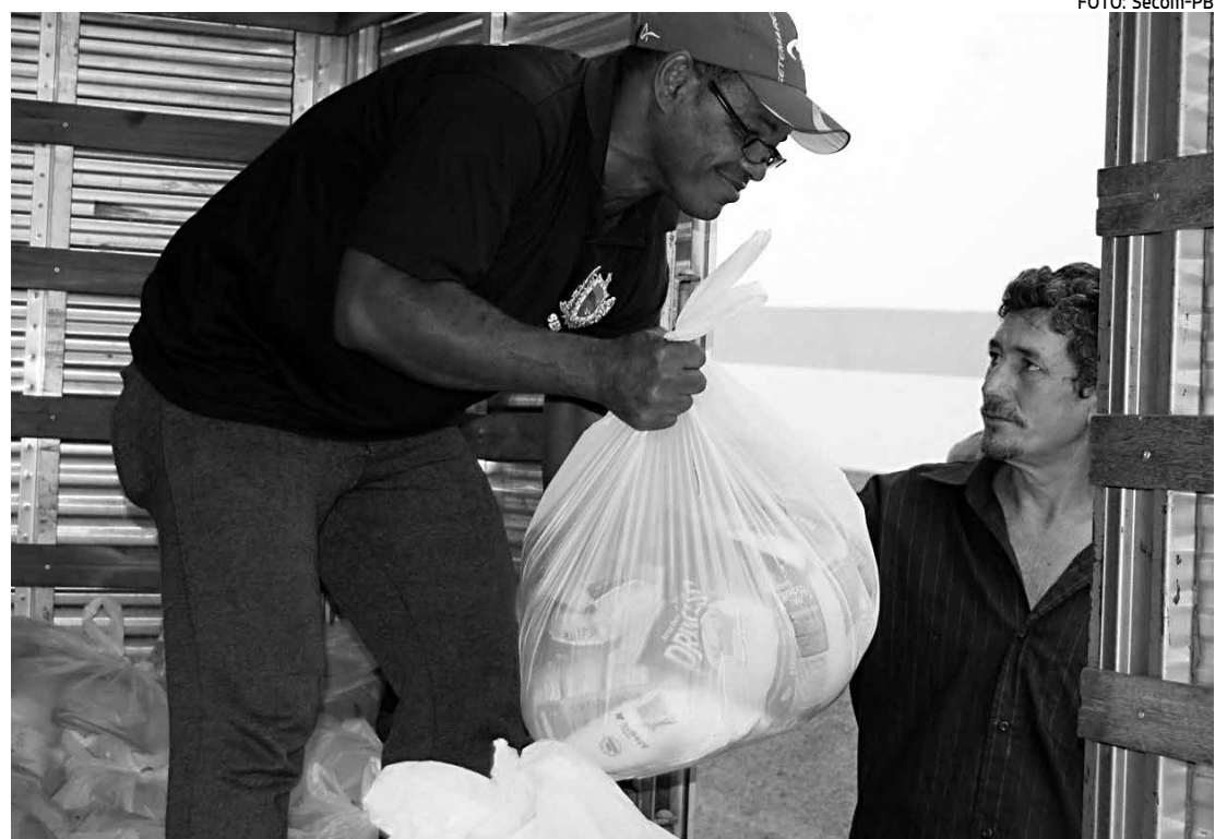
Secretaria de Desenvolvimento Humano e MDS vão distribuir 7.700 cestas básicas na Paraíba

Entre o conjunto de ações do Governo do Estado para reduzir os efeitos da seca estão os recursos de convivência com a estiagem, investimentos para melhoria da oferta de água como a perfuração e recuperação de poços artesianos. O Governo do Estado também isentou o ICMS para garantir a ração animal, além de crédito para a agricultura.