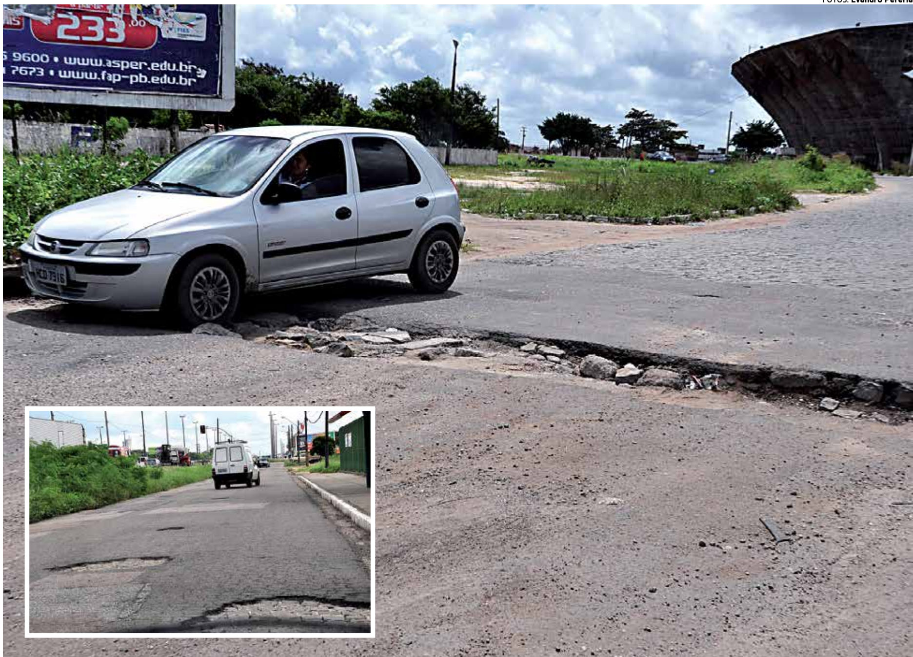
Em várias ruas e avenidas da Capital paraibana é possível localizar os temidos buracos, que além do prejuízo financeiro, também colocam em risco a vida da população

“A demanda é grande, mas, nosso pessoal está nas ruas. Temos oito equipes, totalizando mais de 100