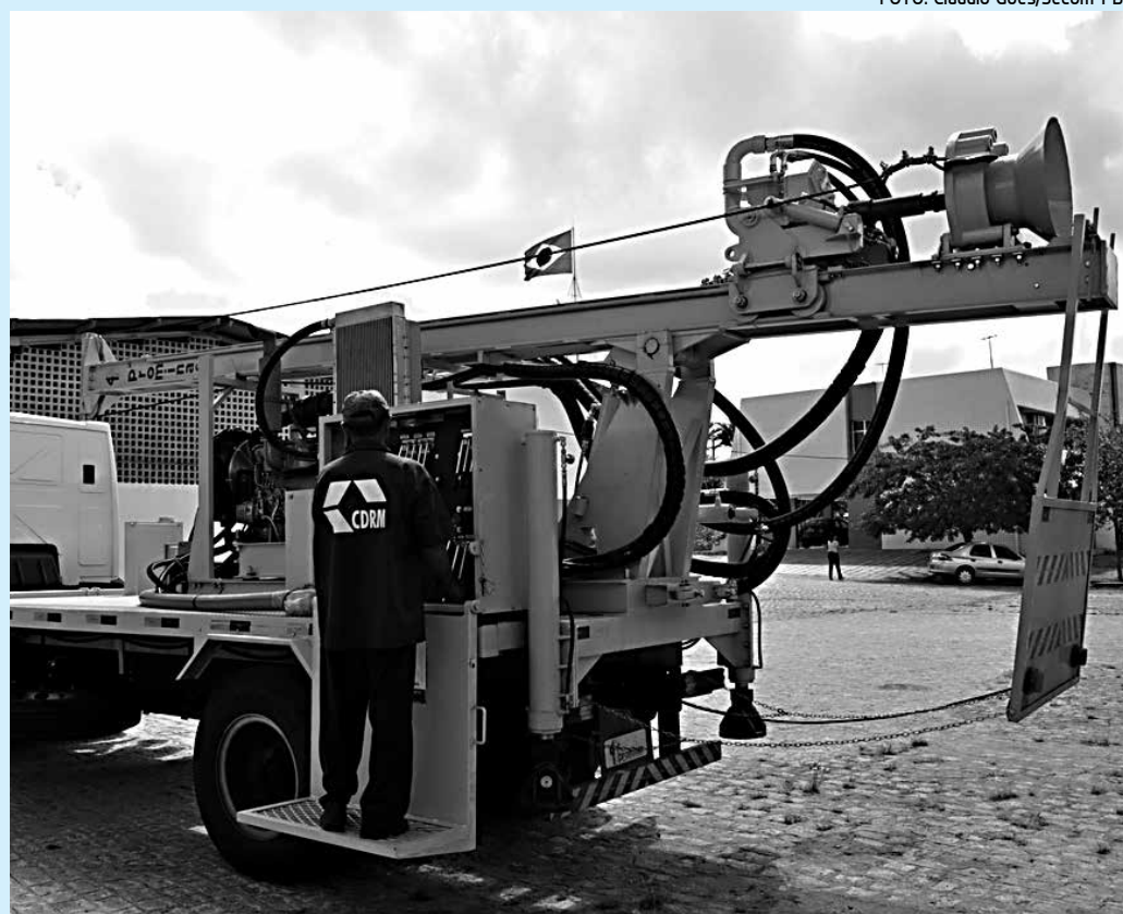
Até agora, a CDRM já abriu 96 poços artesianos em rochas cristalinas, no semiárido