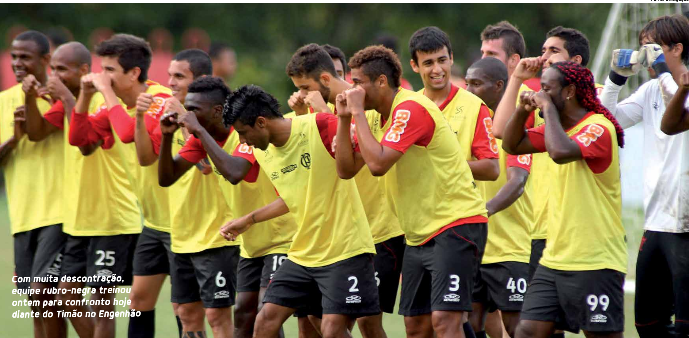
Com muita descontração, equipe rubro-negra treinou ontem para confronto hoje diante do Timão no Engenhão