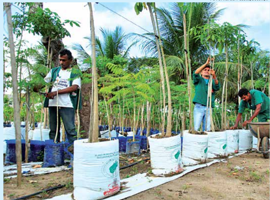
São capacitados 46 profissionais, entre viveiristas, auxiliares de jardinagem, entre outros