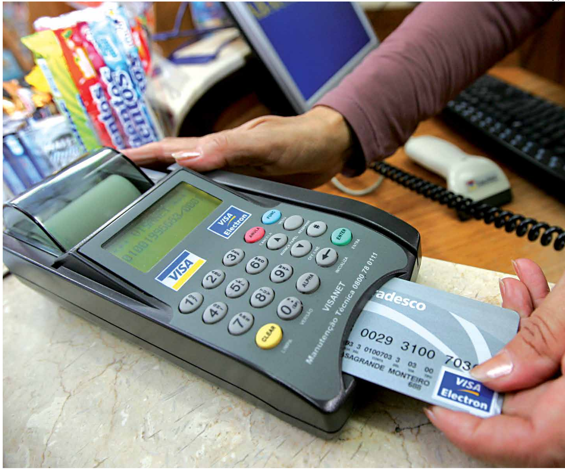
Por ano, o brasileiro, que efetua parte do pagamento da fatura, paga uma taxa média de 323,14%, quase seis vezes maior em comparação ao segundo colocado

A analista, no entanto, avalia que os juros "exorbitantes" são que agravam a inadimplência. "Nós acon-