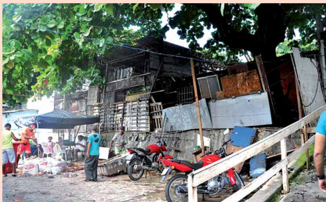
O que se vê na parte de trás do mercado é muito ferro velho e barracas em péssimas condições

Pedrosa, 81 anos, que negocia o produto há 50 anos, a expectativa de todos os comerciantes daquela área é que as obras do Mercado Central sejam concluídas o mais rápido possível. Ele revelou que muitas pessoas deixaram de fazer compras naquela área do mercado